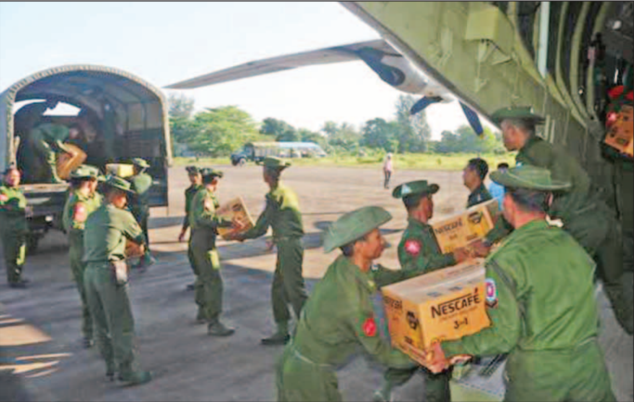
စားသောက်ဖွယ်ရာများနှင့် အသုံးအဆောင်ပစ္စည်းများကို တပ်မတော်လေယာဉ်ဖြင့် ပို့ဆောင်စဉ်။ (မြဝတီ)