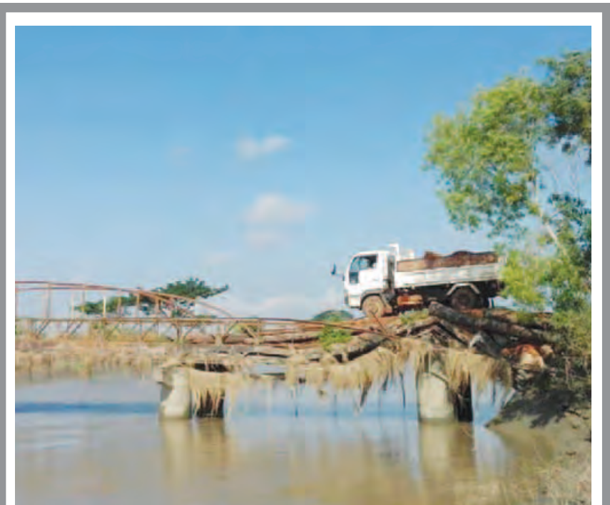
ဘီးလင်းမြို့နယ် စုတ်သုတ်-စုတ်ထူလီနှင့် တခြားရွာခွဲလေးများ၏ ကျေးရွာချင်းဆက် ကုန်သွယ်လမ်းဖြစ်သော နီတိုတံတားသည် လွန်ခဲ့သောရက်အနည်းငယ်က ပင်မသံစရိန်များကျိုးကျ၍ ရေလည်ထောင့်တိုင်များ ကျကျသဖြင့်သွားလာရန် အလွန်အန္တရာယ်ကြီးမားသော အခြေအနေသို့ရောက်ရှိနေကြောင်း သိရသည်။ ယင်းတံတားအရှည်မှာ ပေ ၂၀၀ ခန့်ရှိပြီး ဆန်စပါးပေါ်ချိန်တွင် အဓိကတင်ပို့ရောင်းချသည့် ကုန်သွယ်လမ်းဖြစ်ပြီးသည်။ ယခုဆိုလျှင် တောင်သူများအနေဖြင့် အဓိကပင်မကုန်သွယ်တံတား ကျကျသဖြင့် လွန်စွာ ခိုးရိမ်နေကြကြောင်း သိရသည်။ မြို့နယ်(ပြန်/ဆက်)