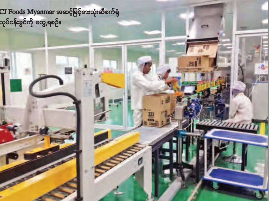
CJ Foods Myanmar အဆင့်မြင့်စားသုံးဆီစက်ရုံ လုပ်ငန်းခွင်ကို တွေ့ရစဉ်။