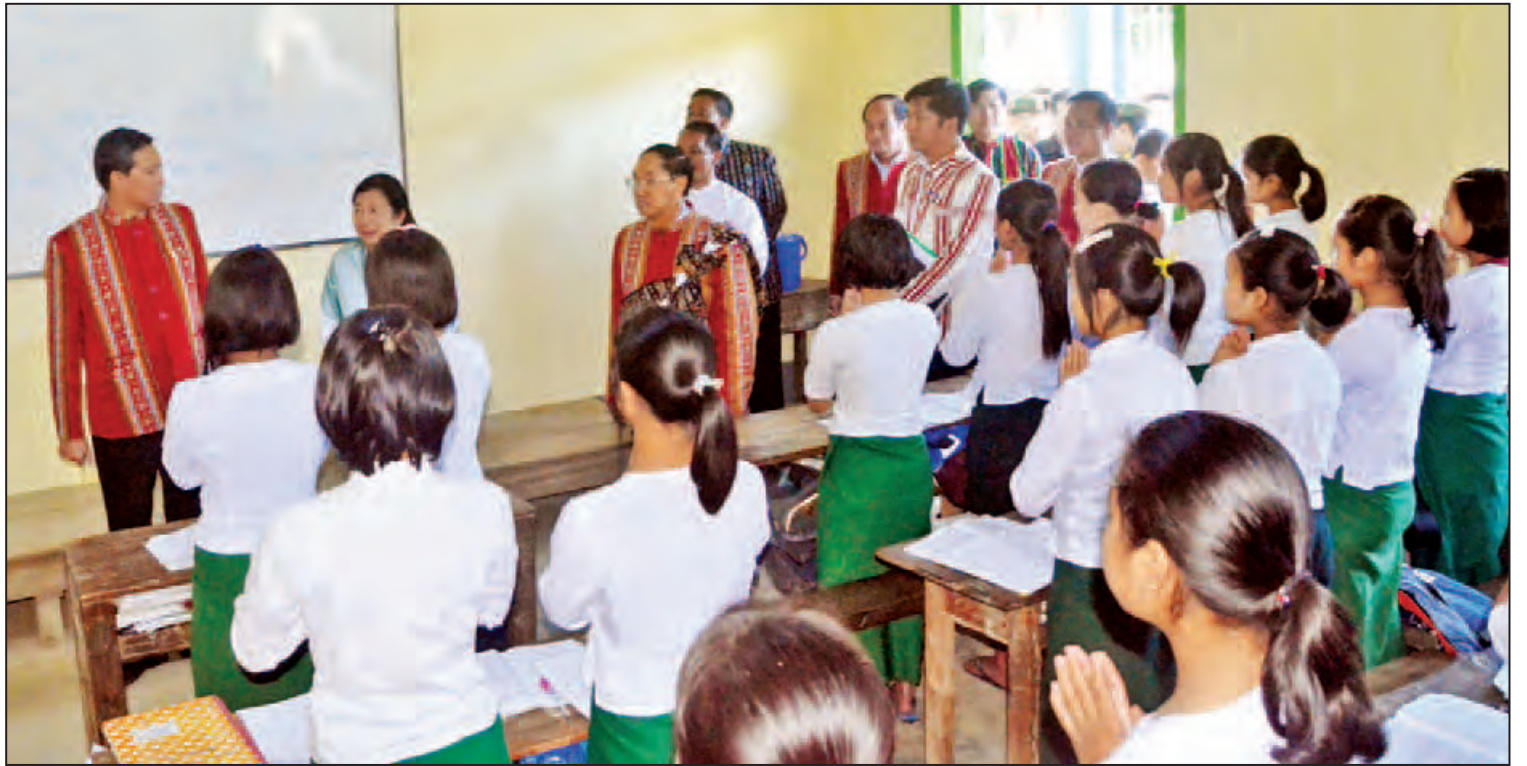
ဟားခါးမြို့ အခြေခံပညာအထက်တန်းကျောင်း၌ ကျောင်းသားကျောင်းသူများအား ဒုတိယသမ္မတ ဦးမြင့်ဆွေ ရင်းရင်းနှီးနှီးတွေ့ဆုံစဉ်။ (သတင်းစဉ်)