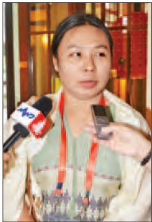
နန်းမော်ဂေး