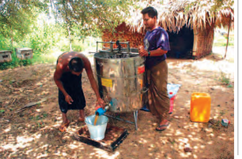
ပျားရည်ထွက်ကောင်းသော်လည်းဈေးနှုန်းကျဆင်းနေကြောင်း သိရသည်။