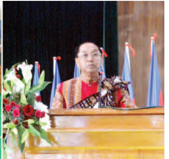
ဒုတိယသမ္မတ ဦးမြင့်ဆွေ ဟားခါးမြို့၌ ပြည်နယ်၊ ခရိုင်နှင့် မြို့နယ်အဆင့် ဌာနဆိုင်ရာတာဝန်ရှိသူများ၊ မြို့မိမြို့ဖများ၊ ရပ်မိရပ်ဖများ၊ ဒေသခံပြည်သူများနှင့် တွေ့ဆုံအမှာစကားပြောကြားစဉ်။ (သတင်းစဉ်)