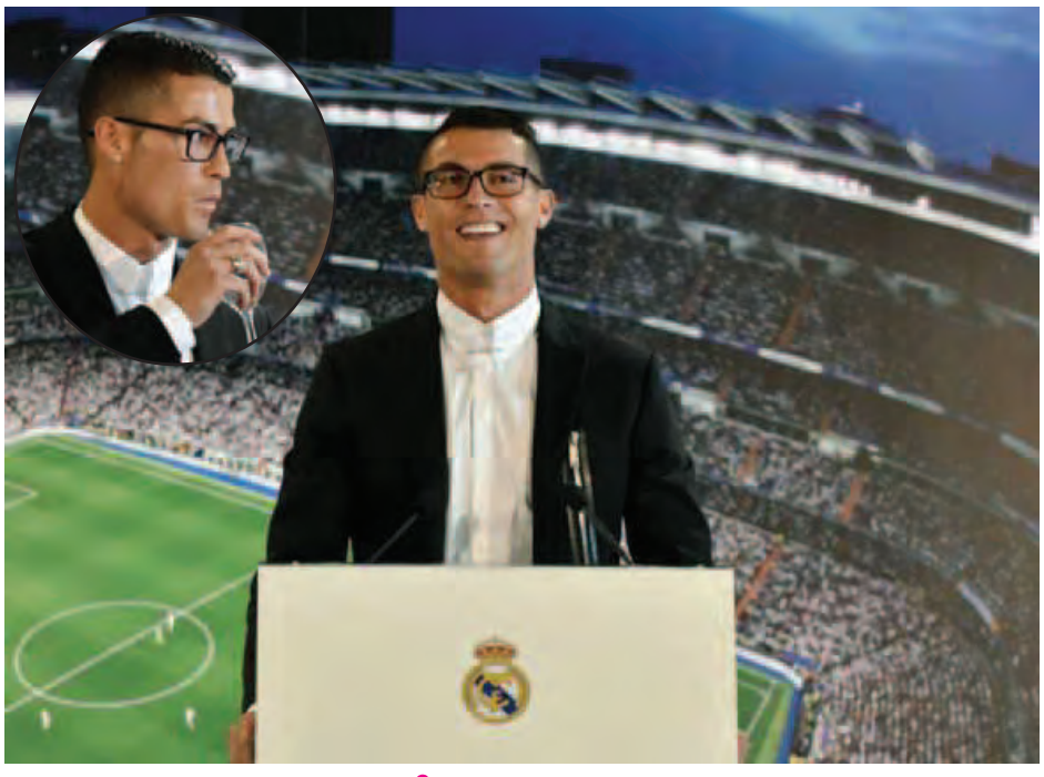
မေ့လဲသင်း - ၅ စည်း ရေးသားသည်

စီရိုနယ်လ်ဒိုနဲ့ နိုဝင်ဘာ ၆ ရက်က နှစ်ဖက်ဖက်သို့ စာချုပ်သက်တမ်းဟာ ၂၀၁၈ ခုနှစ် ဇွန်လမှာ ကုန်ဆုံးမှာဖြစ်ပေမယ့် အခုချုပ်ဆိုခဲ့တဲ့ စာချုပ်သစ်ကြောင့် ၂၀၂၁ ခုနှစ် ဇွန်လအထိ နိုဝင်ဘာ ၆ ရက်က ဆက်ရှိဖို့တော့ သေချာသွားပြီဖြစ်ပါတယ်။ သူက ဒီသက်တမ်းတိုးစာချုပ်ဟာ သူ့ကစားသမားဘဝ နောက်ဆုံးလက်မှတ်ရေးထိုးတဲ့ စာချုပ်မဟုတ်ကြောင်းကို နောက် ၁၀ စုနှစ်တစ်ခုအထိ ကစားသမားဘဝ ဆက်လက်ရှင်သန်ဦးမယ်ဆိုတဲ့စကားနဲ့ အချက်ပြခဲ့ပါတယ်။ စီရိုနယ်လ်ဒိုက “ကျွန်တော် အခုနိုဝင်ဘာ ၆ ရက်က ငါ့နှစ်အထိ ဆက်ရှိဖို့သေချာသွားပြီဖြစ်ပါတယ်။ ဒါပေမယ့် အားလုံးကို သိစေချင်တာက ဒီစာချုပ်ဟာ ကျွန်တော့် ကစားသမားဘဝ နောက်ဆုံးလက်မှတ်ရေးထိုးတဲ့ စာချုပ်တော့ မဟုတ်ပါဘူး” လို့ ဆိုခဲ့ပါတယ်။ စီရိုနယ်လ်ဒိုရဲ့ တစ်ပတ်လုပ်ခလစာ ပေါင် ၃၆၅၀၀၀ အထိ ရှိမယ်လို့ သိရပါတယ်။