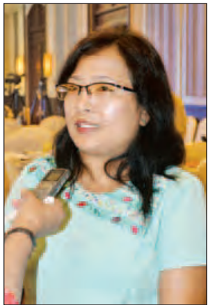
ဒေါ်မြဝန်းရံ

ပဉ္စမအကြိမ် မြန်မာမီဒီယာဖွံ့ဖြိုးတိုးတက်ရေးညီလာခံဖွင့်ပွဲအခမ်းအနားတွင် ပြန်ကြားရေးဝန်ကြီးဌာန ပြည်ထောင်စုဝန်ကြီး ဒေါက်တာဖေမြင့်က “တိုင်းရင်းသားမီဒီယာများ ဖွံ့ဖြိုးတိုးတက်ရေးကို ဆောင်ရွက်သွားမည်ဖြစ်ပါကြောင်း” ထည့်သွင်းပြောကြားသွားခဲ့သည်။ သို့ဖြင့် ပဉ္စမအကြိမ် မြန်မာမီဒီယာဖွံ့ဖြိုးတိုးတက်ရေးညီလာခံမှ တိုင်းရင်းသားမီဒီယာများ၏ အသံများကို မြန်မာ့သတင်းစဉ်က ကောက်နုတ်စုစည်းတင်ပြလိုက်ရပါသည်။