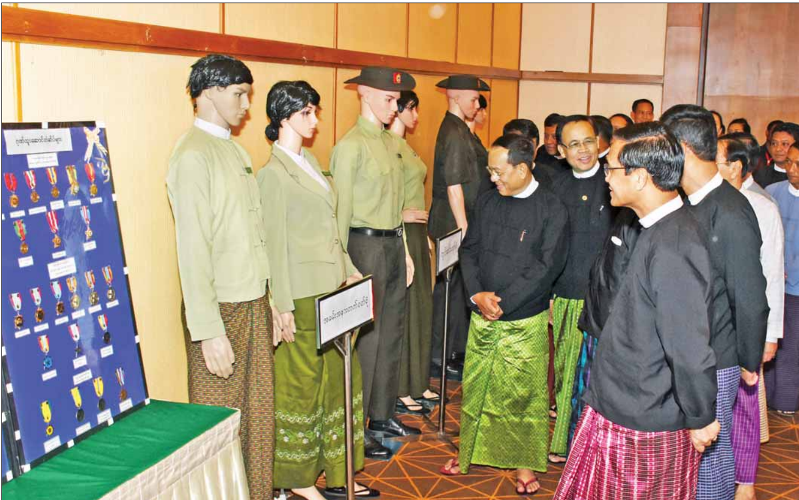
နေပြည်တော်၌ကျင်းပသည့် အထွေထွေအုပ်ချုပ်ရေးဦးစီးဌာန နှစ်ပတ်လည်နေ့အခမ်းအနားတွင် အထွေထွေအုပ်ချုပ်ရေးဦးစီးဌာန၏ လှုပ်ရှားဆောင်ရွက်မှုပြခန်းအား ဒုတိယသမ္မတ ဦးဟင်နရီပန်ထီးယူ လှည့်လည်ကြည့်ရှုစဉ်။ (သတင်းစဉ်)

နေပြည်တော် နိုဝင်ဘာ ၇ အစိုးရ၏မူဝါဒများ အောင်မြင်စွာ ဆောင်ရွက်ရေးအတွက် အဓိက လိုအပ်ချက်သည် အမျိုးသားရေး တည်ဆောက်ရန်၊ ပြည်တွင်းငြိမ်းချမ်း ရေးရရှိရန်တို့ဖြစ်ကြောင်း ဒုတိယ သမ္မတ ဦးဟင်နရီပန်ထီးယူက ပြောကြားသည်။ နေပြည်တော် Hotel Max ၌ ယနေ့ ညနေ ၅ နာရီတွင် ကျင်းပသည့် အထွေထွေအုပ်ချုပ်ရေးဦးစီးဌာန နှစ်ပတ်လည်နေ့ အခမ်းအနားတွင် ဒုတိယသမ္မတက ထိုသို့ပြောကြား လိုက်ခြင်းဖြစ်သည်။ ဆက်လက်၍ အမျိုးသားရေး တည်ဆောက်ရန် အခြေခံအုတ်မြစ် သည် အမျိုးသားညီညွတ်ရေးပင်ဖြစ် ကြောင်း၊ ပြည်ထောင်စုတစ်ခုတည်းမှ ပြည်ထောင်စုသားများ ဟူသည့် စိတ်ဓာတ်များ ဖြစ်ပေါ်လာရန် ညီညွတ်ရေးကို တည်ဆောက်ကြရ မည်ဖြစ်ကြောင်း၊ စစ်မှန်သည့် ဒီမို ကရက်တစ် ဖက်ဒရယ်ပြည်ထောင်စု ထူထောင်ရေး ခြေလှမ်းတစ်ရပ်အနေ ဖြင့် ပြည်ထောင်စုငြိမ်းချမ်းရေး ညီလာခံ ၂၁ ရာစုပင်လုံကို ကျင်းပခဲ့ ပါကြောင်း၊ ငြိမ်းချမ်းရေးလုပ်ငန်းစဉ် များကို ပြီးမြောက်အောင်မြင်အောင် လုပ်ဆောင်ပြီး ထာဝရငြိမ်းချမ်းရေး ရရှိရန် ဆောင်ရွက်လျက်ရှိပါကြောင်း။ အထွေထွေ အုပ်ချုပ်ရေးဦးစီးဌာန ဝန်ထမ်းများသည် နိုင်ငံတော်အဆင့်မှ ရပ်ကွက်၊ ကျေးရွာအဆင့်အထိ တာဝန် ထမ်းဆောင်လျက်ရှိသည့် အတွက် နိုင်ငံတော်၏ မူဝါဒများ အောင်မြင်ရေးနှင့် ထာဝရငြိမ်းချမ်းရေး ရရှိရေးတို့တွင် ဒေသအသီးသီးရှိ တိုင်းရင်းသား ပြည်သူများ ဝိုင်းဝန်း ကူညီပါဝင်လာစေရန် ဆောင်ရွက် သွားကြရမည်ဖြစ်ကြောင်း ဒုတိယ သမ္မတက ပြောကြားသည်။ ဒုတိယသမ္မတက ထိုရောက် ကောင်းမွန်သည့် စီမံအုပ်ချုပ်မှုစနစ် ဖြစ်ပေါ်စေရေးနှင့် ပြည်သူ့ဝန်ဆောင် မှု (People Service) လုပ်ငန်းများ ထိရောက်အောင်မြင်စွာဆောင်ရွက် ပေးနိုင်ရေးအတွက် ဝန်ထမ်းများ သည် သော့ချက်ဖြစ်ပြီး အစိုးရ