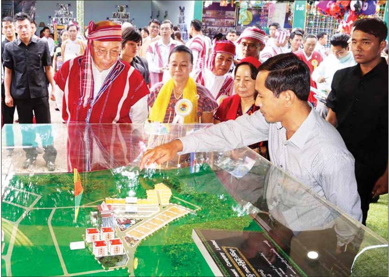
ပြည်ထောင်စုလွှတ်တော်နာယက အမျိုးသားလွှတ်တော်ဥက္ကဋ္ဌ မန်းဝင်းခိုင်သန်းနှင့် ပြည်နယ်ဝန်ကြီးချုပ် ဒေါ်နန်းခင်ထွေးမြင့်တို့ ပြည်နယ်နေပြခန်းများကို လှည့်လည်ကြည့်ရှုအားပေးကြစဉ်။

အကြောင်းအမျိုးမျိုးကြောင့် ပြည်ပမှပြန်လည်ရောက်ရှိလာသော အလုပ်သမားများအား မိမိတို့၏ပြည်တွင်းမှာပင် အခြေချလုပ်ကိုင်နိုင်ခြင်း သည်သာ အကောင်းဆုံးဖြစ်၍ ကာလတိုအတွင်း အလုပ်အကိုင်အခွင့် အလမ်းများ ဖော်ထုတ်ပေးရန်နှင့် စီးပွားရေးလုပ်ငန်းသစ်များတွင် နေရာ ချထားပေးနိုင်မည့် မူဝါဒများ လိုအပ်နေပြီဖြစ်ပါသည်။