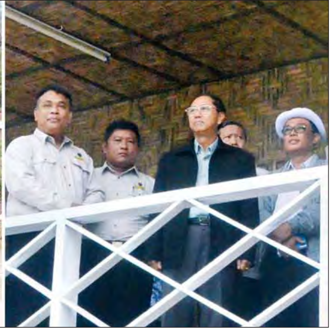
ချင်းတွင်းမြစ်ကူးတံတား(ခန္တီး) တည်ဆောက်ရေးလုပ်ငန်းများကို ဒုတိယသမ္မတ ဦးမြင့်ဆွေ ကြည့်ရှုစစ်ဆေးစဉ်။ (သတင်းစဉ်)