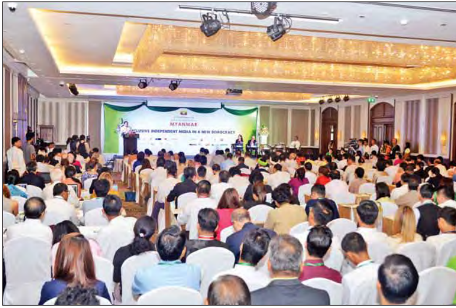
ပဉ္စမအကြိမ် မြန်မာမီဒီယာဖွံ့ဖြိုးတိုးတက်ရေး ညီလာခံဖွင့်ပွဲ ကျင်းပစဉ်။ (သတင်းစဉ်)

ဒုတိယအကြိမ်မြောက် မီဒီယာကွန်ဖရင့်တွင် လွတ်လပ်စွာ ထုတ်ဖော်ပြောဆိုခွင့်ကို အဓိကထား ဆွေးနွေးခဲ့ကြပါကြောင်း၊ တတိယအကြိမ်မြောက် မီဒီယာကွန်ဖရင့်တွင် လူမှုတာဝန်သိမှု မီဒီယာနှင့် မီဒီယာဥပဒေများအကြောင်းကို အဓိကဆွေးနွေးခဲ့ကြောင်း၊ မီဒီယာ