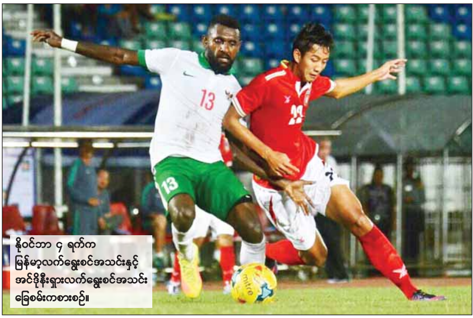
နိုဝင်ဘာ ၄ ရက်က မြန်မာ့လက်ရွေးစင်အသင်းနှင့် အင်ဒိုနီးရှားလက်ရွေးစင်အသင်း ခြေစမ်းကစားစဉ်။