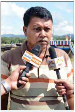
ဦးမောင်မြင့်

မောင်တော နိုဝင်ဘာ ၇ ရခိုင်ပြည်နယ် မောင်တောခရိုင် အတွင်း အောက်တိုဘာ ၉ ရက်က နယ်ခြားစောင့်ရဲတပ်ဖွဲ့စခန်းများအား အကြမ်းဖက်စီးနင်းတိုက်ခိုက်မှုများ ဖြစ်ပွားခဲ့ရာ နယ်ခြားစောင့်ရဲတပ်ဖွဲ့ ဝင်အချို့ ကျဆုံးဒဏ်ရာရရှိခဲ့သည့် အပြင် လက်နက်ခဲယမ်းနှင့် ဆက်စပ် ပစ္စည်းများ ဆုံးရှုံးခဲ့ရသည်။ ထို့ကြောင့် တပ်မတော်စစ်ကြောင်း များနှင့် နယ်ခြားစောင့်ရဲတပ်ဖွဲ့ဝင်များ ပူးပေါင်းပြီး နယ်မြေရှင်းလင်းရေး နှင့် လုံခြုံရေးဆောင်ရွက်လျက်ရှိရာ မောင်တောမြို့နယ်ရှိ လူမျိုးပေါင်းစုံ အတူတကွ နေထိုင်လျက်ရှိသည့် အလယ်သံကျော်ကျေးရွာမှာ တည် ငြိမ်အေးချမ်းလျက်ရှိသည်။