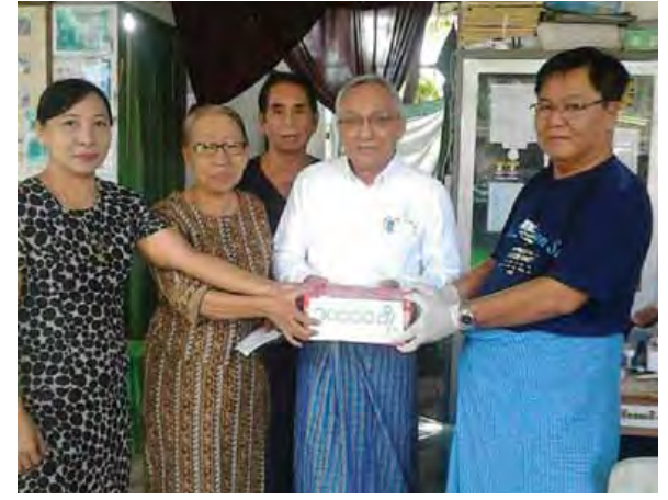
အငြိမ်းစားဆရာကြီးတစ်ဦးမှ ဆေးခန်းအတွက် အလှူငွေပေးအပ်နေစဉ်။

ဆီးချိုစစ်ဆေးပေးခြင်းနှင့် ဝေယျာဝစ္စလုပ်ငန်းများ ကူညီဆောင်ရွက် ပေးကြကြောင်း၊ ဆေးခန်းလာပြုသူ တစ်ဦးအတွက် တစ်လစာ စားဆေးပေးကြောင်း၊ ဓာတ်မှန်ရိုက်ခြင်း၊ Ultra Sound ရိုက်ခြင်းများအတွက် ပြင်ပဆေးခန်းသို့ ပို့ဆောင်ပေးပြီး ကျသင့်ငွေကို ကျခံပေးခြင်း၊ မျက်လုံးခွဲပါက ကျပ်တစ်သိန်း၊ ကွယ်လွန်သွားပါက ကျပ်တစ်သိန်း ထောက်ပံ့ပေးခြင်း၊ ဆေးခန်းမဖွင့်သော ကျန်ရက်များတွင် တပည့်ဆရာဝန်များ၏ ဆေးခန်းတွင် အခမဲ့ကုသပေးခြင်းများ ဆောင်ရွက်ပေးကြောင်း၊ ထို့အပြင် တရားစခန်းသို့ ဝင်ရောက်သော ဆရာကြီး ဆရာမကြီးများကိုလည်း ကျောင်းသားဟောင်းတစ်ဦး က မတည်အလှူငွေဖြင့် တစ်လကျပ်တစ်သောင်း ထောက်ပံ့မှုကိုလည်း ဆောင်ရွက်ပေးရာ အမြတ်ဆုံး