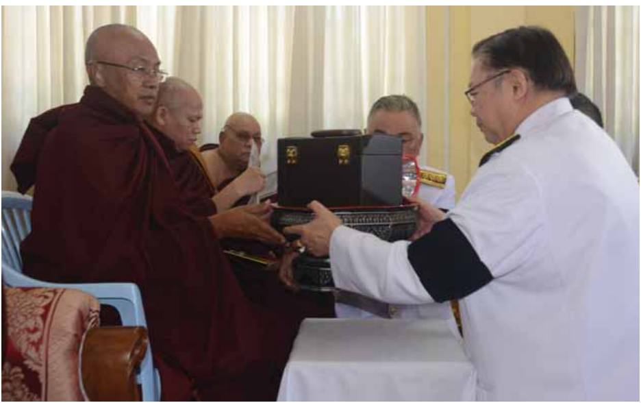
ပရဟိတဆရာတော်အား ထိုင်းနိုင်ငံခြားရေး ဒုတိယဝန်ကြီး လှူဖွယ်ပစ္စည်းဆက်ကပ်လှူဒါန်းစဉ်။

“ထိုင်းဘုရင်မိသားစုအနေနဲ့ နေပြည်တော်မှာရှိတဲ့ ဘုန်းကြီးကျောင်းတွေမှာ တစ်ကြိမ်တစ်ခါမှ လှူဒါန်းမှု မလုပ်ဖူးသေးပါဘူး။ ထိုင်းနိုင်ငံ သံအမတ်ကြီးက ဝါတွင်း ကာလကတည်းက နေပြည်တော်မှာရှိတဲ့ ဘုန်းကြီးကျောင်း