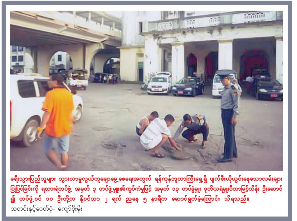
ရေခဲသွားပြည်သူများ သွားလာမှုလွယ်ကူချောမွေ့စေရေးအတွက် ရန်ကုန်ဘူတာကြီးရှေ့ရှိ ပျက်စီးယိုယွင်းနေသောလမ်းများ ပြုပြင်ခြင်းကို ရထားရဲတပ်ဖွဲ့ အမှတ် ၃ တပ်ဖွဲ့မှူး၏ကွပ်ကဲမှုဖြင့် အမှတ် ၁၃ တပ်ခွဲမှူး ဒုတိယရဲမှူးပီတာမြင့်သိန်း ဦးဆောင် ၍ တပ်ဖွဲ့ဝင် ၁၀ ဦးတို့က နိုဝင်ဘာ ၂ ရက် ၂၉ နေ့ ၅ နာရီက ဆောင်ရွက်ခဲ့ကြောင်း သိရသည်။