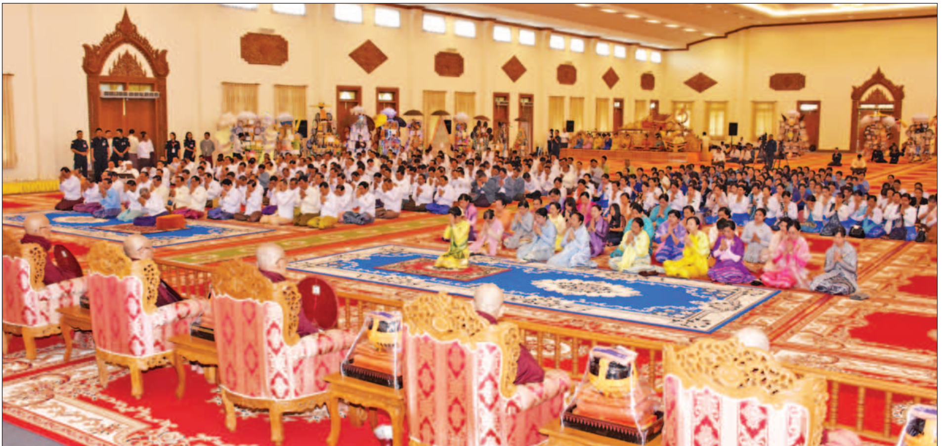
ပြည်ထောင်စုသမ္မတမြန်မာနိုင်ငံတော်အစိုးရအဖွဲ့၏ ကထိန်သင်္ကန်း ဆက်ကပ်လှူဒါန်းပွဲ အလှူတော်မင်္ဂလာအခမ်းအနားကို နေပြည်တော်ရှိ ဥပ္ပါတသန္တိဓေတီတော် သာသနာ့မဟာဗိမာန်တော်၌ကျင်းပရာ နိုင်ငံတော်သမ္မတ ဦးထင်ကျော်နှင့် ဧည့်ပရိသတ်များက နိုင်ငံတော်သံယမဟာနာယကအဖွဲ့ဥက္ကဋ္ဌ ဗန်းမော်ဆရာတော်ထံမှ ကိုးပါးသီလခံယူဆောက်တည်ကြစဉ်။ (သတင်းစဉ်)