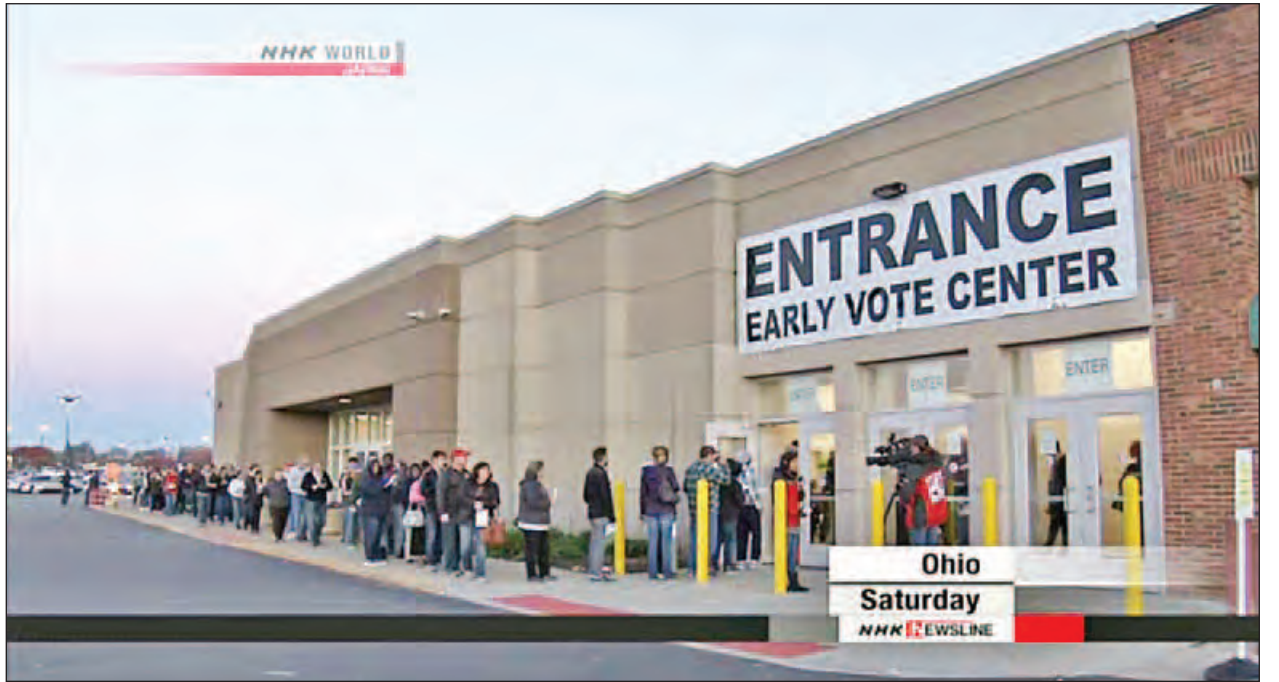
တိုက်တွန်းပြောကြားခဲ့သည်။

အလားတူ ဟီလာရီပြိုင်ဘက် ဒေါ်နယ်ထရမ်ကလည်း ဖလော်ရီဒါပြည်နယ်တွင် မဲဆွယ်စည်းရုံးဆင်းခဲ့သည်။ ပြည်သူများအနေဖြင့် မဲမပေးရသေးသူများ ရှိပါက မဲရုံများသို့ အမြန်ဆုံးသွားရောက်ကာ ဆန္ဒမဲပေးရန် ဒေါ်နယ်ထရမ်က