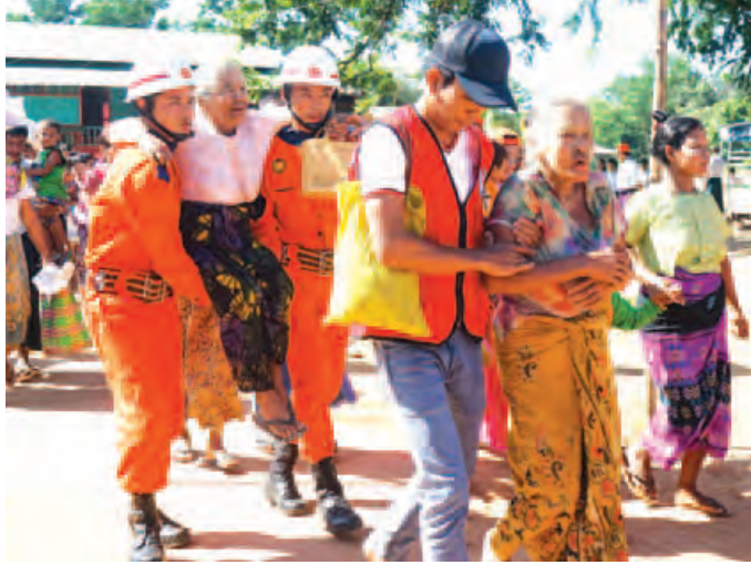
လောင်းလုံး နိုဝင်ဘာ ၆

မြန်မာနိုင်ငံအတွင်း ဖြစ်ပေါ်လေ့ရှိသည့် သဘာဝဘေးအန္တရာယ်များကြောင့် ပြည်သူလူထုများ အသက်အိုးအိမ်နှင့်