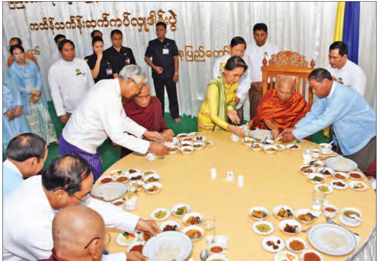
နေ့ဆွမ်းဆက်ကပ်

ပြည်ထောင်စုသမ္မတမြန်မာနိုင်ငံတော် အစိုးရအဖွဲ့၏ ကထိန်လျာသင်္ကန်း ဆက်ကပ်လှူဒါန်းပွဲ အလှူတော်မင်္ဂလာအခမ်းအနားတွင် နိုင်ငံတော်သံဃမဟာနာယက အဖွဲ့ဥက္ကဋ္ဌ ဗန်းမော်ဆရာတော်အမှုပြုသော ဆရာတော် သံဃာတော်များအား နိုင်ငံတော်သမ္မတ ဦးထင်ကျော်၊ နိုင်ငံတော်၏အတိုင်ပင်ခံပုဂ္ဂိုလ် ဒေါ်အောင်ဆန်းစုကြည်နှင့် ဧည့်ပရိသတ်များက နေ့ဆွမ်းဆက်ကပ်လှူဒါန်းကြစဉ်။