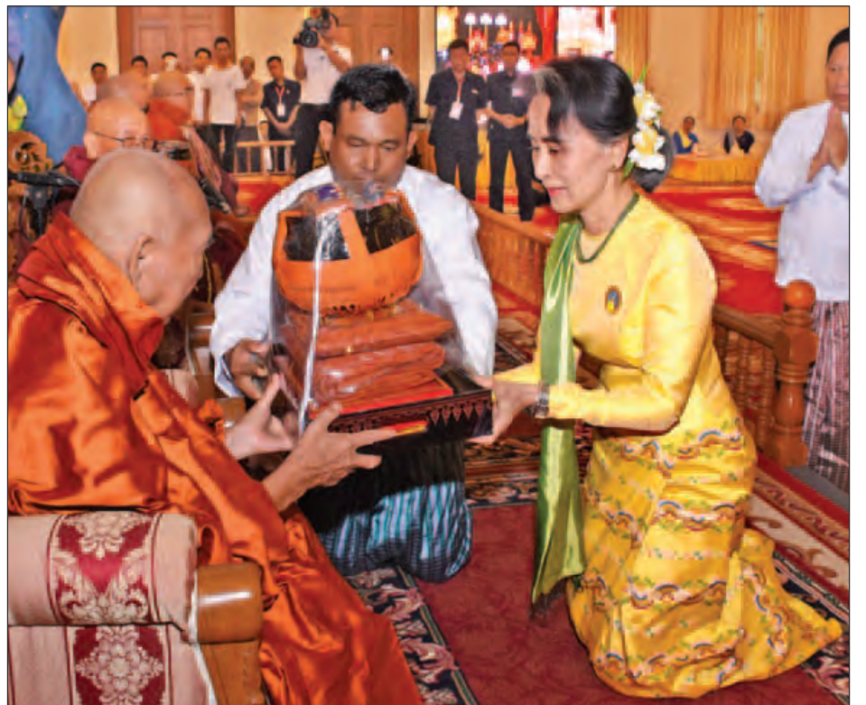
လှူဖွယ်ပစ္စည်းဆက်ကပ်

နိုင်ငံတော် သံဃမဟာနာယကအဖွဲ့ဥက္ကဋ္ဌ ဗန်းမော်ဆရာတော် ဒေါက်တာဘဒ္ဒန္တ ကုမာရာဘိဝံသထံ နိုင်ငံတော်၏ အတိုင်ပင်ခံပုဂ္ဂိုလ် ဒေါ်အောင်ဆန်းစုကြည် လှူဖွယ်ပစ္စည်းများ ဆက်ကပ်လှူဒါန်းစဉ်။