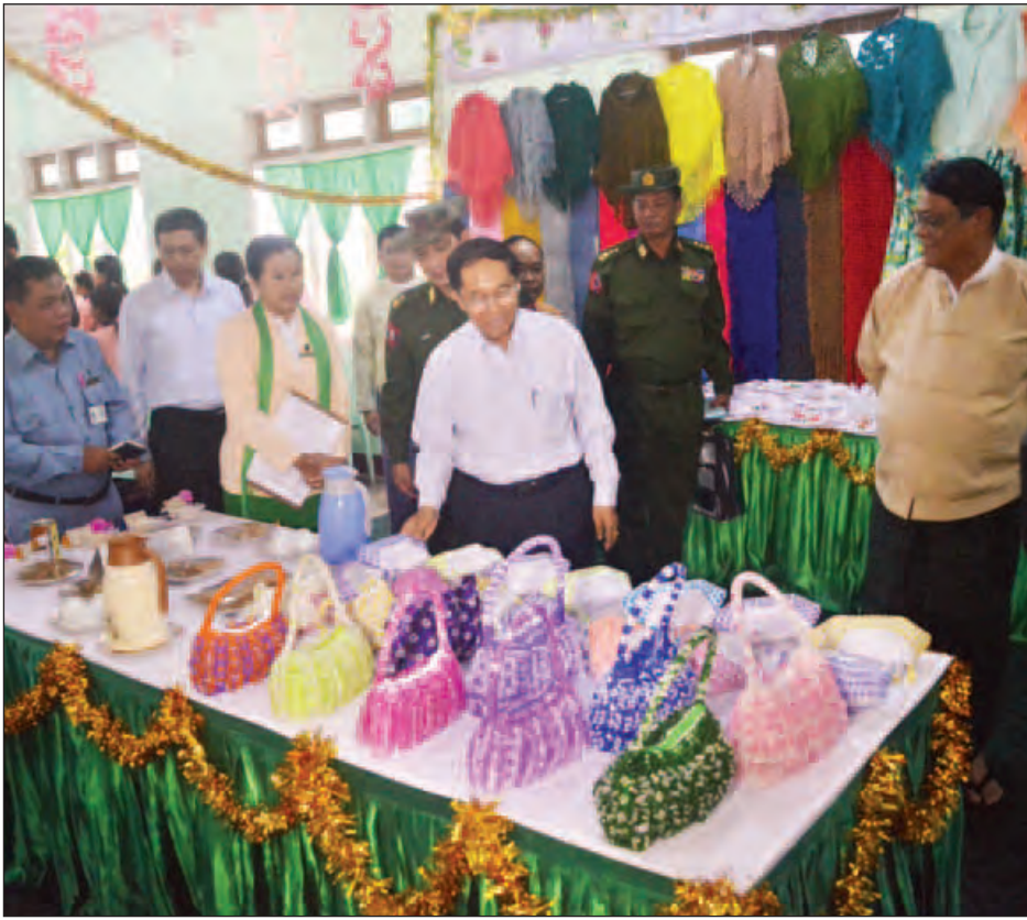
ဒုတိယသမ္မတ ဦးမြင့်ဆွေ ခန္တီးမြို့ အမျိုးသမီးအိမ်တွင်းမှုသက်မွေးလုပ်ငန်းပညာသင်တန်းကျောင်း၌ သင်တန်းသူများ ချုပ်ထားသည့် လက်မှုပစ္စည်းများအား ကြည့်ရှုစစ်ဆေးစဉ်။(သတင်းစဉ်)