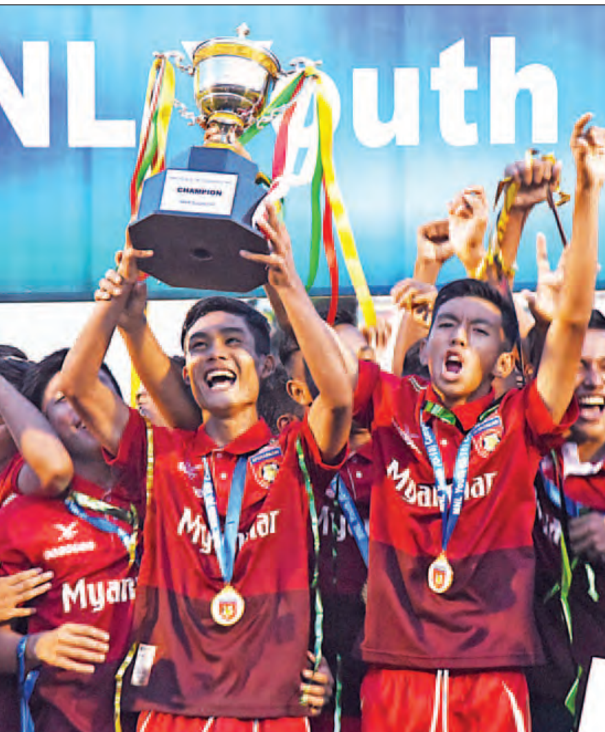
မြန်မာယူ-၁၈ အသင်းအဖြစ်ပြောင်းလဲဖွဲ့စည်းမည့် MFF Youth အသင်းအား ပထမတန်းလူငယ်ပြိုင်ပွဲတွင် ဗိုလ်စွဲစဉ်က တွေ့ရစဉ်။

ရန်ကုန် နိုဝင်ဘာ ၆ ၂၀၁၇ ခုနှစ် စက်တင်ဘာလတွင် အိမ်ရှင်အဖြစ် လက်ခံကျင်းပမည့် ၂၀၁၇ အာဆီယံ ယူ-၁၈ ပြိုင်ပွဲတွင် အောင်မြင်မှုရရန် မြန်မာယူ-၁၈ အသင်းသည် ၁၀ လနီးပါး အချိန်ယူပြင်ဆင်မည်ဖြစ်ပြီး ပြိုင်ပွဲအကြံပြုဆင် မူများစွာ ပြုလုပ်မည်ဖြစ်သည်။ စာမျက်နှာ ၉ ကော်လံ ၄ သို့ ❀