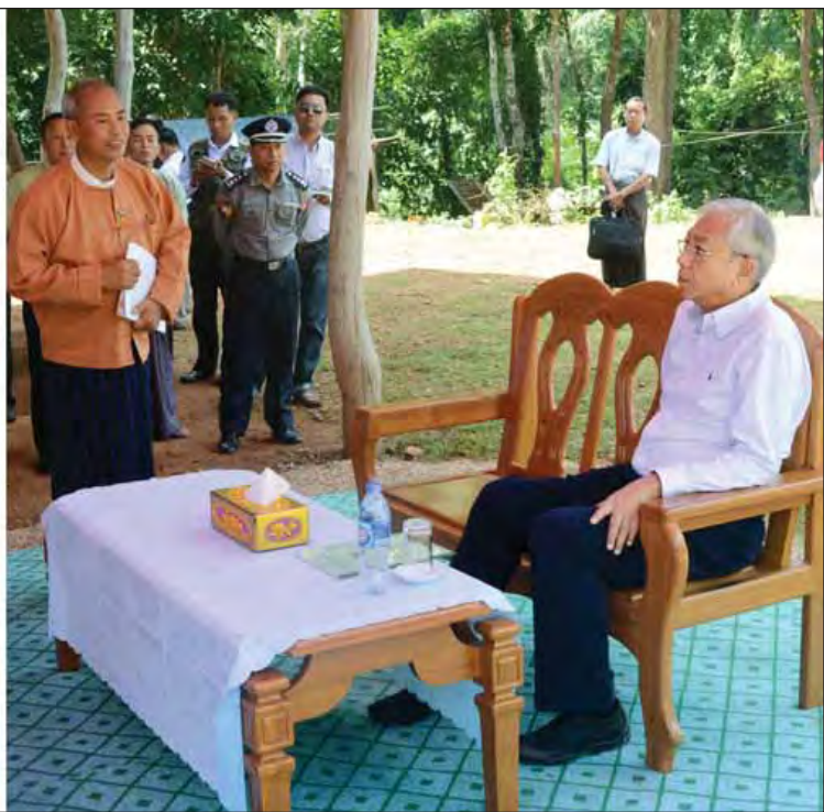
ကယားပြည်နယ် မယ်စုံမြို့ရှိ မယ်စုံနယ်စပ်ကုန်သွယ်ရေးစခန်း၌ ဌာနဆိုင်ရာများ၊ မြို့မိမြို့ဖများ၊ ကုန်သည်လုပ်ငန်းရှင်များ၊ ဒေသခံပြည်သူများနှင့် နိုင်ငံတော်သမ္မတ ဦးထင်ကျော် တွေ့ဆုံစဉ်။ (သတင်းစဉ်)

■ရှေ့ဖုံးမှ ယင်းနောက် နိုင်ငံတော်သမ္မတနှင့်အဖွဲ့သည် ကယားပြည်နယ် မယ်စုံမြို့ရှိ မယ်စုံနယ်စပ်ကုန်သွယ်ရေးစခန်းသို့ရောက်ရှိပြီး ဌာနဆိုင်ရာများ၊ မြို့မိမြို့ဖများ၊ ကုန်သည်လုပ်ငန်းရှင်များ၊ ဒေသခံပြည်သူများနှင့် ရင်းရင်းနှီးနှီး တွေ့ဆုံသည်။