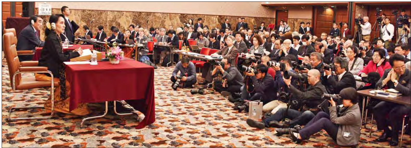
နိုင်ငံတော်၏ အတိုင်ပင်ခံပုဂ္ဂိုလ်ခေါ်အောင်ဆန်းစုကြည် ဂျပန်အမျိုးသား သတင်းထောက်များအသင်း၌ မီဒီယာများနှင့် တွေ့ဆုံစဉ်။ (သတင်းစဉ်)

ထို့နောက် နိုင်ငံတော်သမ္မတနှင့်အဖွဲ့သည် လျှိုင်းကော်မြို့မှ လေကြောင်းခရီးဖြင့် ထွက်ခွာလာရာ ညနေပိုင်းတွင် နေပြည်တော်သို့ ပြန်လည်ရောက်ရှိကြသည်။ (သတင်းစဉ်)