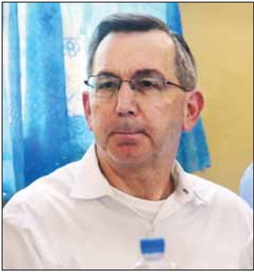
မစ္စတာ မာစီရယ်လ် အမေရိကန်သံအမတ်ကြီး