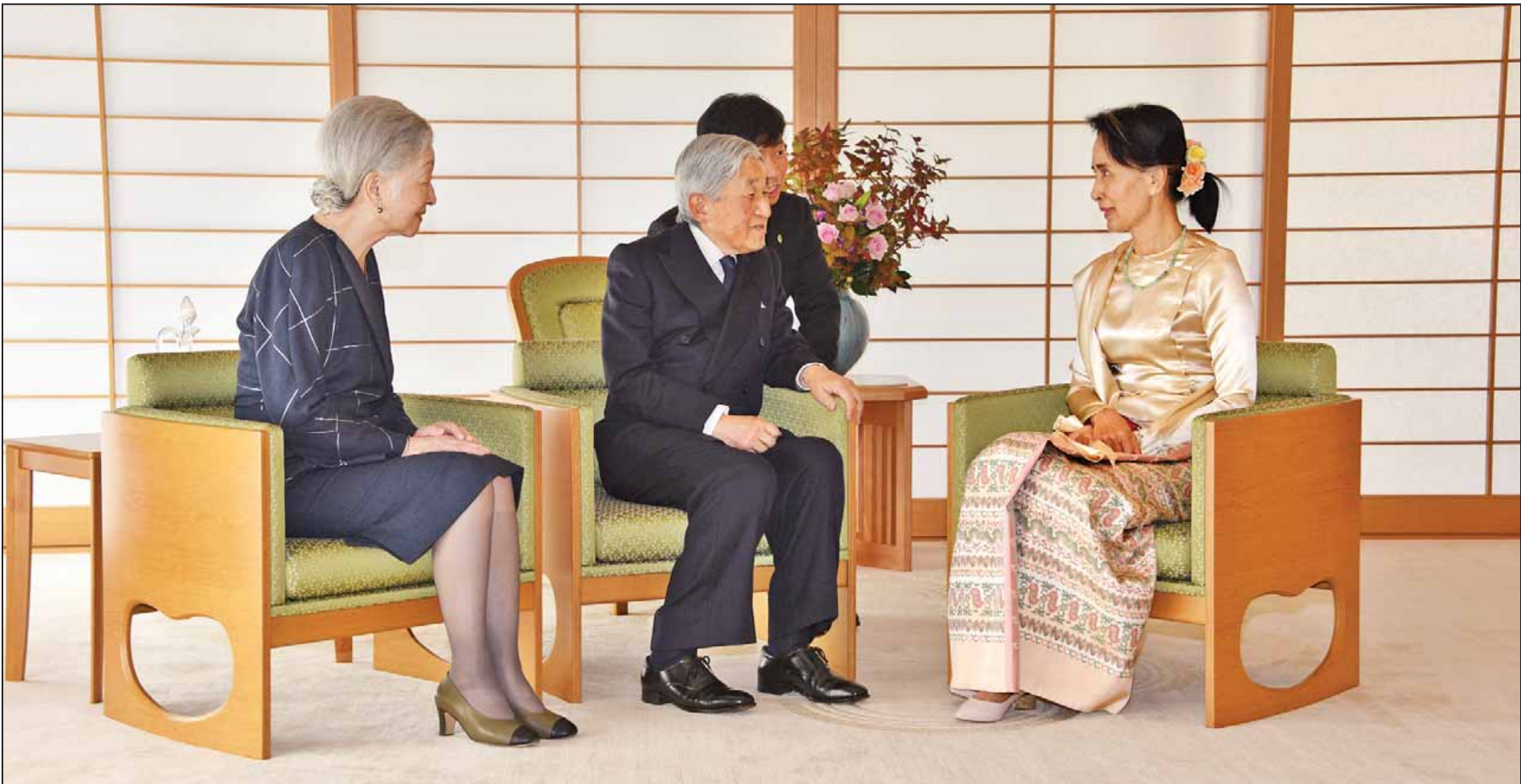
ဂျပန်နိုင်ငံဘုရင် အာကီဟိတိုနှင့် မိဖုရား မိချိုကို တို့အား နိုင်ငံတော်၏ အတိုင်ပင်ခံပုဂ္ဂိုလ် ဒေါ်အောင်ဆန်းစုကြည် ဂျပန်ဘုရင်နန်းတော်၌ သွားရောက်တွေ့ဆုံစဉ်။ (သတင်းစဉ်)

နေပြည်တော် နိုဝင်ဘာ ၄ နိုင်ငံတော်သမ္မတ ဦးထင်ကျော်သည် ပြည်ထောင်စုဝန်ကြီး ဒေါက်တာသန်းမြင့်၊ ဦးသိန်းဆွေ၊ ဦးဖေဇင်ထွန်း၊ ပြည်နယ်ဝန်ကြီးချုပ် အယ်လ်ဖောင်းရှိ၊ ကာကွယ်ရေးဦးစီးချုပ်ရုံး(ကြည်း)မှ ဒုတိယဗိုလ်ချုပ်ကြီးအေးဝင်း၊ အရှေ့ပိုင်းတိုင်းစစ်ဌာနချုပ်တိုင်းမှူး ဗိုလ်ချုပ်ဝင်းမင်းထွန်း၊ ဒုတိယဝန်ကြီး ဗိုလ်ချုပ်သန်းထွဋ်၊ တာဝန်ရှိသူများနှင့်အတူ ယနေ့နံနက်ပိုင်းတွင် လွိုင်ကော်မြို့ သီရိမင်္ဂလာတောင်တော်ရှိ တောင်ကွဲစေတီတော်နှင့် ဆုတောင်းပြည့် မြို့နာမ်ဘုရားတို့အား သွားရောက်ဖူးမြော်ကြည်ညိုကာ ပန်း၊ ရေချမ်း၊ ဆီမီးနှင့် အလှူငွေများကို ဆက်ကပ်လှူဒါန်းခဲ့သည်။ စာမျက်နှာ ၃ ကော်လံ ၁ သို့