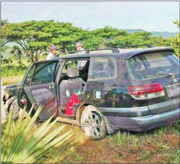
သန်းဦး(လေးမျက်နှာ)

နေပြည်တော် နိုင်ငံဘာ ၄ ရန်ကုန်-မန္တလေးအမြန်လမ်းမကြီး၏ ဖြူးအမြန်လမ်းရဲစခန်းအပိုင် မိုင်တိုင်အမှတ် (၁၀၉/၁) နှင့်(၁၀၉ /၂)အကြား ရန်ကုန်မှ နေပြည်တော်သို့ ယာဉ်မောင်း မျိုးမြင့်မောင်းနှင့် လာသော CALDINA မော်တော်ယာဉ်သည် ယနေ့နံနက် ၇ နာရီ ၁၅ မိနစ်က ဝဲဘက်ရေဘီးပေါက်ကာ လမ်းလယ်ကပ်တုံးတိုက်ပြီး လမ်းလယ်ကျွန်းပေါ် ရောက်ရှိရပ်တန့်ခဲ့သည်။ ဖြစ်စဉ်ကြောင့် ယာဉ်ပေါ်ပါသူများ ထိခိုက်မှုမရှိခဲ့ပေ။ ယာဉ်ကို မဆင်မခြင်မောင်းနှင်သူ ယာဉ်မောင်းမျိုးမြင့်အား ဖြူးအမြန်လမ်းရဲတပ်ဖွဲ့ စခန်းက ယာဉ်(ပ) ၃၆/၂၀၁၆ ရာဇသတ်ကြီးပုဒ်မ ၂၇၉ အရ အမှုဖွင့်အရေးယူထားကြောင်း အမြန်လမ်းရဲတပ်ဖွဲ့စခန်းမှ သိရသည်။