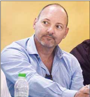
မစ္စတာ ရိုလန် ဥရောပသမဂ္ဂ သံအမတ်ကြီး