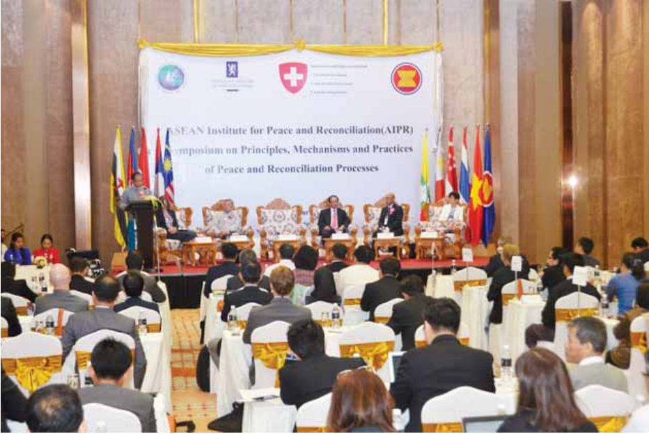
ငြိမ်းချမ်းရေးနှင့် အမျိုးသားပြန်လည်ရင်ကြားစေ့ရေးလုပ်ငန်းစဉ်များဆိုင်ရာမူများ၊ ယန္တရားများနှင့် လက်တွေ့ဆောင်ရွက်မှုများဆိုင်ရာ ဆွေးနွေးပွဲကျင်းပစဉ်။

ဆွေးနွေးပွဲသို့ ယခင်အင်ဒိုနီးရှားနိုင်ငံခြားရေးဝန်ကြီး H.E. Dr. Hassan Wirajuda ၊ မြန်မာနိုင်ငံမဟာဗျူဟာနှင့် နိုင်ငံတကာလေ့လာ