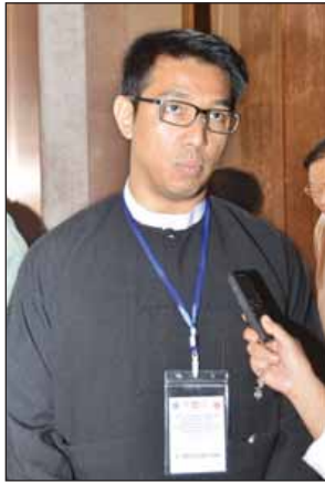
ဒေါက်တာမင်းဇော်ဦး

တွေက အများကြီးရှိတယ်။ (၂၀)ရာစုပင်လုံညီလာခံကျင်းပစဉ်မှာ ငြိမ်းချမ်းရေးလုပ်ငန်းစဉ်မှာပါဝင်တဲ့ အဖွဲ့တွေရဲ့ တောင်းဆိုချက်တွေ၊ ရပ်တည်ချက်တွေက တစ်ဖွဲ့နဲ့တစ်ဖွဲ့မတူကြဘူး။ အဲလို မတူညီတာတွေ ညီရတာကိုက တော်တော်ခက်ခဲတယ်လို့ ယူဆပါတယ်။ လ၊ နှစ် ကြာချင်ကြာမယ်။ အချိန်တော့ပေးရမယ်။ မဆုတ်မနစ် ကြိုးစားသွားကြရမှာ ဖြစ်ပါတယ်။