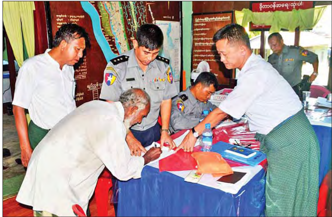
အကြမ်းဖက်စီးနင်းတိုက်ခိုက်မှုဖြစ်စဉ်တွင် ပါဝင်ပတ်သက်မှုမရှိသူများအား ပြန်လွှတ်ပေးစဉ်။ (သတင်းစဉ်)

မောင်တော နိုဝင်ဘာ ၄ ရခိုင်ပြည်နယ် မောင်တောခရိုင်အတွင်း အောက်တိုဘာ ၉ ရက်က နယ်ခြားစောင့်ရဲတပ်ဖွဲ့ စခန်းများအား အကြမ်းဖက်စီးနင်းတိုက်ခိုက်မှုများ ဖြစ်ပွားခဲ့ရာ နယ်ခြားစောင့်ရဲတပ်ဖွဲ့ဝင်များ ကျဆုံးဒဏ်ရာရရှိခဲ့ကြသည့်အပြင် လက်နက်ခဲယမ်းနှင့်ဆက်စပ်စွာသတ်ဖြတ်ခံရသူများ ဆုံးရှုံးခဲ့ရသည်။ ထို့ကြောင့် တပ်မတော်နှင့် နယ်ခြားစောင့်ရဲတပ်ဖွဲ့များ ပူးပေါင်းကာ နယ်မြေရှင်းလင်းရေး ဆောင်ရွက်ခဲ့ပြီး အကြမ်းဖက်စီးနင်းတိုက်ခိုက်သူများ၊ အကူအညီပေးသူများ၊ ပါဝင်ပတ်သက်သူများနှင့် သံသယရှိသူများကို ဥပဒေနှင့်အညီ ရှာဖွေဖော်ထုတ် ထိန်းသိမ်းပြီး စစ်ဆေးမှုများ ပြုလုပ်လျက်ရှိသည်။ နိုဝင်ဘာ ၂ ရက်အထိ မသင်္ကာဘဲ ထိန်းသိမ်းစစ်ဆေးခဲ့မှုမှာ စစ်တွေမြို့မရဲစခန်း၌ သုံးဦး၊ မောင်တောမြို့မရဲစခန်း၌ ငါးဦး၊ ငါးခွရနယ်မြေရဲစခန်း၌ ၄၉ ဦး၊ ပြင်ဖြူကျယ်မြေရဲစခန်း၌ ၅၆ ဦး စုစုပေါင်း ၁၁၃ ဦးဖြစ်သည်။ ၎င်းတို့အနက် မောင်တောမြို့မရဲစခန်း၌ သုံးဦး၊ ငါးခွရနယ်မြေ ရဲစခန်း၌ ၁၅ ဦး၊ ပြင်ဖြူကျယ်မြေ ရဲစခန်း၌ ၂၀ စုစုပေါင်း ၃၈ ဦးမှာ အကြမ်းဖက်