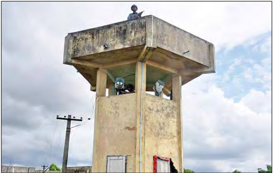
ဆောင်ရွက်နေခြင်းဖြစ်ကြောင်း၊ မောင်တောခရိုင်အတွင်း တိုးမြှင့်ချထားပြီး အကောင်းဆုံးလုံခြုံမှုပေးထားကြောင်း တိုင်းရင်းသားကျေးရွာများတွင် ရဲတပ်ဖွဲ့ဝင်အင်အား သိရသည်။ (သတင်းစဉ်)

“နယ်မြေရှင်းလင်းရေးနဲ့ လုံခြုံရေးဆောင်ရွက်ရာမှာ ပြည်သူတွေရဲ့ အသက်အိုးအိမ်ကာကွယ်စောင့်ရှောက် နိုင်ဖို့ အမြင့်ဆုံးမူဝါဒထားရှိပြီး နိုင်ငံတကာစံချိန်စံညွှန်းနဲ့ အညီ ဆောင်ရွက်နေပါတယ်”ဟု ၎င်းက ဆက်ပြောသည်။ ထို့ပြင် နယ်မြေရှင်းလင်းရေးအတွက် အင်အားအသုံး ပြုရာတွင်လည်း ဥပဒေနှင့်အညီဖြစ်ခြင်း၊ တာဝန်ခံနိုင်မှု ရှိခြင်း၊ အချိုးအစားမျှတခြင်း၊ လိုအပ်သလောက်သာ အသုံးပြုခြင်း စသည့်အချက်လေးချက်နှင့် အညီ