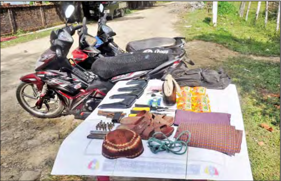
အကြမ်းဖက်စီးနင်းတိုက်ခိုက်သူများထံမှ သိမ်းဆည်းရမိသောပစ္စည်းများကို တွေ့ရစဉ်။