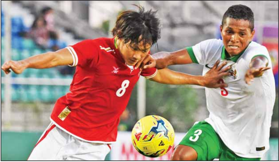
မြန်မာအသင်းနှင့် အင်ဒိုနီးရှားအသင်း အကြိတ်အနယ် ယှဉ်ပြိုင်နေစဉ်။