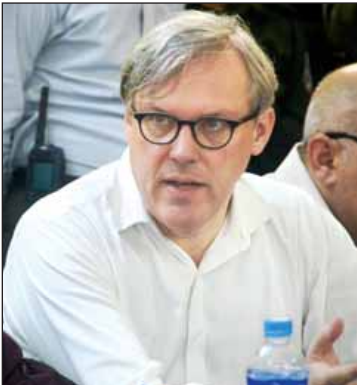
မစ္စတာ အင်ဒရူး ပက်ထရစ် ဗြိတိန်သံအမတ်ကြီး