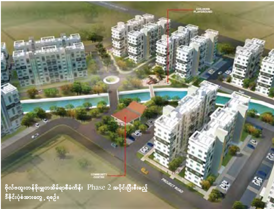
ဗိုလ်ဗထူးတန်ဖိုးမျှတအိမ်ရာစီမံကိန်း Phase 2 အပိုင်းပြီးစီးမည့် ဒီဇိုင်းပုံစံအားတွေ့ ရစဉ်။

ဗိုလ်ဗထူးတန်ဖိုးမျှတအိမ်ရာစီမံကိန်း Phase 1 အပိုင်းဆောက်လုပ်ရေးစီမံကိန်းအား ပြီးခဲ့သည့် ၂၀၁၃ ခုနှစ် မေ ၇ ရက်က စီမံကိန်းလုပ်ငန်းများစတင်ခဲ့ခြင်းဖြစ်ပြီး လေးခန်းတွဲ ရှစ်ထပ်တိုက်အဆောက်အအုံ အံ့ ၁၄ လုံးဖြင့် အခန်းပေါင်း ၄၄၈ ခန်းအား ဆောက်လုပ်ခဲ့ကာ ၂၀၁၄ ခုနှစ် ဇန်နဝါရီ ၄ ရက်တွင် ရန်ကုန်တိုင်းဒေသကြီးအစိုးရအဖွဲ့၏ အစီအစဉ်ဖြင့် အများပြည်သူအား ရောင်းချနိုင်ရန်အတွက် နိုင်ငံပိုင်သတင်းစာတွင် ထည့်သွင်းကြော်ငြာခဲ့ပြီး ရန်ကုန်