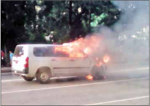
ရန်ကုန်မြို့၊ ဗိုလ်တထောင်မြို့နယ် မဟာဗန္ဓုလလမ်းနှင့် ဗိုလ်တထောင်ဘုရားလမ်းတောင့်တွင် နိုင်ငံဘာ ၄ ရက် နံနက် ၇ နာရီ ၄၅ မိနစ်ခန့်က ပရိဘောဂတက္ကစီယာဉ်တစ်စီး ဖီးလောင်မှုဖြစ်ပွားနေသည်ကို တွေ့ရစဉ်။