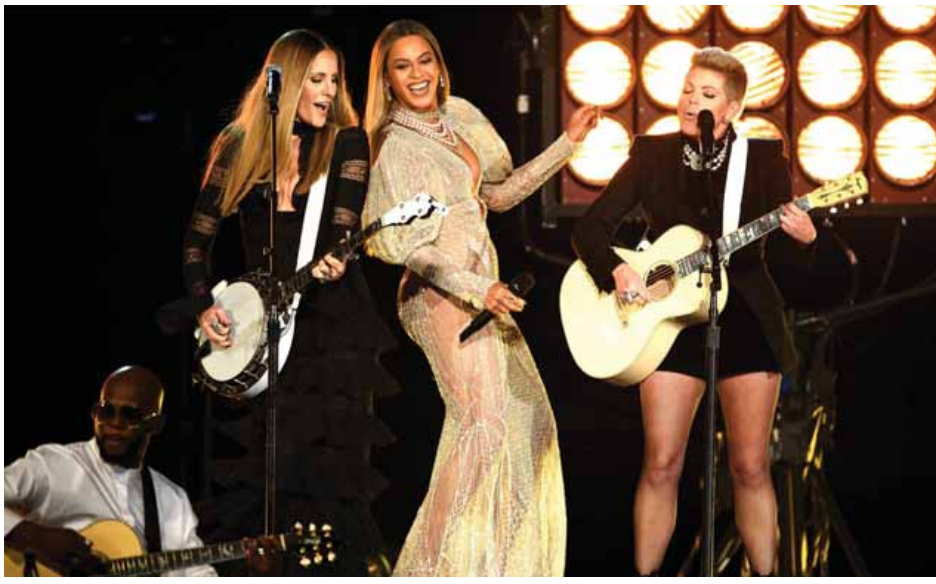
၂၀၁၆ကန်းထရီးတေးဂီတဆုပေးပွဲတွင် ဘီယွန်းစေးနှင့် "The Dixie Chicks" တို့ တွဲဖက်ဖော်ပြနေစဉ်။

အဆိုပါခရီးစဉ်နဲ့ ပတ်သက်တဲ့အသေးစိတ် အချက်အလက်တွေနဲ့ သွားရောက်မယ့် အချိန်အတိ အကျကိုတော့ ဘလွန်းစွန်းမိ အန်တာတီနီးမန်ရဲ့ ဝက်ဘ်ဆိုက်ဒ်မှာ မကြာမီ ထုတ်ပြန်ပေးသွားမှာ ဖြစ်ပါတယ်။