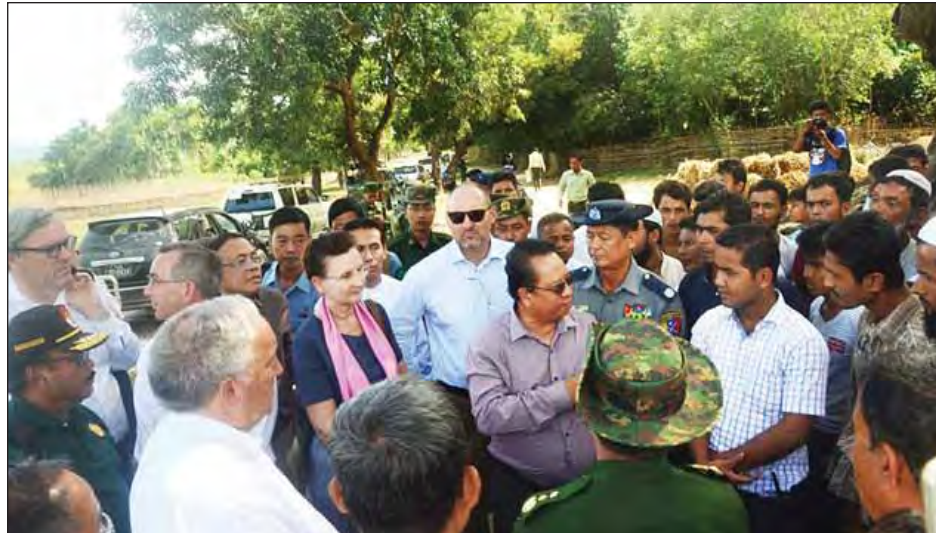
ဇော်မတက်ကျေးရွာ၌ နေထိုင်ကြသည့် အစွဲလမ်းဘာသာဝင်များအား တွေ့ဆုံမေးမြန်းစဉ်။ (သတင်းစဉ်)