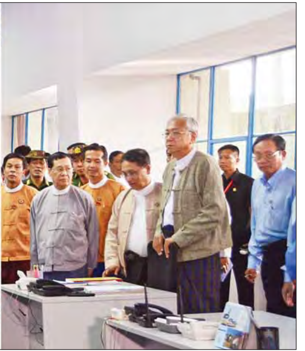
နိုင်ငံတော်သမ္မတ ဦးထင်ကျော် အမှတ်(၂) ဘီလူးချောင်း ရေအားလျှပ်စစ်စက်ရုံအတွင်း ကြည့်ရှုစစ်ဆေးစဉ်။ (သတင်းစဉ်)

နိုင်ငံတော်သမ္မတက တင်ပြချက်များအပေါ် ပြန်လည်သုံးသပ်ပြောကြားပြီး ပြည်နယ်ဖွံ့ဖြိုးတိုးတက်ရေးနှင့် ပြည်သူများရသင့်ရထိုက်သည့် အခွင့်အလမ်းများ ရရှိရေးအတွက် အတတ်နိုင်ဆုံး ဖြည့်ဆည်းဆောင်ရွက်ပေးနိုင်ရန် ကြိုးစားဆောင်ရွက်ပေးသွားမည်ဖြစ်ကြောင်း ပြောကြားသည်။