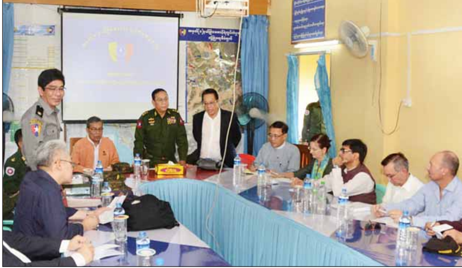
မောင်တောမြို့နယ် အမှတ်(၁) နယ်ခြားစောင့်ရဲတပ်ဖွဲ့ ကွပ်ကဲဌာနချုပ် (ကျီးကန်းပြင်)တွင် အကြမ်းဖက်စီးနင်းတိုက်ခိုက်ခဲ့သည့် ဖြစ်စဉ်များအား တာဝန်ရှိသူများက ရှင်းလင်းပြောကြားစဉ်။ (သတင်းစဉ်)

ပဉ္စမအဆင့်မှာ ဒေသတွင်းပြည်သူတွေရဲ့ စားဝတ်နေရေး၊ ပညာရေး၊ ကျန်းမာရေး၊ လူမှုရေး စတဲ့အခြေအနေတွေ ပုံမှန်ဖြစ်လာစေဖို့ အရေးကြီးတဲ့အချက်ဖြစ်တဲ့ ဌာနဆိုင်ရာ အသီးသီးရဲ့ မူလလုပ်ငန်းတာဝန်တွေ ရပ်တန့်မသွားစေဘဲ အုပ်ချုပ်ရေးယန္တရား ပုံမှန်လည်ပတ်စေဖို့ အလေးထားကြိုးပမ်းဆောင်ရွက်ခဲ့ပါတယ်။ အုပ်ချုပ်ရေး ယန္တရားအတွက် ဌာနအသီးသီးမှ ဝန်ထမ်းများအနေနဲ့ မိမိတို့ တာဝန်ကျရာ နယ်မြေအလိုက် ပုံမှန်အတိုင်း စနစ်တကျ နေထိုင်တာဝန်ထမ်းဆောင်နိုင်ဖို့ ပြည်နယ်အစိုးရ တာဝန်ရှိသူတွေနဲ့ ပေါင်းစပ်ညှိနှိုင်းပြီး ဆောင်ရွက်ထားပါတယ်။