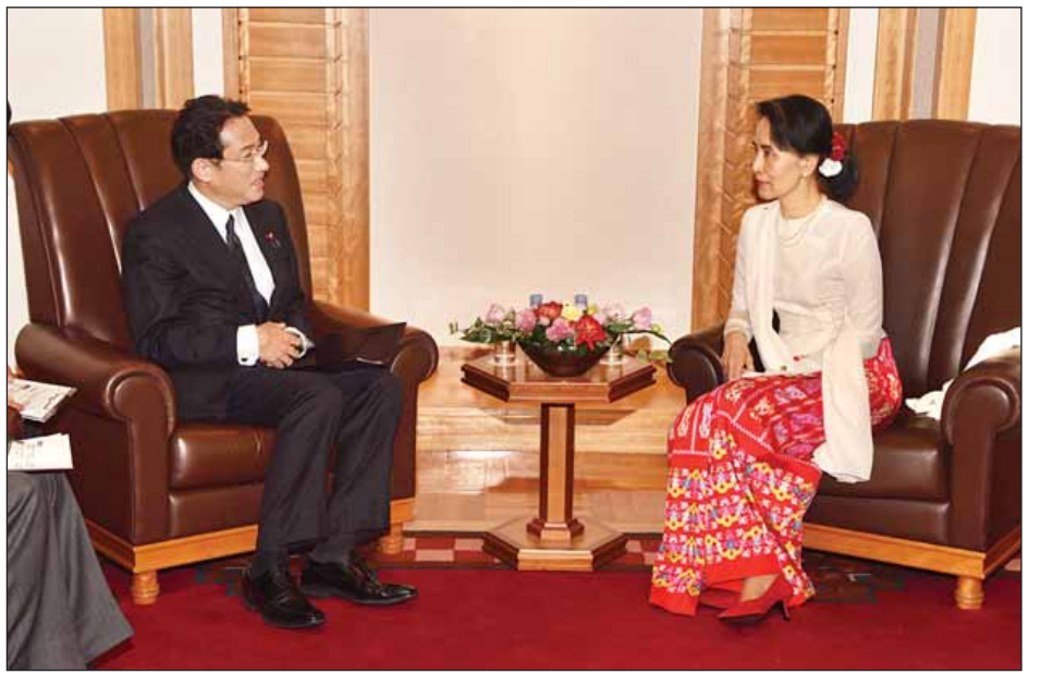
နိုင်ငံတော်၏အတိုင်ပင်ခံပုဂ္ဂိုလ် ဒေါ်အောင်ဆန်းစုကြည်နှင့် ဂျပန်နိုင်ငံခြားရေးဝန်ကြီး H.E.Mr.Fumio Kishida တို့ The Imperial Hotel ၌ တွေ့ဆုံဆွေးနွေးစဉ်။ (သတင်းစဉ်)