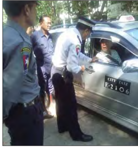
ယာဉ်ထိန်းတပ်ဖွဲ့မှ ယာဉ်မောင်းများ ထိုင်ခုံခါးပတ် ပတ်ထားခြင်းရှိ မရှိစစ်ဆေးစဉ်။

မောင်းချိန်တွင် အသက်ကယ်ထိုင်ခုံခါးပတ်ကို ပတ်ထား သင့်သည်။ မော်တော်ဆိုင်ကယ်စီးသူများ ပြည့်စုံကောင်းမွန် သော ဦးထုပ်များဆောင်း၍ စီးနင်းရန် နေရာအနံ့ပညာပေး ခြင်း၊ စစ်ဆေးရေးယူခြင်းများရှိသော်လည်း လိုက်နာမှု အားနည်းသဖြင့် မော်တော်ဆိုင်ကယ် မတော်တဆဖြစ်မှု၊ တိုက်မှုများကြောင့် သေဆုံး၊ ထိခိုက်သူများပြားနေရဆဲဖြစ် သည်။ ရေကြောင်းသွားရေယာဉ်များ၊ ကူးတို့လှေများတွင် အသက်ကယ်အင်္ကျီ ဝတ်ဆင်မှုအားနည်းခြင်း၊ စီးနင်းလိုက် ပါသူထက် ထားရှိသည့်အသက်ကယ်အင်္ကျီအရေအတွက် နည်းပါးစွာရှိခြင်းတို့ကြောင့် ရေယာဉ်နစ်မြုပ်မှုများတွင် ခရီးသည်သေဆုံးမှုများပြားသည်ကို အောက်တိုဘာလ အတွင်း တွေ့ကြုံရသည့် ချင်းတွင်းမြစ်ကြောင်းသွား အမြန် ရေယာဉ်နစ်မြုပ်မှုဖြစ်စဉ် သတင်းဖော်ပြချက်များတွင်