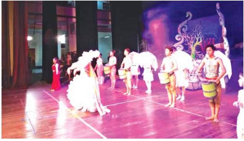
ရေသူမလေးမိရာ ပြဇာတ်ဖျော်ဖြေတင်ဆက်မှုကို မြန်မာနိုင်ငံရပ်စုံသဘင်အသင်းကလည်း ပူးပေါင်းကူညီဆောင်ရွက်ပေးသည်။ ပြဇာတ်ဖျော်ဖြေပွဲမှ လက်မှတ်ရောင်းချရငွေများကိုလည်း ပရဟိတလူမှုရေးလုပ်ငန်းများအတွက် လှူဒါန်းသွားမည်ဖြစ်သည်။

ဆရာဒါရိုက်တာ အီရန်အယ်ကာရစ်၏ အနုပညာဖန်တီးမှုတစ်ရပ်ဖြစ်သော မိဘမေတ္တာသရုပ်ဖော် မေတ္တာဘွဲ့ဇာတ်လမ်းကို မြန်မာ၊ ဖိလစ်ပိုင် အနုပညာရှင်ပါသနာရှင် ၃၅ ဦးက ပါဝင်သရုပ်ဆောင်ထားကြသည်။ ရေသူမလေး မိရာပြဇာတ်ကို မြန်မာ-ဖိလစ်ပိုင် ယဉ်ကျေးမှု ပူးပေါင်းဖလှယ်ရန်၊ ပြဇာတ်ဆိုင်ရာအနုပညာ ဖန်းတီးမှုများ ပိုမိုဖွံ့ဖြိုးတိုးတက်စေရန်၊ ပရဟိတလုပ်ငန်းများတွင် ပါဝင်ကူညီရန် ရည်ရွယ်ချက်ဖြင့် ကပြခြင်း ဖြစ်သည်။