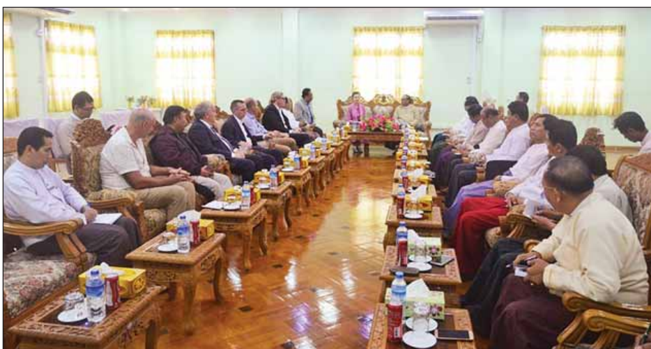
ပြည်ထောင်စုဝန်ကြီးနှင့်အဖွဲ့၊ ကုလသမဂ္ဂဌာနညွှန်ကြားရေးမှူး/လူသားချင်းစာနာမှုအကူအညီပေးရေးညွှန်ကြား ရေးမှူးနှင့် မြန်မာနိုင်ငံဆိုင်ရာသံအမတ်ကြီးများ ရခိုင်ပြည်နယ်လွှတ်တော်ရုံးခန်းမ၌ ပြည်နယ်လွှတ်တော်ဥက္ကဋ္ဌနှင့် တွေ့ဆုံစဉ်။ (သတင်းစဉ်)

တွေ့ဆုံစဉ် UNDP ကိုယ်စားလှယ်နှင့် မြန်မာနိုင်ငံ ဆိုင်ရာသံအမတ်ကြီးများက အကြမ်းဖက်ဖြစ်စဉ်ကြောင့်