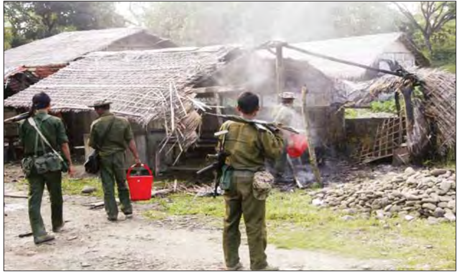
ဘင်္ဂါလီများက ၎င်းတို့နေအိမ်များအား မီးရှို့ထွက်ပြေးသဖြင့် တပ်မတော်စစ်ကြောင်းများနှင့် ရဲတပ်ဖွဲ့ဝင်များက မီးငြိမ်းသတ်နေစဉ်။ (သတင်းစဉ်)

ကျီးကန်းပြင်၊ ဝါးပိတ်၊ စံပယ်ကုန်း၊ ပြောင်ပိုက်၊