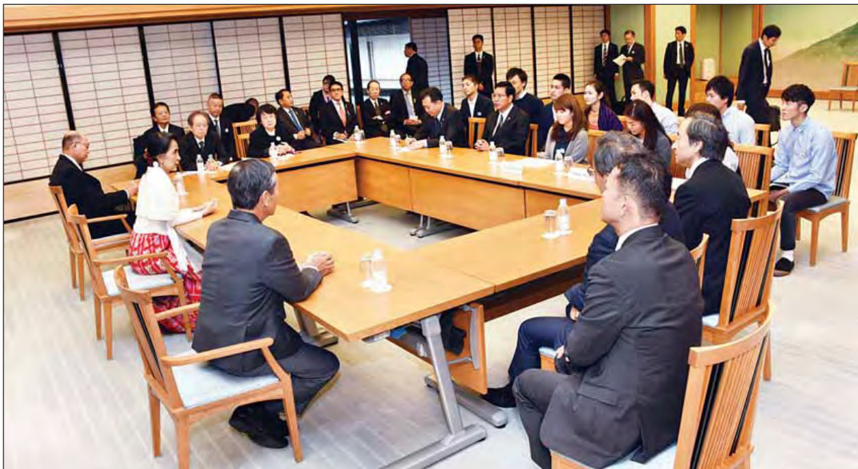
နိုင်ငံတော်၏အတိုင်ပင်ခံပုဂ္ဂိုလ် ဒေါ်အောင်ဆန်းစုကြည် ကိုဘေးတက္ကသိုလ်မှ ပါမောက္ခ Mr. Otsu နှင့် ကျောင်းသားများအား တွေ့ဆုံစဉ်။ (သတင်းစဉ်)