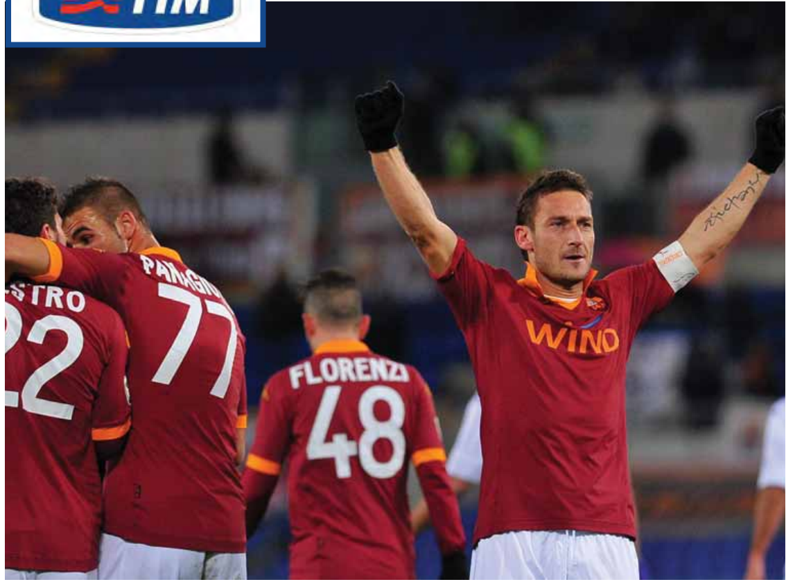
အိတလီစီးရီးအေအသင်းများ ရပ်တည်မှု အမှတ်ပေးဇယား