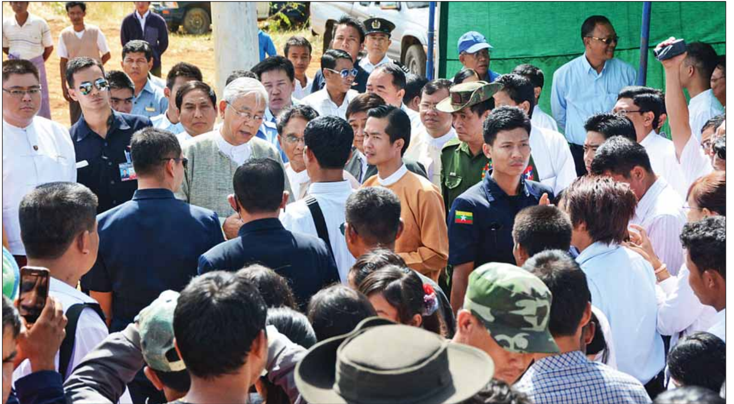
နိုင်ငံတော်သမ္မတ ဦးထင်ကျော် လွိုင်ကော်မြို့နယ် နွားလင်းကျေးရွာအုပ်စု လင်ဖုံလေးကျေးရွာ၌ ဒေသခံပြည်သူများအား ရင်းရင်းနှီးနှီးတွေ့ဆုံနှုတ်ဆက်စဉ်။ (သတင်းစဉ်)

တိုင်းပြည်ဖွံ့ဖြိုးတိုးတက်ရေးအတွက် လုပ်ငန်းများ ဆောင်ရွက်ရာတွင် နိုင်ငံတော်အစိုးရ၊ ဌာနဆိုင်ရာများ၊ ပြည်သူများအားလုံးပူးပေါင်းပါဝင်ရန် လိုအပ်သည့်အပြင် လုပ်ငန်းရှင်များ၏ အခန်းကဏ္ဍသည်လည်း အရေးကြီးပါ ကြောင်း၊ လုပ်ငန်းရှင်များအနေဖြင့်လည်း ပြည်သူပြည်သား များ၏ကောင်းကျိုးအတွက် ဝိုင်းဝန်းပူးပေါင်းဆောင်ရွက်ရန် လိုအပ်ပါကြောင်း၊ စာမျက်နှာ ၃ ကော်လံ ၁ သို့ ☆