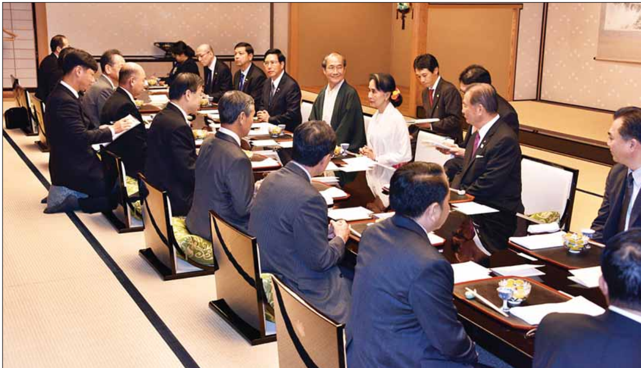
နိုင်ငံတော်၏အတိုင်ပင်ခံပုဂ္ဂိုလ် ဒေါ်အောင်ဆန်းစုကြည်အား ကျိုတိုမြို့၊ ကုန်သည်ကြီးများနှင့် စက်မှုလုပ်ငန်းရှင်များအသင်းက ဂုဏ်ပြုညစာစားပွဲဖြင့် တည်ခင်းဧည့်ခံစဉ်။