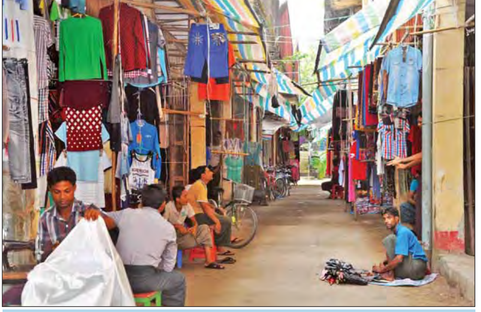
အရောင်းအဝယ်အေးလျက်ရှိသည့် မောင်တောဈေးမြင်ကွင်း။ ဓာတ်ပုံ-နေလင်း

တို့နဲ့ ကစားခွင့်ရတဲ့အတွက် အသင်းရဲ့ ပြင်ဆင်မှုအပိုင်းကို အများကြီးအထောက်အကူဖြစ်စေပါတယ်။ ဆူလူးဖလားပြိုင်ပွဲမှာ အောင်မြင်မှုရအောင် ကြိုးပမ်းသွားမှာပါ” ဟု ပြောကြားခဲ့သည်။ အင်ဒိုနီးရှားလက်ရွေးစင်အသင်းနည်းပြချုပ်အယ်လ်ဖရက်ဒ်က “မြန်မာအသင်းရဲ့ ခြေစမ်းကို လေ့လာထားပါတယ်။ ဒီပွဲကို အာရုံစိုက်ပြီး ကစားမှာပါ။ အခုခြေစမ်းပွဲက ကျွန်တော်တို့ကို ခက်ခဲစေမှာ သေချာသလို မြန်မာအသင်းကိုလည်း ခက်ခဲစေမယ်လို့ ကျွန်တော်ပြောချင်ပါတယ်။ ကျွန်တော်တို့အနေနဲ့ နိုင်ငံတကာပြိုင်ပွဲ ယှဉ်ပြိုင်ခွင့် ကာလရှည်ကြာစွာ ပိတ်ခံထားရတာကြောင့် ခြေစမ်းပွဲတွေကစားပြီး ပြင်ဆင်နေတာဖြစ်ပါတယ်” ဟု ပြောကြားခဲ့သည်။ မြန်မာအသင်းနှင့် အင်ဒိုနီးရှားအသင်းတို့၏ ခြေစမ်းပွဲကို နိုဝင်ဘာ ၄ ရက် ညနေ ၅ နာရီတွင် သုဝဏ္ဏကွင်း၌ ကျင်းပမည်ဖြစ်သည်။ သတင်းနှင့်စာတတ်ပုံ-နှိုင်းထက်စော်