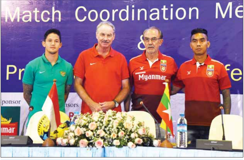
မြန်မာ-အင်ဒိုနီးရှား ပွဲကြိုသတင်းစာရှင်းလင်းပွဲ ပြုလုပ်စဉ်။