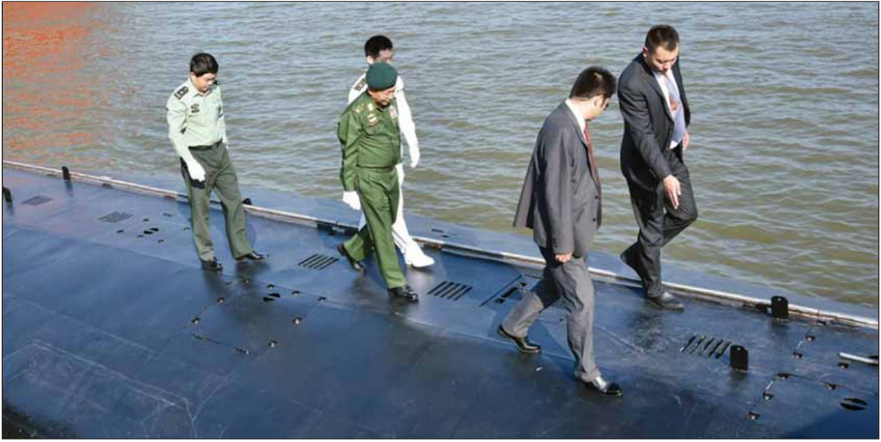
Da Shuai Fu သင်္ဘောဆိပ်သို့သွားရောက်၍ ပုလဲမြစ် ခေါ် Zhu Jiang မြစ် အတွင်း အပျော်စီးသင်္ဘောဖြင့် လှည့်လည်ကြည့်ရှုကြသည်။

ထို့နောက် တပ်မတော်ကာကွယ်ရေးဦးစီးချုပ်နှင့်အဖွဲ့ဝင်များသည်