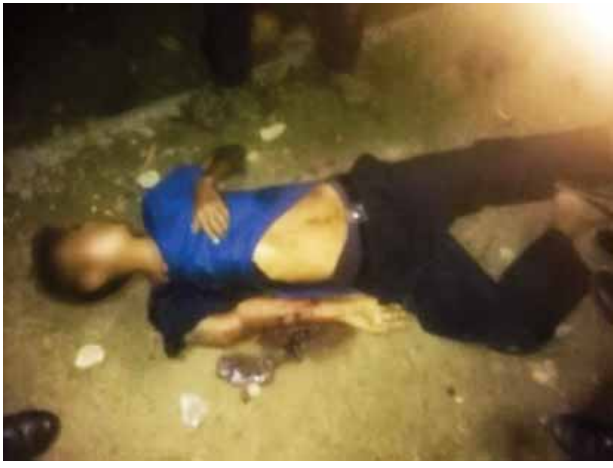
အကြမ်းဖက်စီးနင်းတိုက်ခိုက်သူများ၏ ပစ်ခတ်ခံရမှုကြောင့် ကျဆုံးသွားသော တပ်ဖွဲ့ဝင်တစ်ဦးကို တွေ့ရစဉ်။