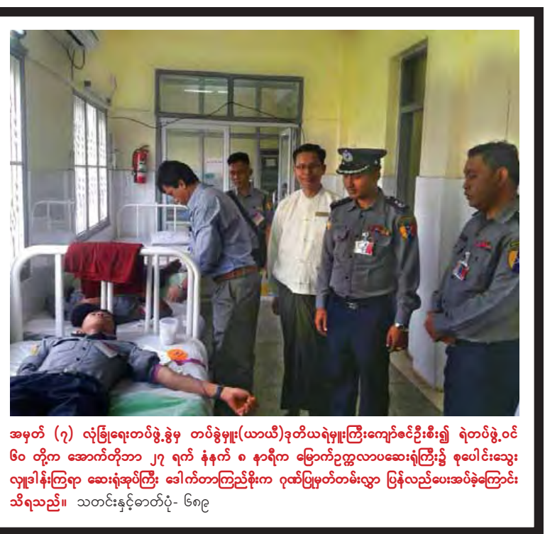
အမှတ် (၇) လုံခြုံရေးတပ်ဖွဲ့ခွဲမှ တပ်ခွဲမှူး(ယာယီ)ဒုတိယရဲမှူးကြီးကျော်စင်ဦးစီး၍ ရဲတပ်ဖွဲ့ဝင် ၆၀ တို့က အောက်တိုဘာ ၂၇ ရက် နံနက် ၈ နာရီက မြောက်ဥက္ကလာပဆေးရုံကြီး၌ စုပေါင်းသွေးလျှော့ခြင်းကြရာ ဆေးရုံအုပ်ကြီး ဒေါက်တာကြည်စိုးက ဂုဏ်ပြုမှတ်တမ်းလွှာ ပြန်လည်ပေးအပ်ခဲ့ကြောင်း သိရသည်။ သတင်းနှင့်ဓာတ်ပုံ- ၆၈၉