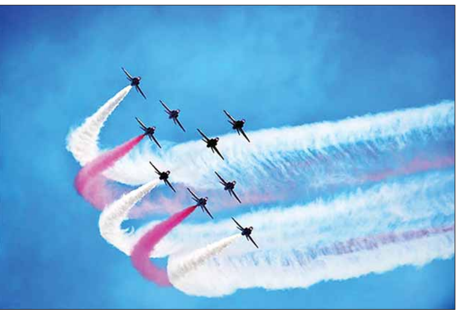
ဈေးကွက်တည်ရာ နိုင်ငံအဆင့် အတန်းကို အမေရိကန်ပြည်ထောင်စုထံမှ လွှဲပြောင်းယူရန် တာရှေ့လျက် ရှိသည်။ တရုတ်နိုင်ငံ၏ ကူးသန်းရောင်းဝယ်ရေးလုပ်ငန်းသုံး လေယာဉ်ထုတ်လုပ်ရေး ကော်ပိုရေးရှင်းကလည်း အရပ်ဘက်သုံး လေယာဉ်သစ်များကို ခင်းကျင်းပြသသည်။ တရုတ်နိုင်ငံသည် လာမည့် ဆယ်စုနှစ် နှစ်စုတာကာလအတွင်း ကမ္ဘာ့လေယာဉ်ဝယ်လိုအား၏ ငါးပုံ ရိုက်တာ။

မြို့ပြလေကြောင်း လုပ်ငန်းများ ဖွံ့ဖြိုးတိုးတက်ရေးအတွက် လည်းကောင်း၊ နိုင်ငံတော်၏ ကာကွယ်ရေးစွမ်းပကား မြှင့်တင်နိုင်စေရေးအတွက် လည်းကောင်း ရည်ရွယ်လျက် လေကြောင်းပြပွဲကို ပြုလုပ်ခြင်းဖြစ်သည်။ တရုတ်နိုင်ငံသည် လာမည့် ဆယ်စုနှစ်အရောက်တွင် ကမ္ဘာ့အကြီးဆုံး မြို့ပြလေကြောင်း