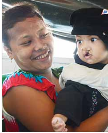
မအေးအေးအောင်

နေရပ်ရွာများတွင် စိုက်ပျိုးခဲ့ကြသည့် စပါးများ ရင့်မှည့်နေပြီဖြစ်သည့်အပြင် ကျွဲ၊ နွားများလည်း ကျန်ခဲ့သဖြင့် ကယ်ဆယ်ရေး စခန်းများမှ နေ့စဉ်ထွက်ခွာလျက်ရှိသည်။