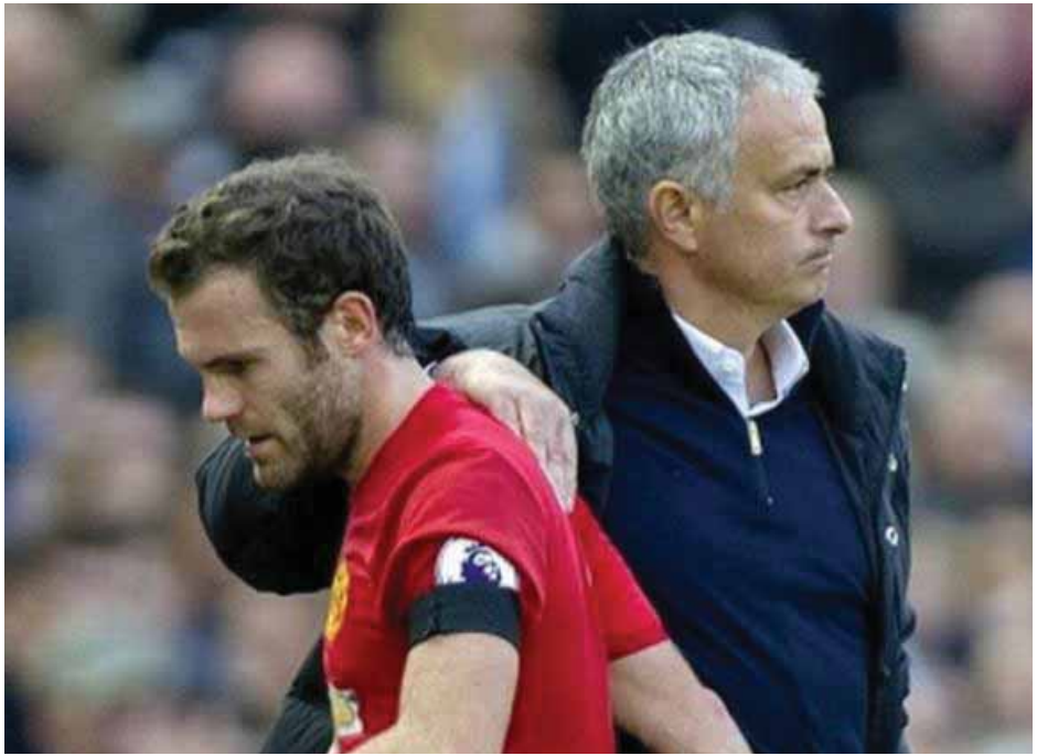
နောက်ဆုံးကစားခဲ့သည့် ပွဲစဉ် ၁၀ ပွဲမှ ရမှတ် ၁၅ မှတ်သာ စုဆောင်းနိုင်ခဲ့ရာ ယင်းရမှတ်သည် ဗိုလ်လက်အောက် ၁၇ မှတ်၊ ဗန်ဟားလ်လက်ထက် ရမှတ် ၂၀ ထက်ပင်

အတက်အကျတွေပေါင်းစုံ တွေ့ကြုံခံစားရပေမယ့် ကျွန်တော်ဟာ အမြဲတမ်းအရေးပါတဲ့ ကစားသမားအဖြစ် ရပ်တည်နိုင်ခဲ့ပါတယ်။ ခုလည်း ကျွန်တော်ဟာ အရေးပါတဲ့ ကစားသမားလို့ ခံစားရပါတယ်။ ဒါကြောင့် ဘယ်သူတွေ ဘယ်လိုပြောစကားတွေနဲ့ ပြောကြပါစေ ကျွန်တော်ဟာ ကျွန်တော့်အလုပ်ကို အကောင်းဆုံး လုပ်ဆောင်နိုင်ခဲ့ တယ်လို့ ယုံကြည်ပါတယ်”ဟု ပြောကြားခဲ့သည်။ ထို့ပြင်မာတာက မော်ရင်ဟိုနှင့် ချယ်လ်ဆီးကစားသမားဘဝကလည်းမပြေလည်ခြင်း မရှိခဲ့သော်လည်း ယင်းဆက်ဆံရေးကို ပရော်ဖက်ရှင်နယ် ဆက်ဆံရေးဟုသာ အမည်တပ်နိုင်ကြောင်းလည်း မှတ်ချက်ပြုခဲ့သည်။ မာတာမှာ လက်ရှိ မန်ယူကစားသမားများထဲတွင်အကောင်းဆုံး ပုံစံပြသထားနိုင်သည့် ကစားသမားတစ်ဦးဖြစ်ပြီး မန်ယူအသင်းလိုအပ်ချိန်တိုင်းတွင် သူ၏ သွင်းဂိုးများဖြင့် အထောက်အကူပြုနိုင်သူဖြစ်သည်။ သို့သော် မန်ယူအသင်းသည် ဘန်လေနှင့် ဂိုးမရှိသရေကျခဲ့ခြင်းကြောင့်