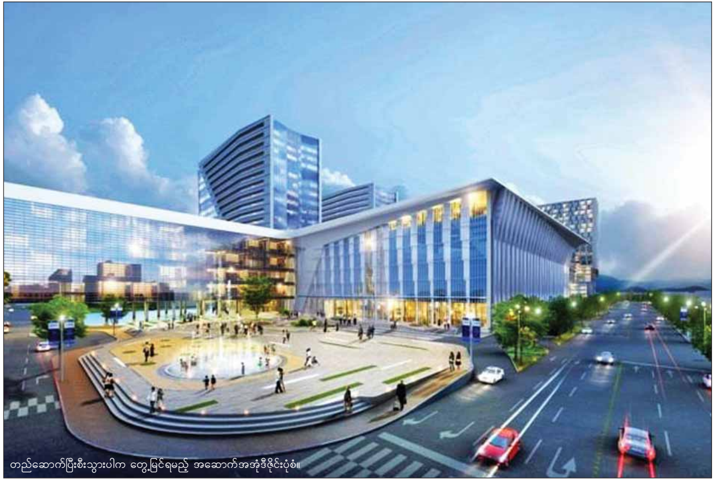
တည်ဆောက်ပြီးစီးသွားပါက တွေ့မြင်ရမည့် အဆောက်အအုံဒီဇိုင်းပုံစံ။