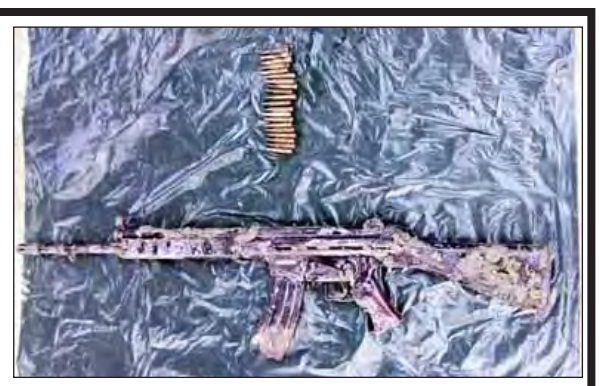
စပါးခင်းအတွင်းမှ သိမ်းဆည်းရမိသည့် အမ်အေ-၁၁ သေနတ်တစ်လက်၊ ကျည်အိမ်တစ်ခု၊ ကျည်အတောင့် ၂၀ တို့အား တွေ့ရစဉ်။