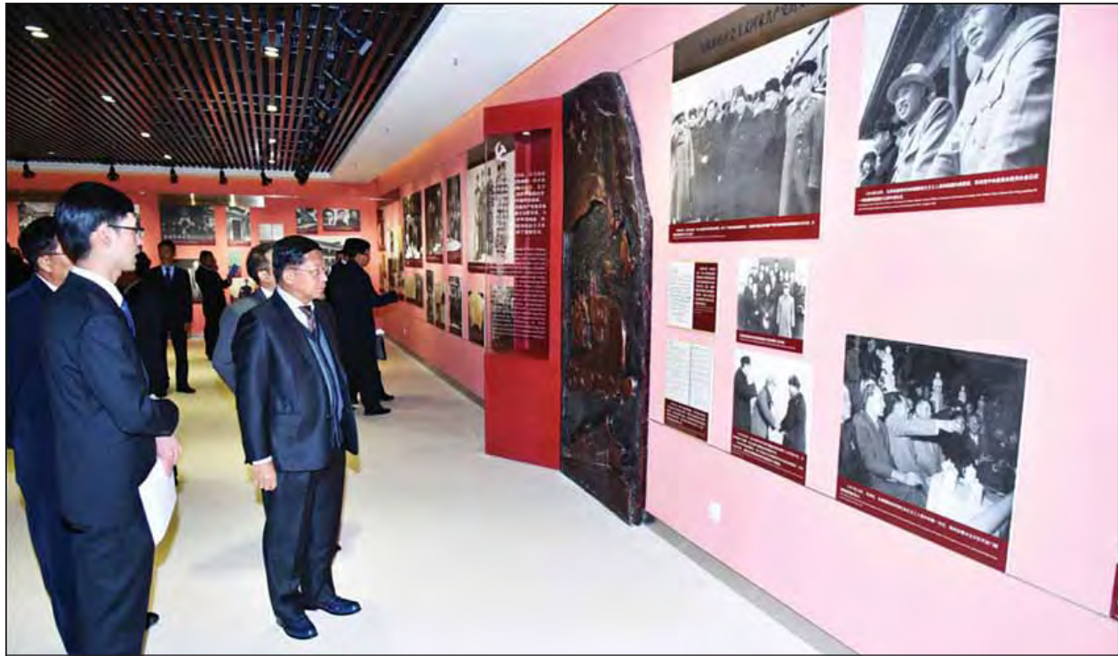
တပ်မတော်ကာကွယ်ရေးဦးစီးချုပ် ဗိုလ်ချုပ်မှူးကြီးမင်းအောင်လှိုင် တရုတ်ပြည်ကွန်မြူနစ်ပါတီဗဟိုကော်မတီ နိုင်ငံခြားဆက်ဆံရေးဌာနအဆောက်အအုံ၌ နိုင်ငံတကာဆက်ဆံရေးဌာန၏ပြခန်းများကို ကြည့်ရှုလေ့လာစဉ်။