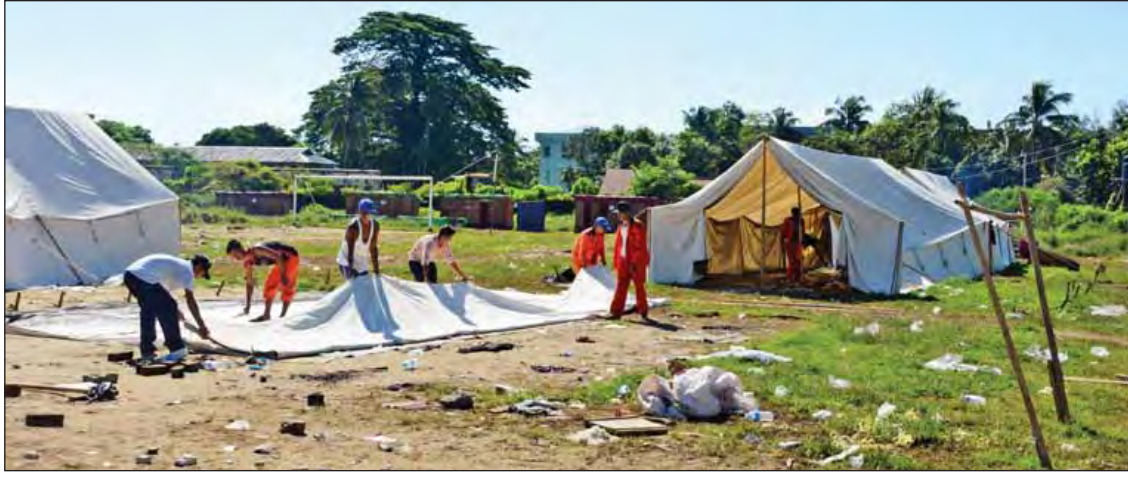
ညောင်တီကယ်ဆယ်ရေးစခန်းအား တွေ့ရစဉ်။

အဲဒီကနေတစ်ဆင့် စစ်တွေကယ်ဆယ် ရေးစခန်းကိုရောက်တယ်။ စစ်တွေမှာ နေရင်း ကနေ မိသားစုရှိလို့ မောင်တောကို တစ်ရက် နှစ်ရက်လောက်ပြန်သေးတယ်။ အဲဒီမှာ စာဖျက်မှာ ၁၁ သို့