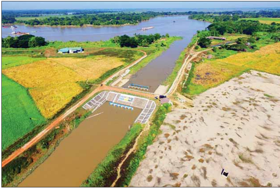
နေ့စဉ် ရေဂါလန် သန်း ၆၀ ဖြန့်ဝေမည့် ကုက္ကိုမြစ်ရေတင်စီမံကိန်းအား တွေ့ရစဉ်။

လဂွန်းပြင်ရေပေးဝေရေးစီမံကိန်းသည် ဒဂုံမြို့သစ် (တောင်ပိုင်း)မြို့နယ် အမှတ်(၂)လမ်းနှင့် မြို့ပတ်လမ်း