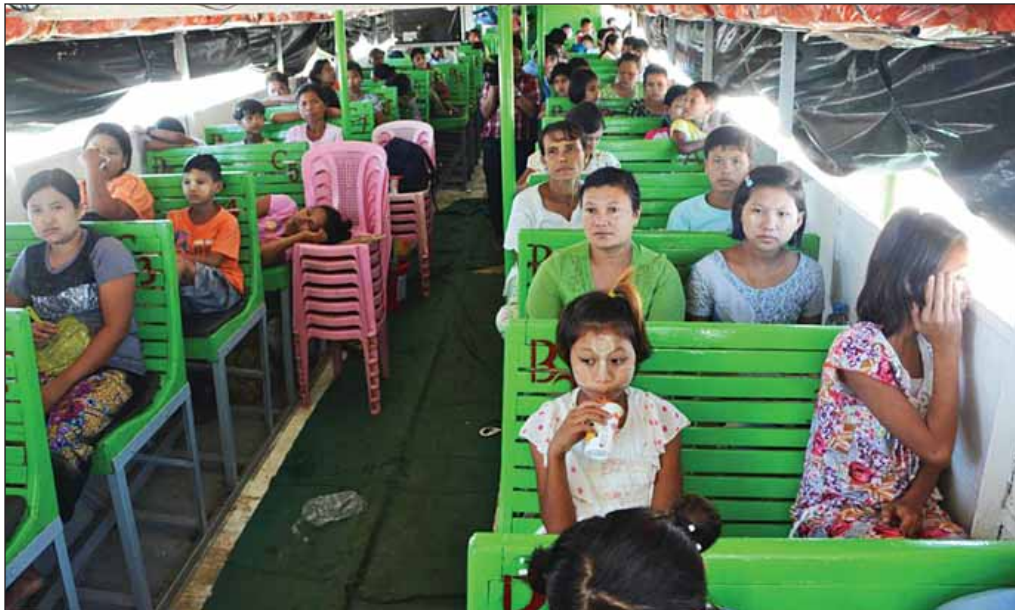
နေရပ်အသီးသီးသို့ ရေယာဉ်ဖြင့် ပြန်လည်ထွက်ခွာလာကြသည့် ဒေသခံပြည်သူများကို တွေ့ရစဉ်။