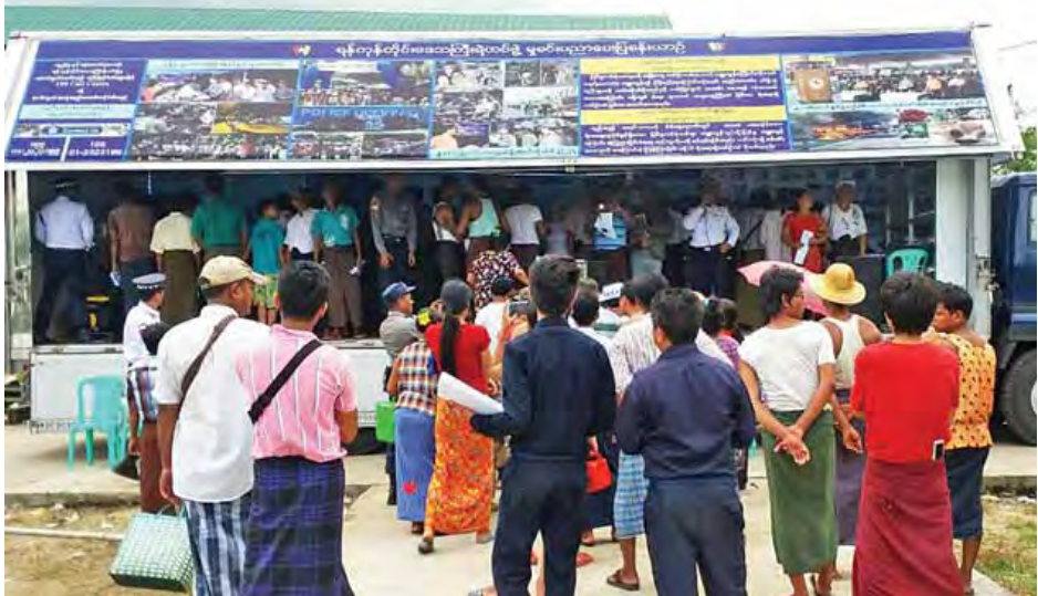
များ ဖြန့်ဝေပေးခဲ့ကြောင်း သိရသည်။ ရန်ကုန်တိုင်းဒေသကြီးရဲတပ်ဖွဲ့မှ မှုခင်းပညာပေးပြခန်းယာဉ်ဖြင့် အသိပညာပေးလုပ်ငန်းများကို ဆက်လက်ဆောင်ရွက်သွားမည်ဖြစ်ကြောင်းနှင့် အများပြည်သူတို့ သိရှိလိုသည့် မှုခင်းကိစ္စများ အသိပညာပေးခြင်းအပြင် ဝန်ဆောင်မှုလုပ်ငန်းများကို ပါဆောင်ရွက်သွားမည်ဖြစ်ကြောင်း သိရသည်။ (သတင်းစဉ်)

ယာဉ်စည်းကမ်းလမ်းစည်းကမ်းနှင့် အညီ လိုက်နာဆောင်ရွက်နိုင်စေရန် အသိပညာပေးခြင်းဖြစ်သည့်အပြင် ကမ္ဘာလှည့်ခရီးသွားနိုင်ခြားသားများ၏ လုံခြုံရေးဆိုင်ရာကိစ္စရပ်များကို ပါ ဗဟုသုတရရှိစေရန် ရည်ရွယ်ပြီး ပညာပေးခြင်းလုပ်ငန်းကို နေရာအနှံ့လိုက်လံပြသဆောင်ရွက်ခဲ့ခြင်းဖြစ်ကြောင်း သိရသည်။ ယင်းသို့ အသိပညာပေးလုပ်ငန်းကို စက်တင်ဘာလ ၁ ရက်နေ့မှစ၍ ဆောင်ရွက်ခဲ့ရာ ယနေ့အထိ မြို့နယ် ပေါင်း ၃၄ မြို့နယ်တို့တွင် ပြည်သူ ၂၀၁၅၀ ခန့် ဆရာ ဆရာမ၊ ကျောင်းသား ကျောင်းသူ ၄၅၉၃၄ ဦးခန့်၊ တပ်မတော်သားနှင့် မိသားစု ၃၄၀ ခန့်တို့ လေ့လာခဲ့ကြပြီး လာရောက်လေ့လာသူများ မှုခင်းအသိပညာရရှိ စေရေးအတွက် ကဏ္ဍအလိုက် သက်ဆိုင်ရာရဲတပ်ဖွဲ့ဝင်များက ရှင်းလင်းဆွေးနွေးခဲ့သည့်အပြင် ပညာပေးလက်ကမ်းစာစောင်