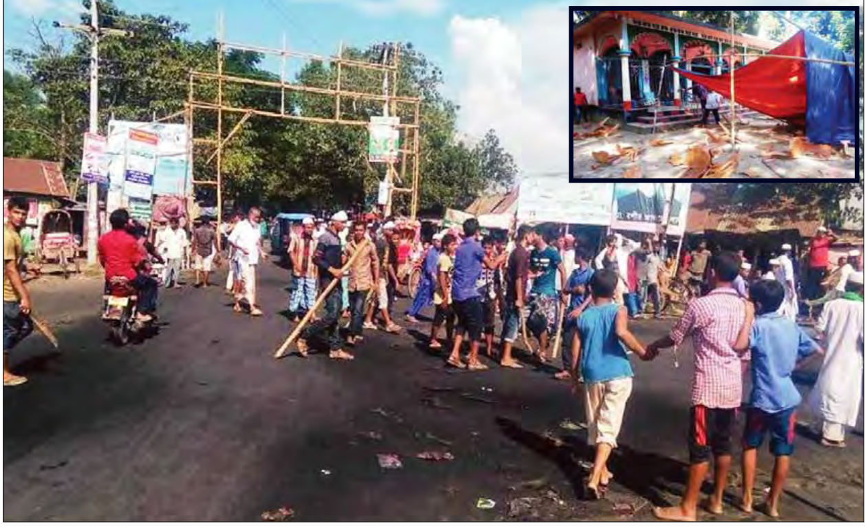
အရန်တပ်ကူအဖွဲ့များ ဖြန့်ကြက်ချထားသည်။ ဘင်္ဂလားဒေ့ရှ်နိုင်ငံတွင် ယခုကဲ့သို့ ဟိန္ဒူဘာသာဝင်များနှင့် အစ္စလာမ်ဘာသာဝင်များအကြား ဖျက်ဆီးတိုက်ခိုက်ခြင်းနှင့် ပဋိပက္ခဖြစ်ပွားခြင်းများသည် ထူးခြားသောဖြစ်ရပ်ဟု ယူဆရသော်လည်း အစွန်းရောက်အစ္စလာမစ်စစ်သွေးကြွများက လူနည်းစုဘာသာဝင်များနှင့် ဘာသာမဲ့များကို ပစ်မှတ်ထားတိုက်ခိုက်သည့်အကြမ်းဖက်မှုများနှင့် ရင်ဆိုင်နေရသည်။ ၂၀၁၂ ခုနှစ်ကလည်း ပင်လယ်ကမ်းခြေမြို့ဖြစ်သော ကော့ဘလားမြို့တွင် အစ္စလာမ်ဘာသာဝင်များ က ဗုဒ္ဓဘာသာဘုန်းတော်ကြီးကျောင်းများ၊ လူနေအိမ်များနှင့် ဈေးဆိုင်များကို မီးရှို့ဖျက်ဆီးခဲ့ကြသည်။ arabnews

ဒါကာမြို့အရှေ့ဘက် ကီလိုမီတာ ၁၅၀ အကွာ(၉၄ မိုင်) ဆူပူအကြမ်းဖက်မှု ဖြစ်ပွားခဲ့သည့် အဆိုပါဒေသသို့ ရဲတပ်ဖွဲ့နှင့် ဘင်္ဂလားဒေ့ရှ်နယ်ခြားစောင့်