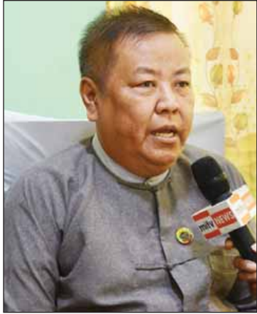
ဒေါက်တာချမ်းသာ

ရခိုင်ပြည်နယ် မောင်တောခရိုင် အမှတ် (၁) နယ်ခြားစောင့် ရဲကွပ်ကဲမှုဌာနချုပ် (ကျီးကန်းပြင်) ကျီးကန်းကောက်ရဲကင်းစခန်းနှင့် ငါးခူရနယ်မြေရုံးတို့သို့ အောက်တိုဘာ ၉ ရက် နံနက်ပိုင်းက အကြမ်းဖက်သမားများက အလစ်အပိုက် ရယူ၍ အကြမ်းဖက်စီးနင်းတိုက်ခိုက်မှုကြောင့် မြန်မာနိုင်ငံရဲတပ်ဖွဲ့ဝင် စုစုပေါင်း ကိုးဦးကျဆုံးခဲ့ပြီး လက်နက်ငယ် မျိုးစုံ၊ ကျည်မျှင်စုံနှင့် ဆက်စပ်ပစ္စည်းများ ဆုံးရှုံးခဲ့ရသည်။ နယ်မြေဒေသမငြိမ်သက်မှုများကြောင့် ဒေသခံတိုင်းရင်းသားများသည် ကြောက်ရွံ့ထိတ်လန့်ပြီး နေရပ်မှ ထွက်ပြေးတိမ်းရှောင်ခဲ့ကြရသည်။ ယခုအခါ နယ်မြေလုံခြုံရေးကို ထိန်းချုပ်နိုင်ခဲ့ပြီဖြစ်ရာ ဒေသခံတိုင်းရင်းသားများ ကယ်ဆယ်ရေးစခန်းများမှ မိမိတို့နေရပ်ဒေသအသီးသီးသို့ ပြန်လည်ထွက်ခွာ နေကြပြီဖြစ်သည်။