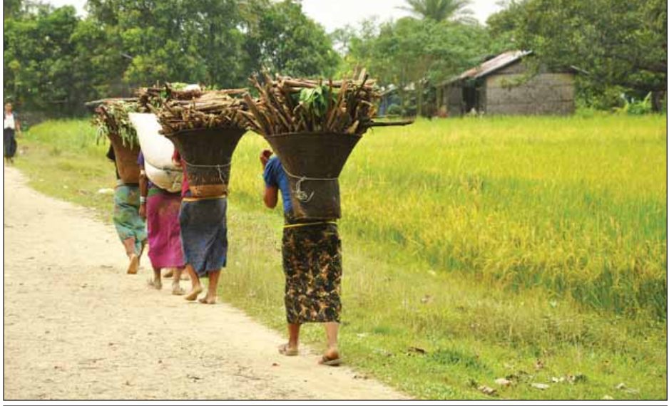
မောင်တောမြို့နယ်ရှိ နယ်မြေအေးချမ်းလာသည့်အတွက် ဒေသခံပြည်သူများ သွားလာလှုပ်ရှားနေကြစဉ်။