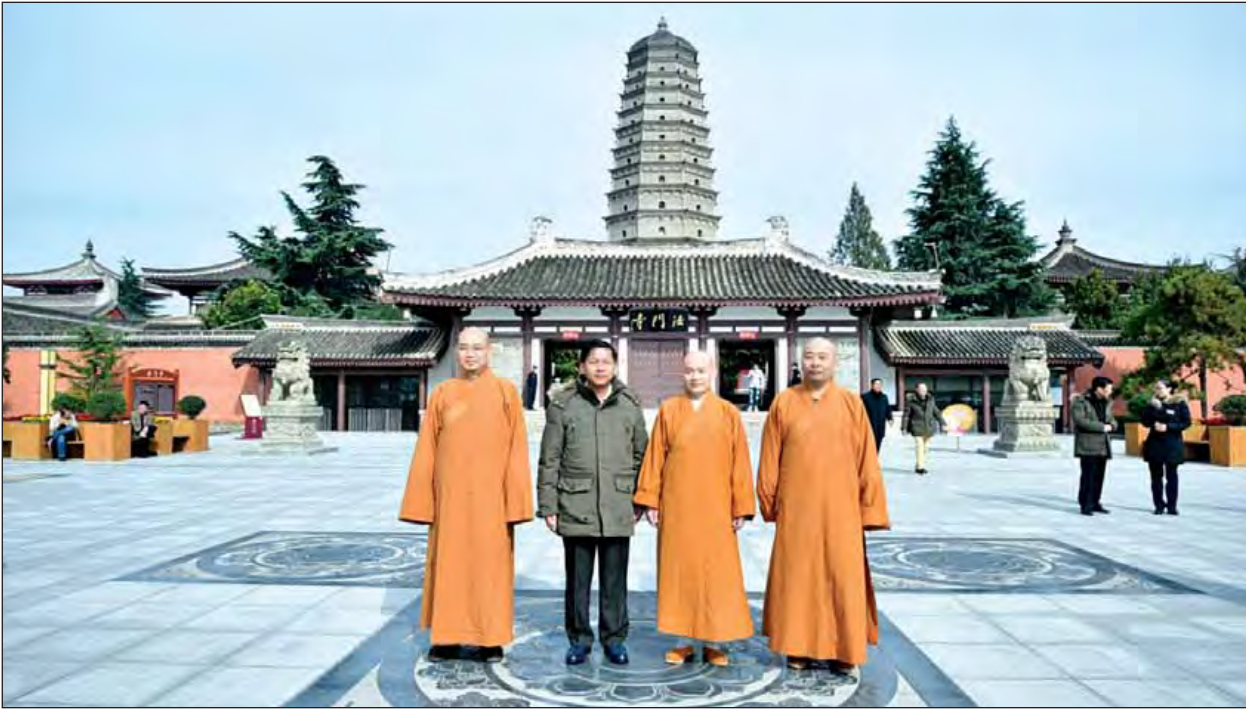
တပ်မတော်ကာကွယ်ရေးဦးစီးချုပ် ပိုလ်ချုပ်မှူးကြီးမင်းအောင်လှိုင် ဘုရားကျောင်းရှေ့၌ မှတ်တမ်းတင်ဓာတ်ပုံရိုက်စဉ်။ (သတင်းစဉ်)

ညပိုင်းတွင် တပ်မတော်ကာကွယ်ရေးဦးစီးချုပ်နှင့်အဖွဲ့သည် တရုတ် ပြည်သူ့သမ္မတနိုင်ငံဆိုင်ရာ မြန်မာနိုင်ငံသံရုံးသို့ ရောက်ရှိပြီး သံရုံးဧည့်ခန်းမ၌ တပ်မတော်ကာကွယ်ရေးဦးစီးချုပ်က သင်တန်းသားများ၊ သံရုံး/စစ်သံရုံး မိသားစုများအား တွေ့ဆုံအမှာစကားပြောကြားကာ အမှတ်တရပစ္စည်းများနှင့် စားသောက်ဖွယ်ရာများပေးအပ်သည်။ ထို့နောက် တပ်မတော်ကာကွယ်ရေး ဦးစီးချုပ်နှင့်အဖွဲ့အား သံရုံးမိသားစုများက ညစာဖြင့် တည်ခင်းစဉ်အခါသည်။ (သတင်းစဉ်)