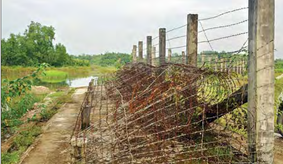
တောင်ပြုလက်ဝဲမြို့ရှိ နယ်စပ်ခြံစည်းရိုးကို တွေ့ရစဉ်။

“အကြမ်းဖက်မှုဖြစ်ပွားခဲ့တဲ့ဖြစ်စဉ်က ဘာကို ဖော်ပြသလဲဆိုရင် ရည်မှန်းချက်ရှိရှိနဲ့ လုပ်ခဲ့တယ်ဆိုတာ ဖော်ပြနေတယ်။ ရေရှည်စီမံကိန်းနဲ့လုပ်ပြီး တစ်ပြိုင်နက်တည်း