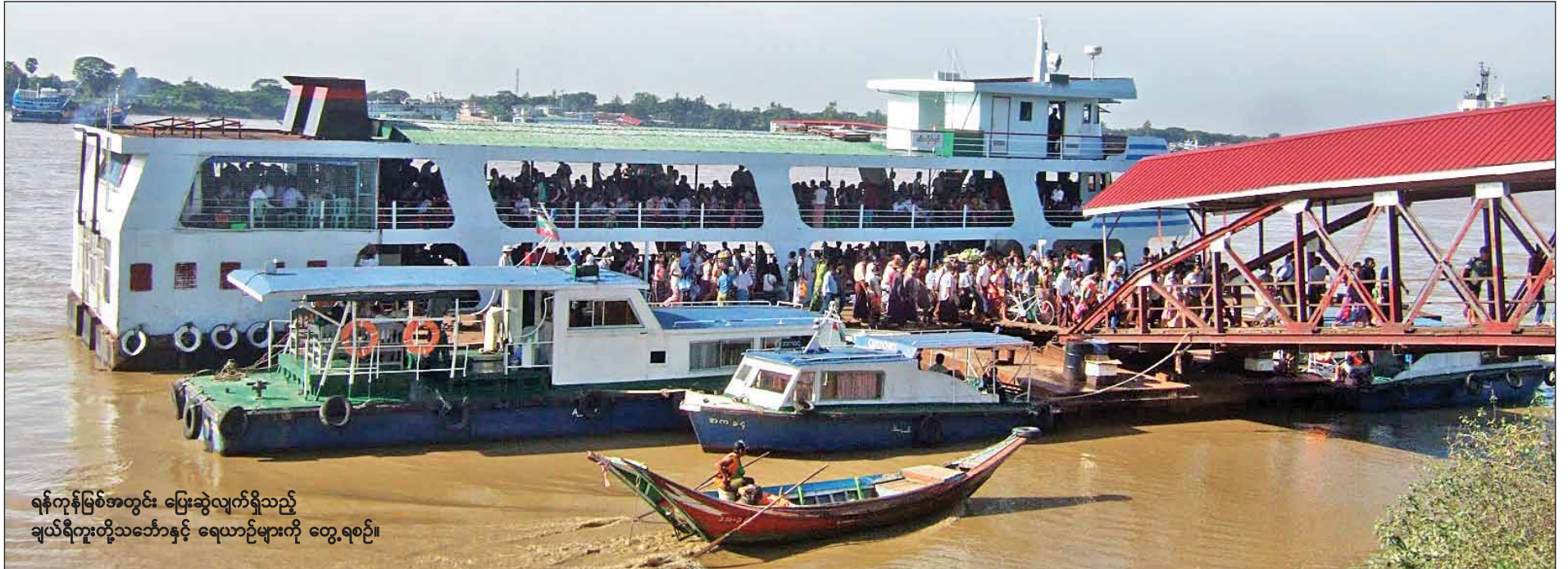
ရန်ကုန်မြစ်အတွင်း ပြေးဆွဲလျက်ရှိသည့် ချယ်ရီကူးတို့သင်္ဘောနှင့် ရေယာဉ်များကို တွေ့ရစဉ်။