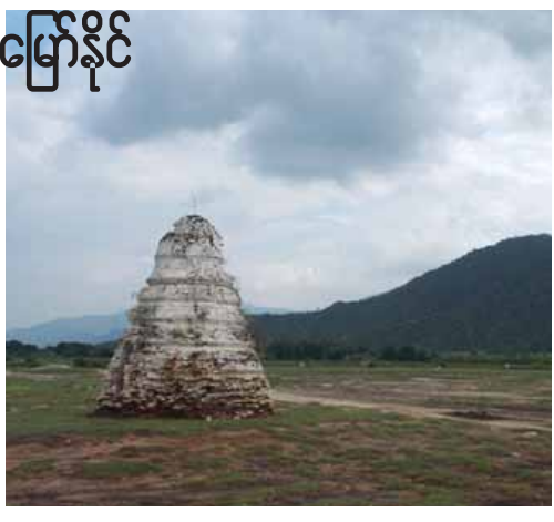
ပင်းယသို့ပြောင်းရွှေ့သွားခဲ့သည်။ ဇေယျာ(မြစ်ဝယ်)