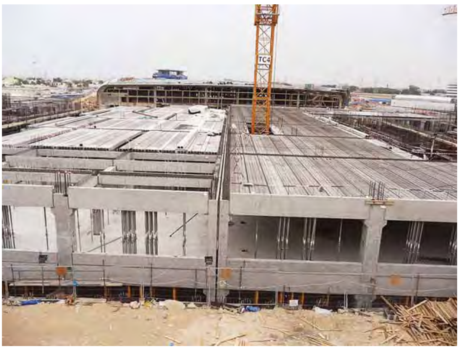
အဆောက်အအုံများအား Precast နည်းပညာစနစ်ဖြင့် ဆောက်လုပ်နေသည်ကို တွေ့ရစဉ်။

“Precast စနစ်နဲ့ ဆောက်လုပ်တာကတော့ ရိုးရိုး သမားရိုးကျ ဆောက်လုပ်တာထက် ဈေးနှုန်း ၂၀ ရာခိုင်နှုန်းလောက်တော့ ပိုမိုကုန်ကျပါတယ်။ ဒါပေမယ့် ဆောက်လုပ်ချိန်မြန်ပြီး ဆောက်လုပ်တဲ့ကြိုခိုင်းမှုအပိုင်းကျတော့လည်း ကောင်းမွန်တဲ့အားသာချက်ရှိပါတယ်။ ကန်ထရိုက်တွေအနေနဲ့ကလည်း အကုန်အကျခံ ဆောက်လုပ်နိုင်မယ်လို့ ထင်ပါတယ်။ ဘာလို့လဲဆိုတော့ တစ်ဖက်က Labour လုပ်အားခ လျော့ကျသွားလို့ပါ။ တစ်ချိန်ချိန်ကျရင် ဒီ Precast စနစ်က အလွန်ကောင်းမွန်လို့မယူဆပါဘူး။ ဒီ Precast စနစ်နဲ့ ဆောက်လုပ်ထားတာတွေ ရန်ကုန်မြို့မှာ