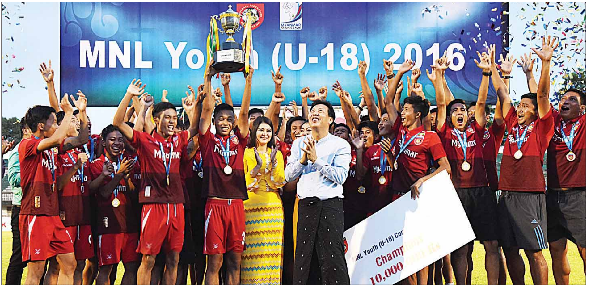
ပထမတန်းလူငယ်ချန်ပီယံ MFF Youth အသင်းအား တွေ့ရစဉ်။