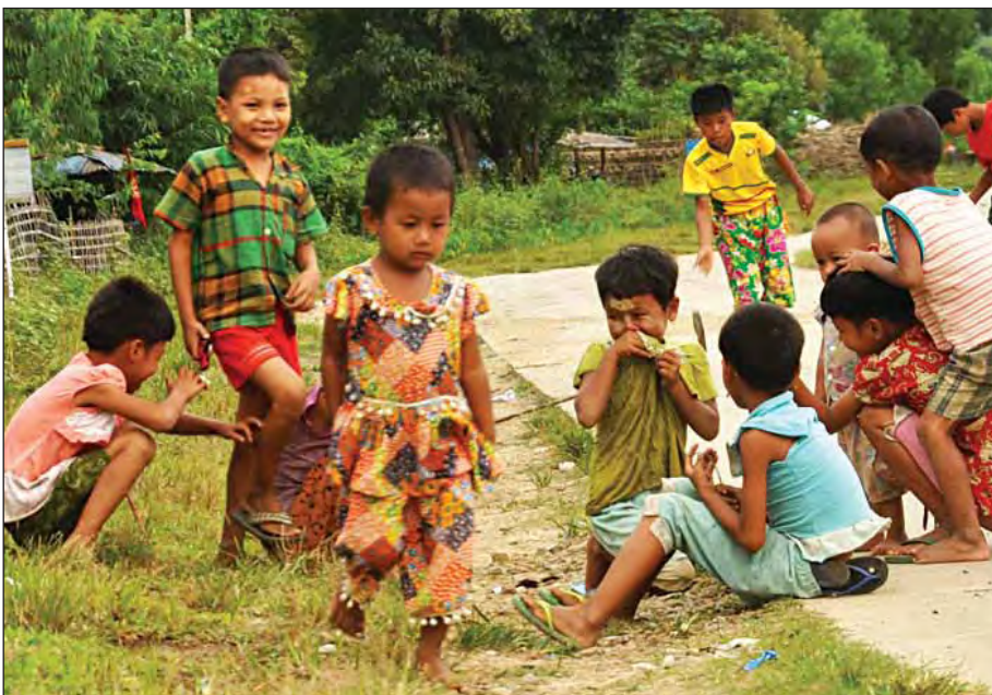
ရခိုင်ပြည်နယ် မောရဝတီကျေးရွာ၌ နယ်မြေပြန်လည်တည်ငြိမ်အေးချမ်းလာ၍ လွတ်လပ်ပေါ့ပါးစွာ ဆော့ကစားနေသည့် ကလေးငယ်များကို တွေ့ရစဉ်။