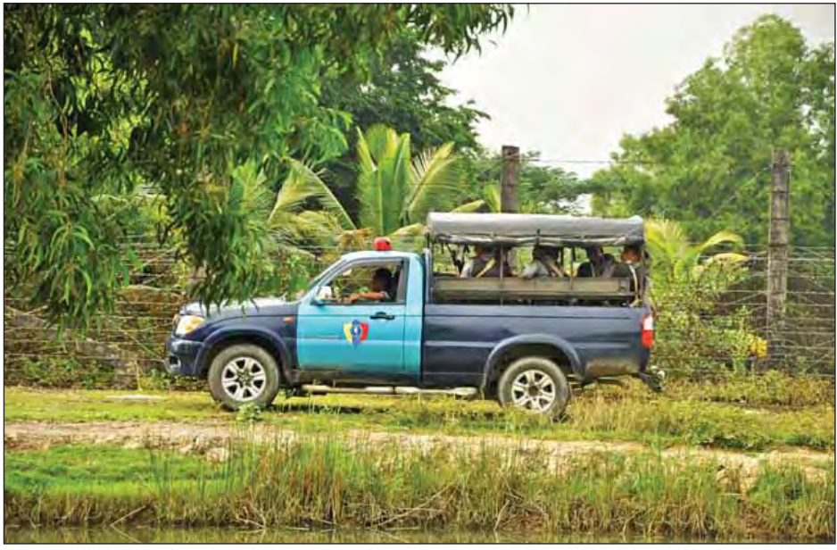
မောင်တောမြို့နယ်ရှိ လုံခြုံရေးတပ်ဖွဲ့ဝင်များ ကင်းလှည့်စောင့်ကြပ်နေစဉ်။

ဒေသခံတိုင်းရင်းသားကျေးရွာတွေ တည်မြဲဖို့ဆိုတာ လုံခြုံရေးက အဓိကပါ။ လုံခြုံရေးမရှိရင် ဒေသခံတိုင်းရင်းသားတွေ နေထိုင်ဖို့ မတည်မြဲနိုင်ဘူး။ တချို့ တိုင်းရင်းသား