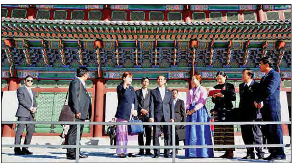
နေပြည်တော် အောက်တိုဘာ ၃၀ ကိုရီးယားသမ္မတနိုင်ငံသို့ ချစ်ကြည်ရေးခရီးရောက်ရှိနေသော ပြည်သူ့လွှတ်တော်ဥက္ကဋ္ဌ ဦးဝင်းမြင့် ခေါင်းဆောင်သော ချစ်ကြည်ရေးကိုယ်စားလှယ်အဖွဲ့သည် ယနေ့ဒေသစံတော်ချိန် နံနက် ၉ နာရီခွဲတွင် ဆိုးလ်မြို့ရှိ ဂယောင်းဘိုနန်းတော်နှင့်ပြတိုက်သို့ သွားရောက်လေ့လာတာဝန်ရှိသူများက နန်းတော်နှင့်ပြတိုက်အတွင်း လိုက်လံရှင်းလင်းပြသခဲ့ကြောင်း သတင်းရရှိသည်။ (ဇေ/သတင်းစဉ်)