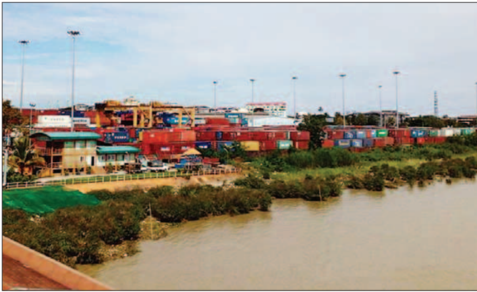
ဗိုလ်တထောင်ဆိပ်ကမ်းရှိ စနစ်တကျစီရိထားသော ကွန်တိန်နာများအားတွေ့ရစဉ်။

ရန်ကုန် အောက်တိုဘာ ၂၉ မြန်မာနိုင်ငံ၏ အပြည်ပြည်ဆိုင်ရာ ပင်လယ်ရေကြောင်းကုန်စည်စီးဆင်း မှုများ မှန်ကန်မြန်ဆန်စွာဆောင်ရွက် စေချင်ကြောင်း အပြည်ပြည်ဆိုင်ရာ ပင်လယ်ရေကြောင်းကုန်စည်ပို့ဆောင် ရေးလုပ်ငန်းရှင်များထံမှ သိရသည်။ မြန်မာ့ဆိပ်ကမ်းအာဏာပိုင်က ပြီးခဲ့ သည့် အောက်တိုဘာ ၁၀ ရက်က အမိန့်ကြော်ငြာစာ၏ အပိုဒ်(က) တွင်ဖော်ပြခဲ့သော ကုန်ပိုင်ရှင်သည် ကုန်လက်ခံပြေစာ တင်ပြနိုင်ပါက ကိုယ်စားလှယ်လုပ်ငန်း ဌာနတွင် ကုန်ထုတ်ခွင့်အမိန့် (Deliver Order-D/O) တိုက်ရိုက်ထုတ်ယူခြင်းကို အောက်တိုဘာ ၁၁ ရက်မှစတင်၍ ကျင့်သုံးမည်ဖြစ်ကြောင်းနှင့် အမိန့် စာမျက်နှာ ၉ ကော်လံ ၁ သို့ ○