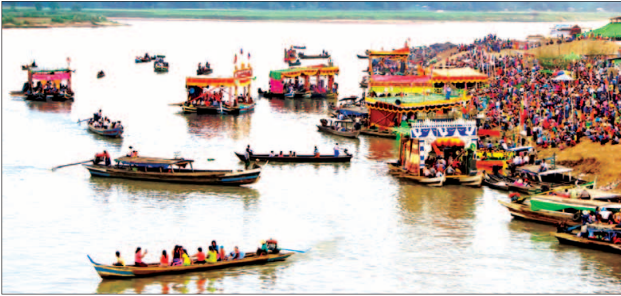
မဒေါက်တန်ဆောင်တိုင်မီးမျှောပွဲတော်ကို ယမန်နှစ်က စစ်တောင်းမြစ်အတွင်း ကျင်းပခဲ့စဉ်။ ဓာတ်ပုံ-ရန်အောင်ထွန်း(ပိန်းဇလုပ်)

မိုးအကုန် ဆောင်းအကူး အလှူထူးသည့် ဟေမန်ဦးအစ တန်ဆောင်မုန်းလတွင် ပဲခူးတိုင်းဒေသကြီး ညောင်လေးပင်မြို့နယ်၌ နှစ်စဉ်စည်ကားသိုက်မြိုက်စွာ ကျင်းပသော ပွဲတစ်ပွဲကား မဒေါက်မြို့ တန်ဆောင်တိုင်မီးမျှောပွဲပင်ဖြစ် သည်။ ဤအချိန်အခါဝယ် မဒေါက်သူ မဒေါက်သားများက တန်ဆောင်တိုင်မီးမျှော ပွဲဇော်ပွဲအတွက် တက်ခတ်ယိမ်း၊ တက်ယုံယိမ်း၊ ယိမ်းအဖွဲ့၊ တိုင်းရင်းသားရိုးရာ ယိမ်းအကအဖွဲ့များက အကအလှသဘာဝဟန်ချက်ညီ ကပြဖျော်ဖြေပြိုင်ပွဲဝင်နိုင် ရေးအတွက် ဇာတ်တိုက်လေ့ကျင့်ခြင်း၊ စက်တပ်လေ့ဖောင်များပေါ်တွင် ဒီဇိုင်း အလိုက် သရုပ်ဖော်ဇာတ်စင်များ ပြင်ဆင်ခြင်းများကို စတင်လှုပ်ရှားနေကြပြီ ဆိုသည်ကတော့ အသေအချာပင်ဖြစ်သည်။