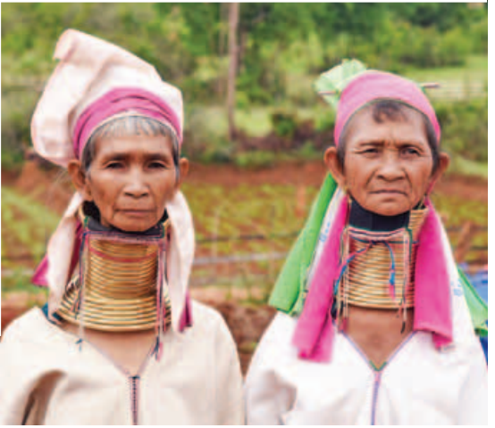
ကယားပြည်နယ် ဒီးမော့ဆိုမြို့နယ်ရှိ ပခေါင်တိုင်းရင်းသားများနေထိုင်ရာ အိမ်ရာများ(အပေါ်ပုံ)နှင့် ပခေါင်တိုင်းရင်းသူ(ယာဝုံ)တို့အား တွေ့ရစဉ်။

မြန်မာနိုင်ငံအတွင်း ယခင်က ခရီးအသွားအလာနည်းခဲ့သော ဝေးလံခေါင်ဖျားဒေသများသို့ ခရီးသွားကဏ္ဍ ဆွဲဆောင်မြှင့်တင်ရန် မြန်မာနိုင်ငံ ခရီးသွားလုပ်ငန်းရှင်များအသင်းက စီစဉ်ဆောင်ရွက်လျက်ရှိကြောင်း သိရသည်။ “အရင်က သွားလို့မရတဲ့ဒေသတွေ အခုသွားလို့ရလာပြီဖြစ်တဲ့အတွက် အဲဒီဒေသတွေကို ခရီးသွားကဏ္ဍ မြှင့်တင်ဖို့လိုပါတယ်။ ကယား၊ တနင်္သာရီ၊ ကရင်၊ ရခိုင်၊ ချင်း၊ ကချင် စတဲ့ ဒေသတွေမှာ ခရီးသွားဆွဲဆောင်မှုတွေ