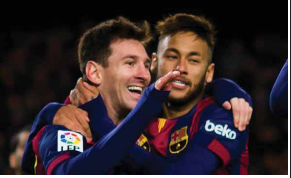
သော်လည်း အဆိုပါဆိုကို မက်ဆီသာ ရသင့်သည်ဟု သုံးသပ်ခဲ့သည်။သို့သော် ပေါ်တူဂီအသင်းနှင့် ယူရှိ ၂၀၁၆ ၂၀၁၆ ဖီဖာဘလွန်းဒီအောဆုကို ရရှိရန် ထိပ်ဆုံးနေရာမှ ရေပန်းစားနေသည်။