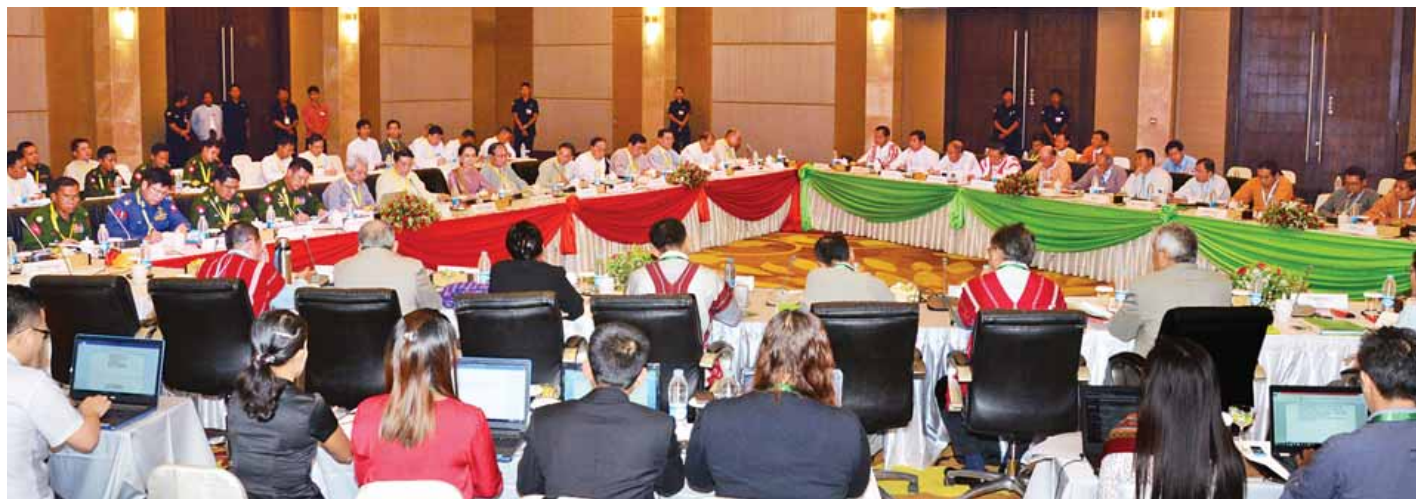
ပြည်ထောင်စုငြိမ်းချမ်းရေးဆွေးနွေးမှု ပူးတွဲကော်မတီ (UPDJC) အစည်းအဝေး ပထမနေ့ကျင်းပစဉ်။ (သတင်းစဉ်)