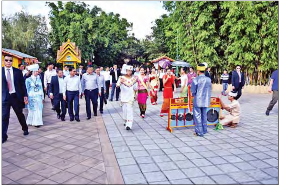
တပ်မတော်ကာကွယ်ရေးဦးစီးချုပ် ဗိုလ်ချုပ်မှူးကြီးမင်းအောင်လှိုင် တိုင်းရင်းသားကျေးရွာအတွင်း လှည့်လည် ကြည့်ရှုစဉ်။ (သတင်းစဉ်)