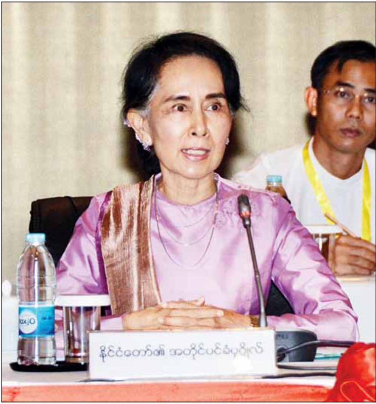
ပြည်ထောင်စုငြိမ်းချမ်းရေးဆွေးနွေးမှု ပူးတွဲကော်မတီဥက္ကဋ္ဌ နိုင်ငံတော်၏အတိုင်ပင်ခံပုဂ္ဂိုလ် ဒေါ်အောင်ဆန်းစုကြည်

ရှေ့ဖုံးမှ ကိုယ်စားလှယ်များနှင့် တာဝန်ရှိသူများ တက်ရောက်ကြသည်။ အစည်းအဝေးတွင် နိုင်ငံတော်၏ အတိုင်ပင်ခံပုဂ္ဂိုလ် ဒေါ်အောင်ဆန်းစုကြည်က အဖွင့်မိန့်ခွန်းပြောကြားရာ၌ UPDJC ၏ အဓိကပန်းတိုင်မှာ ငြိမ်းချမ်းရေးပင်ဖြစ်ပါကြောင်း၊ စစ်မီးများငြိမ်းမှု မိမိတို့အားချမ်းမည်ဖြစ်ပါကြောင်း၊ အေးချမ်းမှုရှိမှ ချမ်းသာအောင် လုပ်နိုင်မည်ဆိုသည် စကားလည်းရှိပါကြောင်း၊ ထို့ကြောင့် UPDJC ၏ အဓိကတာဝန်မှာ ပဋိပက္ခများငြိမ်းချမ်းပြီး ချမ်းသာသည့် ပြည်ထောင်စုကြီး တည်ထောင်နိုင်ရန်ပင်ဖြစ်ပါကြောင်း၊ ပဋိပက္ခများ ချုပ်ငြိမ်းရေးသည် လက်နက်ကိုင်တပ်ဖွဲ့များ အားလုံးနှင့် သက်ဆိုင်ပါကြောင်း။ ငြိမ်းချမ်းရေးတည်ဆောက်မည်ဆိုပါက တစ်ယောက်နှင့် တစ်ယောက်သဘောထားခြင်း ဖလှယ်ရမည်၊ အပြန်အလှန်စကားပြောရမည် ဖြစ်ပါကြောင်း၊ ထိုသို့ ဆွေးနွေးတိုင်ပင်ပြီးမှ အဖြေတစ်ခုရမည်ဖြစ်ပါကြောင်း၊ ထိုအချိန်မှ သဘောတူညီချက်များကို အကောင်အထည် ဖော်ရမည်ဖြစ်ပါကြောင်း၊ ထိုသို့ တစ်ဆင့်ပြီး တစ်ဆင့် လုပ်ဆောင်သွားရန်သည် အင်မတန် အရေးကြီးပါကြောင်း၊ မိမိတို့နိုင်ငံတွင် တိုင်းရင်းသားလူမျိုးပေါင်း များစွာရှိသည့် အတွက် အမျိုးသားအဆင့် ဆွေးနွေးပွဲများတွင် အားလုံးပါဝင်နိုင်ရန် ဦးတည်ပါကြောင်း၊ အားလုံးပါဝင်နိုင်ခြင်းဆိုသည်မှာ အားလုံးကို