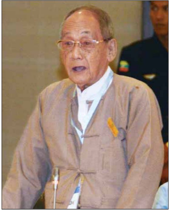
နိုင်ငံရေးပါတီများအစုအဖွဲ့မှ ဒုတိယဥက္ကဋ္ဌ ဦးသုဝေ

သွားမည်ဖြစ်ပါကြောင်း၊ ယခု အစည်းအဝေးသို့ တက်ရောက်လာကြသည့် ပုဂ္ဂိုလ်များအားလုံး ကလည်း ပိုင်းဝန်းကြိုးပမ်းပေးကြပါရန် မိမိ အနေဖြင့် မေတ္တာရပ်ခံပါကြောင်း။ မိမိတို့နိုင်ငံ၏ တိုးတက်မှုသည် ကမ္ဘာ၏ တိုးတက်မှု၊ အောင်မြင်မှုဟု ရှုမြင်နေကြသည့်