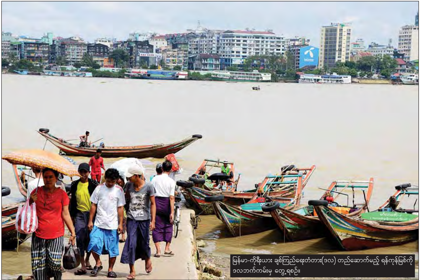
မြန်မာ-ကိုရီးယား ချစ်ကြည်ရေးတံတား(ဒလ) တည်ဆောက်မည့် ရန်ကုန်မြစ်ကို ဒလဘက်ကမ်းမှ တွေ့ရစဉ်။