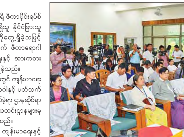
ကျန်းမာရေးနှင့် အားကစားဝန်ကြီးဌာနအမြဲတမ်းအတွင်းဝန် ဒေါက်တာ သက်ခိုင်ဝင်းက ဝန်ကြီးဌာနအနေဖြင့် ကူးစက်ရောဂါများကို ကာကွယ်ထိန်းချုပ်ရန် ၂၀၁၅ ခုနှစ်တွင် ပြဋ္ဌာန်းခဲ့သည့် အပြည်ပြည်ဆိုင်ရာကျန်းမာရေးပြဋ္ဌာန်းချက်များနှင့်အညီ အပြည်ပြည်ဆိုင်ရာ ဝင်/ထွက်ဂိတ်များနှင့် နယ်စပ်ဝင်/ထွက်ဂိတ်များ၌ သက်ဆိုင်ရာနီးနယ်ဝန်ကြီးဌာနများနှင့် အဖွဲ့အစည်းများ အစဉ်တစိုက် ပူးပေါင်းဆောင်ရွက်ခဲ့သည့်အတွက် အောင်မြင်မှုများစွာ ရရှိခဲ့ပါကြောင်း ပြောကြားသည်။

နေပြည်တော် အောက်တိုဘာ ၂၈ ရန်ကုန်မြို့၌ အသက် (၃၂) နှစ်အရွယ်ရှိ ဇီကာပိုင်းရပ်စ်ကူးစက်ခံရဖွယ်ရှိသည်ဟု သံသယရှိသူ နိုင်ငံခြားသူကိုယ်ဝန်ဆောင်အမျိုးသမီး တစ်ဦးကိုတွေ့ရှိခဲ့သဖြင့် ဓာတ်ခွဲစမ်းသပ်မှုများ ပြုလုပ်ခဲ့ပြီးနောက် ဇီကာရောဂါဖြစ်ပွားလျက်ရှိကြောင်းကို ကျန်းမာရေးနှင့် အားကစားဝန်ကြီးဌာနက ယမန်နေ့က အတည်ပြုခဲ့သည်။