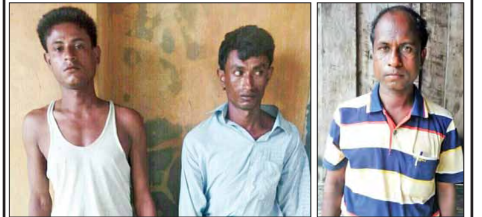
အကြမ်းဖက်စီးနင်းတိုက်ခိုက်မှုတွင် ပါဝင်သူ သုံးဦးအား ဖမ်းဆီးရမိစဉ်။ (မသစ/ရသစ)