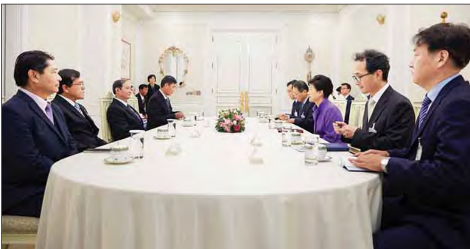
အဖွဲ့သည် ယနေ့နံနက် ၉ နာရီခွဲတွင် Samsung Innovation Museum လိုက်လံရှင်းလင်းပြသကြသည်။ ယင်းနောက် မွန်းလွဲ ၃ နာရီခွဲတွင် သို့ရောက်ရှိရာ တာဝန်ရှိသူများက လျက်ရှိသော Gang Nam Resource Recovery Facility သို့ သွားရောက် လေ့လာကြသည်။ (သတင်းစဉ်)

နေပြည်တော် အောက်တိုဘာ ၂၈ ကိုရီးယားသမ္မတနိုင်ငံတွင် ချစ်ကြည် ရေးခရီး ရောက်ရှိနေသော ပြည်သူ့ လွှတ်တော်ဥက္ကဋ္ဌ ဦးဝင်းမြင့်အား ကိုရီးယားသမ္မတနိုင်ငံ သမ္မတ H.E. Park Geun-hye က ယနေ့ ဒေသ စံတော်ချိန် မွန်းလွဲ ၂ နာရီတွင် ကိုရီးယားသမ္မတအိမ်တော် ဧည့်ခန်းမ ၌ လက်ခံတွေ့ဆုံသည်။