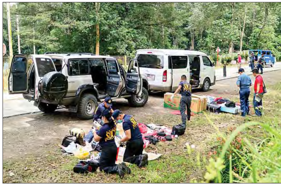
တိုက်ဖျက်ရေးရဲအရာရှိများက အပြန်အလှန် သေနတ် စတင်ထမ်းရွက်သည့်အချိန်မှစပြီး မူးယစ်ဆေးဝါးတိုက်ဖျက်ရေးလုပ်ငန်းစဉ်အရ မူးယစ်မှောင်ခိုကူးသူများအား ဇွန် ၃၀ ရက်က သမ္မတဒူတာတေး သမ္မတရာထူး စတင်ထမ်းရွက်သည့်အချိန်မှစပြီး မူးယစ်ဆေးဝါးတိုက်ဖျက်ရေးလုပ်ငန်းစဉ်အရ မူးယစ်မှောင်ခိုကူးသူများအား

မနိလာ အောက်တိုဘာ ၂၈ ဖိလစ်ပိုင်သမ္မတ ရီဒရို ဒူတာတေးက ၎င်း သမ္မတတာဝန် စတင်ထမ်းရွက်သည့်အချိန်မှစပြီး မူးယစ်ဆေးဝါးတိုက် ဖျက်ရေးလုပ်ငန်းစဉ်ကို အပြင်းအထန်ဆောင်ရွက်လျက် ရှိရာ မူးယစ်ဆေးဝါး တရားမဝင်မှောင်ခိုကူးသည်ဟု သင်္ကာမကင်းဖြစ်နေသော ဖိလစ်ပိုင်မြို့ငယ်လေးတစ်ခု၏ မြို့တော်ဝန် တစ်ဦးအား သမ္မတ ဒူတာတေးက ပြီးခဲ့သော နွေရာသီက အမည်ထုတ်ဖော်ပြောကြားခဲ့သည်။ သမ္မတ၏ သင်္ကာမကင်းဖြစ်နေသော ဒါတူဆော်ဒီ-အမ်ပီတူရန်မြို့ငယ်လေး၏ မြို့တော်ဝန် ဆမ်ဆူဒင် ဒီမာကွန်က 'အပြစ်မလုပ်ထားရင် စိုးရိမ်စရာမလိုပါဘူး' ဟု ဩဂုတ်လက သည်နယူးယောက်တိုင်းမ်သတင်းစာနှင့် ၎င်းအင်တာဗျူးခဲ့စဉ်က ပြောကြားခဲ့သည်။ အောက်တိုဘာ ၂၈ ရက် နံနက် ၄ နာရီဝန်းကျင် တွင် ဒါတူဆော်ဒီ-အမ်ပီတူရန်မြို့၏ အရှေ့ဘက်ပိုင် ၇၀ အကွာအဝေးရှိ မာကီလာလာမြို့အဝင်လမ်း တစ်လျှောက်တွင် မူးယစ်တိုက်ဖျက်ရေးအဖွဲ့က ရဲကင်း စစ်ဆေးရေးဂိတ်တစ်ခု၌ မြို့တော်ဝန်နှင့်အဖွဲ့ကို စောင့်ဆိုင်းနေစဉ် ၎င်းတို့က မော်တော်ယာဉ်များဖြင့် ရောက်ရှိလာခဲ့ကြောင်း ရဲချုပ်အီလိုင်ရစ်ကို လိုနီယာက ဆိုသည်။ မြို့တော်ဝန် ဒီမာကွန်၏ အဖွဲ့နှင့် မူးယစ်ဆေးဝါး