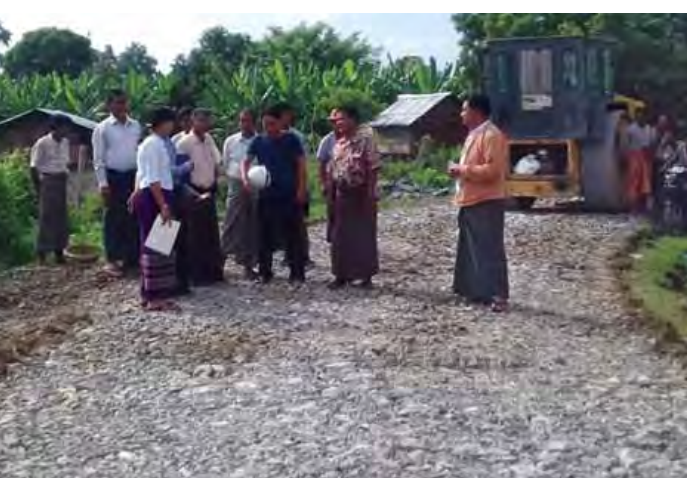
အရည်အသွေးများပြည့်ဝစွာ ဆောင်ရွက်ရန် ကွင်းဆင်းမှာကြား စစ်ဆေးဆောင်ရွက်ခဲ့ကြောင်း သိရသည်။ ရဲဝင်ထွန်း(မြစ်သား)

မြစ်သား အောက်တိုဘာ ၂၆ မန္တလေးတိုင်းဒေသကြီး ကုမ္ပဏီ-အုန်းကုန်းလမ်းပိုင်း ကျောက်ချောလမ်းခင်းခြင်း လုပ်ငန်းဆောင်ရွက်ပြီးစီးမှု အခြေအနေနှင့်ပတ်သက်၍ မြစ်သားမြို့နယ် ပြည်သူ့လွှတ်တော်ကိုယ်စားလှယ်နှင့် ကျေးလက်ဒေသဖွံ့ဖြိုးရေးဦးစီးဌာနတို့က အောက်တိုဘာ ၂၆ ရက်နံနက် ၁၀နာရီက ကွင်းဆင်းစစ်ဆေးခဲ့ကြောင်း သိရသည်။ အဆိုပါ လမ်းပိုင်းသည် ကုမ္ပဏီ-ကဆွန်-သိမ်ကုန်း-အုန်းကုန်းကျေးရွာအထိ တစ်မိုင်အရှည်ရှိပြီး မြစ်သားလမ်းကို ကျောက်ချောလမ်းအဖြစ် အဆင့်မြှင့်တင်ခြင်းဖြစ်သည်။ ယင်းသို့ အဆင့်မြှင့်တင်ရာတွင် ၂၀၁၆-၂၀၁၇ ဘဏ္ဍာနှစ်တွင် တင်ဒါအောင်မြင်သော 'ခေပြီပြည့်' ကုမ္ပဏီက ဆောင်ရွက်လျက်ရှိရာ လမ်း၏ သတ်မှတ်စံနှုန်းများ၊