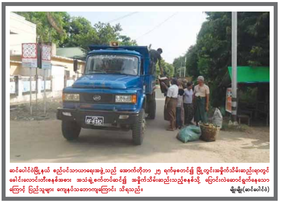
ဆင်ပေါင်ဝဲမြို့နယ် စည်ပင်သာယာရေးအဖွဲ့သည် အောက်တိုဘာ ၂၅ ရက်မှစတင်၍ မြို့တွင်းအမှိုက်သိမ်းဆည်းရာတွင် ခေါင်းလောင်းတီးစနစ်အစား အသံချဲ့စက်တပ်ဆင်၍ အမှိုက်သိမ်းဆည်းသည့်စနစ်သို့ ပြောင်းလဲဆောင်ရွက်နေသောကြောင့် ပြည်သူများ ကျေနပ်သဘောကျကြောင်း သိရသည်။ မျိုးမျိုး(ဆင်ပေါင်ဝဲ)

ဖြင့် ကျွဲမင်းမြို့တွင် အရှည် ၅၅၇ ပေ၊ အကျယ် ၇ ပေ၊ ထု ၆ လက်မရှိ မြစ်မာလာ ၅ လမ်းကို စုစုပေါင်းကုန်ကျငွေ ၆၂ သိန်းဖြင့်လည်းကောင်း၊ အရှည် ၆၀၅ ပေ၊ အကျယ် ၁၀ ပေ၊ ထု ၆ လက်မရှိ နဒီအောင်မြေရပ်ကွက် စက်ရုံလမ်းကို မြို့နယ်စည်ပင်သာယာရေးအဖွဲ့က သိန်း ၁၁၀ နှင့် ပြည်သူ့လူထုထည့်ဝင်ငွေ ၁၀၃ ဒသမ ၅ သိန်းဖြင့် ဆောင်ရွက်သွားမည်ဖြစ်ကြောင်း သိရသည်။ ဆက်လက်ပြီး အရှည် ၁၃၁၇ ပေ၊ အကျယ် ၁၀ ပေ၊ ထု ၆ လက်မရှိ ရွှေလောင်းကျေးရွာအုပ်စု မေတ္တာလမ်းကို မြို့နယ်စည်ပင်သာယာရေးအဖွဲ့က ၁၃၈ ဒသမ ၇ သိန်းနှင့် ပြည်သူ့လူထုထည့်ဝင်ငွေ ၆၉ ဒသမ ၃ သိန်းဖြင့်လည်းကောင်း၊ အရှည် ၆၀၀ ပေ၊ အကျယ် ၁၀ ပေ၊ ထု ၆ လက်မရှိ ကျွန်းကျေးရွာအုပ်စု အောက်ဥယျာဉ်လမ်းကို မြို့နယ်စည်ပင်သာယာရေးအဖွဲ့က ၁၀၅ ဒသမ ၄ သိန်းနှင့် ပြည်သူ့လူထုထည့်ဝင်ငွေ ၅၂ ဒသမ ၆ သိန်းဖြင့် ဆောင်ရွက်သွားမည်ဖြစ်ကြောင်း မြို့နယ်စည်ပင်သာယာရေးအဖွဲ့မှ သိရသည်။ လွမ်းသီဟ(ဝါးခယ်မ)