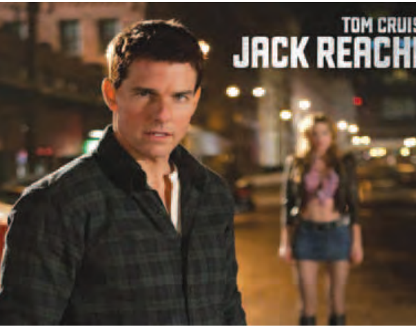
Jack Reacher: Never Go Back မှုခင်းအက်ရှင်ဇာတ်ကားမှ ဇာတ်ဝင်ခန်းတစ်ခန်း။