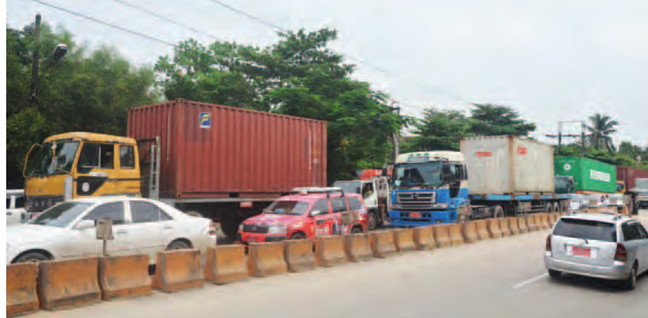
ရန်ကုန်မြို့တော် စည်ပင်သာယာနယ်နိမိတ်အတွင်း သွားလာနေသည့် ကုန်သေတ္တာတင်ယာဉ်(ကွန်တိန်နာ ယာဉ်)များကို အောက်တိုဘာ ၂၆ ရက် မွန်းလွဲပိုင်းက တွေ့ရစဉ်။

ရန်ကုန် အောက်တိုဘာ ၂၇ ရန်ကုန်မြို့တော် စည်ပင်သာယာနယ်နိမိတ်အတွင်း အများပြည်သူသယ်ယူပို့ဆောင်ရေး ပိုမိုကောင်းမွန်စေရန် အတွက် ကုန်သေတ္တာတင်ယာဉ်(ကွန်တိန်နာယာဉ်) များကို နိုဝင်ဘာ ၁ ရက်မှစတင်ကာ လမ်းကြောင်းနှင့် အချိန်ကို ကန့်သတ်၍ မောင်းနှင်ခွင့်ပြုသွားမည်ဖြစ်ကြောင်း တိုင်း ဒေသကြီးအစိုးရအဖွဲ့ထံမှ သိရသည်။