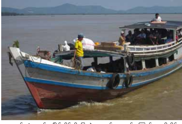
ချောင်းဆုံမှ မော်လမြိုင်ဆိပ်သို့ပြေးဆွဲနေသည့် ရေလမ်းကြောင်းကူးတို့ဆိပ်မှာ လေးခုရှိပြီး ကျွန်းသာယာဆိပ်၊ နတ်မောက်ဆိပ်၊ ကညော၊ ကော့မုပွန်ဆိပ်တို့မှ စက်တင်ရေယာဉ်များဖြင့် အဓိကထားသွားလာလျက်ရှိရာ လူပေါင်း ၈၀၀၀ ခန့် နေ့စဉ်သွားလာလျက်ရှိကြောင်း သိရသည်။