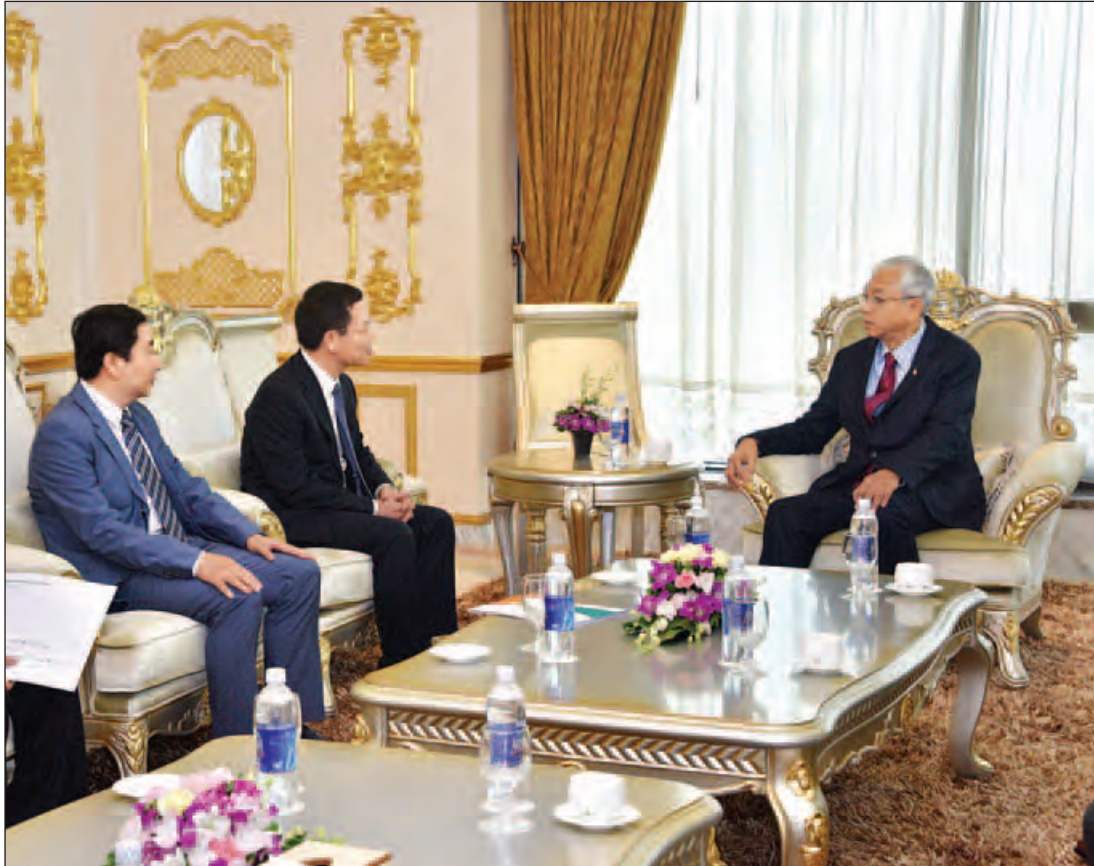
နိုင်ငံတော်သမ္မတ ဦးထင်ကျော် Viettel Telecom Corporation ၏ အမှုဆောင်အရာရှိချုပ် မစ္စတာ ငုယင်မင့်ဟန်အား ဟန္တိုင်းမြို့၊ ဂရင်းပလာဇာတိုက်တွင် လက်ခံတွေ့ဆုံစဉ်။