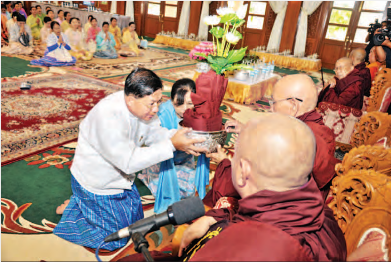
မဟာဝိဇိတာရုံဆရာတော်ကြီးထံ တပ်မတော်ကာကွယ်ရေးဦးစီးချုပ် ဗိုလ်ချုပ်မှူးကြီးမင်းအောင်လှိုင်နှင့် ဇနီး ဒေါ်ကြူကြူလှ တို့က ထိန်လျာသက်န်း ဆက်ကပ်လှူဒါန်းစဉ်။ (သတင်းစဉ်)

နေပြည်တော် အောက်တိုဘာ ၂၇ ကာကွယ်ရေးဦးစီးချုပ်ရုံး(ကြည်း၊ ရေ၊ လေ) မိသားစုများ၏ ဆဋ္ဌမအကြိမ် မဟာဘုံကထိန် အလှူတော်မင်္ဂလာ အခမ်းအနားကို ယနေ့နံနက် ၉ နာရီတွင် ကာကွယ်ရေးဦးစီးချုပ်ရုံး(ကြည်း) အနော်ရထာခန်းမ၌ ကျင်းပရာ တပ်မတော် ကာကွယ်ရေးဦးစီးချုပ် ဗိုလ်ချုပ်မှူးကြီးမင်းအောင်လှိုင်နှင့် ဇနီး ဒေါ်ကြူကြူလှတို့ တက်ရောက်၍ ကထိန်လျာသက်န်းနှင့် လှူဖွယ်ပစ္စည်းများ ဆက်ကပ်လှူဒါန်းကြသည်။