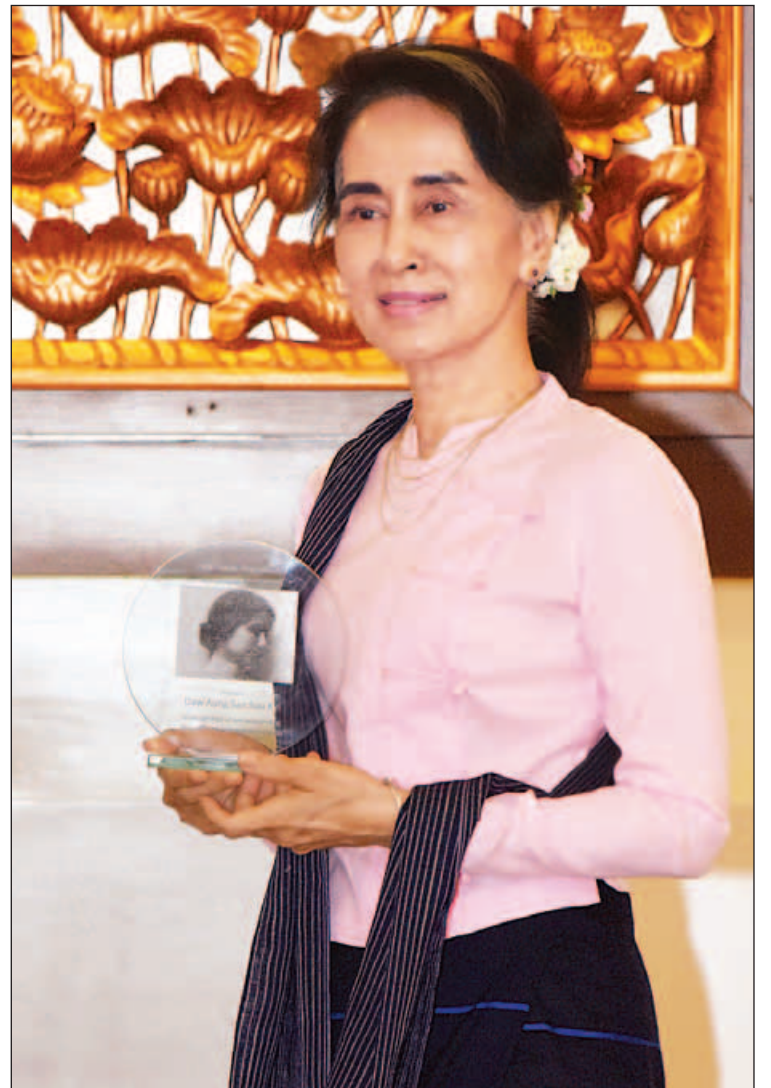
နိုင်ငံတော်၏အတိုင်ပင်ခံပုဂ္ဂိုလ်၊ နိုင်ငံခြားရေးဝန်ကြီးဌာန ပြည်ထောင်စုဝန်ကြီး ဒေါ်အောင်ဆန်းစုကြည်အား ဆုတံဆိပ်နှင့်အတူ တွေ့ရစဉ်။