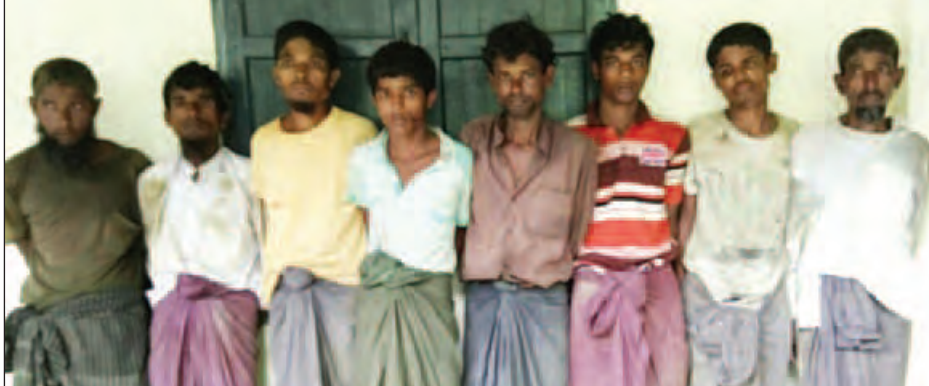
အကြမ်းဖက်စီးနင်းတိုက်ခိုက်မှုများတွင် ပါဝင်ခဲ့သူများအား ပမ်းဆီးရမိစဉ်။(မသစ/ရသစ)