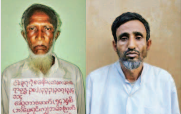
အကြမ်းဖက်စီးနင်းတိုက်ခိုက်မှုများတွင် ပါဝင်ခဲ့သူများအား ပမ်းဆီးရမိစဉ်။(မသစ/ရသစ)