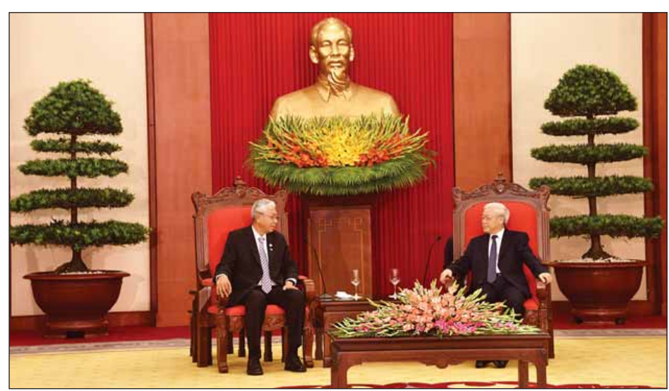
နိုင်ငံတော်သမ္မတ ဦးထင်ကျော်နှင့် ဝိယက်နမ်ကွန်မြူနစ်ပါတီ အထွေထွေအတွင်းရေးမှူး မစ္စတာ ငုယင်ဖုချောင့်တို့ တွေ့ဆုံစဉ်။ (သတင်းစဉ်)

နှစ်နိုင်ငံဆက်ဆံရေးပိုမိုတိုးမြှင့်ရေး၊ စီးပွားရေး နှင့် ရင်းနှီးမြှုပ်နှံမှုကဏ္ဍများ ပိုမိုပူးပေါင်း ဆောင်ရွက်ရေး၊ နှစ်နိုင်ငံတပ်မတော်များ အကြား ဆက်ဆံမှုတိုးမြှင့်ရေးနှင့် ဒေသတွင်းနှင့် နိုင်ငံတကာကိစ္စရပ်များကို ဆွေးနွေးကြပြီး နှစ်နိုင်ငံ ပူးတွဲကြေညာချက် တစ်ရပ်ကို ထုတ်ပြန်ခဲ့။