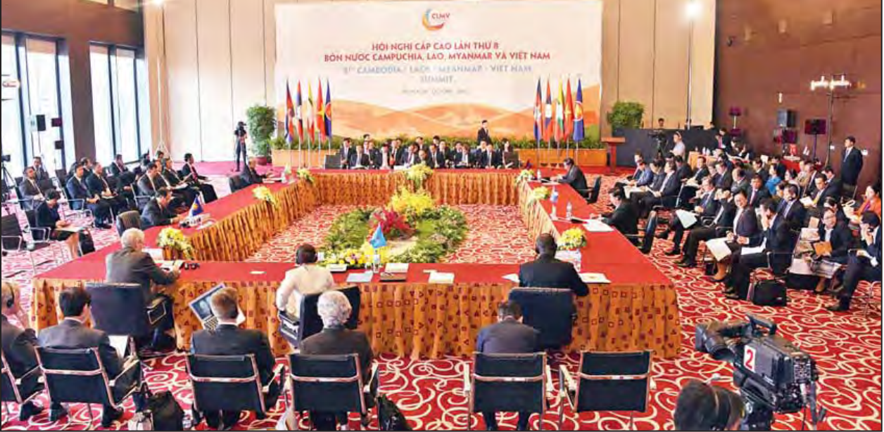
(၈)ကြိမ်မြောက် ကမ္ဘောဒီးယား၊ လာအို၊ မြန်မာ၊ ဗီယက်နမ် (စီအယ်လ်အမ်ပီ) ထိပ်သီးအစည်းအဝေးကျင်းပစဉ်။ (သတင်းစဉ်)

အစည်းအဝေးများအပြီးတွင် နိုင်ငံတော်သမ္မတ ဦးထင်ကျော်နှင့် ဇနီးတို့သည် ဗီယက်နမ် သူရဲကောင်းစစ်သည်ဗိမာန်သို့သွားရောက်ပြီး လွမ်းသူ့ ပန်းခွေချ အလေးပြုကြသည်။ (သတင်းစဉ်)