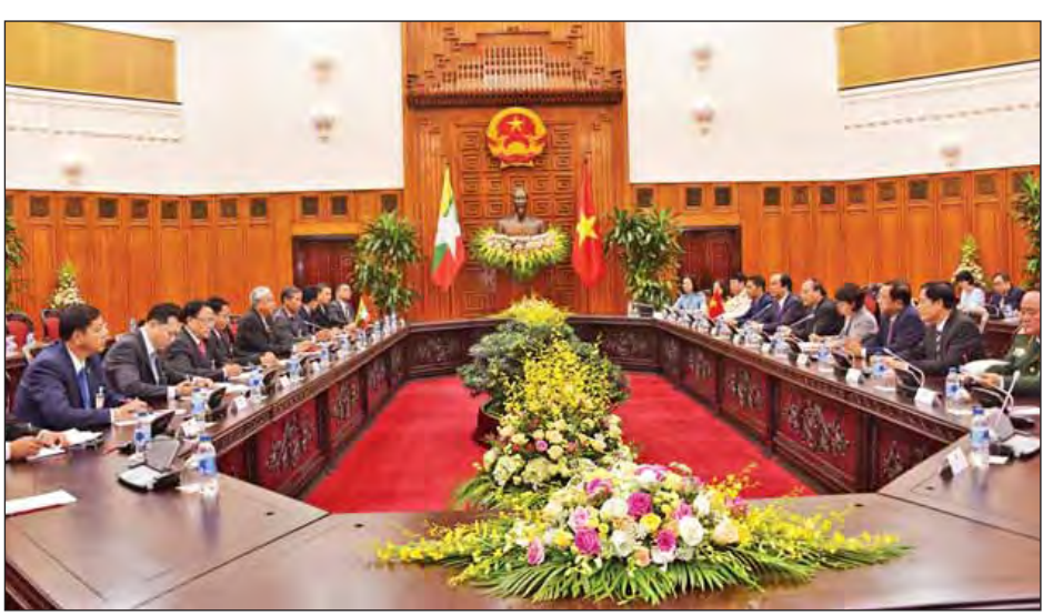
နိုင်ငံတော်သမ္မတ ဦးထင်ကျော်နှင့်အဖွဲ့တို့ ဝိယက်နမ်နိုင်ငံဝန်ကြီးချုပ် မစ္စတာ ငုယင်စွမ်းဖွတ် ဦးဆောင်သည့်အဖွဲ့နှင့် တွေ့ဆုံဆွေးနွေးစဉ်။ (သတင်းစဉ်)