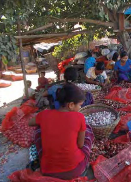
လိုက် စနစ်တကျ ပြုလုပ်ကြရသည်။ ရေဆေးပြီး ကြက်သွန်ဖြူများကို စက်ဖြင့်ထပ်ကြိတ်ကာ အခွံသင်ကြသည်။ အခွံလုံးဝမပါသော ကြက်သွန်ဖြူအမြောင်းကလေးများရရှိလာပါက ဆီဖြင့်ကြော်ခြင်းလုပ်ကာ သန့်စင်သော ကြက်သွန်ဖြူကြော်များကို ရရှိကြသည်။ ကြက်သွန်နီရိုက်ကွက်အတွင်းရှိ အိမ်ရှင်မများမှာ ကြက်သွန်ဖြူ၊ ကြက်သွန်နီ အခွံချွတ်လုပ်ငန်းကြောင့် အိုးမကွာအိမ်မကွာ အလုပ်အကိုင် အခွင့်အလမ်း ရရှိ

မန္တလေးမြို့ ကြက်သွန်နီရိုက်ကွက်တွင် ကြက်သွန်နီ၊ ကြက်သွန်ဖြူ အခွံချွတ်လုပ်ငန်းဖြင့် အိမ်ရှင်မများ အိုးမကွာ အိမ်မကွာ အလုပ်အကိုင်အခွင့်အလမ်းများ ရရှိကြသည်။ မိုးတွင်းကာလတွင် ကြက်သွန်ဖြူထက် ကြက်သွန်နီ အခွံချွတ်ခြင်း၊ အခွံသင်ခြင်းများကို ပြုလုပ်ကြရသည်။ ကြက်သွန်ဖြူရိုက်ကွက်တွင် ကြက်သွန်နီပွဲများမှ ကြက်သွန်ဖြူများကို ထုတ်ပေးပြီး အခွံချွတ်ခြင်းကို ပိဿာပြတ်ဖြင့် ပြုလုပ်ခြင်းကြသည်။ ကြက်သွန်များ ပွဲရုံမှလာပို့ဆိုပါက အုပ်စုလိုက် အခွံချွတ်လုပ်ငန်းကို လုပ်ကိုင်ကြသည်။ ကြက်သွန်နီအခွံချွတ်ခြင်းလုပ်ငန်းတွင် တစ်ပိဿာလျှင် ငွေကျပ် ၁၀၀ နှုန်းဖြင့် ပြုလုပ်ရပြီး တစ်နေ့လျှင် ကြက်သွန်နီပိဿာ လေးဆယ်ကျော်အထိ ပြီးစီးသည်။ လူတစ်ဦးလျှင် အနည်းဆုံးငွေကျပ် ၅၀၀၀ ကျော်အထိ ရရှိသည်။ ကြက်သွန်နီအခွံချွတ်၊ အခွံသင်ခြင်းလုပ်ငန်းမှာ အလုပ်ရှုပ်မှုနည်းပါးပြီး ဓားဖြင့်အခွံသင်ပေးကာ ပွဲရုံသို့ ပြန်လည်သွင်းကြရသည်။ ပွဲရုံမှ ရေဆေးခြင်း၊ သန့်စင်ခြင်းများပြုလုပ်ကာ စက်ဖြင့်ကြိတ်ကာ ကြက်သွန်ကြော်ကို ပြုလုပ်ကြသည်။ ကြက်သွန်ဖြူအခွံချွတ်လုပ်ငန်းမှာ အနည်းငယ်လက်ဝင်ပြီး ဈေးနှုန်းလည်းပိုရသည်။ ကြက်သွန်ဖြူအခွံချွတ်လုပ်ငန်းလုပ်ကိုင်ရာတွင် ပထမဦးစွာ ကြက်သွန်ဖြူ အမြောင်းကလေးများဖြစ်စေရန် ပြု လုပ်ပေးကြရသည်။ ဒုတိယအနေဖြင့် ကြက်သွန်ဖြူ အမြောင်းကလေးများ အပေါ်ယံအခွံဖြူများကို ချွတ်ကြပြီး ဧရာဝတီမြစ်အတွင်း ရေဆေးကြသည်။ ရေဆေးပြီးပါက အခြောက်လှန်းခြင်းမှအစ အဆင့်