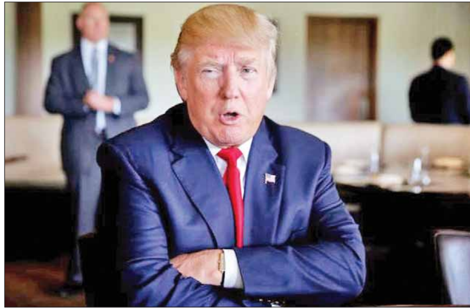
ဆီးရီးယားပြည်တွင်းစစ်နှင့်ပတ်သက်ပြီး ကလင်တန် သည် အမေရိကန်နိုင်ငံကို ကမ္ဘာ့စစ်ပွဲအတွင်းသို့ ဆွဲသွင်း သွားနိုင်ကြောင်း ထရန့်က ပြောကြားသည်။ ကလင်တန်က ဆီးရီးယားတွင် လေယာဉ်မပျံသန်းရန် သတ်မှတ်ပေးရန် တောင်းဆိုခဲ့ပြီး အဆိုပါ လေယာဉ်မပျံသန်းရန်သတ်မှတ် မှတ်တမ်းအရ အမေရိကန်အနေဖြင့် ရုရှားတိုက်လေယာဉ်များ နှင့် တိုက်ရိုက်ပဋိပက္ခဖြစ်ပွားနိုင်ကြောင်း လေ့လာသူအချို့ က သုံးသပ်ကြသည်။

နယူးယောက် အောက်တိုဘာ ၂၆ ရီပတ်ဘလီကန်သမ္မတလောင်း ဒေါ်နယ်ထရန့်က ဒီမိုကရက်တစ်သမ္မတလောင်း ဟီလာရီကလင်တန်၏ ဆီးရီးယားမူဝါဒမှာ နျူကလီးယားလက်နက်ပိုင်ဆိုင်သည့် ရုရှားနိုင်ငံနှင့် ပဋိပက္ခဖြစ်ပွားနိုင်ဖွယ်ရှိမှုကြောင့် တတိယ ကမ္ဘာစစ်သို့ဦးတည်နိုင်ကြောင်း အောက်တိုဘာ ၂၅ ရက် တွင် ပြောကြားသည်။