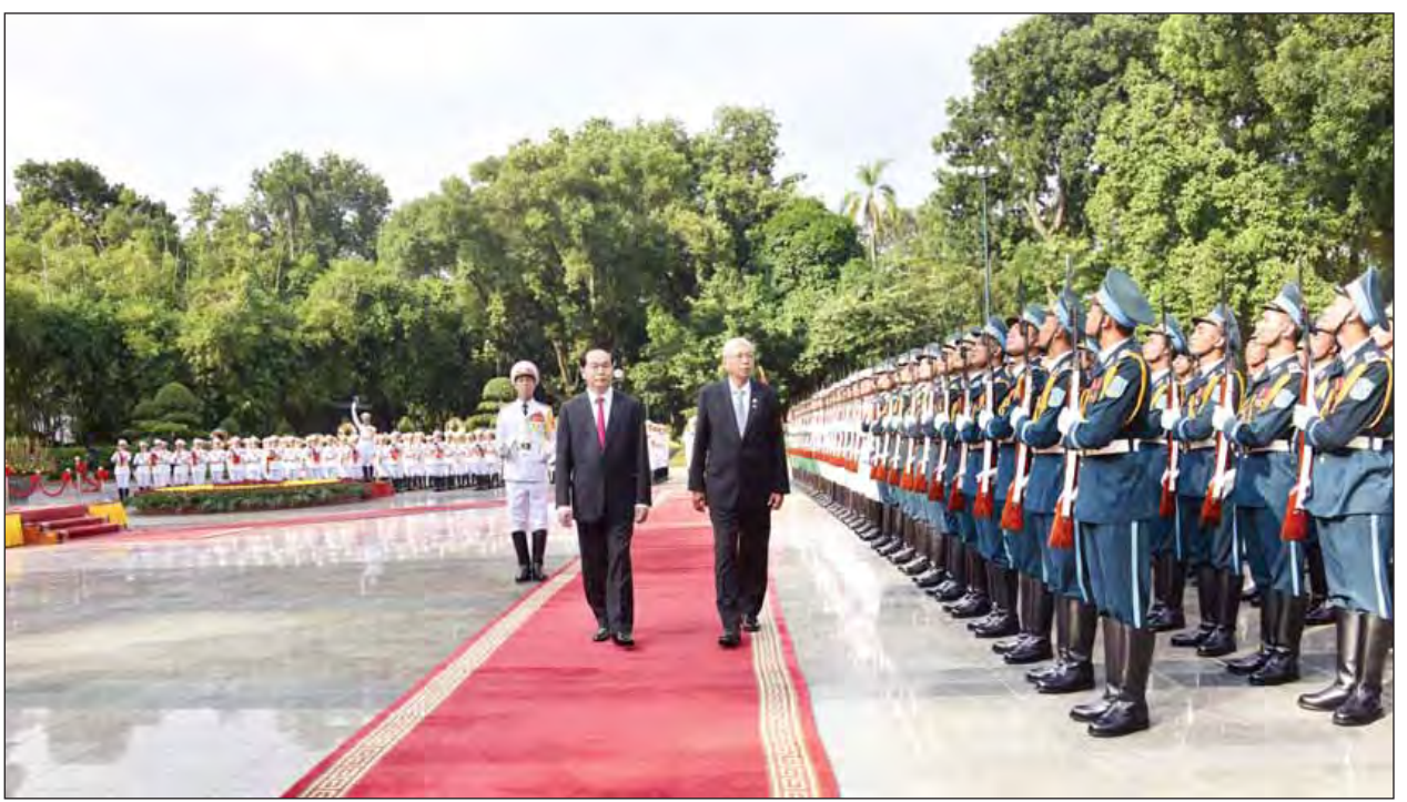
နိုင်ငံတော်သမ္မတ ဦးထင်ကျော် ဂုဏ်ပြုတပ်ဖွဲ့ကို စစ်ဆေးစဉ်။ (သတင်းစဉ်)

အဆိုပါကြေညာချက်တွင် နှစ်နိုင်ငံဆက်ဆံမှုတိုးမြှင့်ရေး၊ စီးပွားရေး ပူးပေါင်းဆောင်ရွက်ရေး၊ ရင်းနှီးမြှုပ်နှံမှုနှင့် ကုန်သွယ်မှုတိုးမြှင့်ရေး၊ စီအယ်လ်