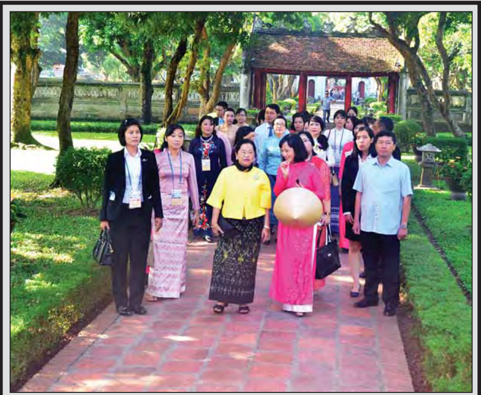
နိုင်ငံတော်သမ္မတ ဦးထင်ကျော်၏ ဇနီး ဒေါ်စုစုလွင် ဟနိုင်းမြို့ရှိ ရှေးဟောင်းတက္ကသိုလ်၌ ကြည့်ရှုလေ့လာ စဉ်။ [သတင်းစာမျက်နှာ - ၈] (သတင်းစဉ်)