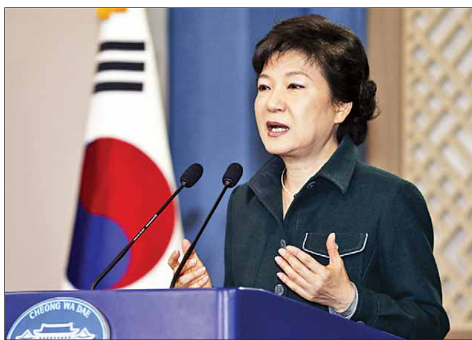
တောင်ကိုရီးယားသမ္မတ ပတ်ကွမ်ဟေးက မိန့်ခွန်းမူကြမ်းများကို ရှာဖွေတွေ့ရှိခဲ့ရကြောင်း တောင်ကိုရီးယား ဂျေဟီဘီစီ ရုပ်မြင်သံကြားဌာနက အောက်တိုဘာ ၂၄ ရက်တွင် သတင်းထုတ်ပြန်ကြေညာခဲ့ပြီးနောက် သမ္မတ ပတ်က ယင်းဖြစ်ရပ်နှင့်ပတ်သက်၍ ဝမ်းနည်းမိသည်ဟု ပြည်သူ များအား တောင်းပန်ခဲ့သည်။

ဆိုးလ် အောက်တိုဘာ ၂၆ မိတ်ဆွေတစ်ဦးအား မိန့်ခွန်းမူကြမ်းများကို ပြသကာ အကြံဉာဏ်ရယူခဲ့ခြင်းအတွက် တောင်ကိုရီးယားသမ္မတ ပတ်ကွမ်ဟေးက ပြည်သူလူထုကို ဝန်ချတောင်းပန်လိုက်ရ ကြောင်း ဒေသဆိုင်ရာ သတင်းဌာနများက အောက်တိုဘာ ၂၆ ရက်တွင် သတင်းထုတ်ပြန်သည်။