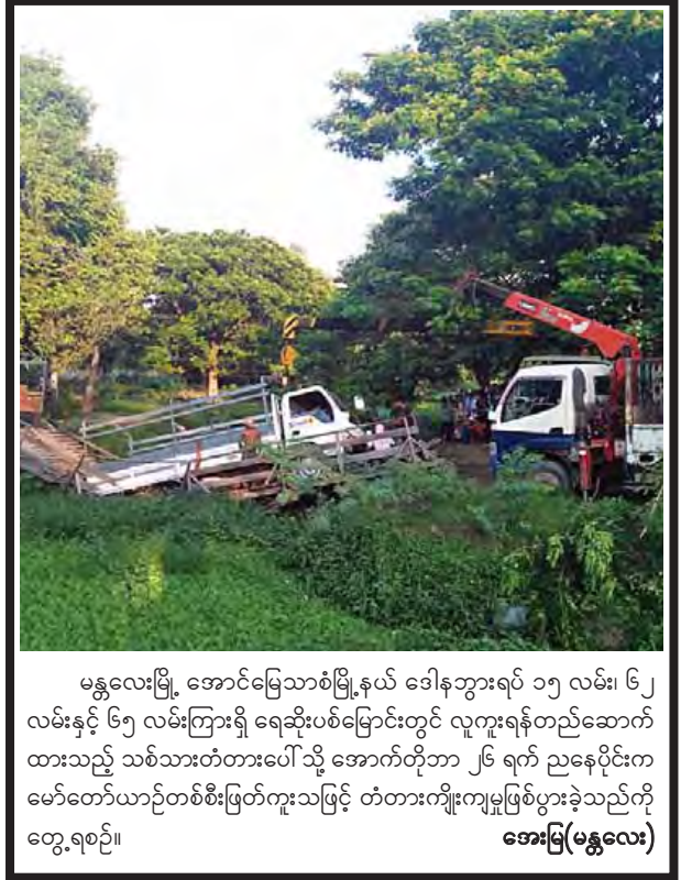
မန္တလေးမြို့၊ အောင်မြေသာစံမြို့နယ် ဒေါနဘွားရပ် ၁၅ လမ်း၊ ၆၂ လမ်းနှင့် ၆၅ လမ်းကြားရှိ ရေဆိုးပစ်မြောင်းတွင် လူကူးရန်တည်ဆောက် ထားသည့် သစ်သားတံတားပေါ်သို့ အောက်တိုဘာ ၂၆ ရက် ညနေပိုင်းက မော်တော်ယာဉ်တစ်စီးဖြတ်ကူးသဖြင့် တံတားကျိုးကျမှုဖြစ်ပွားခဲ့သည်ကို တွေ့ရစဉ်။ အေးမြ(မန္တလေး)

အမှန်တရားကို နားမလည်သဘောပေါက်ပါက အသိတရားသည်ပင်လျှင် မှားယွင်းချက်ဖြစ်သွားနိုင်လေသည်။ (ဒက်ဘားရီး) ဆိုသည့် ဆောင်ပုဒ်လေး ကို သတိချုပ်လိုက်မိသည်။ ယနေ့ကာလသည် ထွန်းသစ်စ ဒီမိုကရေစီ ရောင်ခြည်လင်းလက်လာစ ကာလဖြစ်လေရာ အမှန်တရားကို နားလည်သဘော ပေါက်မိအောင်ကြိုးပမ်းရင်း မှားယွင်းချက်များ မဖြစ်ပွားရလေအောင် ထိန်းကျောင်းခြင်းဖြင့် ဒီမိုကရေစီနိုင်ငံတော်ကြီး သာယာဝပြောထွန်းကား လာအောင် ဝိုင်းဝန်းကြိုးပမ်းသင့်ကြသော ကာလတစ်ခုပင်ဖြစ်ကြောင်း ရေးသားတင်ပြလိုက်ရပါသည်။ ။