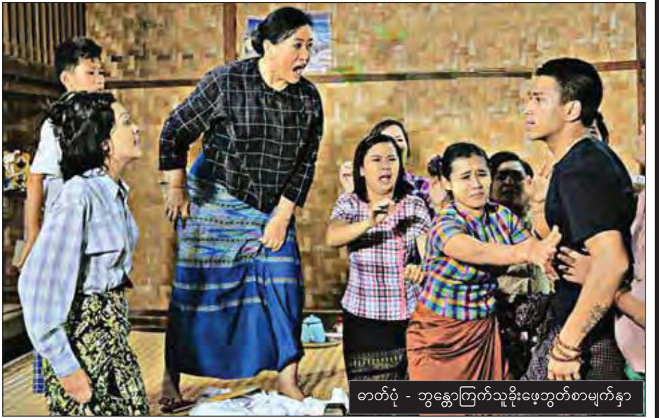
ဇာတ်ပုံ - ဘွဲ့ကြွေကြက်သူခိုးဖေဘွတ်စာမျက်နှာ

‘ဘွဲ့ကြွေကြက်သူခိုး’ မြန်မာဟာသဇာတ်ကားကို လာမည့်သောကြာနေ့တွင် ရန်ကုန်မြို့ရှိ သမ္မတ၊ သွင်၊ မင်္ဂလာ(သိမ်ကြီးဈေး) Mingalar Cineplex ဝမ်းပွင့် (လှည်းတန်း-စံရိပ်ငြိမ်)၊ မင်္ဂလာစံပြု Top Royal ပါရမီ စိန်ဂေဟာ၊ ပြည်၊ မင်္ဂလာထွန်းသီရိ၊ ပဲခူးမြို့ရှိ Mingalar Cineplex Icon Shopping Mall၊ တောင်ငူမြို့ရှိ New 3D Cinema နှင့် လားရှိုးမြို့ရှိ အောင်သီရိရုပ်ရှင်ရုံ၊ မန္တလေးမြို့တွင် ဝင်းလိုက်၊ မြို့မ၊ JCGV၊ ပုသိမ်မြို့တွင် ရွှေပြည်တော်၊ နေပြည်တော် JCGV၊ အောင်သပြေ၊ ဇေယျာသီရိ၊ ထားဝယ်မြို့တွင် အောင်မင်္ဂလာ၊ မြဝတီမြို့ တွင် သွန်းရွှေစင်၊ ဘားအံမြို့တွင် တက်နေဝင်း၊ မော်လမြိုင် မြို့တွင် JCGV၊ လားရှိုးမြို့တွင် သီတာအေး၊ သိန်းထိုက်၊ အောင်သီရိ၊ ပြင်ဦးလွင်မြို့တွင် ချယ်ရီလွင်၊ Movie Planet၊ တောင်ကြီးမြို့တွင် မြသုခ၊ ဗန်းမော်မြို့တွင် စတား၊ ရေနံချောင်းမြို့တွင် ရတနာ၊ ပခုက္ကူမြို့တွင် သီဟ၊