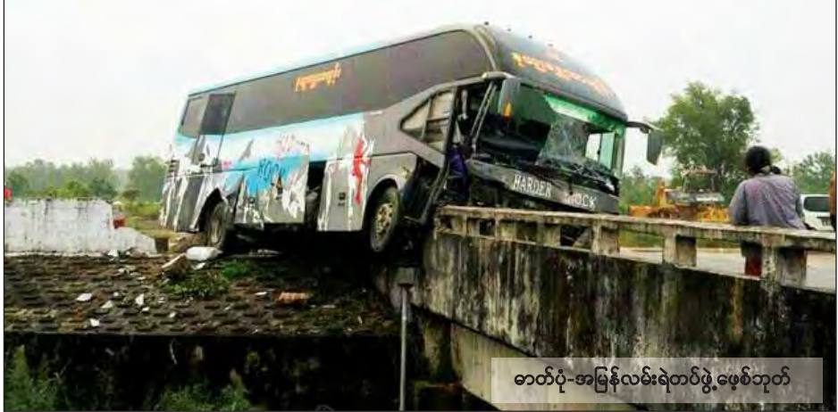
ဓာတ်ပုံ-အမြန်လမ်းရဲတပ်ဖွဲ့ဖမ်းစုတ်