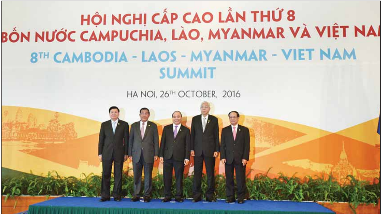
(၈)ကြိမ်မြောက် ကမ္ဘောဒီးယား၊ လာအို၊ မြန်မာ၊ ဗီယက်နမ် (စီအယ်လ်အမ်ပီ) ထိပ်သီးအစည်းအဝေးတွင် နိုင်ငံတော်သမ္မတ ဦးထင်ကျော်၊ ကမ္ဘောဒီးယား နိုင်ငံဝန်ကြီးချုပ်၊ လာအိုနိုင်ငံဝန်ကြီးချုပ်၊ ဗီယက်နမ်နိုင်ငံဝန်ကြီးချုပ်နှင့် အာဆီယံအထွေထွေအတွင်းရေးမှူးချုပ်တို့ မှတ်တမ်းတင်ဓာတ်ပုံရိုက်ကြစဉ်။ (သတင်းစဉ်)

ယင်းနောက် နိုင်ငံတော်သမ္မတ ဦးထင်ကျော်၊ ဗီယက်နမ်နိုင်ငံ ဝန်ကြီးချုပ် မစ္စတာ ငုယင်စွမ်းဖွတ်၊ ကမ္ဘောဒီးယားနိုင်ငံ ဝန်ကြီးချုပ် ဆမ်ဒက်ဟွန်ဆန်၊ လာအိုပြည်သူ့ ဒီမိုကရက်တစ်သမ္မတနိုင်ငံ ဝန်ကြီးချုပ် မစ္စတာထောင်လွန်း ဆီဆိုလစ်နှင့် ထိုင်းနိုင်ငံ ဒုတိယဝန်ကြီးချုပ် မစ္စတာ ဆွန်ကစ်ဂျာတူဆရီပီတက်၊ အာဆီယံအထွေထွေ အတွင်းရေးမှူးချုပ်နှင့် မိတ်ဖက်အဖွဲ့အစည်းများမှ တာဝန်ရှိသူများက မဲခေါင်ဒေသတွင်းပိုမိုဖွံ့ဖြိုး တိုးတက်မှုများရရှိစေရေး၊