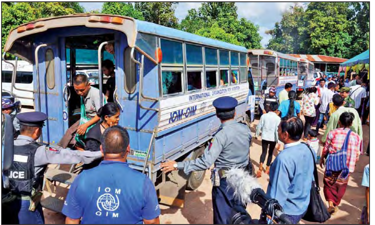
ထိုင်း-မြန်မာ နယ်စပ်ရှိ ဒုက္ခသည်စခန်းများမှ မြန်မာနိုင်ငံသားများအား ကြိုဆိုလက်ခံစဉ်။ (သတင်းစဉ်)