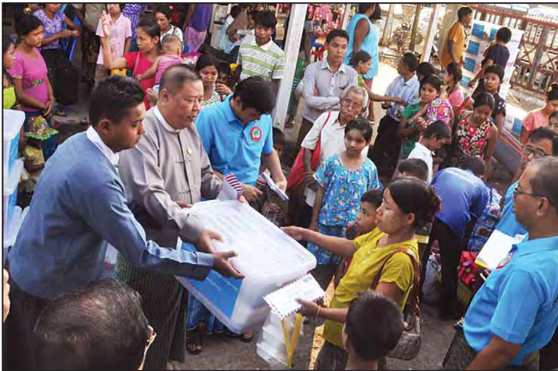
ကယ်ဆယ်ရေးစခန်းများမှ နေရပ်ပြန်သူများအား ထောက်ပံ့ရေးပစ္စည်းများ ပေးအပ်စဉ်။

သတင်း - မင်းသစ်(သတင်းစဉ်)