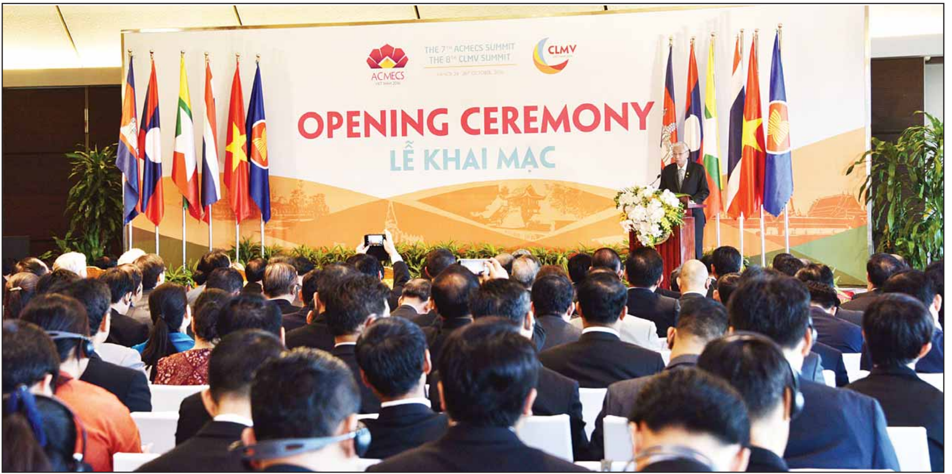
(၇)ကြိမ်မြောက် ဧရာဝတီ-ကျောက်ဖယား-မဲခေါင် စီးပွားရေးပူးပေါင်းဆောင်ရွက်မှု မဟာဗျူဟာ (ACMECS) ထိပ်သီးအစည်းအဝေး၌ နိုင်ငံတော်သမ္မတ ဦးထင်ကျော် မိန့်ခွန်းပြောကြားစဉ်။ (သတင်းစဉ်)

မစ္စတာ ငုယင်စွမ်းဖွတ်၊ ကမ္ဘောဒီးယားနိုင်ငံဝန်ကြီးချုပ် ဆမ်ဒက်ဟွန်ဆန်နှင့် လာအိုပြည်သူ့ဒီမိုကရက်တစ်သမ္မတနိုင်ငံ ဝန်ကြီးချုပ် မစ္စတာ ထောင်လွန်းဆီဆိုလစ်တို့က မိန့်ခွန်းပြောကြားကြသည်။ ယင်းနောက် နိုင်ငံတော်သမ္မတက မိန့်ခွန်းပြောကြားရာတွင် မြန်မာ၊ ထိုင်း၊ ကမ္ဘောဒီးယား၊ ဗီယက်နမ်၊ လာအိုနိုင်ငံတို့၏ စီးပွားရေးဖွံ့ဖြိုးတိုးတက်မှု ရည်မှန်းချက်များအား စာမျက်နှာ ၉ ကော်လံ ၁ သို့