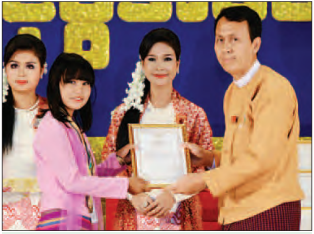
ရန်ကုန်တိုင်းဒေသကြီးဝန်ကြီးချုပ် ဦးဖြိုးမင်းသိန်း ဂုဏ်ပြုဆုနှင့် ဂုဏ်ပြု မှတ်တမ်းလွှာ ပေးအပ်ချီးမြှင့်စဉ်။