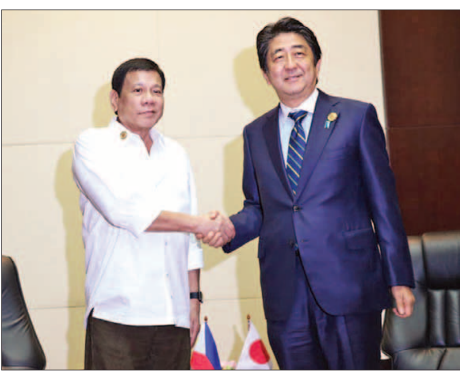
ဂျပန်နိုင်ငံသို့ ရောက်ရှိလာသော သမ္မတ ဒူတာတေးအား ဂျပန်ဝန်ကြီးချုပ် ရှင်ဒိုအာဘေးက လက်ခံတွေ့ဆုံစဉ်။

မနီလာ အောက်တိုဘာ ၂၅ မိမိ၏နိုင်ငံနှင့်ရရှိခဲ့သော စစ်ရေးဆိုင်ရာ သဘောတူညီချက်တစ်ရပ်ကို အမေရိကန်ပြည်ထောင်စုအနေဖြင့် မေ့ပျောက်ထားသင့်ကြောင်း ဖိလစ်ပိုင် သမ္မတ ရိုဒရီဂို ဒူတာတေးက အောက်တိုဘာ ၂၅ ရက်တွင် ပြောကြားလိုက်သည်။ မိမိသည် သမ္မတရာထူးတွင် အချိန်ကာလပိုမိုရှည်ကြာစွာ တာဝန်ထမ်းဆောင်နိုင်မည်ဆိုပါက အမေရိကန်ပြည်ထောင်စုနှင့် ကာကွယ်ရေးဆိုင်ရာ ပူးပေါင်းဆောင်ရွက်မှုဖြင့် တင်ရေး သဘောတူညီချက်ကို လက်မှတ်ထိုးမည်မဟုတ်ကြောင်း ဂျပန်နိုင်ငံသို့ မထွက်ခွာမီ မြို့တော် မနီလာရှိ နီနိုင်းအင်တိုက် နိုင်ငံတကာလေဆိပ်တွင် သတင်းထောက်များအား ပြောကြားသည်။ မိမိနိုင်ငံအတွင်း မည်သည့်နိုင်ငံခြားတပ်ဖွဲ့ကိုမျှ တွေ့မြင်လိုခြင်း မရှိကြောင်း ဒူတာတေးက ပြောကြားသည်။