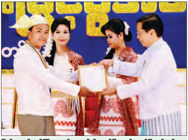
ပြည်ထောင်စုဝန်ကြီး သူရဦးအောင်ကို ဂုဏ်ပြုဆုနှင့် ဂုဏ်ပြုမှတ်တမ်းလွှာ ပေးအပ်ချီးမြှင့်စဉ်။