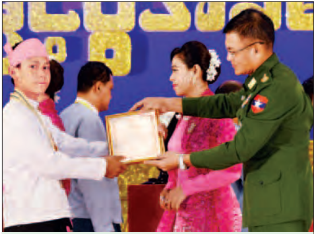
စစ်ရာထူးခန့်ချုပ် ဒုတိယဗိုလ်ချုပ်ကြီးလူအေး ဂုဏ်ပြုဆုနှင့် ဂုဏ်ပြုမှတ်တမ်းလွှာ ပေးအပ်ချီးမြှင့်စဉ်။