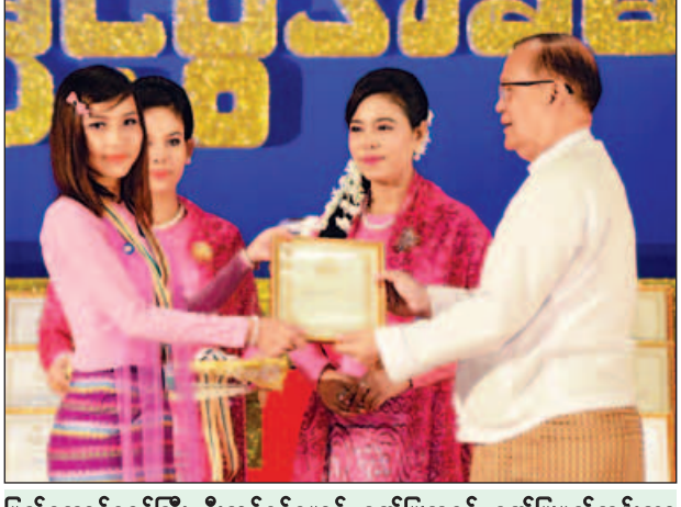
ပြည်ထောင်စုဝန်ကြီး ဦးသန်းစင်မောင် ဂုဏ်ပြုဆုနှင့် ဂုဏ်ပြုမှတ်တမ်းလွှာ ပေးအပ်ချီးမြှင့်စဉ်။