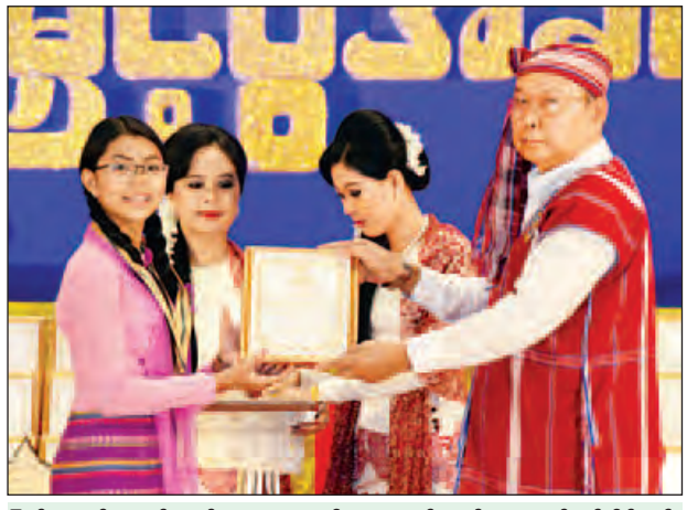
ပြည်ထောင်စုလွှတ်တော်နာယက၊ အမျိုးသားလွှတ်တော်ဥက္ကဋ္ဌ မန်းဝင်းခိုင်သန်း ဂုဏ်ပြုဆုနှင့် ဂုဏ်ပြုမှတ်တမ်းလွှာ ပေးအပ်ချီးမြှင့်စဉ်။