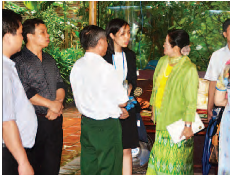
နိုင်ငံတော်သမ္မတ ဦးထင်ကျော်နှင့် ဇနီး ဒေါ်စုစုလွင်တို့ ဗီယက်နမ်နိုင်ငံ ဟန့်ရှင်းမြို့ ပိုးထည်ရွာရှိ ပိုးထည်ရက်လုပ်နေမှုနှင့် ပိုးထည်များကို ကြည့်ရှုလေ့လာကြစဉ်။ (သတင်းစဉ်)