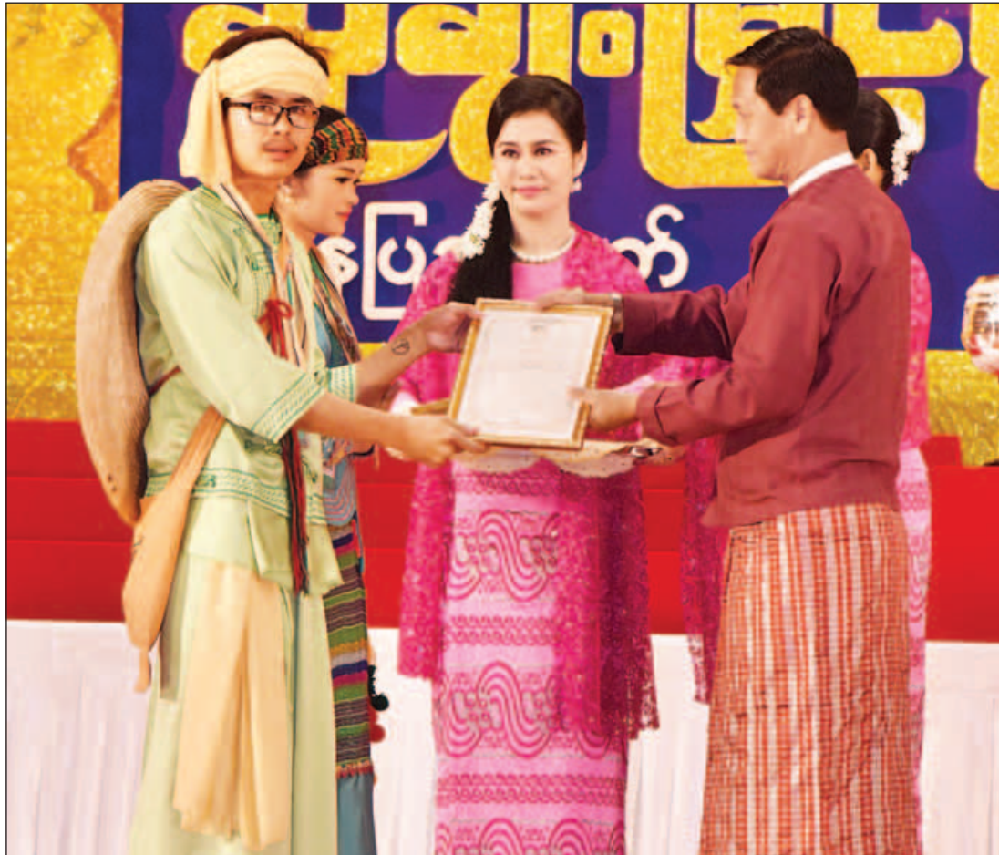
ပြိုင်ပွဲကျင်းပရေးဦးစီးကော်မတီနာယက ဒုတိယသမ္မတ ဦးဟင်နရီဗန်ထီးယူ တိုင်းရင်းသားရိုးရာယဉ်ကျေးမှုအဖွဲ့ကို ဂုဏ်ပြုဆု ပေးအပ်စဉ်။ (သတင်းစဉ်)

မြန်မာတိုင်းရင်းသားတို့၏ ရိုးရာယဉ်ကျေးမှု အဆို၊ အက၊ အရေး၊ အတီးပြိုင်ပွဲများကို စဉ်ဆက်မပြတ် ကျင်းပ နေခြင်းသည် တိုင်းရင်းသားများ၏ ရိုးရာယဉ်ကျေးမှု အနု သုခုမများကို ထိန်းသိမ်းခြင်းအပြင် တိမ်မြုပ်ပျောက်ကွယ် မသွားသင့်သော အမွေအနှစ်များ စဉ်ဆက်မပြတ် ထွန်းကားပြန့်ပွားစေလိုသည့် ရည်ရွယ်ချက်များပါရှိ သကဲ့သို့ ယခုပြိုင်ပွဲကြီးသည် လူမျိုးတစ်မျိုး၊ တိုင်းဒေသကြီး နှင့် စာမျက်နှာ ၈ ကော်လံ ၁ သို့