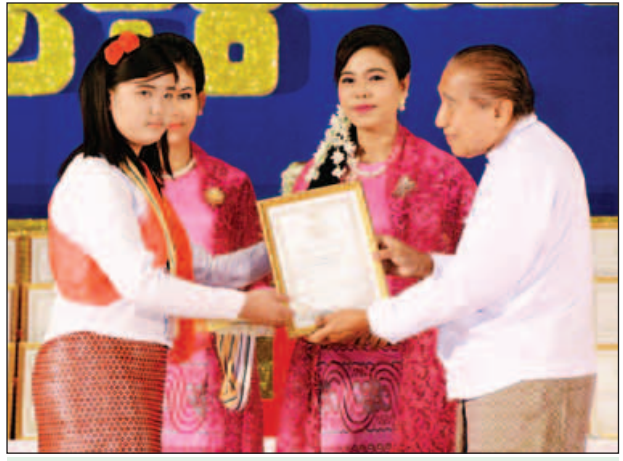
ပြည်ထောင်စုစာရင်းစစ်ချုပ် ဦးမော်သန်း ဂုဏ်ပြုဆုနှင့် ဂုဏ်ပြုမှတ်တမ်းလွှာ ပေးအပ်ချီးမြှင့်စဉ်။