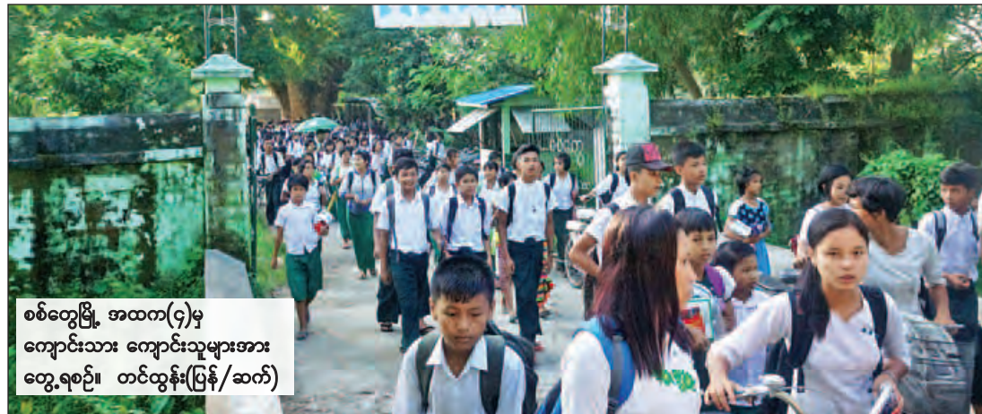
စစ်တွေမြို့ အထက(၄)မှ ကျောင်းသား ကျောင်းသူများအား တွေ့ရစဉ်။ တင်ထွန်း(ပြန်/ဆက်)

နေပြည်တော် အောက်တိုဘာ ၂၅ ယနေ့ည ၇ နာရီခွဲအချိန် တိုင်းထွာချက်များအရ ဘင်္ဂလား ပင်လယ်အော်အရှေ့အလယ်ပိုင်း တွင် ဖြစ်ပေါ်နေသော ဆိုင်ကလုန်း မုန်တိုင်း “ကြွ” (KYANT)သည် အနောက်-အနောက်တောင်ဘက် သို့ ရွှေ့လျားခဲ့ပြီး မြန်မာနိုင်ငံ ပုသိမ်မြို့၏ အနောက်ဘက် မိုင် ၂၃၅ ခန့်၊ ဝှုမြို့၏ အနောက်- အနောက်တောင်ဘက် မိုင် ၂၃၀ ခန့်၊ ကျောက်ဖြူမြို့၏ အနောက် တောင်ဘက် ၂၃၀ မိုင်ခန့်၊ အိန္ဒိယ နိုင်ငံ ဝိဇာကာပတ္တနမ်မြို့၏ အရှေ့ - အရှေ့တောင်ဘက် မိုင် ၄၂၅ ခန့်အကွာ ပင်လယ်ပြင်ကို ဗဟိုပြုနေသည်။ အဆိုပါ ဆိုင် ကလုန်းမုန်တိုင်း “ကြွ” (KYANT) သည် အနောက်-အနောက်တောင် ဘက်သို့ ဆက်လက်ရွှေ့လျားမည် ဟု ခန့်မှန်းရပြီး မြန်မာ့ကမ်းရိုးတန်း သို့ ဦးတည်ရွှေ့လျားခြင်းမရှိသဖြင့် ဆိုင်ကလုန်းမုန်တိုင်း၏ လက်ရှိ အခြေအနေကို အဝါရောင်အဆင့် ဟု သတ်မှတ်သည်။ စာမျက်နှာ ၅ ကော်လံ ၁ သို့ *