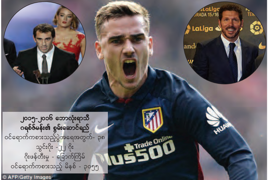
၂၀၁၅-၂၀၁၆ ဘောလုံးရာသီ ဂရစ်စ်မန်း၏ စွမ်းဆောင်ရည် ဝင်ရောက်ကစားသည့်ပွဲအရေအတွက် - ၃၈ သွင်းဂိုး - ၂၂ ဂိုး ဂိုးဖန်တီးမှု - ခြောက်ကြိမ် ဝင်ရောက်ကစားသည့် မိနစ် - ၃၀၅၅

အက်သလက်တီကိုနှင့် ပြင်သစ် အသင်းတိုက်စစ်မှူး ဂရစ်စ်မန်းသည် နာမည်ကျော် ကစားသမားများဖြစ် သည့် မက်ဆီနှင့် စီရိုနယ်လ်ဒိုတို့ကို နောက်ကောက်ချ်ပြီးသည့်ဘောလုံး ရာသီ၏ လာလီဂါအကောင်းဆုံး ကစားသမားအဖြစ် ရွေးချယ်ခဲ့ရ ကြောင်း သိရသည်။ အသက်(၂၅) နှစ်အရွယ် ဂရစ်စ်မန်း ၂၀၁၅-၂၀၁၆ ဘောလုံးရာသီ၏ လာလီဂါအကောင်း ဆုံး ကစားသမားအဖြစ်ရွေးချယ်ခဲ့ရ ကြောင်းကို အောက်တိုဘာ၂၄ ရက်