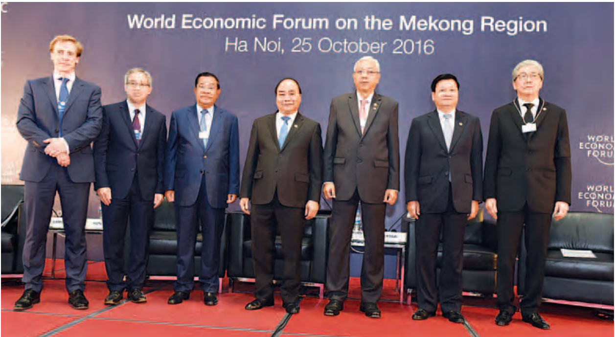
နိုင်ငံတော်သမ္မတ ဦးထင်ကျော် ဗီယက်နမ်နိုင်ငံ ဟန့်ရှင်းမြို့၌ ကျင်းပသည့် ကမ္ဘာ့စီးပွားရေးဖိုရမ်(မဲခေါင်ဒေသ)သို့ တက်ရောက်လာသည့် နိုင်ငံအကြီးအကဲများနှင့် မှတ်တမ်းတင်ဓာတ်ပုံရိုက်စဉ်။ (သတင်းစဉ်)

ညပိုင်းတွင် နိုင်ငံတော်သမ္မတနှင့် ဇနီးတို့သည် (၈)ကြိမ်မြောက် စီအယ်လ်အမ်ပီ ထိပ်သီးအစည်းအဝေးနှင့် (၇)ကြိမ်မြောက် အက်မက်စ်ထိပ်သီးအစည်းအဝေးသို့ တက်ရောက်လာကြသည့် အဖွဲ့ဝင်နိုင်ငံများမှ နိုင်ငံအကြီးအကဲနှင့် အစိုးရအဖွဲ့ အကြီးအကဲများအား ဗီယက်နမ်နိုင်ငံ ဝန်ကြီးချုပ်က တည်ခင်းဧည့်ခံသည့် ဂုဏ်ပြုညစာစားပွဲသို့ တက်ရောက်သည်။ (သတင်းစဉ်)