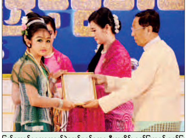
ပြည်ထောင်စုရွေးကောက်ပွဲကော်မရှင်ဥက္ကဋ္ဌ ဦးလှသိန်း ဂုဏ်ပြုဆုနှင့် ဂုဏ်ပြု မှတ်တမ်းလွှာ ပေးအပ်ချီးမြှင့်စဉ်။