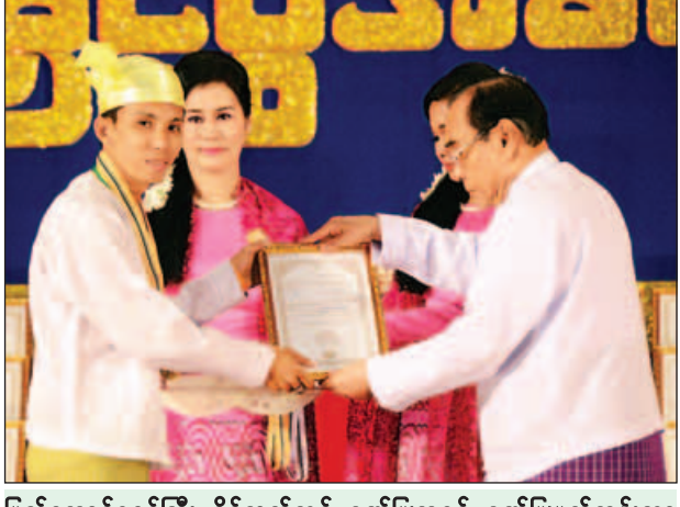
ပြည်ထောင်စုဝန်ကြီး နိုင်သက်လွင် ဂုဏ်ပြုဆုနှင့် ဂုဏ်ပြုမှတ်တမ်းလွှာ ပေးအပ်ချီးမြှင့်စဉ်။