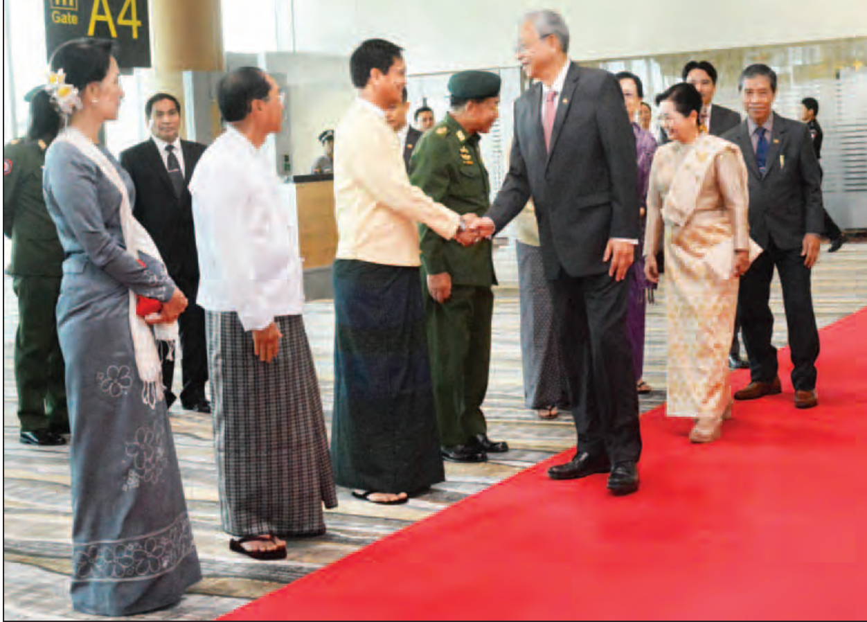
နိုင်ငံတော်သမ္မတဦးထင်ကျော်နှင့်ဇနီး ဒေါ်စုစုလွင်တို့ကို နေပြည်တော်အပြည်ပြည်ဆိုင်ရာလေဆိပ်၌ တာဝန်ရှိသူများက ပို့ဆောင်နှုတ်ဆက်ကြစဉ်။ (သတင်းစဉ်)

နေပြည်တော် အောက်တိုဘာ ၂၅ ပြည်ထောင်စုသမ္မတမြန်မာနိုင်ငံတော် နိုင်ငံတော်သမ္မတဦးထင်ကျော်နှင့် ဇနီးဒေါ်စုစုလွင်တို့သည် အဖွဲ့ဝင်များနှင့်အတူ ဗီယက်နမ်ဆိုရှယ်လစ်သမ္မတနိုင်ငံသို့ ချစ်ကြည်ရေးခရီးသွားရောက်ရန်နှင့် (၈)ကြိမ်မြောက် CLMV၊ (၇)ကြိမ်မြောက် ACMECS ထိပ်သီးအစည်းအဝေးများနှင့် ကမ္ဘာ့စီးပွားရေးဖိုရမ်-မဲခေါင်ညီလာခံသို့ တက်ရောက်ရန် ယနေ့နံနက်ပိုင်းတွင် လေကြောင်းခရီးဖြင့် နေပြည်တော်မှ ထွက်ခွာသည်။ နိုင်ငံတော်သမ္မတနှင့်အဖွဲ့အား နိုင်ငံတော်၏အတိုင်ပင်ခံပုဂ္ဂိုလ် ဒေါ်အောင်ဆန်းစုကြည်၊ ဒုတိယသမ္မတဦးမြင့်ဆွေနှင့် ဦးဟင်နရီဗန်ထီးယူ တပ်မတော်ကာကွယ်ရေးဦးစီးချုပ် ဗိုလ်ချုပ်မှူးကြီးမင်းအောင်လှိုင်၊ နေပြည်တော်ကောင်စီဥက္ကဋ္ဌ ဒေါက်တာမျိုးအောင်၊ နေပြည်တော်တိုင်းစစ်ဌာနချုပ် တိုင်းမှူး ဗိုလ်ချုပ်မှူးကြီးထွန်း၊ ဒုတိယဝန်ကြီး ဦးမောင်မောင်ဝင်း၊ မြန်မာနိုင်ငံဆိုင်ရာ ဗီယက်နမ်ဆိုရှယ်လစ်သမ္မတနိုင်ငံသံရုံး သံရုံးယာယီတာဝန်ခံ Mr. NGUYEN THANH VINH နှင့် တာဝန်ရှိသူများက နေပြည်တော်အပြည်ပြည်ဆိုင်ရာ လေဆိပ်၌ပို့ဆောင်နှုတ်ဆက်ကြသည်။ နိုင်ငံတော်သမ္မတ၏ခရီးစဉ်တွင်အဖွဲ့ဝင်များအဖြစ် ပြည်ထောင်စုဝန်ကြီး ဒေါက်တာအောင်သူ၊ ဦးကျော်ဝင်း၊ ဒုတိယဝန်ကြီးဦးကျော်တင်နှင့် တာဝန်ရှိသူများလိုက်ပါသွားကြသည်။ နိုင်ငံတော်သမ္မတနှင့်အဖွဲ့သည် ဗီယက်နမ်နိုင်ငံ ဟန့်ရှင်းမြို့သို့ ဒေသစံတော်ချိန် နံနက် ၁၀ နာရီ ၅၅ မိနစ်တွင်ရောက်ရှိကြရာ လေဆိပ်၌ ဗီယက်နမ်နိုင်ငံ Minister of Education and Training, H.E. Mr. Phung Xuan Nhai ဗီယက်နမ်နိုင်ငံဆိုင်ရာမြန်မာသံရုံးမှ သံရုံးယာယီတာဝန်ခံနှင့် တာဝန်ရှိသူများက ကြိုဆိုကြသည်။ ထို့နောက် နိုင်ငံတော်သမ္မတနှင့်ဇနီးတို့သည် ခေတ္တတည်းခိုမည့် ဟန့်ရှင်းဂရင်းပလာဇာတိုက်သို့ ရောက်ရှိကြသည်။ (သတင်းစဉ်)