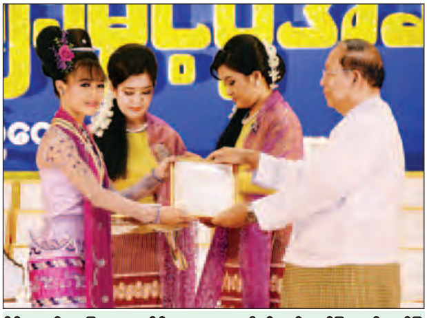
နိုင်ငံတော်အခြေခံဥပဒေဆိုင်ရာ ခုံရုံးဥက္ကဋ္ဌ ဦးမျိုးညွန့် ဂုဏ်ပြုဆုနှင့် ဂုဏ်ပြု မှတ်တမ်းလွှာ ပေးအပ်ချီးမြှင့်စဉ်။