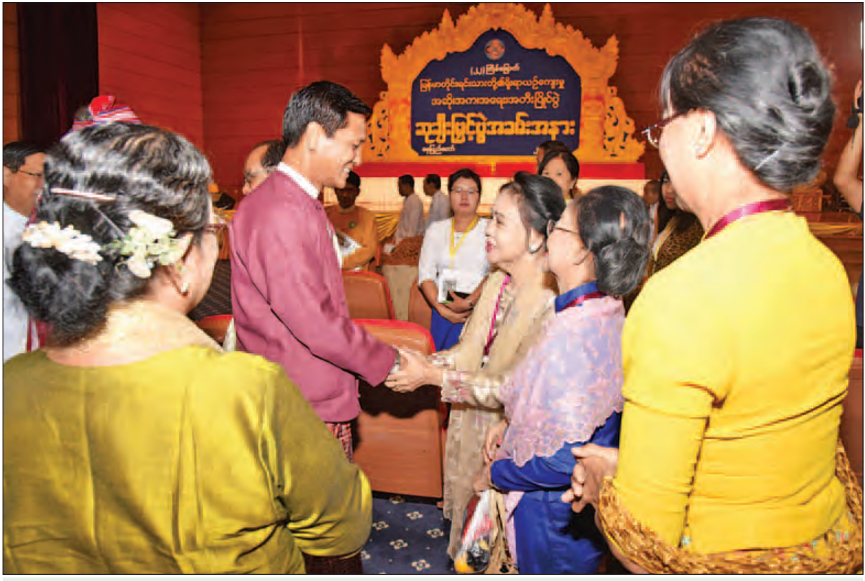
ဒုတိယသမ္မတ ဦးဟင်နရီဗန်ထီးယူ အဆို၊ အက၊ အရေး၊ အတီးပြိုင်ပွဲ ဆုချီးမြှင့်ပွဲအခမ်းအနားသို့ တက်ရောက်လာသူများအား ရင်းရင်းနှီးနှီးနှုတ်ဆက်စဉ်။

တေးသီချင်း အဆိုပြိုင်ပွဲတွင်ပါဝင်သည့် သီချင်းအမျိုးအစားများထဲမှ အမျိုးဂုဏ်၊ ဇာတိဂုဏ်မြှင့်တင်ရေး တေးသီချင်းများသည် မျိုးဆက်သစ်လူငယ် များနှင့် လွန်စွာနီးစပ်ပါကြောင်း၊ လူအများ နားလည်နိုင်သော နေ့စဉ်သုံး စကားလုံးများကို ရိုးရှင်းသည့် သံစဉ်များနှင့် သီကုံးဖွဲ့ဆိုထားခြင်း ဖြစ်ပါ ကြောင်း၊ အဆင့်မြင့်ပညာအဆင့်ပြိုင်ပွဲတွင် ပါဝင်သည့် တေးရေး ရေနံသာ ဝင်းမောင်၏ မြန်မာပြည်သား အမျိုးသားတေးသီချင်းကို ထုတ်နုတ်တင်ပြ လိုပါကြောင်း၊ သီဆိုသူ၊ ကြားရသူများအတွက် အားမာန်တက်ကြွဖွယ်ဖြစ်စေပြီး သီချင်း၏ ဦးတည်ချက်နှင့် သုံးစွဲထားသော စာမျက်နှာ ၉ သို့ ❁