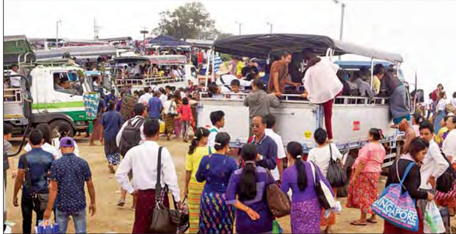
ကျိုက်ထီးရိုးစေတီတော်သို့ လာရောက်ဖူးမြော်ကြသော ဘုရားဖူးပြည်သူများကို တွေ့ရစဉ်။