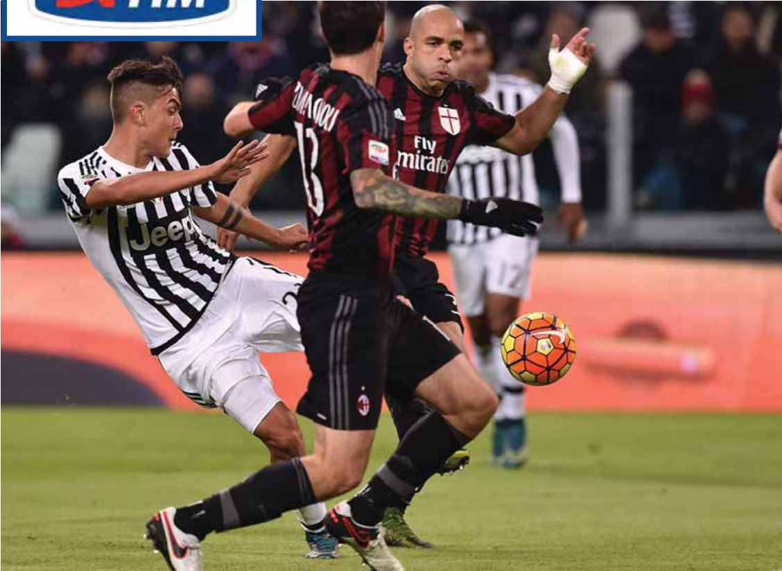
အိတလီစီးရီးအေသင်းများ ရပ်တည်မှု အမှတ်ပေးဇယား