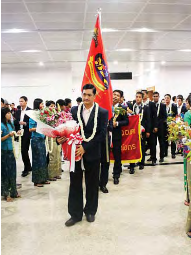
အသင်းအား သုံးဂိုး-ဂိုးမရှိဖြင့် အနိုင် ရရှိခဲ့ပြီး Viettel World Cup 2016 ဆုဖလားရရှိခဲ့ခြင်းဖြစ်ကြောင်း သိရ သည်။

ဗီယက်နမ်နိုင်ငံ ဟနွိုင်းမြို့တွင် အောက်တိုဘာ ၁ ရက်မှ ၁၅ ရက်အထိ မြန်မာ၊ ကမ္ဘောဒီးယား၊ လာအို၊ ဝီယမ်၊ ဗီယက်နမ်၊ တနင်္သာရီ၊ ဟောင်ကောင်၊ ဗီယက်နမ်နိုင်ငံ ၁၁ နိုင်ငံတို့မှ အသင်းပေါင်း ၁၇ သင်း ပါဝင်ယှဉ်ပြိုင်ခဲ့သည့် Viettel World Cup 2016 ပြိုင်ပွဲ၌ ပထမဆုံးရရှိခဲ့သော Dagon FC ဘောလုံးအသင်းသည် အောက်တိုဘာ ၁၉ ရက် ညနေ ၆ နာရီတွင် ရန်ကုန်အပြည်ပြည်ဆိုင်ရာ လေဆိပ်သို့ ပြန်လည်ရောက်ရှိလာရာ မြန်မာစီးပွားရေးကော်ပိုရေးရှင်း၊ Dagon FC အသင်းမှ တာဝန်ရှိသူများ၊ Myanmar National Tele Communication Co.,Ltd မှ တာဝန်ရှိသူများ၊ ဝန်ထမ်းများနှင့် မိသားစုဝင်များက အောင်သပြေပန်းစည်းများဖြင့် ကြိုဆိုခဲ့ကြသည်။