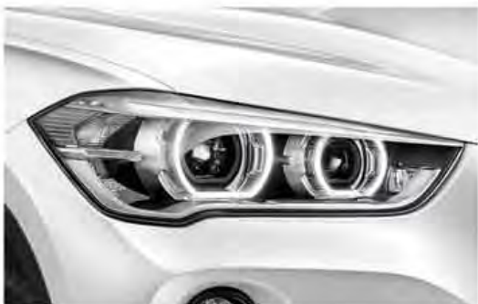
LED headlights with extended contents

The all-new BMW X1 ကို စမ်းသပ်မောင်းနှင်ရန်အတွက် ရန်ကုန်မြို့၊ ပြည်လမ်းနှင့် နာနတ်တောလမ်းထောင့်ရှိ BMW Showroom နှင့် မန္တလေးမြို့၊ ရွှေမန်းတောင် Golf Club ရှိ BMW Pavilion Mandalay သို့ လှမ်းခဲ့ဖို့ ဖိတ်ခေါ်အပ်ပါသည်။