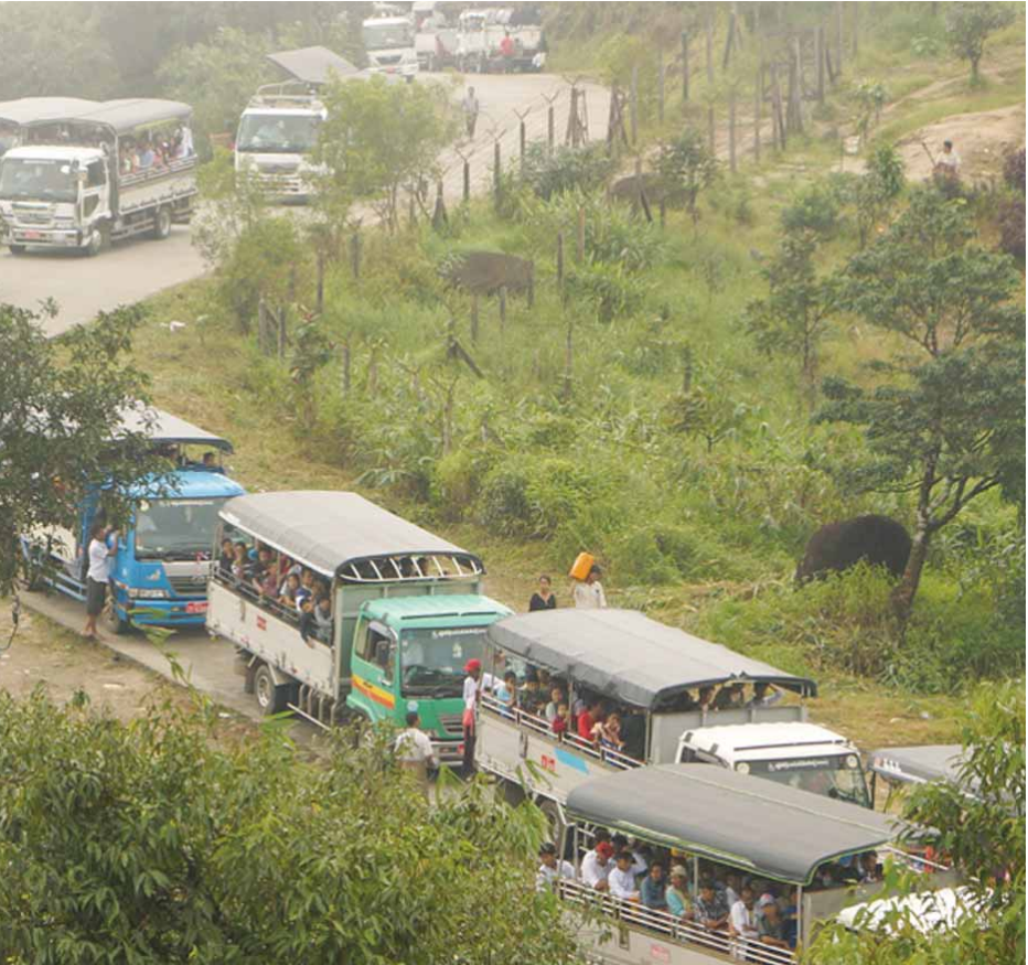
သက်ဦး(သထုံ)

ကျိုက်ထီးရိုးတောင်တက်မော်တော်ယာဉ်အသင်းကို ၁၉၉၃ ခုနှစ် ဇန်နဝါရီလတွင် စတင်တည်ထောင်ခဲ့ပြီး လက်ရှိတွင် တောင်တက်ယာဉ်အစီးရေ ၁၅၀ ဖြင့် ဘုရားဖူး များအား ဝန်ဆောင်ပေးလျက်ရှိကာ နှစ်စဉ် ပြည်တွင်း ပြည်ပ ဘုရားဖူးဦးရေမှာ သိန်း ၂၀ ဝန်းကျင်ခန့်ရှိကြောင်းသိရ သည်။