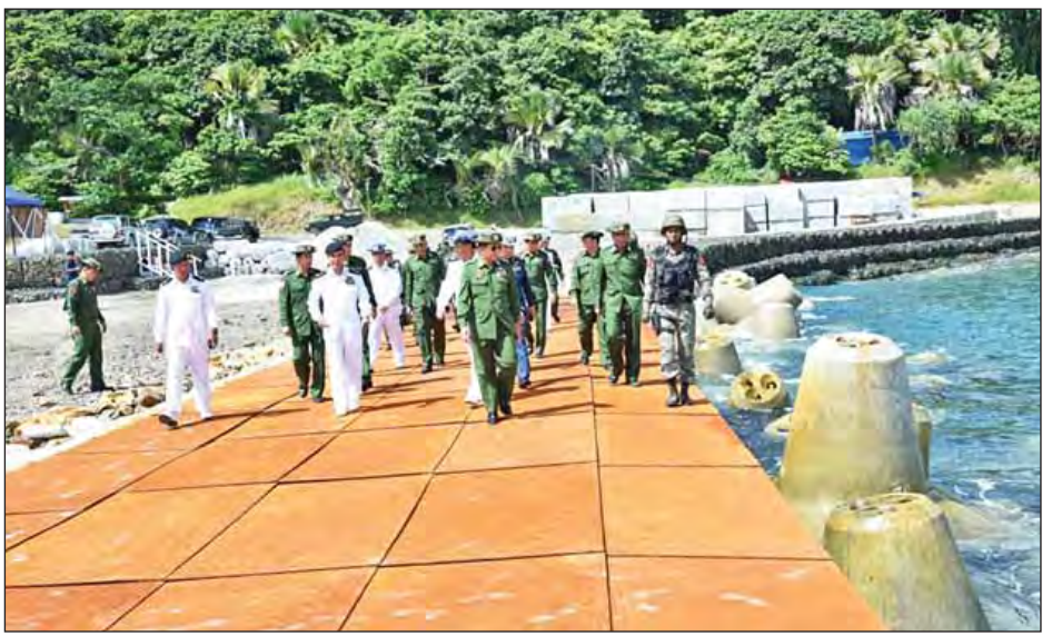
နှင့်အိမ်သုံးပစ္စည်းများ ထုတ်လုပ်ထားရှိမှု၊ တပ်မိသားစုဝင် များနှင့် ဒေသခံပြည်သူများ ပစ္စည်းထုတ်လုပ်ဆောင်ရွက် နေမှုတို့ကို ကြည့်ရှုအားပေးသည်။ ထို့နောက် တပ်မတော်ကာကွယ်ရေးဦးစီးချုပ်နှင့် အဖွဲ့ဝင်များသည် ကိုကိုးကျွန်းဆိပ်ခံတံတား တည်ဆောက် နေမှုအခြေအနေများကို လှည့်လည်ကြည့်ရှုစစ်ဆေးရာ

နှင့် တပ်မတော်အရာရှိကြီးများက စားသောက်ဖွယ်ရာ များနှင့် လက်ဆောင်များပေးအပ်သည်။ ထို့နောက် တပ်မတော်ကာကွယ်ရေးဦးစီးချုပ်နှင့် အဖွဲ့ဝင်များသည် သာသနာ့မဏ္ဍိုင်ကျောင်းတိုက် ကျောင်းထိုင်ဆရာတော် ဥူးအထွတ်အမြတ်ဖြင့် ပြုလုပ်ထားပြီး လှူဖွယ်ပစ္စည်းများနှင့် ဝတ္ထုငွေများဆက်ကပ်လှူဒါန်းသည်။ ထို့နောက် တပ်မတော်ကာကွယ်ရေးဦးစီးချုပ်သည် ကိုကိုးကျွန်းမြို့နယ်ခန်းမ၌ ကိုကိုးကျွန်းမြို့ရှိ ဌာနဆိုင်ရာ ဝန်ထမ်းများ၊ ရပ်မိရပ်ဖများနှင့်ဒေသခံပြည်သူများအား တွေ့ဆုံအမှာစကားပြောကြားသည်။ တွေ့ဆုံပွဲအပြီးတွင် တပ်မတော်ကာကွယ်ရေးဦးစီး ချုပ်က တွေ့ဆုံပွဲသို့ တက်ရောက်လာကြသည့် ဌာနဆိုင်ရာ ဝန်ထမ်းများ၊ ရပ်မိရပ်ဖများနှင့် ဒေသခံပြည်သူများအား ရင်းရင်းနှီးနှီး လိုက်လံနှုတ်ဆက်သည်။ ယင်းနောက် ကျွန်းပတ်လမ်းအတိုင်းမော်တော်ယာဉ် များဖြင့် လှည့်လည်ကြည့်ရှုကြပြီး ရေတပ်စခန်းဌာနချုပ်မှ Green House ဖြင့် စိုက်ပျိုးထားရှိသည့် အသီးအနှံပင်များ နှင့် ကြက်ခြံအတွင်း ဥစားကြက်များမွေးမြူထားရှိမှုတို့ ကို ကြည့်ရှုစစ်ဆေးရာ တာဝန်ရှိသူများက လိုက်လံ ရှင်းလင်းပြသကြသည်။ မွန်းလွဲပိုင်းတွင် တပ်မတော်ကာကွယ်ရေးဦးစီးချုပ် နှင့်အဖွဲ့ဝင်များသည် ရေတပ်စခန်းဌာနချုပ်ရှိ အနီးထွက် ပစ္စည်းများဖြင့်ပြုလုပ်ထားသည့် အိမ်အလှဆင်ပစ္စည်းများ