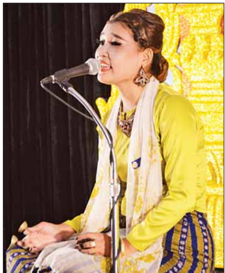
မဟာဂီတအဆင့်မြင့်ပညာ(မ) ပဲခူးတိုင်းဒေသကြီးမှ မဖေခင်ဝတ်ရည်ဟန်