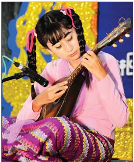
အခြေခံပညာ(၁၀-၁၅)(မ) ရန်ကုန်တိုင်းဒေသကြီးမှ မယွန်းနဒီပိုင်(ခ) ရွှေရုပ်လေး