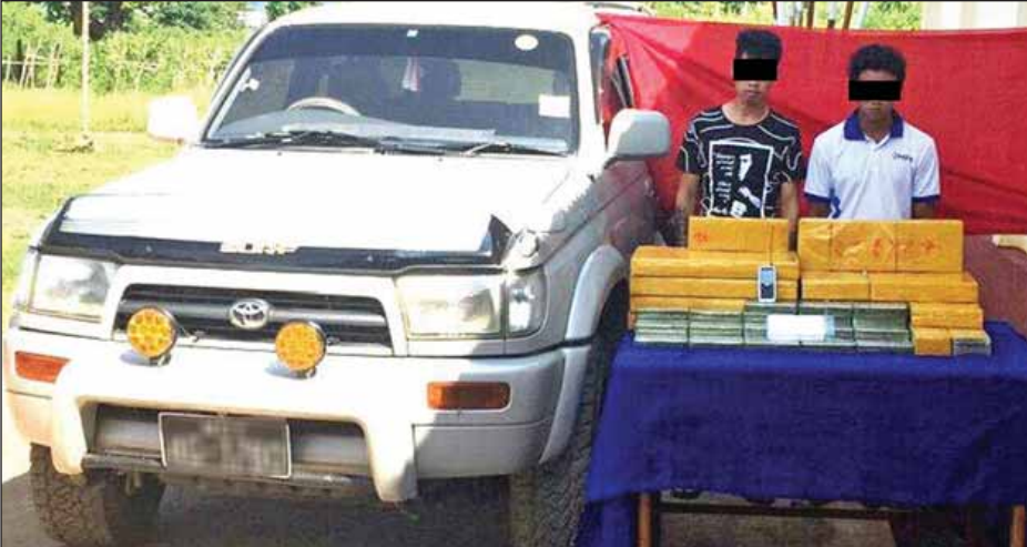
စိုင်းဆိုင်ရွက်နှင့် စိုင်းစာရိယတို့ကို သိမ်းဆည်းရမိ မူးယစ်ဆေးဝါးများနှင့်အတူ တွေ့ရစဉ်။

နေပြည်တော် အောက်တိုဘာ ၂၀ မူးယစ်တပ်ဖွဲ့(၂၇) လွိုင်လင်မှ တပ်ဖွဲ့ဝင်များနှင့် နယ်မြေခံရဲတပ်ဖွဲ့ဝင်များ ပါဝင်သော ပူးပေါင်းအဖွဲ့သည် အောက်တိုဘာ ၂၀ ရက်က ကွန်ဟိန်း-မိုင်းပျဉ်းသွား ကားလမ်းတာကော်ပူးပေါင်းစစ်ဆေးရေးစခန်းတွင် စိုင်းဆိုင်ရွက် မောင်းနှင်ပြီး စိုင်းစာရိယ လိုက်ပါလာသည့် SURF မော်တော်ယာဉ်ကိုရှာဖွေရာ ယာဉ်ကြမ်းခင်း အံ့ဂုတ်အတွင်းမှ ဘီနားပြုဘလောက်တုံး ၂၀၀ (အလေးချိန် ၆၇ ကီလို) ဒေသတန်ဖိုးငွေကျပ်သိန်း ၁၆၇၅၀ သိမ်းဆည်းရမိသဖြင့် စိုင်းဆိုင်ရွက် (၂၆)နှစ်နှင့် စိုင်းစာရိယ (၂၄)နှစ်တို့နှစ်ဦးအား မူးယစ်ဆေးဝါးနှင့် စိတ်ကိုပြောင်းလဲစေသော ဆေးဝါးများဆိုင်ရာဥပဒေအရ အရေးယူထားကြောင်း သိရသည်။ (ကြေးမုံ)