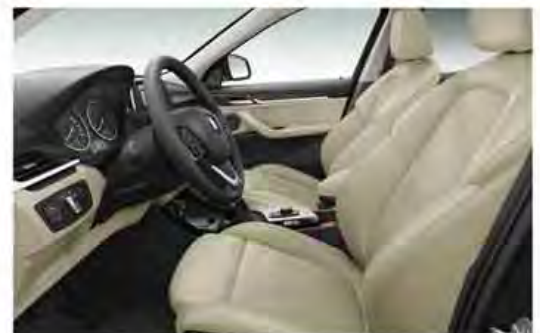
Sport seat with Lumbar support