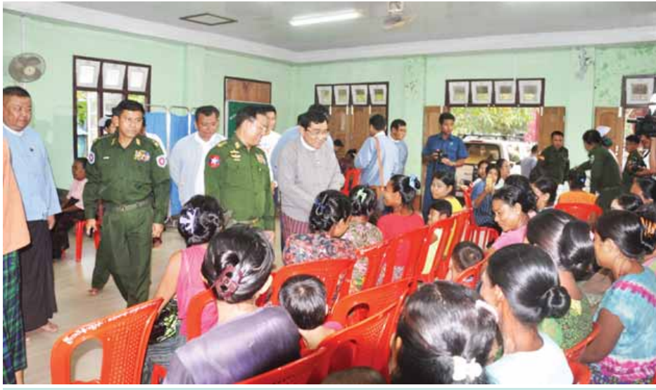
ပြည်ထောင်စုဝန်ကြီးများနှင့်အဖွဲ့ မောင်တောမြို့၌ ဒေသခံပြည်သူများနှင့် ကြောက်ရွံ့ထိတ်လန့်မှုကြောင့် နေရပ်မှ ခေတ္တစွန့်ခွာသူများအား အားပေးစကားပြောကြားစဉ်။ (သတင်းစဉ်)

ကြောက်ရွံ့ထိတ်လန့်မှုကြောင့် နေရပ်မှ ခေတ္တစွန့်ခွာလာပြီး မောင်တောမြို့ရှိ အောင်မြေဟေဗီ အလိုတော်ပြည့်ကျောင်းသို့ ရောက်ရှိနေသည့် ဒေသခံများသည် နယ်မြေအေးချမ်းလာပြီဖြစ်သည့်အတွက် ယနေ့ နံနက်ပိုင်းမှ စတင်ကာ ၎င်းတို့နေရပ်အသီးသီးသို့ မော်တော်ယာဉ်များဖြင့် ပြန်လည်ထွက်ခွာသွားရာ တာဝန်ရှိသူများက ပို့ဆောင်နှုတ်ဆက်ကြသည်။ (သတင်းစဉ်)