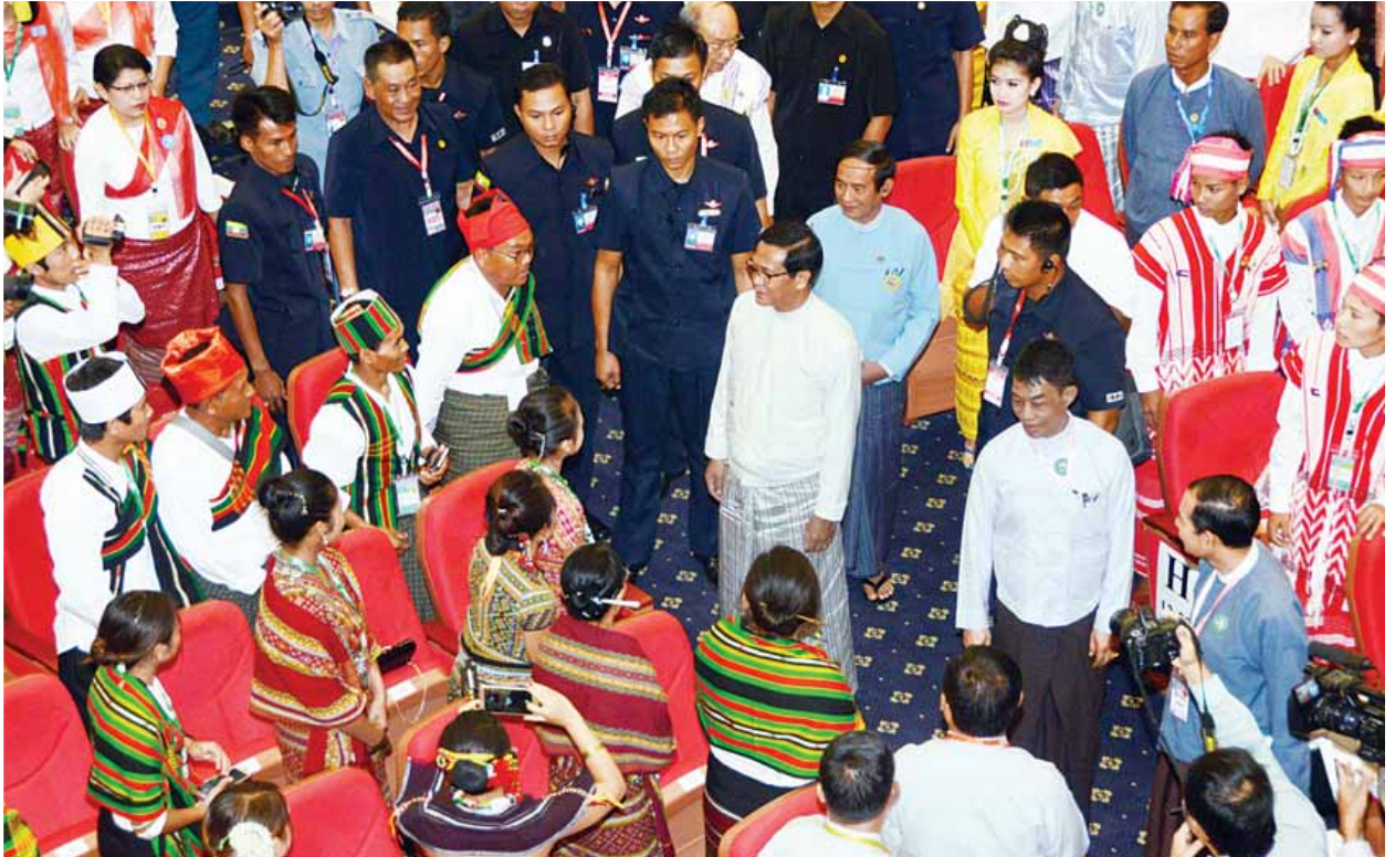
ဒုတိယသမ္မတ ဦးဟင်နရီဗန်ထီးယူ (၂၂)ကြိမ်မြောက် မြန်မာတိုင်းရင်းသားတို့၏ ရိုးရာယဉ်ကျေးမှု အဆို၊ အက၊ အရေး၊ အတီး ပြိုင်ပွဲဖွင့်ပွဲသို့ တက်ရောက် လာသည့် ပြိုင်ပွဲကျင်းပရေးဦးစီးကော်မတီဝင်များ၊ အကဖြတ်ခိုင်များ၊ အုပ်ချုပ်သူများ၊ တိုင်းဒေသကြီးနှင့် ပြည်နယ်များမှ ပြိုင်ပွဲဝင်များအား ရင်းရင်းနှီးနှီး နှုတ်ဆက်စဉ်။ (သတင်းစဉ်)

ယဉ်ကျေးမှု အနုသုခုမစံနှုန်းများ တစ်ခုနှင့်တစ်ခု ရေမြေဒေသကြောင့် မတူကွဲပြားသယောင်ရှိကြသော်လည်း သဘောသဘာဝများတူညီကြကြောင်း၊ သို့ဖြစ်၍ မိမိတို့နိုင်ငံမှာ ကာလရှည်ကြာခဲ့ပြီဖြစ်သည့် သဘောသဘာဝအခြေခံ တူညီသည့် ရိုးရာယဉ်ကျေးမှု အနုသုခုမများ မပျောက်မပျက် မတိမ်ကောအောင် ဆက်လက် ထိန်းသိမ်းရန်အတွက် တိုင်းရင်းသားညီအစ်ကို မောင်နှမအားလုံး တွင် တာဝန်ရှိကြောင်း (၂၂)ကြိမ်မြောက် မြန်မာတိုင်းရင်းသားတို့၏ ရိုးရာ ယဉ်ကျေးမှု အဆို၊ အက၊ အရေး၊ အတီး ပြိုင်ပွဲကျင်းပရေးဦးစီးကော်မတီ နာယက ဒုတိယသမ္မတ ဦးဟင်နရီဗန်ထီးယူက ပြောကြားခဲ့သည်။