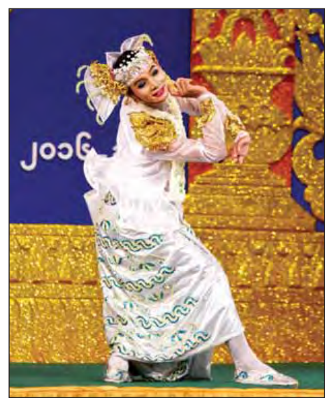
ဝါသနာရှင်အဆင့်(ပထမတန်း) (ကျား) အကပြိုင်ပွဲတွင် ရန်ကုန်တိုင်းဒေသကြီးမှ ရန်ကုန်မျိုးမင်းအောင် ယှဉ်ပြိုင်စဉ်။