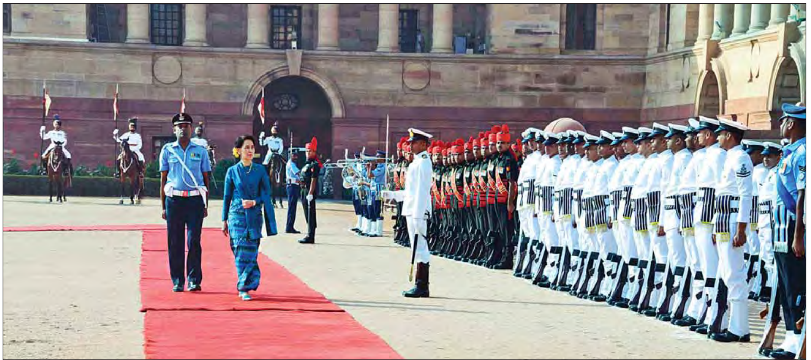
နိုင်ငံတော်၏ အတိုင်ပင်ခံပုဂ္ဂိုလ် ဒေါ်အောင်ဆန်းစုကြည် ဂုဏ်ပြုတပ်ဖွဲ့ကို စစ်ဆေးစဉ်။ (သတင်းစဉ်)

နယူးဒေလီ အောက်တိုဘာ ၁၈ နိုင်ငံတော်၏ အတိုင်ပင်ခံပုဂ္ဂိုလ် ဒေါ်အောင်ဆန်းစုကြည်အား ယနေ့နံနက် ၉ နာရီတွင် နယူးဒေလီမြို့ရှိ နိုင်ငံတော်သမ္မတ အိမ်တော်ဝင်း Rashtrapati Bhavan ၌ ဂုဏ်ပြုအခမ်းအနားဖြင့် ကြိုဆိုသည်။ ရှေးဦးစွာ နိုင်ငံတော်၏အတိုင်ပင်ခံပုဂ္ဂိုလ်သည် ဂုဏ်ပြုကြိုဆိုအခမ်းအနားသို့ ရောက်ရှိလာရာ အိန္ဒိယနိုင်ငံဝန်ကြီးချုပ် မစ္စတာ နာရန်ဒရာ မိုဒီက ကြိုဆိုနှုတ်ဆက်သည်။ ထို့နောက် နိုင်ငံတော်၏ အတိုင်ပင်ခံပုဂ္ဂိုလ်သည် ဂုဏ်ပြုတပ်ဖွဲ့၏ အလေးပြုခြင်းကိုခံယူပြီး ဂုဏ်ပြုတပ်ဖွဲ့ကို စစ်ဆေးသည်။ ထို့နောက် နိုင်ငံတော်၏အတိုင်ပင်ခံပုဂ္ဂိုလ်အား အိန္ဒိယနိုင်ငံဝန်ကြီးချုပ်က ၎င်းနှင့်အတူ ကြိုဆိုကြသူများနှင့် မိတ်ဆက်ပေးပြီး နိုင်ငံတော်၏ အတိုင်ပင်ခံပုဂ္ဂိုလ်ကလည်း စာမျက်နှာ ၃ ကော်လံ ၁ သို့ ☆