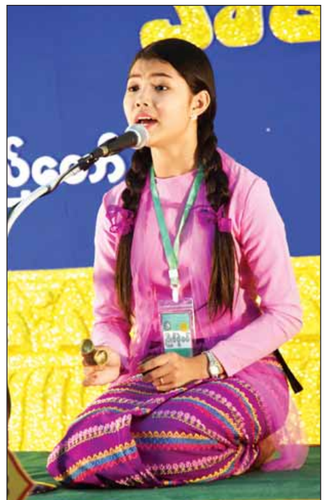
အခြေခံပညာအဆင့်(၁၅-၂၀)နှစ် (မ) ကာလပေါ်အဆိုပြိုင်ပွဲတွင် ရန်ကုန်တိုင်းဒေသကြီးမှ မမေသက်ထားဆွေ ယှဉ်ပြိုင်စဉ်။