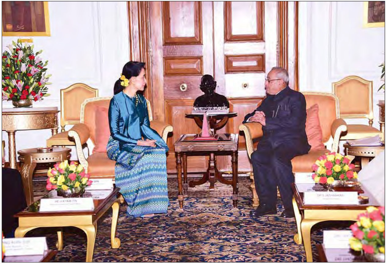
နိုင်ငံတော်၏အတိုင်ပင်ခံပုဂ္ဂိုလ် ဒေါ်အောင်ဆန်းစုကြည်နှင့် အိန္ဒိယသမ္မတနိုင်ငံ သမ္မတ မစ္စတာ ပရာနာ့ဗ်မူခါရီးတို့ တွေ့ဆုံဆွေးနွေးစဉ်။ (သတင်းစဉ်)