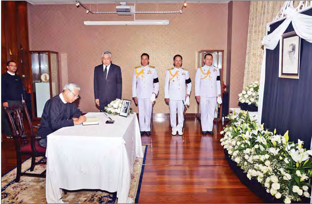
နိုင်ငံတော်သမ္မတ ဦးထင်ကျော် ရန်ကုန်မြို့ရှိ မြန်မာနိုင်ငံဆိုင်ရာ ထိုင်းနိုင်ငံသံရုံး၌ ထိုင်းဘုရင်မင်းမြတ် ဘူမိဘောအဋ္ဌရာဒက်ရှ် နတ်ရွာစံခြင်းအတွက် ဝမ်းနည်းကြောင်းစာအုပ်တွင် လက်မှတ်ရေးထိုးစဉ်။ (သတင်းစဉ်)

လောကဓမ္မတာစံကြရာ အချို့သောသူတို့သည် ဤလူ့ပြည်တွင် အမိ ဝမ်းတွင်းပဋိသန္ဓေနေရကုန်၏။ မကောင်းမှုပြုသူ တို့သည် ငရဲတွင် ကျရကုန်၏။ ကောင်းသောပညာ ရှိတို့သည် နတ်ပြည်သို့ ရောက်ရကုန်၏။ အာသဝေါ ကင်းသော ရဟန္တာပုဂ္ဂိုလ်တို့သည် ပရိနိဗ္ဗာန်စံရ ကုန်၏။ ပါပဝဂ်(ဓမ္မပဒ-၁၂၆)