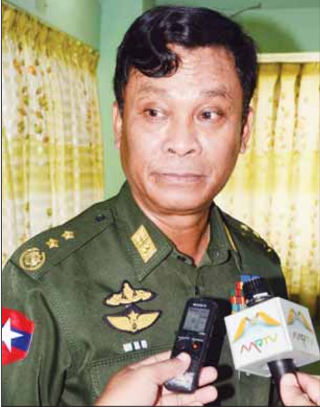
ဒုတိယဗိုလ်ချုပ်ကြီးကျော်ဆွေ

ဖြေ။ ဘူးသီးတောင်၊ မောင်တော၊ ရသေ့တောင်နယ်မြေတွေကို စစ်ဆင်ရေးစရိယာအဖြစ် သတ်မှတ်ပြီး ဆောင်ရွက်နေတယ်။ ဒီဖြစ်စဉ်နဲ့ပတ်သက်ပြီး လက်နက်တွေ ပါသွားမှုတွေ၊ ဆုံးရှုံးမှုတွေရှိခဲ့တယ်။ လက်နက် ၄၈ လက်ဆုံးရှုံးနေတယ်။ ဒီလက်နက်တွေမရမချင်း စစ်ဆင်ရေးတစ်ရပ်လုံးအင်အား ပြန်လုပ်ရလိမ့်မယ်။ အချိန်ကာလ ဘယ်လောက်လဲဆိုတာ ပြောလို့မရသေးဘူး။ လက်နက်တွေ ပြန်မရမချင်းလုပ်ရမှာပါ။ လုပ်တဲ့အခါမှာလည်း ကိုယ့်ရဲ့ကာကွယ်ရေးအမြင်နဲ့လုပ်ရမှာဖြစ်သလို တစ်ဖက်ကလည်း နိုင်ငံရဲ့ဥပဒေနဲ့အညီ ဆောင်ရွက်သွားမှာဖြစ်တယ်။ နိုင်ငံအတွင်းမှာနေတဲ့ ဒီနိုင်ငံမှာရှိတဲ့ ဘယ်သူမဆို နိုင်ငံတော်ဖွဲ့စည်းပုံအခြေခံဥပဒေတွေ၊ ထုတ်ပြန်ထားတဲ့ တည်ဆဲဥပဒေတွေနဲ့အညီ နေရမယ်။ မနေရင် ထိထိရောက်ရောက် အရေးယူရမယ်။ ထိထိရောက်ရောက် အရေးယူနိုင်အောင်လည်း လုပ်နေတယ်။ အချစ်စဉ်နဲ့ပတ်သက်ပြီး တာဝန်ရှိတဲ့သူကိုလည်း တာဝန်ရှိသလို အရေးယူဖို့လုပ်ထားတယ်။ ချီးကျူးဂုဏ်ပြုထိုက်တဲ့သူကိုလည်း ချီးကျူးဂုဏ်ပြုမှုတွေလုပ်ပေးမယ်။ ဒီလိုလုပ်မှပဲ ဒီဒေသမှာ တည်ငြိမ်အေးချမ်းဖို့အတွက် ဆောင်ရွက်နိုင်မှာဖြစ်ပါတယ်။ ဒီဒေသတည်ငြိမ်အေးချမ်းဖို့အတွက် ကျွန်တော်တို့ဘက်က လုပ်နိုင်တာတွေ အားလုံးလုပ်ပေးမယ်။ အထူးသဖြင့် ပြောချင်တာကတော့ ဒီဒေသမှာရှိတဲ့ ကျွန်တော်တို့တိုင်းရင်းသားတွေ နေရပ်ဒေသကို စွန့်ခွာပြီးမသွားဖို့ အရေးကြီးပါတယ်။ နေရပ်ဒေသ စွန့်ခွာသွားမယ်ဆိုရင် ဒီနယ်မြေတွေမှာ ကျန်တဲ့သူတွေ လာနေသွားလိမ့်မယ်။ ဒါကို ဒီမှာရှိတဲ့သူတွေက မြန်မာနိုင်ငံသားဆိုတဲ့အတွေးနဲ့ စိတ်ဓာတ်ရှိဖို့လိုပါတယ်။ ငါက ဘာလူမျိုးမို့လို့ ဘယ်ပါတီကမို့လို့ နေလို့မရဘူး။ မြန်မာဆိုတဲ့စိတ်နဲ့ တစ်လက်မမှ မကျူးကျော်နိုင်အောင် ဆောင်ရွက်ရမယ်။ ဆောင်ရွက်တဲ့အခါ မှာလည်း တရားဥပဒေနဲ့အညီ ဆောင်ရွက်သွားမှာဖြစ်ပါတယ်။