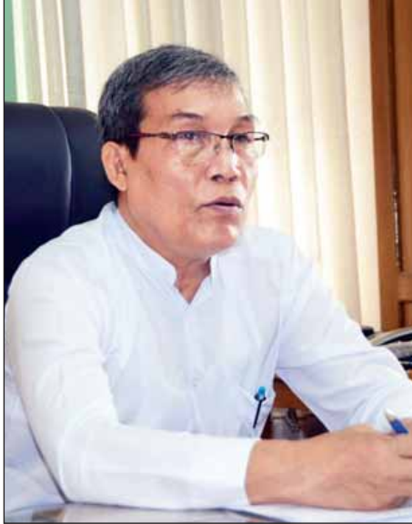
ရခိုင်ပြည်နယ်ဝန်ကြီးချုပ် ဦးညီပု

အောင် ပိုပြီးလုပ်သွားရမယ့် အနေအထားရှိတယ်။ အားလုံးပိုင်းဝန်းပြီး တာဝန်သိသိ ဖူးပေါင်းဆောင်ရွက်ဖို့လိုပါတယ်။ မေး။ စစ်ဘေးရှောင်ပြည်သူတွေနဲ့ပတ်သက်ပြီး ပညာရေး၊ ကျန်းမာရေးကဏ္ဍတွေအတွက် ပြည်နယ်အစိုးရအနေနဲ့ ဘယ်လိုဆောင်ရွက်ပေးနေပါသလဲ။ ဖြေ။ ပညာရေးအနေနဲ့က ဒီကာလဟာ သိတင်းကျွတ်ကျောင်းပိတ်ရက်ကာလဖြစ်နေပါတယ်။ ဒါပေမယ့် အခုဖြစ်သွားတဲ့အဖြစ်အပျက်နဲ့ ဆက်စပ်နေတော့ ဒီကိစ္စကြောင့် ကျောင်းပိတ်လိုက်တယ်လို့ အားလုံးက နားလည်နေတယ်။ ကျောင်းပိတ်ကာလကလည်းဖြစ်နေတော့ ဆရာ ဆရာမတွေကို သူတို့နေရပ်ပြန်နိုင်အောင် ဆောင်ရွက်ပေးထားပြီးဖြစ်ပါတယ်။ ပညာရေးနဲ့ပတ်သက်ပြီး ကလေးတွေအတွက် ဆက်ပြီးဆောင်ရွက်သွားပါမယ်။ ကျန်းမာရေးနဲ့ပတ်သက်လို့လည်း ဘူးသီးတောင်၊ မောင်တောမှာရှိတဲ့ ဆေးရုံဆေးခန်းတွေက ဆရာဝန်တွေနဲ့ တွေ့ဆုံပြီး ဒုက္ခရောက်နေတဲ့ဒုက္ခသည်တွေအတွက် ကျန်းမာရေးကို ဂရုတစိုက် ဆောင်ရွက်ပေးဖို့ ဆေးဝါးကအစ လိုလေသေးမရှိအောင် မှာကြားထားပါတယ်။ နောက်ပြီး ရွာတွေအထိ ရိက္ခာနဲ့ ဆေးဝါးတွေကို ပို့ထားပါတယ်။ ခုချိန်ထိ ကြီးကြီးမားမား ဒုက္ခရောက်တာ မကြားရသေးဘူး။ အစာရေစာ ပြတ်တောက်တာမျိုး၊ ရောဂါထူပြောတာမျိုး နောက်ပြီး ပညာရေးနဲ့ပတ်သက်တာမျိုး အခက်အခဲဖြစ်တာမရှိပါဘူး။ အားလုံး လိုအပ်ချက်ကိုဖြည့်ဆည်းပေးနေပါတယ်။ မေး။ စစ်ဘေးရှောင်ပြည်သူတွေကို ဘယ်တော့ သူတို့နေရပ်ကို ပြန်လည်ပြောင်းရွှေ့ပေးနိုင်မလဲဆိုတာ သိချင်ပါ