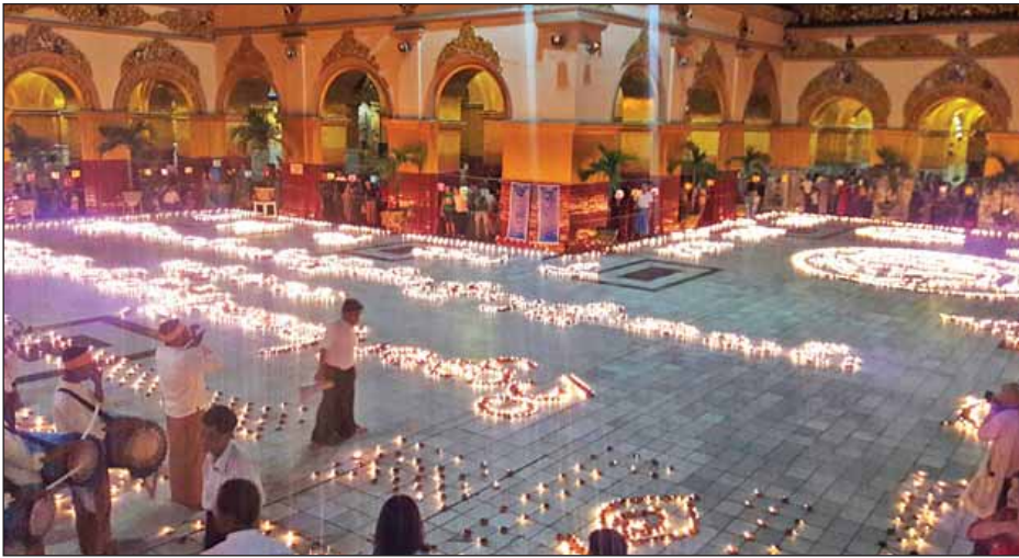
သီတင်းကျွတ်လပြည့်နေ့တွင် မန္တလေး မဟာမုနိဘုရားကြီးရင်ပြင်တော်၌ ရခိုင်မောင်မယ် တံမြက်စည်းလှည်းအသင်း (မန္တလေး)က (၁၂)ကြိမ်မြောက် ဆီမီး ၉၀၀၀ ထွန်းညှိပူဇော်ကြစဉ်။

၁၃၇၈ ခုနှစ် သီတင်းကျွတ်လပြည့် (အဘိဓမ္မာအခါတော်နေ့) တွင် မန္တလေးမြို့ရှိ တန်ခိုးကြီးဘုရားများ ဖြစ်သည့် မဟာမုနိဘုရားကြီး၊ ကျောက်တော်ကြီး ကုသိုလ်တော်၊ စန္ဒာမုနိ၊ ရွှေကြီးမြင် အိမ်တော်ရာ၊ ဝေရောစနကျောက်စိမ်းဓေတီ၊ သကျ သီဟအောင်တော်မူ အစရှိသည့် ဘုရားများတွင် နံနက်အရုဏ်တက်ချိန်မှ စတင်ပြီး ဘုရားဖူးများဖြင့် စည်ကားများပြားလျက်ရှိကြောင်း တွေ့ရသည်။