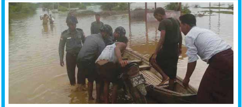
မန္တလေးတိုင်းဒေသကြီး ငါန်းစွန်မြို့နယ် ငါန်းမြာကြီးကျေးရွာနှင့်အနီးတစ်ဝိုက်၌ အောက်တိုဘာ ၁၃ ရက်ညက မိုးသည်ထန်စွာရွာသွန်းမှုကြောင့် ငါန်းမြာ-မိုးတောင်၊ ငါန်းမြာ-ကုန်းလည် ကားလမ်းတို့တွင် မိုးရေလျှံမှုကြောင့် ပြည်သူများခရီးသွားလာရေးလွယ်ကူစေရန် ငါန်းမြာရဲကင်းရဲစခန်းမှ ရဲတပ်ဖွဲ့ဝင်များက အောက်တိုဘာ ၁၄ ရက် နံနက် ၉ နာရီခွဲမှစတင်ကာ ကူညီဆောင်ရွက်ပေးခဲ့ကြောင်း သိရသည်။ သက်ဆိုင်ဦး(ငါန်းစွန်)