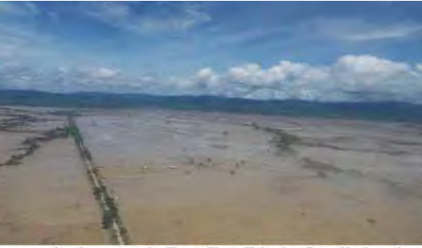
၂၀၁၅ ခုနှစ်အတွင်း ကလေးဒေသတွင် ရေကြီးရေလျှံမှုဖြစ်ပွားမှုကြောင့် လယ်ယာမြေများ ပျက်စီးမှုကို တွေ့ရရန်