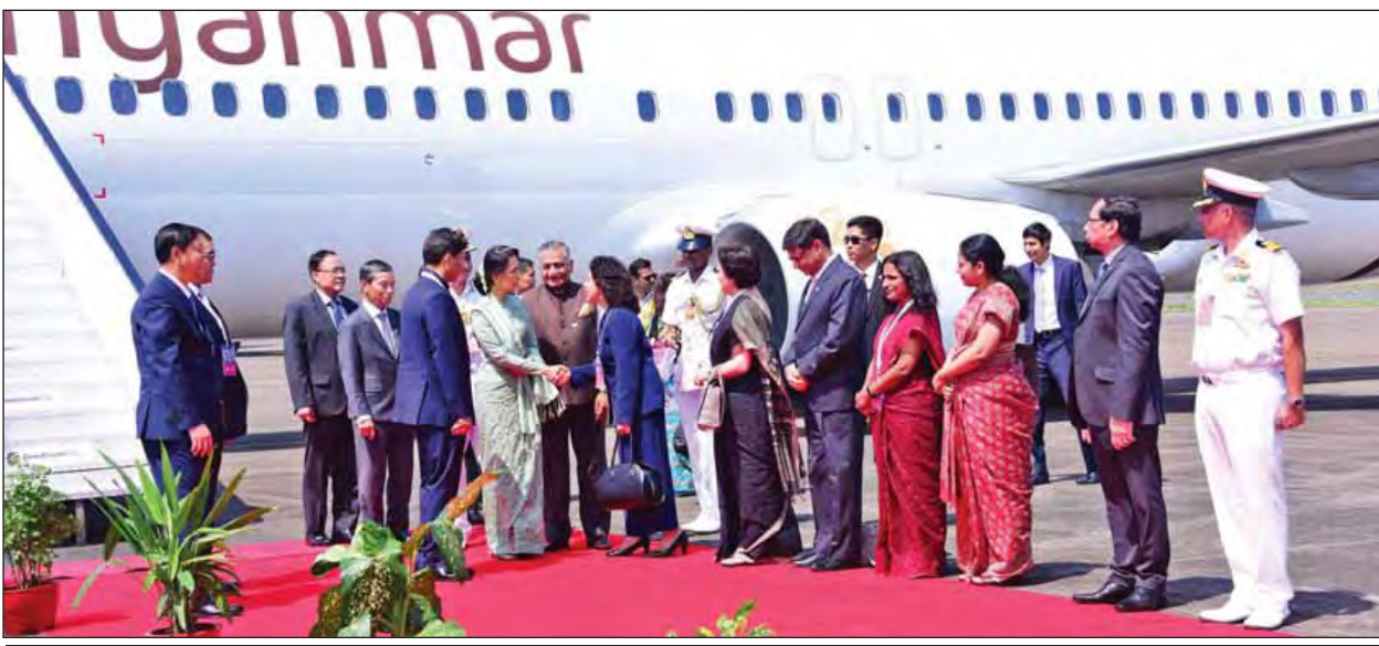
နိုင်ငံတော်၏ အတိုင်ပင်ခံပုဂ္ဂိုလ်ဒေါ်အောင်ဆန်းစုကြည်နှင့်အဖွဲ့အား အိန္ဒိယသမ္မတနိုင်ငံမှ Minister of state for Foreign Affairs Mr. V. K. Singh ၊ မြန်မာနိုင်ငံဆိုင်ရာ အိန္ဒိယသံအမတ်ကြီး Mr. Vikram Misri ၊ အိန္ဒိယနိုင်ငံဆိုင်ရာ မြန်မာသံအမတ်ကြီး ဦးအောင်ခင်စိုးနှင့် တာဝန်ရှိသူများက လေဆိပ်၌ ကြိုဆိုနှုတ်ဆက်ကြစဉ်။ (သတင်းစဉ်)

ဂိုအာ အောက်တိုဘာ ၁၆ နိုင်ငံတော်၏အတိုင်ပင်ခံပုဂ္ဂိုလ် ဒေါ်အောင်ဆန်းစုကြည်သည် အိန္ဒိယသမ္မတနိုင်ငံ ဝန်ကြီးချုပ် မစ္စတာ နာရန်ဒရာမိုဒီ၏ ဖိတ်ကြားချက်အရ အိန္ဒိယနိုင်ငံသို့ တရားဝင်ခရီးသွားရောက်ရန်နှင့် အိန္ဒိယနိုင်ငံ ဂိုအာမြို့၌ ကျင်းပမည့် BIMSTEC Retreat အစည်းအဝေးနှင့် BRICS and BIMSTEC Leader's Outreach Summit အစည်းအဝေးသို့တက်ရောက်ရန် ယနေ့နံနက်ပိုင်းတွင် နေပြည်တော်မှလေကြောင်းခရီးဖြင့် ထွက်ခွာရာ အိန္ဒိယနိုင်ငံ ဂိုအာမြို့သို့ ဒေသစံတော်ချိန် နံနက် ၁၁ နာရီ ၁၀ မိနစ်တွင် ရောက်ရှိသည်။ နိုင်ငံတော်၏ အတိုင်ပင်ခံပုဂ္ဂိုလ်နှင့်အဖွဲ့အား အိန္ဒိယသမ္မတနိုင်ငံမှ Minister of state for Foreign Affairs Mr. V. K. Singh ၊ မြန်မာနိုင်ငံဆိုင်ရာ အိန္ဒိယသံအမတ်ကြီး Mr. Vikram Misri ၊ အိန္ဒိယနိုင်ငံဆိုင်ရာ မြန်မာသံအမတ်ကြီး ဦးအောင်ခင်စိုးနှင့် တာဝန်ရှိသူများက ဒါဟိုလင် အပြည်ပြည်ဆိုင်ရာလေဆိပ်၌ ကြိုဆိုနှုတ်ဆက်ကြသည်။ ထို့နောက် နိုင်ငံတော်၏အတိုင်ပင်ခံပုဂ္ဂိုလ်ဦးဆောင်သည့် ကိုယ်စားလှယ်အဖွဲ့သည် မော်တော်ယာဉ်များဖြင့် ခေတ္တတည်းခိုမည့် Hotel Leela သို့ရောက်ရှိကြသည်။ ယင်းနောက် နိုင်ငံတော်၏အတိုင်ပင်ခံပုဂ္ဂိုလ်သည် Hotel Leela ၌ ဂိုအာပြည်နယ်ဝန်ကြီးချုပ်က BIMSTEC ခေါင်းဆောင်များအား တည်ခင်းဧည့်ခံသည့် နေ့လယ်စာစားပွဲသို့ တက်ရောက်သည်။ (သတင်းစဉ်)