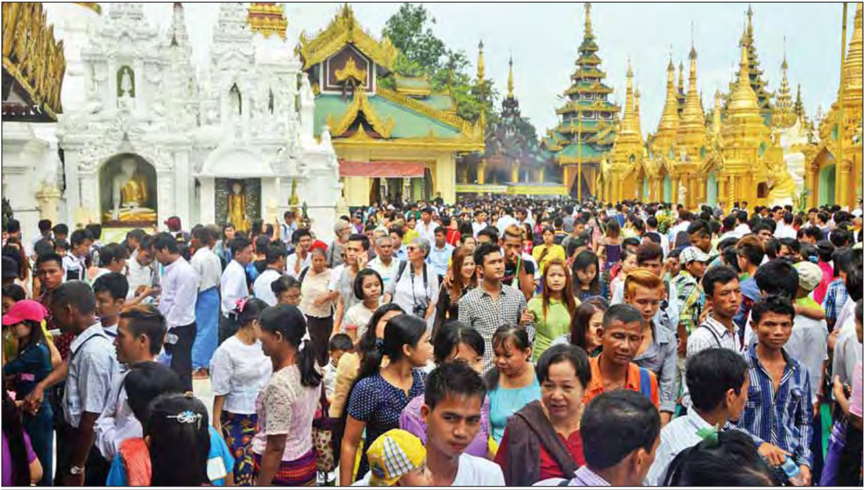
သီတင်းကျွတ်လပြည့်နေ့ ရွှေတိဂုံဓေတီတော်မြတ်ကြီးတွင် ဘုရားဖူးပြည်သူများဖြင့် စည်ကားလျက်ရှိစဉ်။

တာဝတိံသာနတ်ပြည်၌ သန္တုသိတမည်သော မယ်တော်မိနတ်သားကို အမူးထားကာ နတ်ပြဟောတို့အား ဝါတွင်းသုံးလပတ်လုံး အဘိဓမ္မာတရားတော်ကို ဟောတော်မူခဲ့ရာ သီတင်းကျွတ်လပြည့်နေ့၌ အဘိဓမ္မာတရားဟောကြား၍ ပြီးဆုံးတော်မူသည်။ ထိုနေ့တွင်ပင် မြတ်စွာဘုရားရှင်သည် တာဝတိံသာနတ်ပြည်မှ လူ့ပြည်သို့သက်ဆင်းရာ သိကြားမင်းဖန်ဆင်းပေးသော ရွှေစောင်းတန်း၊ ငွေစောင်းတန်း၊ ပတ္တမြားစောင်းတန်းတို့မှ မြတ်စွာဘုရားသည် ရောင်ခြည်တော်ခြောက်သွယ်ဖြင့် တင့်တယ်စွာ အလယ်၌ရှိသော ပတ္တမြားစောင်းတန်းဖြင့်ဆင်းသက်ရာ နတ်အပေါင်းက လက်ယာဘက်ရွှေစောင်းတန်းဖြင့် လည်းကောင်း၊ ဗြဟ္မာကြီးအပေါင်းက လက်ဝဲဘက်ငွေစောင်းတန်းဖြင့် လည်းကောင်း စာမျက်နှာ ၇ ကော်လံ ၁ သို့ *