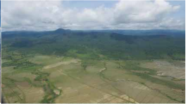
၂၀၁၅ ခုနှစ်အတွင်း ကလေးဒေသတွင် ရေကြီးရေလျှံမှုဖြစ်ပွားမှုကြောင့် လယ်ယာမြေများ ပျက်စီးမှုကို တွေ့ရရန်