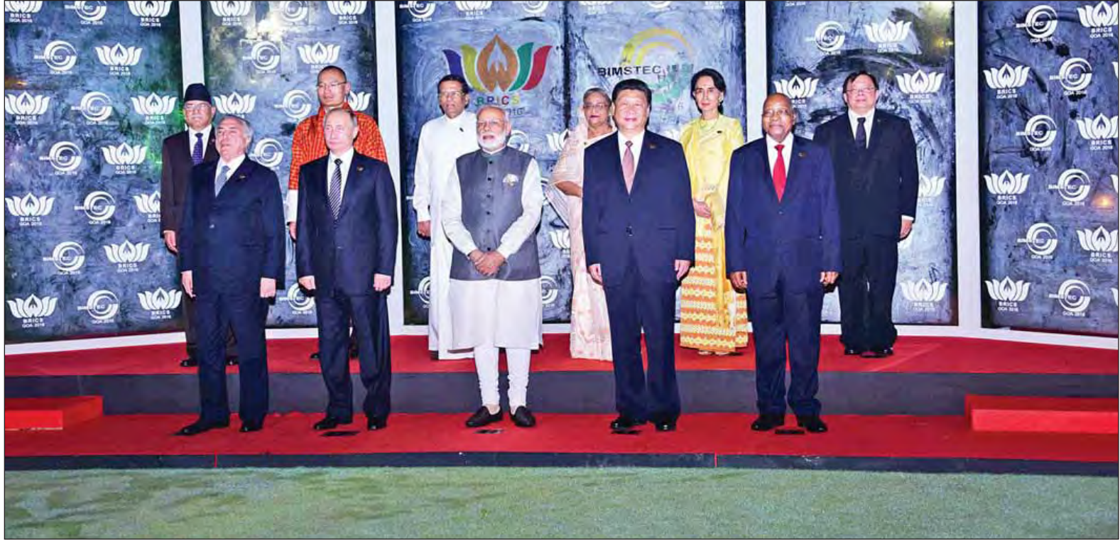
နိုင်ငံတော်၏ အတိုင်ပင်ခံပုဂ္ဂိုလ် ဒေါ်အောင်ဆန်းစုကြည်နှင့် BRICS and BIMSTEC Leader's Outreach Summit အစည်းအဝေး တက်ရောက်လာကြသည့် အဖွဲ့ဝင်နိုင်ငံများမှ နိုင်ငံအကြီးအကဲများနှင့် အစိုးရအဖွဲ့အကြီးအကဲများ စုပေါင်းမှတ်တမ်းတင် ဓာတ်ပုံရိုက်ကြစဉ်။ (သတင်းစဉ်)