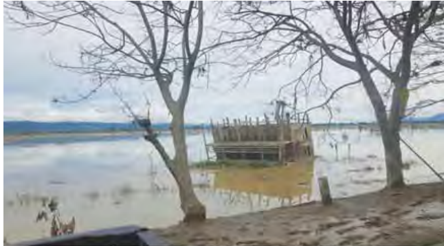
၂၀၁၅ ခုနှစ်အတွင်း ကလေးဒေသတွင် ရေကြီးရေလျှံမှုဖြစ်ပွားမှုကို တွေ့ရရန်