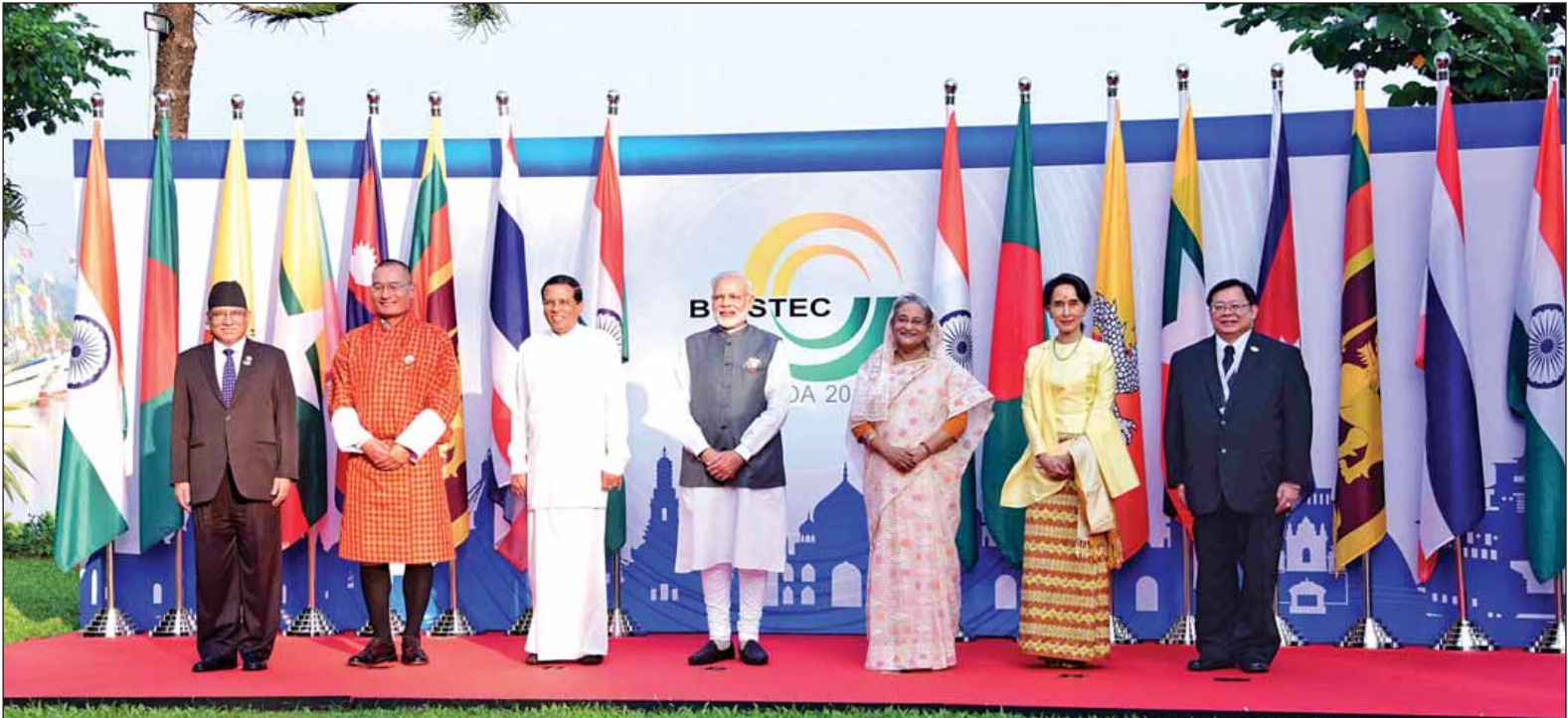
နိုင်ငံတော်၏အတိုင်ပင်ခံပုဂ္ဂိုလ် ဒေါ်အောင်ဆန်းစုကြည်နှင့် ဘင်းမိစတက်သီးသန့်အစည်းအဝေးသို့ တက်ရောက်လာကြသည့် အဖွဲ့ဝင်နိုင်ငံများမှ နိုင်ငံအကြီးအကဲများနှင့် အစိုးရအဖွဲ့အကြီးအကဲများ စုပေါင်းမှတ်တမ်းတင် ဓာတ်ပုံရိုက်ကြစဉ်။ (သတင်းစဉ်)

ဘင်းမိစတက်အဖွဲ့ကို ၁၉၉၇ ခုနှစ် ဇွန် ၆ ရက်တွင် ဗန်ကောက်ကြေညာစာတမ်းနှင့်အတူ ဘင်္ဂလားဒေ့ရှ်၊ အိန္ဒိယ၊ သီရိလင်္ကာနှင့် ထိုင်းနိုင်ငံ စီးပွားရေးပူးပေါင်း ဆောင်ရွက်မှုအဖွဲ့ (BIST-EC) အဖြစ် စတင်ဖွဲ့စည်းခဲ့သည်။ အဆိုပါအဖွဲ့သို့ ၁၉၉၇ ခုနှစ် ဒီဇင်ဘာ ၂၂ ရက်တွင် မြန်မာနိုင်ငံက လည်းကောင်း၊ ၂၀၀၄ ခုနှစ် ဖေဖော်ဝါရီ ၅ ရက်မှ ၉ ရက်ထိ ထိုင်းနိုင်ငံ ဖူးဆက်မြို့၌ကျင်းပသည့် ဆဌမအကြိမ် ဘင်းမိစတက် ဝန်ကြီးအဆင့်အစည်းအဝေးတွင် ဘူတန်နိုင်ငံနှင့် နီပေါနိုင်ငံ တို့ကလည်းကောင်း အဖွဲ့ဝင်နိုင်ငံများ အဖြစ်ပါဝင်ခဲ့ကြသည်။ ၂၀၀၄ ခုနှစ် ဇူလိုင် ၃၀ ရက်တွင် ထိုင်းနိုင်ငံ ဗန်ကောက်မြို့၌ ကျင်းပခဲ့သည့် ပထမအကြိမ် ထိပ်သီးအစည်းအဝေးတွင် အဖွဲ့၏အမည်ကို ဘင်္ဂလားပင်လယ်အော်ဒေသတွင်း ကဏ္ဍစုံနည်းပညာနှင့် စီးပွားရေးပူးပေါင်းဆောင်ရွက်မှုဆိုင်ရာ ဦးဆောင်ဦးရွက်ပြုမှုအစီအစဉ် (Bay of Bengal Initiatives for Multi-Sectoral Technical and Economic Cooperation - BIMSTEC) ဟု ပြောင်းလဲခေါ်ဝေါ်ခဲ့သည်။ အဖွဲ့စတင်ဖွဲ့စည်းသည့် ဇွန် ၆ ရက်ကို ဘင်းမိစတက်နေ့အဖြစ် သတ်မှတ်ထားရှိသည်။ (သတင်းစဉ်)