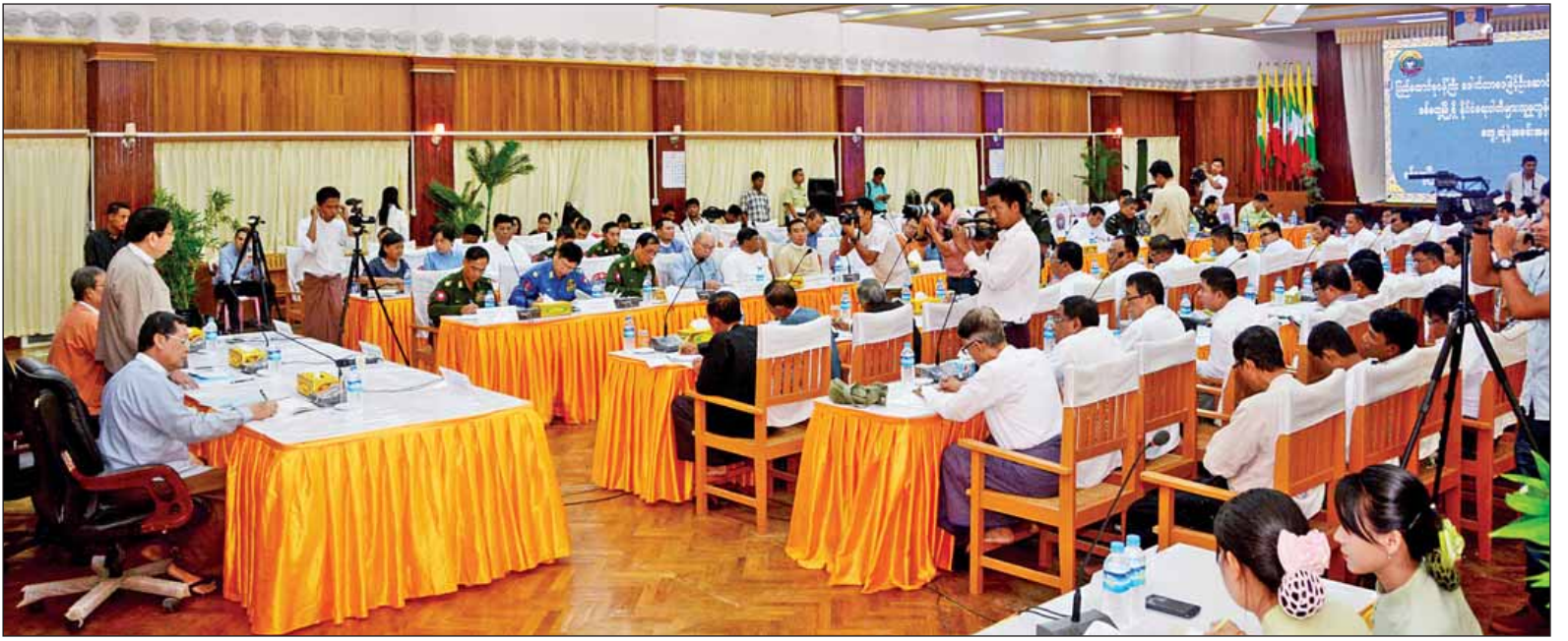
ပြည်ထောင်စုဝန်ကြီးများနှင့်အဖွဲ့ စစ်တွေမြို့ရှိ နိုင်ငံရေးပါတီများ၊ လူမှုကွန်ရက်အဖွဲ့အစည်းများမှ တာဝန်ရှိသူများ တွေ့ဆုံသည်။ (သတင်းစဉ်)

ပြည်နယ်ဝန်ကြီးချုပ် ဦးညီပု၊ ပြည်ထောင်စုဝန်ကြီး ဦးသိန်းဆွေနှင့် ဒေါက်တာဖေမြင့်တို့က ယခင်ကထက် ပိုမို သွေးစည်းညီညွတ်ရန်၊ ယခုဖြစ်စဉ် နှင့်ပတ်သက်၍ ကျူးလွန်သူများကို ဥပဒေနှင့်အညီ ထိထိရောက်ရောက် အရေးယူသွားမည်၊ ကျူးလွန်သူများ အား ဖော်ထုတ်ပြီး အသိပေးတင်ပြ သွားမည်ဖြစ်ကြောင်း၊ ကျီးကန်းပြင် အပါအဝင် နေရာသုံးနေရာကို တစ်ပြိုင်တည်းဝင်ရောက်တိုက်ခိုက် သူများသည် အချုပ်အခြာအာဏာကို ထိပါးခြင်းဖြစ်သဖြင့် တပ်မတော် စစ်ကြောင်းများက လိုအပ်သလို ပိတ်ဆို့ရှင်းလင်းခြင်းကို မြေပြင်၊ ရေပြင်တွင် ဆက်စပ်ဆောင်ရွက်နေ ကြောင်း၊ အချို့လွှဲမှားသောပုဂ္ဂိုလ် များကို အမှန်ထင်ပြီး စိတ်အနှောင့် အယှက်ဖြစ်မည်ကို စိုးရိမ်ပါကြောင်း၊