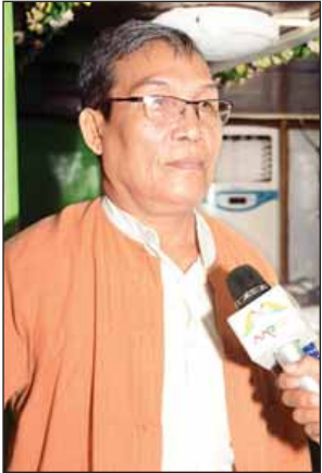
ရခိုင်ပြည်နယ်ဝန်ကြီးချုပ် ဦးညီပု

ရခိုင်ပြည်နယ် မောင်တော၊ ဘူးသီးတောင်နှင့် ရသေ့တောင်မြို့နယ်များအတွင်း ဖြစ်ပွားခဲ့သည့် ဖြစ်စဉ်များနှင့်စပ်လျဉ်းပြီး ပြည်ထောင်စုဝန်ကြီးများ၊ ရခိုင်ပြည်နယ်ဝန်ကြီးချုပ်နှင့်အဖွဲ့သည် အောက်တိုဘာ ၁၁ ရက်မှ ၁၄ ရက်အထိ ရခိုင်ပြည်နယ်သို့ သွားရောက်ခဲ့ပြီး စစ်တွေ၊ မောင်တော၊ ဘူးသီးတောင်မြို့တို့မှ ဆရာတော်ကြီးများ၊ မြို့မိမြို့ဖများ၊ ဒေသခံပြည်သူများ၊ ဌာနဆိုင်ရာအဖွဲ့အစည်းများ၊ အစွဲလားဘာသာဝင်များ၊ စစ်တွေမြို့နယ်ရှိ နိုင်ငံရေးပါတီများနှင့် လူမှုကွန်ရက်မှ တာဝန်ရှိသူများနှင့် တွေ့ဆုံခဲ့သည်။