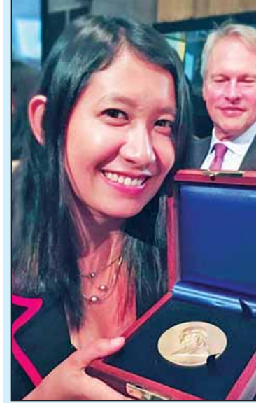
ပုလစ်ဇာဆုတံဆိပ်နှင့် အက်စတာထုဆန်၊ (ဓာတ်ပုံ-အက်စတာထုဆန် ဖေ့စ်ဘွတ်)

* သတင်းလောကမှ ပတ်သက်သည့် အမြင့်ဆုံးဆုတံဆိပ်ကို ပထမဦးဆုံး ဆွတ်ခူးနိုင်သူလည်း ဖြစ်လာခဲ့သည်။