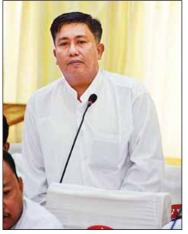
ဦးစိုးနိုင်

* သတင်းလောကမှ ပတ်သက်သည့် အမြင့်ဆုံးဆုတံဆိပ်ကို ပထမဦးဆုံး ဆွတ်ခူးနိုင်သူလည်း ဖြစ်လာခဲ့သည်။