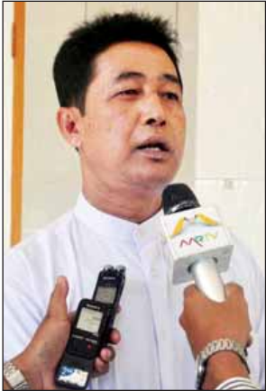
ဦးသန်းရွှေ