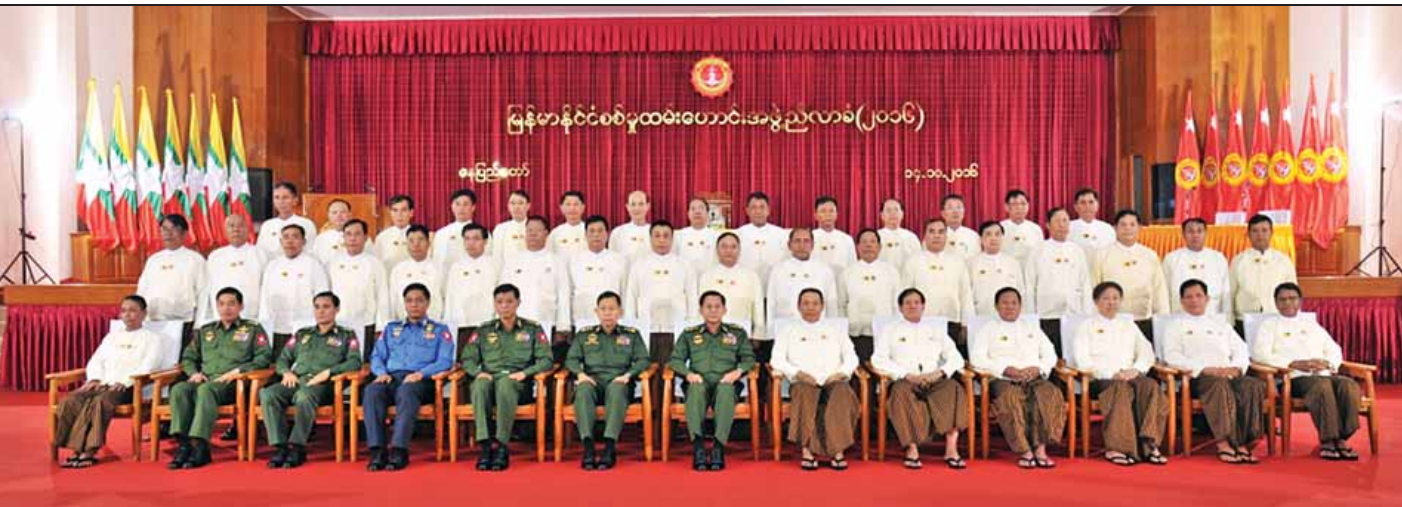
မြန်မာနိုင်ငံ စစ်မှုထမ်းဟောင်းအဖွဲ့ နာယက တပ်မတော်ကာကွယ်ရေးဦးစီးချုပ် ဗိုလ်ချုပ်မှူးကြီး မင်းအောင်လှိုင် စစ်မှုထမ်းဟောင်းအဖွဲ့ ဗဟိုအမှုဆောင်အဖွဲ့နှင့် စုပေါင်းမှတ်တမ်းဓာတ်ပုံရိုက်စဉ်။

တပ်မတော်အနေဖြင့် နိုင်ငံတော်ကာကွယ်ရေးတာဝန်ကို ထမ်းဆောင်ရင်း တိုင်းပြည်၏ ပကတိလိုအပ်ချက်ဖြစ်သည့် တည်ငြိမ်အေးချမ်းရေး၊ စည်းလုံးညီညွတ်ရေးနှင့် ဖွံ့ဖြိုးတိုးတက်ရေးလုပ်ငန်းစဉ်များအား တပ်မတော်၏ ကောင်းမြတ်သည့် အစဉ်အလာဖြစ်သည့် အမျိုးသားနိုင်ငံရေးတာဝန်ထမ်းဆောင်မှုအဖြစ် တစ်တပ်တစ်အား ပါဝင်ဆောင်ရွက်လျက်ရှိကြောင်း၊ မြန်မာနိုင်ငံ