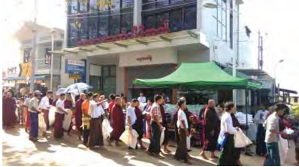
ရေး အောက်တိုဘာ ၁၄

မွန်ပြည်နယ် ရှေးမြို့၏ကျွတ်ဆွမ်းကြီးလောင်းပွဲမှာ စကားတောင်စေတီတော်ဘုရား၏မုခ်ဝအထိ ဗိုလ်ချုပ်လမ်းမကြီးအတိုင်း အောက်တိုဘာ ၁၃ ရက် နံနက် ၈ နာရီက အကြိမ် (၁၂၀) မြောက် မြို့လုံးကျွတ်ဆွမ်းကြီးလောင်းလှပွဲကို စည်ကားစွာကျင်းပကြောင်း သိရသည်။