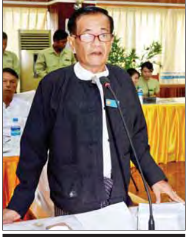
ဦးစောရွှေ

ထို့နောက် သတင်းမီဒီယာများ၏ မေးမြန်းချက်များကို ပြည်ထောင်စုဝန်ကြီး ဒေါက်တာဖေမြင့်နှင့် ဦးသိန်းဆွေတို့က ပြန်လည်ဖြေကြားခဲ့ကြသည်။ (သတင်းစဉ်)