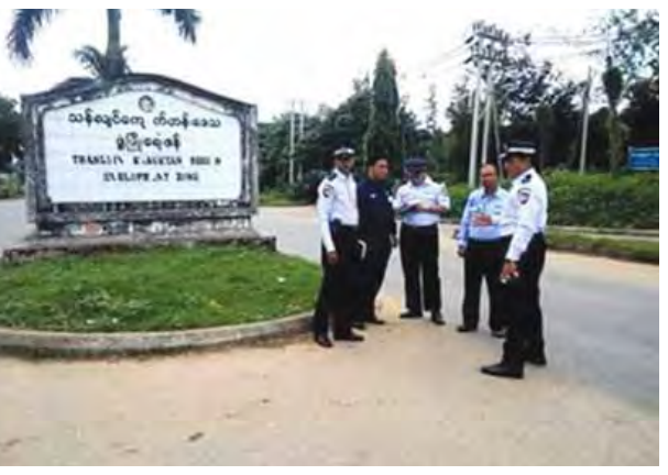
သန်လျင် အောက်တိုဘာ ၁၄

ရန်ကုန်တိုင်းဒေသကြီး တောင်ပိုင်းခရိုင် သန်လျင်မြို့နယ်တွင် မီးပွိုင့်တပ်ဆင်ရန်မြေနေရာအား တာဝန်ရှိသူများက ကြည့်ရှုခဲ့ကြောင်း သိရသည်။