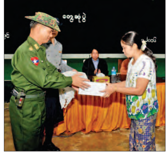
ဒုတိယဝန်ကြီး ဗိုလ်ချုပ်အောင်စိုး ကျဆုံး၊ ဒဏ်ရာရရှိသည့်တပ်ဖွဲ့ဝင်များအတွက် ၎င်းတို့မိသားစုဝင်တစ်ဦးအား ထောက်ပံ့ငွေပေးအပ်စဉ်။ (သတင်းစဉ်)