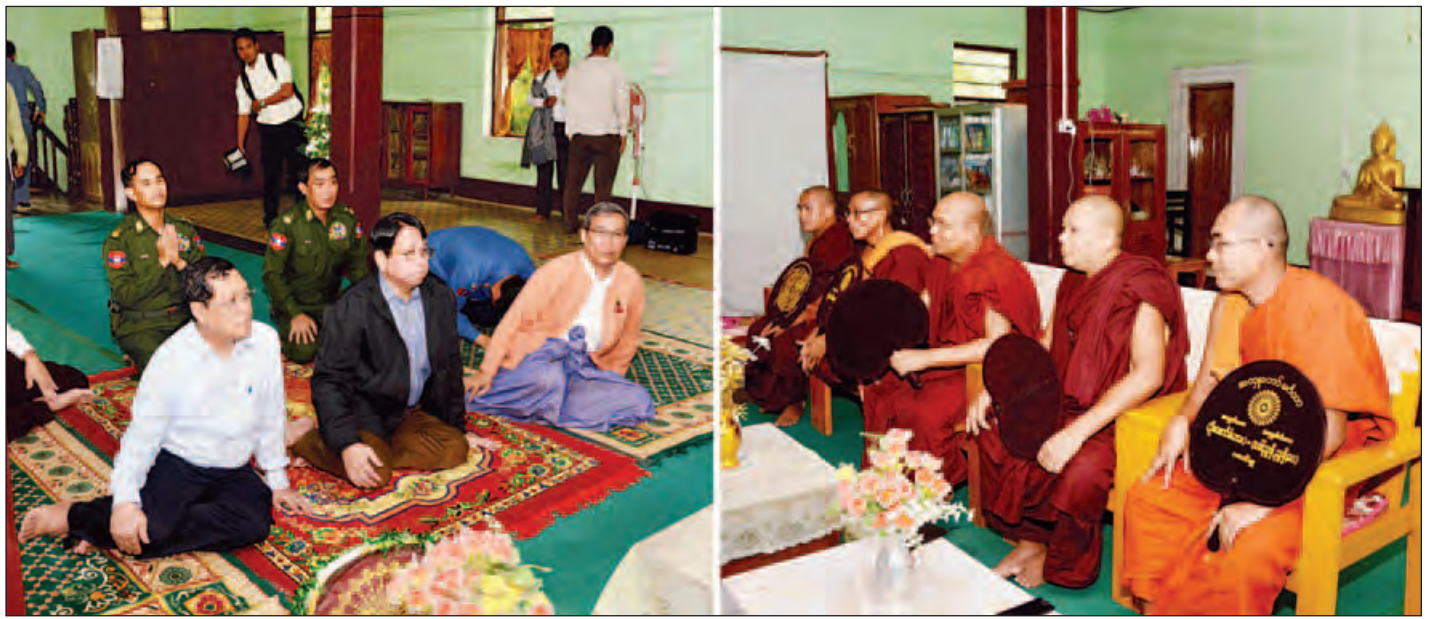
ပြည်ထောင်စုဝန်ကြီးများ၊ ပြည်နယ်ဝန်ကြီးချုပ်နှင့်အဖွဲ့ ဘူးသီးတောင်မြို့နယ် သံယနာယကအဖွဲ့ဥက္ကဋ္ဌနှင့် အဖွဲ့ဝင်ဆရာတော်ကြီးများထံမှ ဩဝါဒနာယူကြစဉ်။ (သတင်းစဉ်)

ပြည်ထောင်စုဝန်ကြီးများနှင့် ဒုတိယဝန်ကြီးများကလည်း လက်ရှိဆောင်ရွက်နေမှုများကို လျှောက်ထားပြီး လှူဖွယ်ဝတ္ထုပစ္စည်းများ ဆက်ကပ်လှူဒါန်းခဲ့သည်။