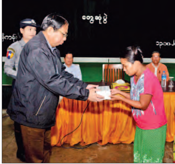
ပြည်ထောင်စုဝန်ကြီး ဒေါက်တာဖေမြင့် ကျဆုံး၊ ဒဏ်ရာရရှိသည့်တပ်ဖွဲ့ဝင်များအတွက် ၎င်းတို့မိသားစုဝင်တစ်ဦးအား ထောက်ပံ့ငွေပေးအပ်စဉ်။ (သတင်းစဉ်)

များ၊ ပြည်နယ်ဝန်ကြီးချုပ်နှင့် ဒုတိယဝန်ကြီးများက အောက်တိုဘာ ၉ ရက်ဖြစ်စဉ်တွင် ကျဆုံး၊ ဒဏ်ရာရရှိသည့်တပ်ဖွဲ့ဝင်များအတွက် ၎င်းတို့၏ မိသားစုဝင်များအား ထောက်ပံ့ငွေများ ပေးအပ်ခဲ့သည်။ ယနေ့တွင် ကျဆုံးတပ်ဖွဲ့ဝင် ကိုးဦးအတွက် ငွေကျပ် ၂၅၈ ဒသမ ၇၅ သိန်း၊ ဒဏ်ရာရတပ်ဖွဲ့ဝင် ငါးဦးအတွက် ငွေကျပ် ၇၂ ဒသမ ၅ သိန်း စုစုပေါင်း ၃၃၀ ဒသမ ၂၅ သိန်းကို ထောက်ပံ့ပေးအပ်ခဲ့ကြောင်း သိရသည်။ အခမ်းအနား အပြီးတွင် ပြည်ထောင်စုဝန်ကြီးများနှင့် အဖွဲ့သည် တပ်ဖွဲ့ဝင်များ၊ မိသားစုများအား ရင်းရင်းနှီးနှီးနှုတ်ဆက်အားပေးခဲ့ကြသည်။ ယင်းနောက် ပြည်ထောင်စုဝန်ကြီးများနှင့်အဖွဲ့သည် ဌာနချုပ်အတွင်း လှည့်လည် ကြည့်ရှုလေ့လာခဲ့ကြသည်။ (သတင်းစဉ်)