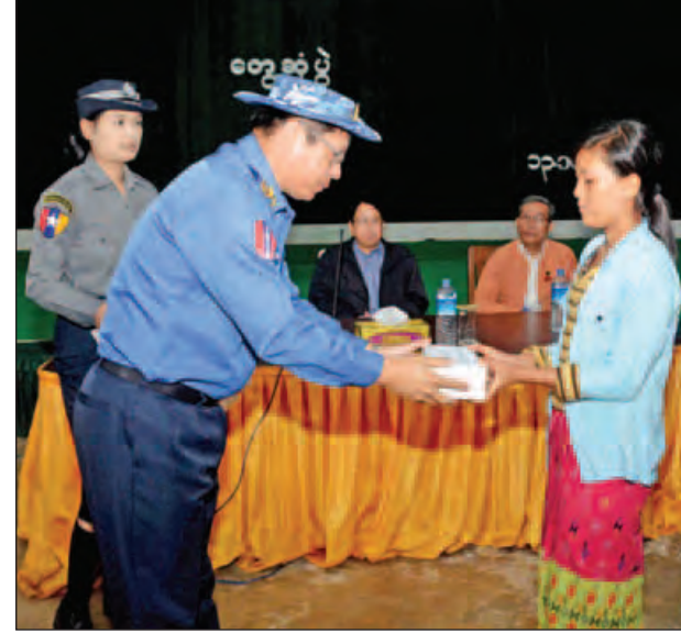
ဒုတိယဝန်ကြီး ဗိုလ်ချုပ်မြင့်နွယ် ကျဆုံး၊ ဒဏ်ရာရရှိသည့်တပ်ဖွဲ့ဝင်များအတွက် ၎င်းတို့မိသားစုဝင်တစ်ဦးအား ထောက်ပံ့ငွေပေးအပ်စဉ်။ (သတင်းစဉ်)