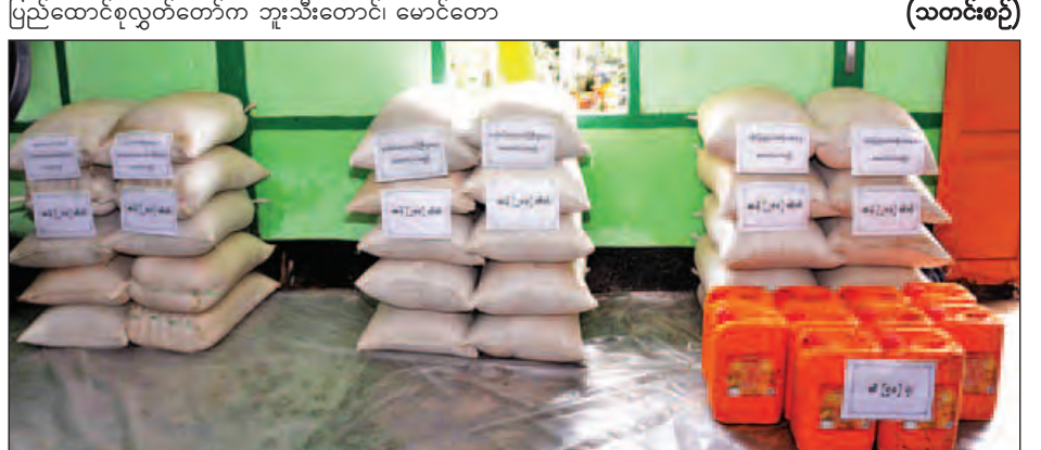
ပြည်ထောင်စုအစိုးရအဖွဲ့မှ ထောက်ပံ့မည့် စားသောက်ကုန်ပစ္စည်းများအား တွေ့ရစဉ်။