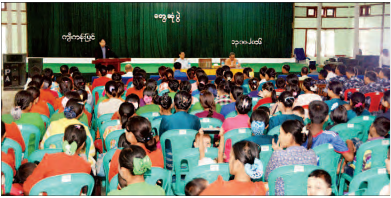
ပြည်ထောင်စုဝန်ကြီးများနှင့်အဖွဲ့ မောင်တောမြို့နယ် ကျီးကန်းပြင်ကွပ်ကဲမှုဌာနချုပ်မှ ဝန်ထမ်းများ၊ မိသားစုများအား တွေ့ဆုံစဉ်။ (သတင်းစဉ်)

အစီအစဉ်များကို ဆောင်ရွက်သွားမည်ဖြစ်ကြောင်း၊ ရုပ်ဝတ္ထုပစ္စည်းများဖြည့်တင်းခြင်း၊ စိတ်ပိုင်းဆိုင်ရာခွန်အားပြည့်အောင် ထောက်ပံ့ကူညီခြင်းများ ဆောင်ရွက်သွားမည်ဖြစ်ကြောင်း၊ ရန်သူကို အပြီးအပိုင်ချေမှုန်းသွားမည်ဖြစ်ကြောင်း၊ ဤစခန်းရှိ တပ်ဖွဲ့ဝင်များ၊ အိမ်ထောင်သည်များ အနေဖြင့် တပ်မတော်နှင့်ပူးပေါင်းပြီး ရန်သူကို အမြစ်ပြတ်ချေမှုန်းရန် ခွန်သစ်အားသစ်ဖြင့် ရှိစေလိုကြောင်း ပြောကြားသည်။ ပြည်နယ်ဝန်ကြီးချုပ် ဦးညီပုက ယခုဖြစ်စဉ်နှင့်ပတ်သက်၍ စိတ်ဓာတ်ကျဆင်းခြင်း၊ ဝမ်းနည်းမှုဆွေးခြင်းဖြစ်ရန် မလိုကြောင်း၊ နိုင်ငံတော်၏ အတိုင်ပင်ခံပုဂ္ဂိုလ်ကလည်း ဤစခန်းရှိ အမျိုးသမီးများ၊ သက်ကြီးရွယ်အိုများ၊ ကလေးများ၏ လိုအပ်ချက်များကို မေးမြန်းပြီး ဖြည့်ဆည်းဆောင်ရွက်ပေးရန် မှာကြားထားပါကြောင်း ပြောကြားသည်။