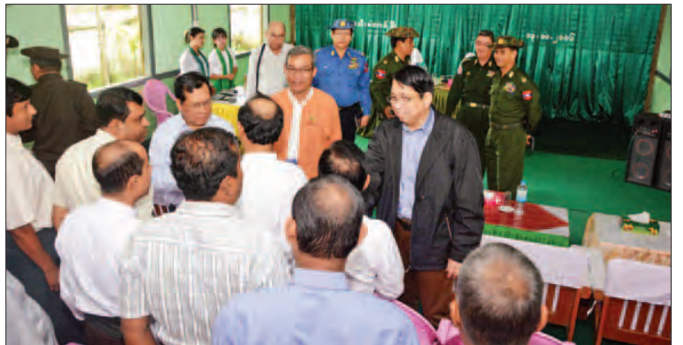
ပြည်ထောင်စုဝန်ကြီးများနှင့်အဖွဲ့ ဘူးသီးတောင်မြို့ပေါ်အနီး ရပ်ကွက်/ကျေးရွာအုပ်စုရှိ အစွလာမ်ဘာသာဝင်များအား တွေ့ဆုံစဉ်။ (သတင်းစဉ်)

ဆက်လက်၍ ပြည်ထောင်စုဝန်ကြီးများနှင့်အဖွဲ့သည် ဘူးသီးတောင်မြို့နယ် ဦးဥက္ကဋ္ဌမခန်းမ၌ မြို့မိမြို့ဖများ၊ ဒေသခံပြည်သူများနှင့် ဌာနဆိုင်ရာဝန်ထမ်းများအား တွေ့ဆုံသည်။