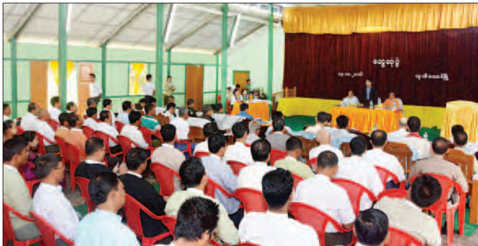
ပြည်ထောင်စုဝန်ကြီးများနှင့်အဖွဲ့ ဘူးသီးတောင်မြို့နယ် မြို့မိမြို့ဖများ၊ ဒေသခံပြည်သူများနှင့် ဌာနဆိုင်ရာ ဝန်ထမ်းများအား တွေ့ဆုံစဉ်။ (သတင်းစဉ်)