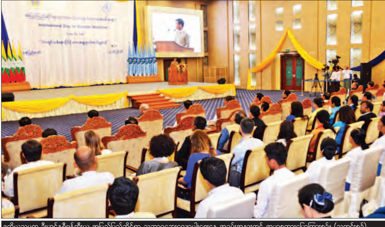
ဒုတိယသမ္မတ ဦးဟင်နရီဗန်ထီးယူ အပြည်ပြည်ဆိုင်ရာ သဘာဝဘေးလျော့ပါးရေးနေ့ အခမ်းအနားတွင် အမှာစကားပြောကြားစဉ်။ (သတင်းစဉ်)

နေပြည်တော် အောက်တိုဘာ ၁၃ ပြီးခဲ့သည့် ၂၅ နှစ်အတွင်း မြန်မာနိုင်ငံတွင် ထိခိုက်ဆုံးရှုံးမှုများသည် ဘေး စုစုပေါင်း(၂၄)ကြိမ်ဖြစ်ပွားခဲ့သည့်အတွက် ပျမ်းမျှတစ်နှစ်လျှင် တစ်ကြိမ်ခန့် ကြီးမားသည့် ဘေးအန္တရာယ်များနှင့် ရင်ဆိုင်ကြုံတွေ့နေရသည်ဟု ဆိုနိုင် ကြောင်း၊ ယခုကဲ့သို့ ဖြစ်ပွားခဲ့သည့်ဘေးများကြောင့် လူဦးရေ လေးသန်းခန့် ဘေးသင့်ခဲ့ရပြီး သဘာဝဘေးကြောင့် ပျက်စီးဆုံးရှုံးမှုတန်ဖိုး စုစုပေါင်း အမေရိကန်ဒေါ်လာ ၄ ဒသမ ၇ ဘီလီယံခန့်ရှိခဲ့ကြောင်း ဒုတိယသမ္မတ ဦးဟင်နရီဗန်ထီးယူက သဘာဝဘေးလျော့ပါးရေးနေ့ အခမ်းအနားတွင် ပြောကြားလိုက်သည်။