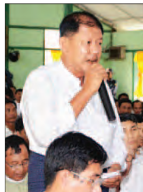
မြို့မိမြို့ဖ ဦးညီညီ