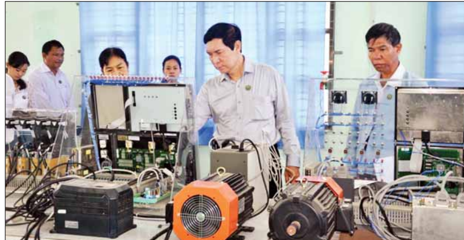
သို့ ရောက်ရှိပြီး စက်ရုံမှထုတ်လုပ်ထားသည့် Turbine, Generator နှင့် Mini Hydro Turbine များကို လည်းကောင်း ဆေးရုံသုံးဆောင်မှုများထုတ်လုပ်နေမှုအခြေအနေတို့ကို လှည့်လည်ကြည့်ရှုစစ်ဆေးပြီး ထုတ်ကုန် ပစ္စည်းများသည် ခိုင်ခံ့ပြီး လှပသေသပ်ကောင်းမွန်သည့် ပစ္စည်းများဖြစ်ရေး အထူးအလေးထားဆောင်ရွက်ရန်လို ကြောင်း၊ မိမိစက်ရုံမှထုတ်လုပ်သည့် ပစ္စည်းများကို သုံးစွဲသူများ ယုံယုံကြည်ကြည်နှင့် သုံးစွဲနိုင်ရေးအားမခံနိုင် ရမည်ဖြစ်ကြောင်း၊ ဈေးကွက်ကို မျက်ခြည်မပြတ်စောင့်ကြည့်၍ ဈေးကွက်လိုအပ်ချက်အတိုင်း ထုတ်လုပ်နိုင်ရေးစီမံဆောင်ရွက် ထားရန်မှာကြားခဲ့ကြောင်း သတင်းရရှိသည်။ (သတင်းစဉ်)

အင်ဂျင်များကို လည်းကောင်း၊ ထုတ်လုပ်ပြီး အင်ဂျင်များ စမ်းသပ်နေမှုအခြေအနေတို့ကို လည်းကောင်း လှည့်လည် ကြည့်ရှုစစ်ဆေးခဲ့သည်။ ထို့နောက် အမှတ်(၁၅)အကြီးစားစက်ရုံ (သာဂရ) သို့ ရောက်ရှိပြီး Machine Process Workshop, Assembly Workshop, Metal Forming Workshop နှင့် ထုတ်လုပ်ပြီး ဈေးကွက်သို့တင်ပို့ရောင်းချရန် အသင့်ဖြစ်နေသည့် မြေထိုးစက်(Bulldozer)များ၊ မြေတူးစက် (Excavator)များ၊ တုန်ခါလမ်းကြိုစက်(Vibrator Soil Compactor) များ၊ အသေးစား မြေတူးစက် (Mini Excavator)များကို လှည့်လည်ကြည့်ရှုစစ်ဆေးပြီး စက်ရုံရှိ စက်ပစ္စည်းများကို အကျိုးရှိစွာအသုံးပြုနိုင်ရေးအတွက် ပုဂ္ဂလိကလုပ်ငန်းရှင်များမှ လာရောက်လုပ်ငန်းအပ်နှံ ဆောင်ရွက်နိုင်ရေး ချိတ်ဆက်ဆောင်ရွက်သွားရန်နှင့် လုပ်ငန်းလိုအပ်ချက်များကို မှာကြားသည်။ ဆက်လက်၍ အမှတ်(၂၆)အကြီးစားစက်ရုံ (သာဂရ)