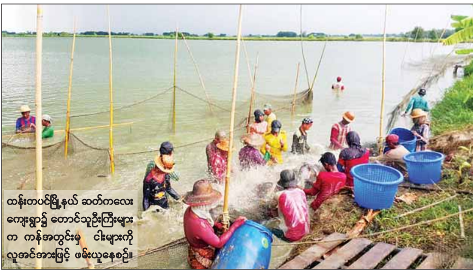
ထန်းတပင်မြို့နယ် ဆတ်ကလေး တွေးရွာ၌ တောင်သူဦးကြီးများက ကန်အတွင်းမှ ငါးများကို လူအင်အားဖြင့် ဖမ်းယူနေစဉ်။

ရန် သဘောတူညီပြီးဖြစ်သော မစ္စ တူနယ် တီးနပ်(စ်)သည် ယနေ့မွန်းလွဲ ၂ နာရီတွင် လည်းကောင်း၊ ရုရှားဖက်ဒရေးရှင်းနိုင်ငံ သံအမတ်ကြီးအဖြစ်ခန့်အပ်ရန် သဘောတူညီပြီး ဖြစ်သော မစ္စတာ နီကိုလိုင် လစ်တိုပါဒေါ့ပ်သည် တမျက်နှာ ၃ ကော်လံ ၁ သို့