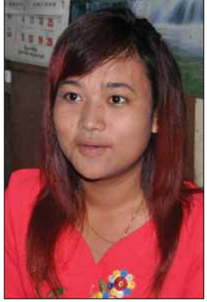
မဖြိုးသန္တာထက်