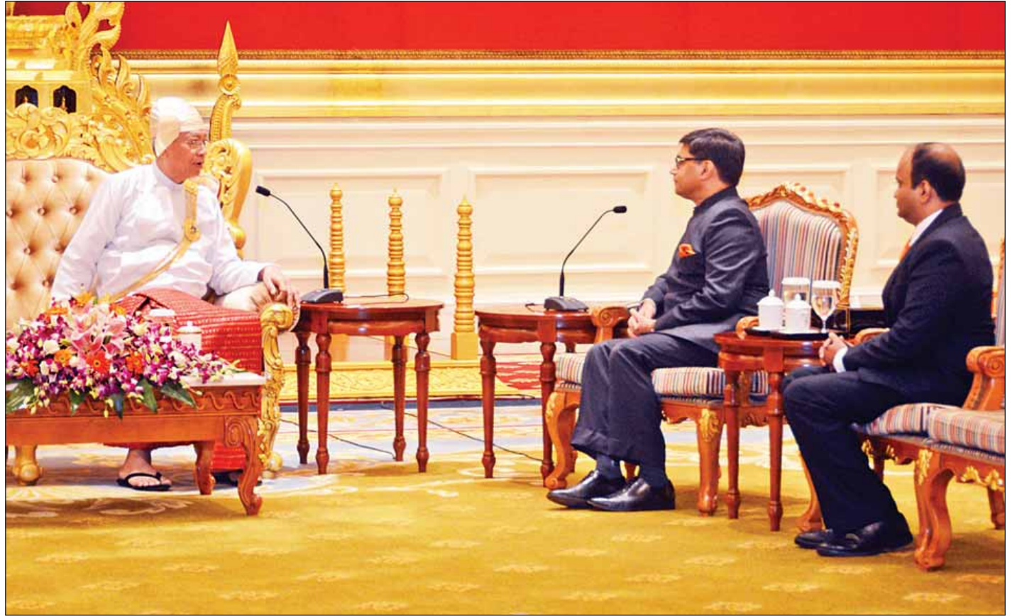
နိုင်ငံတော်သမ္မတ ဦးထင်ကျော်နှင့် အိန္ဒိယသမ္မတနိုင်ငံ သံအမတ်ကြီး မစ္စတာ ဗစ်ခရမ်မစ်ဆရီတို့ ရင်းရင်းနှီးနှီး တွေ့ဆုံကြစဉ်။ (သတင်းစဉ်)