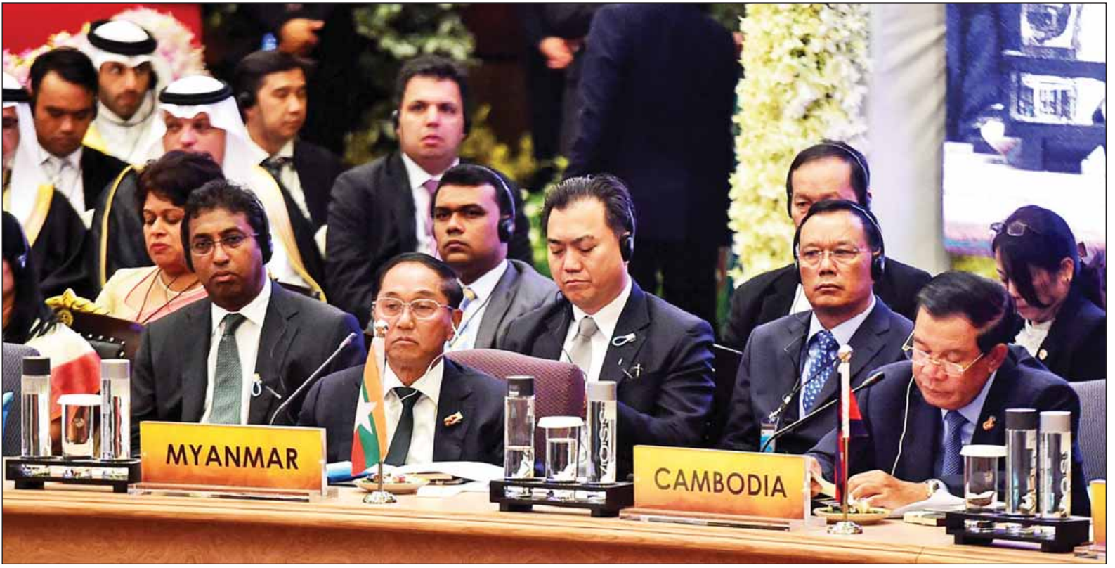
ဒုတိယသမ္မတ ဦးမြင့်ဆွေ ဒုတိယအကြိမ် အာရှပူးပေါင်းဆောင်ရွက်ရေးဆွေးနွေးပွဲ(အေစီဒီ)သို့ တက်ရောက်စဉ်။

ဗန်ကောက် အောက်တိုဘာ ၁၀ ဒုတိယအကြိမ် အာရှပူးပေါင်းဆောင်ရွက်ရေးဆွေးနွေးပွဲ(အေစီဒီ)ကို ယနေ့ နံနက်ပိုင်းတွင် ထိုင်းနိုင်ငံ ဗန်ကောက် မြို့ရှိ နိုင်ငံခြားရေးဝန်ကြီးဌာန၌ ကျင်းပရာ ပြည်ထောင်စုသမ္မတမြန်မာ နိုင်ငံတော် ဒုတိယသမ္မတဦးမြင့်ဆွေ တက်ရောက်သည်။ ဒေသစံတော်ချိန် နံနက် ၁၀ နာရီ တွင် ဒုတိယသမ္မတ ဦးမြင့်ဆွေသည် အေစီဒီ အဖွဲ့ဝင်နိုင်ငံများမှ အကြီးအကဲများနှင့်အတူ ထိပ်သီးအစည်းအဝေးကျင်းပမည့် ထိုင်းနိုင်ငံခြားရေးဝန်ကြီးဌာနသို့ ရောက်ရှိကြရာ ဝန်ကြီးချုပ် ဗိုလ်ချုပ်ကြီးပရာယုဒ် ချန်အိုချာက ခင်မင်ရင်းနှီးစွာကြိုဆို နှုတ်ဆက်ပြီး မှတ်တမ်းတင်စာတံပုံ ရိုက်ကြသည်။ ယင်းနောက် အေစီဒီ ထိပ်သီးအစည်းအဝေးဖွင့်ပွဲအခမ်းအနားကို ကျင်းပရာ ကုလသမဂ္ဂအတွင်းရေးမှူးချုပ် မစ္စတာ ဘန်ကီမွန်း၏ ကြိုဆိုဂုဏ်ပြုနှုတ်ခွန်းဆက် ပီဒီယိုအသံဖိုင်ကို ဖွင့်လှစ်ပြီး အစည်းအဝေးသဘာပတိ ထိုင်းနိုင်ငံဝန်ကြီးချုပ်က အဖွင့် အမှာစကားပြောကြားသည်။ စာမျက်နှာ ၈ ကော်လံ ၁ သို့ ☆