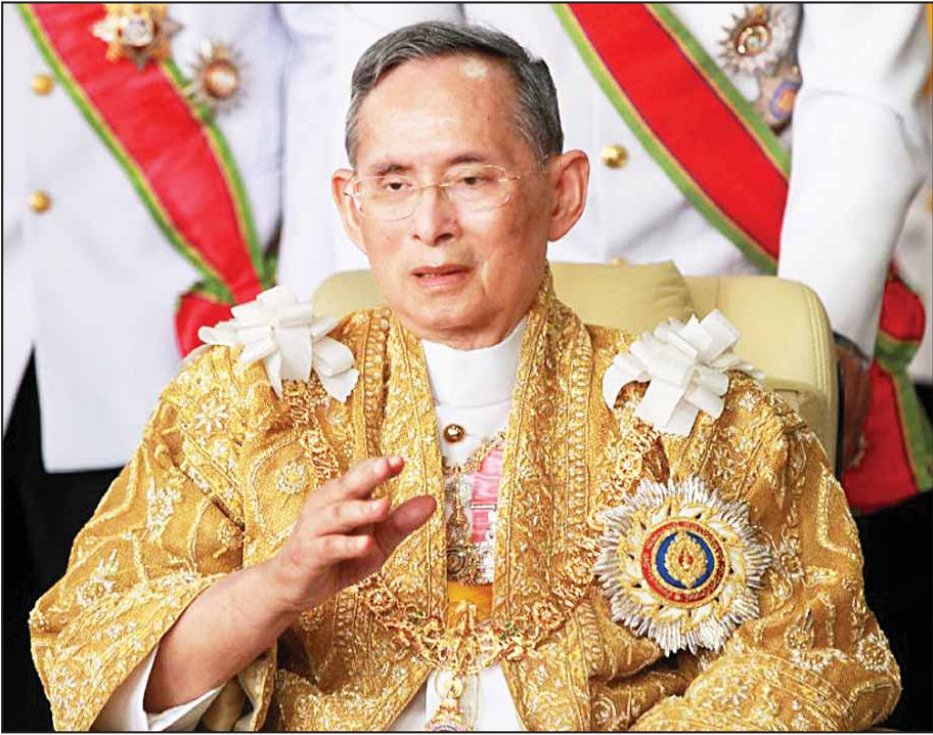
ထိုင်းဘုရင်သည် ထိုင်းပြည်သူတို့၏ အလေးအမြတ်ထားခံရသည့် ဘုရင်တစ်ပါးဖြစ်သည်။ ထိုင်းနိုင်ငံ၏ နိုင်ငံရေးအကျပ်အတည်းကာလတွင် စည်းလုံးညီညွတ်ရေးအတွက် ထိုင်းဘုရင်သည် အဓိကကျသည့် အခန်းကဏ္ဍမှ အရေးပါခဲ့သည်။

ထိုင်းနိုင်ငံ၏ ဖွဲ့စည်းပုံအခြေခံဥပဒေတွင် ဘုရင်က ၎င်း၏တာဝန်ဝတ္တရားများကို ထမ်းဆောင်နိုင်ခြင်းမရှိသည့်အချိန်တွင် ဘုရင်ကိုယ်စားအုပ်စိုးသူ (ရင်ခွင်ပိုက် အုပ်စိုးသူ) တစ်ဦးကို ခန့်အပ်ပိုင်ခွင့်ရှိသည်ဟု ပြဋ္ဌာန်းထားသည်။