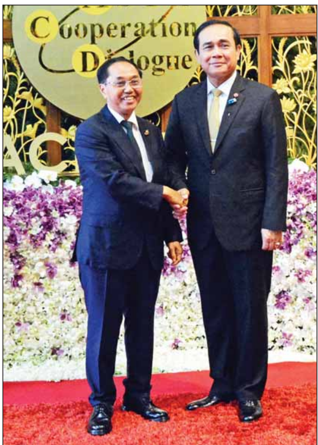
ဒုတိယသမ္မတ ဦးမြင့်ဆွေအား ထိုင်းနိုင်ငံဝန်ကြီးချုပ် ဗိုလ်ချုပ်ကြီး ပရာယုဒ် ချန်အိုချာ ကြိုဆိုနှုတ်ဆက်စဉ်။

အေစီဒီသည် စည်းကမ်းဘောင်များ တင်းကျပ်စွာချမှတ်ပြီး တရားဝင်ဖွဲ့စည်းထားသည့် နိုင်ငံရေးဆိုင်ရာ အဖွဲ့အစည်းမျိုးမဟုတ်ဘဲ အဖွဲ့ဝင်နိုင်ငံ