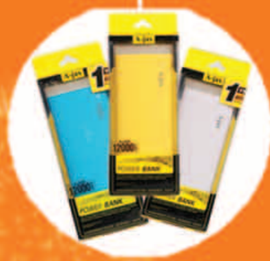
Power Bank (12,000 mAh)