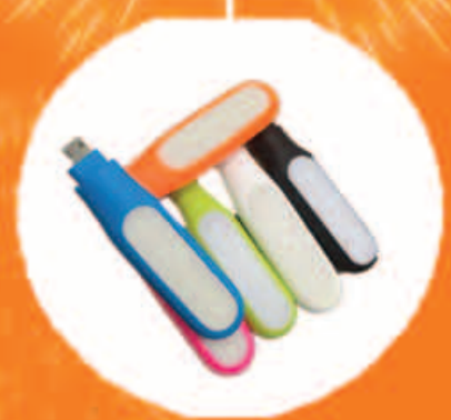
LED phone torch