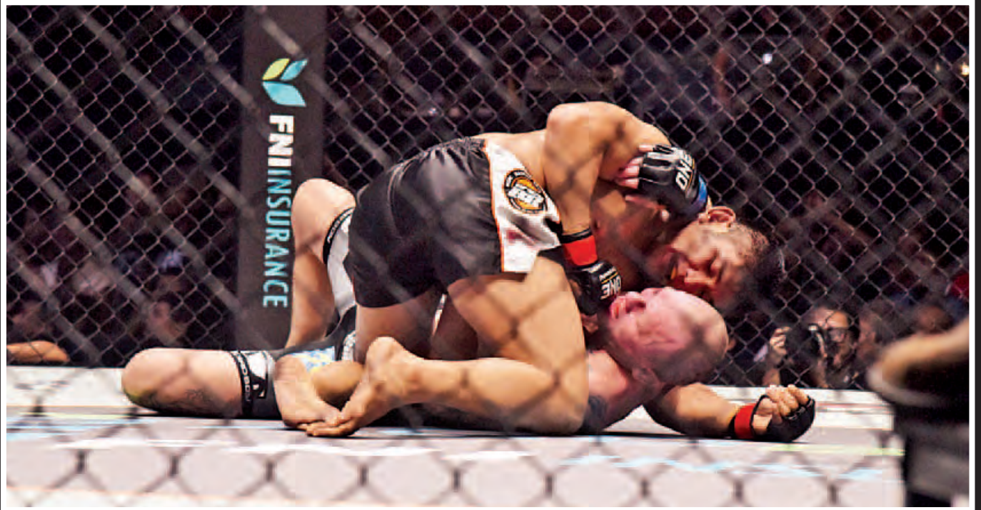
ကချင်တိုင်းရင်းသား အောင်လအန်ဆန်နှင့် ပြိုင်ဘက် ပိုလန်နိုင်ငံသား ပတ်စ်တာနက်ခ်တို့ ယှဉ်ပြိုင်ထိုးသတ်စဉ်။