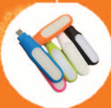
LED Phone torch