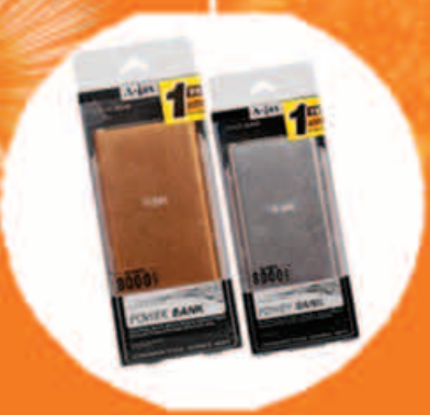
Power Bank (8,000 mAh)