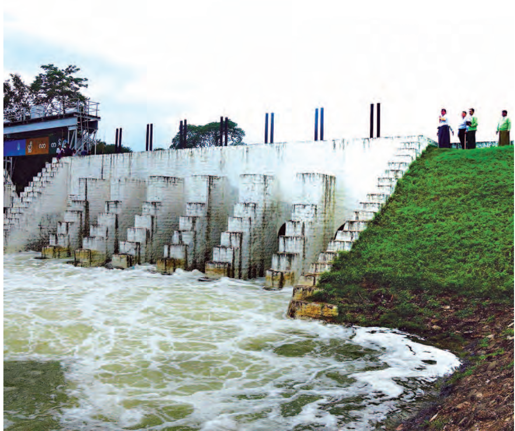
အထူးတွင်ရှိပြီး မိတ္ထီလာကန်ရှိ ရေ ကျော်ခုနစ်ပေါက် ရေလွှတ်တံခါးမှ နှစ်ပေခွဲခန့် ကန်ရေလွှတ်ထားပေးသော်လည်း မိုးနေ့စဉ်ရွာသွန်းပြီး ကန်အတွင်းသို့ ရေဝင်ချောင်းများမှ စီးဝင်ရေများ နေ့စဉ်ဝင်ရောက်နေမှုကြောင့် ကန်ရေမှာ သိသိသာသာလျော့နည်းသွားခြင်း မရှိသေးကြောင်း သိရသည်။