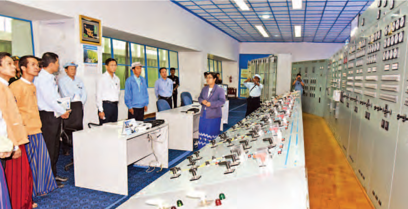
ဒုတိယသမ္မတ ဦးဟင်နရီဗန်ထီးယူ ဘီလူးချောင်း အမှတ်(၂) ရေအားလျှပ်စစ်ဓာတ်အားပေးစက်ရုံရှိ လျှပ်စစ်ဓာတ်အားထုတ်လုပ်ပေးနေမှုကို လှည့်လည်ကြည့်ရှုစဉ်။ (သတင်းစဉ်)

နေပြည်တော် အောက်တိုဘာ ၅ ကယားပြည်နယ် လျှိုင်ကော်မြို့နယ်တွင် ရောက်ရှိနေ သည့် ဒုတိယသမ္မတ ဦးဟင်နရီဗန်ထီးယူသည် ပြည်နယ် ဝန်ကြီးချုပ်၊ ပြည်နယ်လွှတ်တော်ဥက္ကဋ္ဌ၊ ဒုတိယဝန်ကြီး များ၊ တာဝန်ရှိသူများနှင့်အတူ ယနေ့နံနက် ၇ နာရီတွင် လျှိုင်ကော်မြို့နယ်ရှိ ဘီလူးချောင်းအမှတ်(၂)နှင့် အမှတ် (၃) ရေအားလျှပ်စစ်ဓာတ်အားပေးစက်ရုံများ၏ လျှပ်စစ် ဓာတ်အား ထုတ်လုပ်ပေးနေမှုကို လှည့်လည်ကြည့်ရှု စစ်ဆေးသည်။ ရှေးဦးစွာဒုတိယသမ္မတနှင့်အဖွဲ့ဝင်များအား ဘီလူး ချောင်း အမှတ်(၂) ရေအားလျှပ်စစ်ဓာတ်ရုံ၏ ပင်မ ရှင်းလင်းဆောင်ရွက် လျှပ်စစ်ဓာတ်အားထုတ်လုပ်ရေး လုပ်ငန်း ဒုတိယဦးဆောင်ညွှန်ကြားရေးမှူး ဦးခင်မောင်လေး က ဘီလူးချောင်း ရေအားလျှပ်စစ်ဓာတ်အားပေးစက်ရုံ များ၏ စက်တပ်ဆင်အင်အား၊ ဓာတ်အားထုတ်ယူနိုင်မှု၊ ဓာတ်အားဖြန့်ဖြူးပေးမှု အခြေအနေများကို ရှင်းလင်း တင်ပြရာ လျှပ်စစ်နှင့် စွမ်းအင်ဝန်ကြီးဌာန ဒုတိယဝန်ကြီး ဒေါက်တာထွန်းနိုင်က ဖြည့်စွက်ရှင်းလင်းတင်ပြသည်။ တင်ပြချက်များအပေါ် ဒုတိယသမ္မတက သိရှိလို သည်များကို မေးမြန်းဆွေးနွေးပြီး နိုင်ငံစီးပွားရေး ဖွံ့ဖြိုး တိုးတက်မှု၏ အဓိကအခြေခံဖြစ်သည့် လျှပ်စစ်စွမ်းအား အပြည့်အဝ အသုံးပြုနိုင်ရေးသည် အရေးကြီးပါကြောင်း၊ စာမျက်နှာ ၈ ကော်လံ ၁ သို့