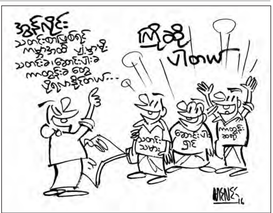
သီဟကိုကို(မန္တလေး)