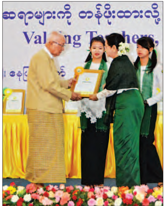
နိုင်ငံတော်သမ္မတ၏ဇနီး ဒေါ်စုစုလွင် ၂၀၁၆ ခုနှစ် ကမ္ဘာ့ဆရာများနေ့ အခမ်းအနားတွင် ဂုဏ်ထူးဆောင်ပုဂ္ဂိုလ်တစ်ဦးအား ဂုဏ်ပြုဆုချီးမြှင့်စဉ်။ (သတင်းစဉ်)

အခမ်းအနားသို့ အမျိုးသားပညာရေးမူဝါဒကော်မရှင်ဥက္ကဋ္ဌနှင့် အဖွဲ့ဝင် များ၊ ပြည်သူ့လွှတ်တော်နှင့် အမျိုးသားလွှတ်တော်မှ ပညာရေးမြှင့်တင်မှု ကော်မတီဥက္ကဋ္ဌများနှင့်အဖွဲ့ဝင်များ၊ လွှတ်တော်ကိုယ်စားလှယ်များ၊ ကုလသမဂ္ဂ ဆိုင်ရာအဖွဲ့အစည်းများမှ ကိုယ်စားလှယ်များ၊ ယူနက်စကိုနှင့် ဖွံ့ဖြိုးရေး မိတ်ဖက်အဖွဲ့အစည်းများမှ တာဝန်ရှိသူများနှင့် ဖိတ်ကြားထားသူများ တက် ရောက်ကြသည်။ (သတင်းစဉ်)