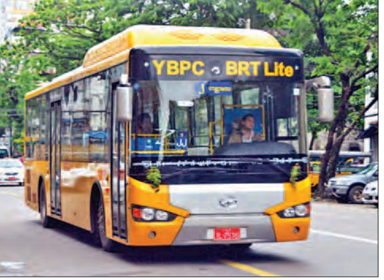
ရန်ကုန်မြို့တွင်း ပြေးဆွဲနေသော BRT Lite ဘတ်စ်ကားတစ်စီးကို တွေ့ရစဉ်။