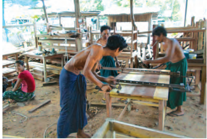
တိမ်တမန်

လက်ရှိကာလတွင် မန္တလေးမြို့ ချမ်းမြ သာစည်မြို့နယ် သင်ပန်းကုန်းမြို့သစ်တွင် လူသုံးများသည့် တန်ဖိုးနည်း ပရိဘောဂ ပစ္စည်းများကို တွင်ကျယ်စွာပြုလုပ်ပြီး ပြန်လည် ရောင်းချလျက်ရှိသည်။