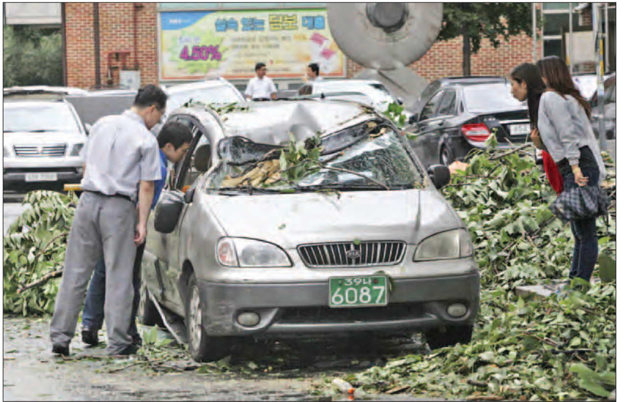
ဆိုးလ် အောက်တိုဘာ ၅

တောင်ကိုရီးယားနိုင်ငံတောင်ပိုင်းဒေသများ၌ ချာဘားဟု အမည်ပေးထားသော အင်အားပြင်း တိုင်ဖွန်းမုန်တိုင်း တိုက်ခတ်ခဲ့ရာ လူသုံးဦးထက်မနည်းသေဆုံးပြီး ပင်လယ်ဆိပ်ကမ်းမြို့ကြီးဖြစ်သော ဘူဆန်မြို့၌ ရေလွှမ်းမိုးမှုဖြစ်ပွားလျက်ရှိကြောင်း ဒေသဆိုင်ရာ သတင်းဌာနများက အောက်တိုဘာ ၅ ရက်တွင် သတင်းထုတ်ပြန်သည်။