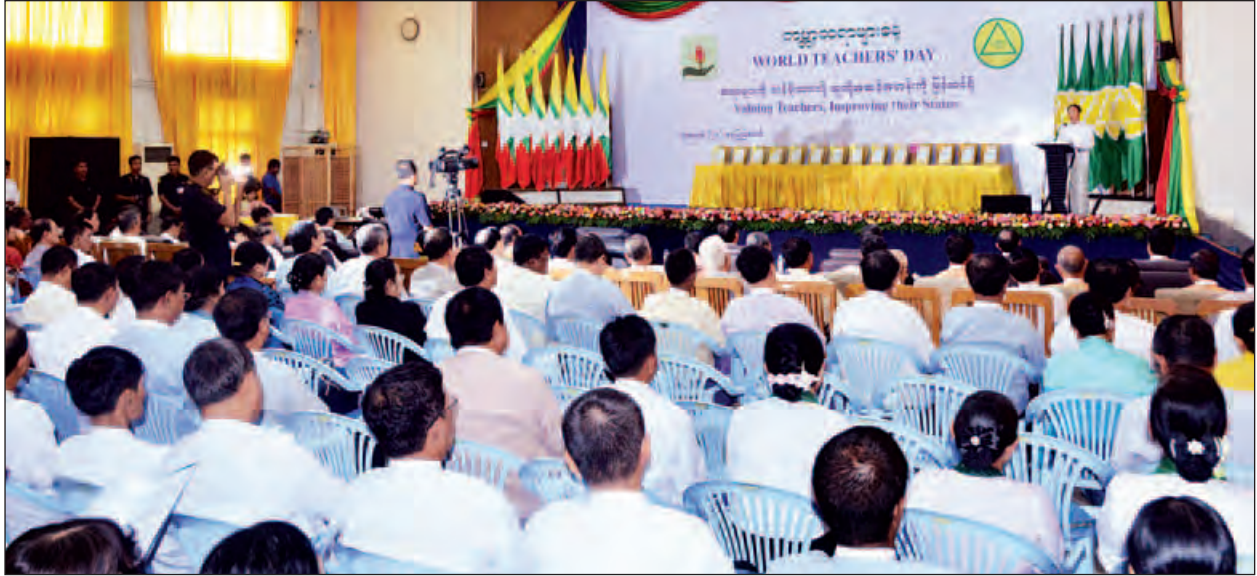
ဒုတိယသမ္မတ ဦးမြင့်ဆွေ ကမ္ဘာ့ဆရာများနေ့ အထိမ်းအမှတ်အခမ်းအနားတွင် အမှာစကားပြောကြားစဉ်။ (သတင်းစဉ်)