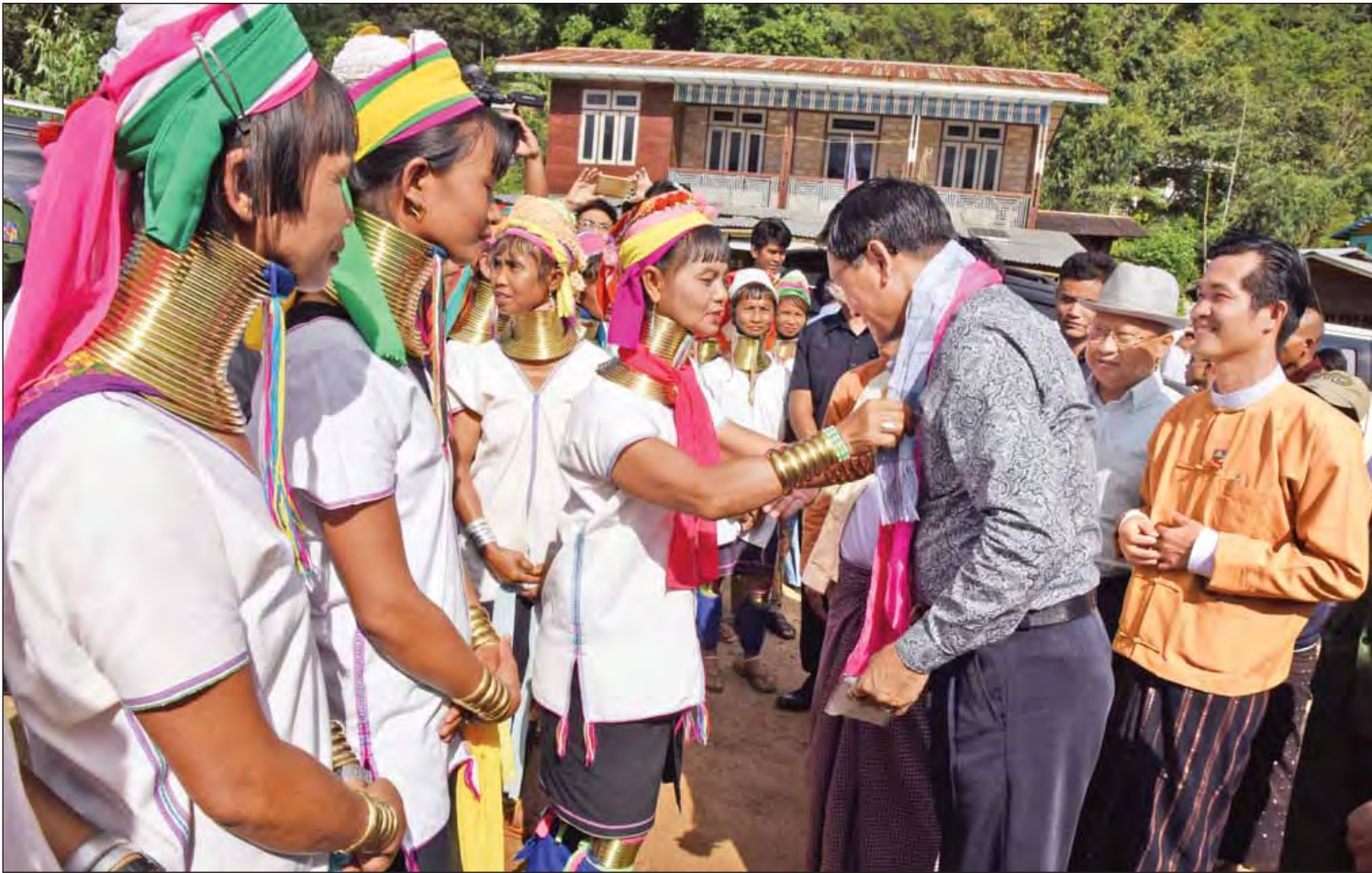
ဒုတိယသမ္မတ ဦးဟင်နရီဗန်ထီးယူ ကယန်း(ပဒေါင်) တိုင်းရင်းသားများနှင့် ရင်းရင်းနှီးနှီး တွေ့ဆုံစဉ်။ (သတင်းစဉ်)

ကျောက်မျက်ထွက်ကုန်အပေါ် ပိတ်ဆို့အရေးယူမှု ပယ်ရှားနိုင် နှစ်နိုင်ငံ တိုက်ရိုက်ကုန်သွယ်မှု ပြန်လည်တည်ထောင်ရန် အမေရိကန်ပညာရှင်များ မှတ်ချက်ပြု