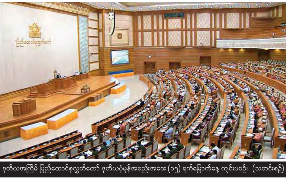
ဒုတိယအကြိမ် ပြည်ထောင်စုလွှတ်တော် ဒုတိယပုံမှန်အစည်းအဝေး (၁၅) ရက်မြောက်နေ့ ကျင်းပစဉ်။ (သတင်းစဉ်)

ယခု နောက်ဆက်တွဲစာချုပ်ကို အာဆီယံအဖွဲ့ဝင် ၁၀ နိုင်ငံအနက် ဘရူနိုင်းဒါရူဆလမ်နိုင်ငံ၊ ကမ္ဘော ဇီးယားနိုင်ငံ၊ အင်ဒိုနီးရှားနိုင်ငံ၊ ထိုင်းနိုင်ငံ၊ ဗီယက်နမ် ဆိုရှယ်လစ်သမ္မတနိုင်ငံနှင့် လာအိုပြည်သူ့ဒီမိုကရက်တစ် သမ္မတနိုင်ငံတို့က အတည်ပြုဝင်ရောက်ပြီးဖြစ်ကြောင်း၊ မြန်မာနိုင်ငံ၊ မလေးရှားနိုင်ငံ၊ ဖိလစ်ပိုင်နိုင်ငံနှင့် စင်ကာပူ နိုင်ငံတို့ အတည်ပြုရန် ကျန်ရှိနေပါကြောင်း၊ အတည်ပြု