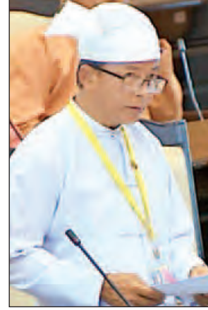
ဒုတိယဝန်ကြီး ဒေါက်တာထွန်းဝင်း

ထို့ပြင် ဒုတိယဝန်ကြီးက ၂၀၁၂ ခုနှစ်၊ မြေလွတ်၊ မြေလပ်နှင့် မြေရိုင်းများ နည်းဥပဒေအရ မြေလွတ်၊ မြေလပ်နှင့် မြေရိုင်းများ စီမံခန့်ခွဲရေးဥပဒေပြဋ္ဌာန်းမီ မြေလွတ်၊ မြေလပ်နှင့် မြေရိုင်းများ လုပ်ပိုင်ခွင့်၊ အသုံးပြုခွင့်ရရှိထားသူသည် မူလခွင့်ပြုကာလအတွင်း သတ်မှတ်ထားသည့် စည်းကမ်းချက်များနှင့်အညီ လုပ်ငန်းဆောင်ရွက်ရန် ပျက်ကွက်လျှင် သို့မဟုတ် စည်းကမ်းချက်ကို ချိုးဖောက်လျှင် တင်သွင်းထားသော အာမခံကြေးကို နိုင်ငံတော်ဘဏ္ဍာငွေအဖြစ် သိမ်းဆည်းခြင်းခံရမည်အပြင် လုပ်ပိုင်ခွင့်၊ အသုံးပြုခွင့်ကို ပြန်လည်ရုပ်သိမ်းခြင်း ခံရမည်ဟု ပြဋ္ဌာန်းထားပါကြောင်း။