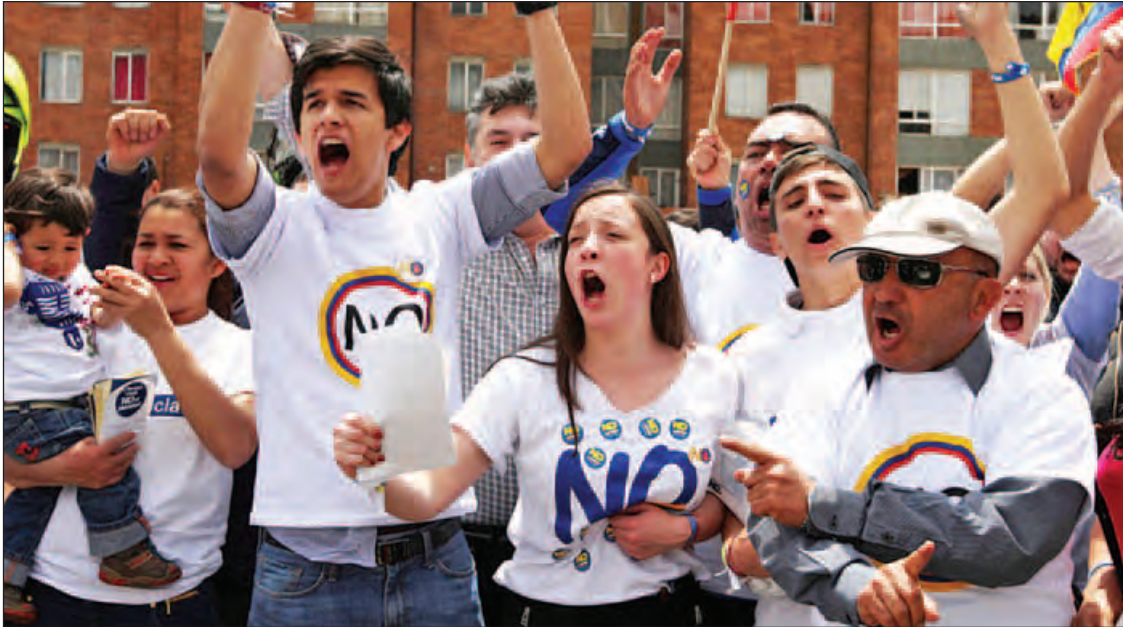
မည်ဖြစ်ကြောင်း ပြောကြားသည်။

ကိုလံဘီယာသမ္မတ ဂျူအန်မန်နီရယ် ဆန်းတို့က ဆန္ဒမဲရလဒ်ကို လက်ခံကြောင်း သို့သော် ၎င်း၏သမ္မတသက်တမ်းနောက်ဆုံး အချိန်ထိ ငြိမ်းချမ်းရေးကို ထိန်းသိမ်းသွား