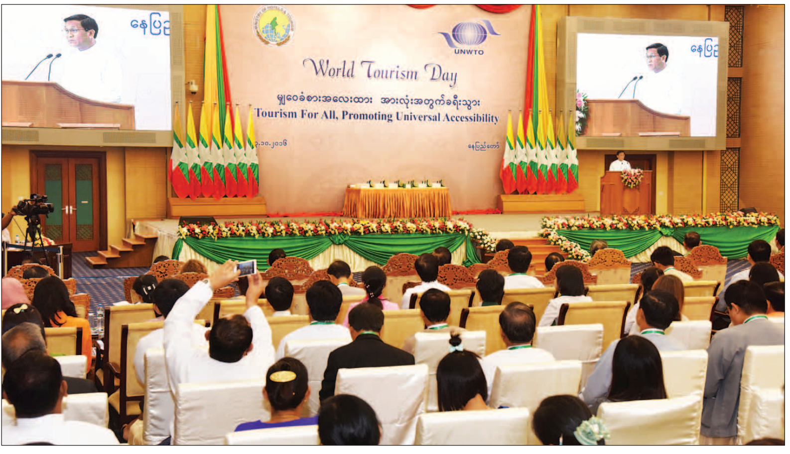
ဒုတိယသမ္မတ ဦးဟင်နရီပန်ထီးယူ ၂၀၁၆ ခုနှစ် ကမ္ဘာ့ခရီးသွားလုပ်ငန်းနေ့အခမ်းအနားတွင် အမှာစကားပြောကြားစဉ်။ (သတင်းစဉ်)

နေပြည်တော် အောက်တိုဘာ ၃ ခရီးသွားလုပ်ငန်းတွင် ပါဝင်ပတ်သက်သည့်သူများအားလုံး တာဝန်ခံမှု၊ တာဝန်ယူမှုအပြည့်ဖြင့် လုပ်ဆောင်နေသမျှ ခရီးသွားလုပ်ငန်းသည် ဆက်လက်ဖွံ့ဖြိုးတိုးတက်နေမည်ဖြစ်ကြောင်း ဒုတိယသမ္မတ ဦးဟင်နရီ ပန်ထီးယူက ယနေ့နံနက် ၉ နာရီတွင် နေပြည်တော်ရှိ မြန်မာအပြည်ပြည်ဆိုင်ရာကွန်ဗင်းရှင်းဗဟိုဌာန-၂ (MI CC-2) ၌ ကျင်းပသည့် ၂၀၁၆ ခုနှစ် ကမ္ဘာ့ခရီးသွားလုပ်ငန်းနေ့ အခမ်းအနားတွင် ပြောကြားသည်။