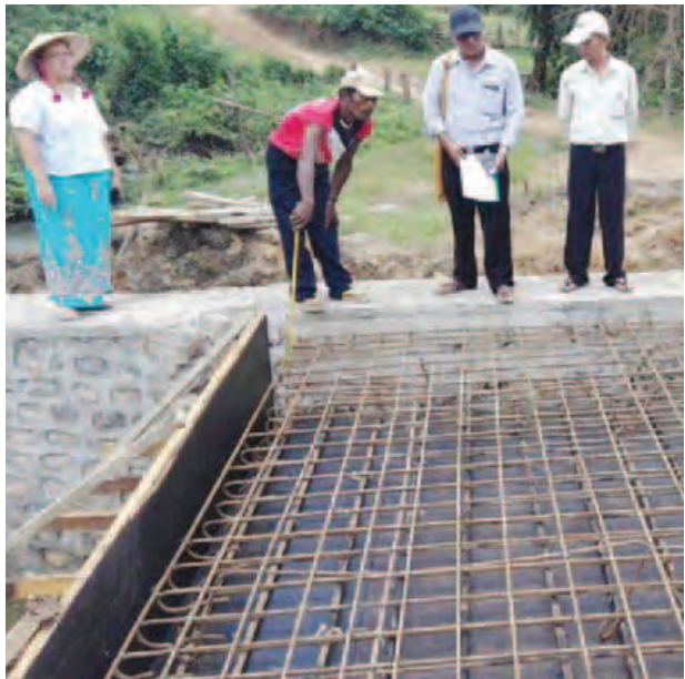
ကွန်ဟိန်း အောက်တိုဘာ ၃

ရှမ်းပြည်နယ်တောင်ပိုင်း ကွန်ဟိန်းမြို့နယ် ကျေးလက်ဒေသဖွံ့ဖြိုးတိုးတက်ရေး ဦးစီးဌာန၏ ၂၀၁၆-၂၀၁၇ ခု ဘဏ္ဍာရေးနှစ် ငွေလုံးငွေရင်းရန်ပုံငွေကျပ် ၁၁ ဒသမ ၉၉ သန်းဖြင့် အလျား ၁၅ ပေ၊ အကျယ် ၁၈ ပေ သံကူကွန်ကရစ် တံတားတစ်စင်းကို ဝိန်းစီးကျေးရွာ၌ တည်ဆောက်ပေးလျက်ရှိကြောင်း သိရသည်။