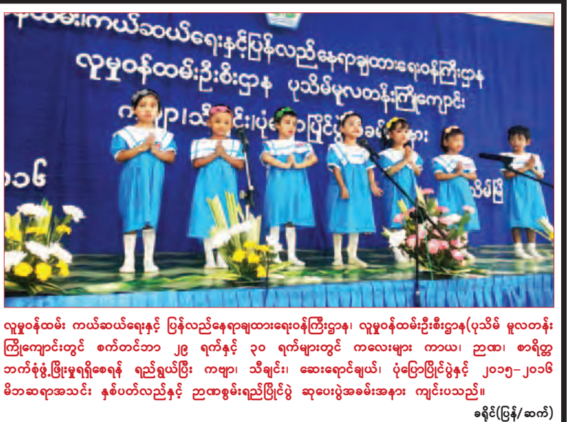
လူမှုဝန်ထမ်း ကယ်ဆယ်ရေးနှင့် ပြန်လည်နေရာချထားရေးဝန်ကြီးဌာန၊ လူမှုဝန်ထမ်းဦးစီးဌာန(ပုသိမ် မူလတန်း ကြီးကျောင်းတွင် စက်တင်ဘာ ၂၉ ရက်နှင့် ၃၀ ရက်များတွင် ကလေးများ ကာယ၊ ဉာဏ်၊ စာရိတ္တ ဘက်စုံဖွံ့ဖြိုးမှုရရှိစေရန် ရည်ရွယ်ပြီး ကဗျာ၊ သီချင်း၊ ဆေးရောင်ချယ်၊ ပုံပြောပြိုင်ပွဲနှင့် ၂၀၁၅-၂၀၁၆ မိဘဆရာအသင်း နှစ်ပတ်လည်နှင့် ဉာဏစွမ်းရည်ပြိုင်ပွဲ ဆုပေးပွဲအခမ်းအနား ကျင်းပသည်။ ခရိုင်(မြန်/ဆန်)