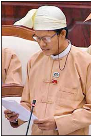
ဦးကျော်အောင်လွင်

နေကြရခြင်းဖြစ်ပါကြောင်း ပြည်ထောင်စုဝန်ကြီးက ဆွေးနွေးပြောကြားသည်။ ဆက်လက်၍ ပြည်ထောင်စုဝန်ကြီးက နိုင်ငံတော်အစိုးရသည် ပြည်ပသို့ ရောက်ရှိအလုပ်လုပ်ကိုင်လျက်ရှိသော မြန်မာအလုပ်သမားများအား သက်ဆိုင်ရာနိုင်ငံ၏ ဥပဒေနှင့်အညီ အကာအကွယ်နှင့် ခံစားခွင့်များရရှိစေရေး၊ အလုပ်သမားရေးရာကွက်အခြေအနေကို လေ့လာနိုင်ရေးနှင့် နှစ်နိုင်ငံအလုပ်သမားရေးရာကွက်စွာရပ်များကို ထိရောက်စွာပူးပေါင်းဖြေရှင်းဆောင်ရွက်နိုင်ရေး တို့အတွက် မလေးရှား၊ ကိုရီးယားနှင့် ထိုင်းနိုင်ငံများတွင် အလုပ်သမားသံအရာရှိများ ခန့်ထားပြီး သက်ဆိုင်ရာမြန်မာသံအမတ်ကြီး၏ ကြီးကြပ်ကွပ်ကဲမှုဖြင့် သံရုံးမှ တာဝန်ရှိသူများနှင့်အတူ ဆောင်ရွက်ပေးလျက်ရှိသကဲ့သို့ အလုပ်သမားသံအရာရှိ မရှိသည့်နိုင်ငံများတွင် ယင်းနိုင်ငံများရှိ မြန်မာသံရုံးများမှ တာဝန်ယူဆောင်ရွက်ပေးလျက်ရှိပါကြောင်း။