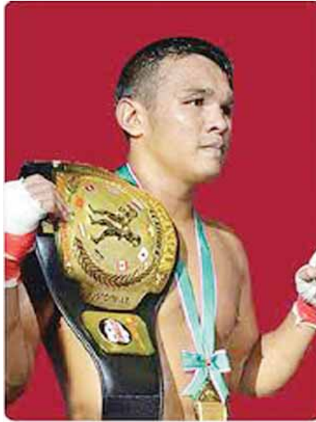
ထွန်းထွန်းမင်း(မြန်မာ)