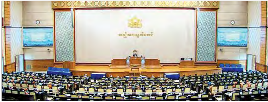
ဒုတိယအကြိမ် အမျိုးသားလွတ်တော် ဒုတိယပုံမှန်အစည်းအဝေး (၄၀)ရက်မြောက်နေ့ ကျင်းပစဉ်။

ယနေ့ကျင်းပသည့် ဒုတိယအကြိမ် အမျိုးသားလွတ်