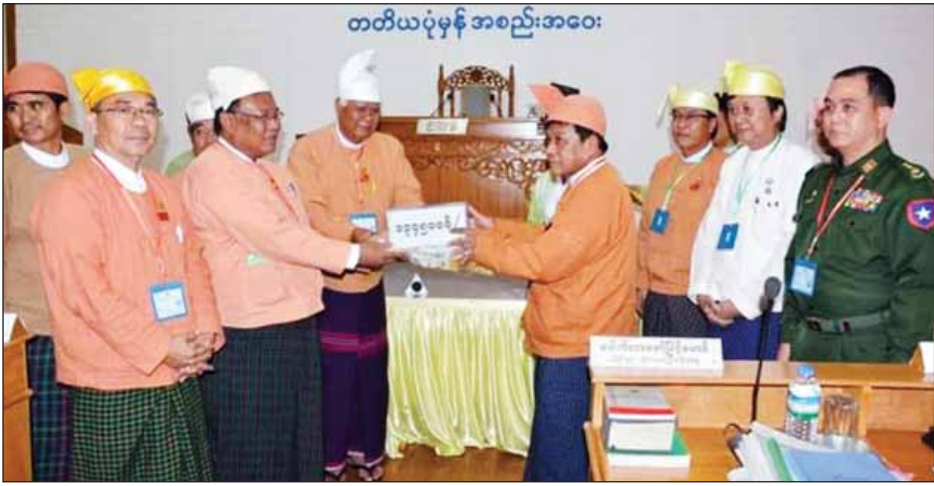
တတိယပုံမှန် အစည်းအဝေး