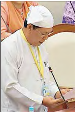
ပြည်ထောင်စုဝန်ကြီး ဦးသိန်းဆွေ

ထိုကဲ့သို့ တရားမဝင်သွားရောက်လုပ်ကိုင်ခြင်းသည် ဥပဒေနှင့်အညီ တရားဝင်သွားရောက်ခြင်းမဟုတ်သည့်အတွက် ရသင့်ရထိုက်သည့် အခွင့်အရေးနှင့် ဥပဒေ၏အကာအကွယ်များရရှိခံစားရခြင်းမရှိဘဲ လုပ်ခလစာခေါင်းပုံဖြတ်ခံရခြင်း၊ အလုပ်ရှင်၏ မတရားညှဉ်းပန်းမှုကိုခံရခြင်း၊ လူကုန်ကူးခံရခြင်းနှင့် လူ့အခွင့်အရေးဆိုင်ရာ ခံစားခွင့်များဆုံးရှုံးခြင်းတို့ကို ရင်ဆိုင်ကြုံတွေ့