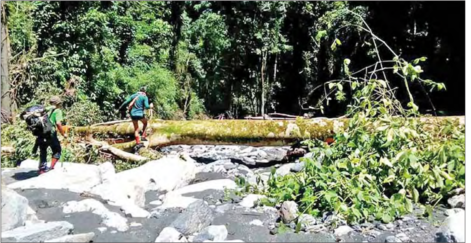
ချင်းတွင်းမြစ်အတွင်း ရေမည်းများ စီးဆင်းမှုကို လေ့လာစုံစမ်းရေးအဖွဲ့ ကွင်းဆင်းစစ်ဆေးစဉ်။

နေပြည်တော် စက်တင်ဘာ ၂၈ ပြန်မာ့စီးပွားရေးဘဏ် ခရိုင် ဘဏ်ခွဲ၊ မြို့နယ်ဘဏ်ခွဲများ တွင် ဝန်ဆောင်မှုအသစ်အနေဖြင့် တစ်နှစ်သက်တမ်း စာရင်းသေ အပ်ငွေ (Fixed Deposits) များအား အတိုးနှုန်း ၉ ဒသမ ၂၅ ရာခိုင်နှုန်းဖြင့် အောက်တိုဘာ ၁ ရက်မှစ၍ လက်ခံဆောင်ရွက် ပေးမည်ဖြစ်သည်။ အချိန်ပိုင်း အပ်ငွေအဖြစ် စာရင်းသေအပ်ငွေ (Fixed Deposits) များကို ၁၉၉၄ ခုနှစ် အောက်တိုဘာ ၁ ရက်မှစ၍ သုံးလအပ်ငွေအတွက် အတိုး နှုန်း ၈ ဒသမ ၂၅ ရာခိုင်နှုန်းဖြင့် လည်းကောင်း၊ ခြောက်လအပ်ငွေ ငွေအတွက် အတိုးနှုန်း ၈ ဒသမ ၅၀ ရာခိုင်နှုန်းဖြင့်လည်းကောင်း၊ ကိုးလအပ်ငွေအတွက် အတိုး နှုန်း ၈ ဒသမ ၇၅ ရာခိုင်နှုန်း ဖြင့်လည်းကောင်း လက်ခံ ဆောင်ရွက်ပေးလျက်ရှိကြောင်း မြန်မာ့စီးပွားရေးဘဏ်မှ သိရ သည်။ (ကြေးမုံ)