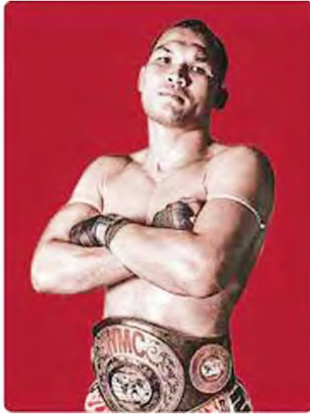
ဟနီယွန်(ထိုင်း)