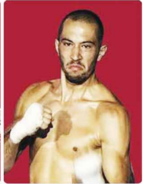
ဒေင်လက်ဒင်(ကနေဒါ)