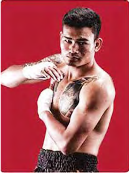
တူးတူး(မြန်မာ)