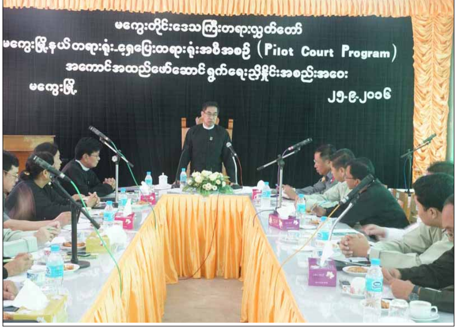
တရားသူကြီးချုပ်က ပြန်လည်ဖြေကြားခဲ့ပြီး အဆိုပါ တက်ရောက်ခဲ့ကြကြောင်း သိရသည်။ ဆွေးနွေးပွဲသို့ ခရိုင်/မြို့နယ်အဆင့် ဌာနဆိုင်ရာများ ညီညီမောင်(မကွေး)