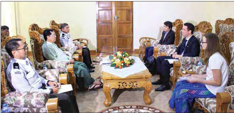
အထည်ဖော် ဆောင်ရွက်နေမှုနှင့် HD အဖွဲ့မှ ပူးပေါင်းကူညီဆောင် ဆွေးနွေးခဲ့ကြောင်း သတင်းရရှိ ရခိုင်ပြည်နယ် ဖွံ့ဖြိုးရေးအတွက် ရွက်နိုင်ရေး အခြေအနေများနှင့် သတင်းရရှိ လုပ်ငန်းများ ဆောင်ရွက်ရာတွင် စပ်လျဉ်း၍ ရင်းနှီးပွင့်လင်းစွာ (သတင်းစဉ်)

အလုပ်သမား၊ လူဝင်မှုကြီးကြပ်ရေး နှင့် ပြည်သူ့အင်အားဝန်ကြီးဌာန ပြည်ထောင်စုဝန်ကြီး ဦးသိန်းဆွေ သည် The Centre for Humanitarian Dialogue (HD) အဖွဲ့မှ မြန်မာနိုင်ငံ ဌာနကိုယ်စားလှယ် Mr. Adam Cooper နှင့်အဖွဲ့အား ယနေ့ ညနေ ၃ နာရီတွင် နေပြည်တော်ရှိ ပြည်ထောင်စုဝန်ကြီး ဧည့်ခန်းမ၌ တွေ့ဆုံသည်။