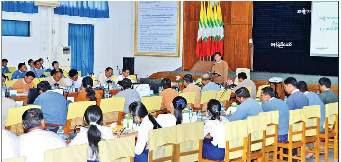
အမျိုးသားသဘာဝဘေးအန္တရာယ်ဆိုင်ရာ စီမံခန့်ခွဲမှုကော်မတီ လုပ်ငန်းညှိနှိုင်းအစည်းအဝေးကျင်းပစဉ်။ (သတင်းစဉ်)

ထို့ပြင် ဒုတိယသမ္မတက သဘာဝဘေးကျရောက်ပြီး နောက် ပြန်လည်ထူထောင်ရေးလုပ်ငန်းများ ဆောင်ရွက်မှုတွင် စာမျက်နှာ ၃ ကော်လံ ၁ သို့