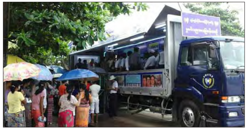
လေ့လာကြရာ သက်ဆိုင်ရာတာဝန်ရှိသူများက ပြန်လည်ရှင်းလင်းဆောင်ရွက်ပေးခဲ့ကြောင်း သိရသည်။