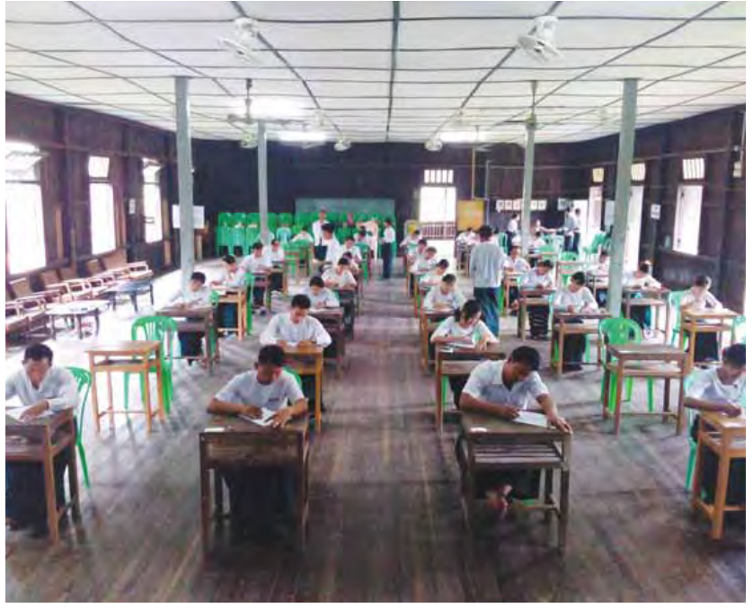
ကျောင်း၊ ခရိုင်အဆင့်တွင် ပထမရရှိသူသုံးဦးက တိုင်းအဆင့်သို့လည်းကောင်း၊ တိုင်းအဆင့်တွင် ပထမရရှိသူသုံးဦးက ဗဟိုအဆင့်သို့လည်းကောင်း ဆက်လက်ဖြေဆိုကြရမည်ဖြစ်ပြီး ဗဟိုအဆင့်တွင် ထက်၊ လယ်၊ မှု သုံးဆင့်စလုံး၌ ပထမဆုရ ကျပ်သိန်း ၄၀၊ ဒုတိယဆုရ ကျပ်သိန်း ၂၀ နှင့် တတိယဆုရ ကျပ် ၁၀ သိန်းစီဖြင့် စုစုပေါင်းကျပ်ငွေ သိန်း ၂၁၀ ချီးမြှင့်မည်ဖြစ်ပြီး ထက်၊ လယ်၊ မှု ဆရာသုံးဦးစီဖြင့် ထူးချွန်ဆရာရွက်ကိုးဦးအား ရွေးချယ်ချီးမြှင့်မည်ဖြစ်ကြောင်း သိရသည်။

မြို့နယ်အဆင့်တွင် ထက်၊ လယ်၊ မှု သုံးဆင့်စလုံး၌ ပထမရရှိသူသုံးဦးက ခရိုင်အဆင့်သို့လည်း