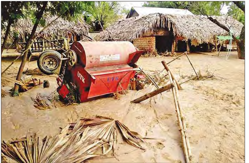
မိုးရွာသွန်းမှုကြောင့် သုံးပေထုခန့်ရှိ ချောင်းသဲများဝင်ရောက်ဖုံးလွှမ်းမှုဖြစ်ပေါ်ခဲ့သည့် တောင်ဖက်တန်းကျေးရွာအတွင်းရှိ လူနေအိမ်တစ်အိမ်ကို တွေ့ရစဉ်။

အလားတူ မိုးသည်းထန်စွာရွာသွန်းခဲ့မှုကြောင့် ခက်လန်းကန်ချောင်းမှ ချောင်းရေများ တောင်ဖက်တန်း ကျေးရွာသို့ အလုံးအရင်းဝင်ရောက်ခဲ့သည်။ အဆိုပါ ကျေးရွာတွင် စာမျက်နှာ ၉ ကော်လံ ၅ သို့ ❊