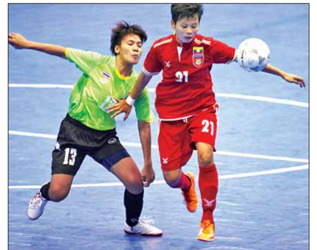
မြန်မာအမျိုးသမီး ဖူဆယ်အသင်း ၂၀၁၆ အာဆီယံ ဖူဆယ်ကလပ်ပြိုင်ပွဲတွင် ယှဉ်ပြိုင်နေစဉ်။

ရန်ကုန် စက်တင်ဘာ ၂၆ ၂၀၁၇ ခုနှစ် ဩဂုတ်လတွင် ကျင်းပမည့် (၂၉)ကြိမ်မြောက် ဆီးဂိမ်း ပြိုင်ပွဲတွင် မြန်မာဖူဆယ်အသင်းများ အောင်မြင်မှုရရှိရန် ပြင်ဆင်မည်ဖြစ်ပြီး အချိန်ယူလေ့ကျင့်မည်ဖြစ်သလို နိုင်ငံတကာခြေစမ်းပွဲများ ယှဉ်ပြိုင်ကစား မည်ဖြစ်သည်။ မလေးရှားအိုလံပစ်ကော်မတီသည် ဆီးဂိမ်းပြိုင်ပွဲတွင် ဖူဆယ်အားကစား နည်းကို ဘောလုံးနှင့်အတူ ကျင်းပမည်ဖြစ်ပြီး အမျိုးသား အမျိုးသမီး ပြိုင်ပွဲ နှစ်ခုစလုံး ထည့်သွင်းကျင်းပမည်ဖြစ်သည်။ စာမျက်နှာ ၉ ကော်လံ ၅ သို့ ❊