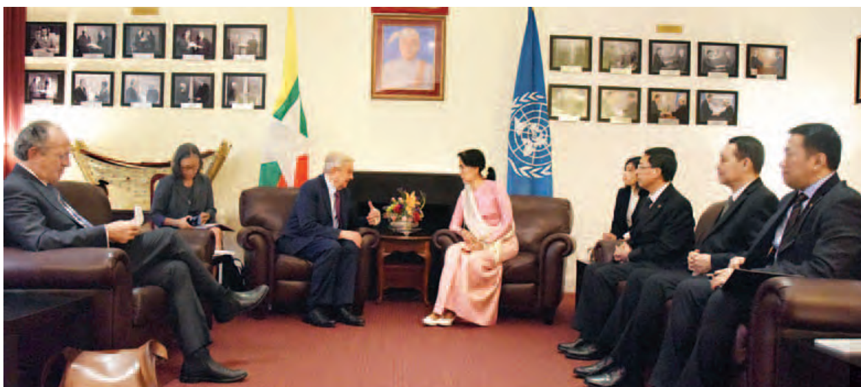
နိုင်ငံတော်၏အတိုင်ပင်ခံပုဂ္ဂိုလ် ဒေါ်အောင်ဆန်းစုကြည်နှင့် မစ္စတာ ဂျော့ချ်ဆိုးရော့စ်တို့ တွေ့ဆုံစဉ်။ (သတင်းစဉ်)