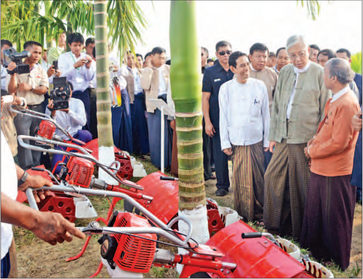
နိုင်ငံတော်သမ္မတ ဦးထင်ကျော် လယ်ယာသုံးစက်ကိရိယာများအား ကြည့်ရှုလေ့လာစဉ်။ (သတင်းစဉ်)

သမဝါယမအသင်းသား တောင်သူလယ်သမားများသို့ လယ်ယာသုံးစက်ကိရိယာများ ဝယ်ယူနိုင်ရန် အရစ်ကျစနစ်ဖြင့် ဆောင်ရွက်ပေးမှုအနေဖြင့် ငွေကျပ် ၁၂၅ ဒသမ ၈၁၈ ဘီလီယံတန်ဖိုးရှိ လက်ထွန်းထွန်စက်၊ ထွန်စက်၊ ရေစုပ်စက်၊ ရိတ်သိမ်းခြွေလှေ့စက်၊ မြက်ရိတ်စက်၊ မျိုးစေ့ချစက်၊ မြေမွှေစက်၊ ထွန်နှင့် ထယ်စသည့် လယ်ယာသုံးစက်ကိရိယာ စုစုပေါင်း ၂၆၀၉၉ စီးကို ရောင်းချပေးခဲ့ပြီး ခြောက်လတစ်ကြိမ် ပြန်လည်ပေးဆပ်ငွေများဖြင့် စဉ်ဆက်