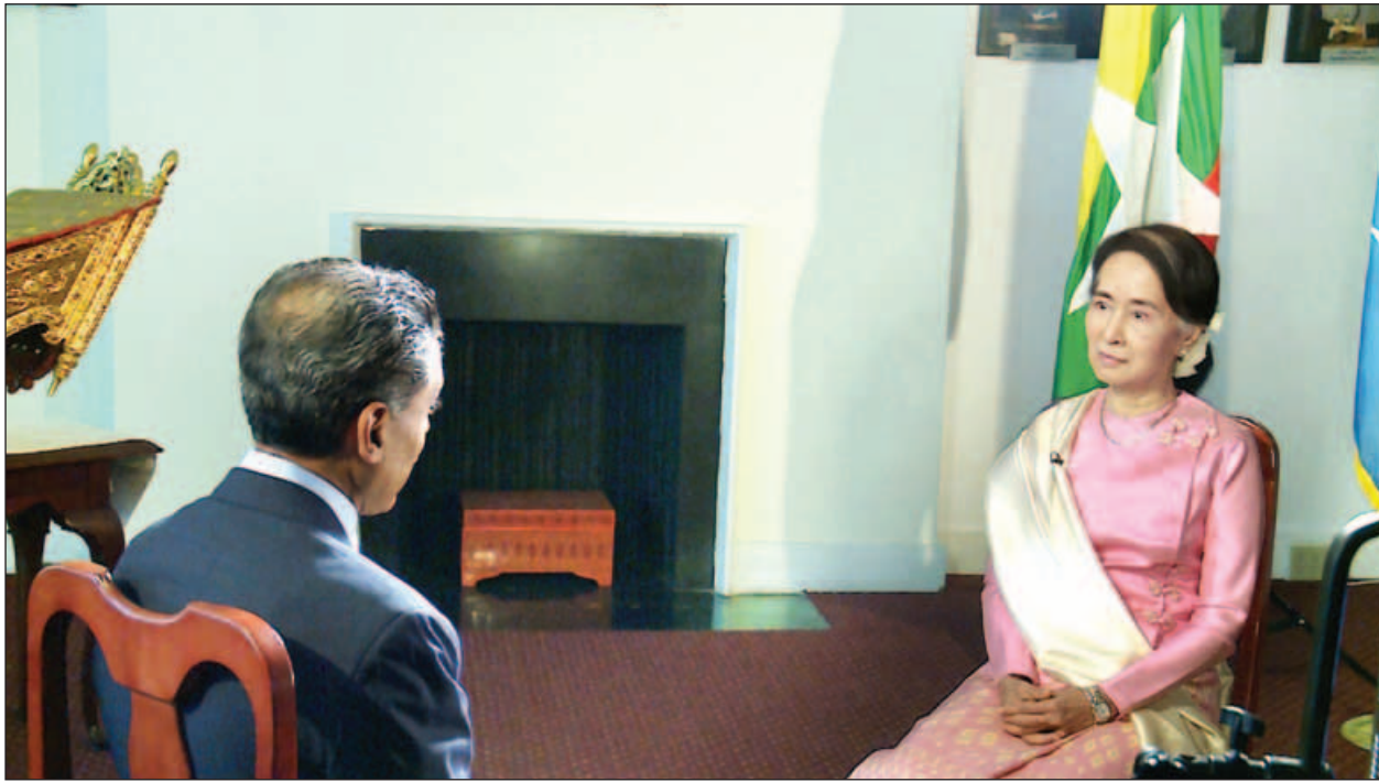
နိုင်ငံတော်၏ အတိုင်ပင်ခံပုဂ္ဂိုလ် ဒေါ်အောင်ဆန်းစုကြည် CNN သတင်းဌာန၏ မေးမြန်းချက်များကို ဖြေကြားစဉ်(သတင်းစဉ်)

မြန်မာနိုင်ငံမှ ဆွစ်ဇာလန်နိုင်ငံ ဒါဗိုဗ်မြို့တွင် ကျင်းပမည့် World Economic Forum အစည်းအဝေးသို့ နိုင်ငံတော်၏ အတိုင်ပင်ခံပုဂ္ဂိုလ် တက်ရောက်ရန်နှင့် မြန်မာနိုင်ငံ၏ စီးပွားရေးဖွံ့ဖြိုးတိုးတက်မှုဆိုင်ရာ ကိစ္စရပ်များအား မူဘောင်ချမှတ်အကောင်အထည်ဖော်ဆောင်ရွက်နေမှုများအပေါ် အမြင်ချင်းဖလှယ် ဆွေးနွေးကြသည်။ ထို့နောက် နိုင်ငံတော်၏အတိုင်ပင်ခံပုဂ္ဂိုလ်သည် Founder and