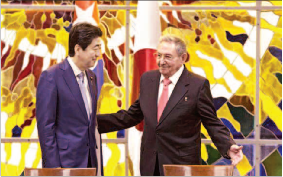
သမ္မတ ရာအူးလ်ကင်ထရီ၏ အစ်ကိုဖီဒယ်ကင်ထရီသည် ၁၉၅၉ ခုနှစ်တွင် အမေရိကန်ထောက်ခံလိုလား

စက်တင်ဘာ ၂၂ ရက် အစောပိုင်းတွင် အာဘေးသည် ကျူးဘားခေါင်းဆောင်ဟောင်း ဖီဒယ်ကင်ထရီကို ၎င်း၏နေအိမ်တွင် တွေ့ဆုံခဲ့သည်။ လက်ရှိကျူးဘား