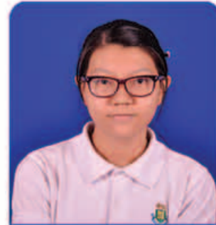
Thinn Thazin 7A*s & 1A