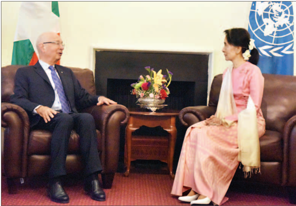
နိုင်ငံတော်၏ အတိုင်ပင်ခံပုဂ္ဂိုလ် ဒေါ်အောင်ဆန်းစုကြည် World Economic forum မှ Executive Chairman, Prof. Klaus Schwab နှင့် တွေ့ဆုံဆွေးနွေးစဉ်။