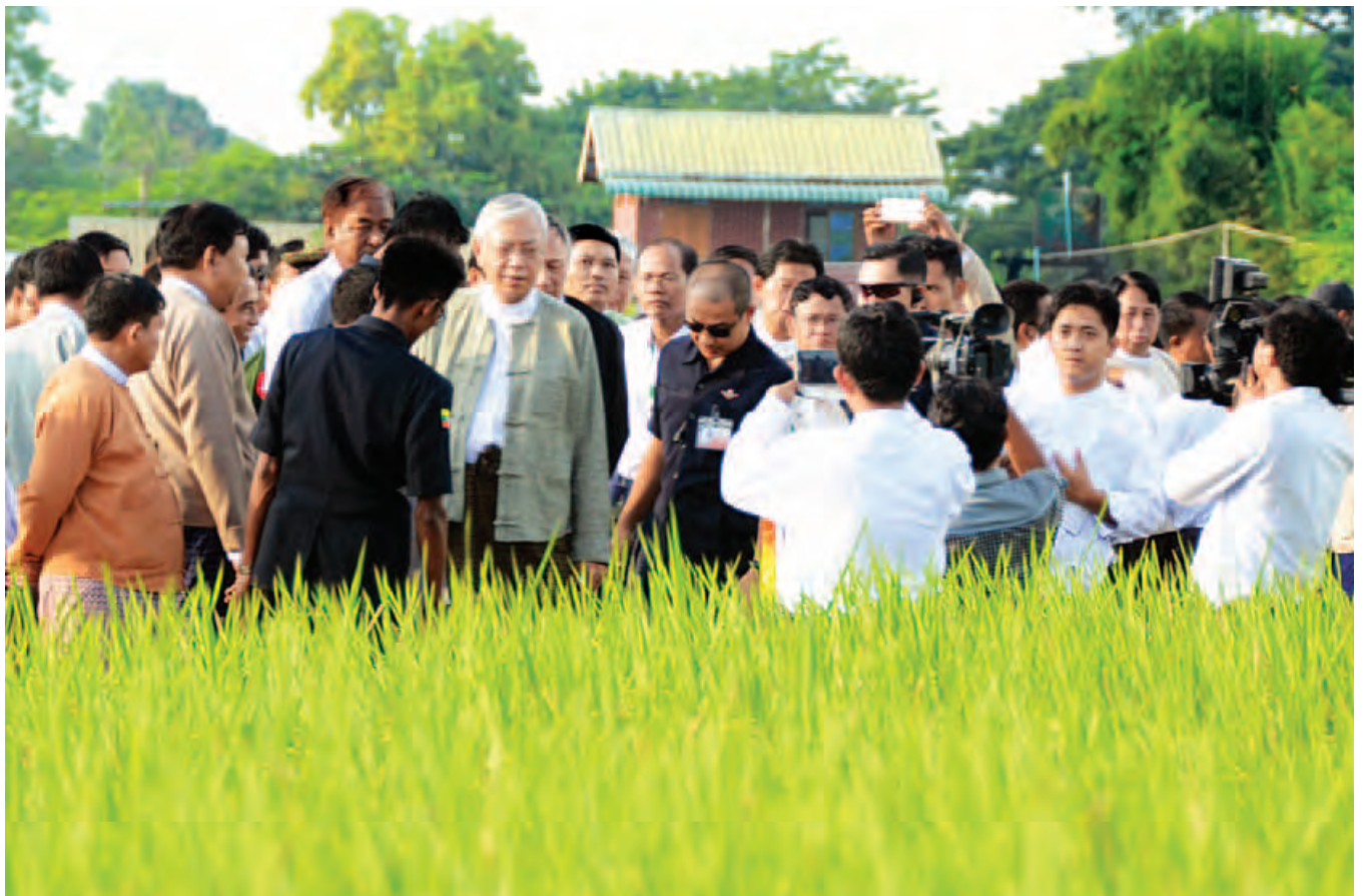
နိုင်ငံတော်သမ္မတ ဦးထင်ကျော် SRI စနစ်ဖြင့် စိုက်ပျိုးထားသည့် မိုးစပါးဧက ၂၀၀ စိုက်ခင်းကို ကြည့်ရှုလေ့လာစဉ်။ (သတင်းစဉ်)