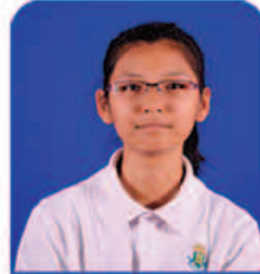
Thitar Aye 4A*s & 3As