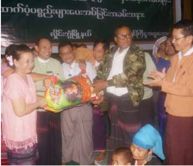
လွှတ်တော်ဥက္ကဋ္ဌဦးစောချစ်ခင်၊ ဒုတိယဥက္ကဋ္ဌ ဒေါ်နန်းသူဇာဝင်း၊ ပြည်နယ်အစိုးရအဖွဲ့ဝင်ဝန်ကြီးများ၊ ပြည်နယ် အဆင့်ဌာနဆိုင်ရာ တာဝန်ရှိသူများက နှစ်သိမ့်အားပေးစကားများပြောကြား၍ ပဲခိုလေး ၆၇၅ ပိဿာ၊ ဟင်းချိုမှုန့် တစ်ပေါင် ထုပ် ၆၇၅ ထုပ်၊ ငရုပ်သီးမှုန့် ၁၃၅ ပိဿာ၊ ကြော်ရည်သုတ်ပန်းကန်နှင့်ခွက် ၅၀ ဖာ၊ ပဲခိုဘူး ၁၁၆၂၈ ဘူး၊ အာလူးကြော် ၁၁၆၂၂ ထုပ်၊ ရုပ်အင်္ကျီ၊ အနွေးထည်၊ ဦးထုပ်၊ စောင်အစရှိသည့် အဝတ်အထည်များ၊ စာအုပ်စာစောင်များ၊ စစ်ဘေးရှောင်ကလေးငယ်များ ပညာသင်ကြားနိုင်ရေးအတွက် သင်ထောက်ကူပစ္စည်းများ၊ ကလေးကစားစရာအရုပ်များ၊ အားကစားပစ္စည်းများအား ထောက်ပံ့ပေးအပ်ခဲ့သည်။

မြိုင်ကြီးငူအထူးဒေသတွင် မဲလရောဒေသမှ ဒေသခံပြည်သူ အိမ်ထောင်စု ၆၇၅ စု လူဦးရေ ၃၈၇၄ ဦး ယာယီစစ်ဘေးရှောင်ပြောင်းရွှေ့နေထိုင်လျက်ရှိရာ ကရင်ပြည်နယ်အစိုးရအဖွဲ့၊ ပြည်နယ်ဝန်ကြီးချုပ်ဒေါ်နန်းခင်ထွေးမြင့်၊ ပြည်နယ်