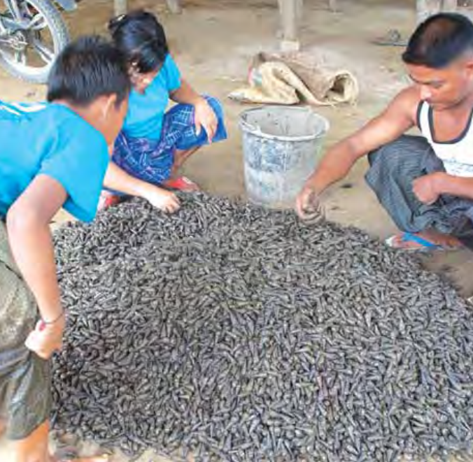
ကျောက်ဆည်နယ်မှ ခရုများကို အထက် တင်ပို့ရောင်းချလျက်ရှိကြောင်း သိရ ပိုင်း၊ မူဆယ်၊ ရွှေလီအထိ တွင်ကျယ်စွာ သည်။