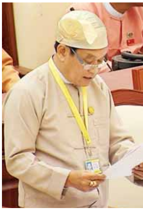
ပြည်ထောင်စု ဝန်ကြီး ဒေါက်တာမြင့်ထွေး

တွင် ကျန်းမာရေးစောင့်ရှောက်မှုဆောင်ရွက်မည့်ဒေသ သတ်မှတ်ခြင်းကို အခန်း(၃)တွင် ဖော်ပြထားပါကြောင်း၊ ၂၀၁၆ ခုနှစ်မှစတင်၍ UNFPA အထောက်အပံ့ဖြင့် မျိုးဆက်ပွားကျန်းမာရေးလုပ်ငန်းစီမံချက် ဆောင်ရွက်လျက် ရှိပြီး သားဆက်ခြားလုပ်ငန်း၊ မိသားစုကျန်းမာရေးလုပ်ငန်း၊ မိခင်နှင့်ကလေး ကျန်းမာရေးကဏ္ဍများကို စီးစားပေးဆောင်ရွက်လျက်ရှိပြီး မိခင်သေဆုံးမှုနှင့် ကလေးသေဆုံးမှုများကျဆင်းရေးနှင့် ကာကွယ်ဆေးထိုးလုပ်ငန်းများကို အထူး ဝရပြုဆောင်ရွက်လျက်ရှိကြောင်း ပြည်ထောင်စုဝန်ကြီးက ဖြေကြားသည်။