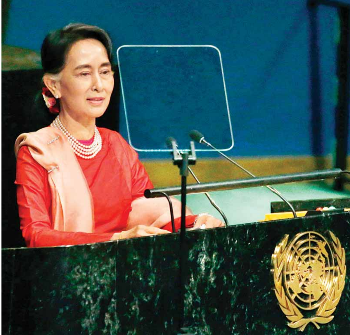
(၇၁)ကြိမ်မြောက် ကုလသမဂ္ဂအထွေထွေညီလာခံတွင် နိုင်ငံတော်၏အတိုင်ပင်ခံပုဂ္ဂိုလ် နိုင်ငံခြားရေးဝန်ကြီးဌာန ပြည်ထောင်စုဝန်ကြီး ဒေါ်အောင်ဆန်းစုကြည် အထွေထွေပုဂံဒေသရာဇ်ခန်း ဖြောကြားစဉ်။