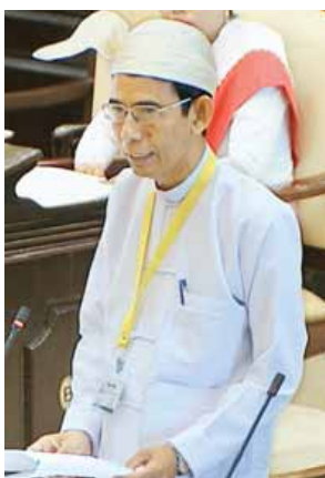
ပြည်ထောင်စုဝန်ကြီး ဒေါက်တာအောင်သူ

ချင်းပြည်နယ် မဲဆန္ဒနယ် အမှတ် (၁၂)မှ ဦးရဲမြင့်စိုး(ခ) ဆလိုင်းမျိုးထိုက် ၏ “ချင်းပြည်နယ် ပလက်ဝမြို့နယ် ဆမီးမြို့နှင့် ကန်ပက်လက်မြို့နယ်ကြား ဆမီး-ကန်ပက်လက် တိုက်ရိုက် ကားလမ်းဖောက်လုပ်ပေးရန် အစီ အစဉ်ရှိ/မရှိ” မေးခွန်းနှင့်စပ်လျဉ်း၍ ပြည်ထောင်စုဝန်ကြီး ဒေါက်တာ