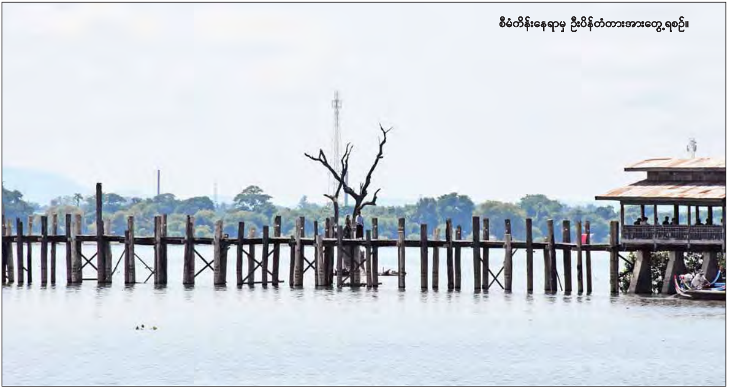
စီမံကိန်းနေရာမှ ဦးပိန်တံတားအားတွေ့ရစဉ်။

“ဒီစီမံကိန်းတစ်ခုတည်းကြောင့်တော့ မဟုတ်ဘူး။