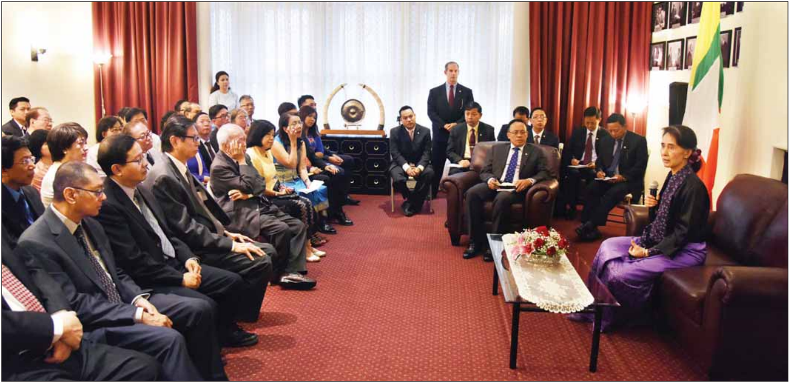
အတိုင်ပင်ခံပုဂ္ဂိုလ်က တင်ပြချက် များနှင့်စပ်လျဉ်း၍ ပြန်လည်ရှင်းလင်း ဆွေးနွေးခဲ့သည်။ (သတင်းစဉ်) နိုင်ငံတော်၏အတိုင်ပင်ခံပုဂ္ဂိုလ် ဒေါ်အောင်ဆန်းစုကြည် နယူးယောက်မြို့၌ မြန်မာအသိုက်အဝန်းနှင့် တိုင်းရင်းသားကိုယ်စားလှယ်များအား တွေ့ဆုံစဉ်။ (သတင်းစဉ်)

နယူးယောက် စက်တင်ဘာ ၁၈ နိုင်ငံတော်၏ အတိုင်ပင်ခံပုဂ္ဂိုလ် ဒေါ်အောင်ဆန်းစုကြည်သည် နယူးယောက်မြို့ရှိ မြန်မာအသိုက်အဝန်းနှင့် တိုင်းရင်းသားကိုယ်စားလှယ်များအား ယမန်နေ့ ဒေသစံတော်ချိန် နံနက် ၁၀ နာရီတွင် ကုလသမဂ္ဂဆိုင်ရာ မြန်မာအမြဲတမ်းကိုယ်စားလှယ်အဖွဲ့ ရုံး၌ တွေ့ဆုံသည်။ တွေ့ဆုံစဉ် နိုင်ငံတော်၏ အတိုင်ပင်ခံပုဂ္ဂိုလ်က နိုင်ငံတော်မှ ပညာရေးကဏ္ဍမြှင့်တင်ရေး၊ ပြည်သူ့ လူထု၏ ကျန်းမာရေးစောင့်ရှောက်မှု လုပ်ငန်းများ ပိုမိုတိုးချဲ့မြှင့်တင် ဆောင်ရွက်ရေး၊ ငြိမ်းချမ်းရေးနှင့် အမျိုးသားရင်ကြားစေ့ရေး တိုင်းရင်း သား စည်းလုံးညီညွတ်ရေးအတွက် ဆောင်ရွက်နေမှုများကို ရှင်းလင်း ပြောကြားသည်။ ထို့နောက် မြန်မာအသိုက်အဝန်းမှ တာဝန်ရှိသူများက ကျန်းမာရေးကဏ္ဍ ပိုမိုတိုးတက် မြှင့်မားလာစေရေး၊ ပြည်ပခွင့်ပီဇာသက်တမ်း တိုးမြှင့် ဆောင်ရွက်ပေးရေး ကိစ္စရပ်များအား ဆွေးနွေးတင်ပြကြရာ နိုင်ငံတော်၏