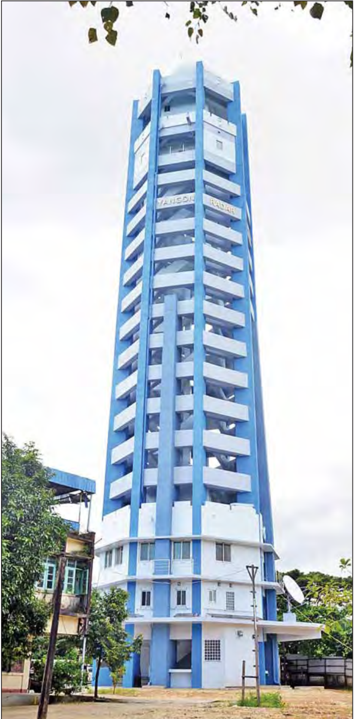
ရန်ကုန်မြို့ မရမ်းကုန်းမြို့နယ်ရှိ မိုးလေဝသခန့်မှန်းရေး ရေဒါတာဝါအား တွေ့ရစဉ်။