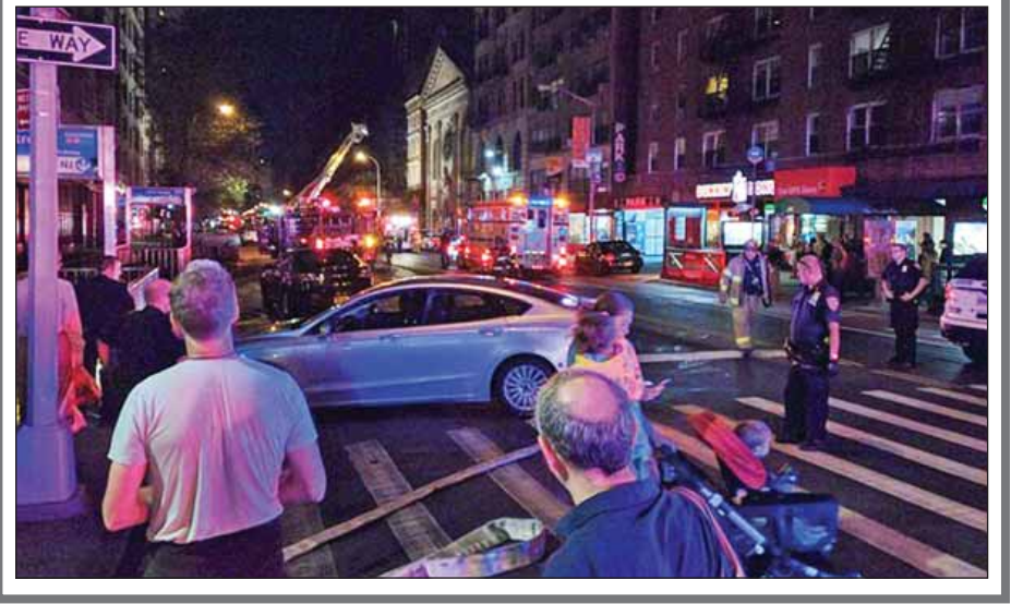
အင်န်အိတ်ချ်ကော။

နယူးယောက်စီးတီး စက်တင်ဘာ ၁၈ စက်တင်ဘာ ၁၇ ရက်က အမေရိကန်ပြည်ထောင်စု နယူးယောက်စီးတီး၌ ဗုံးပေါက်ကွဲမှုတစ်ရပ်ဖြစ်ပွားခဲ့ရာ လူအနည်းဆုံး ၂၉ ဦး ထိခိုက်ဒဏ်ရာများ ရရှိခဲ့ကြောင်း သတင်းများအရ သိရသည်။ စက်တင်ဘာ ၁၇ ရက် နံနက် ၈ နာရီခွဲအချိန်တွင် နယူးယောက်စီးတီး၏ မန်ဟန်တန်ချယ်စီးရပ်ကွက်တွင် ဗုံးပေါက်ကွဲမှုဖြစ်ပွားခဲ့သည်။ ယင်းကိစ္စနှင့်ပတ်သက်ပြီး အာဏာပိုင်များက စုံစမ်းစစ်ဆေးလျက်ရှိသည်။ ယင်း ပေါက်ကွဲမှုကြောင့် လူ ၂၉ ဦးကျော် ထိခိုက်ဒဏ်ရာများ ရရှိခဲ့ပြီး ၎င်းတို့အနက် တစ်ဦးမှာ အသက်အန္တရာယ် ပိုးရိမ်ဖွယ်ရှိကြောင်း ရဲအရာရှိများက ဆိုသည်။ နယူးယောက်စီးတီးမြို့တော်ဝန် ဘေလီဒီဗလာစီယို နှင့် ရဲအရာရှိများက အဆိုပါဗုံးပေါက်ကွဲမှုသည် တမင် ရည်ရွယ်ပြီးလုပ်ဆောင်ခြင်းဖြစ်သည်ဟု သတင်းစာ ရှင်းလင်းပွဲတစ်ရပ်တွင် ပြောကြားခဲ့သည်။ သို့သော် မည်သည့် အကြမ်းဖက်အဖွဲ့အစည်း၏ လုပ်ရပ်ဖြစ်သည် ကိုမူ ပြောကြားခဲ့ခြင်းမရှိပေ။ မြို့လယ်လမ်းမကြီးပေါ်ရှိ စားသောက်ဆိုင်များ သည် အဆိုပါဗုံးပေါက်ကွဲမှုကြောင့် တုန်လှုပ်ချောက်ချား လျက်ရှိသည်။ ဗုံးပေါက်ကွဲပြီးနောက် ရဲအရာရှိများနှင့် မီးသတ် တပ်ဖွဲ့တို့က အခင်းဖြစ်ပွားရာနေရာသို့ ရောက်ရှိခဲ့ပြီး ထိခိုက်ဒဏ်ရာရရှိသူများအား နီးစပ်ရာဆေးရုံများသို့ ပို့ဆောင်ခဲ့ကြသည်။ အခင်းဖြစ်ပွားရာ ဝန်းကျင်ကို ဖြတ်သန်းသွားလာမှု ယာယီပိတ်ပင်ထားသည်။ စက်တင်ဘာ ၁၇ ရက်တွင် ကုလသမဂ္ဂအထွေထွေ ညီလာခံတက်ရောက်ရန် ကမ္ဘာ့ခေါင်းဆောင်ကြီးများ စုဝေးရောက်ရှိနေသည့်အတွက် နယူးယောက်မြို့တွင် လုံခြုံရေးတင်းကျပ်ထားကြောင်း သိရသည်။ စက်တင်ဘာ ၁၇ ရက် နံနက်အစောပိုင်းတွင် နယူးယောက်မြို့ရှိ ရေပိုက်တစ်ခုအတွင်း ပေါက်ကွဲမှုတစ်ခု ဖြစ်ပွားခဲ့သည်။ အဆိုပါပေါက်ကွဲမှုနှင့် ယခုဗုံးပေါက်ကွဲ မှုတို့ ဆက်စပ်မှုရှိမရှိဆိုသည်ကိုမူ အာဏာပိုင်များက ပြောကြားခြင်း မရှိသေးပေ။