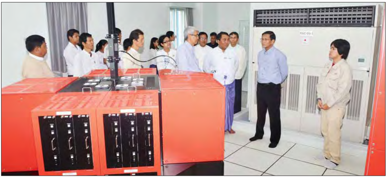
မိုးလေဝသခန့်မှန်းရေး ရေဒါတာဝါ၏ လုပ်ငန်းဆောင်ရွက်နေမှုများကို ဒုတိယသမ္မတ ဦးဟင်နရီဗန်ထီးယူ ကြည့်ရှုစစ်ဆေးစဉ်။ (သတင်းစဉ်)

ဒုတိယသမ္မတ ဦးဟင်နရီဗန်ထီးယူအား အစည်းအဝေးခန်းမ၌ မိုးလေဝသနှင့် လေဗေဒညွှန်ကြားမှုဦးစီးဌာန ဒုတိယညွှန်ကြားရေးမှူးချုပ် ဒေါက်တာ ကျော်မိုးဦးက သဘာဝဘေးအန္တရာယ်ဆိုင်ရာ ရာသီဥတုစောင့်ကြည့်လေ့လာရေး လုပ်ငန်းများ အကောင်အထည်ဖော်ဆောင်ရွက်ခြင်းစီမံကိန်း (ရေဒါ တည်ဆောက်ခြင်းစီမံကိန်း) ဆောင်ရွက်နေမှု၊ မိုးလေဝသ သတိပေးနှိုးဆော်ချက် များကို အက်မ်အမ်ရေဒီယိုနှင့် ရုပ်သံလွှင့်လိုင်းများ၊ သတင်းစာများနှင့် လူမှု ကွန်ရက်များပေါ်တွင် ထုတ်လုပ်ဖြန့်ချိပေးနေမှု၊ မိုးလေဝသနှင့် လေဗေဒ ညွှန်ကြားမှုဦးစီးဌာနက သဘာဝဘေးအန္တရာယ်ဆိုင်ရာ ရာသီဥတုစောင့်ကြည့် လေ့လာရေးလုပ်ငန်းများကို နိုင်ငံတကာနှင့် ပူးပေါင်းဆောင်ရွက်နေမှုနှင့် ဆက်လက်ဆောင်ရွက်သွားမည့် အစီအစဉ်တို့နှင့် စပ်လျဉ်း၍ ရှင်းလင်းတင်ပြပြီး ပို့ဆောင်ရေးနှင့် စာမျက်နှာ ၃ ကော်လံ ၁ သို့ ☆