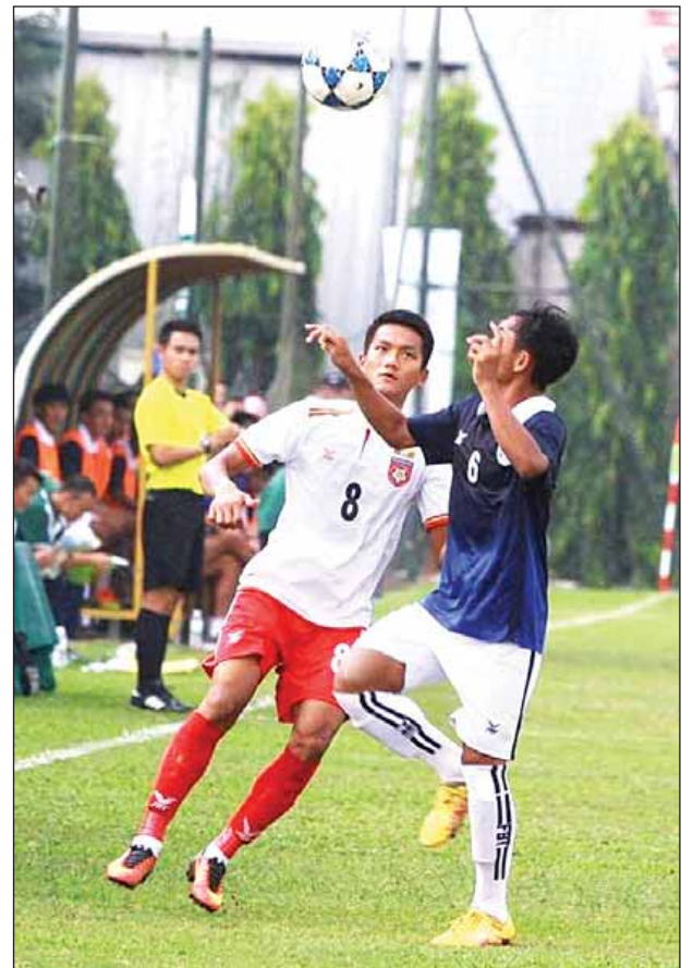
မြန်မာအသင်းနှင့် ကမ္ဘောဒီးယားအသင်းယှဉ်ပြိုင်နေစဉ်။

ဗီယက်နမ်နိုင်ငံ ဟနွိုင်းမြို့၌ ကျင်းပလျက်ရှိသည့် ၂၀၁၆ အာဆီယံယူ-၁၉ ပြိုင်ပွဲ အုပ်စု(ခ)ပွဲစဉ်များကို ယနေ့ ညနေပိုင်းက ကျင်းပရာ မြန်မာယူ-၁၉ အသင်း နိုင်ပွဲပြန်ရခဲ့သည်။ စာမျက်နှာ ၉ ကော်လံ ၄ သို့ ○