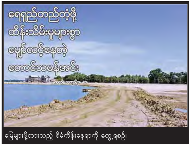
မြေများဖို့ထားသည့် စီမံကိန်းနေရာကို တွေ့ရစဉ်။