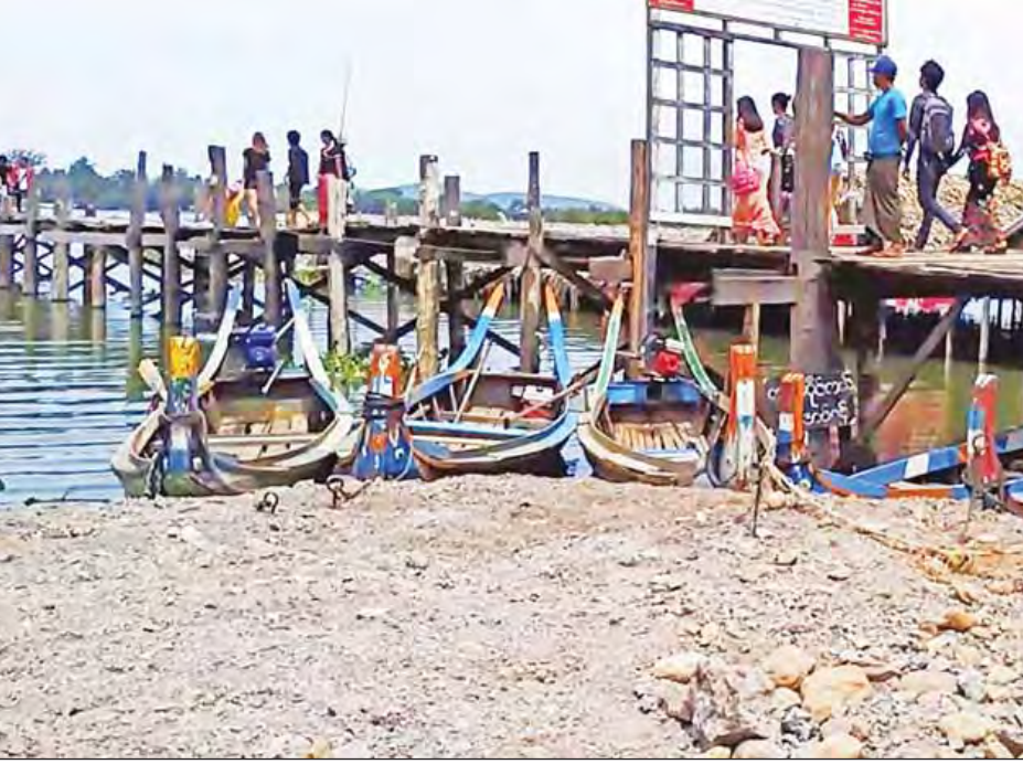
ဦးပိန်တံတားအခြေအထိ လှည့်လမ်းအား ကျောက်ခင်းလမ်းပြုလုပ်ပေးထားစဉ်ကတွေ့ရစဉ်။