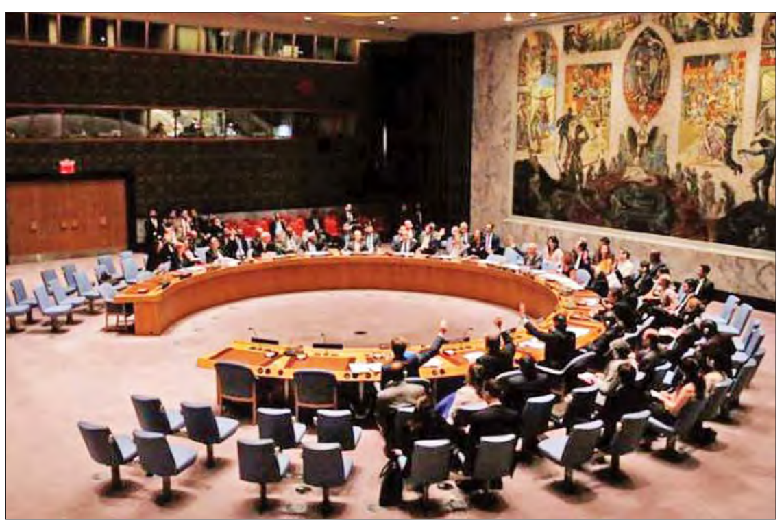
ရိုက်တာ။

နယူးယောက် စက်တင်ဘာ ၁၈ ဆီးရီးယားနိုင်ငံ၌ အမေရိကန်ဦးဆောင်သောတပ်ဖွဲ့၏ လေကြောင်းတိုက်ခိုက်မှုကြောင့် ဆီးရီးယားစစ်သည် ၈၀ ထက်မနည်း သေဆုံးရသည်ဆိုသော သတင်းပေါ်ထွက်လာခဲ့ပြီးနောက် ရုရှားနိုင်ငံ၏ တောင်းဆိုချက်အရ ကုလသမဂ္ဂလုံခြုံရေးကောင်စီအရေးပေါ်အစည်းအဝေး တစ်ရပ်ကို ချက်ချင်းခေါ်ယူခဲ့ရကြောင်း ဒေသဆိုင်ရာသတင်းဌာနများက စက်တင်ဘာ ၁၈ ရက်တွင် သတင်းထုတ်ပြန်သည်။ အမေရိကန်ဦးဆောင်သောတပ်ဖွဲ့၏ လေကြောင်းတိုက်ခိုက်မှုကြောင့် ဆီးရီးယား အစိုးရတပ်ဖွဲ့မှ တပ်ဖွဲ့ဝင်များသေဆုံးရပြီး စစ်ယာဉ်များ ပျက်စီးခဲ့သည်ဟု ရုရှားနိုင်ငံက အမေရိကန်ဦးဆောင်သော ညွန့်ပေါင်းတပ်ဖွဲ့ကို အကြောင်းကြားခဲ့ပြီးနောက် အစ္စလာမ္မစ် နိုင်ငံတော်(အိုင်အက်စ်)၏ ပစ်မှတ်များကို တိုက်ခိုက်မှု ရပ်ဆိုင်းထားကြောင်း သတင်းတွင် ဖော်ပြသည်။ ဆီးရီးယားနိုင်ငံ အရှေ့မြောက်ပိုင်းရှိ အိုင်အက်စ်ပစ်မှတ်များဟုယူဆရသော နေရာ များကို လေကြောင်းမှ တိုက်ခိုက်စဉ်အတွင်း အမေရိကန်ဦးဆောင်သော ညွန့်ပေါင်းအဖွဲ့က ဆီးရီးယားအစိုးရတပ်ဖွဲ့ စခန်းတစ်ခုကို မှားယွင်းတိုက်ခိုက်ခဲ့သည်ဟု တာဝန်ရှိသူများက ပြောကြား ကြသည်။ လေကြောင်းတိုက်ခိုက်မှုအတွင်း မှားယွင်းတိုက်ခိုက်မှုကြောင့် ဆီးရီးယား တပ်ဖွဲ့ဝင်များ အသက်ဆုံးရှုံးခဲ့ခြင်းအတွက် ဝမ်းနည်းမိသည်ဟု အမေရိကန်က ရုရှားအစိုးရအဖွဲ့ထံ အကြောင်းကြားခဲ့ကြောင်း အမေရိကန်ကာကွယ်ရေးဆိုင်ရာ တာဝန်ရှိသူတစ်ဦးက အီးမေးလ်ဖြင့် ပေးပို့သော ကြေညာချက်တစ်ရပ်တွင် ဖော်ပြသည်။ ယင်းဖြစ်စဉ်နှင့် ပတ်သက်၍ ဆွေးနွေးနိုင်ရန် အဖွဲ့ဝင် ၁၅ နိုင်ငံ ပါဝင်သော ကုလသမဂ္ဂ လုံခြုံရေးကောင်စီသည် စက်တင်ဘာ ၁၇ ရက် ညတွင် အရေးပေါ် အစည်းအဝေးခေါ်ယူခဲ့ရ သည်။