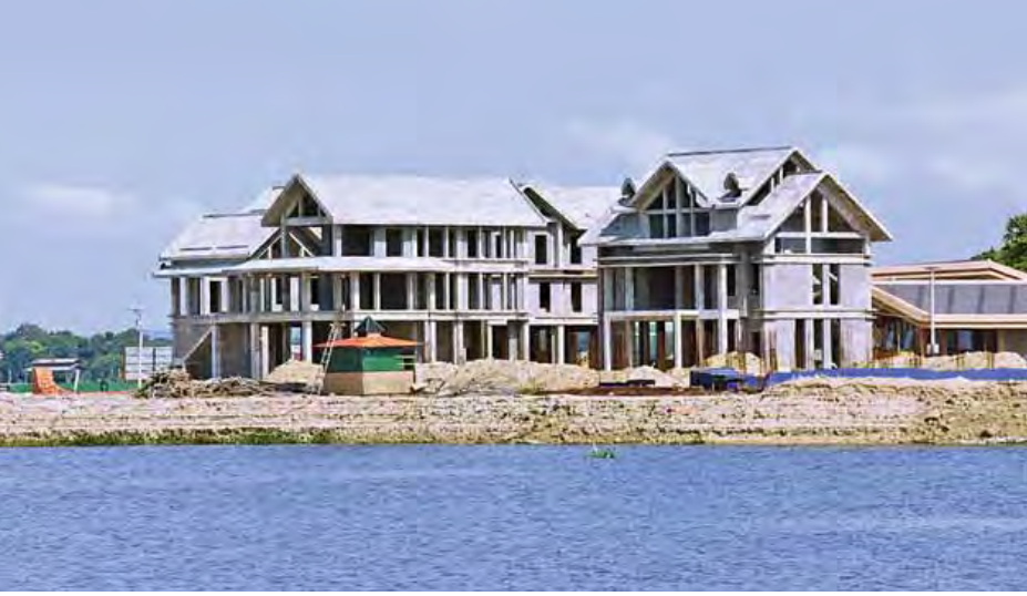
စီမံကိန်းသစ်တွင် ဆောက်လုပ်ထားသည့် ဟိုတယ်များအား တွေ့ရစဉ်။