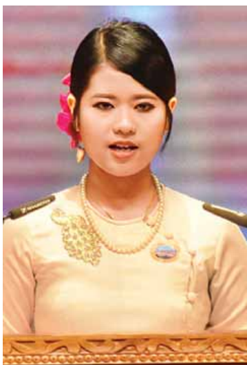
ကျောင်းသား ကျောင်းသူကိုယ်စားလှယ် မအိမ်သက်ထားနိုင်

ပညာရေးဝန်ကြီးဌာန ကလည်း အဆင့်မြင့်ပညာကဏ္ဍ၊ အခြေခံပညာကဏ္ဍနှင့် ဆရာအတတ်ပညာကဏ္ဍစသည့်ကဏ္ဍအသီးသီးအတွက် ပြည်တွင်း ပြည်ပပညာရှင်များ၊ အဖွဲ့အစည်းအသီးသီးက အသိပညာရှင်၊ အတတ်ပညာရှင်များပါဝင်သော နိုင်ငံတကာ ဆွေးနွေးပွဲများ၊ နီးနော့ဖလှယ်ပွဲများ၊ အလုပ်ရုံ ဆွေးနွေးပွဲများကို ကျင်းပပြီး ဘက်စုံလွှမ်းခြုံသောပညာရေး အဆင့်မြှင့်တင်နိုင်ရေးအတွက် ကြိုးပမ်းဆောင်ရွက်လျက်ရှိတာကို