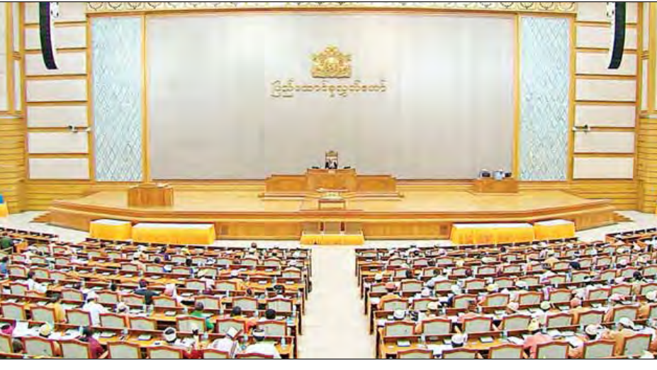
ပြည်ထောင်စုလွှတ်တော် ဒုတိယပုံမှန်အစည်းအဝေး (၁၂)ရက်မြောက်နေ့ ကျင်းပစဉ်။ (သတင်းစဉ်)

နေပြည်တော် စက်တင်ဘာ ၁၆ ဒုတိယအကြိမ် ပြည်ထောင်စုလွှတ်တော် ဒုတိယပုံမှန် အစည်းအဝေး (၁၂) ရက်မြောက်နေ့ကို ယနေ့မွန်းလွဲ ၁ နာရီခွဲတွင် နေပြည်တော်ရှိ ပြည်ထောင်စုလွှတ်တော် အစည်းအဝေးခန်းမ၌ ကျင်းပသည်။