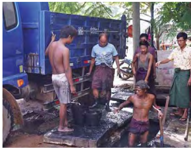
မင်းဝေ(မုံရွာ)

ရပ်ကွက်အုပ်ချုပ်ရေးမှူးက ပြောသည်။ အဆိုပါ ရေနုတ်မြောင်း တူးဖော်ခြင်းကို ဒေါက်မြို့ရပ်ကွက်ရှိ ပြည်ထောင်စုနှင့် လယ်တီ လမ်းတစ်လျှောက် လမ်းဘေးဝဲ/လာ ရေနုတ် မြောင်းအတွင်းရှိ အမှိုက်များ၊ သဲနုန်းများကို ရှင်းလင်းရာ မြို့နယ်စည်ပင်သာယာ ရေးကော်မတီမှ အမှိုက်ကားဖြင့် ရပ်ကွက်နေပြည်သူများက ရှင်းလင်းခဲ့ကြောင်း သိရ သည်။