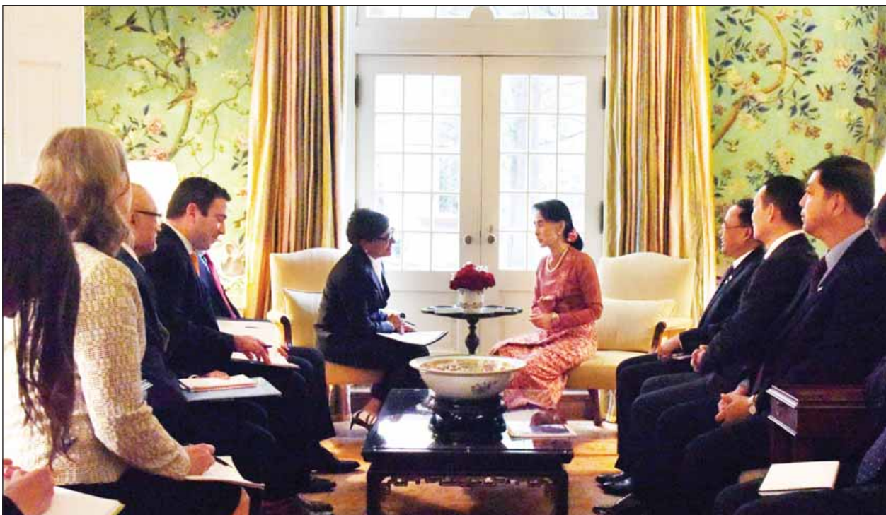
နိုင်ငံတော်၏အတိုင်ပင်ခံပုဂ္ဂိုလ် ဒေါ်အောင်ဆန်းစုကြည် အမေရိကန် ကုန်သွယ်ရေးဝန်ကြီး Ms. Penny Pritzker နှင့် တွေ့ဆုံဆွေးနွေးစဉ်။

ကျောင်းသားများနှင့် ရင်းရင်းနှီးနှီးတွေ့ဆုံသည်။ နိုင်ငံတော်၏အတိုင်ပင်ခံပုဂ္ဂိုလ်သည် ဒေသစံတော်ချိန် ညနေ ၃ နာရီ ၁၅ မိနစ်တွင် ခေတ္တတည်းခိုနေထိုင်ရာ Blair House ၌ အမေရိကန်နိုင်ငံ ကုန်သွယ်ရေးဝန်ကြီး Ms. Penny Pritzker နှင့် တွေ့ဆုံခဲ့ပြီး နှစ်နိုင်ငံအကြား ကုန်သွယ်မှုနှင့် ရင်းနှီးမြုပ်နှံမှုတိုးမြှင့်ရေး၊ နှစ်နိုင်ငံစီးပွားရေးလုပ်ငန်းရှင်ကြီး များအကြား ပူးပေါင်းဆောင်ရွက်မှုတိုးမြှင့်ရေး အလားအလာများကို ဆွေးနွေး ကြသည်။ ညနေပိုင်းတွင် Four Seasons ဟိုတယ်၌ US Chamber of Commerce နှင့် US - ASEAN Business Council တို့က ပူးပေါင်းကျင်းပသော ဆွေးနွေးပွဲသို့ တက်ရောက်ပြီး ၎င်းတို့က တည်ခင်းဧည့်ခံသည့် ဂုဏ်ပြုညစာ စားပွဲသို့ တက်ရောက်၍ မိန့်ခွန်းပြောကြားသည်။