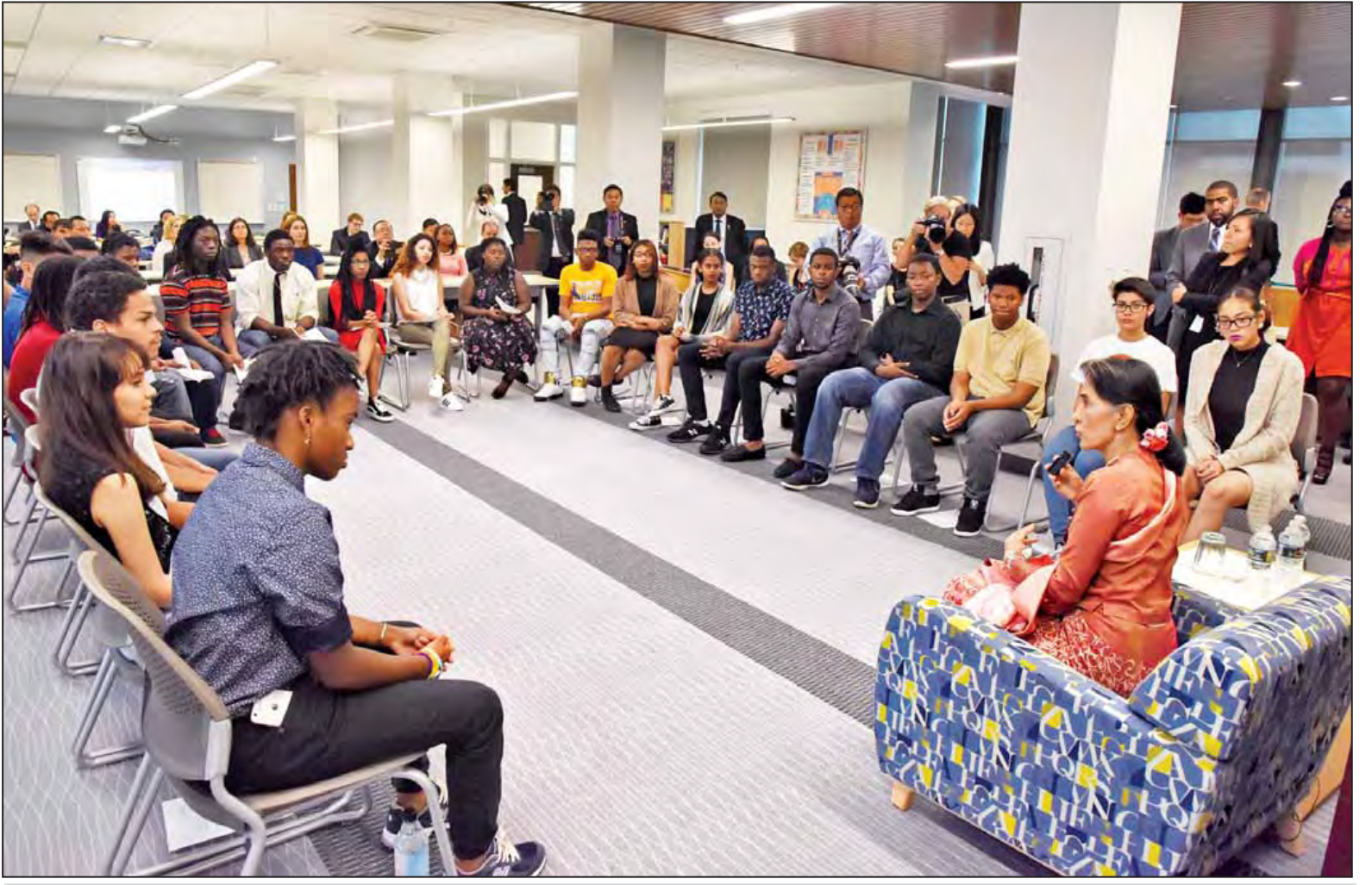
နိုင်ငံတော်၏အတိုင်ပင်ခံပုဂ္ဂိုလ် ဒေါ်အောင်ဆန်းစုကြည် ဝါရှင်တန်မြို့ရှိ Roosevelt Senior High School သို့ သွားရောက်၍ အထက်တန်းအဆင့်ကျောင်းသားများနှင့် ရင်းရင်းနှီးနှီးတွေ့ဆုံစဉ်။ (သတင်းစဉ်)

ဝါရှင်တန် စက်တင်ဘာ ၁၆ အမေရိကန်ပြည်ထောင်စု ဝါရှင်တန်မြို့တွင် ရောက်ရှိနေသော နိုင်ငံတော်၏ အတိုင်ပင်ခံပုဂ္ဂိုလ် ဒေါ်အောင်ဆန်းစုကြည်သည် ယမန်နေ့ ဒေသစံတော်ချိန် နံနက် ၉ နာရီခွဲတွင် ဝါရှင်တန်မြို့ရှိ U.S Capitol ၌ အမေရိကန် အောက်လွှတ်တော်အမတ် Minority Leader Rep. Nancy Pelosi နှင့် တွေ့ဆုံသည်။ ထိုသို့တွေ့ဆုံရာတွင် မြန်မာနှင့် အမေရိကန်နှစ်နိုင်ငံအကြား ဆက်ဆံရေးနှင့် ပူးပေါင်းဆောင်ရွက်မှု ပိုမိုတိုးမြှင့်ရေး၊ မြန်မာနိုင်ငံ၏ ဒီမိုကရေစီပြုပြင်ပြောင်းလဲမှု လုပ်ငန်းစဉ်များ ဆက်လက်အောင်မြင်မှု ရရှိစေရေးအတွက် အမေရိကန်လွှတ်တော်က ပံ့ပိုးကူညီပေးသွားနိုင်မည့် အခြေအနေများကို ဆွေးနွေးကြသည်။ ယင်းနောက် နိုင်ငံတော်၏ အတိုင်ပင်ခံပုဂ္ဂိုလ်သည် အမေရိကန် အထက်လွှတ်တော်အမတ် Majority Leader Mitch McConnell နှင့် Senator Harry Reid တို့ ဦးဆောင်သည့်အဖွဲ့နှင့် တွေ့ဆုံသည်။ တွေ့ဆုံစဉ် မြန်မာနိုင်ငံ၏ ဒီမိုကရေစီ အသွင်ကူးပြောင်းရေး လုပ်ငန်းစဉ်များ ဆက်လက်ဖွံ့ဖြိုးတိုးတက်ရေးဆိုင်ရာများ၊ မြန်မာ-အမေရိကန် နှစ်နိုင်ငံအကြား စာမျက်နှာ ၃ ကော်လံ ၁ သို့