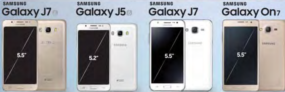
Galaxy J7(2016) , J5(2016) , J7 or On7 မည်သည့်ဖုန်း (၁)လုံး ဝယ်ယူသူမဆို အောက်ပါမေတ္တာလက်ဆောင်များ ရယူပါ...

စက်တင်ဘာလ (၁၂) ရက်နေ့မှ စတင်၍ ပစ္စည်းလက်ကျန်ရှိသည်အထိသာ