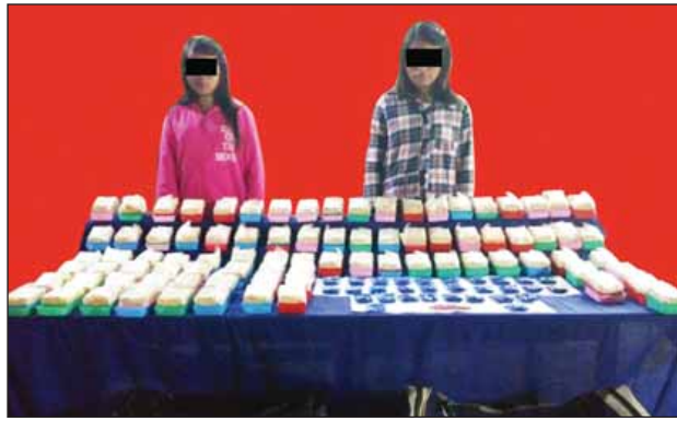
မလှရာ(ခ)အင်ဂွမ်းလူရာ နှင့် မထုနောင်(ခ)အင်ဂွမ်းထုနောင်တို့ နှစ်ဦးအား သိမ်းဆည်းရမိ မူးယစ်ဆေးဝါးများနှင့်အတူ တွေ့ရစဉ်။