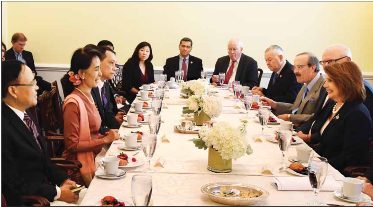
နိုင်ငံတော်၏အတိုင်ပင်ခံပုဂ္ဂိုလ် ဒေါ်အောင်ဆန်းစုကြည် အမေရိကန် အောက်လွှတ်တော်အမတ် Minority Leader Rep. Nancy Pelosi နှင့် တွေ့ဆုံဆွေးနွေးစဉ်။ (သတင်းစဉ်)

ဝါရှင်တန်မြို့မှ ပူးပေါင်းဆောင်ရွက်ရေးဆိုင်ရာ ကိစ္စရပ်များ၊ လူကုန်ကူးမှုတိုက်ဖျက်ရေး၊ တရားမဝင်ကူးသန်းရောင်းဝယ်မှုများ ပပျောက်စေရေးအတွက် လူသားစွမ်းရည် ဖွံ့ဖြိုးတိုးတက်ရေး အကူအညီပေးအပ်မည့်ကိစ္စများအပေါ် ဆွေးနွေးကြသည်။ အလားတူ နိုင်ငံတော်၏အတိုင်ပင်ခံပုဂ္ဂိုလ်သည် ဒေသစံတော်ချိန် နံနက် ၁၁ နာရီတွင် ဝါရှင်တန်မြို့ရှိ U.S Capitol ၌ National Democratic Institute (NDI) , International Republican Institute (IRI) နှင့် House Democracy Partnership တို့က ကျင်းပသည့် Close Door VIP Brunch သို့ တက်ရောက်ပြီး အမှာစကားပြောကြားသည်။ နိုင်ငံတော်၏အတိုင်ပင်ခံပုဂ္ဂိုလ်သည် ဒေသစံတော်ချိန် မွန်းလွဲ ၂ နာရီ တွင် Roosevelt Senior High School သို့ သွားရောက်၍ အထက်တန်းအဆင့်