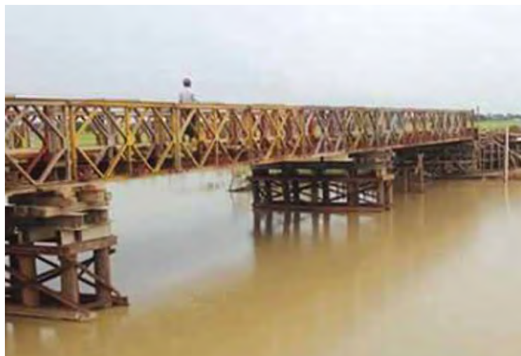
ဆောက်လုပ်ပြီးစီး၍ ကားများ မောင်းနှင်ခွင့်ရသည့်အတွက် ဒေသခံပြည်သူများ ဝမ်းသာလျက်ရှိကြောင်း သိရသည်။ ဝန်ထမ်း(မြို့မ)

တိုက်ကြီး စက်တင်ဘာ ၁၆ တိုက်ကြီးမြို့နယ် အပျောက်-ဥတိုလမ်းပိုင်း ရေကြီးချိန်ရေစီးနှင့်မျောပါခဲ့သော တံတားအမှတ် (၁/၁၀) အစား တံတားအထူးအဖွဲ့ (၁၁) မှ တာဝန်ယူတည်ဆောက်လျက်ရှိသော နှစ်ထပ်ဘေလီတံတားတပ်ဆင်မှုနှင့် လမ်းဦးစီးဌာနမှ ဆောင်ရွက်လျက်ရှိသော တံတားချဉ်းကပ်လမ်းပြီးစီးသဖြင့် စက်တင်ဘာ ၁၄ ရက်မှစတင်၍ ကားများဖြတ်သန်းမောင်းနှင်လျက်ရှိကြောင်း သိရသည်။