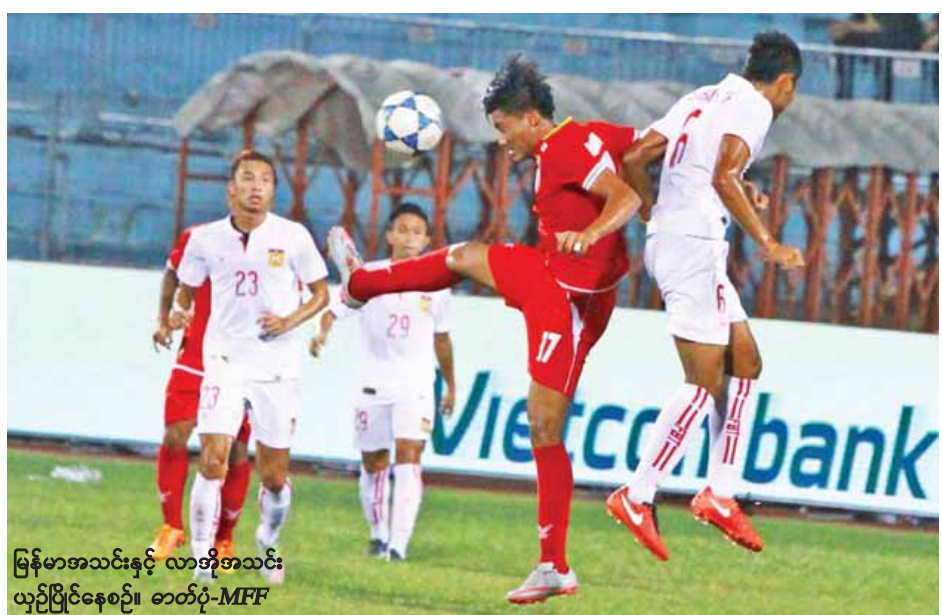
မြန်မာအသင်းနှင့် လာအိုအသင်း ယှဉ်ပြိုင်နေစဉ်။