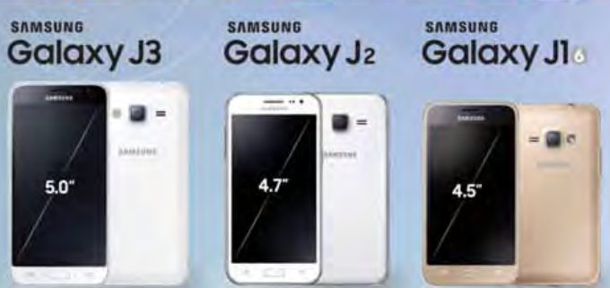
Galaxy J3 , J2 , J1(2016) မည်သည့်ဖုန်း (၁)လုံး ဝယ်ယူသူမဆို အောက်ပါ မေတ္တာလက်ဆောင်များ ရယူပါ...