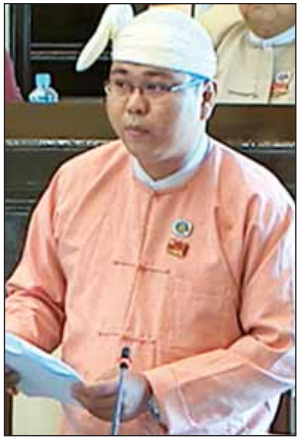
ဦးအေးမင်းဟန်

လမ်းပေါ်နေ ကလေးများနှင့် တောင်းရမ်းစားသောက်သူများ၊ ခိုကိုးရာမဲ့များ၊ စောင့်ရှောက်သူမဲ့ မသန်စွမ်းသူများအား ကာကွယ်စောင့်ရှောက်ရေးနှင့် လူ့အသိုင်းအဝိုင်းအတွင်း ပြန်လည်ဝင်ဆန့်နိုင်ရေးအတွက် ရှေ့ပြေးစီမံချက်ရေးဆွဲပြီး အကောင်အထည်ဖော် ဆောင်ရွက်နိုင်ရန် ကြိုးပမ်းဆောင်ရွက်လျက်ရှိကြောင်း လူမှုဝန်ထမ်း၊ ကယ်ဆယ်ရေးနှင့် ပြန်လည်နေရာချထားရေးဝန်ကြီးဌာန ပြည်ထောင်စုဝန်ကြီး ဒေါက်တာဝင်းမြတ်အေးက ပြောကြားသည်။