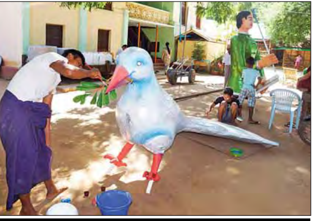
မန္တဟာဘုရားဗုဒ္ဓပူဇော်ယဉ်ပွဲတော် အရပ်သွန်းပွဲတွင် ပါဝင်ပြသမည့် (၂၁)ရာစုပင်လုံညီလာခံဂုဏ်ပြုသရုပ်ဖော် ချီးဖြူငှက်နှင့်လူရုပ်ကို ပြင်ဆင် ဆောင်ရွက်နေကြစဉ်။

မြို့ရှေ့၊ မြို့ညွှန့်၊ စိန်ကုန်း၊ မြို့လယ်၊ ရွှေခြံရပ်များမှ ဒေသခံပြည်သူများက အရပ်သွန်းပွဲတော်တွင် ဦးစားပေး ပါဝင်ဆင်နွှဲကြကြောင်း သိရသည်။ “ဒီနှစ်အရပ်တွေက လူငယ်၊ လူကြီး တွေက အကုန်ချီးကြတော့ များမယ် လို့တော့ထင်ပါတယ်။ အရပ်ချီးတဲ့ ပညာက မိရိုးဖလာ ဖြစ်နေတော့ ကလေးတွေကအစချီးတတ်တယ်။ အခုကျွန်တော်တို့ချီးနေတဲ့ အရပ်က (၂၁)ရာစုပင်လုံညီလာခံကို ဂုဏ်ပြုတဲ့ အနေနဲ့သရုပ်ဖော်ထားတဲ့ ချီးဖြူငှက် နဲ့ လူရုပ်ပါ။ ၁၅ ရက် လောက်ကြာပါ ပြီ။ အခုတော့ နောက်ဆုံးအဆင့်အနေ နဲ့ ဆေးသုတ် အချောကိုင်နေတာပါ” ဟု မန္တဟာဘုရားတော်ကြီးကျောင်း ကိုယ်စားပြု အရပ်သွန်းမည့်တာဝန် ရှိသူတစ်ဦးကပြောသည်။ အဆိုပါ အရပ်သွန်းပွဲတော်ကို စက်တင်ဘာ ၁၅ ရက်(တော်သလင်း လဆန်း ၁၄ ရက်) မွန်းလွဲ ၂ နာရီမှ စတင်၍ ကျင်းပမည်ဖြစ်ကြောင်း၊ တော်သလင်းလပြည့်နေ့တွင် ဘုရား ကြီးရင်ပြင်တော်၌ သံယာတော်များ အား ဆွမ်းသပိတ်လှူဆက်ကပ်လှူဒါန်း ပွဲ ကျင်းပသွားမည်ဖြစ်ကြောင်း သိရ သည်။