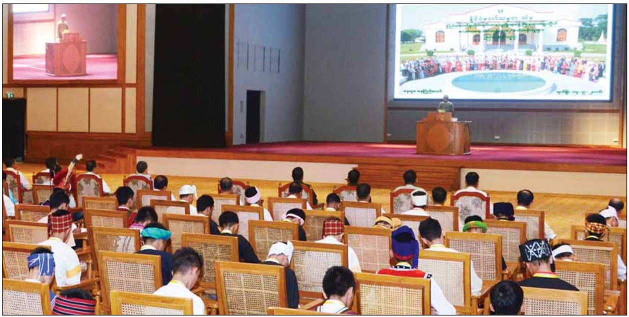
နိုင်ငံတော်သမ္မတ ဦးထင်ကျော် ပြည်ထောင်စုတိုင်းရင်းသားလူမျိုးများဖွံ့ဖြိုးရေးတက္ကသိုလ် မူလတန်းဆရာအတတ်သင် (၃)နှစ် သင်တန်းအမှတ်စဉ် (၄၅)မှ သင်တန်းသား သင်တန်းသူများအား ဩဝါဒစကား ပြောကြားစဉ်။ (သတင်းစဉ်)

တိုင်းရင်းသားများအများစုနေထိုင်ရာ နယ်စပ်ဒေသများသည် အတိတ် သမိုင်း၏ အခြေအနေအရပ်ရပ်ကြောင့် ဖွံ့ဖြိုးမှုနောက်ကျခဲ့သည်ကို တွေ့ရမည်