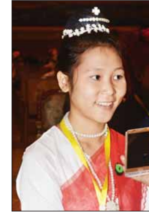
မနင်းပွင့်ဖြူ

နိုင်ငံတော်သမ္မတကြီး ပြောသွားတဲ့ အထဲမှာ ငြိမ်းချမ်းရေးနဲ့ မူးယစ်ဆေးဝါးအကြောင်းလည်းပါတယ်။ ဟုတ်ပါတယ်။ ငြိမ်းချမ်းမှုသာ နိုင်ငံတစ်နိုင်ငံက ဖွံ့ဖြိုးတိုးတက်မှာဖြစ်ပါတယ်။ ကိုယ့်တာဝန်၊ ကိုယ့်အသိစိတ်နဲ့ကိုယ် ထမ်းဆောင်နေမယ်ဆိုရင် မငြိမ်းချမ်းမှုဆိုတာ ဖြစ်လာမှာမဟုတ်ဘူး။ မူးယစ်ဆေးဝါးဆိုတာ အခုခေတ်လူငယ်တွေကြားမှာ ပျံ့နှံ့နေပါတယ်။ အခုခေတ်လူငယ်တွေက လက်တွေ့