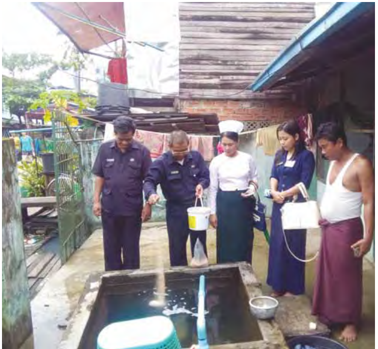
ရန်ကုန် စက်တင်ဘာ ၁၄

ကျွန်ုပ်တို့ လူသားအားလုံး သာယာပျော်ရွှင်စရာကောင်းသော ပတ်ဝန်းကျင်ကောင်းများ ရှာဖွေပိုင်ဆိုင်နိုင်ကြပါစေဟု ဆန္ဒပြုရင်း။