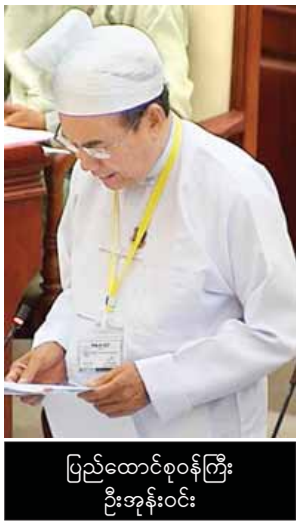
ပြည်ထောင်စုဝန်ကြီး ဦးအုန်းဝင်း

နှင့် ပစ္စည်းများတင်သွင်းခြင်းတွင် လက်ရှိတည်ဆဲဥပဒေ၊ နည်းဥပဒေများနှင့်အညီ ဆောင်ရွက်လျက်ရှိပြီး စာချုပ်သက်တမ်းကုန်ဆုံးချိန်တွင် အမှတ်(၁)သတ္တုထွင်း လုပ်ငန်းပိုင်ပစ္စည်းများဖြစ်လာမည်ဖြစ်ကြောင်း၊ ကုမ္ပဏီတည်ဆောက်ရေးကာလ ကို ပထမအကြိမ်အဖြစ် ၂၀၁၃ ခုနှစ် နိုဝင်ဘာလ ၁၂ ရက်မှ ၂၀၁၄ ခုနှစ် စက်တင်ဘာလ ၁၁ ရက်ထိသတ်မှတ်ခဲ့ပြီး ဒုတိယအကြိမ်အဖြစ် ၂၀၁၄ ခုနှစ် စက်တင်ဘာလ ၁၁ ရက်မှ ၂၀၁၅ ခုနှစ် ဇူလိုင်လ ၁၂ ရက်ထိ တိုးမြှင့်ခွင့်ပြုခဲ့ ကာ စီးပွားဖြစ်စတင်သောနေ့ကို ၂၀၁၅ ခုနှစ် ဇူလိုင်လ ၁၂ ရက်အဖြစ် အတည်ပြု သတ်မှတ်ခဲ့ပါကြောင်း ဖြေကြားသည်။