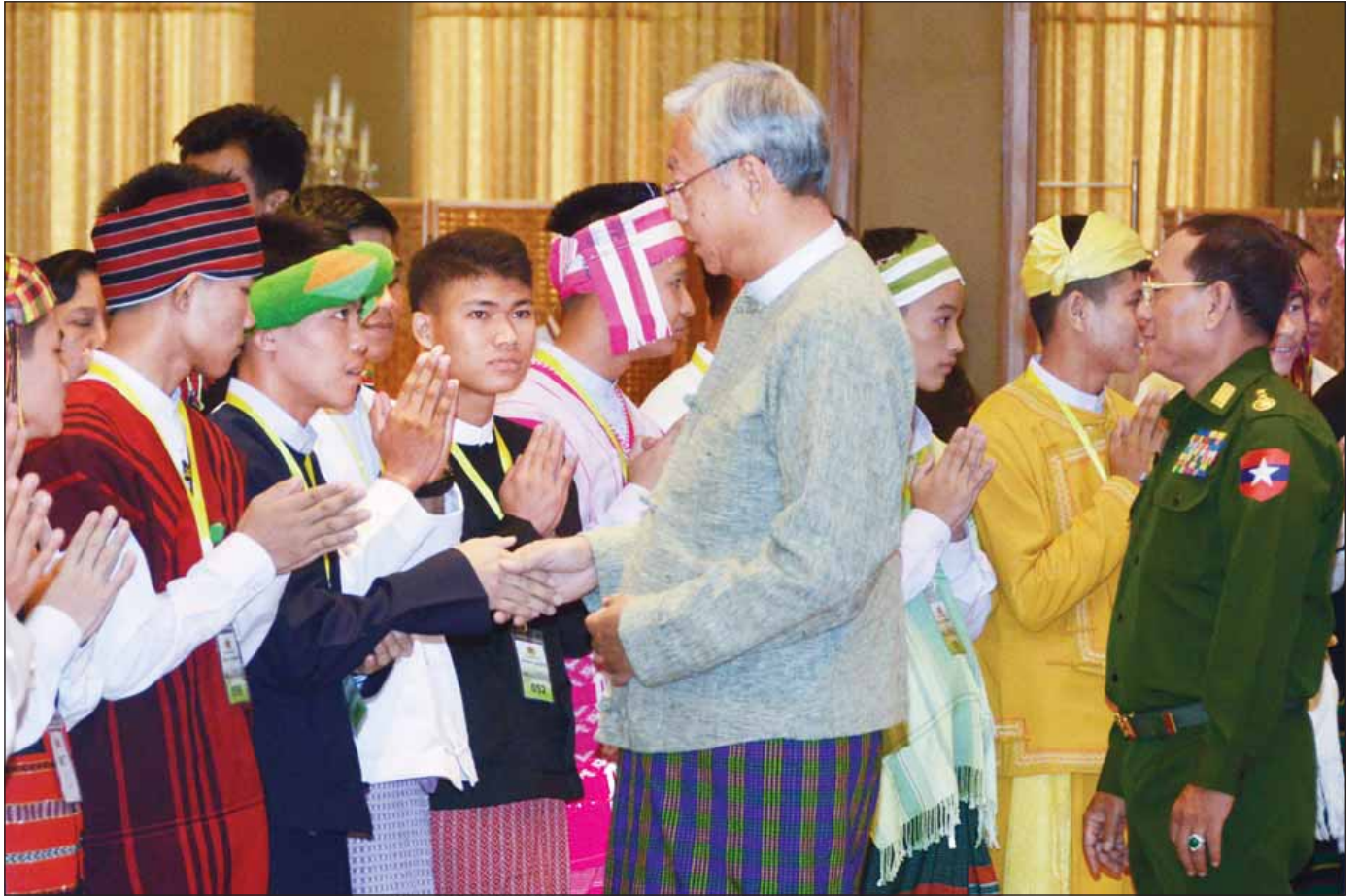
ပြည်ထောင်စုတိုင်းရင်းသားလူမျိုးများဖွံ့ဖြိုးရေးတက္ကသိုလ်မှ သင်တန်းသား သင်တန်းသူများအား နိုင်ငံတော်သမ္မတ ဦးထင်ကျော် ခင်မင်ရင်းနှီးစွာ နှုတ်ဆက်စဉ်။ (သတင်းစဉ်)