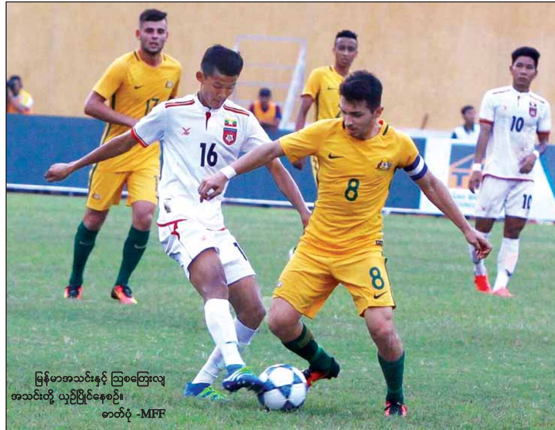
မြန်မာအသင်းနှင့် ဩစတြေးလျ အသင်းတို့ ယှဉ်ပြိုင်နေစဉ်။