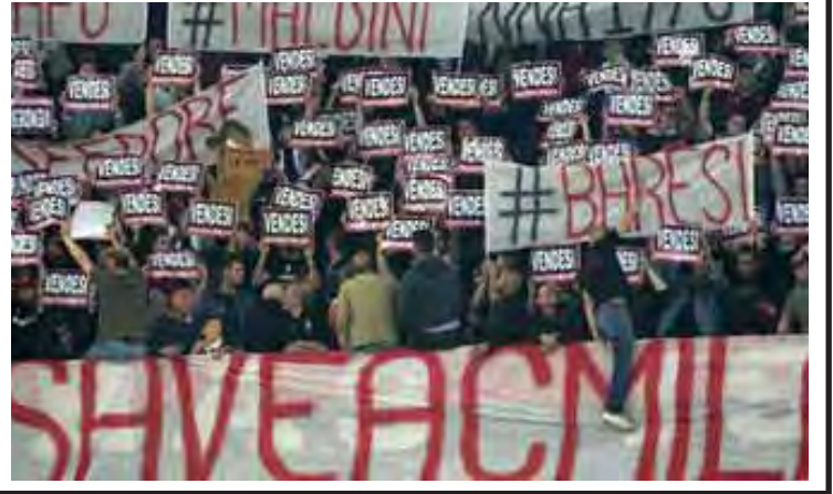
မေလဲ့သင်း

ကြိုးပမ်းသွားမယ့်လို့ ကျွန်တော်တို့က ကတိပြုနိုင်ပါတယ်” ဟု ဆိုလိုက်သည်။ အေစီမီလန်အသင်းသည် ချန်ပီယံလိဂ် ခုနစ်ကြိမ်အထိ ဆွတ်ခူးထားသော အသင်းဖြစ်သောကြောင့် ဥရောပဘောလုံး သမိုင်းတွင် ရိုးယဲလ်မက်ဒရစ်ပြီးလျှင် ဒုတိယအအောင်မြင်ဆုံးကလပ်အသင်းအဖြစ် ရပ်တည်နေသော်လည်း ပြီးခဲ့သည့်ရာသီ စီရီးအေတွင် အဆင့်(၇)နေရာဖြင့်သာ ရာသီသိမ်းနိုင်ခဲ့သည်။