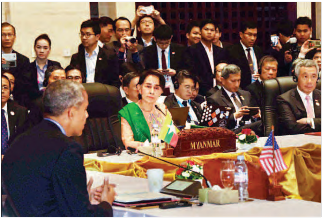
နိုင်ငံတော်၏အတိုင်ပင်ခံပုဂ္ဂိုလ် ဒေါ်အောင်ဆန်းစုကြည် စတုတ္ထအကြိမ်မြောက် အာဆီယံ-အမေရိကန် ထိပ်သီးအစည်းအဝေးသို့ တက်ရောက်စဉ်။ (သတင်းစဉ်)

ဗီယင်ကျန်း စက်တင်ဘာ ၈ နိုင်ငံတော်၏အတိုင်ပင်ခံပုဂ္ဂိုလ် ဒေါ်အောင်ဆန်းစုကြည်သည် ယနေ့တွင် လာအို ပြည်သူ့ဒီမိုကရက်တစ်သမ္မတနိုင်ငံ ဗီယင်ကျန်းမြို့ အမျိုးသားကွန်ဂရက်အစည်းအဝေးနှင့် (၁၁) ကြိမ်မြောက် အရှေ့အာရှထိပ်သီးအစည်းအဝေးနှင့် အာဆီယံနှင့် ဆွေးနွေးဖက်နိုင်ငံများ ထိပ်သီးအစည်းအဝေးများသို့ တက်ရောက်သည်။ နိုင်ငံတော်၏အတိုင်ပင်ခံပုဂ္ဂိုလ်သည် အဖွဲ့ဝင်များနှင့်အတူ ဒေသစံတော်ချိန် နံနက် ၉ နာရီတွင် ဗီယင်ကျန်းမြို့ အမျိုးသားကွန်ဂရက်အစည်းအဝေးနှင့် ကျင်းပသည့် (၁၄)ကြိမ်မြောက် အာဆီယံ-အိန္ဒိယထိပ်သီးအစည်းအဝေးနှင့် ဒေသစံတော်ချိန် ၁၀ နာရီ မိနစ် ၄၀ တွင် ကျင်းပ သည့် စတုတ္ထအကြိမ်မြောက် အာဆီယံ-အမေရိကန် စာမျက်နှာ ၈ ကော်လံ ၁ သို့ ☉