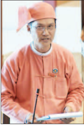
ဦးဟန်ဝင်းသိန်း

နိုင်ငံတော် အစိုးရအနေဖြင့် တိုင်းရင်းသား မျိုးနွယ်စုအားလုံး တစ်ပြေးညီ ဖွံ့ဖြိုးတိုးတက်စေရန် ကျေးလက်နှင့် တောင်ပေါ်ဒေသနေ တိုင်းရင်းသားလူမျိုးများကို ယခုထက် ပို၍ အဆင့်မြင့်ပညာဆည်းပူးလေ့လာခွင့်ရစေရန် ဆောင်ရွက်ပေးသင့်ကြောင်း၊ တပ်မတော်သား လွှတ်တော်ကိုယ်စားလှယ် ဒုတိယပုံမှန်ကြီး ရဲနိုင်ဦးက ယနေ့ နံနက် ၁၀ နာရီတွင် ကျင်းပသည့် အမျိုးသားလွှတ်တော် အစည်းအဝေး၌ မန္တလေးတိုင်းဒေသကြီး မဲဆန္ဒနယ် အမှတ်(၈)မှ ဦးခင်အောင်မြင့်၏ တိုင်းရင်းသား မျိုးနွယ်စုများအတွက် စာမတတ်သူ ပပျောက်ရေး၊ အဆင့်မြင့်ပညာသင်