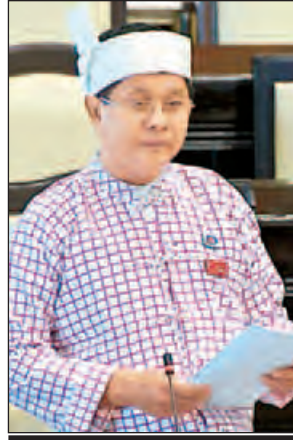
ဦးနိုင်သီဟ

တနင်္သာရီတိုင်းဒေသကြီး မဲဆန္ဒနယ် အမှတ်(၄)မှ ဦးဟန်ဝင်းသိန်းက အဆိုကို ပါဝင်ဆွေးနွေးကြသည့် ကိုယ်စားလှယ် အရေအတွက်ကို ကြည့်ခြင်းအားဖြင့် ပညာရေးလိုအပ်ချက်သည် မိမိတို့တိုင်းပြည်တွင် အလွန်အရေးကြီးကြောင်းနှင့် ပညာရေးနှင့်ပတ်သက်၍ ပြည်နယ်/ပြည်မ တန်းတူရရှိခွင့်ရရှိရေးသည် အလွန်လိုအပ်သည်မှာ သိသာထင်ရှားနေပါကြောင်း၊ မည်သည့်တိုင်းရင်းသားဖြစ်စေ ဝေးလံခေါင်သီသည့် နေရာများတွင် စာမတတ်သူအရေအတွက် ပိုမိုများပြားပါကြောင်း၊ ပညာရေးကို ပြုပြင်ပြောင်းလဲရေး အသွင်တစ်ရပ်အနေဖြင့် ဆောင်ရွက်သင့်ပါကြောင်း၊ တိုင်းပြည် ပြုပြင်ပြောင်းလဲရေးနှင့် ရေရှည်ဖွံ့ဖြိုးတိုးတက်ရေးအတွက် ပညာရေးရင်းနှီးမြှုပ်နှံမှုသည် အဓိကအကျဆုံးသော အရင်းအနှီးတစ်ခုဖြစ်ပါကြောင်း၊ ပညာရေးပြုပြင်ပြောင်းလဲမှုသည် စီးပွားရေးနှင့် လူမှုရေးဖွံ့ဖြိုးတိုးတက်မှုများသာမက စစ်ရေးနှင့် နိုင်ငံရေးတို့ကိုပါ အထောက်အပံ့ပြုပါကြောင်း၊ လူသားသယံဇာတများ ထုတ်ယူသွားစွဲနိုင်ရန် ပညာရေးကို ရင်းနှီးမြှုပ်နှံသင့်ပါကြောင်း၊ အဆိုကို မှတ်တမ်းအဖြစ်ထားရှိသင့်ကြောင်း ဆွေးနွေးသည်။