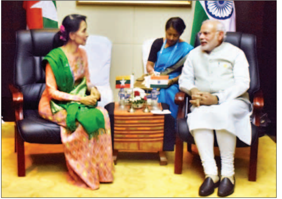
နိုင်ငံတော်၏အတိုင်ပင်ခံပုဂ္ဂိုလ် ဒေါ်အောင်ဆန်းစုကြည်နှင့် အိန္ဒိယနိုင်ငံဝန်ကြီးချုပ် မစ္စတာ နာရင်ဒရာမိုဒီ တွေ့ဆုံဆွေးနွေးစဉ်။ (သတင်းစဉ်)