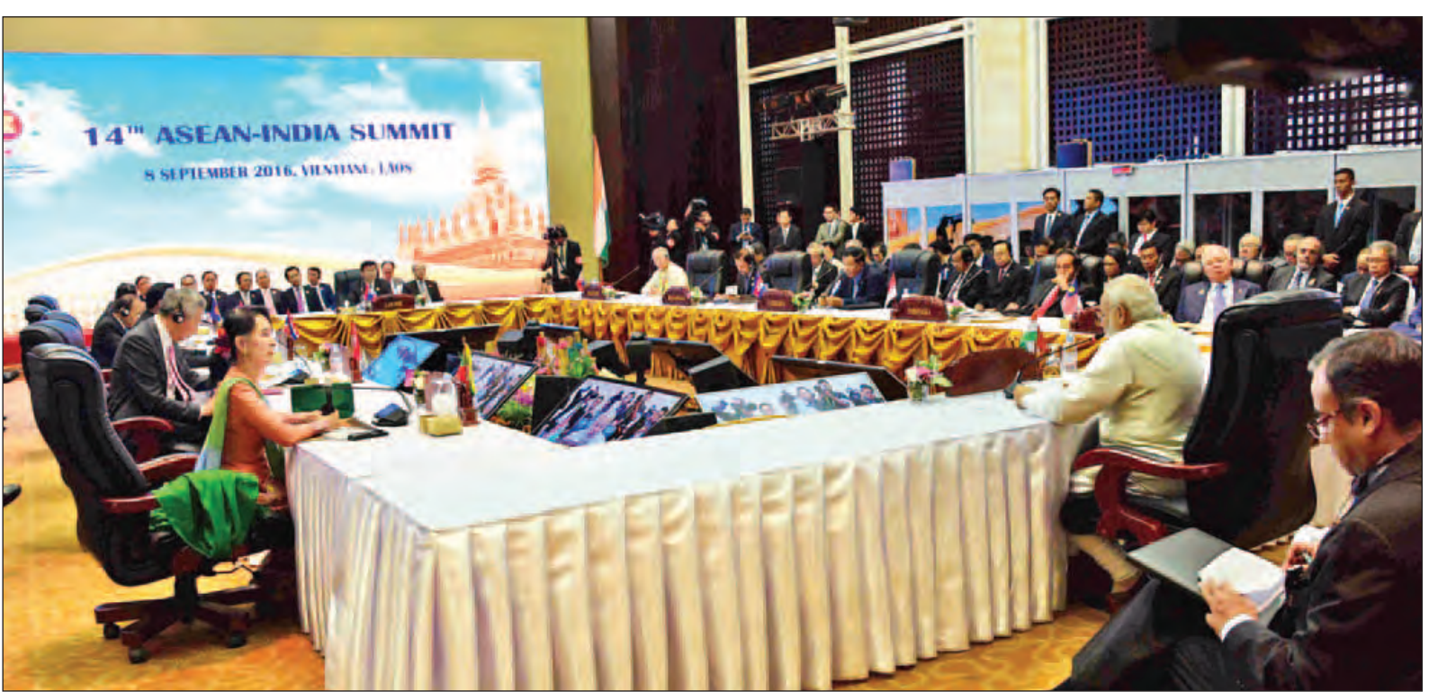
နိုင်ငံတော်၏အတိုင်ပင်ခံပုဂ္ဂိုလ် ဒေါ်အောင်ဆန်းစုကြည် (၁၄)ကြိမ်မြောက် အာဆီယံ-အိန္ဒိယ ထိပ်သီးအစည်းအဝေးသို့ တက်ရောက်စဉ်။ (သတင်းစဉ်)

နိုင်ငံတော်၏အတိုင်ပင်ခံပုဂ္ဂိုလ်မှ ထိပ်သီးအစည်းအဝေးနှင့် ဒေသစံတော်ချိန် နံနက် ၁၂ နာရီခွဲတွင် ဆက်လက်ကျင်းပသည့် (၁၁)ကြိမ်မြောက် အရှေ့အာရှ ထိပ်သီးအစည်းအဝေးများသို့ တက်ရောက်သည်။ အဆိုပါ အစည်းအဝေးများသို့ အာဆီယံအလှည့်ကျဥက္ကဋ္ဌ၊ လာအိုပြည်သူ့ဒီမိုကရက်တစ်သမ္မတနိုင်ငံ ဝန်ကြီးချုပ်၊ အာဆီယံအဖွဲ့ဝင်နိုင်ငံများဖြစ်သည့် ဘရူနိုင်း၊ ကမ္ဘောဒီးယား၊ မလေးရှား၊ မြန်မာ၊ အင်ဒိုနီးရှား၊ ဖိလစ်ပိုင်၊ စင်ကာပူ၊ ထိုင်းနှင့် ဗီယက်နမ်နိုင်ငံတို့မှ နိုင်ငံအကြီးအကဲ၊ အစိုးရအဖွဲ့အကြီးအကဲများ၊ ဆွေးနွေးဖက်နိုင်ငံများမှ နိုင်ငံအကြီးအကဲများ၊ အစိုးရအဖွဲ့အကြီးအကဲများ၊ အာဆီယံနှင့် ဆွေးနွေးဖက်နိုင်ငံများမှ ဝန်ကြီးများ၊ အဆင့်မြင့်အရာရှိကြီးများ၊ အာဆီယံ အတွင်းရေးမှူးချုပ်၊ အာဆီယံဆိုင်ရာ အမြဲတမ်းကိုယ်စားလှယ်များ၊ အာဆီယံအစိုးရချင်းဆိုင်ရာ လူ့အခွင့်အရေး ကော်မရှင်ကိုယ်စားလှယ်များ၊ ဖိတ်ကြားထားသည့်