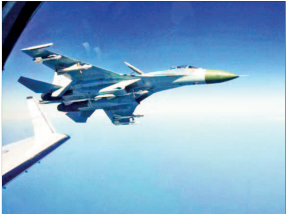
ယခုနှစ်အတွင်း အမေရိကန်နှင့် ရုရှားအကြား တွေ့သည့်ဖြစ်ရပ်မှာ ပထမဆုံးအကြိမ်ဖြစ်သည်။ စစ်လေယာဉ်များ သို့မဟုတ် စစ်ရေယာဉ်များ ထိပ်တိုက် ဆင်ယူ။

ပင်လယ်နက်ဒေသ ဝေဟင်အတွင်း မိမိတို့၏ လေကြောင်းပိုင်နက်ဘက်သို့ ချဉ်းကပ်လာသော အမေရိကန် သူလျှိုလေယာဉ်များကို ကြားဖြတ်ဟန့်တားနိုင်ရန် ခရိုင်းမီးယားဒေသအခြေစိုက် အက်စ်ယူ-၂၇ ဂျက်တိုက်လေယာဉ်များကို စေလွှတ်ခဲ့ရသည်ဟု ရုရှားကာကွယ်ရေး ဝန်ကြီးဌာန၏ ကြေညာချက်တွင် ဖော်ပြသည်။