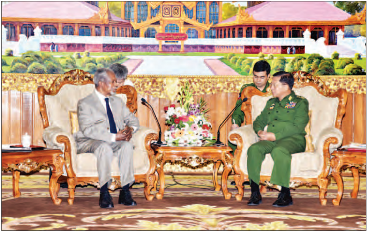
စိုးရိမ်ပူပန်မှုအသီးသီးကိုလည်း ကြားသိခဲ့ရပါကြောင်း၊ နိုင်ငံသားစိစစ်ရေး ခြင်းဖြင့် ပြဿနာကို ပြေလည်အောင်ဖြေရှင်းနိုင်မည့် နည်းလမ်းများကို လေ့လာလုပ်ငန်းစဉ်သည် ဆက်လက်ဆောင်ရွက်သင့်ပြီး ဥပဒေနှင့်အညီ ဆောင်ရွက် လုပ်ဆောင်သွားမည်ဖြစ်ကြောင်း ပြန်လည်ပြောကြားသည်။ (သတင်းစဉ်)

မစ္စတာ ကိုဖီအာနန်က ယခုကဲ့သို့ ရှင်းလင်းပြောကြားပေး၍ မိမိအတွက် သမိုင်း အသိရပြီး အနာဂတ်ကိုမြော်မြင်နိုင်မှုအတွက် ကျေးဇူးတင်ရှိပါကြောင်း၊ မိမိတို့ကော်မရှင်အနေဖြင့် ယခုကဲ့သို့အတွက် ဆုံးဖြတ်ချက်ပေးခြင်းမဟုတ်ဘဲ Stakeholder များ၊ နှစ်ဖက်အသိုက်အဝန်းများနှင့်တွေ့ဆုံ၍ လေ့လာသုံးသပ်ပြီး အကြံပေးခြင်း၊ အကြံပြုခြင်းများသာ ဆောင်ရွက်သွားမည်ဖြစ်ကြောင်း၊ နိုင်ငံသားဖြစ်မှု၊ မဖြစ်မှုကိုစွဲတစ်ခုတည်းသာမက ဒေသဖွံ့ဖြိုးတိုးတက်မှုအပါအဝင် ဘက်စုံထောင့်စုံမှ လေ့လာဆောင်ရွက်သွားမည်ဖြစ်ကြောင်း၊ မိမိရခိုင်ဒေသသို့ သွားရောက်ခဲ့သည့် ခရီးစဉ်တွင် နှစ်ဖက်အသိုက်အဝန်း၏