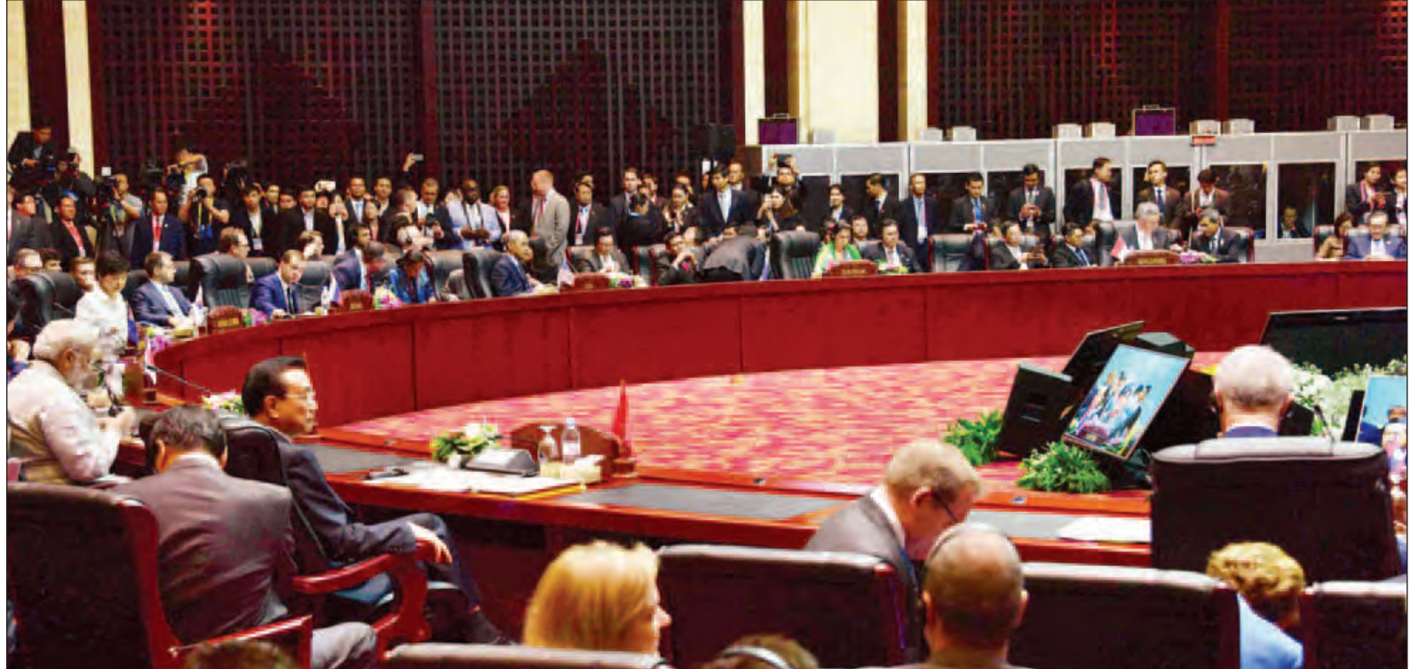
နိုင်ငံတော်၏အတိုင်ပင်ခံပုဂ္ဂိုလ် ဒေါ်အောင်ဆန်းစုကြည် (၁၁)ကြိမ်မြောက် အရှေ့အာရှထိပ်သီးအစည်းအဝေးသို့ တက်ရောက်စဉ်။ (သတင်းစဉ်)