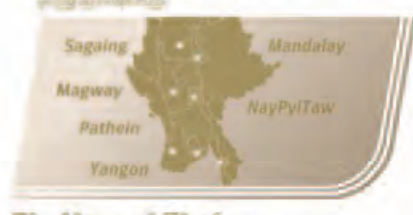
မြန်မာနိုင်ငံအတွက် မြန်မာနိုင်ငံအတွက် အရောင်းဌာနများ