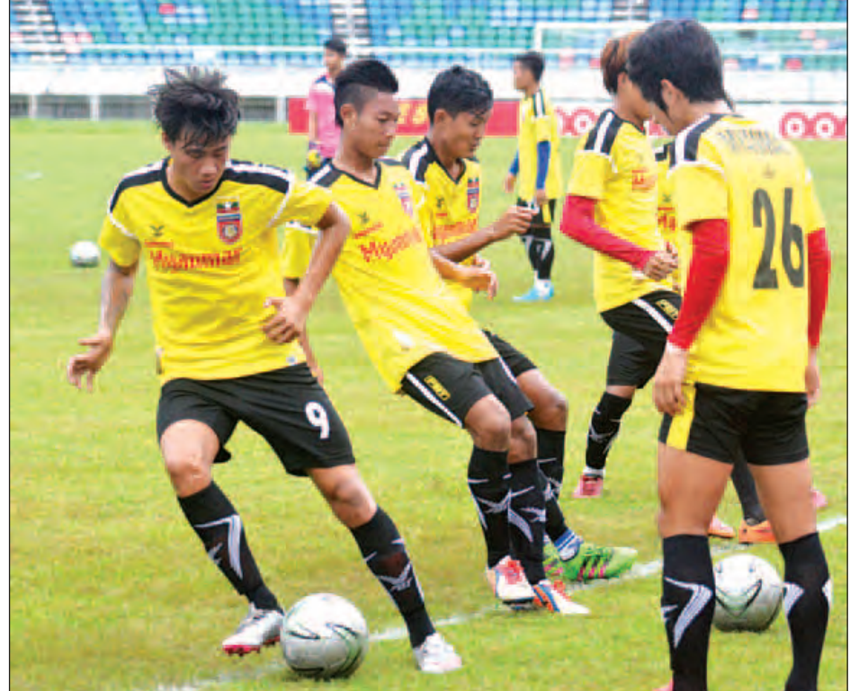
မြန်မာယူ-၁၉ အသင်းပြိုင်ပွဲမတိုင်မီ လေ့ကျင့်နေစဉ်။

ရန်ကုန် စက်တင်ဘာ ၈ ကုလသမဂ္ဂအတွင်းရေးမှူးချုပ်ဟောင်း ရခိုင်ပြည်နယ်ဆိုင်ရာအကြံပေးကော်မရှင်ဥက္ကဋ္ဌ မစ္စတာကိုဖီအာနန်သည် ၎င်း၏ ခရီးစဉ်နှင့်စပ်လျဉ်းသည့် သတင်းစာရှင်းလင်းပွဲကို ယနေ့ ညနေပိုင်းတွင် ရန်ကုန်မြို့ ဆူးလေရှန်ဂရီလာဟိုတယ် မန္တလေးခန်းမ၌ ကျင်းပသည်။ (အပေါ်ပုံ) မစ္စတာ ကိုဖီအာနန်က တက်ရောက်လာကြသည့် ပြည်တွင်း ပြည်ပသတင်းဌာနများအား ပဏာမရှင်းလင်းပြောကြားရာတွင် ကော်မရှင်၏လုပ်ငန်းတာဝန်နှင့် ဦးတည်ချက်သည် အကြံပေးရန်ဖြစ်ကြောင်း၊ ရခိုင်ပြည်နယ်အတွင်း ရှုပ်ထွေးသိမ်မွေ့သည့်ကိစ္စရပ်များကို ဖြေရှင်းချက်ရရှိနိုင်ရန် နိုင်ငံတကာစံနှုန်းများနှင့်အညီ ဆောင်ရွက်နိုင်ရန် အကြံပြုသွားမည်ဖြစ်ကြောင်း၊ ကော်မရှင်သည် နိုင်ငံတော်အစိုးရကို အကြံပြုမည့်အဖွဲ့အစည်းဖြစ်ပါကြောင်း၊ မိမိတို့သည် တိတိကျကျ လုံးဝဘက်မလိုက်ဘဲ ကြားနေလုပ်ဆောင်သွားမည်ဖြစ်ကြောင်း ပြောကြားသည်။ ဆက်လက်၍ လုပ်ငန်းတာဝန်များအနေဖြင့် ကျယ်ပြန့်ပါကြောင်း၊ အဆိုပါအကြောင်းအရာများမှ အဓိကအကြံပြုသွားမည် စာမျက်နှာ ၃ ကော်လံ ၃ သို့ ၀