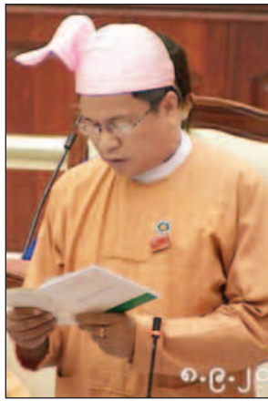
ဦးမြင့်လွင်

အစည်းအဝေးတွင် ပုဇွန်တောင်မဲဆန္ဒနယ်မှ လွှတ်တော်ကိုယ်စားလှယ် ဦးမြင့်လွင်၏ ပြည်ထောင်စုတရားလွှတ်တော်ချုပ်သည် တရားမဒုတိယအယူခံမှု/ပြင်ဆင်မှု/ရာဇဝတ်အယူခံမှု/ပြင်ဆင်မှု (တစ်ပါးထိုင်)အမှုများကို အထက်မြန်မာပြည်အတွက် မန္တလေးမြို့၌လည်းကောင်း၊ အောက်မြန်မာပြည်အတွက် ရန်ကုန်မြို့၌လည်းကောင်း ရုံးထိုင်စစ်ဆေးပေးရန် အစီအစဉ် ရှိ/မရှိ မေးခွန်းနှင့်စပ်လျဉ်း၍ ပြည်ထောင်စုတရားလွှတ်တော်ချုပ်တရားသူကြီး ဦးစိုးညွန့်က ပြည်ထောင်စုတရားစီရင်ရေးဥပဒေပုဒ်မ ၁၀ တွင် ပြည်ထောင်စုတရားလွှတ်တော်ချုပ်သည် နေပြည်တော်တွင် ရုံးထိုင်ရမည်ဟု ပြဋ္ဌာန်းထားပါကြောင်း၊ ပြည်ထောင်စုတရားလွှတ်တော်ချုပ်သည် နိုင်ငံတော်၏ အမြင့်ဆုံးတရားရုံးဖြစ်ပြီး နောက်ဆုံးအဆင့်ဖြစ်သည့် အယူခံမှုများကို ရုံးထိုင်ကြားနာခြင်းဖြစ်ပါကြောင်း၊ ပြည်ထောင်စုတရားလွှတ်တော်ချုပ်အနေဖြင့် ပြည်ထောင်စုတရားစီရင်ရေးဥပဒေတွင် ပြဋ္ဌာန်းထားသည့် အခြားဝန်ကြီးဌာနများ၊ ဗဟိုအဖွဲ့အစည်းများကဲ့သို့ နေပြည်တော်တွင်ရုံးထိုင်၍ အမှုတွဲများကို စစ်ဆေးစီရင်ခြင်းဖြစ်ပါကြောင်း၊ နေပြည်တော်သည် မြန်မာနိုင်ငံ၏ ဗဟိုအချက်အချာအလယ်ဗဟိုတွင်ရှိသည့်အတွက် အထက်ဒေသများဖြစ်သည့် ကချင်၊ ရှမ်း