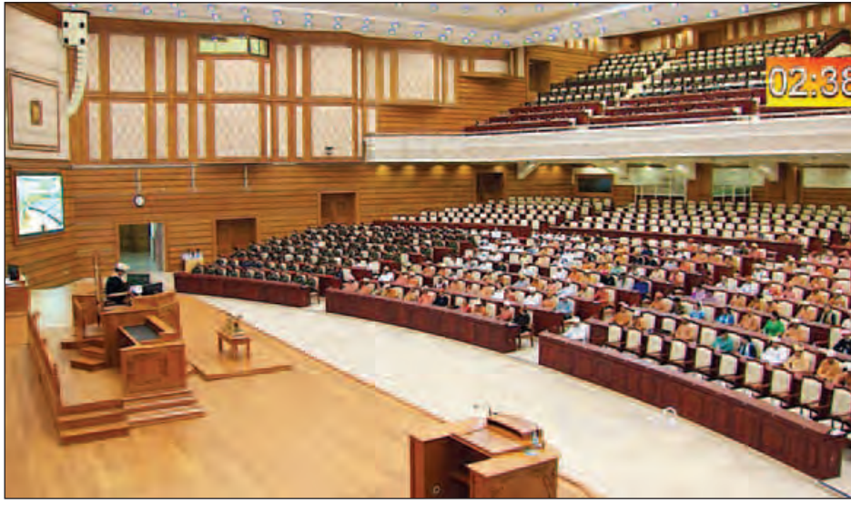
ဒုတိယအကြိမ်ပြည်သူ့လွှတ်တော် ဒုတိယပုံမှန်အစည်းအဝေး ကျင်းပစဉ်။ (သတင်းစဉ်)

ဒုတိယအကြိမ်ပြည်သူ့လွှတ်တော် ဒုတိယပုံမှန်အစည်းအဝေး (၂၇)ရက်မြောက်နေ့ကို ယနေ့ နံနက် ၁၀ နာရီတွင် ကျင်းပရာ ပေါက်တောမဲဆန္ဒနယ်မှ ဦးအောင်ကျော်ဇံ၏ နိုင်ငံတော်အတိုင်ပင်ခံရုံးဝန်ကြီးဌာန၏ ၂၀၁၆ ခုနှစ် ဩဂုတ်လ ၂၄ ရက် သတင်းထုတ်ပြန်ချက်အရ ဖွဲ့စည်းသွားမည့် ရခိုင်ပြည်နယ်ဆိုင်ရာအကြံပေးကော်မရှင်တွင် နိုင်ငံခြားသား(၃)ဦးပါဝင်နေခြင်းသည် မိမိနိုင်ငံ၏ ပြည်တွင်းရေးပြဿနာကို နိုင်ငံတကာပြဿနာအဖြစ် ဖန်တီးရာရောက်စေသဖြင့် အဆိုပါကော်မရှင်တွင် ပြည်တွင်းမှ တတ်သိပညာရှင်များဖြင့်သာ ပါဝင်ဖွဲ့စည်းသင့်ကြောင်း နိုင်ငံတော်အစိုးရအားတိုက်တွန်းသည့် အရေးကြီးအဆိုနှင့် စပ်လျဉ်း၍ လွှတ်တော်ကိုယ်စားလှယ်များ၏ သဘောထားခံယူရာ ထောက်ခံမဲ (၁၄၈)မဲ၊ ကန့်ကွက်မဲ (၂၅၀) ကြားနေမဲ (၁)မဲဖြင့် ပြည်သူ့လွှတ်တော်ဥက္ကဋ္ဌ ဦးဝင်းမြင့်က အတည်မပြုကြောင်း ကြေညာသည်။