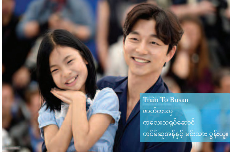
Train To Busan ဇာတ်ကားမှ တလေးသရုပ်ဆောင် တင်မိဆူအန်နှင့် မင်းသား တွန်းယူ။

မေလအတွင်းက တောင်ကိုရီးယား ရုပ်ရှင်လောကမှ နိုင်ငံတကာရုပ်ရှင် ဈေးကွက်သို့ အရှိန်ပြင်းပြင်းနဲ့ ဝင်ရောက်လာတဲ့ တောင်ကိုရီးယား ရွန်ဘီဇာတ်ကား Train To Busan ၏ နောက်ဆက်တွဲဇာတ်ကားနှင့် ပတ်သက်ပြီး မင်းသား တွန်းယူက ယင်းဇာတ်ကားသည် အွန်လိုင်းရော၊ ရုပ်ရှင်ရုံများတွင်ပါ ပရိသတ်များ တစ်ခဲနက် အားပေးကြည့်ရှုခဲ့ကြသည့် ဇာတ်ကားတစ်ကားဖြစ်သည့်အတွက် အတယ်၍ နောက်ဆက်တွဲဇာတ်ကား ဆက်လက်ရိုက်ကူးဖြစ်ပါက ၎င်းအတွက် အလွန်ပင် ကြီးလေးသောတာဝန်တစ်ရပ် ပခုံးပေါ်ကျရောက်လာခြင်းပင် ဖြစ်ကြောင်း တောင်ကိုရီးယားသတင်းစာ တစ်စောင်၏ မေးမြန်းမှုကို ဖြေကြားခဲ့သည်။