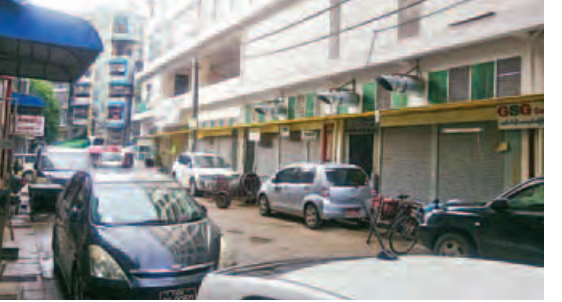
အနံ့ဆိုးထုတ်လွှတ်သည့်ခေါင်းတိုင်ကို ဈေးမြေညီထပ်၌ တပ်ဆင်ထားစဉ်။

ယင်းရပ်ကွက်နေပြည်သူတစ်ဦးက “ဈေးကို အဆင့်မြှင့်တင်တည်ဆောက်တာကောင်းပါတယ်။ ဈေးအတွင်း သားစိမ်း၊ ငါးစိမ်း စသဖြင့်ပေါ့။ အနံ့ဆိုးထွက်တဲ့ဟာတွေရှိတော့ အနံ့ဆိုးထုတ်တဲ့ပန်ကာတွေ တပ်ဆင်ပေးတာလည်း ကောင်းပါတယ်။ ဒါပေမယ့် အနံ့ဆိုးထုတ်တဲ့ခေါင်းတိုင်အပေါက်က မြေညီထပ်မှာထားရှိတော့ ထုတ်သမျှအနံ့တွေက ရပ်ကွက်ထဲကို အကုန်ရောက်တယ်။ ရပ်ကွက်နေပြည်သူတွေက နေ့စဉ်ရှူရှိုက်ရတယ်။ ရပ်ကွက်ထဲဆိုတော့ အသက်ကြီးသူတွေ၊ ကလေးသူငယ်တွေ၊ နာမကျန်းတဲ့သူတွေရှိတယ်။ ရပ်ကွက်နေပြည်သူတွေရဲ့ ကျန်းမာရေးကိုတော့ ထည့်တွက်သင့်တယ်။ ကျွန်တော်သိထားသလောက် ရန်ကုန်မြို့မှာ ဥပမာဆိုပါ တော့ စားသောက်ဆိုင်ပွင့်ရင် ညော်စုပ်ခေါင်းတိုင်ကို အောက်ထပ်မှာ ထားလို့မရဘူး။ အပေါ်ဆုံးထပ်ခေါင်းတိုင်ထိရောက်အောင် ထားရတယ်။ဒါမှ အညော်က ရပ်ကွက်ထဲမရောက်မှာ။ စည်ပင်ကလည်း သတ်မှတ်ချက်ရှိတယ်။ အခုဟာက အဆင့်မြှင့်တင်ပြီး တည်ဆောက်တာဖြစ်တဲ့အတွက် အနံ့ဆိုးထုတ်တဲ့ ခေါင်းတိုင်ကို မြေညီမှာ ထားတော့ နားမလည်နိုင်အောင် ဖြစ်မိတယ်” ဟုပြောကြားသည်။ ဆက်လက်၍အနံ့ဆိုးထုတ်လွှတ်မှုနှင့်ပတ်သက်၍ “သက်ဆိုင်ရာက အမြန်ဆုံးစီစဉ်ဆောင်ရွက်ပေးစေလိုပါတယ်။ ကျွန်တော်အပါအဝင်