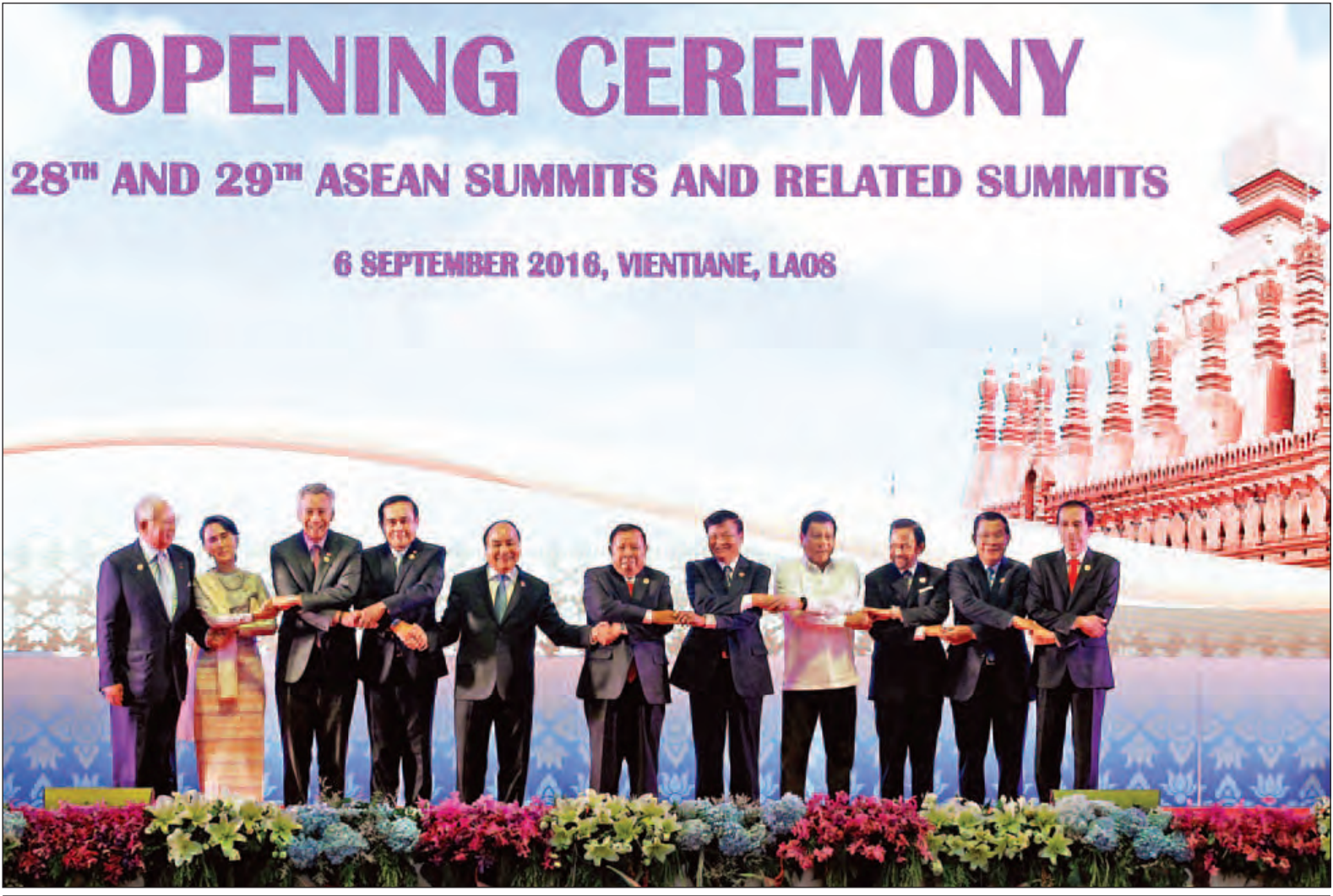
နိုင်ငံတော်၏ အတိုင်ပင်ခံပုဂ္ဂိုလ် ဒေါ်အောင်ဆန်းစုကြည် အာဆီယံနိုင်ငံများမှ နိုင်ငံအကြီးအကဲများ၊ အစိုးရအဖွဲ့အကြီးအကဲများနှင့်အတူ စုပေါင်းမှတ်တမ်းတင်ပုံရိုက်စဉ်။

★ရှေးဦးစွာ အခမ်းအနားကို အာဆီယံသီချင်းဖြင့် ဖွင့်လှစ်ပြီး လာအိုရုံးရာ အဆို၊ အကများဖြင့် ကပြသီဆိုဖျော်ဖြေကြသည်။ ထို့နောက် လာအိုပြည်သူ့ဒီမိုကရက်တစ်သမ္မတနိုင်ငံဝန်ကြီးချုပ် မစ္စတာ သောင်လွန်း ဆီဆိုလစ်က ကြိုဆို နှုတ်ခွန်းဆက်စကား ပြောကြားသည်။ ယင်းနောက် လာအိုပြည်သူ့ဒီမို ကရက်တစ်သမ္မတနိုင်ငံ သမ္မတ မစ္စတာ ဘွန်ညိုရာချစ်က အဖွင့် မိန့်ခွန်းပြောကြားသည်။ ထို့နောက် နိုင်ငံတော်၏ အတိုင်ပင်ခံပုဂ္ဂိုလ်သည် အာဆီယံ နိုင်ငံများမှ နိုင်ငံအကြီးအကဲများ၊ အစိုးရအဖွဲ့အကြီးအကဲများနှင့်အတူ Launch of the Visit ASEAN @50 Campaign Logo အား စက် ခလုတ်နှိပ်ဖွင့်လှစ်ပေးပြီး စုပေါင်း၍ မှတ်တမ်းတင်ဓာတ်ပုံရိုက်သည်။ မွန်းလွဲပိုင်းတွင် (၂၈)ကြိမ်မြောက် အာဆီယံခေါင်းဆောင်များ မျက်နှာ စုံညီထိပ်သီးအစည်းအဝေးကို ကျင်းပ ရာ လာအိုနိုင်ငံဝန်ကြီးချုပ်က ကြိုဆို နှုတ်ခွန်းဆက်စကား ပြောကြားပြီး လာအိုနိုင်ငံသမ္မတက အဖွင့်မိန့်ခွန်း ပြောကြားသည်။ အာဆီယံခေါင်းဆောင်များ မျက်နှာ စုံညီအစည်းအဝေးတွင် နိုင်ငံတော်၏ အတိုင်ပင်ခံပုဂ္ဂိုလ်က မိန့်ခွန်းပြော ကြားသည်။ ထို့နောက် အခမ်းအနားသို့ တက် ရောက်လာကြသော အာဆီယံနိုင်ငံ များမှ နိုင်ငံအကြီးအကဲ၊ အစိုးရအဖွဲ့ အကြီးအကဲများသည် စုပေါင်း၍ မှတ်တမ်းတင်ပုံရိုက်ကြသည်။ ယင်းနောက် နိုင်ငံတော်၏ အတိုင်ပင်ခံပုဂ္ဂိုလ်သည် အာဆီယံ ပေါင်းစည်းဆက်သွယ်ရေးဆိုင်ရာ မဟာစီမံကိန်း(၂၀၂၅)နှင့် အာဆီယံ ပေါင်းစည်းရေးဆိုင်ရာ ကနဦး လုပ်ငန်းစီမံချက် (၃) အား စတင်