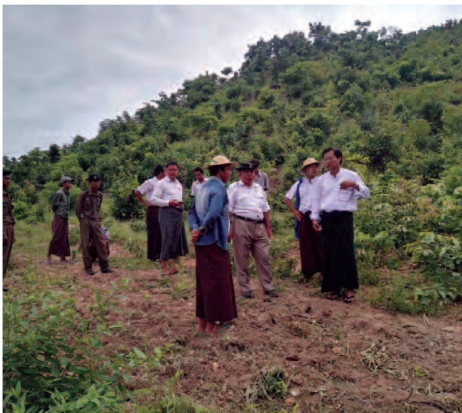
ရိုးကျော်သူထွေး(မတ္တရာ)