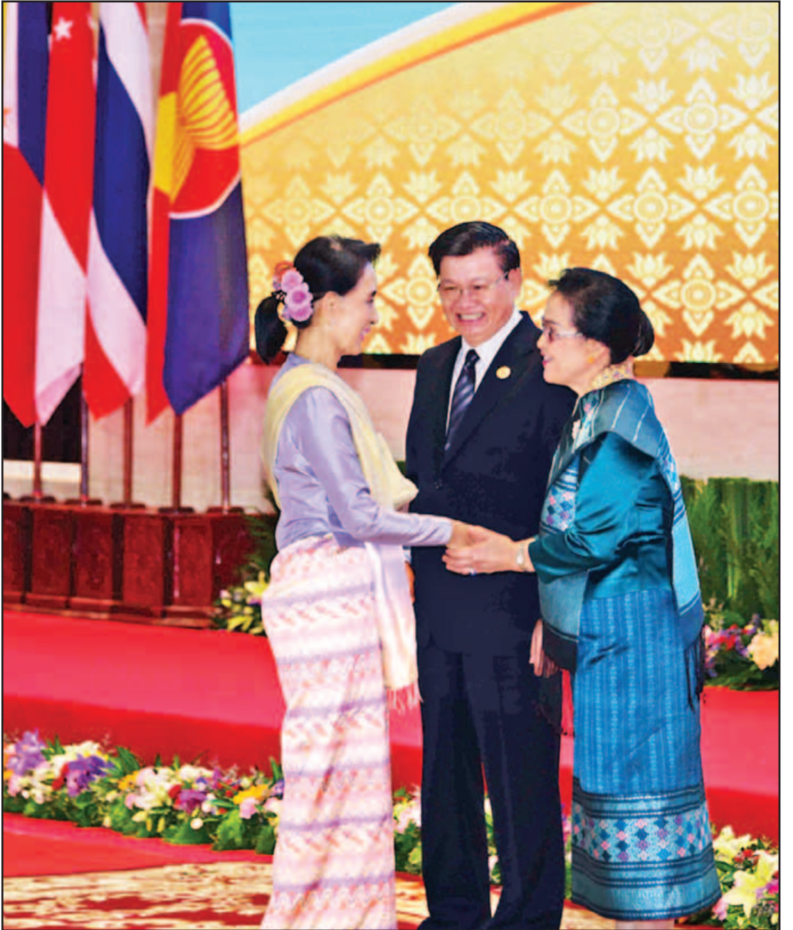
အာဆီယံထိပ်သီးအစည်းအဝေးဖွင့်ပွဲအခမ်းအနားသို့တက်ရောက်လာသည့်နိုင်ငံတော်၏ အတိုင်ပင်ခံပုဂ္ဂိုလ် ဒေါ်အောင်ဆန်းစုကြည်အား အာဆီယံအလှည့်ကျဥက္ကဋ္ဌ လာအိုနိုင်ငံဝန်ကြီးချုပ် မစ္စတာ သောင်လွန်းဆီဆိုလစ်နှင့် ဇနီးတို့က ကြိုဆိုနှုတ်ဆက်စဉ်။