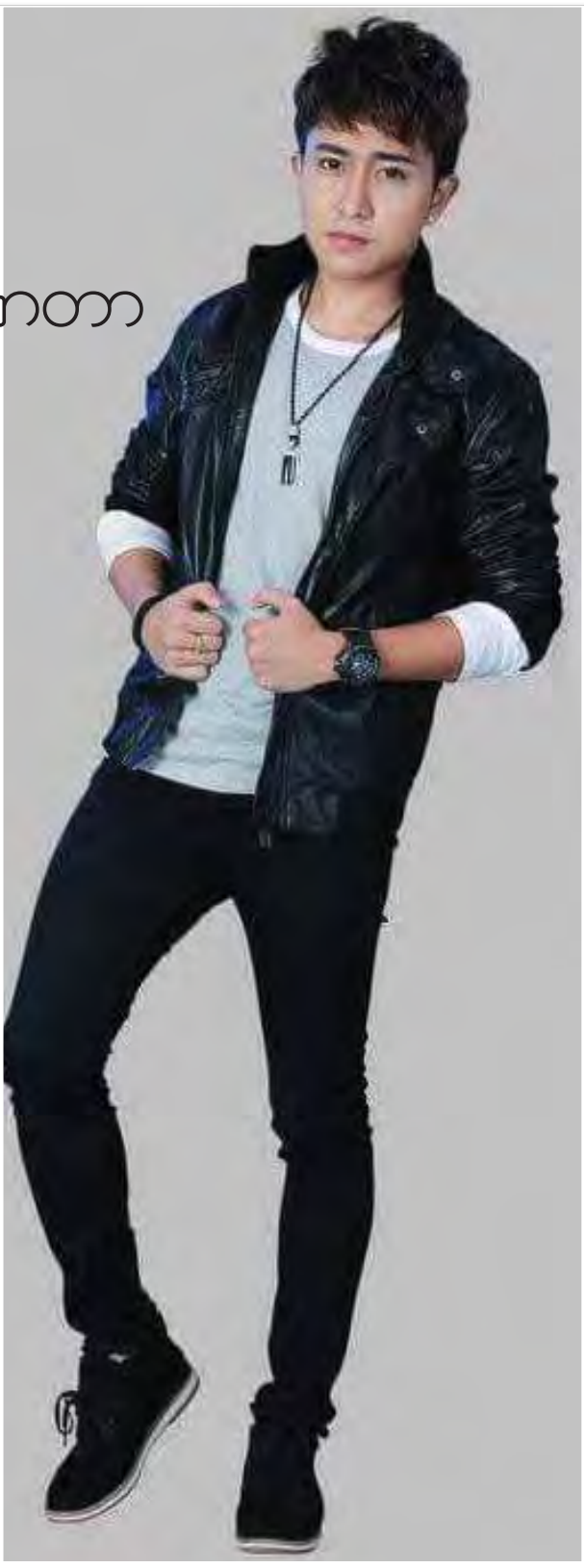
ပြီးစန္ဒာမြင့်

သူရိယသည် ယခုလ စက်တင်ဘာ ၂ ရက်တွင် Info9 မှ မြန်မာတစ်ပြည်လုံးသို့ ဖြန့်ချိခဲ့သည့် ‘ရွာသား’ဇာတ်ကားတွင်လည်း ဝါရင့်သရုပ်ဆောင်တစ်ဦးဖြစ်ပြီး မကြာမီကမှ အကယ်ဒမီဆုကြီးကို ထိုက်ထိုက်တန်တန်ဆွတ်ခူးရရှိခဲ့သည့် အကယ်ဒမီတက္ကသိုလ်ဝမ်းပုံနှင့် လိုက်ဖက်ညီစွာ သရုပ်ဆောင်ထားသည်။ ‘ရွာသား’ ဇာတ်ကားကို ဒါရိုက်တာပြည်ဟိန်းသီဟက ပုံဖော်ထားပြီး မင်းသား သူရိယနှင့်အတူ သွန်းဆက်၊ အကယ်ဒမီတက္ကသိုလ်ဝမ်းပုံ၊ ကျော်ထူး၊ ဧရာ၊ အုန်းသီးနှင့် သရုပ်ဆောင်များစွာက ပါဝင်အားဖြည့်ထားကြသည်။