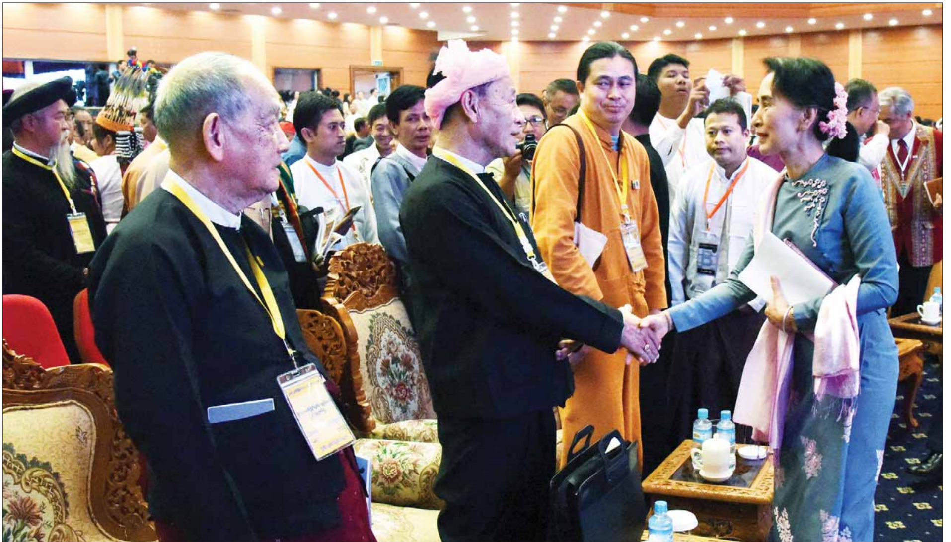
ပြည်ထောင်စုငြိမ်းချမ်းရေးညီလာခံ-(၂၁)ရာစုပင်လုံ စတုတ္ထနေ့တွင် အဖွဲ့အစည်းအသီးသီးမှ ကိုယ်စားလှယ်များအား နိုင်ငံတော်၏အတိုင်ပင်ခံပုဂ္ဂိုလ် ဒေါ်အောင်ဆန်းစုကြည် ရင်းရင်းနှီးနှီးနှုတ်ဆက်စဉ်။ (သတင်းစဉ်)

ပြည်ထောင်စုသမ္မတမြန်မာနိုင်ငံ နိုင်ငံတော်၏အတိုင်ပင်ခံပုဂ္ဂိုလ် ဒေါ်အောင်ဆန်းစုကြည် သည် လာအိုပြည်သူ့ ဒီမိုကရက်တစ်သမ္မတနိုင်ငံ၌ ကျင်းပမည့် (၂၈)ကြိမ်နှင့် (၂၉)ကြိမ်မြောက် အာဆီယံထိပ်သီးအစည်းအဝေးများနှင့် ဆက်စပ်အစည်းအဝေးများသို့ တက်ရောက်ရန်အတွက် မကြာမီကာလအတွင်း လာအိုပြည်သူ့ဒီမိုကရက်တစ်သမ္မတနိုင်ငံသို့ သွားရောက်မည်ဖြစ်သည်။ (သတင်းစဉ်)