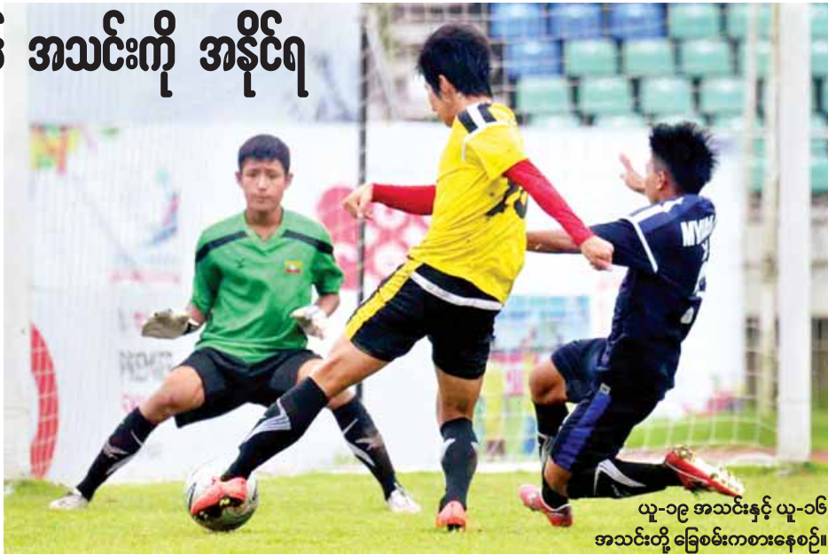
ယူ-၁၉ အသင်းနှင့် ယူ-၁၆ အသင်းတို့ ခြေစမ်းကစားနေစဉ်။

ပွဲအစတွင် ယူ-၁၆ အသင်းကပိုမိုကစားနိုင်ခဲ့သော်လည်း အဆုံးသတ် ဂိုးသွင်းအားနည်းမှုကြောင့် ဂိုးမရခဲ့ပေ။ စာမျက်နှာ ၇ ကော်လံ ၁ သို့