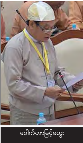
ဒေါက်တာမြင့်ထွေး

ဒုတိယအကြိမ် ပြည်သူ့လွှတ်တော် ဒုတိယပုံမှန်အစည်းအဝေး(၂၄)ရက် မြောက် နေ့ကို ယနေ့နံနက်ပိုင်းတွင် ကျင်းပရာ ရန်ကင်းတိုင်းဒေသကြီး မြောက်ဥက္ကလာပ မဲဆန္ဒနယ်မှ လွှတ်တော်ကိုယ်စားလှယ် ဒေါက်တာသန်းဝင်း၏ မြောက်ဥက္ကလာပ မြို့နယ် (ဂ)ရပ်ကွက်ရှိ မဏ္ဍိုင်အားကစားကွင်းကို မြို့နယ်အဆင့် အဆင့်မြင့် အားကစားကွင်းကြီးအဖြစ် သက်ဆိုင်ရာမှ ဆောင်ရွက်ပေးနိုင်ခြင်း ရှိမရှိ မေးခွန်းအား ကျန်းမာရေးနှင့်အားကစားဝန်ကြီးဌာန ပြည်ထောင်စုဝန်ကြီး ဒေါက်တာမြင့်ထွေးက အဆိုပါအားကစားကွင်းကို အဆင့်မြင့်တင်ဆောင်ရွက် နိုင်ရေးအတွက် အစီအစဉ်မရှိပါကြောင်းနှင့် သဘောတူငှားရမ်းထားသည့် စာချုပ်ပါစည်းမျဉ်းစည်းကမ်းသတ်မှတ်ချက်များအရ စီမံခန့်ခွဲသူဖြစ်သည့် မြန်မာနိုင်ငံဘောလုံးအဖွဲ့ချုပ်သို့ အကြောင်းကြား ဆောင်ရွက် ရမည်ဖြစ်ကြောင်း ဖြေကြားသည်။