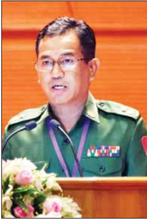
ဒုတိယဗိုလ်မှူးကြီးသန့်ဇော်

နေပြည်တော် စက်တင်ဘာ ၁ ပြည်ထောင်စုငြိမ်းချမ်းရေးညီလာခံ-(၂၁)ရာစုပင်လုံ ဒုတိယနေ့ အစည်းအဝေး မွန်းလွဲပိုင်းအစီအစဉ်များကို ယနေ့မွန်းလွဲ ၁ နာရီတွင် နေပြည်တော်ရှိ မြန်မာအပြည်ပြည်ဆိုင်ရာ ကွန်ဗင်းရှင်းဗဟိုဌာန-၂ (MICC-2) ၌ ဆက်လက်ကျင်းပသည်။ တပ်မတော်မှ ဒုတိယဗိုလ်မှူးကြီး သန့်ဇော်က ပြည်ထောင်စုသမ္မတမြန်မာနိုင်ငံတော် (၂၀၀၈) ဖွဲ့စည်းပုံအခြေခံဥပဒေသည် မြန်မာနိုင်ငံ၏ ပြည်ထောင်စုနယ်မြေ တိုင်းဒေသကြီးနှင့် ပြည်နယ်များ၊ ကိုယ်ပိုင်