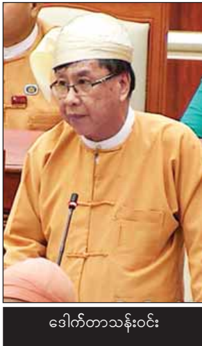
ဒေါက်တာသန်းဝင်း

ချက်များအတိုင်း တာဝန်ယူဆောင်ရွက်ရမည်ဖြစ်ပါကြောင်း၊ ကျန်းမာရေးနှင့် အားကစားဝန်ကြီးဌာနနှင့် မဆိုင်ပါကြောင်း ဖြေကြားသည်။