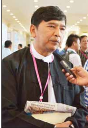
ဦးမင်းကိုနိုင်

စစ်ဘေးဒဏ် ခံရတဲ့နေရာတွေ၊ စစ်ရှောင်ဒေသက ကလေးတွေရဲ့အသံ ကို ကျွန်တော် နားထောင်ခဲ့တယ်။ သူတို့ အသက်လုပြေးရတဲ့ဘဝက လွတ်ချင် တယ်။ သူတို့အများနည်းတူ ပညာသင်ချင်တယ်။ အေးချမ်းစွာ အသက်မွေးချင် ကြတယ်။ ဒါကြောင့် အားလုံးသဘောတူတဲ့ အဖြေမရတောင် စစ်ပွဲတွေ စိတ်ချ လက်ချရလို့ရတဲ့ အခြေအနေကနေ စတင်စေချင်ပါတယ်။ ဒီဆွေးနွေးပွဲဟာ လူကြီးလူကောင်းဆန်တဲ့ ဆွေးနွေးပွဲဖြစ်အောင် အားလုံးက ကြိုးစားရမှာပါ။