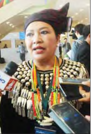
ဒေါ်ခွဲဘူ