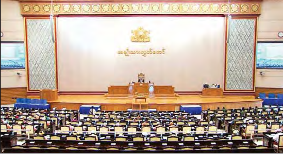
ဒုတိယအကြိမ် အမျိုးသားလွှတ်တော် ဒုတိယပုံမှန်အစည်းအဝေး (၂၄)ရက်မြောက်နေ့ကျင်းပစဉ်။ (သတင်းစဉ်)

ကျောက်တော်မြို့နယ် သရက်တပင်-ဂူပို့ထောင် ကျေးရွာ ချင်းဆက်လမ်းကို ၂၀၁၇ - ၂၀၁၈ ဘဏ္ဍာရေးနှစ် ကျေး လက်ဒေသဖွံ့ဖြိုးတိုးတက်ရေးဦးစီးဌာန ပြည်ထောင်စုရန်ပုံ ငွေတွင်လည်းကောင်း၊ အဆိုပါလမ်းပေါ်ရှိ တံတား ၁၁ စင်းကို ၂၀၁၇-၂၀၁၈ ဘဏ္ဍာရေးနှစ် နယ်စပ်ဒေသနှင့် တိုင်းရင်းသားလူမျိုးများဖွံ့ဖြိုးတိုးတက်ရေးဦးစီးဌာန ရန်ပုံငွေတွင်လည်းကောင်း လျာထားတင်ပြ တောင်းခံ သွားမည်ဖြစ်ပြီး ရန်ပုံငွေရရှိမှုပေါ်မူတည်၍ ဆောင်ရွက် ပေးသွားမည်ဖြစ်ကြောင်း စိုက်ပျိုးရေး၊ မွေးမြူရေးနှင့် ဆည်မြောင်းဝန်ကြီးဌာန ပြည်ထောင်စုဝန်ကြီး ဒေါက်တာ အောင်သူက ပြောကြားသည်။