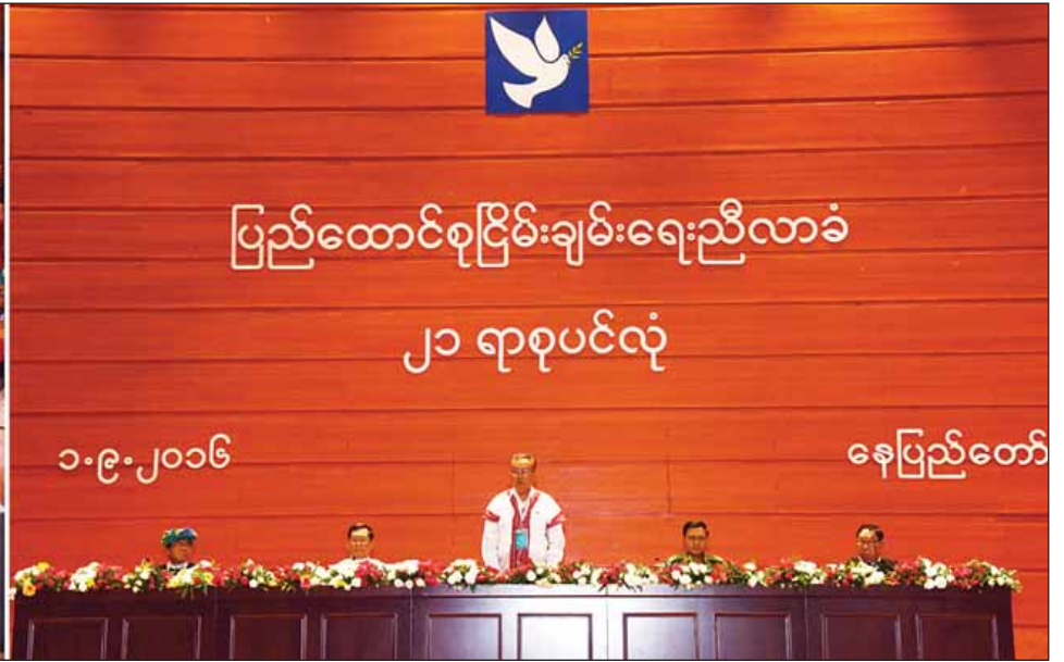
ပြည်ထောင်စုငြိမ်းချမ်းရေးညီလာခံ-(၂၁)ရာစုပင်လုံ ဒုတိယနေ့အစည်းအဝေး ကျင်းပစဉ်။ (သတင်းစဉ်)