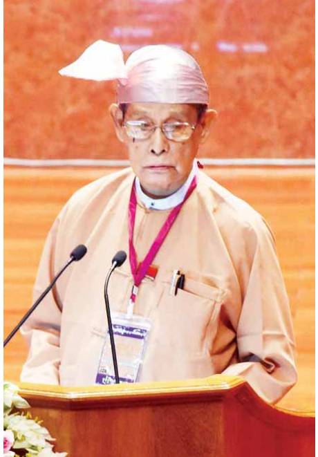
တရားဥပဒေစိုးမိုးရေးနဲ့အတူ ပျော်ရွှင်အေးချမ်းစွာ နေထိုင်စားသောက်လုပ်ကိုင်နိုင်ကြမှာပါ။

ဒီကနေ့လို ထူးခြားတဲ့သမိုင်းဝင်နေ့ထူးနေ့မြတ်မှာ အမျိုးသားဒီမိုကရေစီအဖွဲ့ချုပ်ပါတီ ကိုယ်စားပြုလျက် စကားပြောကြားခွင့်ရတဲ့အတွက် လွန်စွာဝမ်းမြောက်မိပါတယ်။ (၂၁)ရာစုပင်လုံညီလာခံကို ငြိမ်းချမ်းရေးရရှိဖို့ ကျင်းပတာပါ။ ငြိမ်းချမ်းရေးလိုချင်တာကတော့ မြန်မာနိုင်ငံကို လွတ်လပ်တရားမျှတပြီး ဖွံ့ဖြိုးတိုးတက်တဲ့ နိုင်ငံတစ်ခုအဖြစ် တည်ဆောက်ချင်လို့ပဲဖြစ်ပါတယ်။ လွတ်လပ်တရားမျှတပြီး ဖွံ့ဖြိုးတိုးတက်တဲ့နိုင်ငံတစ်ခုအဖြစ် မြင်လိုတဲ့အကြောင်းကတော့ မြန်မာနိုင်ငံသူ နိုင်ငံသားများအားလုံးဟာ ဒုက္ခပင်လယ်ဝေနေရတဲ့ အခြေအနေကနေ လူတန်းစေ့ပျော်ရွှင်အေးချမ်းစွာ နေထိုင်သင့်ပြီလို့ ယုံကြည်လို့ပဲဖြစ်ပါတယ်။