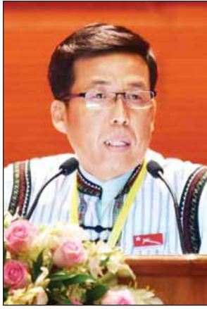
ဦးရွှေမင်း

အုပ်ချုပ်ခွင့်ရ စီရင်ခွင့်နယ်မြေများအလိုက်ရရှိသည့် အခွင့်အရေးများနှင့် လိုက်နာကျင့်သုံးရမည့် စည်းမျဉ်းစည်းကမ်းများကို ပြည်ထောင်စုစနစ်သဘောသဘာဝများနှင့်အညီ ပြည့်စုံစွာပြဋ္ဌာန်းထားသည်ကို တွေ့ကြောင်း၊ လက်ရှိဖွဲ့စည်းပုံအခြေခံဥပဒေ၏ အုပ်ချုပ်ရေးနှင့် တရားစီရင်ရေးစနစ် ပြဋ္ဌာန်းချက်များသည်လည်း ပြည်ထောင်စုစနစ်နှင့်ကိုက်ညီသည်ကို လေ့လာတွေ့ရှိကြောင်း ဆွေးနွေးသည်။