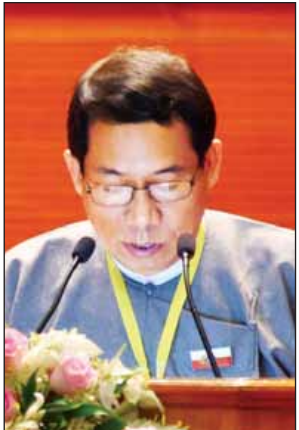
ဒေါက်တာအေးမောင်