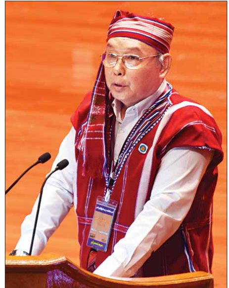
စာမျက်နှာ ၁၆ သို့

အသလို နိုင်ငံသူနိုင်ငံသားအားလုံး မျှော်လင့်တောင့်တ နေတဲ့ ငြိမ်းချမ်းရေးဟာ အခုဆိုရင် လက်တစ်ကမ်းအကွာ မှာ ရောက်ရှိလို့နေပြီ ဖြစ်ပါတယ်။ လက်တစ်ကမ်းအကွာမှာ ရောက်ရှိနေပြီဖြစ်တဲ့ နိုင်ငံသူ နိုင်ငံသားအားလုံးကလည်း လိုလားတောင့်တနေတဲ့ ငြိမ်းချမ်းရေးကို ပြည်ထောင်စု ငြိမ်းချမ်းရေးညီလာခံ -(၂၁) ရာစုပင်လုံမှာ ပါဝင်ဆွေးနွေး ကြမယ့်