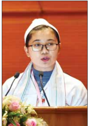
ဒေါ်ဝင့်ဝါထွန်း

ကြောင်း၊ မြန်မာနိုင်ငံ၏ အမျိုးသားလုံခြုံရေးမူဝါဒသည် ဒီမိုကရေစီစနစ်ကို အခြေခံပြီး တရားဥပဒေစိုးမိုးရေးကို မဏ္ဍိုင်ထားရန် လိုအပ်ပါကြောင်း၊ ဒီမိုကရေစီစနစ်အခြေခံသည့် အမျိုးသားလုံခြုံရေးမူဝါဒဖြစ်ရန် ဒီမိုကရေစီနည်းအရ နွေးကောက်တင်မြှောက်လိုက်သည့် အစိုးရတစ်ရပ်၏ လုံခြုံရေးဆိုင်ရာ လုပ်ပိုင်ခွင့်များကို အခြေခံဥပဒေတွင် ပြဋ္ဌာန်းထားရန် လိုအပ်ပါကြောင်း၊ နိုင်ငံတော်ကာကွယ်ရေးနှင့် လုံခြုံရေးအကောင်အထည်ဖော်မှုများတွင် အရပ်သားများပါဝင်မှု အခန်းကဏ္ဍကို မြှင့်တင်နိုင်ရန် စတင်အကောင်အထည်ဖော် စဉ်းစားရမည် ဖြစ်ပါကြောင်း။