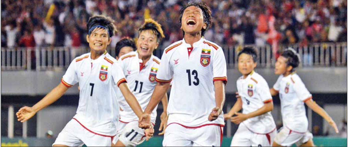
မြန်မာအမျိုးသမီးအသင်းအား ၂၀၁၆ အာဆီယံအမျိုးသမီးဘောလုံးပြိုင်ပွဲ ယှဉ်ပြိုင်စဉ်က တွေ့ရစဉ်။

ရန်ကုန် စက်တင်ဘာ ၁ အိမ်ရှင်အဖြစ်လက်ခံကျင်းပခဲ့သည့် ၂၀၁၆ အာဆီယံအမျိုးသမီးဘောလုံးပြိုင်ပွဲတွင် တတိယ ရရှိခဲ့သည့် မြန်မာအမျိုးသမီးအသင်းသည် ၂၀၁၇ ခုနှစ်အတွင်း ယှဉ်ပြိုင်ရမည့် ဆီးဂိမ်း ပြိုင်ပွဲနှင့် အာရှဖလားခြေစစ်ပွဲတို့အတွက် ကြိုတင်ပြင်ဆင်မှုများ ပြုလုပ်နေပြီဖြစ်သည်။ မြန်မာအမျိုးသမီးအသင်းသည် အာဆီယံဒေသတွင်း အဆင့်မြင့်ဆုံးပြိုင်ပွဲဖြစ် သည့် အာဆီယံအမျိုးသမီးပြိုင်ပွဲတွင် ချန်ပီယံဖြစ်ရရှိဖူးသော်လည်း ဆီးဂိမ်းပြိုင်ပွဲ တွင် ရွှေတံဆိပ်ရယူနိုင်ခြင်းမရှိသေးပေ။ မြန်မာအမျိုးသမီးအသင်းသည် ၂၀၁၇ ခုနှစ် အတွင်း ဆီးဂိမ်းပြိုင်ပွဲအပါအဝင် ၂၀၁၈ အာရှဖလား အမျိုးသမီးခြေစစ်ပွဲအတွက်ပါ ပြင်ဆင်နေခြင်းဖြစ်သည်။ မြန်မာအမျိုးသမီးအသင်းသည် ဩဂုတ် ၂၉ ရက်မှစ၍ လေ့ကျင့်လျက်ရှိသော်လည်း တစ်ပတ်လျှင် သုံးရက်သာ လေ့ကျင့်နေပြီး နည်းပြချုပ် ရော်ဂျာရိုင်နာရောက်ရှိအပြီး စက်တင်ဘာ ၁၂ ရက်မှစ၍ နေ့စဉ်လေ့ကျင့်သွားမည်ဖြစ် သည်။ နယ်သာလန်အမျိုးသမီးလက်ရွေးစင်အသင်း နည်းပြဟောင်းရော်ဂျာရိုင်နာသည် မြန်မာအမျိုးသမီးအသင်းကို ဖေဖော်ဝါရီလမှစတင်ကိုင်တွယ်ခဲ့ပြီး အိမ်ရှင်အဖြစ် လက်ခံကျင်းပခဲ့သည့် စာမျက်နှာ ၁၂ ကော်လံ ၃ သို့