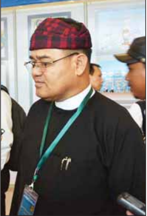
ဦးခက်ထိန်နန်