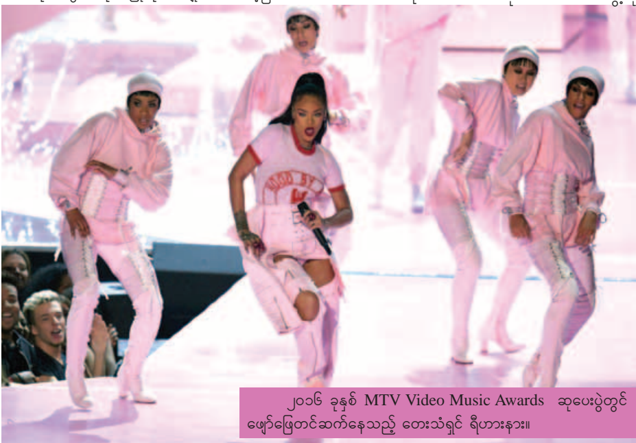
၂၀၁၆ ခုနှစ် MTV Video Music Awards ဆုပေးပွဲတွင် ဖျော်ဖြေတင်ဆက်နေသည့် တေးသံရှင် ရီဟားနား။