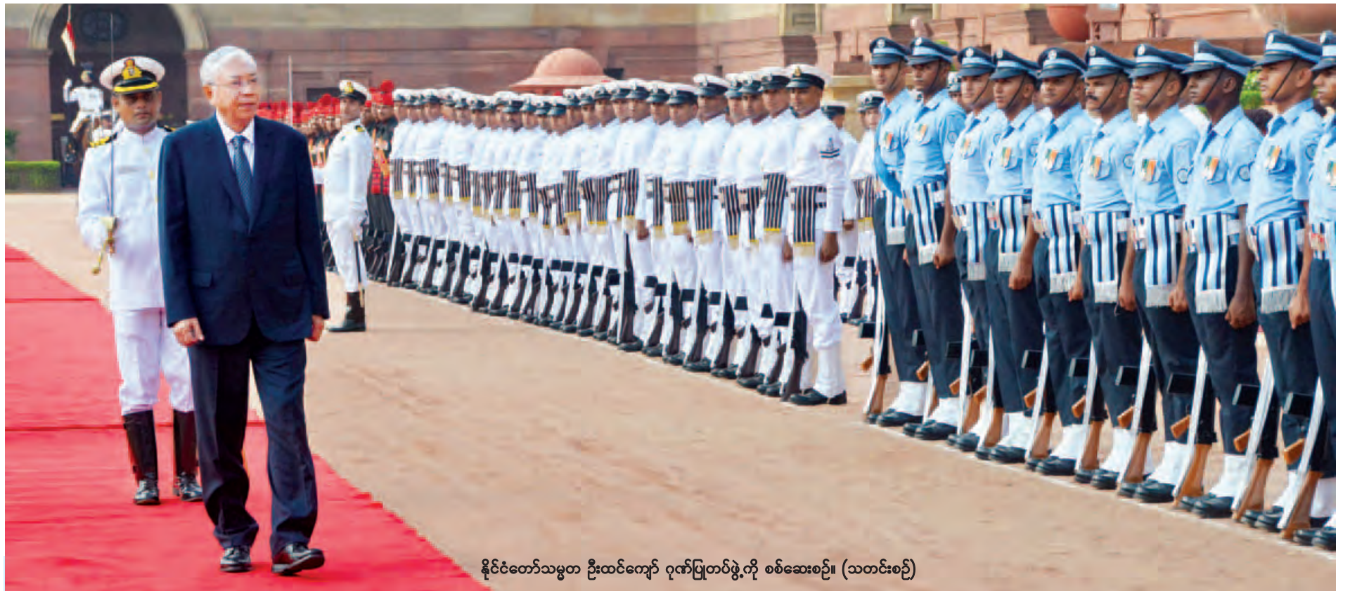
နိုင်ငံတော်သမ္မတ ဦးထင်ကျော် ဂုဏ်ပြုတပ်ဖွဲ့ကို စစ်ဆေးစဉ်။ (သတင်းစဉ်)

နိုင်ငံတော်သမ္မတ ဦးထင်ကျော်နှင့် ဇနီး ဒေါ်စုစုလွင်တို့အား အိန္ဒိယသမ္မတနိုင်ငံ သမ္မတ မစ္စတာ ပရာနာ့စ် မူခါရီးက ဂုဏ်ပြုကြိုဆိုသည့်အခမ်းအနားကို ယနေ့နံနက် ၉ နာရီတွင် နယူးဒေလီမြို့ရှိ သမ္မတအိမ်တော်ဝင်း Rashtrapati Bhavan ၌ ကျင်းပသည်။ စာမျက်နှာ ၉ ကော်လံ ၁ သို့