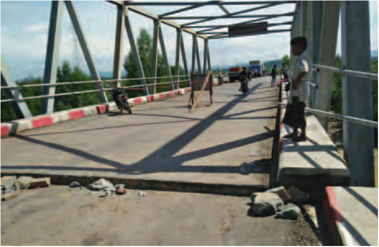
ကျောက်မြို့-ရန်ကုန်အဝေးပြေးလမ်းမကြီး၏ တံတားကြီးကိုစင်းအနက် မအိမြို့နယ်အပိုင် လုံးတော် ပေါက်တံတားမှာ ဩဂုတ် ၂၄ ရက် ညနေ ၅ နာရီ၅၅မိနစ်တွင် ငလျင်လှုပ်ခတ်သည့်အတွက်ကြောင့် တံတားသံပေါင်များ ရွေ့လျားသွားခဲ့ရာ ဩဂုတ် ၂၅ ရက်မှ စတင်ကာ နေပြည်တော်မှ ဒုညွှန်ချုပ် ဦးအောင်မြတ်ဦးနှင့် အင်ဂျင်နီယာချုပ် ဦးစိုးမင်း၊ တံတားအထူးအဖွဲ့များက အမြန်ဆုံးစစ်ဆေး၍ ခရီး သွားယာဉ်များ ဖြတ်သန်းသွားလာနိုင်ရေးဆောင်ရွက်နေကြရာ ဩဂုတ် ၃၀ ရက်၌ ကားများကို ဖြတ် သန်းသွားလာခွင့်ပြုမည်။

ဟားခါး ဩဂုတ် ၂၉ ချင်းပြည်နယ်အတွင်းရှိ နည်းပညာနှင့် သက်မွေးပညာ သင်တန်းကျောင်းများ၏ ဖွံ့ဖြိုးရေးဆိုင်ရာ အလုပ်ရုံဆွေးနွေးပွဲကို ဩဂုတ် ၂၇ ရက် နံနက် ၉ နာရီက အစိုးရ စက်မှုလက်မှုသိပ္ပံ(ဟားခါး) စာကြည့်တိုက် ခန်းမ၌ ကျင်းပခဲ့သည်။ အဆိုပါ ဆွေးနွေးပွဲတွင် ချင်းပြည်နယ် အစိုးရအဖွဲ့ ပြည်နယ်ဝန်ကြီးချုပ် ဦးဆလင်း လျန်လွယ်နှင့် ပြည်နယ်လွှတ်တော်ဥက္ကဋ္ဌ တို့က အမှာစကား ပြောကြားခဲ့သည်။ ယင်းနောက် ပြည်နယ်စည်ပင်သာယာ ရေး၊ လျှပ်စစ်နှင့် စက်မှုလက်မှုဝန်ကြီး ဦးဆလင်းအိုက်ဇက်ခင်နှင့် ပြည်နယ်လူမှု ရေးဝန်ကြီး ဦးပေါင်လွန်းမင်ထန်တို့က ချင်းပြည်နယ်အတွင်းရှိ နည်းပညာနှင့် သက်မွေးပညာ သင်တန်းကျောင်းများဖွံ့ ဖြိုးတိုးတက်ရေးနှင့် စပ်လျဉ်း၍ အကြံပြု ဆွေးနွေးတင်ပြခဲ့ကြသည်။ ယင်းနောက် အစိုးရနည်းပညာအထက် တန်းကျောင်း မင်းတပ်၊ တီးတိန်မှ ရက်ကန်း နှင့် သက်မွေးပညာသင်တန်းကျောင်း မင်း တပ်၊ ဖလမ်းတို့မှ ကျောင်းအုပ်ကြီးများနှင့် အစိုးရ စက်မှုလက်မှုသိပ္ပံ(ဟားခါး) ကျောင်းအုပ်ကြီးတို့က လုပ်ငန်းဆောင်ရွက် မှုအခြေအနေများကိုရှင်းလင်းတင်ပြကြ ရာ တင်ပြချက်များအပေါ် ပြည်နယ်စည် ပင်သာယာရေး၊ လျှပ်စစ်နှင့်စက်မှုလက်မှု ဝန်ကြီးက ဖြည့်စွက်ဆွေးနွေးခဲ့သည်။ ယင်းနောက် ပြည်နယ်ဝန်ကြီးချုပ်က အလုပ်ရုံဆွေးနွေးပွဲ အောင်မြင်စွာ ကျင်းပ နိုင်ရေးအတွက် ငွေကြေးအကူအညီ ထောက်ပံ့ပေးသော အာရုံစိုက်ဦးလှူဖွံ့ဖြိုး ရေးအသင်းအား ဂုဏ်ပြုမှတ်တမ်းလွှာ ပေးအပ်ရာ တာဝန်ရှိသူတစ်ဦးက လက်ခံရယူခဲ့သည်။ (ဦးစိုးမင်း ဖြန့်/ဆက်)