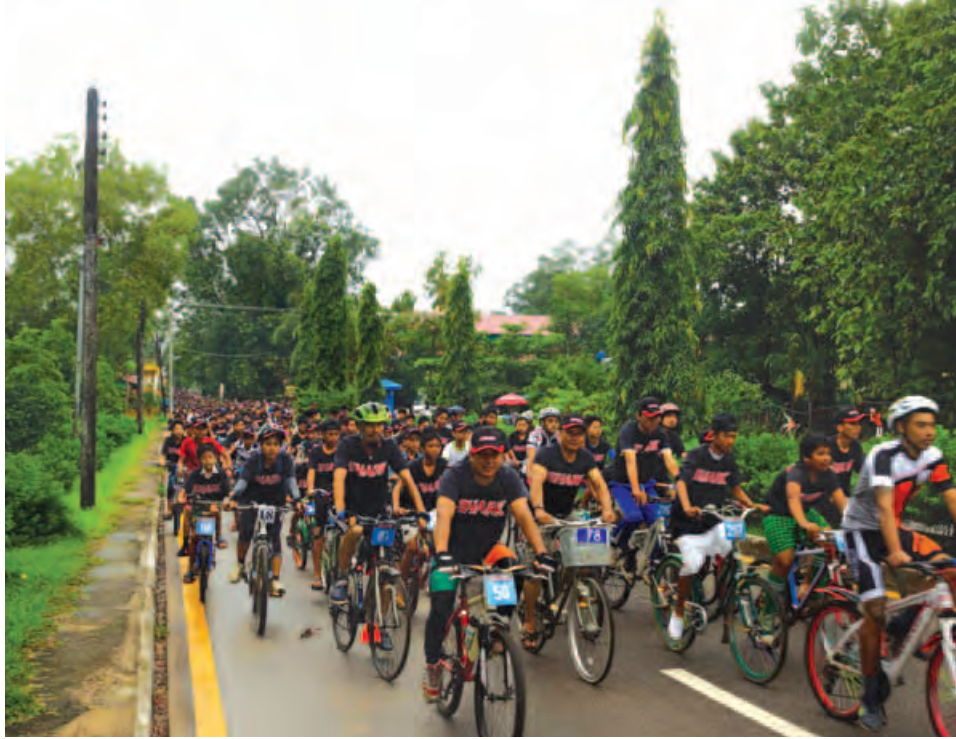
ထားဝယ် ဩဂုတ် ၂၉