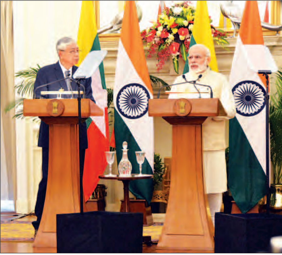
နိုင်ငံတော်သမ္မတ ဦးထင်ကျော်နှင့် အိန္ဒိယဝန်ကြီးချုပ် မစ္စတာ နာရန်ဒရာ မိုဒီတို့ နှစ်နိုင်ငံပူးပေါင်းဆောင်ရွက်ရေးဆိုင်ရာကိစ္စရပ်များကို သတင်းမီဒီယာများအား ပြောကြားစဉ်။ (သတင်းစဉ်)