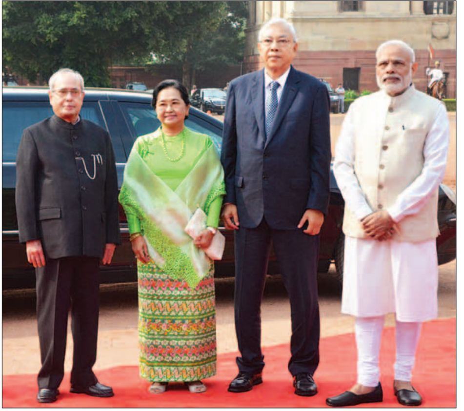
နိုင်ငံတော်သမ္မတ ဦးထင်ကျော်နှင့်ဇနီး ဒေါ်စုစုလွင်၊ အိန္ဒိယသမ္မတ မစ္စတာ ပရာနာ့စ် မူခါဂျီးနှင့် ဝန်ကြီးချုပ် မစ္စတာ နာရန်ဒရာ မိုဒီတို့ စုပေါင်းမှတ်တမ်းတင်ဓာတ်ပုံရိုက်ကြစဉ်။ (သတင်းစဉ်)