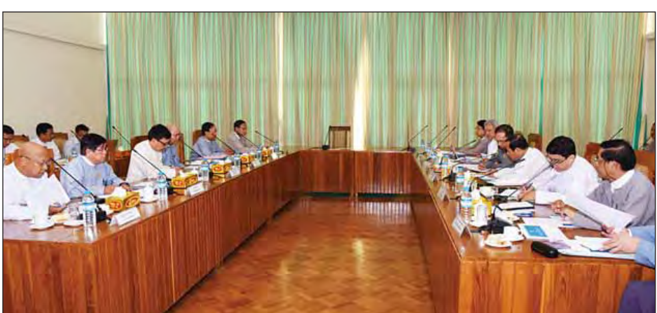
အသီးသီးက ပြည်ထောင်စုငြိမ်းချမ်းရေးညီလာခံ-(၂၁)ရာစုပင်လုံအောင်မြင်

နေပြည်တော် ဩဂုတ် ၂၆ ပြည်ထောင်စု ငြိမ်းချမ်းရေးညီလာခံ-(၂၁)ရာစုပင်လုံကျင်းပရေးလုပ်ငန်းကော်မတီ၏ ဒုတိယအကြိမ် အစည်းအဝေးကို ယနေ့မနက် ၁ နာရီတွင် နေပြည်တော်ရှိ နိုင်ငံတော်အတိုင်ပင်ခံရုံးဝန်ကြီးဌာန အစည်းအဝေးခန်းမတွင် ကျင်းပသည်။(ယာပုံ) အစည်းအဝေးတွင် ပြည်ထောင်စုငြိမ်းချမ်းရေးညီလာခံ-(၂၁)ရာစုပင်လုံကျင်းပရေးပဟိုကော်မတီ ဒုတိယဥက္ကဋ္ဌ နိုင်ငံတော်အတိုင်ပင်ခံရုံးဝန်ကြီးဌာန ပြည်ထောင်စုဝန်ကြီးဦးကျော်တင်ဆွေက အဖွင့်အမှာစကားပြောကြားပြီး လုပ်ငန်းကော်မတီ