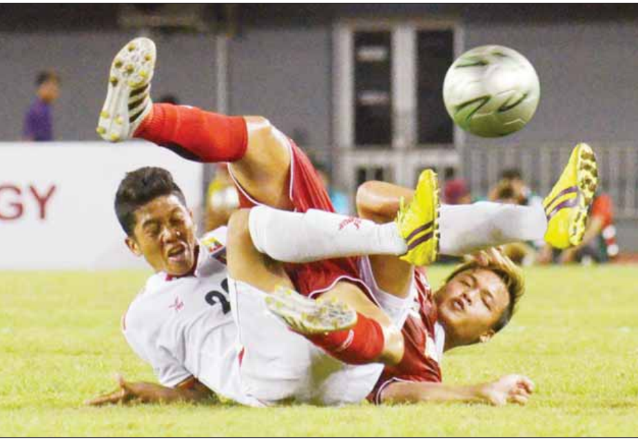
မြန်မာနှင့်ထိုင်းအသင်း အကြိတ်အနယ်ယှဉ်ပြိုင်နေစဉ်။