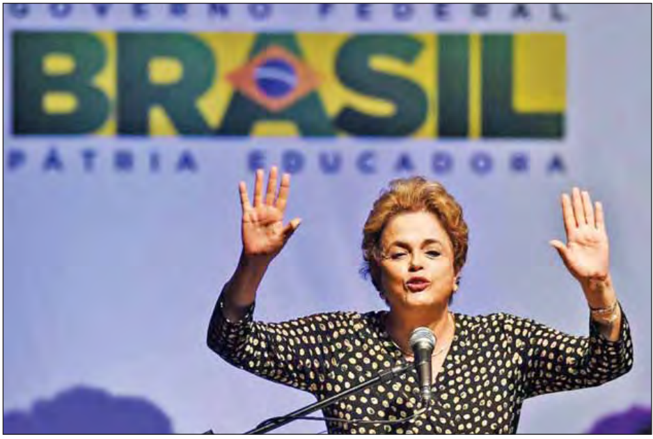
တာလမတိုင်မီ နိုင်ငံ၏ လိုငွေများကို ဝှက်ကွယ်ထားရန် ချိုးဖောက်ခဲ့သည်ဟု စွပ်စွဲခြင်းခံနေရသည်။ ရည်ရွယ်သည့်အနေဖြင့် ရသုံးမှန်းခြေဥပဒေများကို