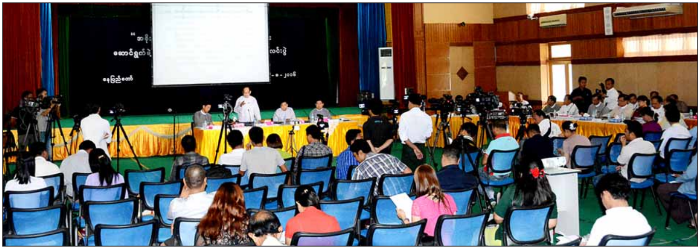
အစိုးရသစ်၏ ပထမရက် ၁၀၀ ကာလအတွင်း ဆောင်ရွက်ခဲ့မှုများနှင့်ပတ်သက်သည့် ပဉ္စမအကြိမ် သတင်းစာရှင်းလင်းပွဲ ကျင်းပစဉ်။

ဆေးရုံများတွင် ကူးစက်ရောဂါ ကာကွယ်တားဆီးရေးလုပ်ငန်းများ ဆောင်ရွက်ခြင်း၊ ဆေးရုံစစ်ဆေးမှု ပုံစံများ ပြုလုပ်၍ ပြည်နယ်နှင့် တိုင်းဒေသကြီး အသီးသီးရှိ ဆေးရုံများသို့ ကွင်းဆင်းကြီးကြပ်စစ်ဆေးခြင်းများ ဆောင်ရွက်ခဲ့ပါကြောင်း၊ ကျန်းမာရေးလုပ်ငန်းများ၏ ကျင့်ဝတ်သိက္ခာ ပိုမိုကောင်းမွန်စေရေးအတွက် ဆေးတက္ကသိုလ်များ၊ သူနာပြုတက္ကသိုလ်များနှင့် ဆေးပညာနွဲ့နွယ် တက္ကသိုလ်များ၏ ဘွဲ့ကြို၊ ဘွဲ့လွန်အတန်းအားလုံးတွင် ဆေးပညာကျင့်ဝတ်၊