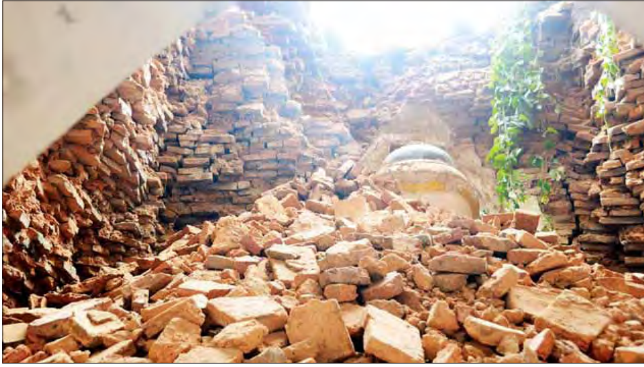
ရေနံချောင်းမြို့ ရှင်ဇေယျမာရ်အောင်ကျမ်းကိုင် ဘုရားပရိဝုဏ်အတွင်းရှိ စေတီတစ်ဆူ၏ အတွင်းပိုင်းပြိုကျ ပျက်စီးနေမှု။

နှစ်သက်တမ်း ၁၁၈ နှစ်ခန့်ရှိပြီဖြစ်သော အဆိုပါ ဘုရားပရိဝုဏ်အတွင်း၌ စေတီငယ်များရှိပြီး စေတီတစ်ဆူ မှာ လျှင်ဒဏ်ကြောင့် အတွင်းပိုင်း၌ ပြိုကျပျက်စီးမှုများဖြစ် ပေါ်ခဲ့ကာ အချို့မှာ စိန်ဖူးတော်မြေခဲခြင်း၊ စောင်းသွား ခြင်းတို့ဖြစ်ပေါ်ခဲ့ကြောင်း၊ အဆိုပါဘုရားပရိဝုဏ်၌ အမှန်တရားကို လက်ကိုင်ပြုပြီးကျမ်းသစ္စာ ကျိန်ဆို၍