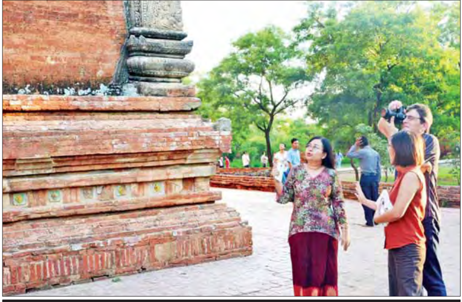
ငလျင်ဒဏ်သင့်ခဲ့သည့် စူဠာမဏိစေတီတွင် ယူနက်စကိုမှ လာရောက်လေ့လာစဉ်။

ပုဂံဒေသမှ မေး။ ။ ရှေးဟောင်းဘုရားပုထိုးစေတီတွေပျက်စီးသွားတဲ့အတွက်ကြောင့် ယူနက်စကိုဝင်ဖို့ အခက်အခဲဖြစ်သွားနိုင်ပါသလား။ ဖြေ။ ။ ရှေးဟောင်းအမွေအနှစ်ကို ပြန်လည်ပြင်ဆင်ရေးအပိုင်းမှာစီမံကိန်းနှစ်ခု ရှိပါတယ်။ ကာလတိုမှာလုပ်ကိုင်ရမယ့်အချက်တွေ၊ ကာလရှည်လုပ်ဆောင်ရမယ့်အချက်တွေကို ယူနက်စကိုက လုပ်ငန်းအစီအစဉ်များကို မကြာခင်ရေးဆွဲပြီး သက်ဆိုင်ရာ အစိုးရအဖွဲ့များကို တင်ပြသွားမှာဖြစ်ပါတယ်။ ဇူလိုင်လအတွင်းက ယူနက်စကိုအနေနဲ့ မန္တလေးမှာတိုင်းဒေသကြီးအစိုးရအဖွဲ့ဝင်များနဲ့လည်း ဆွေးနွေးမှုတွေလုပ်ခဲ့ပါတယ်။ အဲဒီမှာမြန်မာနိုင်ငံအစိုးရအနေနဲ့ ပုဂံဒေသကို ၂၀၁၈ မှာ ကမ္ဘာ့အမွေအနှစ်စာရင်းမှာတင်ပြနိုင်ဖို့အတွက် ဆုံးဖြတ်ခဲ့ပါတယ်။ အဲဒီအစီအစဉ်ကလည်း အခုအချိန်ထိမပြောင်းလဲသေးပါဘူး။ ဒီလိုပုဂံမှာ ငလျင်ဖြစ်သွားတဲ့အတွက် နောင်နှေးနှေးနဲ့ ဖြစ်ပေါ်လာစေမလားဆိုတာက အခုချိန်မှာပြောဖို့သိပ်ပြီး စောနေပါသေးတယ်။ နှစ်ပတ်၊ သုံးပတ်လောက် လေ့လာ