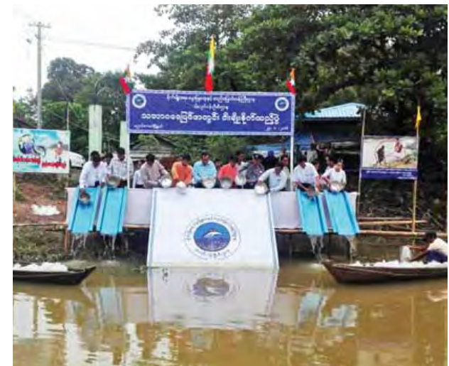
သည် ငါးမြစ်ချင်း နှစ်သိန်းငါးသောင်း ကြောင်းသိရသည်။ ကျော်အားငါးမျိုးစိုက်ထည့်ပေးခဲ့ သူရ(ညောင်လေးပင်)

သည်တစ်ပတ်မှာတော့ စာဖတ်သူလူကြီးမင်းများအတွက် တွေးစရာ၊ ဆွေးနွေးစရာအစတွေကိုမရတဲရဲနဲ့ပထုတ်ကြည့်လိုက်ပါတယ်။ အားလုံးအတွက် တွေးဆဆင်ခြင်စရာတစ်စုံတစ်ရာတော့ ကျန်ရစ်မယ် ထင်ပါတယ်ခင်ဗျား။