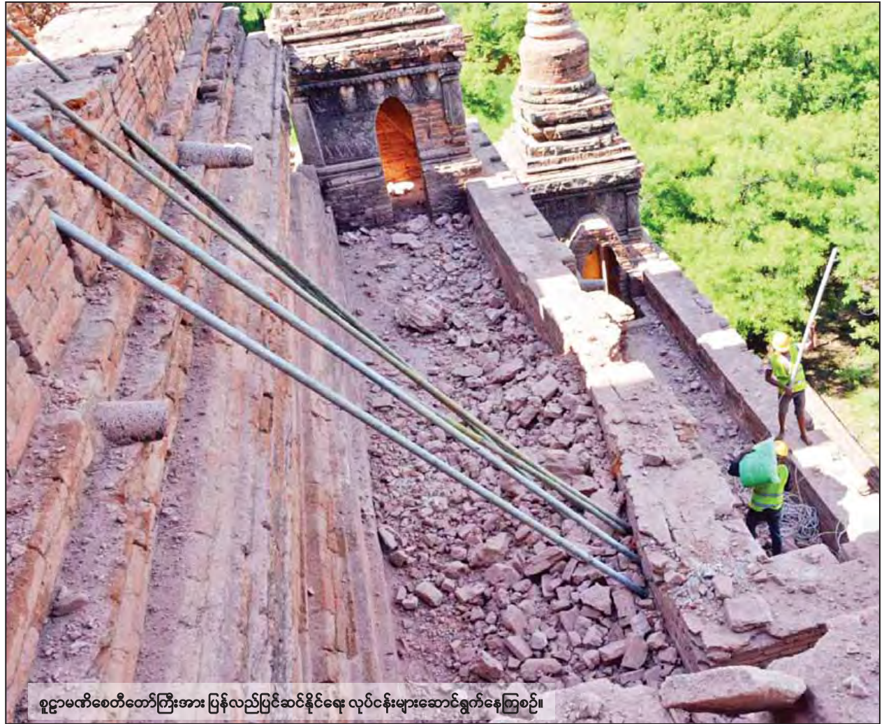
စူဠာမဏိစေတီတော်ကြီးအား ပြန်လည်ပြင်ဆင်နိုင်ရေး လုပ်ငန်းများဆောင်ရွက်နေကြစဉ်။