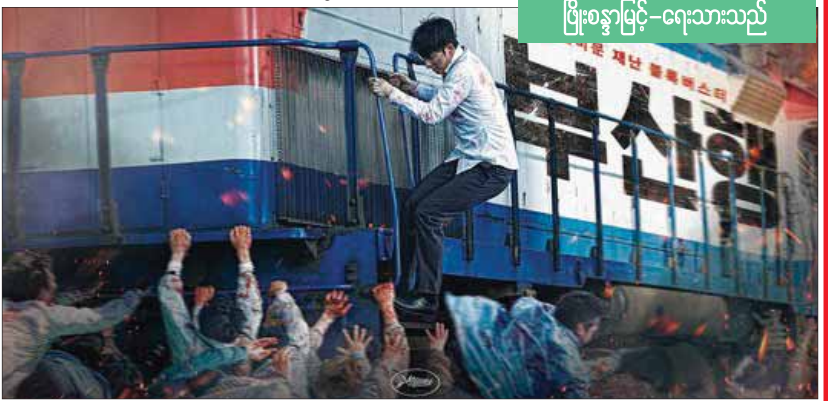
ပြီးစနွားမြင့်-ငေးသားသည်

ပြီးခဲ့တဲ့ ရက်သတ္တပတ်က မြန်မာတစ်နိုင်ငံလုံးမှာရှိတဲ့ ရုပ်ရှင်ရုံတွေမှာ တစ်ပြိုင်တည်းရုံတင်ပြသခဲ့တဲ့ အဲဒီဇာတ်ကားဟာ ပရိသတ်တွေ အကြိုက်တွေ့ခဲ့ကြတယ်လို့လည်း သိရပါတယ်။ 'ဘောစိ'ဇာတ်ကားကို အခုတစ်ပတ်မှာ သမ္မတ၊ သွင်၊ မင်္ဂလာ(၁)သိမ်ကြီးဈေး၊ တော့ရွှင်ရယ်(စိန်ဂေဟာပါရမီ)၊ မင်္ဂလာစံပြ၊ မင်္ဂလာ(ဂမုန်းပွင့်)၊ မြို့မ၊ ဝင်းလိုက်နှင့် မင်္ဂလာထွန်းသီရိ အဆင့်မြင့် ရုပ်ရှင်ရုံများမှာ ရုံတင်ပြသမည်။