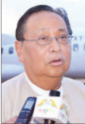
ပြည်ထောင်စုဝန်ကြီး ဦးဝင်းခိုင်

ပြည်တွင်းပြည်ပဘုရားဖူးတွေ စိတ်ဝင်စားတဲ့ ဂူပြောက်ကြီး၊ ထီးလိုမင်းလို၊ စူဠာမဏိ၊ ပြဿဒိကြီး၊ စေတနာကြီးနဲ့ မေရုဘုရားပုထိုးတွေကို ဦးစားပေး ပြုပြင်သွားမယ့်အပြင် ကျန်တဲ့စေတီပုထိုးတွေကို အဆင့်သတ်မှတ်ပြီး ပြုပြင် ခြင်း ဒါမှမဟုတ် တစ်ပြိုင်တည်း ဖြန့်ကြက်ပြုပြင်ခြင်းတွေ ဆောင်ရွက် သွားမှာ ဖြစ်ပါတယ်။ အခုလို ငလျင်ဒဏ်ကြောင့် ပြိုကျပျက်စီးသွားတဲ့ မြန်မာ့ရွှေဟောင်းအမွေအနှစ်ပစ္စည်းတွေကို ယခုတစ်ကြိမ် ပြန်လည်ပြုပြင် မွမ်းမံခွင့်ရခြင်းဟာ ဘဝမှာတန်ဖိုးကြီးမားတဲ့ မဟာကုသိုလ်တော်ဖြစ်ပါတယ်။