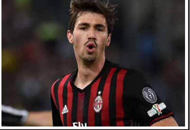
မေလဲ့သင်း

၍သာ ရိုမက်ဂီနိုလီဘက်သို့ ပြောင်းလဲစဉ်းစား ခဲ့ခြင်းဖြစ်သည်။ အသက်(၂၁)အရွယ် ရိုမက်ဂီနိုလီမှာ ပြီးခဲ့သည့်နှစ်ဘောလုံးရာသီတွင် ပြောင်းရွှေ့ကြေး ပေါင် ၂၁သန်းဖြင့် ရောက်ရှိလာခဲ့ပြီး နောက် ယခင်အေစီမီလန်နောက်ခံလူ နက်စတာ လက်သစ်ဟု တင်စားခံထားရသော ကစားသမားလည်း ဖြစ်သည်။