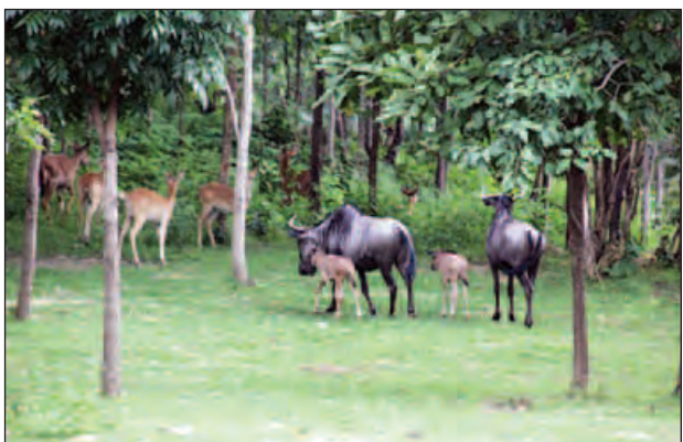
နေထိုင်ကျက်စားကြသည်များကို လာရောက်လေ့လာမြင်တွေ့နိုင်ပါကြောင်း သတင်းကောင်းပါးအပ်ပါသည်။ (ကြေးမုံ)

ရင်ဆိုင် ရချိန်တွင် တစ်နာရီပိုင် ၄၀ မှ မိုင် ၆၀ ထိ အမြန်နှုန်းဖြင့်ပြေးနိုင်ကြပြီး များသော အားဖြင့် ဇွန်လပိုင်းတွင် မိတ်လိုက်တတ်ကြသည်။ ကိုယ်ဝန်ဆောင်ကာလမှာ ရက် ၂၄၀ မှ ရက် ၂၇၀ ခန့်ထိရှိပြီး တစ်ကြိမ်လျှင် တစ်ကောင်သာပေါက်ပွား တတ်ကြသည်။ သားပေါက်ကလေးများ၏ ပျမ်းမျှ ကိုယ်အလေးချိန်မှာ (10kg-20kg)ထိ ရှိတတ်ကြသည်။ ၎င်းနူးသားပေါက်ကလေးများသည် မိခင်မှ သဘာဝအတိုင်းမွေးဖွား၍ မိနစ် ၃၀ မှ ၄၅ မိနစ်အတွင်း လမ်းလျှောက်နိုင်၊ ပြေးနိုင်ကြပြီး အသက် နှစ်နှစ်ခွဲခန့်တွင် အရွယ်ရောက်သည်။ ခြေလေးချောင်းနှင့် ဦးချိုပါရှိသော အသီးအရွက်စား စားမြုံ့ပြန် သတ္တဝါများဖြစ်သည်။ ၎င်းတို့သည် နေပိုင်းတွင် လှုပ်ရှားမှုနည်းပြီး နံနက်စောစောနှင့် ညနေပိုင်းများတွင်သာ လှုပ်ရှားသွားလာ ကျက်စားတတ်ကြသည်။ ယခုအခါ ထိုနူးသမင်များကို ဆာဖာရီဥယျာဉ်(နေပြည်တော်)၌ အုပ်စုဖွဲ့