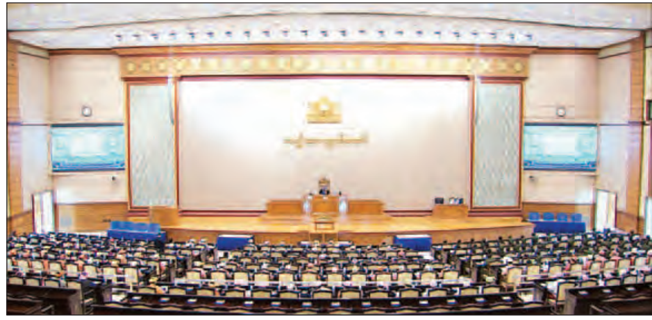
ဒုတိယအကြိမ် အမျိုးသားလွှတ်တော် ဒုတိယပုံမှန်အစည်းအဝေး (၂၀)ရက်မြောက်နေ့ ကျင်းပစဉ်။ (သတင်းစဉ်)

နေပြည်တော် ဩဂုတ် ၂၅ တိုင်းရင်းသားဘာသာစာပေ၊ ယဉ်ကျေးမှုအဖွဲ့အသီးသီးက အတည်ပြုပေးပို့လာသည့် Grade 1,2,3 ဘာသာစာပေ ဖတ်စာအုပ်များကို ရိုက်နှိပ်ပြီး အခမဲ့ဖြန့်ဝေပေးကြောင်း၊ ဘာသာစကားသင် ဆရာ ဆရာမများကို သင်ကြားချိန် နာရီနှင့် ချိန်ဆ၍ လစဉ်ချီးမြှင့်ငွေများကို ပေးအပ်လျက် ရှိကြောင်း ပညာရေးဝန်ကြီးဌာန ပြည်ထောင်စုဝန်ကြီး ဒေါက်တာမျိုးသိမ်းကြီးက ပြောကြားသည်။ ပြည်ထောင်စုဝန်ကြီးက ၂၀၁၆-၂၀၁၇ ပညာသင်နှစ် တွင် တိုင်းရင်းသားစာပေများကို ထိရောက်စွာသင်ကြား နိုင်ရန်အတွက် မြို့နယ် ၁၈၇ မြို့နယ်၊ ကျောင်းသားပေါင်း ၅၄၀၀၀၀ အတွက် တိုင်းရင်းသားဘာသာပေါင်း ၄၉ မျိုးကို ပညာရေးဝန်ကြီးဌာန အခြေခံပညာဦးစီးဌာနက အခမဲ့ဖြန့်ဝေပေးရန် စီစဉ်ထားရှိပြီးဖြစ်ပါကြောင်း၊ အလားတူ သင်ကြားမည့် ဆရာ ဆရာမများအတွက် လိုအပ်မည့် ချီးမြှင့်ငွေများကို စာရင်းပြုစု၍ ဘဏ္ဍာငွေ လျာထားသတ်မှတ်ပြီးဖြစ်ပါကြောင်း ဆက်လက် ပြောကြားသည်။ ယနေ့ကျင်းပသည့် ဒုတိယအကြိမ် အမျိုးသားလွှတ်တော် ဒုတိယပုံမှန်အစည်းအဝေး (၂၀)ရက်မြောက်နေ့တွင် စစ်ကိုင်းတိုင်းဒေသကြီး မဲဆန္ဒနယ်အမှတ်(၁၂)မှ ဦးမင်းနိုင် ၏ “မြန်မာနိုင်ငံတွင်နေထိုင်ကြသော တိုင်းရင်းသားများ သည် မိမိတို့တိုင်းရင်းသားစာပေများကို သင်ကြားနိုင်ရန် နိုင်ငံတော်မှ ဆရာ ဆရာမများအား ၂၀၁၆-၂၀၁၇ ပညာသင်နှစ်တွင် ခန့်ထားပေးရန်အစီအစဉ်ရှိ/မရှိ” မေးခွန်းနှင့်စပ်လျဉ်း၍ ပြည်ထောင်စုဝန်ကြီးက အထက်ပါ အတိုင်း ဖြေကြားခဲ့ခြင်းဖြစ်သည်။ ထို့ပြင် နိုင်ငံတော်အစိုးရ၏လမ်းညွှန်မှုအရ ပညာရေး