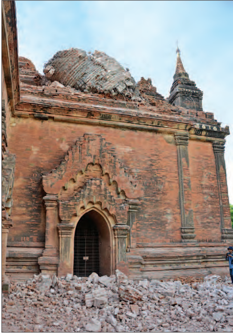
လျှင်ဒဏ်သင့်ခဲ့သည့် စူဠာမဏိဘုရား ပျက်စီးနေမှုကို တွေ့ရစဉ်။ (အပေါ်ပုံ)နှင့် နိုင်ငံတော်သမ္မတ ဦးထင်ကျော် ပြန်လည်ပြုပြင်ထိန်းသိမ်းရေးလုပ်ငန်းများ စနစ်တကျဆောင်ရွက်ရန် မှာကြားစဉ်။ (ယာဝုံ) (သတင်းစဉ်)