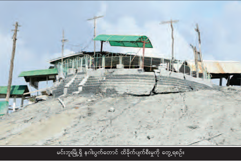
မင်းဘူးမြို့ရှိ နဂါးပွက်တောင် ထိခိုက်ပျက်စီးမှုကို တွေ့ရစဉ်။

ဈေးကအပြန် ထိုင်ခုံတွင် ခဏထိုင်နေတုန်း တဖြည်းဖြည်းလှုပ်လာ၍ ငလျင်လှုပ်နေသည်ဟု တခြား လူများအား သတိပေးပြီး ခဏအကြာတွင် အထက်အောက် ရှေ့နောက် ဘယ်ညာ သွက်သွက်ခါရမ်းသည်အထိ လှုပ်ခတ်မှုရှိလာကြောင်း၊ မြေကြီးကိုကြည့်ပြီး မည်ကဲ့သို့ ခြေချရမည်ဆိုသည်ကိုပင် မစဉ်းစားတတ်တော့ကြောင်း၊