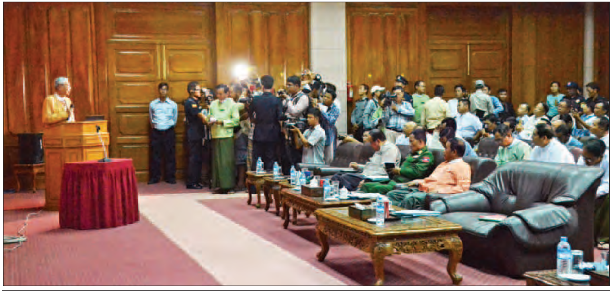
နိုင်ငံတော်သမ္မတ ဦးထင်ကျော် ပုဂံရှေးဟောင်းယဉ်ကျေးမှုပြတိုက်၌ အမှာစကားပြောကြားစဉ်။ (သတင်းစဉ်)

ပုဂံ-ညောင်ဦးဒေသတွင် ငလျင်ဒဏ်သင့်ပြီးချိန်မှစတင်၍ အပျက်အစီး များအား ဖယ်ရှားခြင်း၊ ကူညီကယ်ဆယ်ခြင်းလုပ်ငန်းများကို ဒေသဆိုင်ရာ အာဏာပိုင်များ၊ တပ်မတော်၊ မြန်မာနိုင်ငံရဲတပ်ဖွဲ့၊ မီးသတ်တပ်ဖွဲ့နှင့် ဒေသခံ