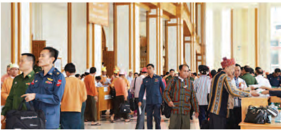
ဒုတိယအကြိမ် ပြည်သူ့လွှတ်တော်ဒုတိယပုံမှန်အစည်းအဝေးသို့ တက်ရောက်လာသော လွှတ်တော်ကိုယ်စားလှယ်များအား တွေ့ရစဉ်။

ဒေသခံပြည်သူ အစုအဖွဲ့ပိုင် သစ်တောတည်ထောင်ခြင်း လုပ်ငန်းဆိုင်ရာ ညွှန်ကြားချက်များတွင် သစ်တောများအတွင်း သို့မဟုတ် သစ်တောများအနီး (၅)မိုင် ပတ်လည်အတွင်းတွင် (၅)နှစ် တစ်ဆက်တစ်စပ်တည်း အခြေချနေထိုင်ခဲ့သော ဒေသခံပြည်သူများအနက် သစ်တောလုပ်ငန်းကို စိတ်ဝင်စားပြီး သစ်တောကိုအမှန်တကယ် မှီခိုအသုံးပြု၍ တိုက်ရိုက်အကျိုးသက်ဆိုင်သည့် အိမ်ထောင်စုများဖြင့် ဖွဲ့စည်းထားသော အသုံးပြုသူများအဖွဲ့ဖြင့် ဒေသခံပြည်သူအစုအဖွဲ့ပိုင် သစ်တောလုပ်ငန်းကို ဆောင်ရွက်နိုင်ပါကြောင်း၊ သို့ရာတွင် အစဉ်အလာနှင့် ဓလေ့ထုံးစံအရ ဒေသခံလူထုက စီမံအုပ်ချုပ်လုပ်ကိုင်လာခဲ့သော သစ်တောများကိုဖြစ်စေ၊ ဒေသအခြေအနေပေါ် မူတည်၍ ခရိုင်သစ်တောအရာရှိက အတည်ပြုသတ်မှတ်ပေးလျှင်ဖြစ်စေ၊ ခြွင်းချက်အဖြစ် အကွာအဝေးနှင့် နေထိုင်ခဲ့သည့် အချိန်ကာလကို ထည့်သွင်းစဉ်းစားရန် မလိုအပ်ပါကြောင်း၊ ကျေးရွာများအနီး (၅)မိုင်ပတ်လည်အတွင်းရှိ သစ်တောမြေ သို့မဟုတ် အစိုးရစီမံခန့်ခွဲခွင့်ရှိသော မြေရှိ