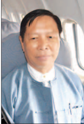
ပြည်ထောင်စုဝန်ကြီးသူရဦးအောင်ကို