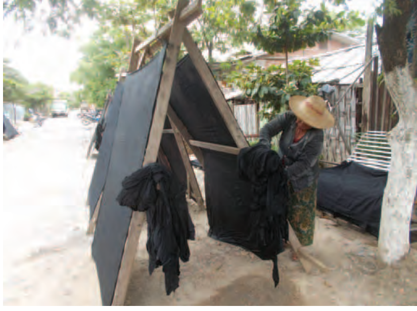
ကော်တင်သည့်လုပ်ငန်းကြောင့် နေ့စဉ်ပုံမှန်ဝင်ငွေ ရရှိနေသည်။ အများစုမှာ မိန်းကလေးများက ပြုလုပ် ပြီး မိန်းကလေးတစ်ဦးလျှင် ငွေကျပ် ၄၀၀၀ မှ ၆၀၀၀ အထိ လုပ်နိုင်သည့် ပမာဏအပေါ်မူတည်ကာ ရရှိကြသည်။ အထက်ဆင်ကော်တင်သည့်လုပ်ငန်း ကို တစ်နှစ်ပတ်လုံးပြုလုပ်ကြပြီး နေ့စဉ်ပုံမှန်ဝင် ငွေရရှိသည့်အတွက် အဆင်ပြေလျက်ရှိကြောင်း သိရသည်။ တိမ်တမန်

မန္တလေး ဩဂုတ် ၂၅ မန္တလေးမြို့ ပြည်ကြီးတံခွန်မြို့နယ် သင်ပန်းကုန်း ညည (၁၉) ရပ်ကွက်တွင် အထက်ဆင်ကော်တင် သည်လုပ်ငန်းကြောင့် နေ့စဉ်ပုံမှန်ဝင်ငွေရရှိလျက်ရှိ သည်။ အထက်ဆင်ကော်တင်ရန်အတွက် လုပ်ငန်းရှင် မှာ ကော်တင်သူထံ ကုန်ကြမ်းများ အိမ်အထိပို့ ဆောင်ပေးလေ့ရှိသည်။ ကော်တင်သူများမှာ မိသား စုလိုက် ပြုလုပ်ကြသည်။ ကော်တင်ရာတွင် ကော်ကျီ ပြီးပါက အထက်ဆင်ပိတ်အုပ်များကိုထည့်ကာ နင်း ပေးရသည်။ ကော်တင်ပြီးသည်နှင့် လှန်းစင်များတွင်တင်ကာ နေလှန်းပေးကြရသည်။ လူတစ်ဦးသည် တစ်နေ့ လျှင် အထက်ဆင်ပိတ်အုပ် ၁၅ အုပ်မှ ၂၀ အထိ ပြီးစီးသည်။ အထက်ဆင်အလျားနှစ်ကိုက် အနံ့တစ် ကိုက်ခန့်ရှိသည့် အထက်ဆင်ပိတ်စတစ်လျှင် ငွေ ကျပ်တစ်ဆယ်နှုန်း ရရှိကြသည်။ နေလှန်းပြီး ခြောက် သွားပါက အထက်ဆင်ကို သီးသန့်ခေါက်သူများက ခေါက်ပေးကြသည်။ကော်တင်သည့်လုပ်ငန်းအတွက် တစ်ဈေးပေးရသလို ခေါက်သူအတွက်လည်း တစ် ဈေးပေးကြရသည်။ အထက်ဆင်ခေါက်သူများမှာ ပိတ်စတစ်လျှင် လေးကျပ်နှုန်းပေးကြရသည်။ လက်ရှိကာလတွင် သင်မန်းကုန်း ညည(၁၉) ရပ်ကွက်တွင် အထက်ဆင်