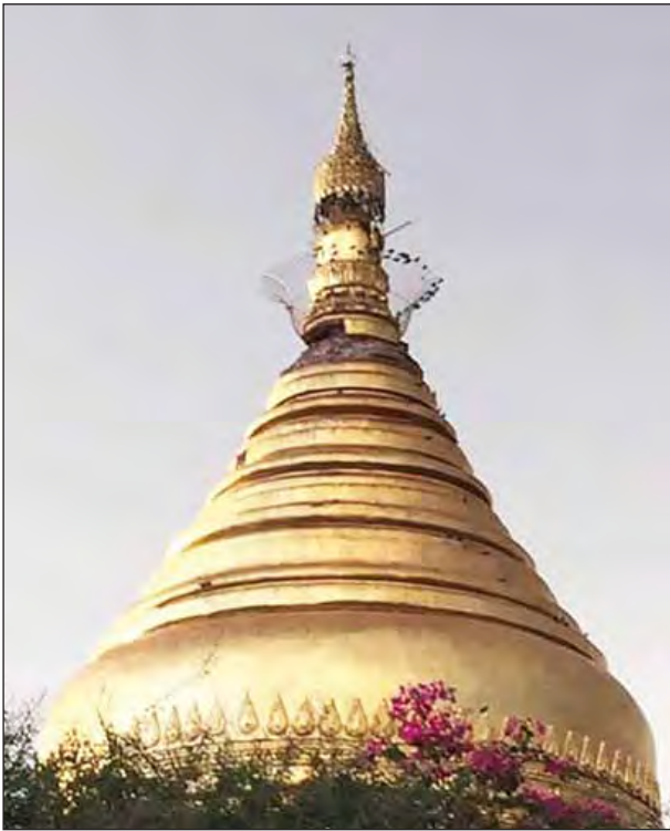
ဓမ္မရာဇကဘုရားဖောင်းရစ်ကွဲအက်မှု ဖြစ်ပွားစဉ်။

တစ်ချိန်တည်းမှာပင် ချောင်းဦး မြို့နယ် သုံးပန်လှကျေးရွာအုပ်စု သုံးပန်လှကျေးရွာ ရွာအဝင်ရှိ သုံးပန် လှ ဘုရားကြီး စိန်ဖူးတော်နှင့် ငှက်မြတ်နားတော် မြေခခဲ့ပြီး အမြင့် ကျေးရွာအုပ်စုရှိ ဘုရားအမှတ်(၀၆၂) ညဏ်တော် ပေ ၆၀ ခန့်(ဘွဲ့တော်စိစစ် ဆဲ)ဘုရားငုတ်တို့သည် သုံးပုံတစ်ပုံခန့်