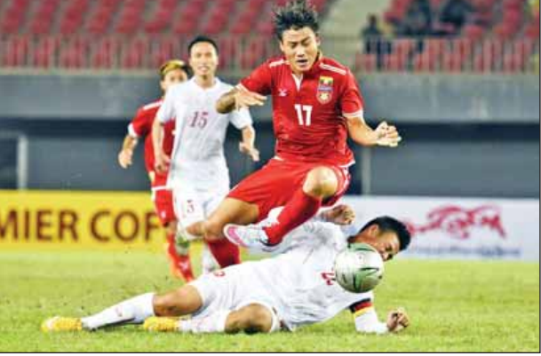
မြန်မာအသင်းတိုက်စစ်ကို ဗီယက်နမ်နောက်တန်း ဖျက်ထုတ်နေစဉ်။

ဗီယက်နမ် ယူ-၁၉ အသင်းက လေး ရက်တွင် ဆက်လက်ကျင်းပမည်ဖြစ်ပြီး မှတ်၊ ဆာပေါ့ရို ယူ-၁၈ နှင့် ထိုင်း ယူ-၁၉ အသင်းတို့က သုံးမှတ်စီ၊ အိမ်ရှင်မြန်မာအသင်းက တစ်မှတ်တို့ ရရှိထားသည်။ အုပ်စုနောက်ဆုံးပွဲကို ဩဂုတ် ၂၆