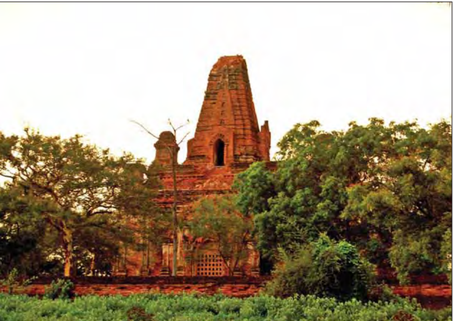
ဝက်ကြီးအင်း ဝုပြောက်ကြီးဘုရား၏ကွမ်းတောင် မူလနေရာထိပြုတ်ကျမှုဖြစ်ပွားစဉ်။ (ရဲသူရအောင်)

ပိုင်းရပ်ကွက်ရှိ ဆယ်မျက်နှာစေတီ တော်၏ ထီးတော် ၄၅ ဒီဂရီ တိမ်း စောင်းသွားခြင်း၊ ရွာသစ်ရပ်ကွက်ရှိ ရွှေတောင်ဦးစေတီတော်၊ ရွှေစော လူးစေတီတော်၊ ကိုးတောင်ကျေးရွာရှိ အရိုးဘုရားကြီးစေတီတော်၊ ထန်း ချောင်းကျေးရွာရှိ လေးမျက်နှာစေတီ တော် စသည့်စေတီတော်များ၏ ထီး တော်များ မြေခခဲ့သည်။ ထို့အတူ ဆိပ်ဖြူမြို့နယ် အောက် ဆိပ်ကျေးရွာ ရွာဦးကျောင်း ဒီပင် ကရာစေတီတော် ကျောက်ထီးတော် တိမ်းစောင်းခြင်း၊ ပိဋကတ်တိုက်စေတီ တော် ဖောင်းရစ်အက်ကွဲခြင်း၊ ဆန္ဒ တော်ပြည့် အာရုံ ခံ အုတ် တိုက် ရှိ ရှေးဟောင်း အဆောက်အအုံ ပြို ကျခြင်း၊ ရွာဦးအနောက်ကျောင်းရှိ