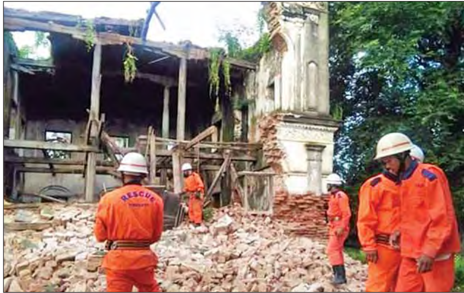
လျင်လှုပ်ခတ်မှုကြောင့် တောင်တွင်းကြီးမြို့နယ် မောင်းတိုင်(၂)ရပ်ကွက် အပိုင်း(၆) မြောက်ပြင်အရှေ့ကျောင်းဝင်းအတွင်းရှိ ရဟန်း၊ သံဃာ မနေတော့သည့် နှစ်ထပ်တိုက်ကျောင်းဆောင်ဟောင်းပြိုကျနေမှုကို တွေ့ရစဉ်။