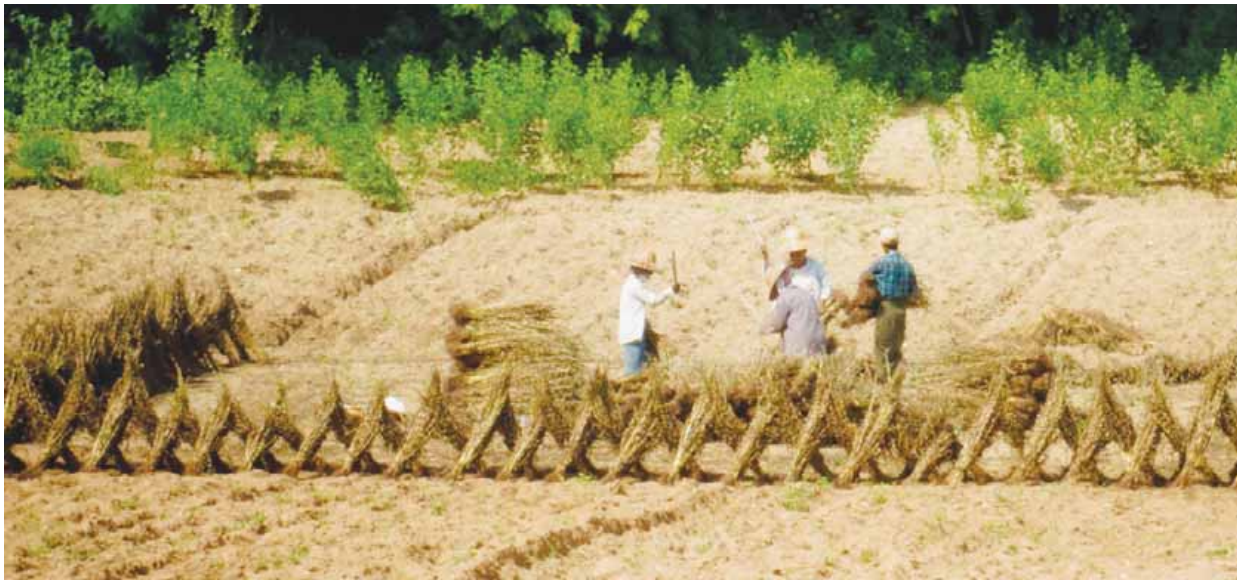
မင်းဘူး ဩဂုတ် ၂၄

မင်းဘူးမြို့နယ်အတွင်းရှိ ကျေးရွာများတွင် မိုးသီးနှံများ ရိတ်သိမ်းချိန်ကာလ သို့ရောက်ရှိခဲ့ပြီး နှမ်းစိုက်တောင်သူများအား စိုက်ပျိုးရေးနှင့် ဖွံ့ဖြိုးရေးကော်မရှင်များက တစ်လသားနီးပါး မိုးများ ချော်လင့်လင့် နှမ်းပင်များ ဖျက်သိမ်းပြီး ပြန်လည်စိုက်ပျိုးခဲ့ရာ နှမ်းထွက်နှုန်းမှာလည်း နည်းသည်ဟု တောင်သူဦးကြီးများထံမှ သိရသည်။