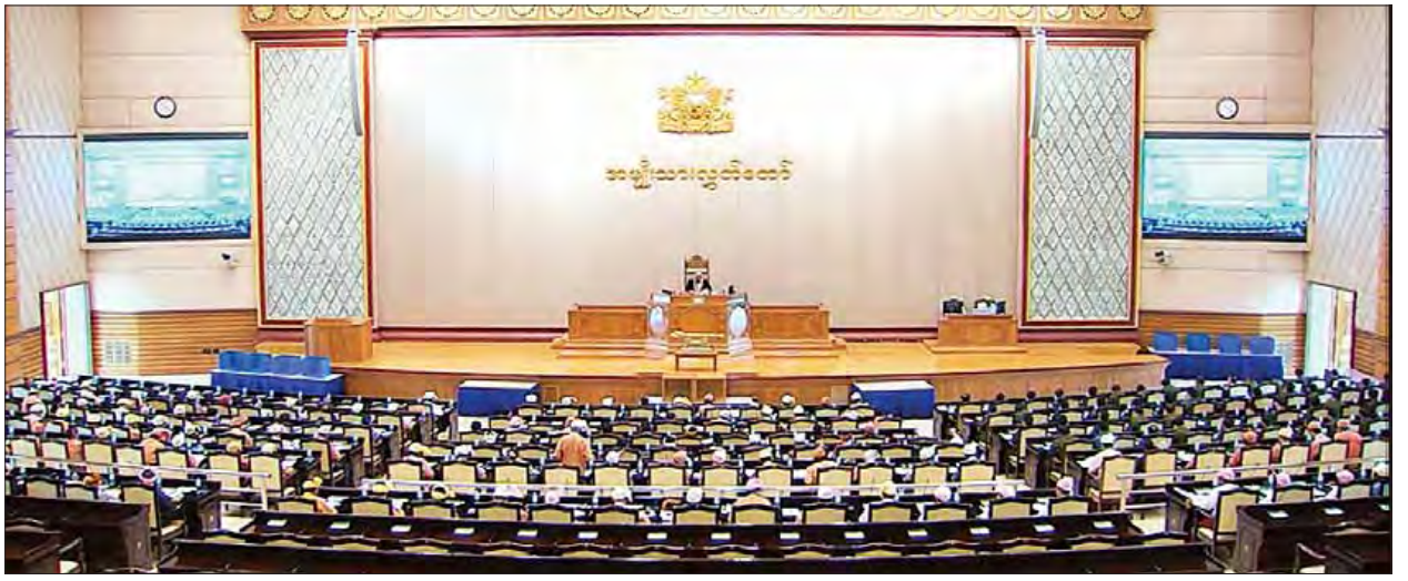
ဒုတိယအကြိမ် အမျိုးသားလွှတ်တော်ဒုတိယပုံမှန်အစည်းအဝေး (၁၉)ရက်မြောက်နေ့ ကျင်းပစဉ်။ (သတင်းစဉ်)