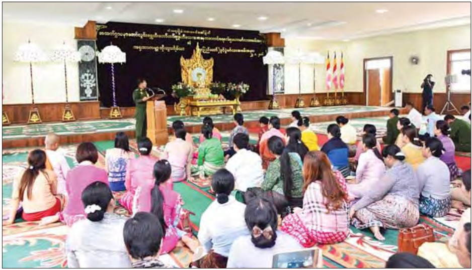
အားပေးစကားပြောကြားသည်။

ဆက်လက်၍ ကရုဏာကမ္ဘာ့ဘိုးဘွားရိပ်သာ အထိမ်းအမှတ်ရုပ်တုကို တပ်မတော်ကာကွယ်ရေး ဦးစီးချုပ်နှင့် ဒုတိယဗိုလ်ချုပ်ကြီးထွန်းကြည်(အငြိမ်းစား) တို့က စက်ခလုတ်နှိပ်ဖွင့်လှစ်ပေးပြီး ဘိုးဘွားရိပ်သာအတွင်း လှည့်လည်ကြည့်ရှု၍ အဘိုးအဘွားများအား ရင်းရင်းနှီးနှီး