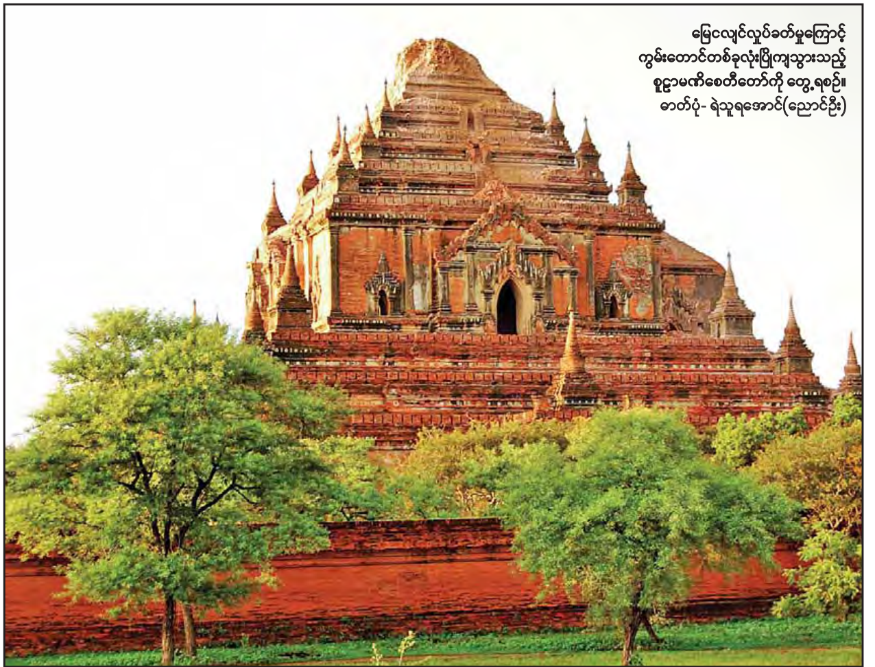
မြေလျှင်လှုပ်ခတ်မှုကြောင့် ကွမ်းတောင်တစ်ခုလုံးပြိုကျသွားသည့် စူဠာမဏိစေတီတော်ကို တွေ့ရစဉ်။