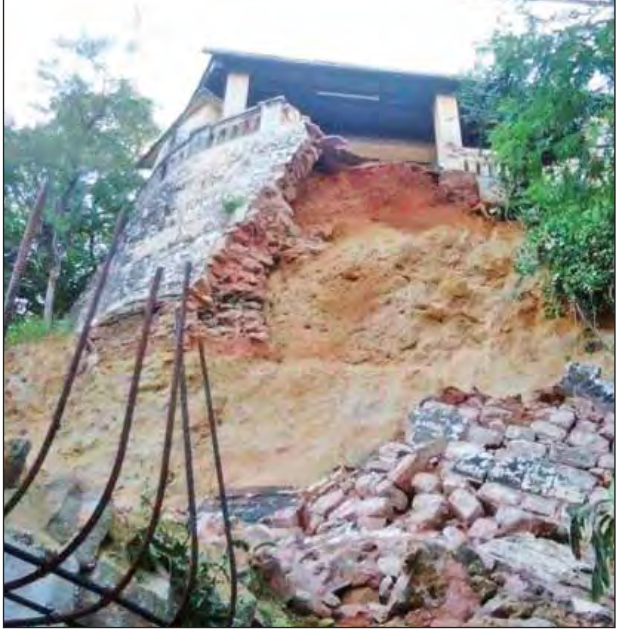
လျင်လှုပ်ခတ်မှုကြောင့် ရေနံချောင်းမြို့ ရွှေမြင်မိဘုရား ကမ်းပါးယံပြိုကျမှုကို တွေ့ရစဉ်။ (အဆိုပါကမ်းပါးယံပြိုကျမှုကြောင့် အသက် (၇)နှစ်အရွယ်နှင့် (၁၅)နှစ်အရွယ် အမျိုးသမီးနှစ်ဦး ကမ်းပါးယံပိတ်၍ သေဆုံးခဲ့သည်။)