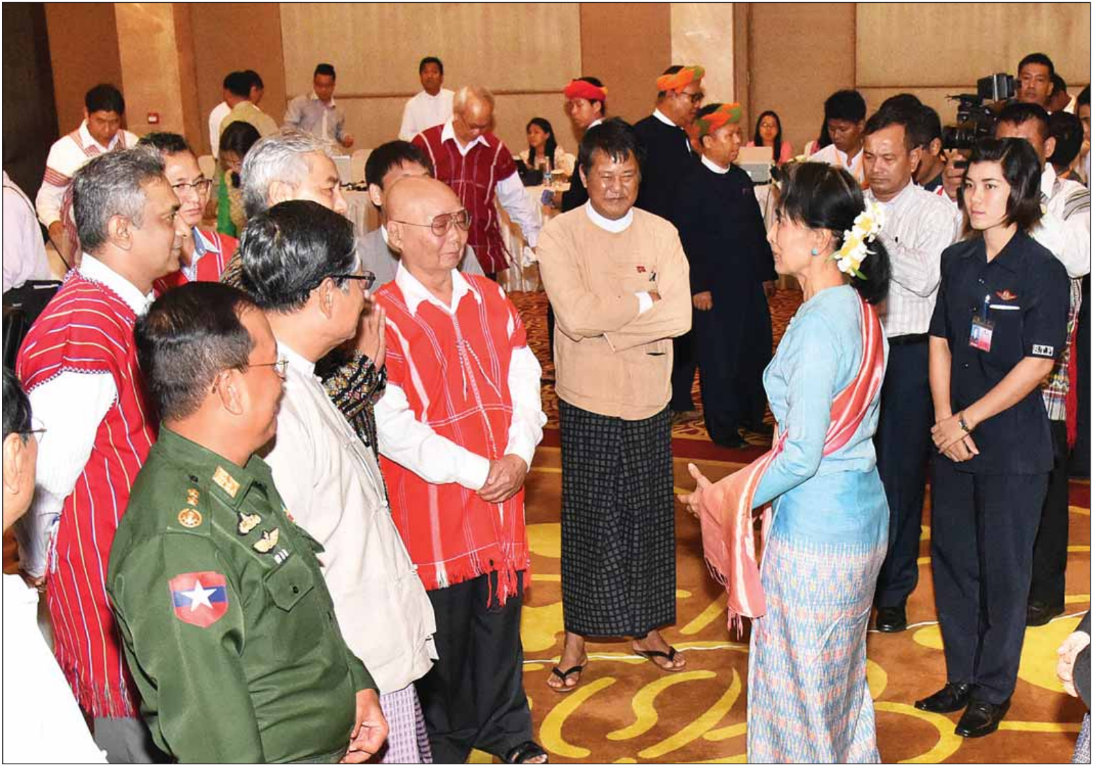
ငြိမ်းချမ်းရေးလုပ်ငန်းစဉ် ဦးဆောင်အဖွဲ့အစည်းအဝေးသို့ တက်ရောက်လာသူများအား နိုင်ငံတော်၏အတိုင်ပင်ခံပုဂ္ဂိုလ် ဒေါ်အောင်ဆန်းစုကြည် ရင်းရင်းနှီးနှီး နှုတ်ဆက်စဉ်။ (သတင်းစဉ်)

ငြိမ်းချမ်းရေးလုပ်ငန်းစဉ်၏ အဓိကလိုအပ်ချက်မှာ ယုံကြည်မှုပင်ဖြစ်ကြောင်း၊ တစ်ဦးနှင့်တစ်ဦး ယုံကြည်မှု ရှိပါက အခြားပြဿနာများကို ဖြေရှင်းနိုင်ကြောင်း၊ ယုံကြည်မှုမရှိပါက စာချုပ်များ မည်သို့ပင် ချုပ်ထားစေကာမူ အဟောသိက်ဖြစ်သွားစေနိုင်ကြောင်း၊ ယုံကြည်မှုရရှိရန်ဆိုလျှင် တစ်ဦးနှင့်တစ်ဦး ဆက်ဆံရာတွင် ပွင့်လင်းရန်နှင့် တည်မတ်မှုရရှိရန် လိုအပ်ကြောင်း၊ ပွင့်ပွင့်လင်းလင်းပြောရမည်ဆိုသော်လည်း တစ်ဖက်သားစာမျက်နှာ ၃ ကော်လံ ၁ သို့