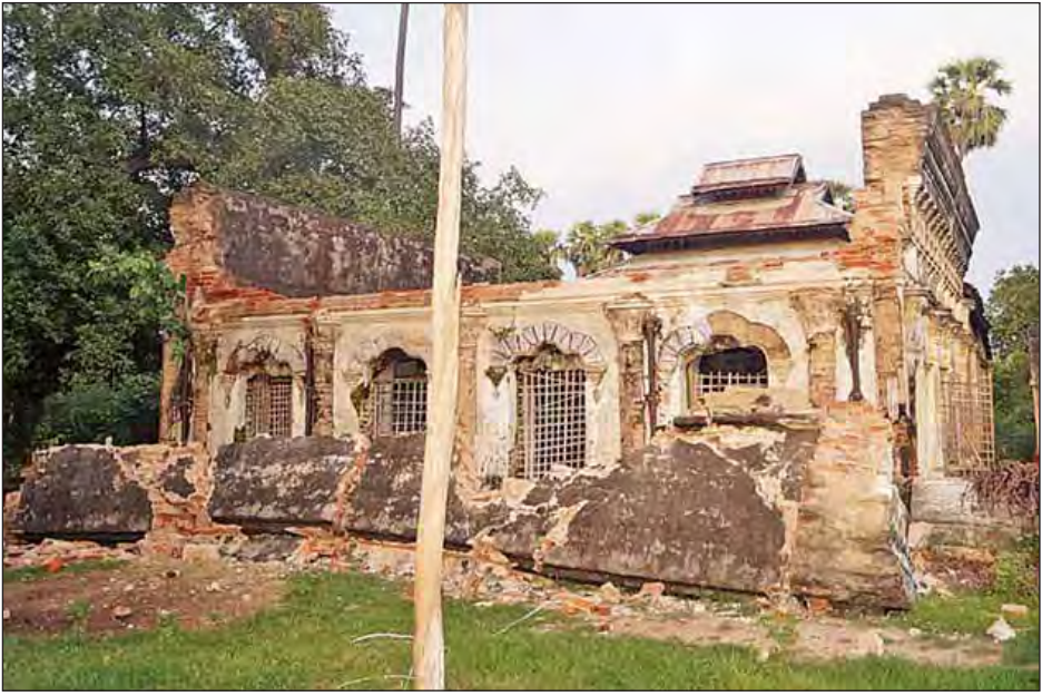
ဆိပ်ဖြူမြို့နယ် အောက်ဆိပ်ကျေးရွာရှိ ဆန္ဒတော်ပြည့်အာရုံခံအုတ်တိုက် ပြိုကျပျက်စီးမှုကို တွေ့ရစဉ်။ ဓာတ်ပုံ-မြို့နယ်(ပြန်/ဆက်)