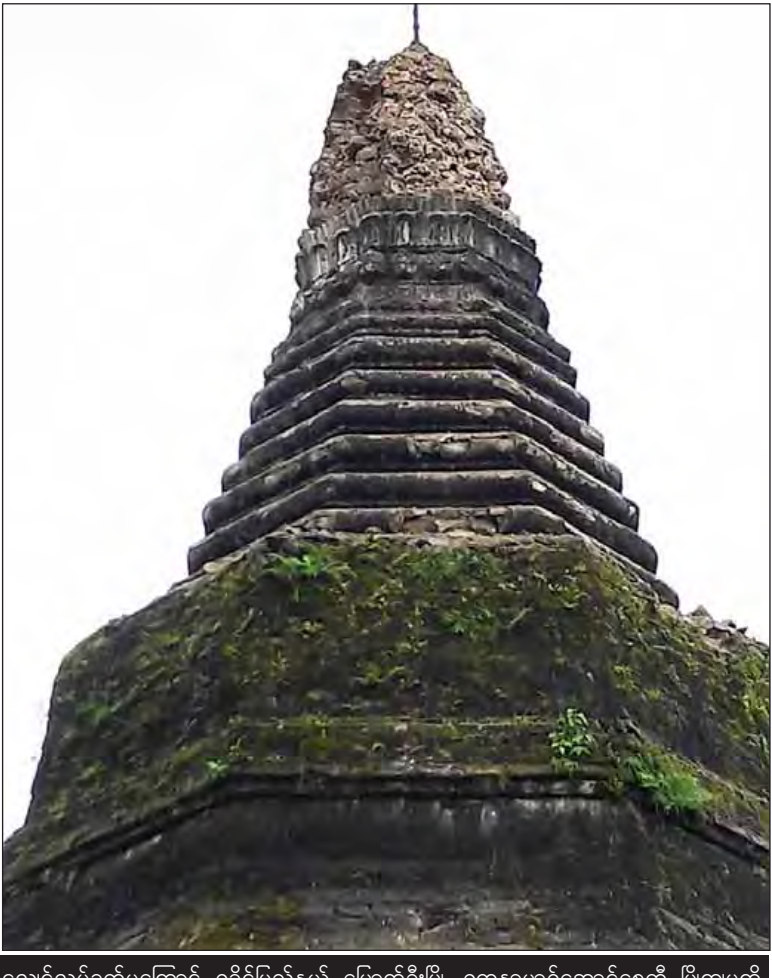
လျင်လှုပ်ခတ်မှုကြောင့် ရခိုင်ပြည်နယ် မြောက်ဦးမြို့ ရတနာမာရ်အောင်စေတီ ပြိုကျမှုကို တွေ့ရစဉ်။