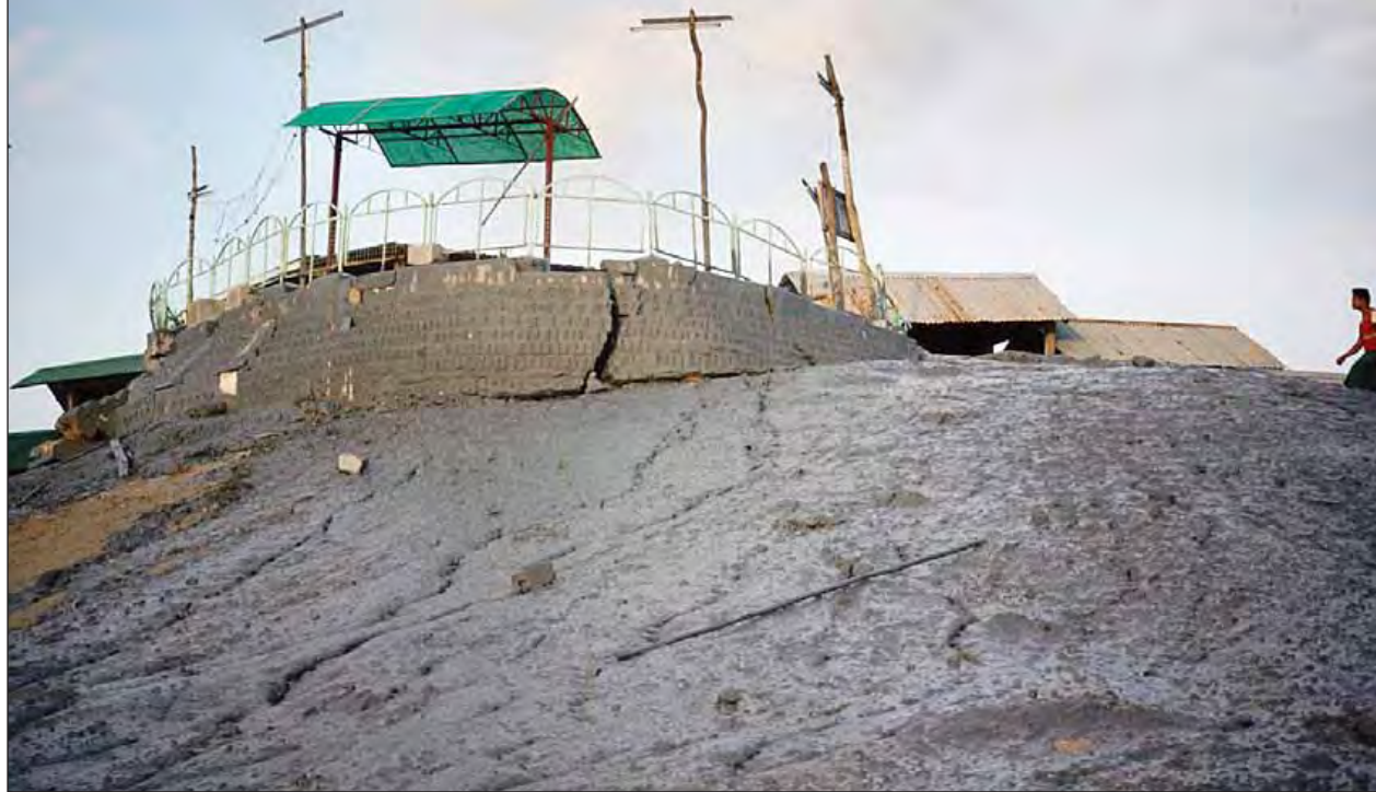
လျင်လှုပ်ခတ်မှုကြောင့် မင်းဘူး(စက္က)မြို့ နဂါးပွက်တောင်ရှိ ရွှံ့ချော်ရည်များ လျှံကျမှုဖြစ်ပွားသည်ကို တွေ့ရစဉ်။