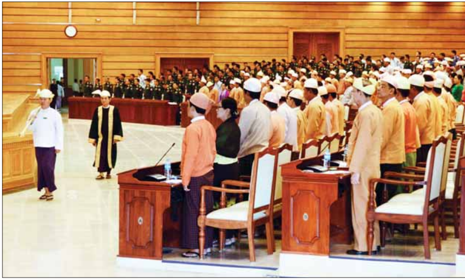
ဒုတိယအကြိမ် ပြည်သူ့လွှတ်တော်ဒုတိယပုံမှန်အစည်းအဝေး ကျင်းပစဉ်။ (သတင်းစဉ်)

ယနေ့ပြည်သူ့လွှတ်တော်အစည်းအဝေးတွင် အောင်မြင်သောစံနှုန်းနှင့် လွှတ်တော်ကိုယ်စားလှယ် ဒေါက်တာ ဦးလှမိုး၏ နိုင်ငံတော်၏ ချမှတ်ထားသော ပညာရေးမူဝါဒနှင့် ဦးတည်ချက်များကို အောင်မြင်စွာ အကောင်အထည်ဖော်နိုင်ရန် အထောက်အပံ့ဖြစ်စေသော အခြေခံပညာအဆင့် သင်ကြားသင်ယူမှု ပညာရည်စစ်ဆေးတိုင်းတာခြင်း အကဲဖြတ်မှုပုံစံအတွက် မှန်ကန်သော မူဝါဒတစ်ရပ် ချမှတ်ပေးပါရန်နှင့် ခိုင်ခိုင်မာမာကျင့်သုံးပေးပါရန် ပညာရေးဝန်ကြီးဌာနအား တိုက်တွန်းကြောင်း အဆိုကို လွှတ်တော်ကိုယ်စားလှယ်များက ဆွေးနွေးကြသည်။