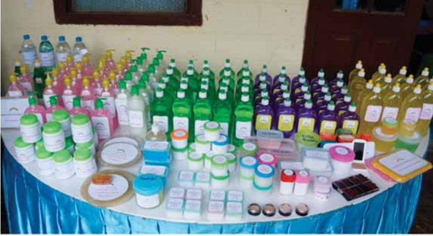
သင်တန်းသား/သူများ လက်တွေ့ထုတ်လုပ်ထားသည့် လူသုံးကုန်နှင့် အလှကုန်ပစ္စည်းများ(၂၃.၈.၂၀၁၆)

လွိုင်လင် ဩဂုတ် ၂၄ ရှမ်းပြည်နယ်(တောင်ပိုင်း) လွိုင်လင်မြို့ အထွေထွေအုပ်ချုပ်ရေးဦးစီးဌာန အစည်းအဝေးခန်းမ၌ ရှမ်းပြည်နယ် အသေးစား အလတ်စား စက်မှုလက်မှုလုပ်ငန်းဦးစီးဌာနမှ ကြီးမှူး၍ လူသုံးကုန်နှင့် အလှကုန်ထုတ်လုပ်မှု နည်းပညာသင်တန်းဆင်းပွဲ အခမ်းအနားကို ဩဂုတ် ၂၃ ရက် နံနက် ၉ နာရီက ပြုလုပ်ခဲ့ကြောင်း သိရသည်။