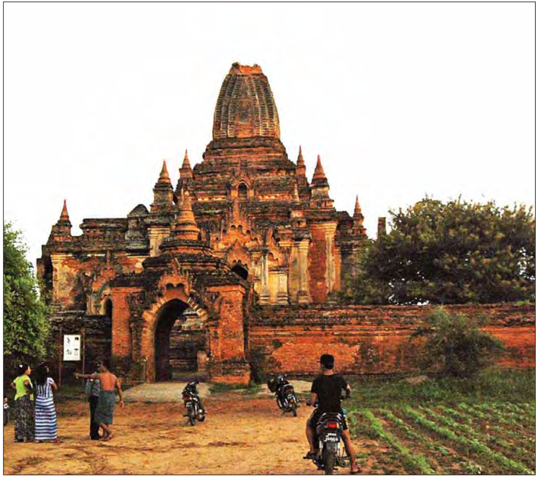
လျင်လှုပ်ခတ်မှုကြောင့် ပုဂံရှိ ရွှေလိပ်တူးအထွတ်စေတီ ပြိုကျမှုကို တွေ့ရစဉ်။