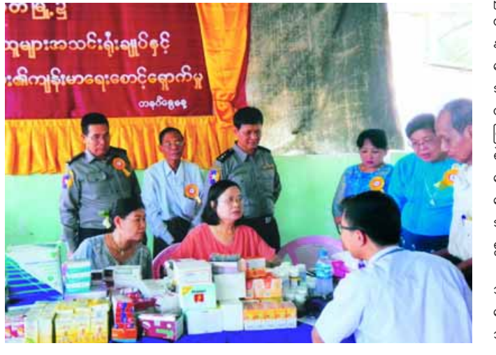
စိုင်းစော်လတ်(လင်းခေး)

အဆိုပါ အခမဲ့ဆေးကုသရေးအဖွဲ့ သည် ဟင်္သာတမြို့နယ်ရှိ အထွေထွေ ရောဂါ ဝေဒနာရှင် ၁၆၇ ဦးအား ဆေးကု သပေးခဲ့ကြောင်း သိရသည်။ (၇၀၀)