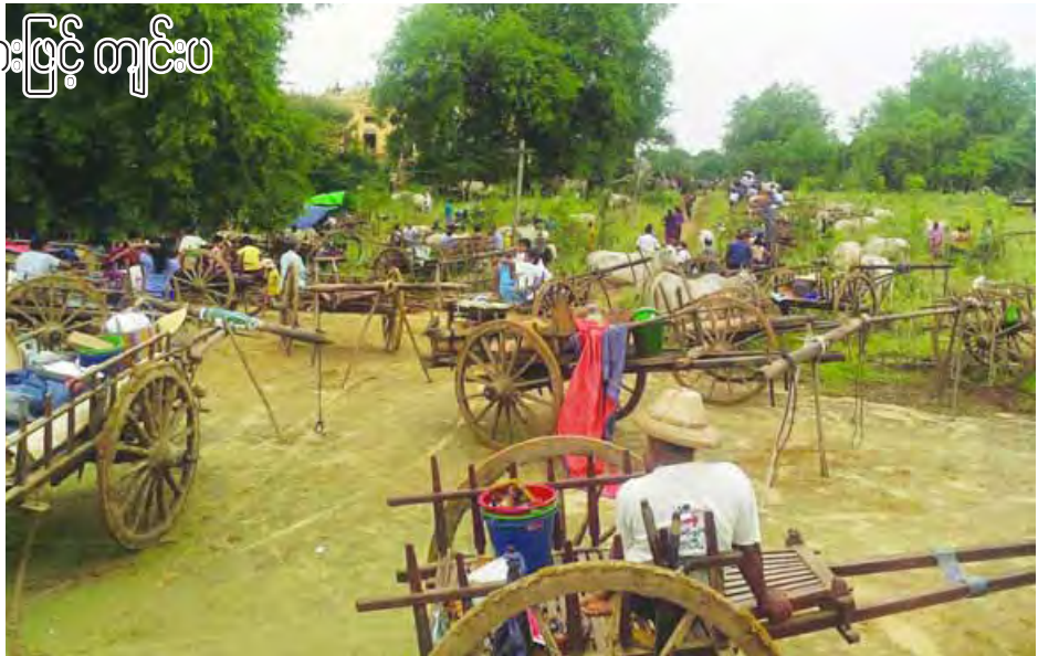
တိမ်တမန်

လာလှည်းတန်းကြီးကို လမ်းမှ စတုဒိသာကျွေးမွေးရာတွင် မှန်ဟင်းခါး၊ ကြာဆံဟင်းခါး၊ ပေါင်မှန်နို့ဆမ်း စသည်မှန် များကို ဘုရားပွဲအသွားတွင် ကျွေးမွေးလေ့ရှိပြီး ဘုရားပွဲ အပြန်တွင် အအေးမျိုးစုံတိုက်သည့်ခလေ့ကို ယနေ့ထိတိုင် ပြုလုပ်ကြသည်။ တစ်နှစ်လျှင် တစ်ကြိမ်သာကျင်းပသော ရွှေဆပ်သွား ဘုရားပွဲကို လှည်းများဖြင့်လာကာ ညအိပ်ဆင်နွှဲကြသည်။ ဘုရားပွဲရောက်ပါက လှည်းများကို စုပေါင်းကာ အစုအဖွဲ့ လိုက် လှည်းဝိုင်းထိုးထားလေ့ရှိသည်။ ဘုရားပတ်ပတ် လည်တွင် လှည်းဝိုင်းများဖြင့် ပြည့်နက်နေကာ ပျော်စရာ အကောင်းဆုံး အစည်ကားဆုံးပွဲတစ်ပွဲဖြစ်ပြီး ယနေ့ထိတိုင် လှည်းဝိုင်းယဉ်ကျေးမှုကို ဆက်လက်ထိန်းသိမ်းထားသော ရှားပါလှသည့် မြန်မာ့ရိုးရာ ခလေ့ပွဲတစ်ခုပင်ဖြစ်ကြောင်း သိရသည်။