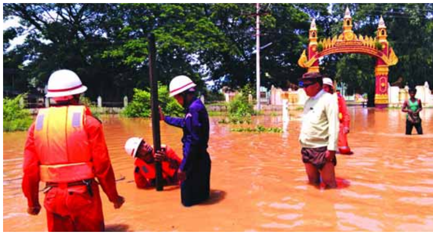
သန့်ထိုက်(ချေး)

တရားဝင် မှတ်ပုံတင်ထားသည့်ဆေးများ ကို အညွှန်းအတိုင်း သုံးစွဲကြရန်နှင့် လို အပ်သည်ထက် ပိုမိုအသုံးပြုခြင်း မပြုလုပ် ကြရန် အရေးကြီးကြောင်း၊ ဖြုတ်ကောင် ကျရောက်မှု၊ ဆစ်ပိုးများ ပေါက်ပွားနှုန်း နှင့် ကြိုတင်ကာကွယ်ရေးနည်းလမ်းများ ကိုလည်းကောင်း၊ စတင်စိုက်ပျိုးချိန်မှ ရိတ်သိမ်းခြေလှေ့ သိုလှောင်ဖြန့်ဖြူးသည် အထိ အဆင့်တိုင်းတွင် စနစ်တကျဆောင် ရွက်သင့်ကြောင်း အသိပညာပေး ဆွေး နွေးခဲ့ကြသည်။