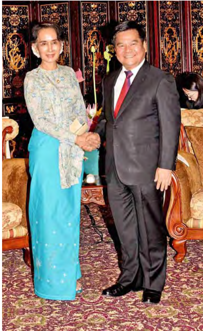
နိုင်ငံတော်၏အတိုင်ပင်ခံပုဂ္ဂိုလ် ဒေါ်အောင်ဆန်းစုကြည်နှင့် ယူနန်ပြည်နယ် တရုတ်ကွန်မြူနစ်ပါတီ အတွင်းရေးမှူး Mr. Li Jiheng တို့ တွေ့ဆုံနှုတ်ဆက်စဉ်။ (သတင်းစဉ်)

နိုင်ငံတော်၏အတိုင်ပင်ခံပုဂ္ဂိုလ်နှင့်အဖွဲ့အား ရန်ကုန်တိုင်းဒေသကြီး ဝန်ကြီးချုပ် ဦးဖြိုးမင်းသိန်းနှင့် တာဝန်ရှိသူများ၊ တရုတ်သံရုံးမှ ကောင်စစ်ဝန် Mr. Chen Chen နှင့် တာဝန်ရှိသူများက ရန်ကုန်အပြည်ပြည်ဆိုင်ရာလေဆိပ်၌ ကြိုဆိုနှုတ်ဆက်ကြသည်။ (သတင်းစဉ်)