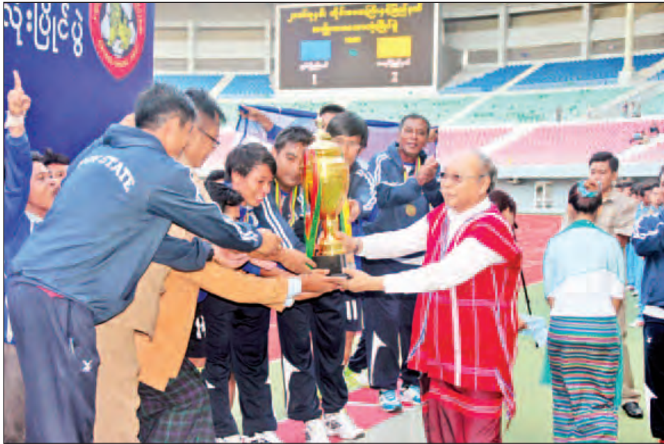
များ တက်ရောက်ကြည့်ရှုအားပေးသည်။

အဆိုပါပိုလ်လုပွဲနှင့် ဆုချီးမြှင့်ပွဲအခမ်းအနားသို့ ပြည်ထောင်စုလွှတ်တော်နာယက မန်းဝင်းခိုင်သန်းနှင့် အတူ နေပြည်တော်ကောင်စီဥက္ကဋ္ဌ ဒေါက်တာမျိုးအောင်၊ ကျန်းမာရေးနှင့်အားကစားဝန်ကြီးဌာန ပြည်ထောင်စု ဝန်ကြီး ဒေါက်တာမြင့်ထွေး၊ ကရင်ပြည်နယ်အစိုးရအဖွဲ့ ဝန်ကြီးချုပ် ဒေါ်နန်းခင်ထွေးမြင့်နှင့် ကရင်ပြည်နယ် အစိုးရအဖွဲ့ဝင်ဝန်ကြီးများ၊ ရှမ်းပြည်နယ် ပြည်သူ့လွှတ်တော် ဥက္ကဋ္ဌ ဦးစိုင်းလုံဆိုင်နှင့် ရှမ်းပြည်နယ်အစိုးရအဖွဲ့ ဝန်ကြီး များ၊ အားကစားဝါသနာရှင်ပရိသတ်များ၊ ရှမ်းပြည်နယ်နှင့် ကရင်ပြည်နယ်မှ လာရောက်အားပေးကြသည့် ပရိသတ်