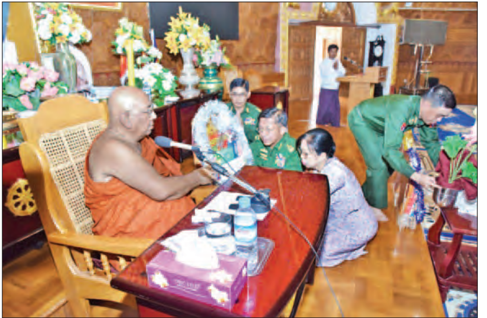
တပ်မတော်ကာကွယ်ရေးဦးစီးချုပ် ဗိုလ်ချုပ်မှူးကြီးမင်းအောင်လှိုင်နှင့် ဇနီး ဒေါ်ကြာကြာလှတို့ ဒုတိယရွှေကျင် သာသနာပိုင် သီတဂူကမ္ဘာ့ဗုဒ္ဓတက္ကသိုလ်များ၏ အဓိပတိ ဆရာတော် ဒေါက်တာအရှင်ဉာဏိဿရအား လှူဖွယ် ပစ္စည်းများ ဆက်ကပ်လှူဒါန်းစဉ်။ (မြဝတီ)