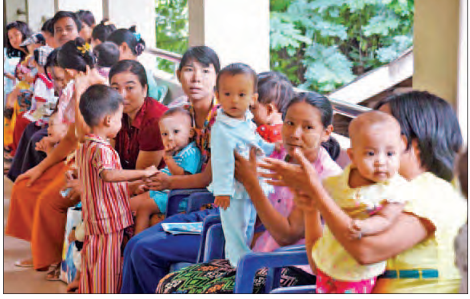
လေ့ကျင့်(မကွေး)