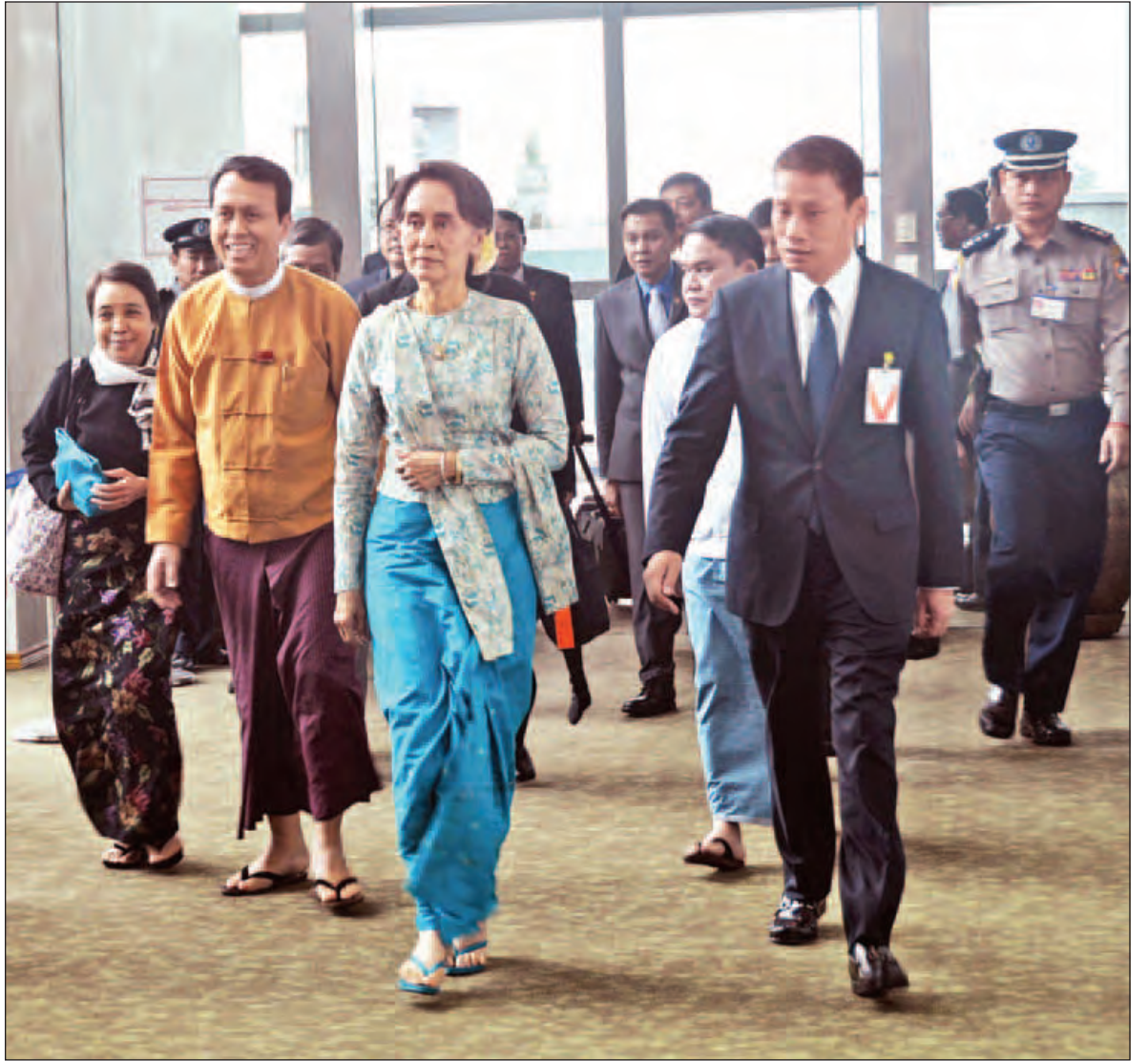
နိုင်ငံတော်၏အတိုင်ပင်ခံပုဂ္ဂိုလ် ဒေါ်အောင်ဆန်းစုကြည်အား ရန်ကုန်တိုင်းဒေသကြီး ဝန်ကြီးချုပ် ဦးဖြိုးမင်းသိန်း၊ တရုတ်သံရုံးမှ ကောင်စစ်ဝန် Mr. Chen Chen နှင့် တာဝန်ရှိသူများက ရန်ကုန်အပြည်ပြည်ဆိုင်ရာ လေဆိပ်၌ ကြိုဆိုနှုတ်ဆက်ကြစဉ်။ (သတင်းစဉ်)