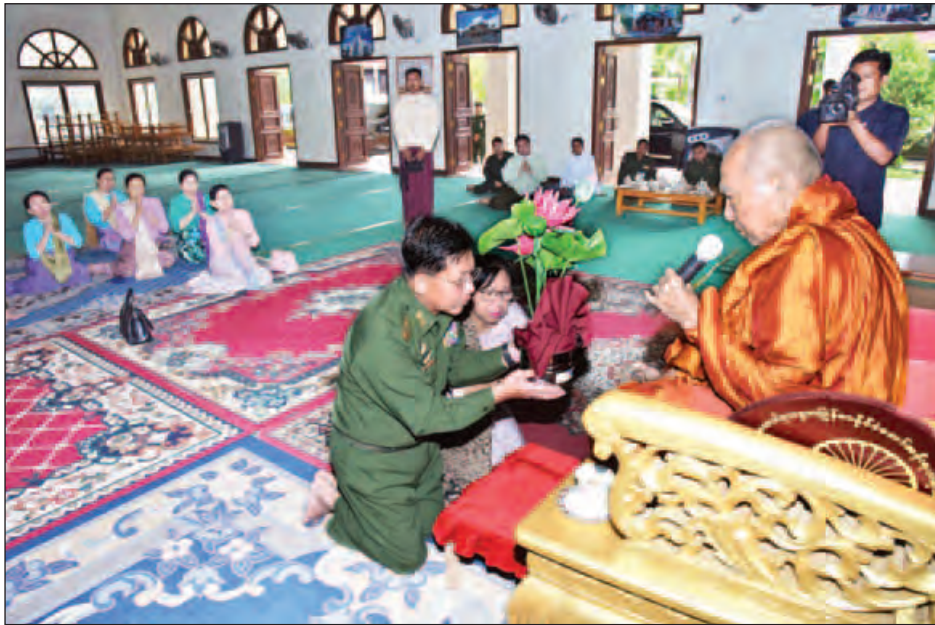
တပ်မတော်ကာကွယ်ရေးဦးစီးချုပ် ဗိုလ်ချုပ်မှူးကြီးမင်းအောင်လှိုင်နှင့် ဇနီး ဒေါ်ကြာကြာလှတို့ နိုင်ငံတော်သံသမဟာ နာယကအဖွဲ့ဥက္ကဋ္ဌ ဗန်းမော်ကျောင်းတိုက်ဆရာတော် ဒေါက်တာ ဘန္တု ကုမာရာဘိဝံသအား လှူဖွယ်ပစ္စည်းများ ဆက်ကပ်လှူဒါန်းစဉ်။ (မြဝတီ)