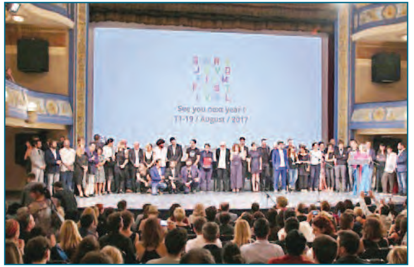
(၂၂)ကြိမ်မြောက် ဆာရာဇေးဗိုးရုပ်ရှင်ပွဲတော် ပိတ်ပွဲအခမ်းအနားမြင်ကွင်း။

ဘောစနီးယားဟာဇီဝီဗီးနားနိုင်ငံ ဆာရာဇေးဗိုးမြို့တော်တွင် ကျင်းပခဲ့သည့် အဆိုပါရုပ်ရှင်ပွဲတော်ကို ယမန်နေ့ ညပိုင်းက အဆုံးသတ်ခဲ့ပြီး ဆုချီးမြှင့်ပွဲ