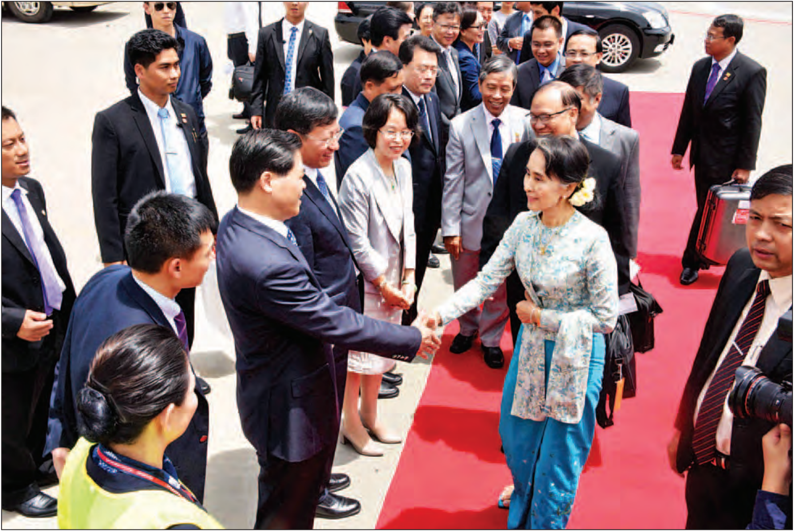
နိုင်ငံတော်၏အတိုင်ပင်ခံပုဂ္ဂိုလ် ဒေါ်အောင်ဆန်းစုကြည်အား ယူနန်ပြည်နယ် ကုမင်းမြို့ အပြည်ပြည်ဆိုင်ရာလေဆိပ်၌ တာဝန်ရှိသူများက ပို့ဆောင်နှုတ်ဆက်ကြစဉ်။ (သတင်းစဉ်)

တွေ့ဆုံစဉ် နှစ်နိုင်ငံဆက်ဆံရေး ပိုမိုတည်တံ့ခိုင်မြဲရေးနှင့် နှစ်နိုင်ငံပြည်သူများအကြား ပိုမိုရင်းနှီးစွာ ဆက်ဆံရေးအတွက် ပူးပေါင်းဆောင်ရွက်ရေး၊ နယ်စပ်ဒေသ တည်ငြိမ်အေးချမ်းရေး၊ တရားဥပဒေ စာမျက်နှာ ၃ ကော်လံ ၁ သို့