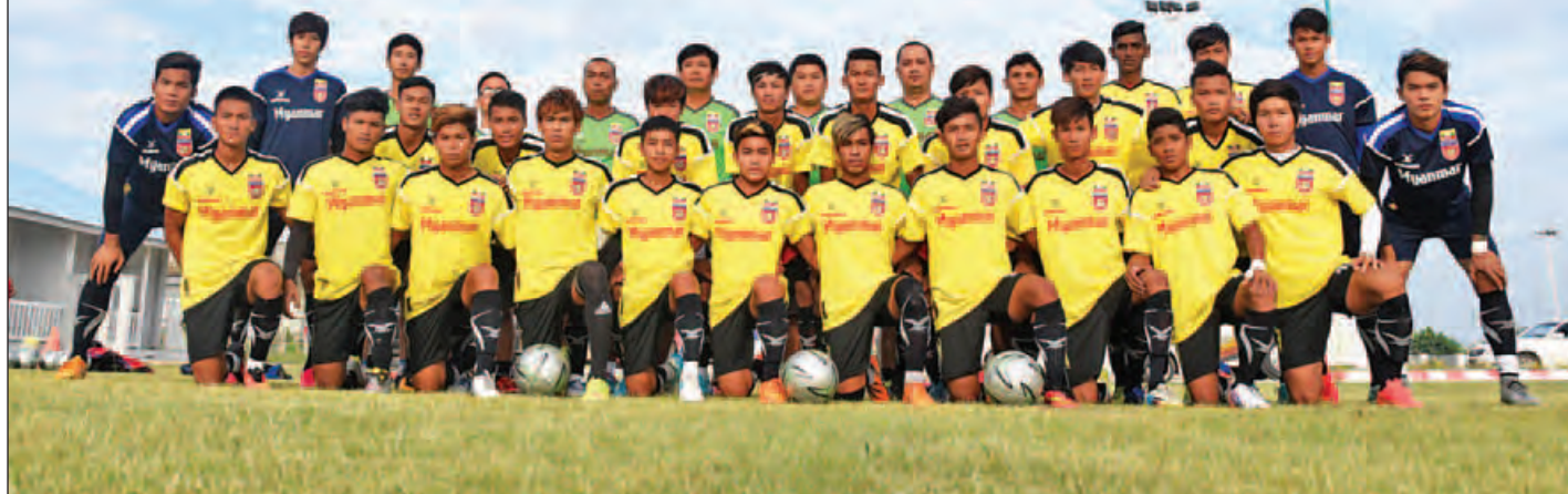
လေးနိုင်ငံဖိတ်ခေါ်ပြိုင်ပွဲယှဉ်ပြိုင်မည့် မြန်မာ ယူ-၁၉ အသင်းကို ဩဂုတ် ၂၁ ရက်က တွေ့ရစဉ်။

မန္တလေး ဩဂုတ် ၂၁ KBZ Bank U-19 Cup 2016 (လေးနိုင်ငံဖိတ်ခေါ်ပြိုင်ပွဲ) ကို မန္တလေးမြို့ရှိ မန္တလာသီရိကွင်း၌ ဩဂုတ် ၂၂ ရက်မှ စတင်ကျင်းပမည်ဖြစ်ပြီး အိမ်ရှင်မြန်မာအသင်းသည် ဂျပန်ဒုတိယတန်းကလပ် ဆာပေါ်ရီ ယူ-၁၈ အသင်းနှင့် စတင်ကစားရမည်ဖြစ်သည်။ အဆိုပါ ပြိုင်ပွဲကို အိမ်ရှင်မြန်မာ ယူ-၁၉ အသင်း အပါအဝင် ထိုင်း ယူ-၁၉ အသင်း၊ ဗီယက်နမ် ယူ-၁၉ အသင်းနှင့် ဂျပန်ဒုတိယတန်းကလပ် ဆာပေါ်ရီ ယူ-၁၈ အသင်းတို့ ယှဉ်ပြိုင်ကစားမည်ဖြစ်သည်။ အုပ်စုအဖွင့်ပွဲအဖြစ် ဩဂုတ် ၂၂ ရက် ညနေ ၃ နာရီတွင် ထိုင်း ယူ-၁၉ အသင်းနှင့် ဗီယက်နမ် ယူ-၁၉ အသင်း၊ ညနေ ၆ နာရီတွင် အိမ်ရှင်မြန်မာ ယူ-၁၉ အသင်းနှင့် ဆာပေါ်ရီ ယူ-၁၈ အသင်းတို့ ယှဉ်ပြိုင်ကစားမည်ဖြစ်သည်။ ပြိုင်ပွဲကို ပတ်လည်စနစ်ဖြင့် ကျင်းပမည်ဖြစ်ပြီး အမှတ်အများဆုံး နှစ်သင်းမှာ ဗိုလ်လုပွဲနှင့် အဆင့် ၃၊ ၄ အသင်းမှာ တတိယ နေရာလုပွဲ ယှဉ်ပြိုင်ကစားရမည်ဖြစ်သည်။ မြန်မာနိုင်ငံ ဘောလုံးအဖွဲ့ချုပ်သည် စာမျက်နှာ ၉ ကော်လံ ၁ သို့ ၀