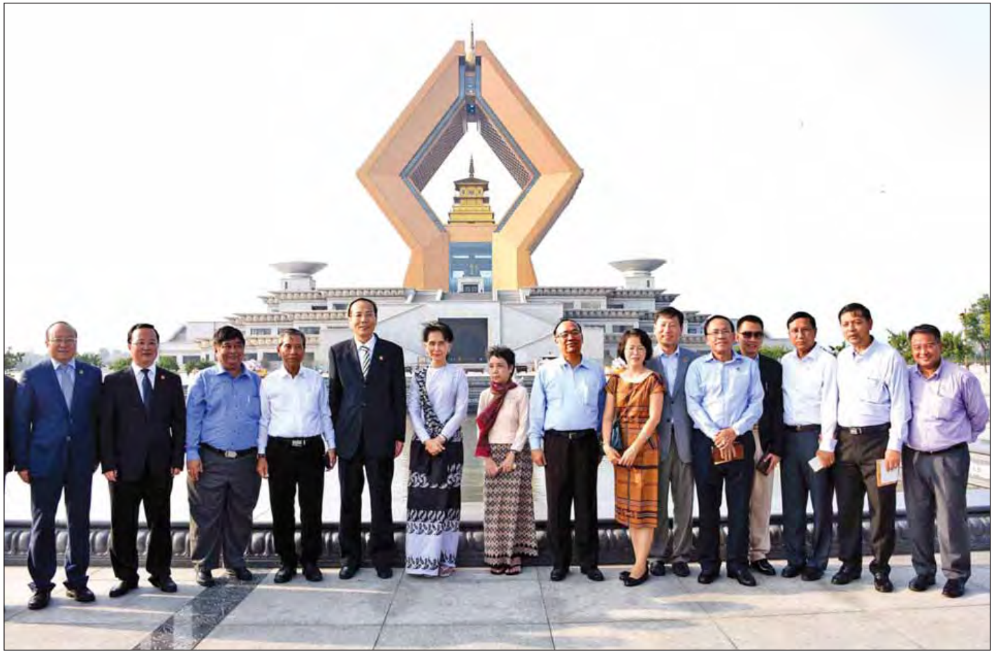
နိုင်ငံတော်၏အတိုင်ပင်ခံပုဂ္ဂိုလ် ဒေါ်အောင်ဆန်းစုကြည်နှင့်အဖွဲ့ ဖာမန်ကျောင်းတော်၌ မှတ်တမ်းတင်ဓာတ်ပုံရိုက်စဉ်။ (သတင်းစဉ်)

စိုက်ပျိုးရေးပြခန်းကို အပိုင်းငါးပိုင်းခွဲခြားထားပြီး ပိုးမွှားပြခန်း၊ သတ္တဗေဒပြခန်း၊ စိုက်ပျိုးရေးသမိုင်းပြခန်း၊ ရုက္ခဗေဒပြခန်းနှင့် မြေဆီမြေယွာနည်းပညာပြခန်းတို့ ဖြစ်သည်။ (သတင်းစဉ်)