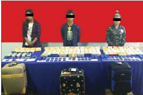
လဂေါင်၊ မဟာမန္တလေးနှင့် မဘောမ်နန်တို့သုံးဦးအား သိမ်းဆည်းရမိ မူးယစ်ဆေးဝါးများနှင့်အတူ တွေ့ရစဉ်။