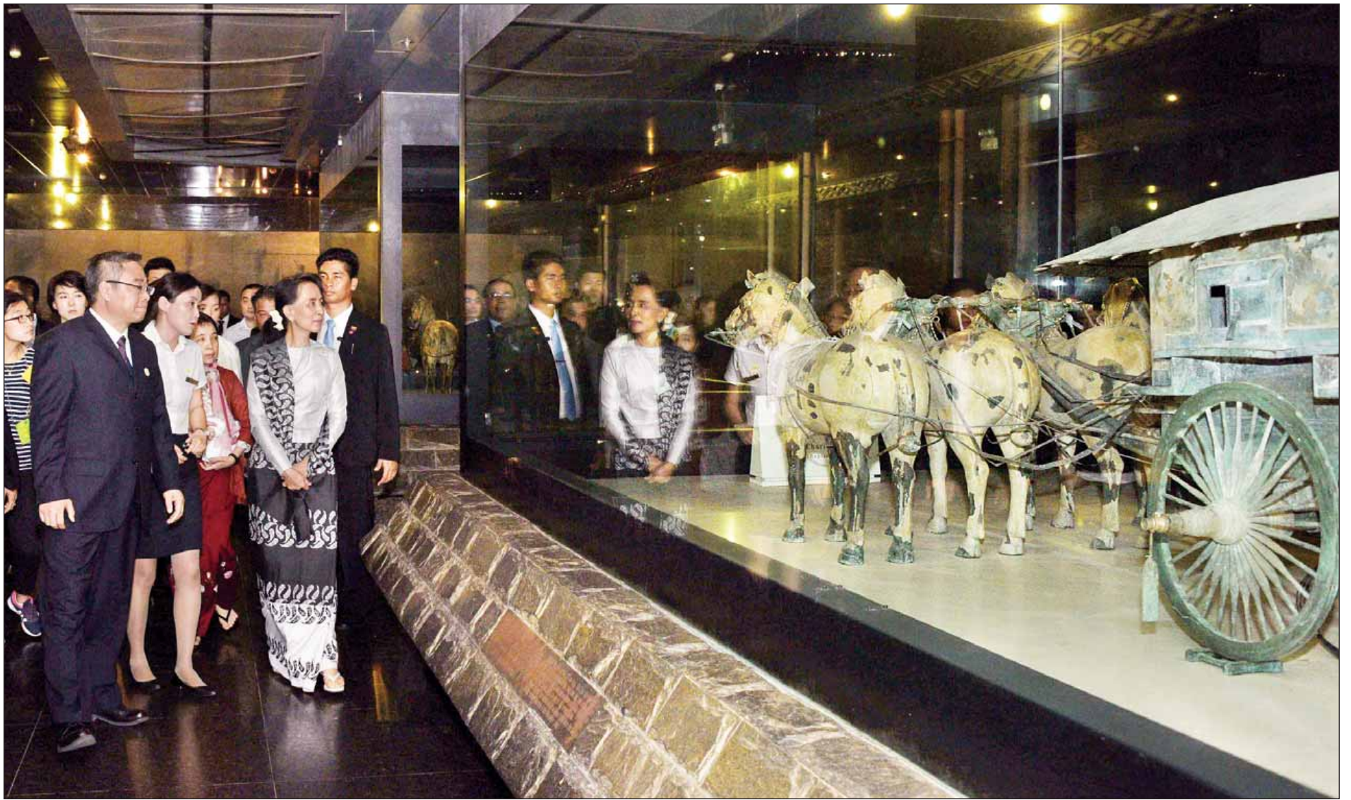
နိုင်ငံတော်၏အတိုင်ပင်ခံပုဂ္ဂိုလ် ဒေါ်အောင်ဆန်းစုကြည် ချင်ရှီယွမ်းရှင်ဘုရင် စစ်သည်တော်မြင်းရုပ်တုများမှ စစ်ရထားရုပ်တုကို ကြည့်ရှုလေ့လာစဉ်။ (သတင်းစဉ်)