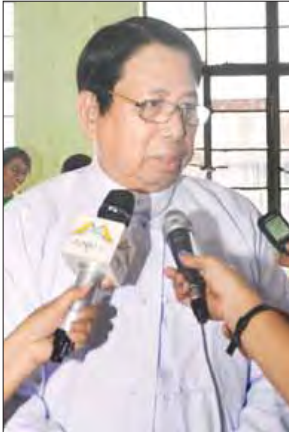
ခေါက်တာဖေမြင့်

စာပေသမား၊ အနုပညာသမား၊ သိပ္ပံပညာရှင်စတဲ့ ဘယ်သူမဆို မိမိဆောင်ရွက်တဲ့ ကိစ္စတွေအပေါ်မှာ အသိအမှတ်ပြုမှုတစ်ခုတော့ ခံယူချင်တဲ့သဘောရှိတယ်။ ဒါလူ့သဘာဝလည်း ဖြစ်တယ်။ ဒီလိုဆုတွေက ဂုဏ်သိက္ခာကြီးမားလေ ဆုအပေါ်မှာ တန်ဖိုးထားမှုက ကြီးလေလေ။ ဆုကို ရရှိသူတွေအတွက် ပိုပြီးတော့ ဂုဏ်ယူဝမ်းသာစရာ ကောင်းလေဖြစ်တယ်။ ဆုရပုဂ္ဂိုလ်တွေအနေနဲ့ မိမိရဲ့စာပေစွမ်းဆောင်မှုကြောင့် ရရှိခဲ့တာဖြစ်တယ်။ အထူးသဖြင့် လူငယ်လူရွယ်လူလတ်ပိုင်းတွေနဲ့ ပတ်သက်ပြီး ဆောင်ရွက်တဲ့စာပေလက်ရာကြောင့် ရရှိခဲ့တာဖြစ်တယ်။ နောက်နောင် ဒီထက်မက တောက်ပြောင်တဲ့စာပေလက်ရာတွေ ပြုစုနိုင်ကြမယ်၊ ကြိုးစားကြလိမ့်မယ်လို့ထင်တယ်။ ကြိုးစားကြလိမ့်မယ်လို့လည်း မျှော်လင့်တယ်။ ဒါတွေက ဂုဏ်ယူစရာ ဖြစ်ပါတယ်။