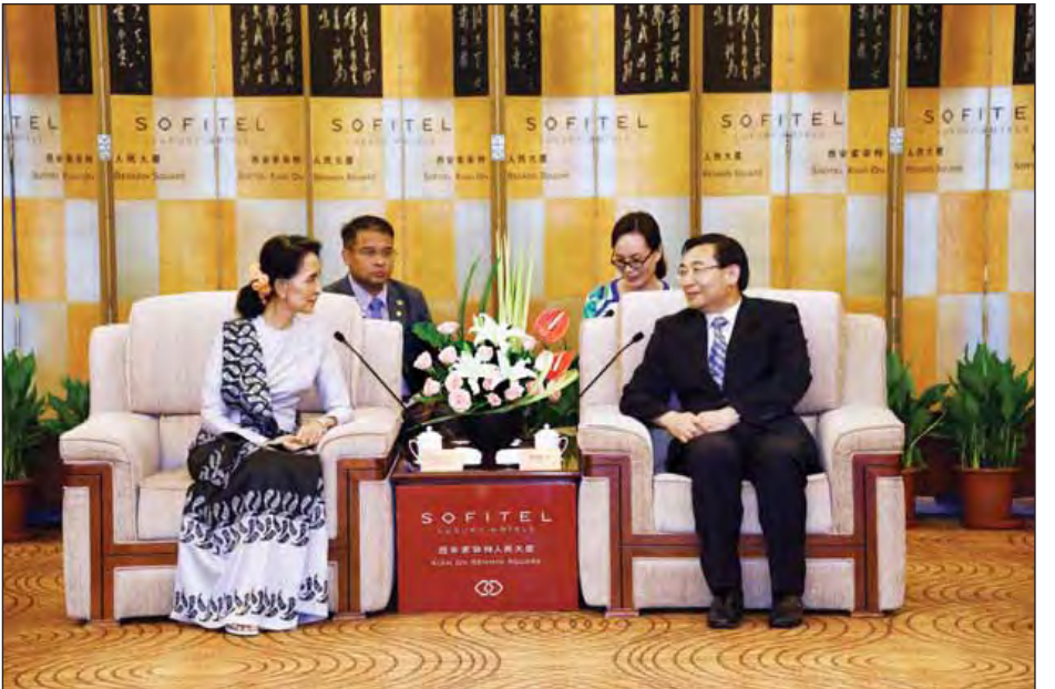
နိုင်ငံတော်၏အတိုင်ပင်ခံပုဂ္ဂိုလ် ဒေါ်အောင်ဆန်းစုကြည်နှင့် ရှန်ရှီပြည်နယ်အုပ်ချုပ်ရေးမှူး Mr. Hu Heping တို့ တွေ့ဆုံဆွေးနွေးစဉ်။ (သတင်းစဉ်)