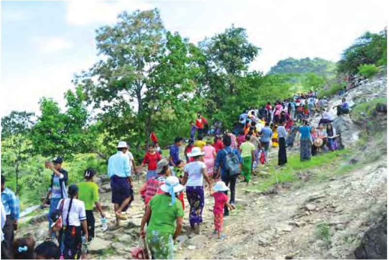
ရွှေမန်းသားဖိုးချစ်ဇာတ်အဖွဲ့ လာရောက် ကပြဖျော်ဖြေပြီး ဘုရားပွဲဈေးတန်းတွင် ဆိုင်ခန်းကြီး ဆိုင်ခန်းငယ်ပေါင်း ၁၂၀၀ ကျော်ခန့် စည်ကားသိုက်မြိုက်စွာ ခင်းကျင်းရောင်းချကြသည်။ ဘုရားပွဲတော်သို့ လာရောက်သူတိုင်း ဝါခေါင်လပြည့်တွင် စင်္ကြာတောင်တက်ပွဲကို