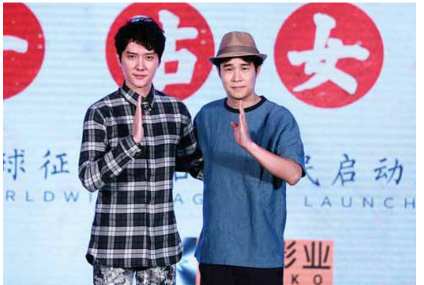
The Monkey King 3 ဇာတ်ကားသစ်တွင် အဓိကသရုပ်ဆောင်များအဖြစ် ပါဝင်သရုပ်ဆောင် သွားမည့် မင်းသား Feng Shaofeng နှင့် ပါကျဲအဖြစ်သရုပ်ဆောင်မည့် တရုတ်မင်းသား Shen He တို့အား တွေ့ရစဉ်။

ကလေးရော လူကြီးပါ ကြိုက်နှစ်သက်ကြသည့် The Monkey King ဇာတ်ကား၏ နောက်ဆက်တွဲ ဇာတ်ကားသစ်အဖြစ် The Monkey King 3 ကို နိုဝင်ဘာလတွင် စတင်ရိုက်ကူးကာ ၂၀၁၈ ခုနှစ်တွင် ပြသသွားမည်ဖြစ်ကြောင်း ယင်းဇာတ်ကား၏ ဒါရိုက်တာ Cheang Pou-soi ၏ တရုတ်မီဒီယာ တစ်ခုသို့ ပြောကြားချက် အရသိရသည်။ ဟောင်ကောင်-တရုတ် ပူးတွဲရိုက်ကူးမည့် ယင်းဇာတ်ကားသစ်တွင် တရုတ်နိုင်ငံ၏ ထိပ်တန်း သရုပ်ဆောင်တစ်ဦးဖြစ်သူ Feng Shaofeng နှင့် အတူ ယင်းဇာတ်ကား၏ အဓိကဇာတ်ဆောင်တစ်ဦး ဖြစ်သည့် ပါကျဲအဖြစ် တရုတ်မင်းသား Shen He က ပါဝင်သရုပ်ဆောင်သွားမည်ဖြစ်ပြီး အဓိက ဇာတ်ဆောင်မင်းသမီးနေရာတွင်လည်း နာမည်ကြီး တရုတ်မင်းသမီးတစ်ဦးကို အသုံးပြုသွားမည်ဖြစ် ကြောင်းသိရသည်။