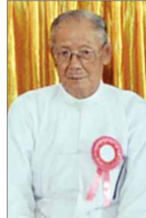
ဦးမောင်ကလေး

ပခုက္ကူစာပေဆု တစ်သက်တာ စာပေဆုရှင်ဆရာကြီး ဦးမောင်ကလေး (သောကြာဦးမောင်ကလေး) ဒီကနေ့ တစ်သက်တာ စာပေဆုရတယ်ဆိုတော့ ဝမ်းမြောက်ဂုဏ်ယူပါတယ်။ အဘက အသက်(၂၀)ကျော်ကတည်းက စာပေကိုလေ့လာဖတ်ရှုရေးသားလာခဲ့တာပါ။ အခု အဘအသက်က (၉၄) နှစ်ထဲရောက်တော့မယ်။ ဒီအချိန် ဒီအခါမှာ အဘတစ်သက်လုံး လုပ်ကိုင်လာခဲ့တဲ့ စာပေကို အခုလိုအသိအမှတ်ပြုခံရတာ အင်မတန်မှ ဝမ်းမြောက်ဂုဏ်ယူပါတယ်။ အားလုံးလိုက်နာကျင့်သုံးဖို့ ကောင်းတဲ့ စကားလေးသုံးခွန်းကို ပြောကြားလိုပါတယ်။ ကျန်းမာတုန်းကို ဆေးစားပါ။ ရှိတုန်းကိုချွေတာပါ။ အားတုန်းကို စာဖတ်ပါ။ အားလုံးလိုက်နာကျင့်သုံးဖို့ ကောင်းတဲ့အတွက် ပြောကြားလိုက်ပါတယ်။