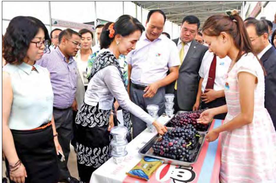
နိုင်ငံတော်၏အတိုင်ပင်ခံပုဂ္ဂိုလ် ဒေါ်အောင်ဆန်းစုကြည် Yang Ling Xin Cun ကျေးရွာ စိုက်ပျိုးရေးဇုန်မှ စိုက်ပျိုး ထုတ်လုပ်ထားသော စပျစ်သီးများကို ကြည့်ရှုလေ့လာစဉ်။ (သတင်းစဉ်)