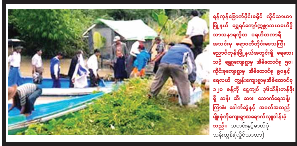
ရန်ကုန်မြောက်ပိုင်းခရိုင် လှိုင်သာယာမြို့နယ် ရွှေရင်ကျော်ဇွာသယံဇာတပရိယာဇာတိ အသင်းမှ ဧရာဝတီတိုင်းဒေသကြီး ညောင်တုန်းမြို့နယ်အတွင်းရှိ ရေဘေးသင့် ရွှေကျေးရွာမှ အိမ်ထောင်စု ၅၀၊ ကိုင်းစုကျေးရွာမှ အိမ်ထောင်စု ၉၀နှင့် ရေလယ် ကျွန်းကျေးရွာမှအိမ်ထောင်စု ၁၂၀ ခန့်ကို ငွေကျပ် ၃၆သိန်းတန်ဖိုးရှိ ဆန်၊ ဆီ၊ ဆား၊ သောက်ရေသန့်ကြော့၊ ခေါက်ဆွဲနှင့် အဝတ်အထည်မျိုးစုံကိုကျေးရွာအရောက်လှူဒါန်းခဲ့သည်။