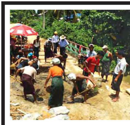
နေပြည်တော်ကောင်စီနယ်မြေ ဒက္ခိဏသီရိမြို့နယ်ထန်းတစ်ပင်၊အောင်သုခ၊ မဲဒီး၊ ချိုင်းကျေးရွာချင်းဆက်လမ်းပေါ်ရှိ ရွာခြားချောင်းပေါ်တွင် ၂၀၁၂ ခုနှစ်က တည်ဆောက်ပေးထားသည့် အရှည်ပေ၂၀၊ အကျယ် ၁၅ ပေရှိ သံပေါင်၊ သစ်သားခင်းတံတားသည် မိုးသည်းထန်စွာ ရွာသွန်းပြီး ချောင်းရေ တိုက်စားမှုကြောင့်ချဉ်းကပ် ဖြေများ ရေစီးဖြင့် မျောပါခဲ့သဖြင့် ဒေသခံများက ကိုယ့်အားကိုယ်ကိုး စုပေါင်းဖြေဖြင့် ကြောင်းသိရသည်။