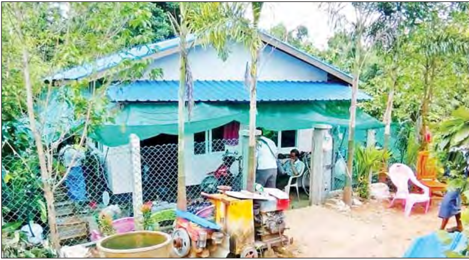
လူသတ်မှုဖြစ်ပွားခဲ့သည့် နေအိမ်ကို တွေ့ရစဉ်။