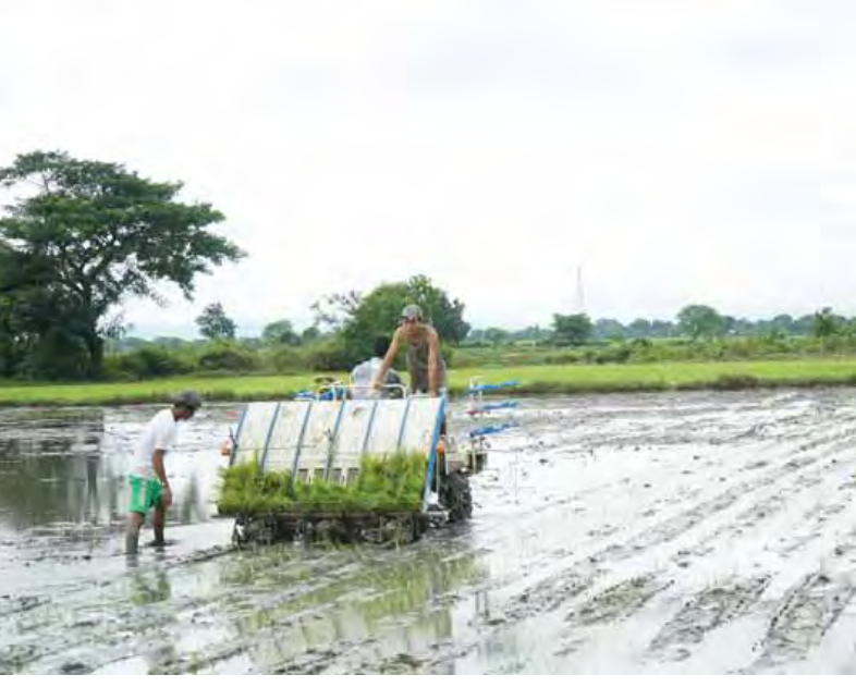
စော်စော်(မြို့သစ်)

မြို့သစ် ၊ ဩဂုတ် ၂၀ မကွေးခရိုင် မြို့သစ်မြို့ လယ်ပြင်ရပ်ကွက်တွင် နေထိုင်သော တောင်သူဦးဇော်ထွန်းလုပ်ကိုင်လျက်ရှိသည့် ကွင်းအမှတ် ၁၃၀၃ ဦးပိုင်အမှတ် ၅၁ ရှိ အကွက်တွင် လယ်ယာလုပ်သားရှားပါးမှုပြဿနာများ ဖြေရှင်းဆောင်ရွက်နိုင်စေရန်အတွက် မြို့နယ်စိုက်ပျိုးရေးဦးစီးဌာနနှင့် စက်မှုလယ်ယာဦးစီးဌာနတို့ ပူးပေါင်းကူညီမှုဖြင့် ကောက်စိုက်စက်ဖြင့် စပါးစိုက်ပျိုးခြင်းများကို ဩဂုတ် ၁၆ ရက် နံနက်ပိုင်းက အဆိုပါကွင်းအတွင်း ကျင်းပခဲ့သည်။ ထိုသို့ ပြုလုပ်ဆောင်ရွက်ရာတွင် စိုက်ပျိုးရေးဦးစီးဌာနမှ ဦးစီးမှူးနှင့် ဝန်ထမ်းများ၊ စက်မှုလယ်ယာမှ တာဝန်ရှိသူများက ကွင်းအတွင်းသို့ မနောသုဗျိုး ကွဲနှစ်မျိုးက အား ကူညီစိုက်ပျိုးမှုများ ပြုလုပ်ခဲ့ရာ စိတ်ပါဝင်စားသောတောင်သူများ၊ ဌာနဆိုင်ရာတာဝန်ရှိသူများ၊ ရပ်ကွက်/ကျေးရွာအုပ်ချုပ်ရေးမှူးများက စိတ်ဝင်စားကြည့်ရှုအားပေးခဲ့ကြပြီး အချို့သောတောင်သူများ၏ သိရှိလိုသော မေးမြန်းမှုများကိုလည်း စိုက်/ညီအဖွဲ့များက ရှင်းလင်းပြောကြားခဲ့ကြောင်း သိရသည်။