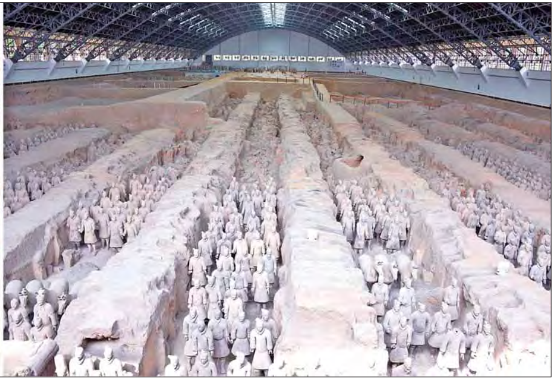
နိုင်ငံတော်၏အတိုင်ပင်ခံပုဂ္ဂိုလ် ဒေါ်အောင်ဆန်းစုကြည် ချင်ရှီယွမ်းရှင်ဘုရင် စစ်သည်တော်မြင်းရုပ်တုများကို ကြည့်ရှုလေ့လာစဉ်။ (သတင်းစဉ်)