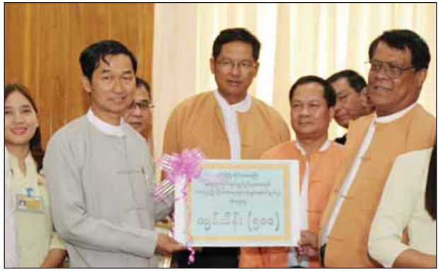
ဖြန့်ဝေလှူဒါန်းလျက်ရှိသည်။ ကမ္ဘောဇအနာဂတ်အလင်းတန်းမြန်မာဖောင်ဒေးရှင်း(BFM)သည် စတင်ဖွဲ့စည်းခဲ့သည့်အချိန်မှစ၍ ဘာသာရေး၊ ပညာရေး၊ ကျန်းမာရေး၊ လူမှုရေး၊ အားကစားနှင့် ဒေသဖွံ့ဖြိုးတိုးတက်ရေးနှင့် သဘာဝဘေးအန္တရာယ်အမျိုးမျိုး ကျရောက်ခဲ့သည့်နေရာများရှိ ပြည်သူများအတွက် စုစုပေါင်းကျပ်ငွေ ၁၀၇ ဘီလီယံကျော်ကို တိုင်းပြည်နှင့် ပြည်သူအကျိုးပြုလှူဒါန်းခဲ့ကြောင်း သိရသည်။ (၀၀၀)

ထို့ပြင် မိုးလေဝသပညာရှင်များက လာမည့်ဆောင်းရာသီတွင် လာနီညာ ရာသီဥတုဖြစ်ပေါ်ကာ အအေးလွန်နိုင်ကြောင်း သတင်းထုတ်ပြန်ချက်များအရ ယခုနှစ် ဆောင်းရာသီတွင် လာနီညာရာသီဥတု ဖြစ်ပေါ်လာပါက အအေးဒဏ်လွန်ကုန် ပိုမိုခံရနိုင်သည့် ဒေသများရှိ တိုက်ပွဲရှောင်စခန်းများမှ တိုင်းရင်းသားပြည်သူများအတွက် အအေးဒဏ်ကာကွယ်နိုင်ရန် အမေရိကန်ဒေါ်လာ နှစ်သိန်းကျော်တန်ဖိုးရှိ ခေါင်းစွပ်ပါအနွေးထည် တစ်သိန်းလေးသောင်းကို ဖောင်ဒေးရှင်း ဥက္ကဋ္ဌ၏ စီစဉ်ညွှန်ကြားမှုဖြင့် ဆောင်းရာသီအမီ ကြိုတင်ပို့ဆောင်လှူဒါန်းလျက်ရှိသည်။ ဖောင်ဒေးရှင်းသည် မြန်မာနိုင်ငံဒေသအချို့တွင် ရေကြီးရေလျှံမှုများ ဆက်တိုက်ဖြစ်ပေါ်မှုကြောင့် ရေဘေးဒုက္ခကြုံတွေ့နေသည့် ဒေသများရှိ ရေဘေးသင့်ပြည်သူများအတွက် ဆန်၊ သောက်သုံးရေသန့်နှင့် ထမင်းဘူးများကို အဆိုပါဒေသများရှိ ဒေသခံပြည်သူများနှင့် ကမ္ဘောဇဘဏ်လီမိတက်ဘဏ်ခွဲများမှ အရာထမ်း၊ ဝန်ထမ်းများ၊ ဖောင်ဒေးရှင်း အဖွဲ့ဝင်များ ပူးပေါင်းပြီး နေ့စဉ် ရေဝင်နှစ်မြုပ်နေသည့် ရပ်ကွက်၊ ကျေးရွာများထိ သွားရောက်၍ အဆက်မပြတ်