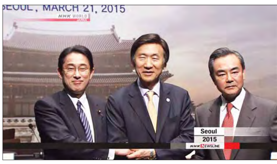
အချို့အစိုးရ အဖွဲ့ဝင်အရာရှိများက ထောက်ပြပြောဆိုကြသည်။ အဆိုပါနှစ်နိုင်ငံပူးတွဲစစ်ရေးလေ့ကျင့်မှုကို ပြုယမ်းက ဆန့်ကျင်သည်။ အမေရိကန်နိုင်ငံတွင် မြောက်ကိုရီးယား အား အတိုက်အခံ သဘောဆောင်သည့် မူဝါဒတစ်ရပ် လက်ကိုင်ထားကြောင်း ပြုယမ်းကဆိုသည်။ လာမည့်ရက်သတ္တပတ်တွင်ကျင်းပမည့် နိုင်ငံခြားရေး ဝန်ကြီးများအစည်းအဝေးတွင် ဒေသဆိုင်ရာကိစ္စရပ်များကို နိုင်ငံခြားရေးဝန်ကြီးများက ရင်းနှီးပွင့်လင်းစွာ ဆွေးနွေး နိုင်ဖွယ်ရှိကြောင်း မျှော်လင့်ရသည်ဟု ဂျပန်တာဝန်ရှိသူများ က ဆိုသည်။ ထို့ပြင် ယခုနှစ်နှောင်းပိုင်းတွင် ဂျပန်နိုင်ငံတွင် ကျင်းပမည့် သုံးနိုင်ငံထိပ်သီးအစည်းအဝေးတစ်ရပ် ကျင်းပ နိုင်ရေးအတွက်လည်း အလေးပေးဆွေးနွေးကြမည်ဖြစ် ကြောင်း သိရသည်။

တိုကျို ဩဂုတ် ၁၈ ဂျပန်နိုင်ငံ တိုကျိုမြို့၌ ဂျပန်၊ တရုတ်နှင့် တောင်ကိုရီးယား နိုင်ငံခြားရေးဝန်ကြီးများ အစည်းအဝေးတစ်ရပ် လာမည့် ရက်သတ္တပတ်အတွင်း ကျင်းပနိုင်ရန် ဂျပန်နိုင်ငံခြားရေး ဝန်ကြီးဌာန တာဝန်ရှိသူများက စီစဉ်လျက်ရှိကြောင်း အင်န်အိတ်ချီကေ သတင်းတစ်ရပ်အရ သိရသည်။