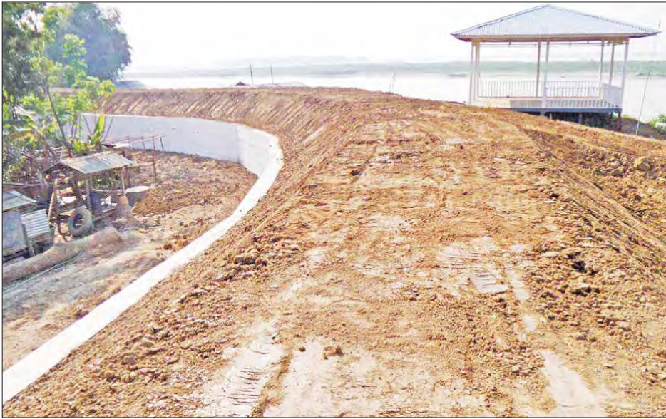
အပျောက်မြို့ ကမ်းနားတာကွန်ကရစ်မြေထိန်းနံရံတည်ဆောက်ခြင်းလုပ်ငန်း ဆောင်ရွက်ပြီးသည့်အပိုင်းကို တွေ့ရစဉ်။

ရောဂါဖြစ် အရွေ့ဘက်ကမ်းရှိ ဇလွန်မြို့နယ် ချောင်းကြီးကျေးရွာမှ ဓနုဖြူမြို့နယ် သံပရာကုန်းကျေးရွာ အထိ မြစ်ရေကြီးမြင့်မှုအန္တရာယ်မှ ကာကွယ်ရန်အတွက် တည်ဆောက်ထားသည့် အရှည် ၇ ဒသမ ၂၅ မိုင်ရှိ ရေဘေးကာကွယ်ရေးတာ (အပျောက်) ကို အကြီးစားပြုပြင်မွမ်းမံမှုများ ပြုလုပ်ရန်လိုအပ်နေကြောင်း ရန်ကုန်တိုင်းဒေသကြီး ဆည်မြောင်းနှင့် ရေအသုံးချမှု စီမံခန့်ခွဲရေးဦးစီးဌာနမှ သိရသည်။