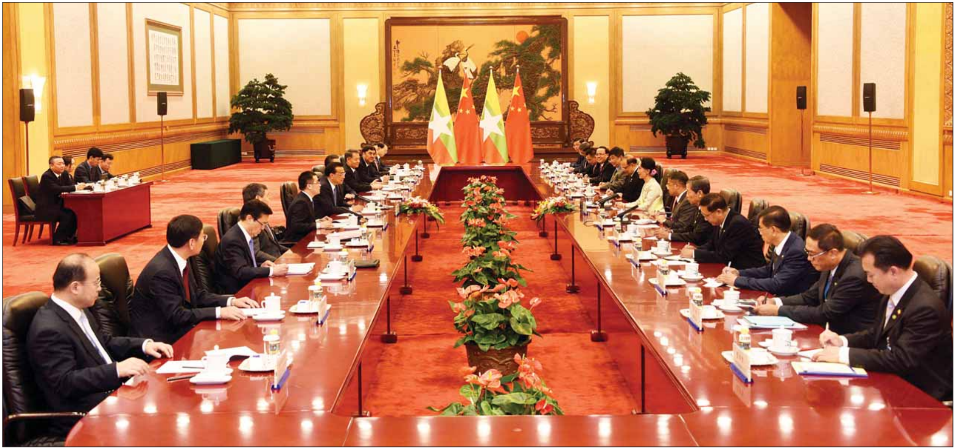
မြန်မာ-တရုတ် နှစ်နိုင်ငံဆွေးနွေးပွဲ ကျင်းပစဉ်။ (သတင်းစဉ်)