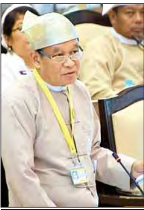
ဒေါက်တာမြင့်ထွေး

ဟိုပုံးမြို့နယ် မိုင်းပျဉ်းဒေသတွင် တိုက်နယ်ဆေးရုံတစ်ရုံ ဖွင့်လှစ်ရန် ဖွဲ့စည်းပုံခွင့်ပြုမိန့်ရရှိရေးအတွက် ၂၀၁၆-၂၀၁၇ ဘဏ္ဍာရေးနှစ်တွင် လည်းကောင်း၊ ဆေးရုံအဆောက်အအုံ ဆောက်လုပ်ရန်အတွက် ၂၀၁၇-၂၀၁၈ ဘဏ္ဍာရေးနှစ်တွင်လည်း ကောင်း ဆောင်ရွက်ပေးသွားမည်ဖြစ် ကြောင်းနှင့် အဆိုပါတိုက်နယ်ဆေးရုံ တည်ဆောက်ဖွင့်လှစ်နိုင် ရေးကို အမြန်ဆုံး ဆောင်ရွက်ပေးသွားမည် ဖြစ်ကြောင်း ကျန်းမာရေးနှင့် အားကစားဝန်ကြီးဌာန ပြည်ထောင်စု ဝန်ကြီး ဒေါက်တာမြင့်ထွေးက ပြောကြားသည်။