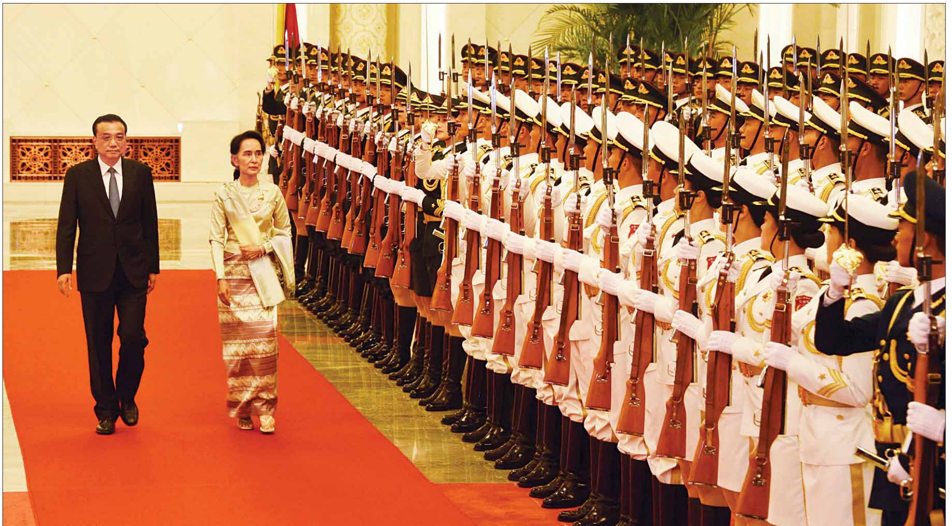
နိုင်ငံတော်၏အတိုင်ပင်ခံပုဂ္ဂိုလ် ဒေါ်အောင်ဆန်းစုကြည်နှင့် တရုတ်နိုင်ငံ နိုင်ငံတော်ကောင်စီဝန်ကြီးချုပ် မစ္စတာ လီခချန်းတို့ ဂုဏ်ပြုတပ်ဖွဲ့ကို စစ်ဆေးကြစဉ်။ (သတင်းစဉ်)