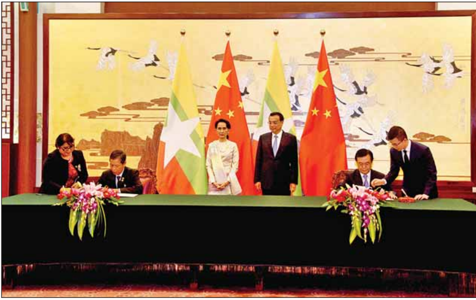
ပြည်ထောင်စုသမ္မတမြန်မာနိုင်ငံတော်အစိုးရနှင့် တရုတ်ပြည်သူ့သမ္မတနိုင်ငံ အစိုးရတို့အကြား ချုပ်ဆိုသော စီးပွားရေးနှင့် နည်းပညာ ပူးပေါင်းဆောင်ရွက်ရေး သဘောတူစာချုပ်ကို စီမံကိန်းနှင့် ဘဏ္ဍာရေးဝန်ကြီးဌာန ပြည်ထောင်စုဝန်ကြီး ဦးကျော်ဝင်းနှင့် တရုတ်နိုင်ငံ စီးပွားရေးနှင့် ကူးသန်းရောင်းဝယ်ရေးဝန်ကြီး Mr. Gao Hucheng တို့ လက်မှတ်ရေးထိုးကြစဉ်။ (သတင်းစဉ်)