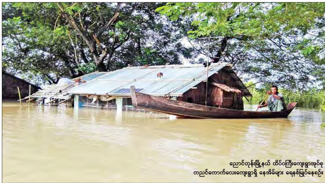
ညောင်တုန်းမြို့နယ် ထိပ်ဝကြီးကျေးရွာအုပ်စု ကညင်ကောက်လေးကျေးရွာရှိ နေအိမ်များ ရေနစ်မြုပ်နေစဉ်။