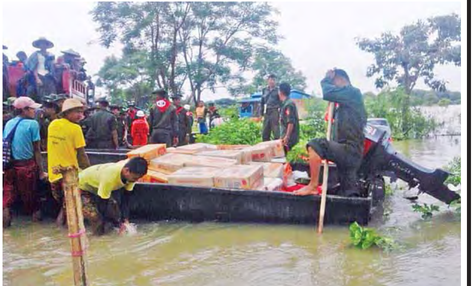
တပ်မတော်သားများ ရေဘေးသင့်ပြည်သူများအား လှေဖြင့် ကူညီရွှေ့ပြောင်းပေးနေစဉ်။ (မသစ/ရသစ)