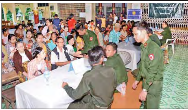
ရန်ကုန်တိုင်းစစ်ဌာနချုပ်မှ တပ်မတော်သားများ ရေဘေးသင့် ပြည်သူများအား ဆေးကုသမှုဆောင်ရွက်ပေးနေစဉ်။ (ရသစ)