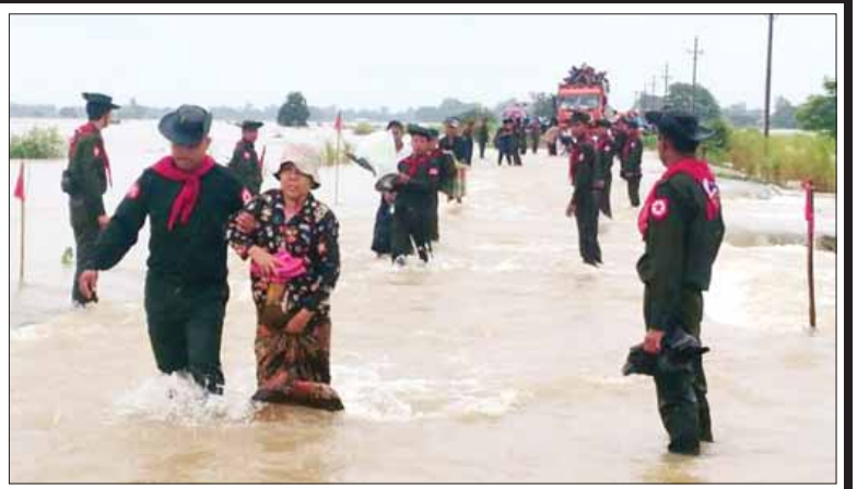
ဥတု-အဖျောက် ကားလမ်းရေကျော်စဉ် တပ်မတော်သားများက ခရီးသွားပြည်သူများအား ကူညီဆောင်ရွက်ပေးစဉ်။