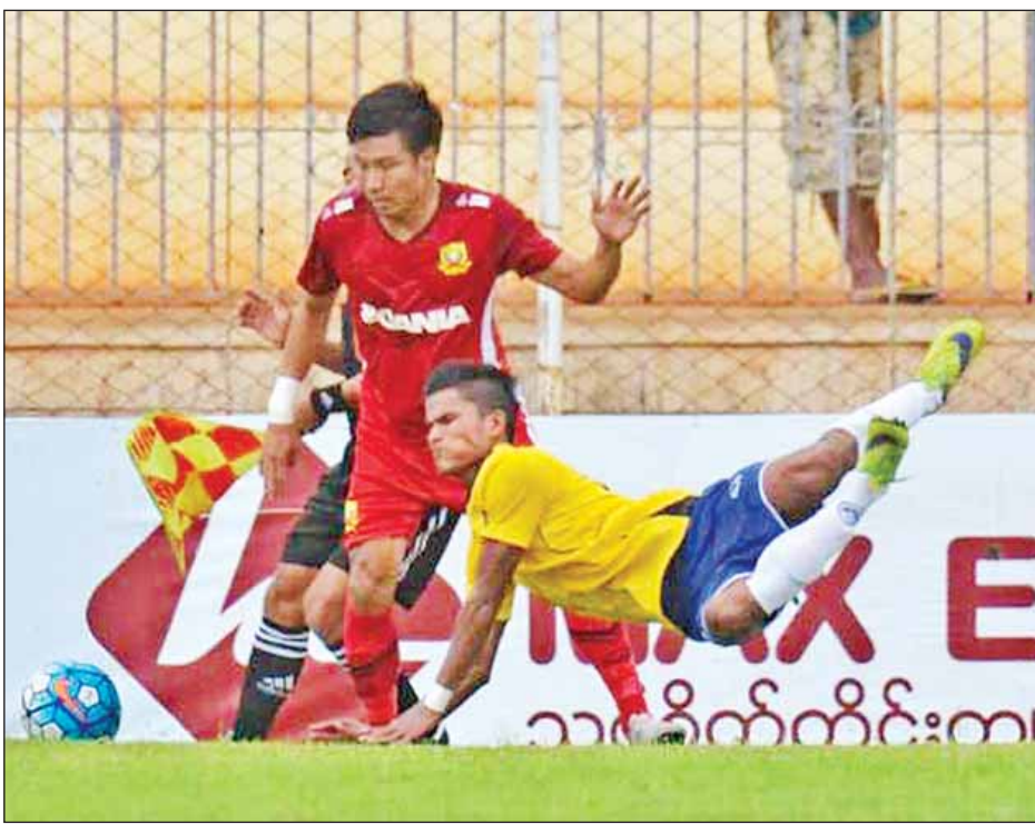
ရှမ်းယူနိုက်တက်နှင့် မကွေးအသင်းယှဉ်ပြိုင်နေစဉ်။

ရှမ်းယူနိုက်တက်အသင်းသည် အိမ်ကွင်း၌ နိုင်ပွဲရယူနိုင်ရန် အတောင့်တင်းဆုံး လူစာရင်းဖြင့် ပွဲထွက်ခဲ့သလို မကွေးအသင်းမှာ နှုံး/ ထွက် ဝိုင်းလှပွဲ ကစားရန်ရှိသော်လည်း စာမျက်နှာ ၁၁ ကော်လံ ၁ သို့ ○