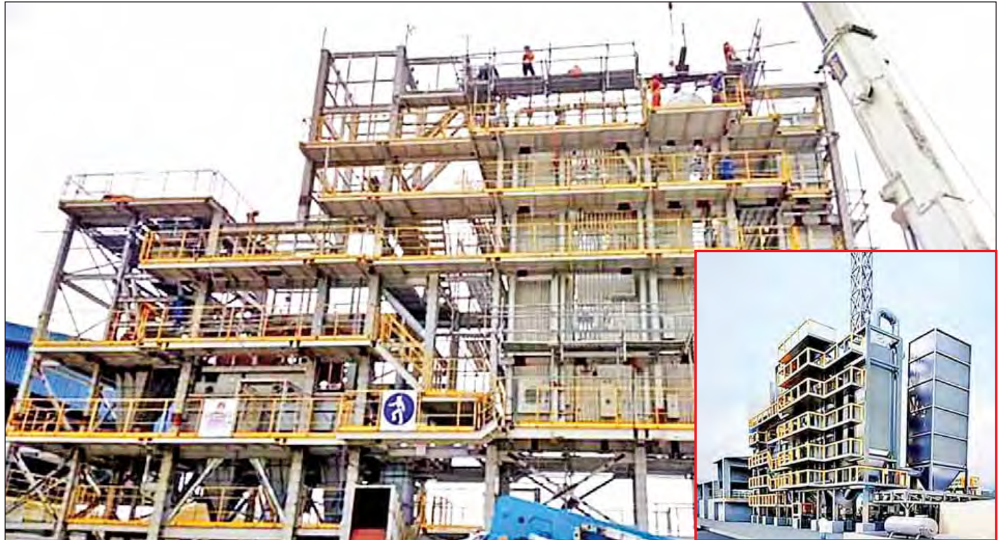
တစ်ရက်လျှင်အမှိုက်တန် ၆၀ မီးရှို့နိုင်သည့် အမှိုက်မှစွမ်းအင်ထုတ်စက်ရုံ တည်ဆောက်နေမှုနှင့် ပုံစံငယ်ကို တွေ့ရစဉ်။

“ဒီစက်ရုံကို စတင်ပုံနှိုက်ရိုက်ခဲ့တာက ၂၀၁၅ အောက်တိုဘာ ၁၅ ရက်ကပါ။ စီမံကိန်းကာလ နှစ်နှစ် ဖြစ်ပါတယ်။ ဒီနှစ်အကုန်မှာ အကြမ်းထည်ပြီးမယ်။ နှစ်ဆန်းပိုင်းမှာ စမ်းသပ်လည်ပတ်မယ်။ ၂၀၁၇ ဧပြီ ၁ ရက်နေ့မှာ စတင်လည်ပတ်ဖို့ ဆောင်ရွက်နေပါတယ်။ စက်ရုံအနေနဲ့ တစ်ရက်ကို အမှိုက်တန် ၆၀မီးရှို့နိုင်ပါတယ်။ လျှပ်စစ်ဓာတ်အား စာမျက်နှာ ၁၁ ကော်လံ ၁ သို့ *