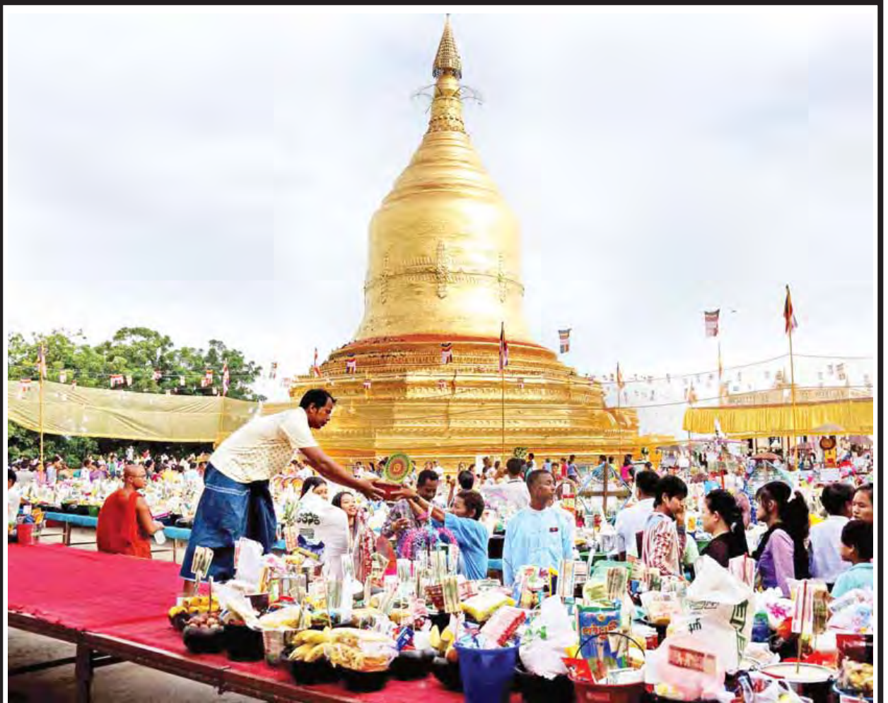
ပုဂံရှေးဟောင်းယဉ်ကျေးမှုနယ်မြေရှိ လောကနန္ဒာစွယ်တော်မြတ်ဘုရား ဗုဒ္ဓပူဇော်ယဉ်ကျေးမှုတော်ကို ဝါခေါင်လဆန်း ၈ ရက်တွင် စည်ကားသိုက်မြိုက်စွာ ကျင်းပခဲ့ရာ ဘုရားကြီးရင်ပြင်တော်၌ ဆွမ်းသပိတ်လုံးများ ဆက်ကပ်လှူဒါန်းမှုကို တွေ့ရစဉ်။