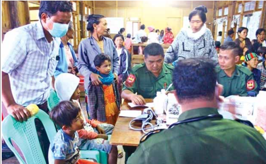
တပ်မတော်သားများ တီးတိန်မြို့၌ ဆေးကုသမှုဆောင်ရွက်ပေးနေစဉ်။ (မသစ/ရသစ)