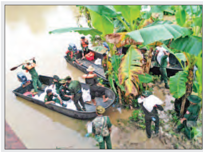
အနောက်တောင်တိုင်းစစ်ဌာနချုပ်မှ တပ်မတော်သားများ ပြည်သူ့အကျိုးပြုလုပ်ငန်းများဆောင်ရွက်ပေးနေစဉ်။(မသစ)