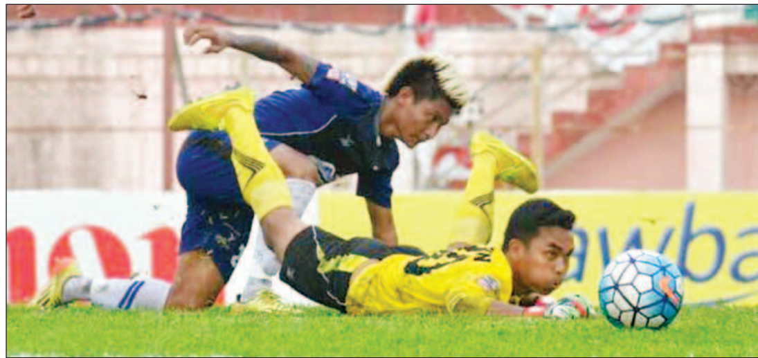
ရတနာပုံအသင်းနှင့် ဟံသာဝတီအသင်းတို့ ယှဉ်ပြိုင်နေစဉ်။