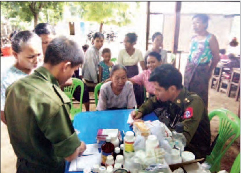
အနောက်မြောက်တိုင်းစစ်ဌာနချုပ်မှ တပ်မတော်သားများ ရေဘေးသင့်ပြည်သူများအား ကျန်းမာရေးစောင့်ရှောက်မှု ဆောင်ရွက်ပေးနေစဉ်။ (မသစ)

ဧရာဝတီတိုင်းဒေသကြီးအတွင်း ၁၉ မြို့နယ်တွင် ရေကြီးရေလျှံမှုများ ဖြစ်ပေါ်ခဲ့ပြီး အိမ်ထောင်စု ၁၂၀၀၀၀ ကျော် ရေဘေးသင့်ခဲ့သည်။ ရေဘေးသင့်ပြည်သူများအား ကယ်ဆယ်ရေးစခန်း ၆၈၀ ကျော်ဖွင့်လှစ်၍ နိုင်ငံတော်အစိုးရတိုင်းဒေသကြီးအစိုးရ၊ အရပ်ဘက်လူမှုအဖွဲ့အစည်းများ၊ စေတနာရှင်များ၊ ဌာနဆိုင်ရာအဖွဲ့အစည်းများ၊ တပ်မတော်သားများ၊ မြန်မာနိုင်ငံရဲတပ်ဖွဲ့ဝင်များ၊ ကြက်ခြေနီနှင့် မီးသတ်တပ်ဖွဲ့ဝင်များပူးပေါင်း၍ ကူညီကယ်ဆယ်ထောက်ပံ့မှုများ ပြုလုပ်ပေးလျက်ရှိကြောင်း သိရသည်။ (သတင်းစဉ်)