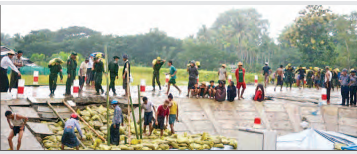
ရန်ကုန်တိုင်းစစ်ဌာနချုပ်မှ တပ်မတော်သားများ ရေဘေးကာကွယ်ရေးအတွက် တာဖျိုခြင်းလုပ်ငန်းများ ဆောင်ရွက်ပေးနေစဉ်။ (မသစ)