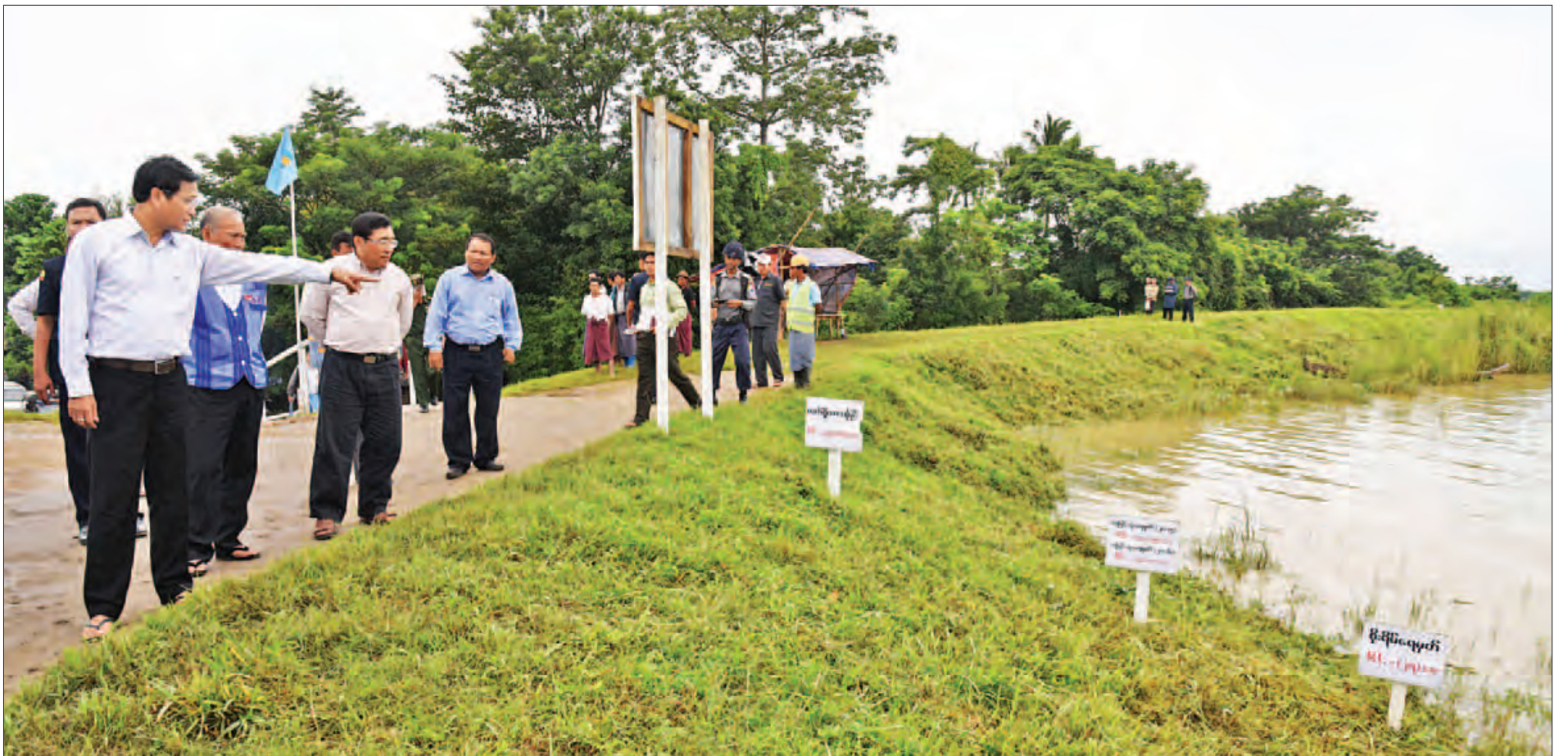
ဧရာဝတီတိုင်းဒေသကြီး ငါးသိုင်းချောင်းမြို့ ရေကင်းစခန်းအမှတ်(၂) ဗောဓိကုန်းတာ ကြံ့ခိုင်မှုအခြေအနေကို ဒုတိယသမ္မတ ဦးဟင်နရီဗန်ထီးယူ ကြည့်ရှုစစ်ဆေးစဉ်။ (သတင်းစဉ်)