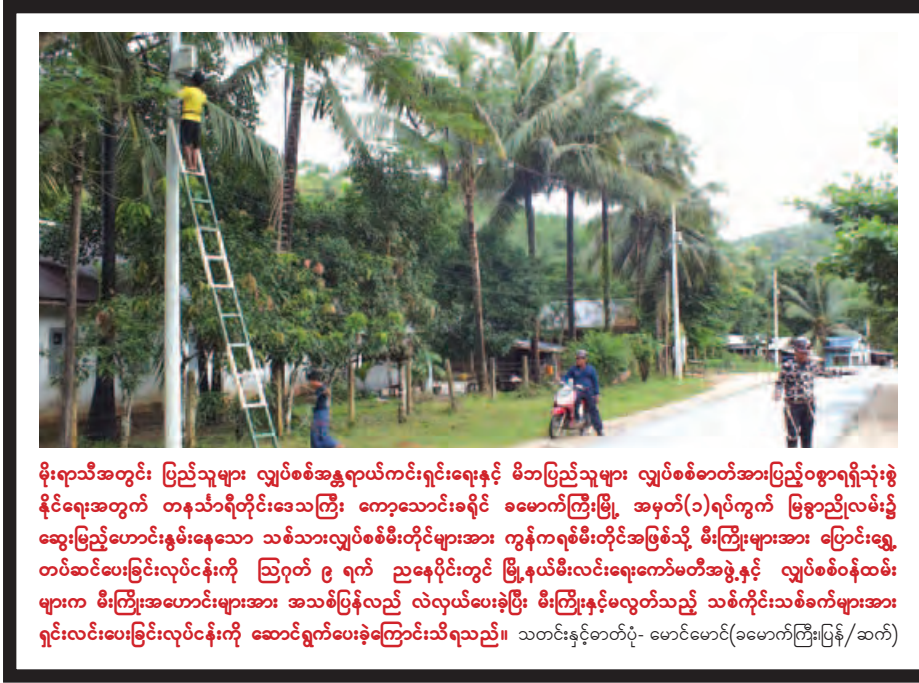
မိုးရာသီအတွင်း ပြည်သူများ လျှပ်စစ်အန္တရာယ်ကင်းရှင်းရေးနှင့် မိဘပြည်သူများ လျှပ်စစ်ဓာတ်အားပြည့်ဝစွာရရှိသုံးစွဲ နိုင်ရေးအတွက် တနင်္သာရီတိုင်းဒေသကြီး ကော့သောင်းခရိုင် ခမောက်ကြီးမြို့ အမှတ်(၁)ရပ်ကွက် မြေဧည့်လမ်း၌ ဆွေးနွေးပြောဆိုလမ်းဆွဲသော သစ်သားလျှပ်စစ်မီးတိုင်များအား ကွန်ကရစ်မီးတိုင်အဖြစ်သို့ မီးကြိုများအား ပြောင်းရွှေ့ တပ်ဆင်ပေးခြင်းလုပ်ငန်းကို ဩဂုတ် ၉ ရက် ညနေပိုင်းတွင် မြို့နယ်မီးလင်းရေးကော်မတီအဖွဲ့နှင့် လျှပ်စစ်ဝန်ထမ်း များက မီးကြိုအဟောင်းများအား အသစ်ပြန်လည် လဲလှယ်ပေးခဲ့ပြီး မီးကြိုနှင့်မလွတ်သည့် သစ်ကိုင်းသစ်ခက်များအား ရှင်းလင်းပေးခြင်းလုပ်ငန်းကို ဆောင်ရွက်ပေးခဲ့ကြောင်းသိရသည်။