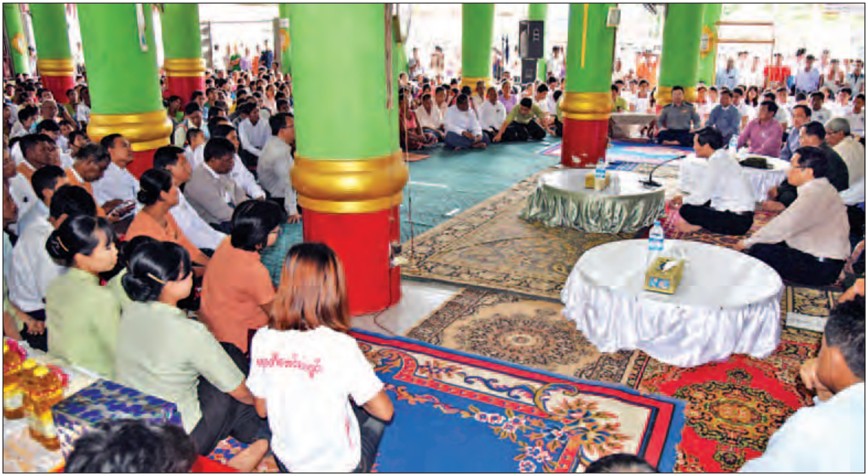
ဒုတိယသမ္မတ ဦးဟင်နုရီပန်ထီးယူ ဓနုဖြူမြို့ ကျိုက္ကလွန်ပွန်းစေတီတော်ဓမ္မာရုံ၌ ရေဘေးသင့်ပြည်သူများအား တွေ့ဆုံအားပေးစကားပြောကြားစဉ်။ (သတင်းစဉ်)

ယင်းနောက် ညောင်တုန်းမြို့ တာကြံခိုင်ရေးပြုပြင်ဆောင်ရွက်နေမှုကို ကြည့်ရှုစစ်ဆေးပြီး တိုက်သစ်ဘုန်းကြီးကျောင်း ကယ်ဆယ်ရေးစခန်း၌ ညောင်တုန်းမြို့နယ် ရေဘေးသင့်ပြည်သူများနှင့် တွေ့ဆုံ၍ ဆန်အိတ် ၁၇၀ နှင့် ငွေကျပ်