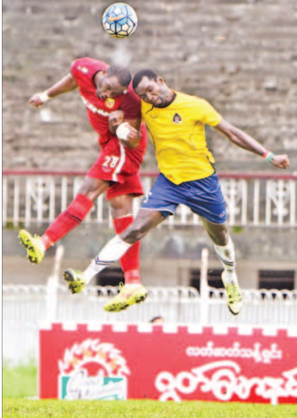
မကွေးနှင့် ရှမ်းယူနိုက်တက်အသင်း ရှမ်းထွက် ပြိုင်ပွဲ၌ တွေ့ဆုံခဲ့စဉ်။

ပြိုင်ပွဲဝင်အသင်းများအနက် ရန်ကုန်နှင့် ဇေယျာရွှေမြေအသင်းသည် ၁၉ပွဲသာ ကစားရသေးပြီး ယင်းနှစ်သင်းထိပ်တိုက်တွေ့သောပွဲမှာ ရာသီဥတုကြောင့် ရွှေ့ဆိုင်းခဲ့ရသည်။ ဒုတိယနေရာအတွက် အပြိုင်ဖြစ်နေသည့် မကွေး၊ ရန်ကုန်နှင့် ဇေယျာရွှေမြေအသင်းတို့သည် ယခုတစ်ပတ်တွင် ပွဲကျပ်များကစားရမည်ဖြစ်ပြီး ရှမ်းထွက် ပိုလ်လပွဲကစားရမည့် ရန်ကုန်နှင့် မကွေးအသင်းတို့ အနေဖြင့် မည်သည့်ပြိုင်ပွဲကို အာရုံစိုက်မလဲဆိုတာ စောင့်ကြည့်ရမည်ဖြစ်သည်။