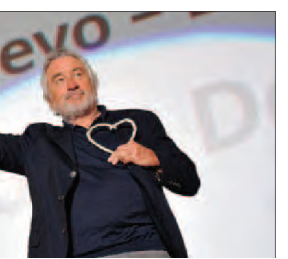
ဆရာကျေးဇူး ရုပ်ရှင်ပွဲတော်တွင် အော်စကာဆုရှင် Robert De Niro အား Heart of Sarajevo ဆုလက်ခံရယူအပြီး တွေ့ရစဉ်။

ဥရောပအရှေ့တောင်ပိုင်း၏ အထင်ကရရုပ်ရှင်ပွဲတော်တစ်ခုဖြစ်သည့် ယင်းပွဲတော်ကို ဩဂုတ် ၁၂ ရက် ညပိုင်းက ဆရာကျေးဇူးမြို့ရှိ National Theater တွင်ကျင်းပခဲ့ရာ အဆိုပါအခမ်းအနားတွင် နှစ်ထပ်ကွမ်း အော်စကာဆုရှင် Robert De Niro အား တစ်သက်တာအကောင်းဆုံးဆု Heart of Sarajevo ဆုကို ဂုဏ်ပြုချီးမြှင့်ခဲ့ကြောင်း သိရသည်။