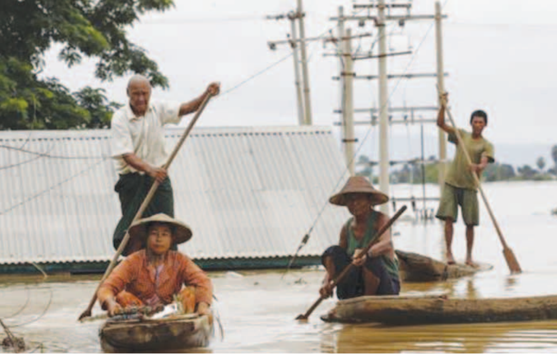
သစ်တောသစ်စုစုစု သဲနှင့်နုန်းမြေများ အထူးကြီးလေးစွာ သယ်ဆောင်သွားကြရသည်။ ထိုအခါ မြစ်ကမ်းပေါ်ရေလျှံတက်ရန်

သစ်တောပြုန်းတီးခြင်းကြောင့် ရေဝေရလွှဲဒေသများ၊ ရေစီးရာတစ်လျှောက် ကုန်းမြေများတွင် ရေကိုစုတ်ယူ ထိန်းသိမ်းမည့် သစ်တောများပြုန်းတီးခြင်းကြောင့်၊ ကုန်းမြေကို ရေတိုက်စားမှု အထူးများသောကြောင့် မြစ်ချောင်းများတွင် စီးနေသောရေတွင်