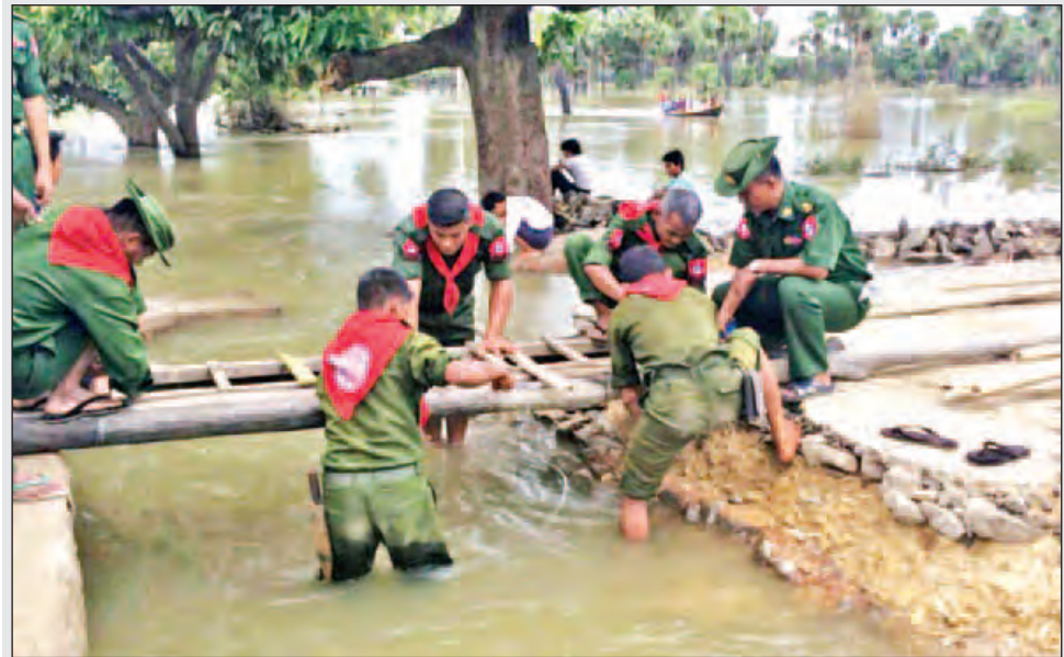
အလယ်ပိုင်းတိုင်းစစ်ဌာနချုပ်မှ တပ်မတော်သားများ ရေဘေးပြန်လည်ထူထောင်ရေးအတွက် ပြည်သူ့အကျိုးပြုလုပ်ငန်းများ ဆောင်ရွက်ပေးနေစဉ်။ (မသစ)