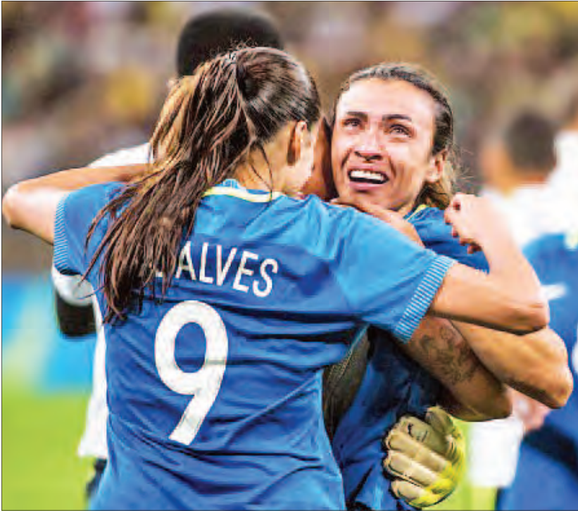
လေးဝိုး-သုံးဝိုးဖြင့် အနိုင်ရရှိခဲ့ခြင်းဖြစ်သည်။ ၂၀၁၆ ရီယိုအိုလံပစ်ပြိုင်ပွဲ အမျိုးသမီး ဘောလုံးပြိုင်ပွဲ၏ အခြားသောဆီမီးဖိုင်နယ်ပွဲစဉ်အဖြစ် ကနေဒါအမျိုးသမီးအသင်းနှင့် ဂျာမနီအမျိုးသမီးအသင်းတို့ ယှဉ်ပြိုင်ကစားရမည်ဖြစ်သည်။ (ငွေကြယ်)

ဆွီဒင်အမျိုးသမီးအသင်းသည် ကွာတားဖိုင်နယ်အဆင့်တွင် အမေရိကန်အမျိုးသမီးအသင်းနှင့် ယှဉ်ပြိုင်ကစားခဲ့ပြီး ယင်းပွဲစဉ်တွင် သာမန်ပွဲကစားချိန်အတွင်း တစ်ဖက်တစ်ဖက်စီသရေရလဒ်ထွက်ပေါ်ခဲ့ခြင်းကြောင့် ပင်နယ်တီအဆုံးအဖြတ်ခံယူခဲ့ရာတွင် ဆွီဒင်အမျိုးသမီးအသင်းက လက်ရှိချန်ပီယံ အမေရိကန်အမျိုးသမီးအသင်းကို