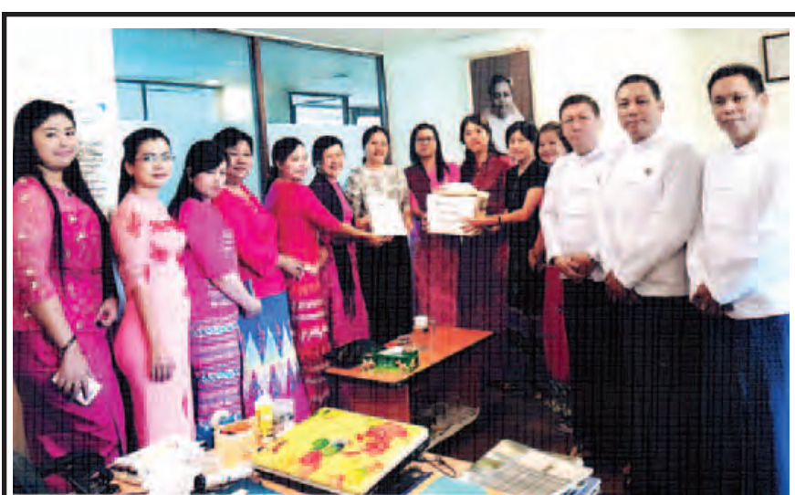
ရေဘေးသင့်ပြည်သူများအတွက် ဆန်အိတ် ၅၀ ပေးအပ်လှူဒါန်း

ယနေ့ပွဲ (တောင်ကြီးကွင်း) ရှမ်းယူနိုက်တက် - မကွေး (အောင်ဆန်းကွင်း) ရခိုင် - Horizon (သုဝဏ္ဏကွင်း) ချင်းယူနိုက်တက် - Southern (ရှင်းထက်ဇော်)