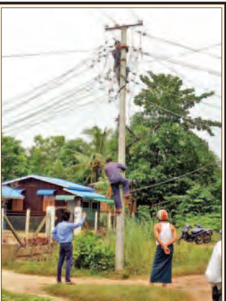
ဒိုက်ဦးမြို့နယ်တွင် လျှပ်စစ်အန္တရာယ်ကင်းရှင်းရေး အတွက် မြို့သစ်(က)၇လမ်းနှင့်ရပ်ကွက်အတွင်းရှိ ၄၀၀ ဗို့လျှပ်စီးထိန်းသိမ်းပြင်ဆင်ခြင်း၊ ဓာတ်အားလိုင်းဝါ ယာသစ်ပင် သစ်ကိုင်းခုတ်ထွင်ရှင်းလင်းခြင်းနှင့် ရှုပ်ထွေးဆားပစ်ကြိုးများအား အန္တရာယ်ကင်းအောင် ပြုပြင်ရှင်းလင်းခြင်းလုပ်ငန်းများကို ဩဂုတ် ၁၂ ရက်က မြို့နယ်လျှပ်စစ်အင်ဂျင်နီယာမှူး မြို့နယ်အင်ဂျင်နီယာဦးအာကာထက်ပိုင်ဆွေနှင့် ဝန်ထမ်းများဆောင်ရွက်စဉ်။