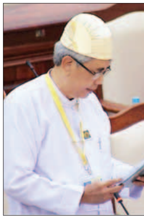
ဒုတိယဝန်ကြီး ဦးကျော်မျိုး