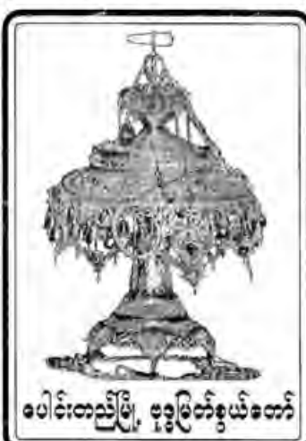
ပေါင်းတည်မြို့၊ ဗုဒ္ဓမြတ်စွယ်တော်

(၁၁၆) ကြိမ်မြောက်၊ (၁၁၉) နှစ်ပြည့်၊ ပေါင်းတည်မြို့၊ ဗုဒ္ဓမြတ်စွယ်တော် လှည့်လည်အပူဇော်ခံပွဲတော်ကြီးကို - ၁၃၇၈ - ခုနှစ်၊ တော်သလင်းလဆန်း (၁၂) ရက် (၁၃.၉.၂၀၁၆) နေ့မှ တော်သလင်းလပြည့်ကျော် (၁) ရက် (၁၇.၉.၂၀၁၆) နေ့အထိ (၅) ရက် တိုင်တိုင် စည်ကားသိုက်မြိုက်စွာ ကျင်းပမည် ဖြစ်ပါသည်။ ၁၃၇၈ - ခုနှစ်၊ တော်သလင်းလဆန်း (၁၃) ရက် (၁၄.၉.၂၀၁၆) နေ့ နေ့လည် ( ၁ ) နာရီမှ စတင်၍ ဗုဒ္ဓမြတ်စွယ်တော်ကို ဆင်ရတနာပေါ်သို့ ပင့်ဆောင်ပြီး ယိမ်း - နိပါတ် - ဘာသာရေးအဖွဲ့အစည်းများ လိုက်ပါခြံရံလျက် မြို့ပေါ်သို့ လှည့်လည် အပူဇော်ခံပါမည်။ ၁၃၇၈ - ခုနှစ်၊ တော်သလင်းလဆန်း (၁၄) ရက် (၁၅.၉.၂၀၁၆) နေ့မှ တော်သလင်းလပြည့် ( ၁၆ . ၉ . ၂၀၁၆ ) နေ့ ည (၁၀) နာရီအထိ ဗုဒ္ဓမြတ်စွယ်တော် ရတနာ ကို စိန်ကြွတ်မှ ဖွင့်လှစ်၍ ပကတိအတိုင်း ပူဇော်ခံ ထားရှိမည် ဖြစ်သည်။ လေလံဆိုင်ခန်းများကို - ၁၃၇၈ - ခုနှစ်၊ ဝါခေါင်လပြည့်ကျော် ( ၆ ) ရက်နေ့ ( ၂၄ . ၉ . ၂၀၁၆ ) နေ့ နံနက် ( ၉ ) နာရီ အချိန်တွင် ယခင်နှစ်များအတိုင်း ဈေးပြိုင်စနစ်ဖြင့် ရောင်းချပါမည်။ ဈေးဆိုင်ဟောင်းများကို တော်သလင်းလဆန်း ( ၁ ) ရက် ( ၂ . ၉ . ၂၀၁၆ ) နေ့ မှ စ၍ တော်သလင်းလဆန်း ( ၃ ) ရက် ( ၄ . ၉ . ၂၀၁၆ ) ရက်နေ့အထိ ရောင်းချပြီး ဈေးဆိုင်သစ်များကို တော်သလင်းလဆန်း ( ၄ ) ရက် ( ၅ . ၉ . ၂၀၁၆ ) ရက်နေ့မှ စတင်ရောင်းချပါမည်။ "ဗုဒ္ဓမြတ်စွယ်တော်နှင့်ပတ်သက်သော အမှတ်တရ အင်္ကျီ - ဂျာဗတ် - တံဆိပ် - CD ဝေမျှား လုံးဝရောင်းချခွင့်မပြု။" အခြားမြို့နယ်များသို့ အလှူခံ စေလွှတ်ခြင်းမရှိပါ။ မြတ်စွယ်တော်အမ်းအနားစီစဉ်မှုအဖွဲ့၊ ပေါင်းတည်မြို့၊ ဖုန်း - ၀၅၃ - ၃၈၁၁၀