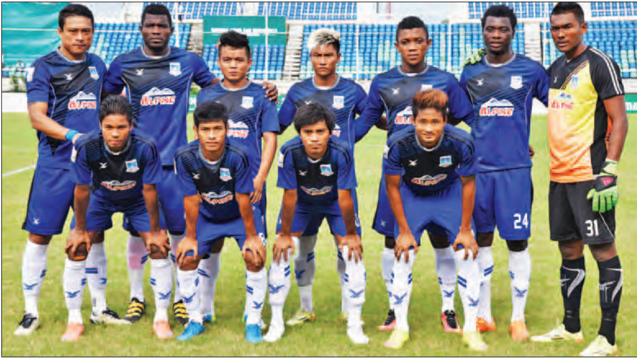
ဖလားနှစ်လုံးရရှိရေး အိမ်ကွင်း၌ ကြိုးပမ်းမည့် ရတနာပုံအသင်း။