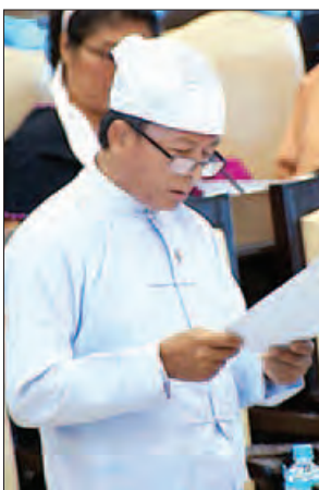
ဒုတိယဝန်ကြီး ဒေါက်တာထွန်းဝင်း

၂၀၁၆-၂၀၁၇ ဘဏ္ဍာနှစ်တွင် တိုင်းဒေသကြီးနှင့် ပြည်နယ် ရှစ်ခုရှိ သောက်သုံးရေကန် ၉၄ ကန်ကို တူးဖော်ပြုပြင်သွားမည်ဖြစ်ကြောင်းနှင့် နိုင်ငံတစ်ဝန်းရှိ မြို့နယ်ပေါင်း ၂၉၈ မြို့နယ်တွင် ရေရရှိရေးလုပ်ငန်းပေါင်း ၂၀၉၇ ခုကို လျာထားဆောင်ရွက်လျက် ရှိကြောင်း စိုက်ပျိုးရေး၊ မွေးမြူရေးနှင့် ဆည်မြောင်းဝန်ကြီးဌာန ဒုတိယဝန်ကြီး ဒေါက်တာထွန်းဝင်းက ပြောကြားသည်။