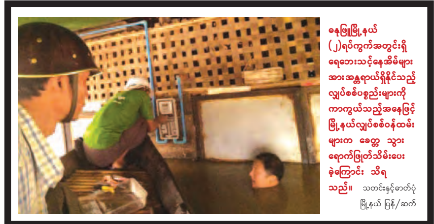
ဇေယျမြို့နယ် (၂)ရပ်ကွက်အတွင်းရှိ ရေဘေးသင့်နေအိမ်များ အားအန္တရာယ်ရှိနိုင်သည့် လျှပ်စစ်ပစ္စည်းများကို ကာကွယ်သည့်အနေဖြင့် မြို့နယ်လျှပ်စစ်ဝန်ထမ်းများက ဧည့် သွား ရောက်ဖြတ်သိမ်းပေးခဲ့ကြောင်း သိရသည်။

အဆိုပါအခမ်းအနားသို့ ဆောက်လုပ်ရေးကုမ္ပဏီမှ လုပ်ငန်းရှင်များ၊ ကျောင်းသား၊ ကျောင်းသူများ တက်ရောက်ခဲ့ကြကြောင်း သိရသည်။