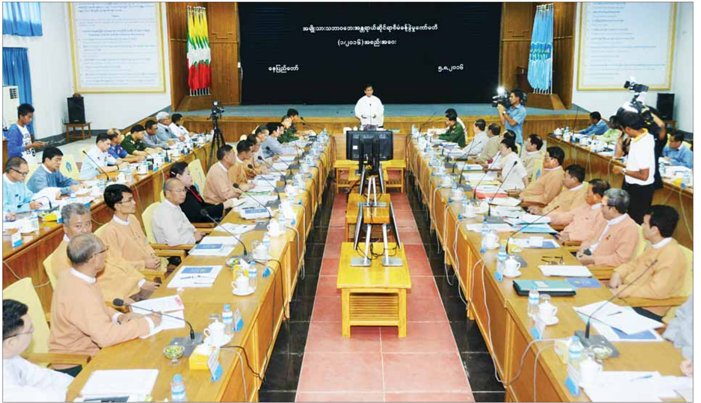
အမျိုးသားသဘာဝဘေးအန္တရာယ်ဆိုင်ရာစီမံခန့်ခွဲမှုကော်မတီ(၁/၂၀၁၆) လုပ်ငန်းညှိနှိုင်းအစည်းအဝေး ကျင်းပစဉ်။ (သတင်းစဉ်)

ထို့ပြင် ဒုတိယသမ္မတက ယနေ့အချိန်အခါတွင် ရာသီဥတုပြောင်းလဲမှုနှင့် ကမ္ဘာကြီးပူနွေးမှုကြောင့် သဘာဝဘေးအန္တရာယ်များလည်း ကြုံတွေ့နေကြရပြီဖြစ်ကြောင်း၊ သဘာဝဘေးအန္တရာယ်မှာ ရှောင်လွှဲ၍မရသော်လည်း ထိခိုက်ဆုံးရှုံးမှုအနည်းဆုံးဖြစ်အောင်နှင့် ပျက်စီးဆုံးရှုံးမှု လျော့ပါးသက်သာအောင် ဆောင်ရွက်ကြရမည်ဖြစ်ကြောင်း၊ သဘာဝဘေးအန္တရာယ်လျော့ပါးစေရေးအတွက် သဘာဝဘေးအန္တရာယ်များနှင့် စာမျက်နှာ ၃ ကော်လံ ၁ သို့ ❖