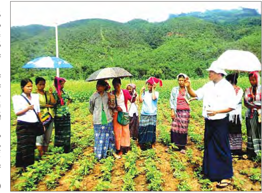
ကိုရိုင်း (လွိုင်ကော်)

ယင်းခရိုင်အတွင်းရှိ တောင်သူများမှာ နွမ်းကိုသာ အဓိကစိုက်ပျိုးပြီး အသက်မွေးဝမ်းကျောင်း ပြုကြသူများဖြစ်ပြီး ကယားပြည်နယ်၏ အဓိကထွက်ကုန်များတွင် ဘော်လခဲခရိုင်မှ နွမ်းများလည်း ပါဝင်ကြောင်း သိရသည်။