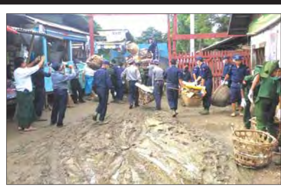
စစ်ကိုင်းတိုင်းဒေသကြီး မော်လိုက်မြို့တွင် ချင်းတွင်းမြစ်ရေကုဆင်းသွားပြီးနောက် ရေကန်မြစ်သားခွဲရသည့် မြို့မဈေးကြီးအခြေခံဆုံး ဖွင့်လှစ်နိုင်ရန်နှင့် ပြည်သူများ အသုံးပြုသွားလာနေရသည့် မင်္ဂလာလမ်းမကြီး သန့်ရှင်းသပ်ရပ်စေရန် ဩဂုတ်လ ၄ ရက်၊ နံနက်ပိုင်းတွင် မော်လိုက်ခရိုင်စီမံခန့်ခွဲမှုကော်မတီဥက္ကဋ္ဌ ဦးဝင်းမင်းသိန်း၏ ဦးဆောင်လမ်းညွှန်မှုဖြင့် ခရိုင်၊ မြို့နယ်ဌာနဆိုင်ရာတာဝန်ရှိသူများ၊ နယ်မြေခံတပ်ရင်းမှ တပ်မတော်သားများ၊ မြန်မာနိုင်ငံရဲတပ်ဖွဲ့ဝင်များ၊ မြို့နယ်မီးသတ်တပ်ဖွဲ့ဝင်များ၊ မြို့နယ်စည်ပင်သာယာရေးကော်မတီအဖွဲ့ဝင်များ၊ ဝန်ထမ်းများနှင့် ပြည်သူများစုပေါင်း၍ သန့်ရှင်းရေးလုပ်ငန်းများဆောင်ရွက်ပေးခဲ့ကြောင်း သိရသည်။