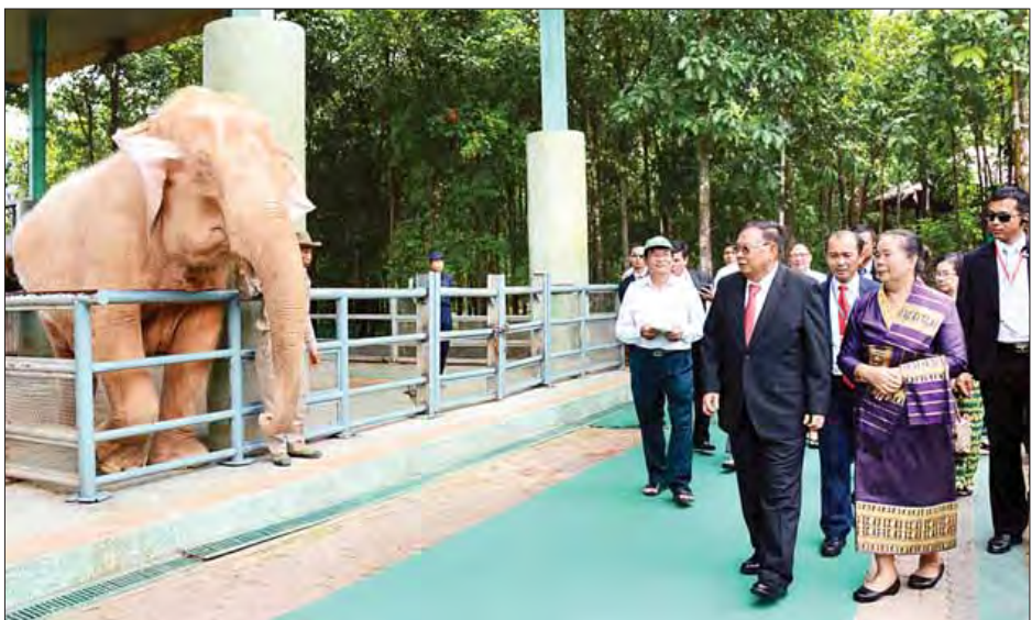
လာအိုနိုင်ငံသမ္မတ မစ္စတာ ဘွန်ညံ ပိုရာချစ်နှင့် ဇနီးနှင့်အဖွဲ့ ဆင်ဖြူတော်အား ကြည့်ရှုလေ့လာစဉ်။