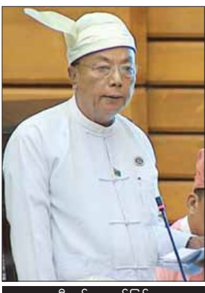
ဦးခင်အောင်မြင့်

အခါ ရေရှားပါးပြတ်လပ်မှုသည် တစ်နှစ်ထက်တစ်နှစ် ပိုမိုများပြားလာသည်ကို တွေ့ရှိရပါကြောင်း၊ ရေတွင်းရေကန်များ လျင်မြန်စွာခန်းခြောက်ခြင်း၊ စိမ့်ရေစမ်းရေများ ရေထွက်မှုနည်းပါးလာခြင်းတို့ကိုလည်း တွေ့ရှိရပါကြောင်း၊ ထို့ကြောင့် နိုင်ငံတစ်ဝန်းအစိုးရ တပ်မတော်နှင့် စေတနာရှင်ပြည်သူများက ရေဖြန့်ဝေပေးခြင်းနှင့် စက်ရေတွင်းများ တူးဖော်ပေးခြင်းတို့ကို ကူညီထောက်ပံ့ဖြည့်ဆည်းဆောင်ရွက်ပေးခဲ့သဖြင့် အတိုင်းအတာတစ်ခုအထိ ဖြေရှင်းဆောင်ရွက်နိုင်ခဲ့ပါကြောင်း။