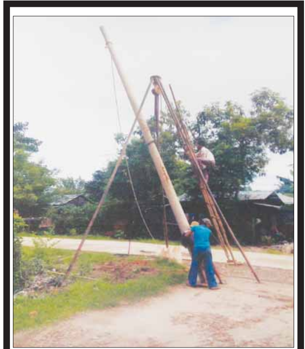
ဧရာဝတီတိုင်းဒေသကြီး ပုသိမ်ခရိုင် ကျောင်းကုန်းမြို့နယ် သစ်ဆိန်ကုန်းကျေးရွာ အုပ်စု မှော်သေးရပ်ရှိ ပြည်သူများ လျှပ်စစ်အန္တရာယ်ကင်းဝေးစေရေးအတွက် ဆွေးနွေးဖြေနေသော သစ်သားတိုင်များအစား ၉ မီတာ ကွန်ကရစ်ကျောက်တိုင်၊ သံလက်တန်းတိုင်ဖြင့် အစားထိုးလဲလှယ်မှုကို ဩဂုတ် ၄ ရက် နံနက်ပိုင်းက ကျောင်းကုန်းမြို့ လျှပ်စစ်အင်ဂျင်နီယာရုံးမှ ဝန်ထမ်းများက ဆောင်ရွက်ပေးခဲ့ကြ သည်။ မိုးတွင်းကာလဖြစ်သဖြင့် လေနှင့်မိုး တိုက်ခတ်ရွာသွန်းမှုကြောင့် ခိုင် ခန့်မှုမရှိသော ဆွေးနွေးသစ်သားတိုင် ၄၅ တိုင်အား အစားထိုးလဲလှယ်ပေးခြင်းဖြစ် ကြောင်း သိရသည်။