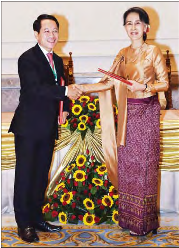
နိုင်ငံခြားရေးဝန်ကြီးဌာန ပြည်ထောင်စုဝန်ကြီး ဒေါ်အောင်ဆန်းစုကြည် နှင့် လာအိုနိုင်ငံ နိုင်ငံခြားရေးဝန်ကြီး Mr. Saleumxay Komm Asith တို့ သဘောတူစာချုပ်ကို လက်မှတ်ရေးထိုးပြီး အပြန်အလှန်လဲလှယ်ကြစဉ်။ (သတင်းစဉ်)