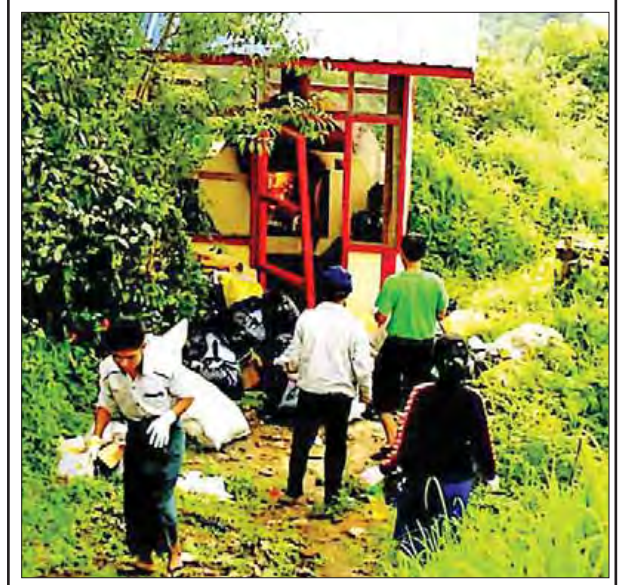
ရင်းမြစ်နယ် မင်းတပ်မြို့ ခရိုင်ပြည်သူ့ဆေးရုံကြီး၌ ဆေးရုံဝင်းသန့်ရှင်းသင်ရပ်မှ ရှိစေရန် လူများ၏ စွန့်ပစ်အမှိုက်များကို စီးပို့ဆောင်ရွက်လုပ်ကား စနစ်တကျ စီးပို့ဖျက်ဆီးခြင်းများ ဆောင်ရွက်နေသည်ကို ဩဂုတ် ၃ ရက်က တွေ့ရစဉ်။

ညောင်ဦးမြို့နယ်အတွင်း ၂၀၁၆ - ၂၀၁၇ ဘဏ္ဍာနှစ်အတွက် မြစ်ရေရောင်ကျေးရွာစီမံကိန်း ရန်ပုံငွေကျပ် သိန်း ၃၀၀ ရရှိသည့်ကျေးရွာများမှာ မြေခိုအုပ်စုကွန်းဘိုကန်ကျေးရွာ၊ တောရွာကျေးရွာ၊ သပြေအိုင်အုပ်စု ကွန်းရှည်ကျေးရွာ၊ လက်ထုပ်အုပ်စု လက်ထုပ်ကွန်းကျေးရွာ၊ တက်မအုပ်စု သပွတ်စုကျေးရွာ၊ ကမ္ဘားနီအုပ်စု ညောင်ကြီးကျေးရွာ၊ ကန်နီကြီးအုပ်စု ဝက်လူးကျေးရွာ၊ ဇီးဇေမြိုင်ကျေးရွာနှင့် ဝါခင်းကြီးကျေးရွာတို့ဖြစ်ကြောင်း သိရသည်။