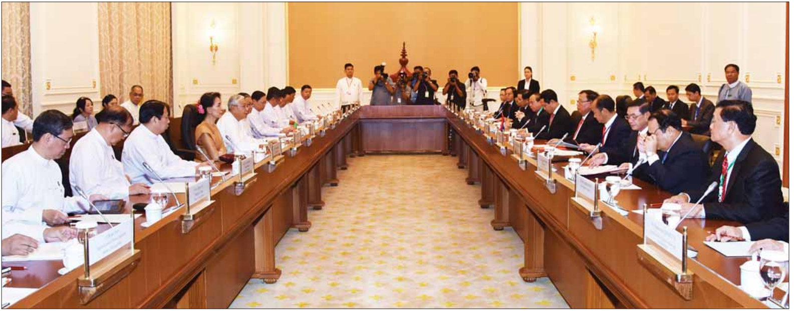
မြန်မာ-လာအို နှစ်နိုင်ငံတွေ့ဆုံဆွေးနွေးပွဲ ကျင်းပစဉ်။ (သတင်းစဉ်)

နေ့လယ်စာ စားပွဲအပြီးတွင် နှစ်နိုင်ငံခေါင်းဆောင်များ၊ ဇနီးများ နှင့် အဖွဲ့ဝင်များသည် သဘင်ဆောင်၌ ယဉ်ကျေးမှုဒေသကပွဲဖြင့် ဖျော်ဖြေ တင်ဆက်မှုကို ကြည့်ရှုအားပေးကြ သည်။