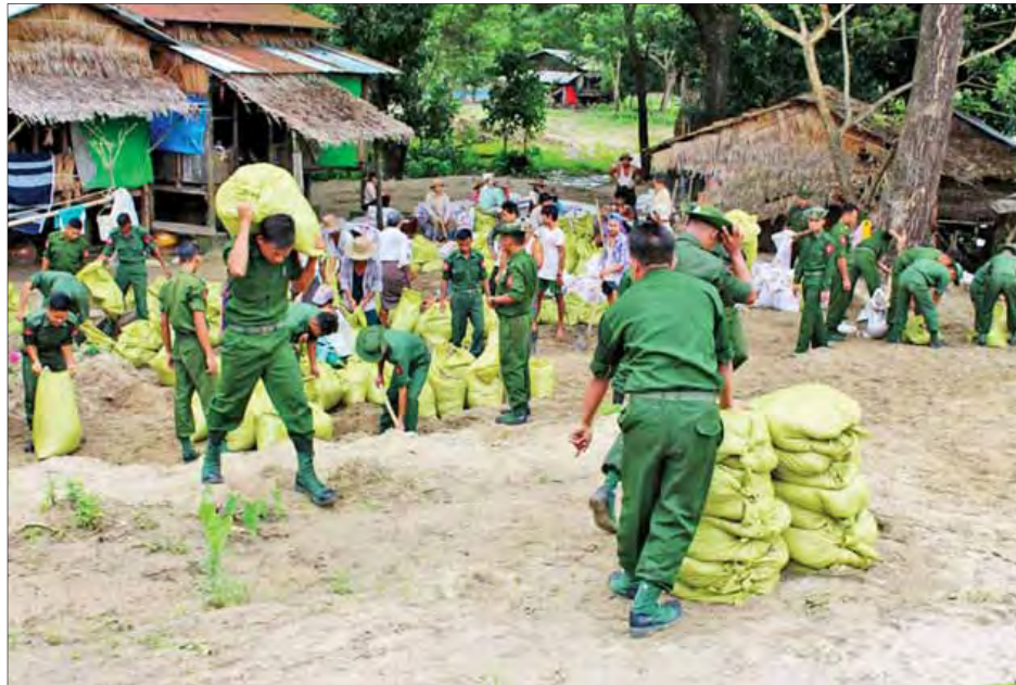
ဧရာဝတီတိုင်းဒေသကြီး၊ ညောင်တုန်းမြို့နယ် ပါလွဲကျေးရွာတွင် ဧရာဝတီမြစ်ရေတက်ကာကွယ်ရေးအတွက် တပ်မတော်သားများနှင့် ပြည်သူများက ရေဘေးကာကွယ်ရေးပစ္စည်းများ ကြိုတင်စုဆောင်းနေစဉ်။