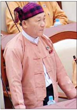
ဦးအင်ထိုးခါးနော်ဆမ်

ဒုတိယအကြိမ် ပြည်သူ့လွှတ်တော် ဒုတိယပုံမှန်အစည်းအဝေး နဝမနေ့ကို ယနေ့နံနက် ၁၀ နာရီတွင် လွှတ်တော်အဆောက်အအုံ ပြည်သူ့လွှတ်တော်၌ ဆက်လက်ကျင်းပရာ မြစ်ကြီးနားမဲဆန္ဒနယ်မှ လွှတ်တော်ကိုယ်စားလှယ် ဦးအင်ထိုးခါးနော်ဆမ်၏ နယ်စပ်ဒေသများ၌ တိုက်ပွဲများဖြစ်နေခြင်းကြောင့် စစ်ရှောင်ဒုက္ခသည်များအတွက် မည်သို့ဆောင်ရွက်ပေးနေကြောင်းနှင့် တိုက်ပွဲများဖြစ်နေကြသော နယ်စပ်လက်နက်ကိုင်အဖွဲ့အကြီးအကဲများထံသို့ ညှိနှိုင်းဖြေရှင်းပေးရန် အစီအစဉ် ရှိ မရှိနှင့် စပ်လျဉ်းသည့်မေးခွန်းကို နယ်စပ်ရေးရာဝန်ကြီးဌာန ဒုတိယဝန်ကြီး ဝိုင်းချုပ်သန်းထွဋ်က ကျေပယ်ပြန်အတွင်း ၂၀၁၁ ခုနှစ် ဇွန်လမှစတင်၍ ပဋိပက္ခများဖြစ်ပွားခဲ့ရာ နယ်မြေလုံခြုံရေးအခြေအနေအရ တိမ်းရှောင်လာသော မိသားစုများအတွက် မြစ်ကြီးနား၊ ဝိုင်းမော်၊ ကန်ပိုက်တီး၊ ချီဖွေ၊ ပန်ဝါ၊ မိုးညှင်း၊ မိုးကောင်း၊ ဖားကန့်၊ ကာပိုင်း၊ ဗန်းမော်၊ မိုးမောက်၊ လွယ်ကျယ်၊ မန်စီ၊ ရွှေကူ၊ ဒေါ်ဖုန်းယန်၊ ပူတာအို၊ ဆွမ်ပရာတွမ်ဒေသများတွင် ၂၀၁၆ ခုနှစ် ဇွန်လအထိ ကယ်ဆယ်ရေးစခန်း (၉၄) ခု ဖွင့်လှစ်ခဲ့ပြီး အိမ်ထောင်စု (၈၀၉၈) စု စုစုပေါင်းရွှေ့ပြောင်းနေထိုင်သည့် လူဦးရေ (၃၉၃၇၆) ဦးရှိသည်ဟု ကချင်ပြည်နယ်အစိုးရအဖွဲ့၏ တင်ပြချက်အရ သိရှိရပါကြောင်း ဖြေကြားသည်။