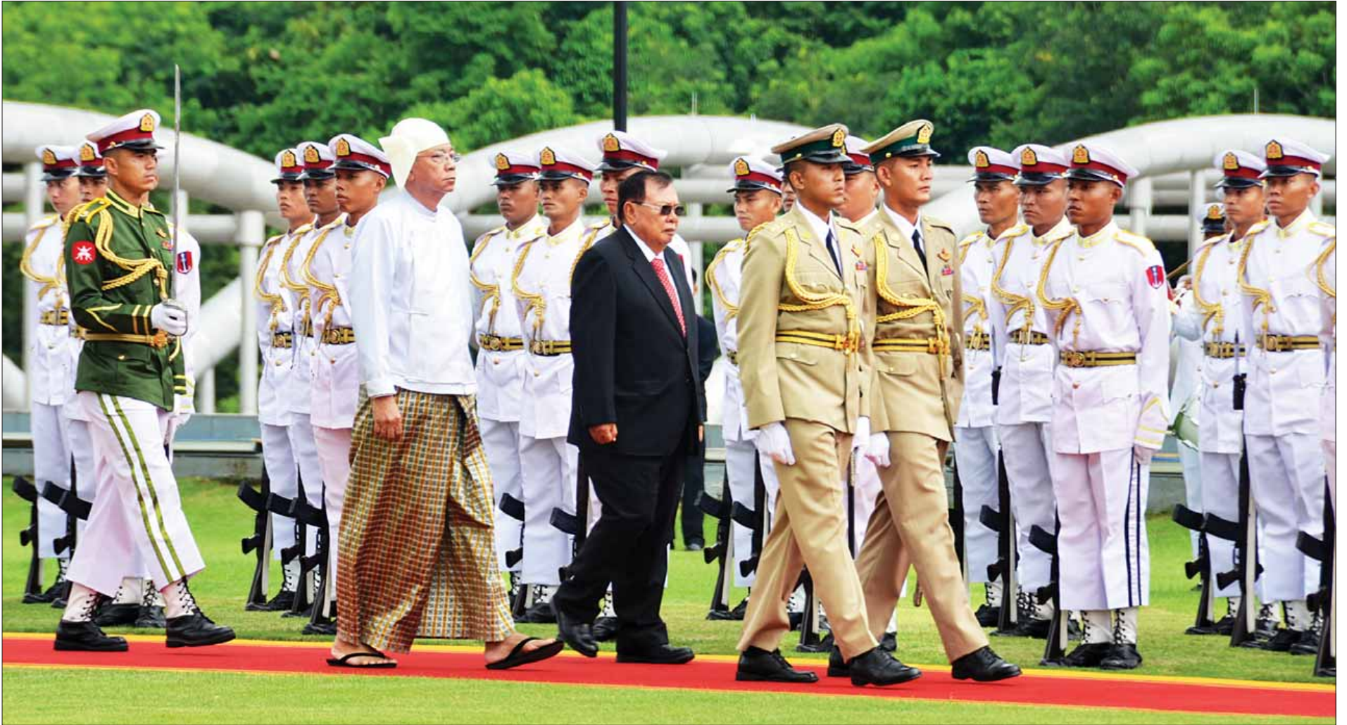
နိုင်ငံတော်သမ္မတ ဦးထင်ကျော်နှင့် လာအိုနိုင်ငံသမ္မတ မစ္စတာ ဘွန်ညံ ဗိုရာချစ်တို့ ဂုဏ်ပြုတပ်ဖွဲ့အား စစ်ဆေးစဉ်။

သူတော်ကောင်းတို့သည် ခန္ဓာငါးပါးစသော သဘောတရား အားလုံး၌ တပ်မက်မှုကို စင်စစ် စွန့်လွှတ်ကုန်၏။ သူတော် ကောင်းတို့သည် ကာမကိုအလိုရှိကုန်သည်ဟု မပြော ဆိုကုန်။ ပညာရှိတို့သည် ချမ်းသာဆင်းရဲနှင့် တွေ့စေကာမူ ဝမ်းမြောက်ခြင်း၊ နှလုံးမသာမယာခြင်း သဘောကို မဖော်ပြ ကြကုန်။ ဆင်းရဲ ချမ်းသာ ဘယ်အခါမှ ဝမ်းနည်း ဝမ်းသာ ခြင်းမရှိ။ ပဏ္ဍိတဝင်(ဓမ္မပဒ-၈၃)