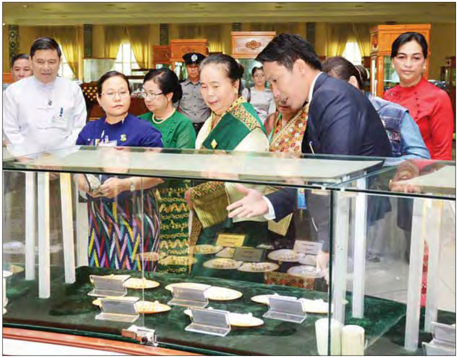
လာအိုနိုင်ငံသမ္မတ၏ ဇနီးနှင့်အဖွဲ့ ကျောက်မျက်ရတနာပြတိုက်၌ ကြည့်ရှုလေ့လာစဉ်။