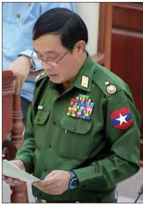
ဒုတိယဝန်ကြီး ဝိုင်းချုပ် သန်းထွဋ်

ဒီမိုကရေစီဖက်ဒရယ်ပြည်ထောင်စုပေါ်ထွန်းလာရေး မျှော်မှန်း၍ ပြည်ထောင်စု တိုင်းရင်းသားများ ပါဝင်သင့် ပါဝင်ထိုက်သူများ ပါဝင်သည့် ပြည်ထောင်စုငြိမ်းချမ်းရေးညီလာခံ (၂၁)ရာစုပင်လုံကို ကျင်းပသွားမည်ဖြစ်ရာ ညီလာခံအောင်မြင်စွာ ကျင်းပနိုင်ရေးအတွက် လိုအပ်သည့် ကြိုတင်ပြင်ဆင်မှုများ လုပ်ဆောင်နိုင်ရန် မေ ၃၁ ရက်တွင် ပြည်ထောင်စု ငြိမ်းချမ်းရေးညီလာခံ (၂၁) ရာစုပင်လုံ အကြိုပြင်ဆင်ရေးကော်မတီကို ဖွဲ့စည်း၍ လုပ်ငန်းတာဝန်များ ချမှတ်အကောင်အထည်ဖော်ဆောင်ရွက်လျက်ရှိပါကြောင်း။ ထို့အပြင် တစ်နိုင်ငံလုံးပစ်ခတ်တိုက်ခိုက်မှုရပ်စဲရေးဆိုင်ရာ သဘောတူစာချုပ် (NCA) လက်မှတ်ရေးထိုးပြီး ဖြစ်သည့် အဖွဲ့များနှင့် တွေ့ဆုံဆွေးနွေးနိုင်ရန်အတွက် ပြည်ထောင်စုငြိမ်းချမ်းရေးညီလာခံ (၂၁)ရာစုပင်လုံ အကြိုပြင်ဆင်ရေးဆောင်ရွက်မတီ (၁)ကိုလည်းကောင်း၊ တစ်နိုင်ငံလုံး ပစ်ခတ်တိုက်ခိုက်မှုရပ်စဲရေးဆိုင်ရာ သဘောတူစာချုပ် (NCA) လက်မှတ်ရေးထိုးခြင်း မပြုရသေးသော အဖွဲ့များနှင့် တွေ့ဆုံဆွေးနွေးနိုင်ရန်အတွက် ပြည်ထောင်စုငြိမ်းချမ်းရေးညီလာခံ (၂၁)ရာစုပင်လုံ အကြိုပြင်ဆင်ရေးဆောင်ရွက်မတီ (၂)ကိုလည်းကောင်း ဖွဲ့စည်း၍ လုပ်ငန်းတာဝန်များ ချမှတ်အကောင်အထည်ဖော် ဆောင်ရွက်လျက်ရှိပါကြောင်းဖြင့် ရှင်းလင်းဖြေကြားသည်။