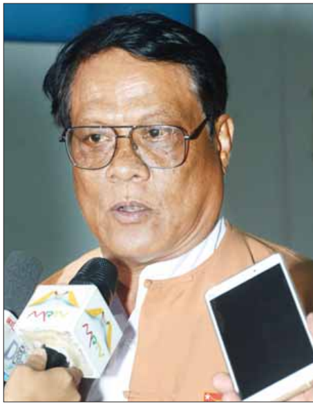
ဒေါက်တာမြင့်နိုင် (စစ်ကိုင်းတိုင်းဒေသကြီး ဝန်ကြီးချုပ်)

ပြီးခဲ့တဲ့လ ၃၁ ရက်ကစပြီး ကာရော်နောက်ညို ကျေးလက်ကျန်းမာရေးဌာနက ကျန်းမာရေးအဖွဲ့တွေ ပြီးတော့ အခုလ ၅ ရက်ကစပြီး ပြည်သူ့ကျန်းမာရေး ဦးစီးဌာန ကူးစက်ရောဂါဆရာဝန်ကြီးတွေနဲ့ ငှက်ဖျားရောဂါ ဆရာဝန်ကြီးပါဝင်တဲ့ ဗဟိုကွင်းဆင်းအဖွဲ့နဲ့ စစ်ကိုင်းတိုင်း ဒေသကြီး ပြည်သူ့ကျန်းမာရေးဦးစီးဌာနက ကူးစက်ရောဂါ ဆရာဝန်တွေပါဝင်တဲ့ တိုင်းဒေသကြီးကွင်းဆင်းအဖွဲ့တွေက ကွင်းဆင်းပြီး ရောဂါကာကွယ်ထိန်းချုပ်လုပ်ငန်းတွေ၊ အသေးစိတ်စုံစမ်းစစ်ဆေးမှုတွေနဲ့ နီးစပ်ရာ ကျေးရွာတွေမှာ ကျန်းမာရေး စောင့်ရှောက်မှုပေးတဲ့ လုပ်ငန်းတွေကို လုပ်ဆောင်လျက်ရှိပါတယ်။