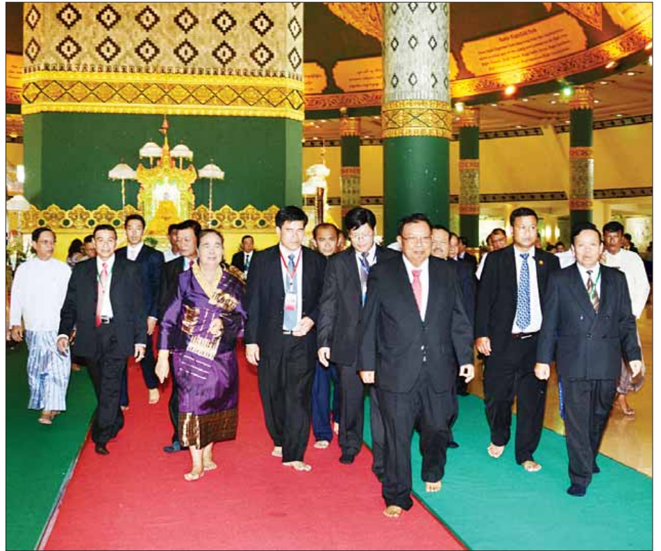
လာအိုနိုင်ငံသမ္မတ မစ္စတာ ဘွန်ညံ ပိုရာချစ်နှင့် ဇနီးတို့ ဥပဒေရေးရာတိုင်းတာခြင်းအား သွားရောက်ဖူးမြော် ကြည့်ရှုစဉ်။ (သတင်းစဉ်)