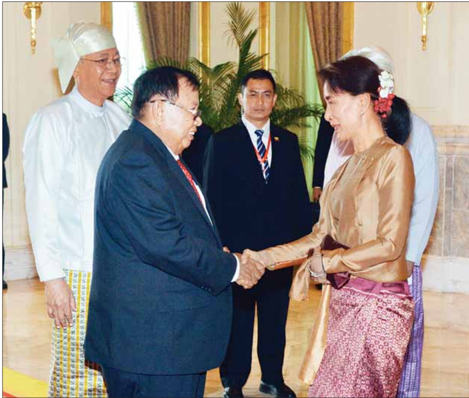
နိုင်ငံတော်၏အတိုင်ပင်ခံပုဂ္ဂိုလ် ဒေါ်အောင်ဆန်းစုကြည် လာအိုနိုင်ငံသမ္မတ မစ္စတာ ဘွန်ညံ ပိုရာချစ်အား ကြိုဆို နှုတ်ဆက်စဉ်။ (သတင်းစဉ်)

အထိ လည်းကောင်း၊ မွန်ဂိုလီးယား နိုင်ငံသမ္မတ မစ္စတာ ဇေတ်ဟီးလ်ယာဒ် အယ်လ်ဘတ်ခ်ဒေါ့ဂျီ သည် ဇွန် ၁၄ ရက်မှ ၁၆ ရက်အထိ လည်းကောင်း ချစ်ကြည်ရေးခရီး လာရောက်ခဲ့ကြပြီး ယခုလာအိုနိုင်ငံသမ္မတ၏ ခရီးစဉ်သည် သုံးယောက်မြောက် နိုင်ငံခေါင်းဆောင်