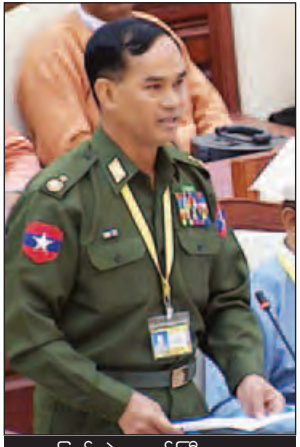
ပြည်ထဲရေးဝန်ကြီးဌာန ဒုတိယဝန်ကြီး ဦးဝင်းကျော်

ပုဇွန်တောင်မဲဆန္ဒနယ်မှ ဦးမြင့်လွင်၏ တရားရုံးများတွင် တရားစီရင်ရာ မှာ စိတ်ဝင်စားသော ပြည်သူများ ဝင်ရောက်နားထောင်ရာတွင် တားဆီးသူ များအား အရေးယူရန် အစီအစဉ် ရှိ မရှိနှင့် တရားရုံးများတွင် ရေးသား လျှောက်လဲချက်ကို လက်ခံနေခြင်းသည် ဥပဒေကို ဆန့်ကျင်နေပါသဖြင့် ရပ်ဆိုင်းရန်အစီအစဉ် ရှိ မရှိနှင့်စပ်လျဉ်းသည့် မေးခွန်းအပေါ် ပြည်ထောင်စု တရားလွှတ်တော်ချုပ်တရားသူကြီး ဦးစိုးညွန့်က သက်ဆိုင်ရာ တရားရုံးသည် လူကုန်ကူးမှုနှင့်စပ်လျဉ်းသော ဖြစ်မှုများကို စစ်ဆေးစီရင်ရာတွင် လူကုန်ကူး ခံရသည့် အမျိုးသမီးများ၊ ကလေးသူငယ်နှင့် လူငယ်များဖြစ်ပါက ကာယိန္ဒြေ စောင့်ထိန်းမှုနှင့် ရုပ်ပိုင်းဆိုင်ရာ၊ စိတ်ပိုင်းဆိုင်ရာ လုံခြုံမှုရှိစေရန် အများပြည်သူ ရွေ့တွင် မဟုတ်ဘဲ သီးသန့်ခန်းတွင် စစ်ဆေးစီရင်ရမည်ဟု ပြဋ္ဌာန်းထား