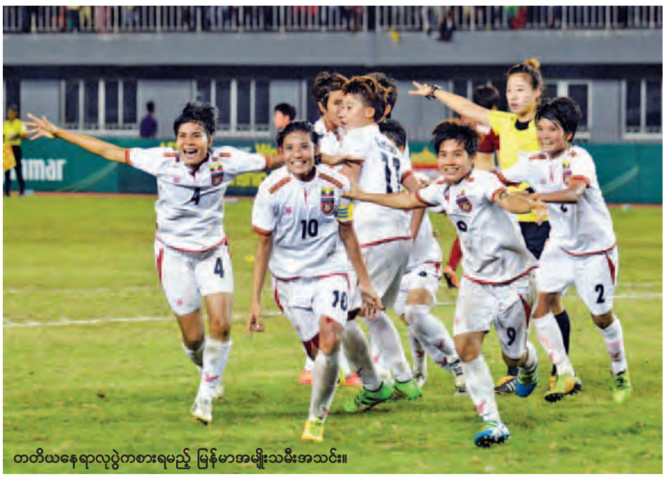
တတိယနေရာလှည့်ကစားရမည့် မြန်မာအမျိုးသမီးအသင်း။