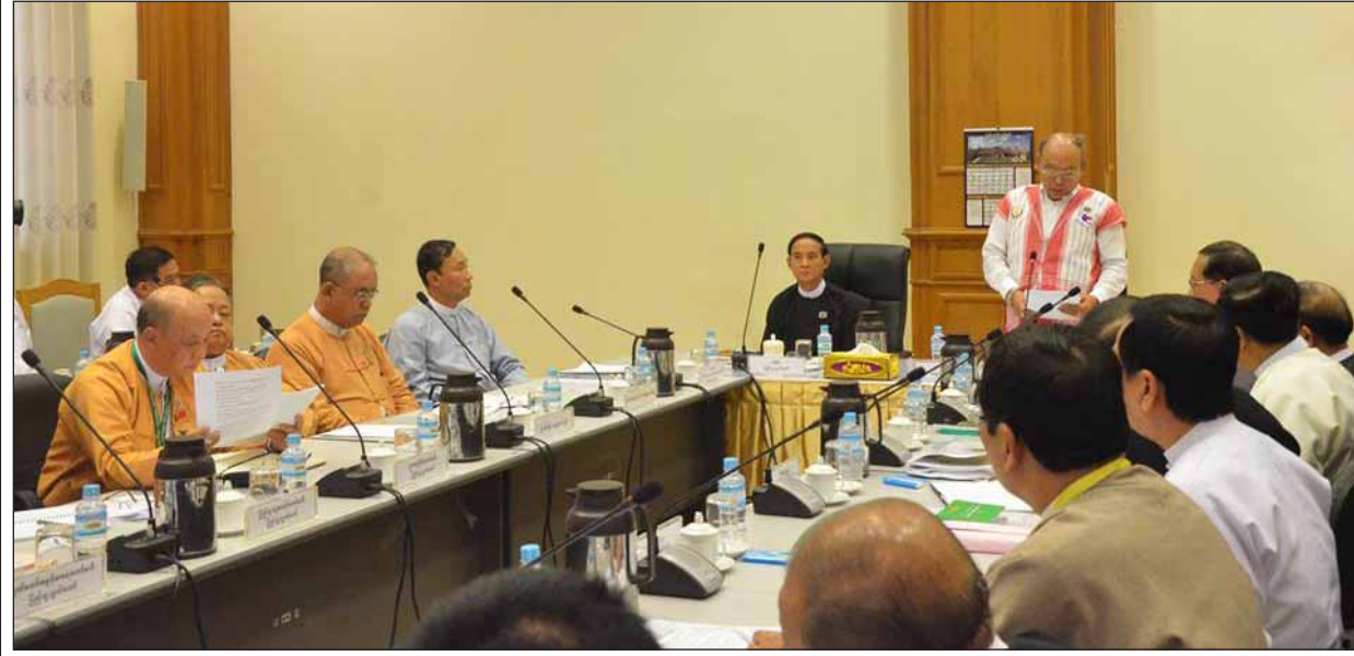
ဇွန် ၂၇ ရက်က ပြည်ထောင်စုလွှတ်တော်၌ ဥပဒေ(မူကြမ်း)နှင့် နည်းဥပဒေများ ရေးဆွဲပြဌာန်းခြင်းဆိုင်ရာလုပ်ငန်းညှိနှိုင်းစည်းဝေးစဉ်။

“ခေတ်မီပြုပြင်ပြောင်းလဲခြင်း၏ အခြေခံ အစသည် ဥပဒေများဖြစ်ကြပြီး ဥပဒေများကို ပြင်ဆင်နိုင်ပါမှလည်း အမှန်တကယ်ပြောင်းလဲ နိုင်ကြမည်ဖြစ်”