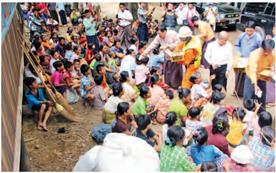
ပြည်ထောင်စုဝန်ကြီး ဒေါက်တာဝင်းမြတ်အေး၊ ရေဘေးသင့်ပြည်သူများအား ထောက်ပံ့ပေးပစ္စည်းများ ပေးအပ်စဉ်။ (သတင်းစဉ်)

ဌာနမှထောက်ပံ့သော ဆန်ဖိုးနှင့် ငါးသေတ္တာဖိုးထောက်ပံ့ငွေ ၄၄၃၈၀၀ နှင့် မီးဖွားပြီးစ မိခင်နှင့် ကလေးအတွက် ထောက်ပံ့ငွေ ၂၀၀၀၀ အား ထောက်ပံ့ပေးအပ်သည်။ ယင်းနောက် ပွင့်ဖြူမြို့နယ် ကုန်းဇောင်း-သံကိုင်း လမ်းမကြီးပေါ်တွင် ယာယီရွှေ့ပြောင်းနေထိုင်ကြသော ရေဘေးသင့်ပြည်သူများအား ရင်းရင်းနှီးနှီးတွေ့ဆုံအား ပေးစကားပြောကြားပြီး အိမ်ထောင်စု ၂၈၅ စုမှ လူဦးရေ ၉၂၄ ဦးအတွက် ဝန်ကြီးဌာနမှထောက်ပံ့သော ဆန်ဖိုးနှင့် ငါးသေတ္တာဖိုးထောက်ပံ့ငွေ ၁၉၁၉၇၀၀၊ ကယ်ဆယ်ရေး ပစ္စည်းလေးမျိုးအား ထောက်ပံ့ပေးအပ်ကာ ရေလွတ်ရာ နေရာများသို့ ယာယီရွှေ့ပြောင်းပေးရေးဆောင်ရွက်ပေး နေသော တပ်မတော်သားများ၊ မီးသတ်တပ်ဖွဲ့ဝင်များနှင့် အတူ ရေနစ်မြုပ်လျက်ရှိသည့် သံကိုင်းကျေးရွာသို့ စက်လှေများဖြင့် သွားရောက်ကြည့်ရှုသည်။ မွန်းလွဲပိုင်းတွင် မကွေးတိုင်းဒေသကြီးအစိုးရအဖွဲ့ရုံး အစည်းအဝေးခန်းမ၌ မင်းဘူးမြို့နယ် အမှတ်(၃)၊ (၄) ရပ်ကွက်ရှိ ရေဘေးသင့်ပြည်သူများ သောက်သုံးရေရရှိရေး ဆောင်ရွက်နိုင်ရန် တာပေါ်လင်စများ၊ ရေသန့်ဆေးပြား များအား ပြည်ထောင်စုဝန်ကြီးမှ တိုင်းဒေသကြီးဝန်ကြီးချုပ် သို့ လွှဲပြောင်းပေးအပ်ကာ စာရင်းထပ်မံတိုးလာသည့် ရေဘေးသင့်ပြည်သူများအား ဆက်လက် ထောက်ပံ့နိုင်ရေး စီစဉ်ဆောင်ရွက်ပေးသည်။ အဆိုပါခရီးစဉ်အတွင်း Fedwell Company Ltd မှ အာဟာရမှုန့်များအား