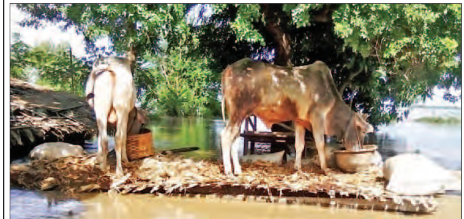
ချင်းတွင်းမြစ်ရေမြင့်တက်မှုကြောင့် ရေစကြိုမြို့နယ်ရှိ သာဂေါင်ကျေးရွာတွင် နွားများအား တုံးများခံကာ ကုန်းလှုပ်၍ ထားရသည်ကို ဩဂုတ် ၂ ရက်က တွေ့ရစဉ်။