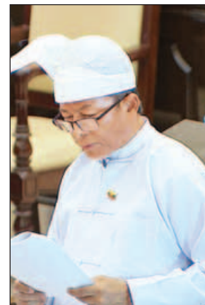
ဒုတိယဝန်ကြီး ဒေါက်တာထွန်းဝင်း

ယနေ့ကျင်းပသည့် ဒုတိယအကြိမ် အမျိုးသားလွှတ်တော် ဒုတိယပုံမှန် အစည်းအဝေး သတ္တမနေ့တွင် ရခိုင် ပြည်နယ် မဲဆန္ဒနယ်အမှတ်(၂) မှ ဦးတက်ထွန်းအောင်၏ “ရခိုင် ပြည်နယ်အတွင်း စိုက်ပျိုးရေးရရှိနိုင် ရန်အတွက် ပြည်ထောင်စုအစိုးရ ရန်ပုံငွေဖြင့် ရေချိုချောင်းပိတ်ဆည် ဆောင်ရွက်ပေးရန် အစီအစဉ် ရှိ၊ မရှိ” မေးခွန်းနှင့်စပ်လျဉ်း၍ ဒုတိယ ဝန်ကြီးက ဖြေကြားရာ၌ အထက်ပါ အတိုင်း ပြောကြားခဲ့သည်။