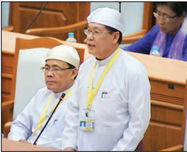
ပြည်ထောင်စုဝန်ကြီး ဦးသိန်းဆွေ။

ထို့အတူ အတည်ပြုချမှတ်ခဲ့သည့် နောက်ဆက်တွဲစာချုပ်တွင် အဓမ္မခိုင်း စေမှုများကို တားဆီးတိုက်ဖျက်ရေး၊ လျော်ကြေးပေးခြင်းကဲ့သို့သော ထိရောက်