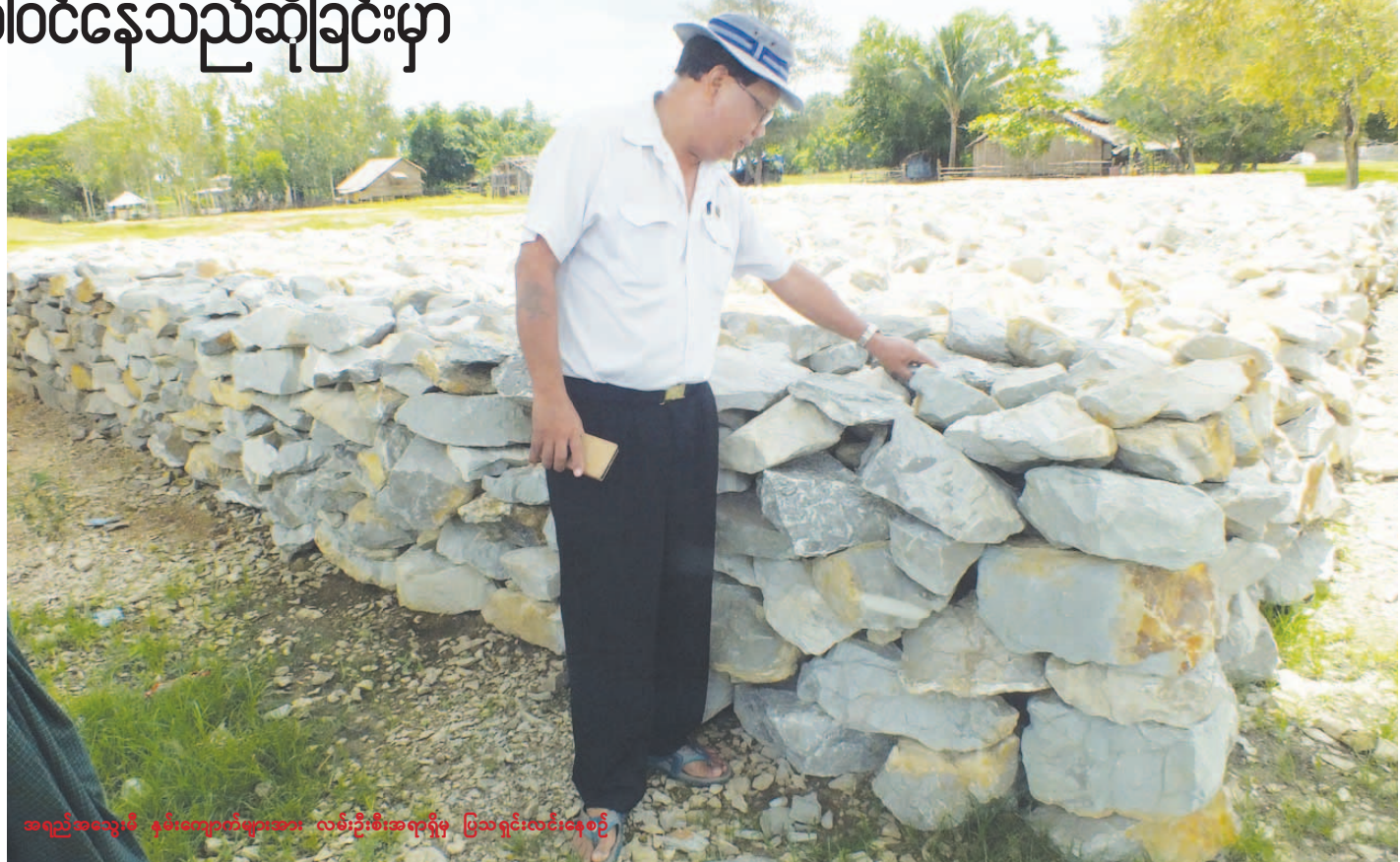
အရည်အသွေးမမီ နှမ်းကျောက်များထား လမ်းဦးစီးအရာရှိမှ ပြသရှင်းတင်နေစဉ်

ဖြေ။ ။ ယခုကျွန်တော်တို့ လက်ခံထားတဲ့ ကျောက်ပုံတွေကိုကြည့်ပါ။ ကျောက်အမာတွေဖြစ်ပါတယ်။ အဲဒီကျောက်တွေက ပြောမယ်ဆိုရင် ကျောက်အနှစ်တွေပါ။ သူတို့ကိုခွဲထားတဲ့နေရာတွေမှာ ကြည့်ပါ။ အမဲစက်ကလေးတွေတွေ့ပါလိမ့်မယ်။ အဲဒါကို ကျောက်ကုန်သည်က နှမ်းကျောက်လို့ခေါ်တာပါ။ ကျွန်တော်တို့ကတော့ မာကျောတဲ့သက်ရင့်ကျောက်တွေဆို သတ်မှတ်ထားတဲ့ အရည်အသွေး