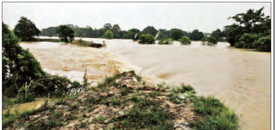
ဝန်မြစ်ရေမြင့်တက်မှုကြောင့် ဩဂုတ် ၃ ရက်က ဧရာဝတီတိုင်းဒေသကြီး ဟင်္သာတမြို့နယ်အင်္ဂါရမ်းကျေးရွာအုပ်စု သပြေဆိပ်-ဂျောင်းစိန် လယ်သမားတာ အလျားပေ ၃၀ ခန့် ကျိုးပေါက်မှုဖြစ်ပွားစဉ်။ ခရိုင်(ပြန်/ဆက်)

■ အိမ်ရှင်မြန်မာမှ နောက်ကျချေပုဒ်ကြောင့် သရေကျခဲ့ခြင်းဖြစ်သည်။ ယခုပွဲကို မြန်မာအသင်း တိုက်စစ်မှူး ရီရီဦးပွဲပယ်ပြစ်ဒဏ်ကြောင့် ပါဝင်နိုင်မည်မဟုတ်သော်လည်း အခြားကစားသမားများ ပါဝင်မည်ဖြစ်သည်။ ပြိုင်ပွဲ၏ အအောင်မြင်ဆုံးအသင်းဖြစ်သည့် မြန်မာအသင်းဗိုလ်လုပွဲနှင့် လွဲချော်ပြီးနောက် ဗိုလ်လုပွဲရောက်ရှိလာသည့် ထိုင်းနှင့် ဗီယက်နမ်အသင်းအနက် ဗိုလ်စွဲသည့်အသင်းမှာ အအောင်မြင်ဆုံးအသင်းအဖြစ်ပါ ရပ်တည်နိုင်မည်ဖြစ် သည်။ ထိုင်းအသင်းသည် လက်ရှိချန်ပီယံအသင်းဖြစ်သော်လည်း အုပ်စုတွင်း တွေ့ဆုံစဉ်က ဗီယက်နမ်အသင်းကို နှစ်ဂိုး-ဂိုးမရှိဖြင့် ရှုံးနိမ့်ထားသည်။ ၂၀၁၂ ခုနှစ်နောက်ပိုင်း ဗိုလ်လုပွဲသို့ တစ်ကျော့ပြန်တက်ရောက်လာသည့် ဗီယက်နမ် အသင်း အောင်ပွဲခံနိုင်မလား။ ထိုင်းအသင်းက ချန်ပီယံဆုကာကွယ်နိုင်မလား ဆိုတာ စောင့်ကြည့်ရမည်ဖြစ်သည်။ မြန်မာအသင်းသည် ယခုပြိုင်ပွဲတွင် အောင်မြင်မှုရရှိရန် ကြိုးပမ်းခဲ့သော် လည်း ဗီယက်နမ်ကို ပင်နယ်တီတွင် ရှုံးခဲ့သောကြောင့် ချန်ပီယံဆုနှင့် လွဲချော်ခဲ့ရပြီဖြစ်သည်။ သို့သော် မြန်မာကစားသမားများ၏ မဆုတ်မနစ်သော ကြိုးစားအားထုတ်မှုကို တွေ့မြင်ခဲ့ရရာ ဩစတြေးလျကို ကျော်ဖြတ်၍ တတိယ နေရာ ရယူနိုင်ဖွယ်ရှိနေပေသည်။ (ရှင်းထက်ဇော်)