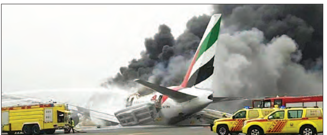
ရိုက်တာ။

အီမရိတ်လေကြောင်းပိုင် ခရီးသည်တင်လေယာဉ်တစ်စင်းသည် ဩဂုတ် ၃ ရက်က အာရပ်စော်ဘွားများပြည်ထောင်စု (ယူအေအီး) ခုတ်လှော်မှု နိုင်ငံ တကာလေဆိပ်သို့ အရေးပေါ်ဆင်းသက်စဉ် လေယာဉ်မီးလောင်မှုဖြစ်ပွားခဲ့ကြောင်း သိရသည်။ ခရီးသည်နှင့် လေယာဉ်ဝန်ထမ်း စုစုပေါင်း ၃၀၀ စလုံးမှာ မီးလောင်နေသော လေယာဉ်ကိုယ်ထည်မှ ထွက်ပြေးလွတ်မြောက်ခဲ့ကြောင်း အာဏာပိုင်များက ပြောကြားသည်။ လေယာဉ်ဦးပိုင်းဘက်မှ မီးခိုးများအူထွက်လာပုံကို ဗီဒီယိုမှတ်တမ်းတွင် တွေ့မြင်ရသည်။ လေယာဉ်မှာ ဝမ်းဗိုက်ဖြင့် လျှောဆင်းခဲ့ပုံရပြီး လေယာဉ်ပေါ် လိုက်ပါလာသူအားလုံးကို ဘေးကင်းရာသို့ ကယ်ထုတ်ပေးနိုင်ခဲ့ကြောင်း၊ ခရီးသည် ၂၇၅ ဦးနှင့် လေယာဉ်ဝန်ထမ်းများ လိုက်ပါလာခဲ့သော ဘိုးရင်း-၇၇၇ လေယာဉ်သည် အိန္ဒိယနိုင်ငံ ထရီပူရနီဒရမ်မြို့မှ ခုတ်လှော်မှုသို့ ပျံသန်းခဲ့ခြင်း ဖြစ်ကြောင်း အာဏာပိုင်များက ပြောကြားကြသည်။