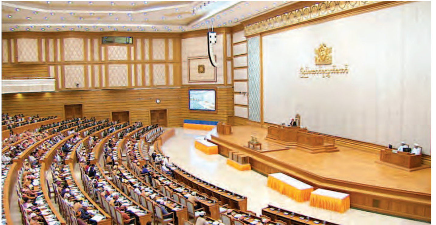
ဒုတိယအကြိမ် ပြည်ထောင်စုလွှတ်တော်ဒုတိယပုံမှန်အစည်းအဝေး တတိယနေ့ကျင်းပစဉ်။ (သတင်းစဉ်)

ဆက်လက်၍ ပြည်ထောင်စုဝန်ကြီး ဦးသိန်းဆွေက အတည်ပြုထားသည့် ပြဋ္ဌာန်းချက်များနှင့် စပ်လျဉ်းသည့် စာမျက်နှာ ၈ ကော်လံ ၁ သို့