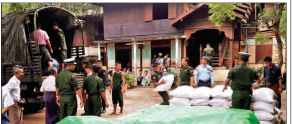
တပ်မတော်(ကြည်း၊ ရေ၊ လေ) မိသားစုများ လျှာဒါနသည့် ကယ်ဆယ်ရေးပစ္စည်း စားနပ်ရိက္ခာများကို တောင်ဘီ လယ်ယားကျေးရွာ ကမ္ဘာ့ဘုန်းတော်ကြီးကျောင်းသို့ ဩဂုတ် ၃ ရက်က ပို့ဆောင်လျှာဒါနစဉ်။ ရဲသူရအောင်(ညောင်ဦး)