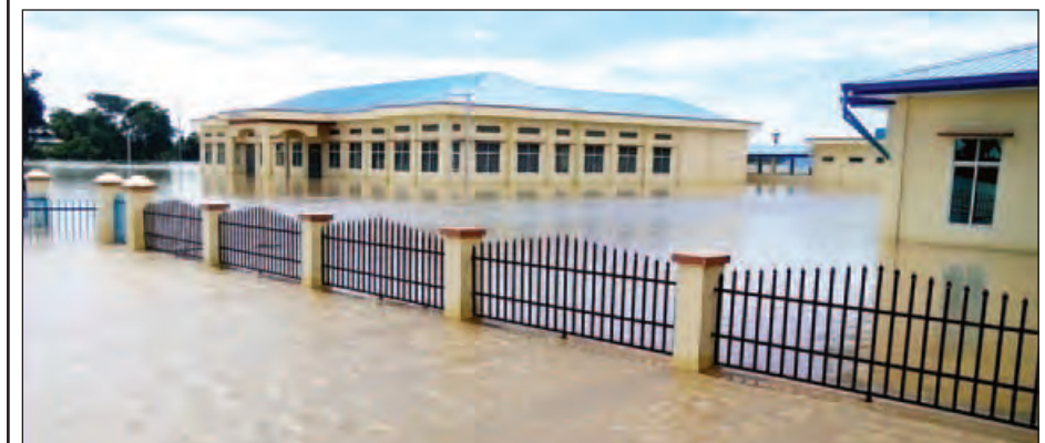
မကွေးတိုင်းဒေသကြီး ရေစကြိုမြို့နယ် မြေတော်ကျေးရွာရှိ မြေတော်တိုက်နယ်ဆေးရုံဝင်းအတွင်းသို့ ရေများ ဝင်ရောက်ကာ နစ်မြုပ်လျက်ရှိသည်ကို ဩဂုတ် ၂ ရက်က တွေ့ရစဉ်။

လျှာဒါနပေးအပ်ခဲ့သည်။ လူမှုဝန်ထမ်း၊ ကယ်ဆယ်ရေးနှင့် ပြန်လည်နေရာချ ထားရေးဝန်ကြီးဌာနအနေဖြင့် တိုင်းဒေသကြီးအသီးသီး တွင် လတ်တလောဖြစ်ပွားလျက်ရှိသည့် ရေဘေးသင့်ဒေသ များမှ ရေဘေးသင့်ပြည်သူများအတွက် ကယ်ဆယ်ရေး၊ ထောက်ပံ့ရေးလုပ်ငန်းများအား ဆောင်ရွက်ပေးလျက်ရှိ ကြောင်း သိရသည်။ (သတင်းစဉ်)