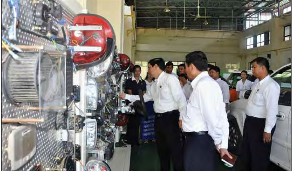
စက်မှုဝန်ကြီးဌာန ပြည်ထောင်စုဝန်ကြီး ဦးခင်မောင်ချို အမှတ်(၅) စက်မှုသင်တန်းကျောင်း(မကွေး)၌ ကြည့်ရှုစစ်ဆေးစဉ်။

စက်မှုဝန်ကြီးဌာန ပြည်ထောင်စုဝန်ကြီး ဦးခင်မောင်ချိုသည် ဇူလိုင် ၃၀ ရက်က မကွေးတိုင်းဒေသကြီး စက်မှုကြီးကြပ်ရေးနှင့် စစ်ဆေးရေးဦးစီးဌာနသို့ သွားရောက်ပြီး လျှပ်စစ်စစ်ဆေးရေး ဘိုင်းလားစစ်ဆေးရေးနှင့် စက်မှုလုပ်ငန်းများစစ်ဆေးရာတွင် အသုံးပြုသည့် အထောက်အကူပြုပစ္စည်းများကို ကြည့်ရှုစစ်ဆေး၍ လုပ်ငန်းလိုအပ်ချက်များကို မှာကြားခဲ့သည်။