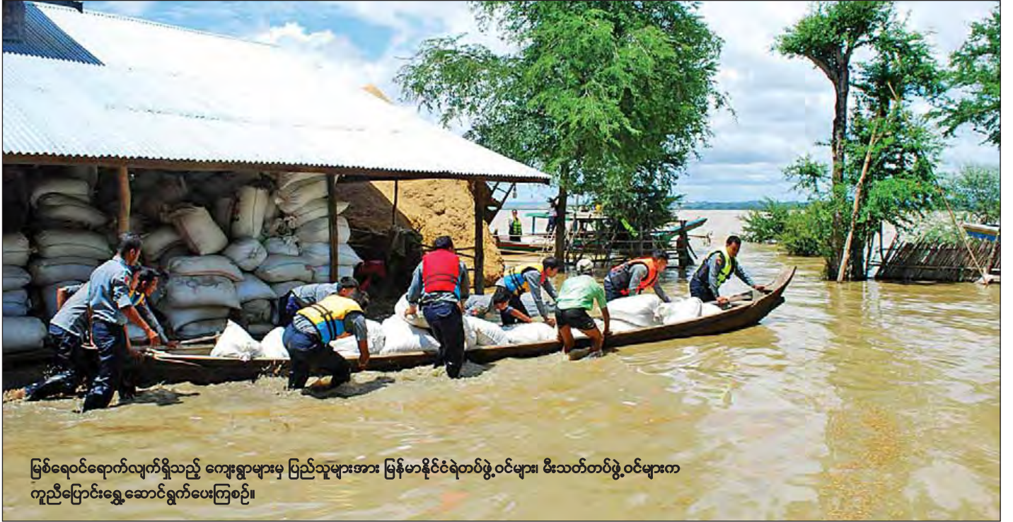
မြစ်ရေဝင်ရောက်လျက်ရှိသည့် ကျေးရွာများမှ ပြည်သူများအား မြန်မာနိုင်ငံရဲတပ်ဖွဲ့ဝင်များ၊ မီးသတ်တပ်ဖွဲ့ဝင်များက ကူညီပြောင်းရွှေ့ဆောင်ရွက်ပေးကြစဉ်။

ပွင့်ဖြူမြို့နယ် ရောဝတီမြစ်ကမ်းပါးအနီးကျေးရွာများသို့ ဇူလိုင် ၃၀ ရက်မှစ၍ မြစ်ရေများ ဝင်ရောက်လျက်ရှိရာ ဩဂုတ် ၂ ရက်တွင် ကူးကြီး၊ ကြီးကုန်း၊ ကွဲဒါ၊ သံကိုင်၊ သိမ်းကုန်း၊ ကျောင်းစု၊ ကံလှ၊ ပေါက်ကုန်း၊ ဇီးကျွန်း၊ ငှက်တောကုန်း၊ ကျွန်းကလေး၊ ဘီးဇပ်ခုံ၊ နန်းတော်ကျွန်း၊ ငါးခြောက်ကျွန်း(တ+မ)၊ ထူး၊ ဆည်မုန်း၊ ခုံစု၊ ရှားတော၊ ညောင်ကုန်း၊ ရွာသာညွန့်၊ ရှားတောညွန့်၊ အရှေ့လေးအိမ်၊ မြင်းခြံစုနှင့် ရေချမ်းစဉ်ကျေးရွာ စုစုပေါင်း ၂၅ ရွာသို့ မြစ်ရေဝင်ရောက်သဖြင့် ရေဘေးလွတ်ရာ ရောဝတီမြစ်အရှေ့ဘက်ကမ်းရှိရေနံချောင်းမြို့ သံကိုင်-ကုန်းစောင်းလမ်းဘေး၊ ဝဲ၊ ယာ၊ ကုန်းစောင်းကျေးရွာရှိ ရွှေကျောင်းဘုရားဝင်းအတွင်း၊ လယ်ကိုင်ကျေးရွာ၊ ဂါတ်ကုန်းကျေးရွာဘုန်းတော်ကြီးကျောင်းများသို့ ယာယီပြောင်းရွှေ့နေထိုင်လျက်ရှိသည်။ ရေဘေးရှောင်အိမ်ထောင်စုများရှိရာ နေရာများသို့ ဩဂုတ် ၁ ရက်က စာမျက်နှာ ၉ ကော်လံ ၅ သို့