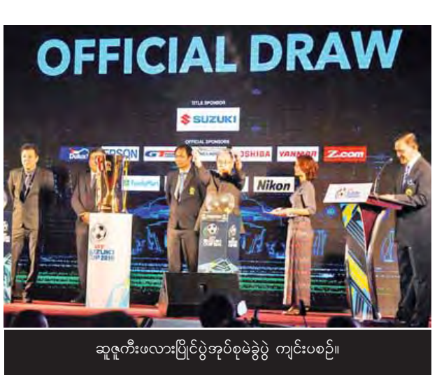
ဆူဇုကီးပလားပြိုင်ပွဲအုပ်စုမဲခွဲပွဲ ကျင်းပစဉ်။