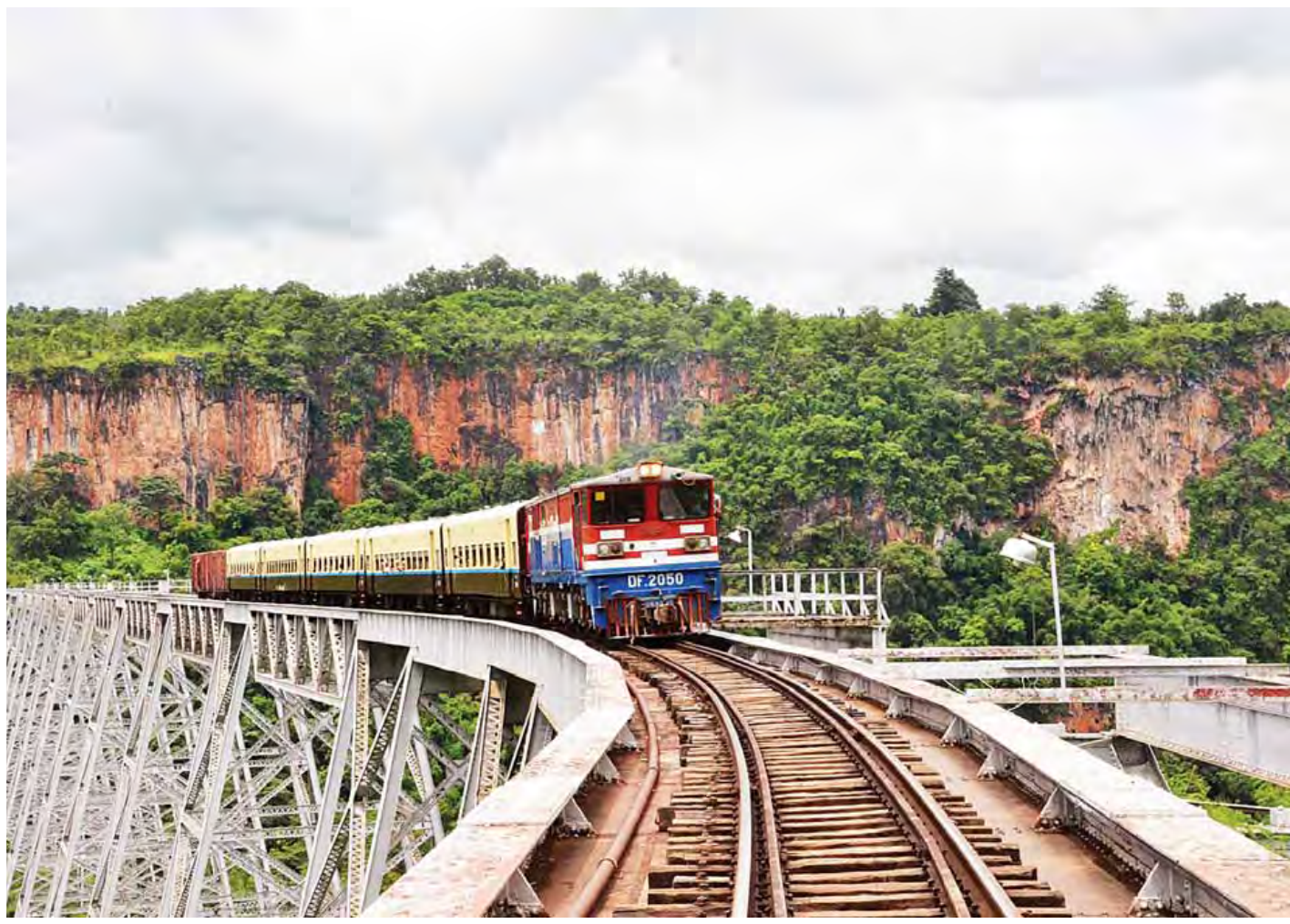
ရှမ်းပြည်နယ်(မြောက်ပိုင်း)နောင်ချိုမြို့ရှိ ကမ္ဘာကျော်ဂုတ်ထိပ်ဘူတာကြီးအား တွေ့ရစဉ်။

ရှမ်းပြည်နယ်(မြောက်ပိုင်း)နောင်ချိုမြို့ရှိ ကမ္ဘာကျော် ဂုတ်ထိပ်ဘူတာကြီးအား လာရောက်လည်ပတ်သည့် ပြည်တွင်း၊ ပြည်ပခရီးသည်များ အဆင်ပြေစေရန်အတွက် အပျော်စီးရထားများအား ဂုတ်ထိပ်ဘူတာတွင် အခြေပြု၍ ပြေးဆွဲပေးလိုကြောင်း တံတားကြီးသို့လာရောက် လည်ပတ် သည့်ခရီးသည်များထံမှ သိရသည်။