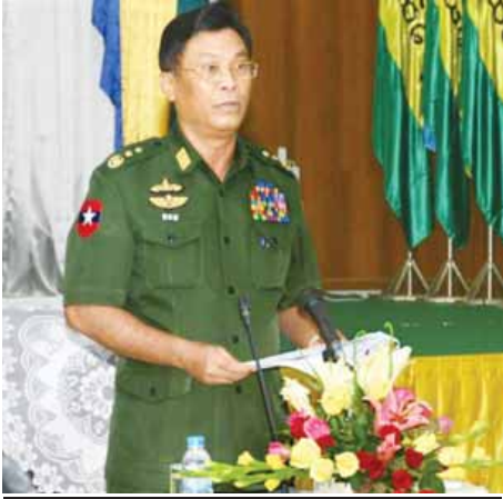
ပြည်ထောင်စုဝန်ကြီး ဒုတိယဗိုလ်ချုပ်ကြီးကျော်ဆွေ

မူးယစ်ဆေးဝါး တရားမဝင် သယ်ဆောင်ရောင်းဝယ်မှုများနှင့် အခြားပိုက်ဆံဖွဲ့ကုမှုလွန်ပွားမှုများအကြား ဆက်စပ်နေမှုမှာလည်း နိုင်ငံတစ်နိုင်ငံ၏ တည်ငြိမ်သည့် စီးပွားရေးကို လှိုက်စားစေသည့်အပြင် တည်ငြိမ်အေးချမ်းသာယာရေး၊ လုံခြုံရေး၊ အချုပ်အခြာအာဏာ တည်တံ့ခိုင်မြဲရေးတို့ကိုပါ ခြိမ်းခြောက်လျက်ရှိကြောင်းနှင့် ပြီးပြည့်စုံသော ဘက်ပေါင်းစုံ ချဉ်းကပ်မှုများပါဝင်သည့် မူးယစ်ဆေးဝါးထိန်းချုပ်ရေး မူဝါဒသစ်တစ်ရပ်ပေါ်ထွက်ရေး အမြန်ဆုံးဆောင်ရွက်ရမည်ဖြစ်ကြောင်း၊ မူးယစ်ဆေးဝါးနှင့် စိတ်ကိုပြောင်းလဲစေသော ဆေးဝါးများအန္တရာယ် တားဆီးကာကွယ်ရေးပဟိုအဖွဲ့(၂၀၁၆) အစည်းအဝေးတွင် ပြောကြားသည်။