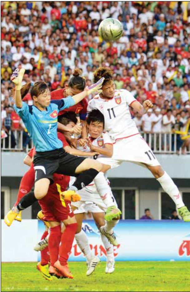
မြန်မာအသင်းနှင့် ဗီယက်နမ်အသင်းယှဉ်ပြိုင်နေစဉ်။

တတိယနေရာလုပွဲအဖြစ် ဩစတြေးလျ ယူ-၂၀ နှင့် အိမ်ရှင်မြန်မာ၊ ဗိုလ်လုပွဲအဖြစ် လက်ရှိချန်ပီယံထိုင်းနှင့် ဗီယက်နမ်အသင်းတို့ယှဉ်ပြိုင်ကစားမည်ဖြစ်ပြီး ဩဂုတ် ၄ ရက်တွင် မန္တလေးသီရိတွင်း၌ ကျင်းပမည်ဖြစ်သည်။ သတင်း-ရှိုင်းထက်ဇော်