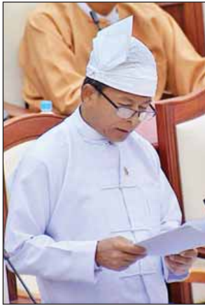
ဒုတိယဝန်ကြီး ဒေါက်တာထွန်းဝင်း

အုပ်စုခြောက်ခုမှ လက်ရှိလုပ်ကိုင်နေသည့် လယ်မြေ (၁၅၉၄)ဧကအပြင် အသစ် ပေါ်ထွက်လာမည့် စိုက်ဧက(၂၅၉၇) ဧက စုစုပေါင်းဧက (၄၂၀၀)ခန့်ကို ရေငန်ဘေးအန္တရာယ်မှ ကာကွယ်ပေးနိုင်မည်ဖြစ်ပြီး အထက်ပါလုပ်ငန်းများကို စုစမ်းလေ့လာ တိုင်းတာတွက်ချက်မှုအပေါ်မူတည်၍ ၂၀၁၇-၂၀၁၈ ဘဏ္ဍာ ရေးနှစ် ရခိုင်ပြည်နယ်အစိုးရ ရန်ပုံငွေထုတ်လျာထားပြီး ရန်ပုံငွေခွဲဝေရရှိမှု အပေါ်မူတည်၍ တည်ဆောက်ပေးနိုင်မည်ဖြစ်ပါကြောင်း ရှင်းလင်းဖြေကြား သည်။