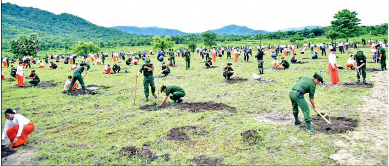
များ၏ ၂၀၁၆ ခုနှစ် ဒုတိယအကြိမ် မိုးရာသီသစ်ပင်စိုက်ပျိုးပွဲတွင် ရတနာတန်းဝင် ယနေ့စိုက်ပျိုးသည့် စိုက်ပျိုးပင် စုစုပေါင်း ၄၃၀၀၂၇ ပင်ဖြစ်ကြောင်း သတင်း ကျွန်းပင် ၅၀၀၀ ကို စိုက်ပျိုးပေးခဲ့သည်။ တပ်မတော်တစ်ရပ်လုံးအနေဖြင့် ရရှိသည်။ (မြဝတီ)

ကာကွယ်ရေးဦးစီးချုပ်ရုံး(ကြည်း၊ ရေ၊ လေ)မိသားစုများ၏ ရေဆင်းဆည် သဘာဝပတ်ဝန်းကျင်ထိန်းသိမ်းရေးအတွက် ဒုတိယအကြိမ်မိုးရာသီသစ်ပင် စိုက်ပျိုးပွဲအခမ်းအနားကို ယနေ့နံနက် ၇ နာရီတွင် နေပြည်တော် ဇေယျာသီရိ မြို့နယ် ရေဆင်းဆည်အနီး၌ကျင်းပရာ တပ်မတော်ကာကွယ်ရေးဦးစီးချုပ် ဗိုလ်ချုပ်မှူးကြီးမင်းအောင်လှိုင်နှင့် ဇနီး ဒေါ်ကြူကြူလှတို့ တက်ရောက် အားပေးပြီး အထိမ်းအမှတ်သစ်ပင်များကို စိုက်ပျိုးပေးသည်။ တပ်မတော်ကာကွယ်ရေးဦးစီးချုပ်က မိုးရာသီသစ်ပင်စိုက်ပျိုးပွဲ အထိမ်းအမှတ် ခရေပင်ကိုလည်းကောင်း၊ တပ်မတော်ကာကွယ်ရေးဦးစီးချုပ်၏ ဇနီးက ကံ့ကော်ပင်ကိုလည်းကောင်း စိုက်ပျိုးပေးပြီး ဒုတိယတပ်မတော်ကာကွယ်ရေး ဦးစီးချုပ် ကာကွယ်ရေးဦးစီးချုပ်(ကြည်း)နှင့် ဇနီး၊ ပြည်ထောင်စုဝန်ကြီးများနှင့် ဇနီးများ၊ ကာကွယ်ရေးဦးစီးချုပ်ရုံးမှ တပ်မတော်အရာရှိကြီးများနှင့် ဇနီးများ၊ အခမ်းအနားတက်ရောက်လာကြသူများက စိုက်ပျိုးပင်များကို သတ်မှတ်နေရာ အသီးသီးတွင် စိုက်ပျိုးကြသည်။ ထို့နောက် တပ်မတော်ကာကွယ်ရေးဦးစီးချုပ် ဗိုလ်ချုပ်မှူးကြီး မင်းအောင်လှိုင်နှင့် အဖွဲ့ဝင်များသည် အရာရှိ၊ စစ်သည်၊ မိသားစုများ စုပေါင်း သစ်ပင်စိုက်ပျိုးနေမှုကို လှည့်လည်ကြည့်ရှုအားပေးကြသည်။ ယနေ့ကျင်းပသော ကာကွယ်ရေးဦးစီးချုပ်ရုံး(ကြည်း၊ ရေ၊ လေ)မိသားစု