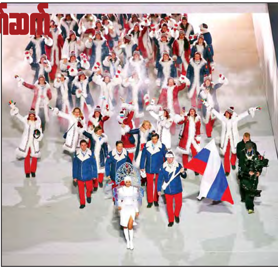
၂၀၁၄ ခုနှစ် ဆောင်းရာသီ ဆိုချီ အိုလံပစ်ပြိုင်ပွဲဝင် ရုရှားကိုယ်စားပြုအဖွဲ့ ချီတက်လာစဉ်။

ရုရှား ကစားသမားတွေက ၂၀၁၂ လန်ဒန်အိုလံပစ်နဲ့ ၂၀၁၄ ဆိုချီဆောင်းရာသီ အိုလံပစ်ပြိုင်ပွဲတွေမှာ တားမြစ်ဆေးသုံးစွဲမှု ပေါ်ပေါက်ခဲ့တာကြောင့် ကမ္ဘာ့တားမြစ်ဆေးသုံးစွဲမှု ဆန့်ကျင်ရေးအေဂျင်စီ(ဝါဒါ)က ရုရှားနိုင်ငံကို ရိုယိုအိုလံပစ်ပြိုင်ပွဲ ဝင်ရောက်ခွင့်ပိတ်ပင်ဖို့ ဇူလိုင် ၁၈ ရက်မှာ တောင်းဆိုခဲ့ပါတယ်။ အိုလံပစ်ကော်မတီ (အိုင်အိုစီ)ကတော့ ပြိုင်ပွဲဝင် ရုရှားကစားသမားတွေ အားလုံး အနေနဲ့ ပြိုင်ပွဲမဝင်ခင် ဆေးအစစ်ခံရမှာ ဖြစ်ပေမယ့် အိုလံပစ်ပြိုင်ပွဲဝင်ခွင့်ကို ပိတ်ပင်သွားမှာ မဟုတ်ဘူးလို့ ဇူလိုင် ၂၄ ရက်မှာ ဆုံးဖြတ်ချက်ချခဲ့ပါတယ်။ ဇူလိုင် ၂၆ ရက်မှာတော့ ရုရှားကစားသမား ၈၆ ဦးကို ပြိုင်ပွဲဝင်ရောက်ယှဉ်ပြိုင်ခွင့်ကနေ ပိတ်ပင်ခဲ့ပြီး ဒီထဲက ကစားသမား ၆၇ ဦးဟာ ယခင်တားမြစ်ဆေး သုံးစွဲတယ်ဆိုတဲ့ စွဲချက်ပြီးကတည်းက ပြိုင်ပွဲဝင်ခွင့်ပိတ်ပင်ခံထားရတဲ့ ကစားသမားတွေ ဖြစ်ပါတယ်။ ရုရှားသမ္မတ ဗလာဒီမာ