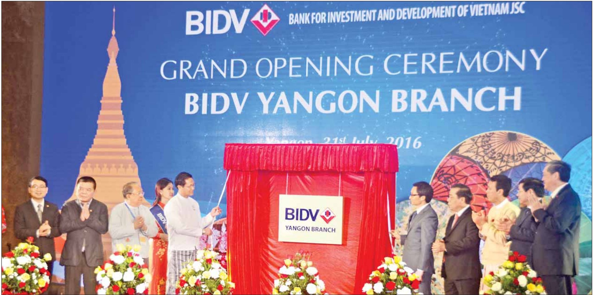
ဒုတိယသမ္မတ ဦးဟင်နရီဗန်ထီးယူနှင့် ဗီယက်နမ်နိုင်ငံ ဒုတိယဝန်ကြီးချုပ်တို့ BIDV ရန်ကုန်ခွဲဆိုင်ခွဲဆိုင်ဘုတ်ကို စက်ခလုတ်နှိပ်၍ဖွင့်လှစ်ပေးကြစဉ်။ (သတင်းစဉ်)

မိတ်ဆွေဟူသည် မိတ်ဆွေကောင်း၊ မိတ်ဆွေညွှန်ဟူ၍ နှစ်မျိုးရှိရာ မိတ်ဆွေကောင်းတို့ကို ပေါင်းသင်းဆက်ဆံဆည်းကပ်ရာ၏။ ထိုမိတ်ဆွေကောင်းတို့အား ပေါင်းသင်းဆက်ဆံဆည်းကပ်ခြင်းဖြင့် မိမိအတွက် အကျိုးများရာ၏။ မိတ်ဆွေကောင်းအပေါ် ယုတ်ညံ့သောစိတ်ဖြင့် မပြစ်မှားရာ။ ပဏ္ဍိတဝဂ်(ဓမ္မပဒ-၇၈)