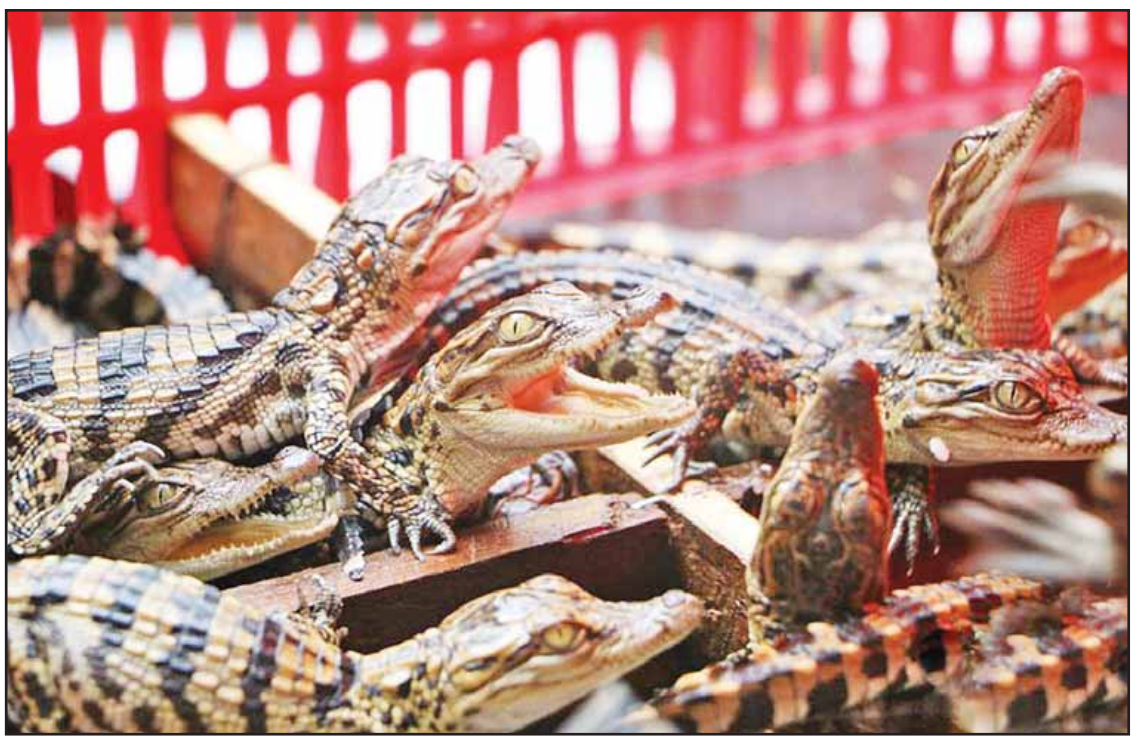
ဖမ်းဆီးရမိသော ဆီးရားမီးစီးမျိုးနွယ်စု မိကျောင်းသားပေါက်များအား တွေ့ရစဉ်။

နန်နင်း ဇူလိုင် ၃၁ တရုတ်နိုင်ငံ ကွမ်ရှီးကျွန်းကိုယ်ပိုင်အုပ်ချုပ်ခွင့်ရဒေသရှိ နယ်စပ်ရဲအရာရှိများက နိုင်ငံအတွင်း တားမြစ်ထားသည့် ဆီးရားမီးစီးမျိုးနွယ်စု မိကျောင်းသားပေါက်ကောင်ရေ ၃၉၉ ကောင်ကို ဖမ်းဆီးရမိခဲ့ကြောင်း ဆင်ယူသတင်းတစ်ရပ်အရသိရသည်။ ဇူလိုင် ၂၉ ရက်က နယ်စပ်ရဲအရာရှိများက အိမ်ထောင်စုလူဦးရေစာရင်းများ လိုက်လံကောက်ယူနေစဉ် သုံးယင်မြို့ရှိ လူနေအိမ်တစ်အိမ်တွင် အဆိုပါ မိကျောင်းသားပေါက်များကို ဖမ်းဆီးရမိခဲ့ခြင်းဖြစ်သည်။