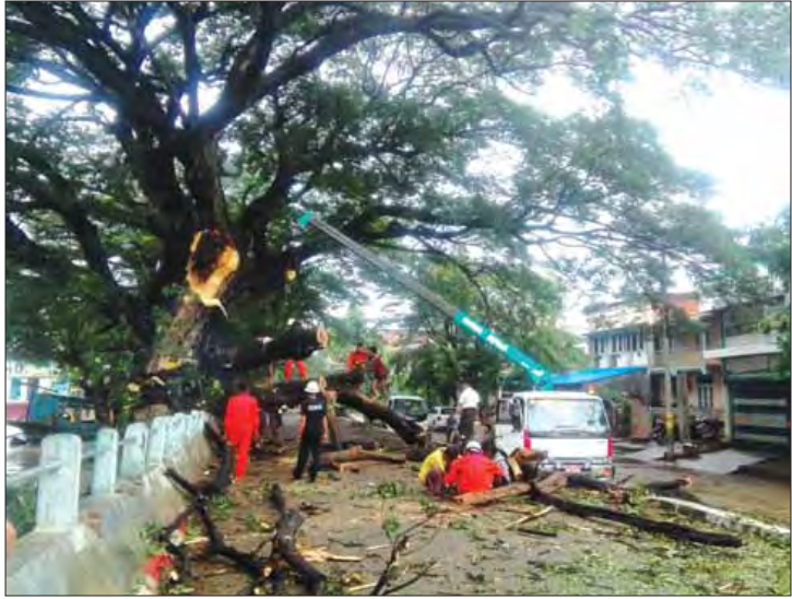
မုံရွာ ဧရာဝတီ ဝှမ်းပျက်ရောဂါ ကာကွယ်တားဆီးရေး အတွက် ကျောက်ကြီး မြို့နယ် စည်ပင်သာယာရေးအဖွဲ့ ဝှမ်းပျက်ရောဂါ ကာကွယ်တားဆီးရေးအဖွဲ့ဝင်များက မိုးသည်းထန်စွာရွာသွန်းမှုကြောင့် ပြိုလဲနေသည့် သစ်ပင် သစ်ကိုင်းကြီးများကို စုပေါင်းရှင်းလင်းခဲ့ကြောင်း ဖော်ပြရပါသည်။