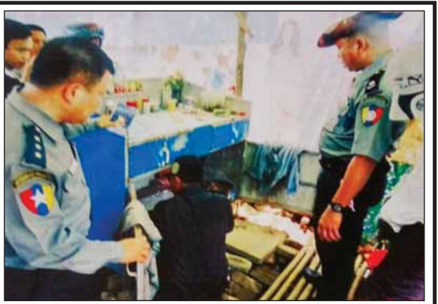
အသုပင်ဆိုင်နှင့်ကွမ်းယာဆိုင်များကို မူးယစ်ဆေးဝါးနှင့်စိတ်ကိုပြောင်းလဲစေသောဆေးဝါးများ ရောင်းချခြင်း ရှိ မရှိ ရှောင်တခင်ဝင်ရောက်စစ်ဆေးစဉ်။ (၄၉၃)

ပဲခူးတိုင်းဒေသကြီး(အနောက်ပိုင်း) ပြည်ခရိုင်