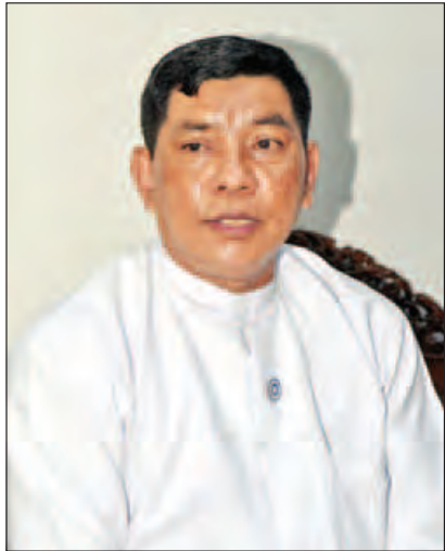
အလုပ်သမား၊ လူဝင်မှုကြီးကြပ်ရေး နှင့် ပြည်သူ့အင်အား ဝန်ကြီးဌာန အမြဲတမ်းအတွင်းဝန် ဦးမျိုးအောင်။

ဖြေ။ ။ အလုပ်သမားတွေရဲ့ နိုင်ငံသားစိစစ်မှုကိစ္စရပ်တွေကို ပြုလုပ်ပြီး