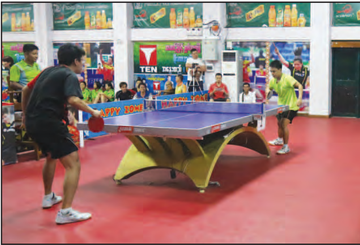
မြန်မာ-တရုတ်(တိုင်ပေ)နှစ်နိုင်ငံချစ်ကြည်ရေး စားပွဲတင်တန်းနှစ်ပြိုင်ပွဲကျင်းပ