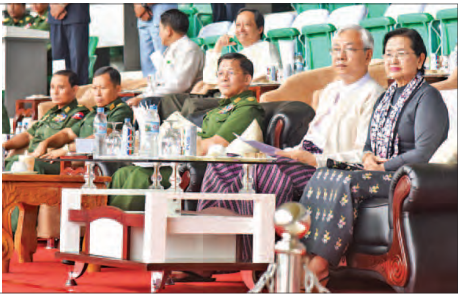
၂၀၁၆ ခုနှစ် ဝန်ကြီးဌာနပေါင်းစုံ အမျိုးသားဘောလုံးပြိုင်ပွဲ ပိုလ်လုပွဲအား နိုင်ငံတော်သမ္မတ ဦးထင်ကျော် ကြည့်ရှုအားပေးစဉ်။ (သတင်းစဉ်)

ပြိုင်ပွဲတွင် ကာကွယ်ရေးဝန်ကြီးဌာနအသင်းက စီမံကိန်းနှင့်ဘဏ္ဍာရေးဝန်ကြီးဌာနအသင်းကို လေးရိုး-တစ်ရိုးဖြင့် အနိုင်ရပိုင်ပွဲသွားသည်။ ထို့နောက် ဆုပေးပွဲကိုကျင်းပရာ အကောင်းဆုံး ရိုးသမားဆုကို ကာကွယ်ရေးဝန်ကြီးဌာနအသင်းမှ ထူးကိုကလည်းကောင်း၊ အကောင်းဆုံးနောက်တန်းဆုကို ပြန်ကြားရေးဝန်ကြီးဌာနအသင်းမှ ဇင်ဘိုမင်းကလည်းကောင်း၊ အကောင်းဆုံးအလယ်တန်းဆုကို ကာကွယ်ရေးဝန်ကြီးဌာန