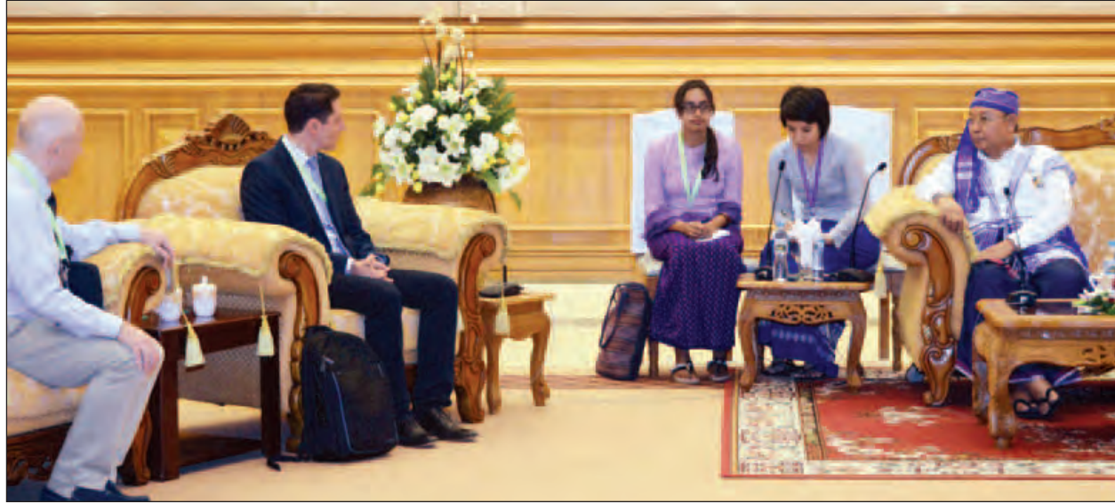
နေပြည်တော် ဇူလိုင် ၂၈

ပြည်ထောင်စုလွှတ်တော်နာယက၊ အမျိုးသားလွှတ်တော်ဥက္ကဋ္ဌ မန်းဝင်းခိုင်သန်းသည် ရန်ကုန်မြို့၊ ဥရောပသမဂ္ဂရုံးမှ Acting Head of Cooperation, Mr. George Dura နှင့်အဖွဲ့အား ယနေ့မနက် ၂ နာရီတွင် နေပြည်တော်ရှိ အမျိုးသားလွှတ်တော် ဧည့်ခန်းမဆောင်၌ လက်ခံတွေ့ဆုံသည်။ (အပေါ်ပုံ) တွေ့ဆုံစဉ် လွှတ်တော်ကိုယ်စားလှယ်များနှင့် လွှတ်တော်ရုံးဝန်ထမ်းများ