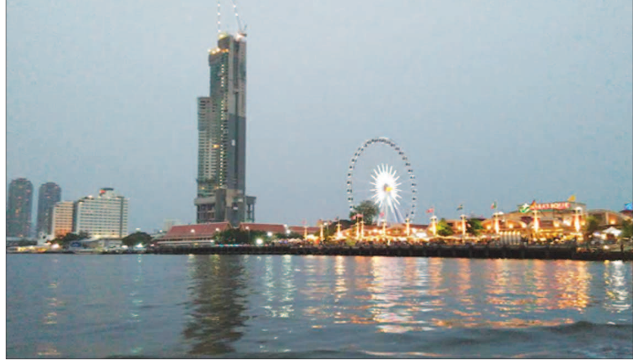
မြန်မာခရီးသွားများ သွားရောက်လည်ပတ်လေ့ရှိသော ထိုင်းနိုင်ငံ ဗန်ကောက်မြို့မှ ကျောက်ဖရားမြစ် အလှမြင်ကွင်း။