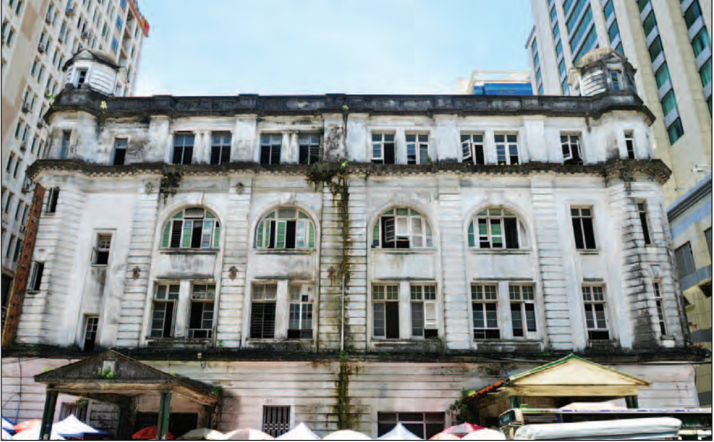
အမျိုးသားစာကြည့်တိုက်(ရန်ကုန်) ပြောင်းရွှေ့ဖွင့်လှစ်မည့် ရန်ကုန်မြို့ ပန်းဘဲတန်းမြို့နယ် အမှတ်(၆၀၄/ ၆၀၈)ကုန်သည်လမ်းရှိ အဆောက်အအုံကို လက်ရှိအခြေအနေအတိုင်း တွေ့ရစဉ်။