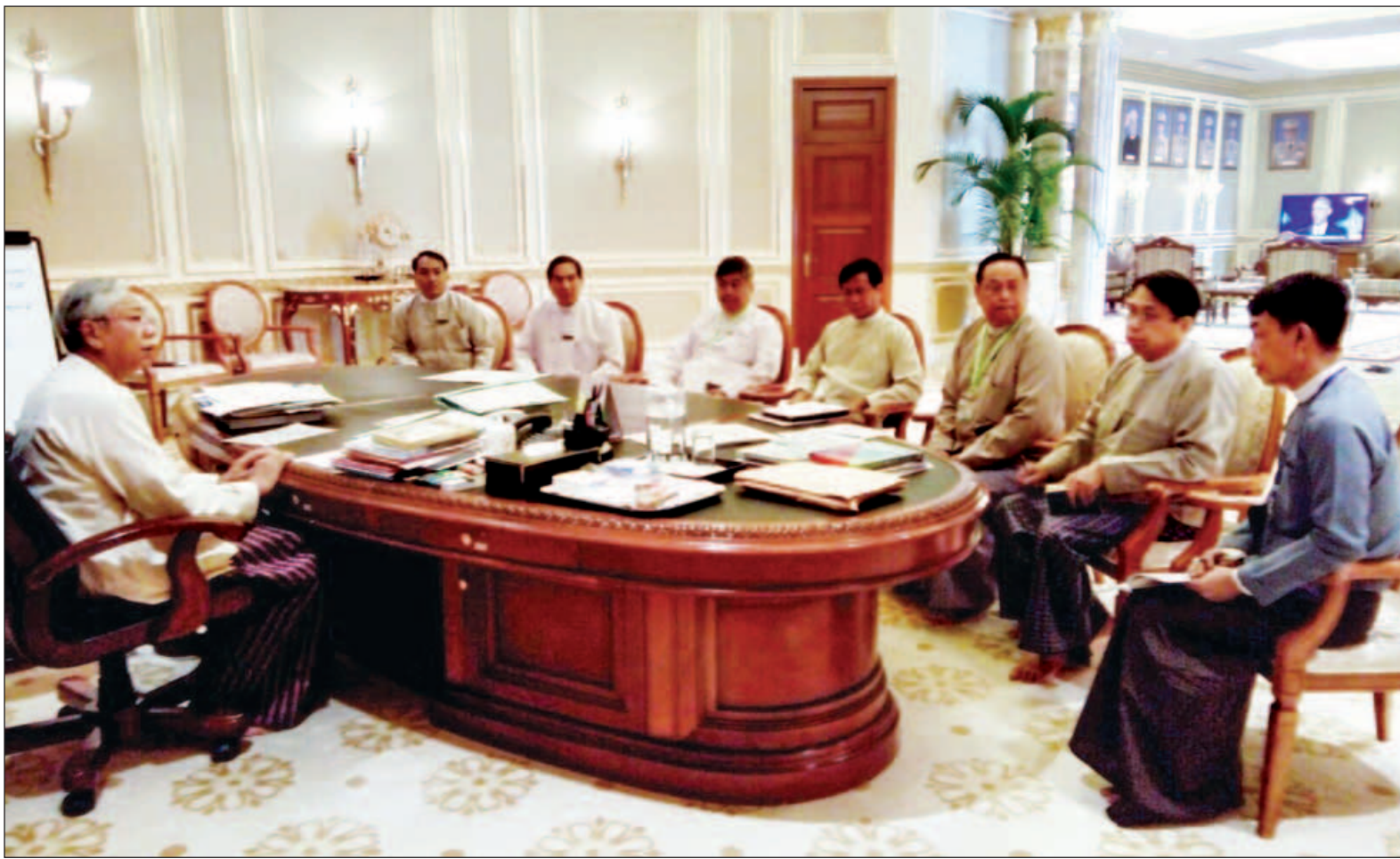
အမျိုးသားစာကြည့်တိုက် (ရန်ကုန်)ကို ရန်ကုန်မြို့လယ်ကောင်သို့ပြောင်းရွှေ့ဖွင့်လှစ်ရေး ညှိနှိုင်းအစည်းအဝေး ကျင်းပစဉ်။ (သတင်းစဉ်)

နေပြည်တော် ဇူလိုင် ၂၈ အမျိုးသားစာကြည့်တိုက် (ရန်ကုန်) ကို ရန်ကုန်မြို့လယ်ကောင်ရှိ ပြည်သူများ အလွယ်တကူ ဝင်ထွက် သွားလာနိုင်သည့်နေရာသို့ ပြောင်း ရွှေ့ဖွင့်လှစ်ရေးနှင့် စပ်လျဉ်းသည့် ညှိနှိုင်းအစည်းအဝေးကို ယနေ့ နံနက်ပိုင်းတွင် နိုင်ငံတော်သမ္မတ အိမ်တော်၌ ကျင်းပသည်။ အစည်းအဝေးသို့ နိုင်ငံတော် သမ္မတ ဦးထင်ကျော်၊ ဒုတိယသမ္မတ ဦးဟင်နရီဗန်ထီးယူ၊ ပြန်ကြားရေး ဝန်ကြီးဌာန ပြည်ထောင်စုဝန်ကြီး ဒေါက်တာဖေမြင့်၊ လျှပ်စစ်နှင့် စွမ်းအင်ဝန်ကြီးဌာန ပြည်ထောင်စု ဝန်ကြီး ဦးဖေဇင်ထွန်း၊ ဆောက်လုပ် ရေးဝန်ကြီးဌာန ပြည်ထောင်စုဝန်ကြီး ဦးဝင်းခိုင်၊ သာသနာရေးနှင့် ယဉ်ကျေးမှုဝန်ကြီးဌာန၊ အနုပညာ ဦးစီးဌာန ညွှန်ကြားရေးမှူးချုပ် ဦးထွန်းအံ့၊ နိုင်ငံတော်သမ္မတရုံး ခေတ္တညွှန်ကြားရေးမှူးချုပ် ဦးဝင်း ကျော်အောင်နှင့် သမ္မတဦးစီးရုံးမှ ဒုတိယညွှန်ကြားရေးမှူးချုပ် ဦးခင်လတ် တို့ တက်ရောက်ကြသည်။ အစည်းအဝေးတွင် ရန်ကုန်မြို့ ရန်ကင်းမြို့နယ် ကမ္ဘာ့အေးစေတီ လမ်းမကြီး သီရိမင်္ဂလာရိပ်သာလမ်း အမှတ် ၈၅ (က) တွင် ဖွင့်လှစ်ထား စာမျက်နှာ ၈ ကော်လံ ၁ သို့ □