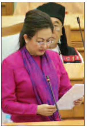
ဒေါက်တာဒေါ်သက်သက်ခိုင်

ထိရောက်သည့် အခွန်ကောက်ခံမှုတစ်ရပ် အကောင်အထည်ဖော်နိုင်မည်ဖြစ်ပါကြောင်း ဆွေးနွေးပြောကြားသည်။ ဆွေးနွေးချက်များနှင့်စပ်လျဉ်း၍ စီမံကိန်းနှင့် ဘဏ္ဍာရေးဝန်ကြီးဌာန ဒုတိယဝန်ကြီး ဦးမောင်မောင်ဝင်းက ၂၀၁၅-၂၀၁၆ ဘဏ္ဍာနှစ်တစ်နှစ်လုံးကို ပြန်ကြည့်မည်ဆိုပါက လျာထားချက် ၁၃၃၅ ဒသမ ၄၄၄ ဘီလီယံအပေါ်တွင် ၁၃၂၇ ဒသမ ၃၃၉