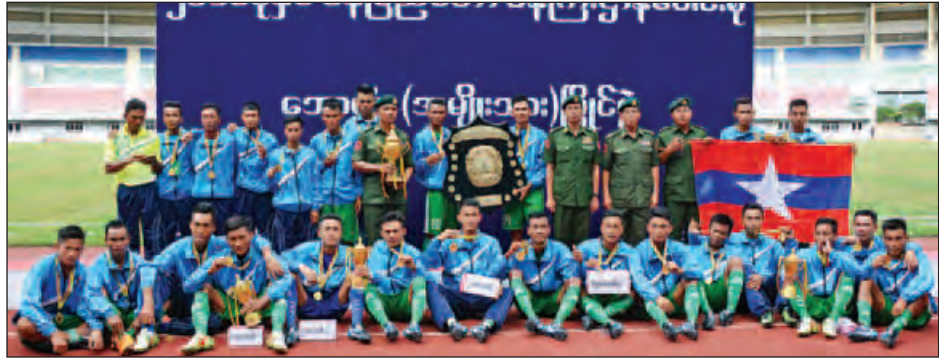
ပထမဆုရရှိသည့် ကာကွယ်ရေးဝန်ကြီးဌာနအသင်းအား တံခွန်စိုက်ခိုင်းဆုနှင့်အတူ တွေ့ရစဉ်။(သတင်းစဉ်)

ချထားရေး ဝန်ကြီးဌာနအသင်းအား ဒေါက်တာမြင့်ထွေးကလည်းကောင်း ပေးအပ်ချီးမြှင့်ကြသည်။ ဒေါက်တာ ဘောလုံးပိုလ်လုပွဲနှင့် ဆုချီးမြှင့်ပွဲ အခမ်းအနားသို့ နိုင်ငံတော်သမ္မတ၏ ဇနီးဒေါ်စုစုလွင်၊ တပ်မတော်ကာကွယ် ရေးဦးစီးချုပ် ပိုလ်ချုပ်မှူးကြီး မင်းအောင်လှိုင်၊ ဒုတိယတပ်မတော် ကာကွယ်ရေးဦးစီးချုပ် ကာကွယ်ရေး ဦးစီးချုပ် (ကြည်း) ဒုတိယပိုလ်ချုပ်မှူး ကြီးစိုးဝင်း၊ ပြည်ထောင်စုဝန်ကြီးများ၊ တပ်မတော်အရာရှိကြီးများ၊ ဝန်ထမ်း မိသားစုများနှင့် အားကစားဝါသနာရှင် များ တက်ရောက်အားပေးကြသည်။ (သတင်းစဉ်)