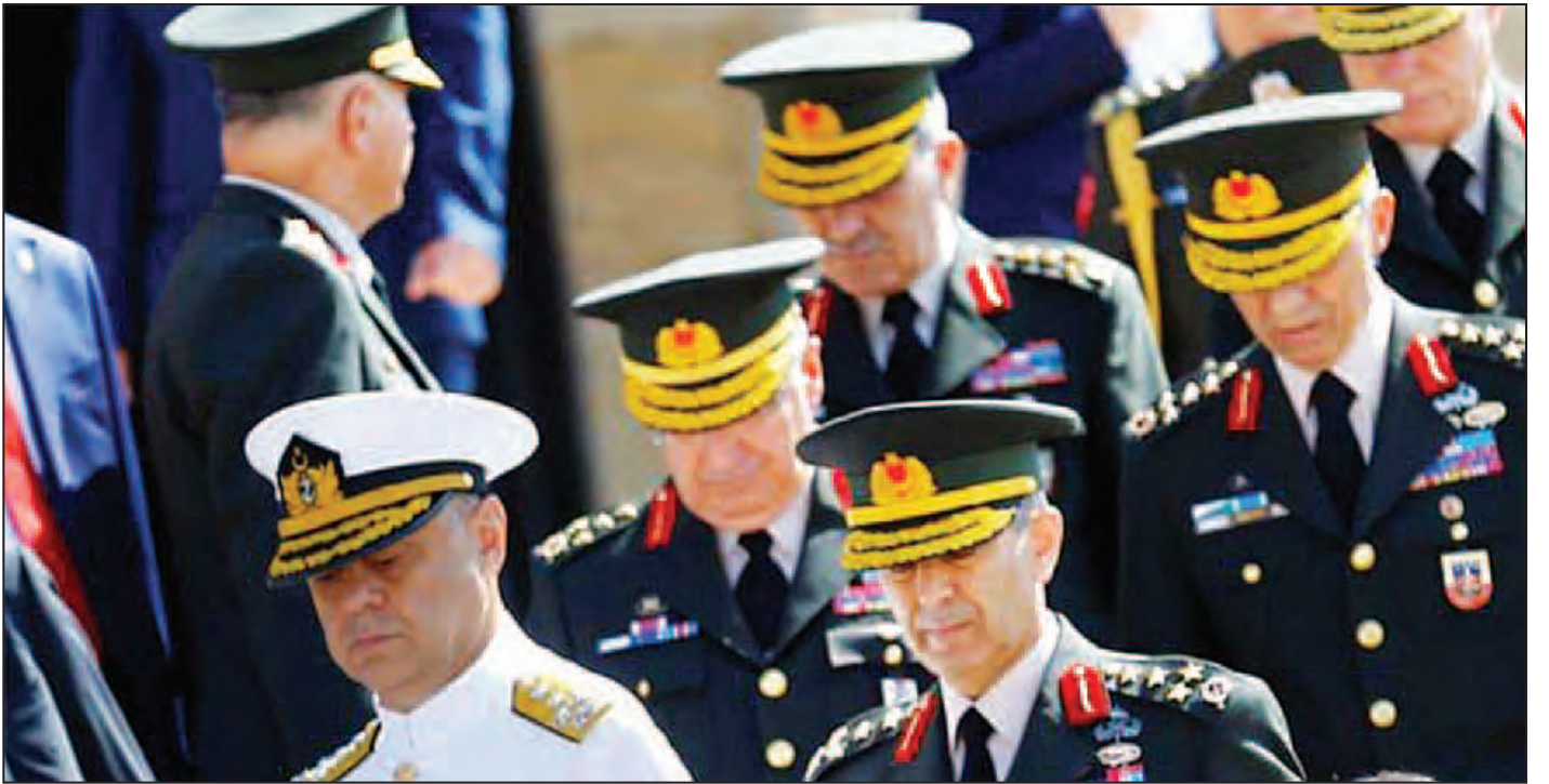
ယခုအချိန်ထိ တပ်ဖွဲ့ဝင် ၁၀၀၁၂ ဦးခန့်ကို ထိန်းသိမ်းထားပြီး စုံစမ်းစစ်ဆေးမှုများ ပြုလုပ်လျက်ရှိသည်။ တူရကီနိုင်ငံအနေဖြင့် ဘာသာရေးခေါင်းဆောင် ချနေထိုင်လျက်ရှိသည့် အမေရိကန်ပြည်ထောင်စုကို ဖိသုလာဟစ်ကို ပြန်လည်ပေးအပ်ရန် ၎င်းအခြေအပြင်းအထန် တောင်းဆိုထားသည်။ ဆင်ဟွာ။

အာဏာသိမ်းပိုက်မှုနှင့်ပတ်သက်ပြီး ဗိုလ်ချုပ်ကြီး နှစ်ဦးက စစ်ဦးစီးအရာရှိ ရာထူးမှထုတ်ပယ်ရန် ယနေ့ အဆိုပြုခဲ့သည်။ ရေတပ်ဗိုလ်ချုပ်ကြီးနှင့် ဗိုလ်ချုပ်ကြီး ၁၄၉ ဦးအပါအဝင် စစ်ဘက်အဖွဲ့ဝင် ၁၆၈၄ ဦးခန့်ကို ရာထူးမှ ထုတ်ပယ်ခွင့်ပြုခဲ့ကြောင်း ဒေသန္တရမီဒီယာများအရ သိရသည်။ အဆိုပါနုတ်ထွက်သွားသည့် စစ်ဘက်အဖွဲ့ဝင်များသည် မွတ်စလင်ဘာသာရေး ခေါင်းဆောင် ဖိသုလာဟစ်ကို သစ္စာခံသူများဖြစ်ကြောင်း အာဏာပိုင်များကဆိုသည်။