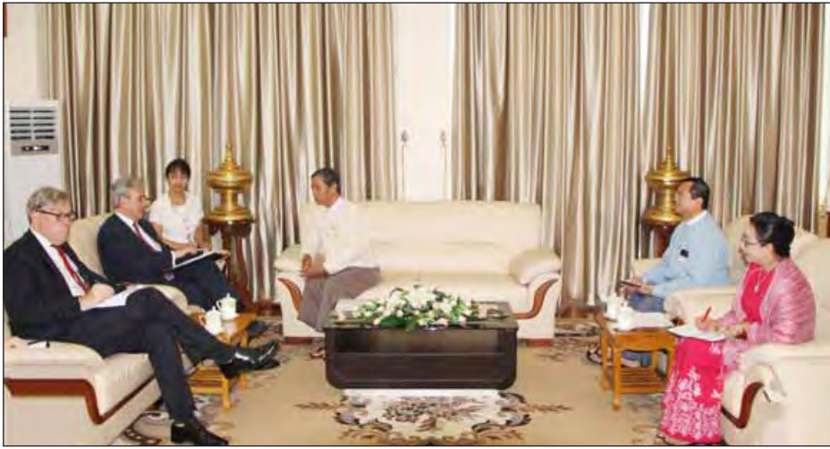
ရပ်များနှင့် စပ်လျဉ်း၍ ဆွေးနွေး ကြသည်။ ဆက်လက်၍ ဧရာဟင်္သာကုမ္ပဏီ လီမိတက် ဂျပန်နိုင်ငံ မာရူဘီနီကော်ပို ရေးရှင်း၊ ပြင်သစ်နိုင်ငံ EDF တို့မှ တာဝန်ရှိပုဂ္ဂိုလ်များအား မွန်းတည့် ၁၂ နာရီတွင် တွေ့ဆုံ၍ လှုပ်စစ်နှင့် စွမ်းအင်ဝန်ကြီးဌာနနှင့် ပူးပေါင်း ဆောင်ရွက်မည့် ရေအားလျှပ်စစ် စီမံကိန်းနှင့် စပ်လျဉ်း၍ ဆွေးနွေးကြ ကြောင်း သိရသည်။ (သတင်းစဉ်)

နေပြည်တော် ဇူလိုင် ၂၈ စီမံကိန်းနှင့် ဘဏ္ဍာရေးဝန်ကြီးဌာန ပြည်ထောင်စုဝန်ကြီး ဦးကျော်ဝင်း သည် ဗြိတိန်နိုင်ငံ ဝန်ကြီးချုပ်၏ မြန်မာ၊ ထိုင်းနှင့် ဘရူနိုင်းနိုင်ငံတို့၏ ကုန်သွယ်ရေးဆိုင်ရာ အထူးကိုယ်စား လှယ် Mr. Mark Garnier နှင့် အဖွဲ့ အား ဇူလိုင် ၂၇ ရက် နံနက် ၁၁ နာရီ တွင် စီမံကိန်းနှင့် ဘဏ္ဍာရေးဝန်ကြီး ဌာန ရုံးအမှတ် (၂၆) ၌ တွေ့ဆုံသည်။ ထိုသို့ တွေ့ဆုံရာတွင် ဗြိတိန်နှင့် မြန်မာနိုင်ငံအကြား ကုန်သွယ်ရေး နှင့် ရင်းနှီးမြှုပ်နှံမှု တိုးမြှင့်ရေးကိစ္စရပ် များ၊ ဘက်လုပ်ငန်းနှင့် အာမခံလုပ်ငန်း ဖွံ့ဖြိုးတိုးတက်ရေးဆိုင်ရာ ပူးပေါင်း ဆောင်ရွက်မည့်ကိစ္စများ၊ အခွန် ကောက်ခံမှုဆိုင်ရာ နည်းစနစ်များ တွင် အတွေ့အကြုံဖလှယ်ရေးကိစ္စ