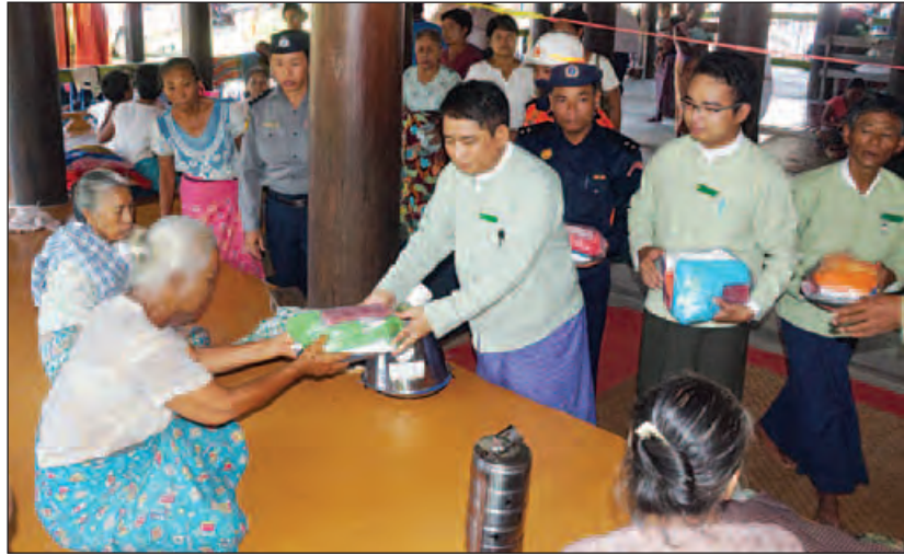
များအား ပေးအပ်လျှင်အားဖြင့် ထီးချိုင့်မြို့နယ် လုပ်ငန်းများဆောင်ရွက်နေမှုကို ကြည့်ရှုအားပေးခဲ့ အတွင်း ရေမြုပ်ကျေးရွာများတွင် ကယ်ဆယ်ရေး ကြောင်း သိရသည်။ (ဇွဲမာန်-ထီးချိုင့်)

ထီးချိုင့် ဇူလိုင် ၂၈ ကသာခရိုင် စီမံခန့်ခွဲမှုကော်မတီဥက္ကဋ္ဌ ဦးခင်မောင်စိုးနှင့်အဖွဲ့သည်ဇူလိုင် ၂၈ ရက် နံနက် ၉ နာရီက ထီးချိုင့်မြို့ အမှတ်(၄)ရပ်ကွက်အတွင်းမှ ရေဘေးရှောင်ပြည်သူ ၂၈၅ ဦးအား လက်ခံထား ရှိသော ရွှေစည်းခုံကျောင်းတိုက်နှင့် ကျောက်စေတီ ကျောင်းတိုက်များသို့သွားရောက်ပြီး ဆရာတော်ကြီး များ၏ ဩဝါဒခံယူကာရေဘေးရှောင်ပြည်သူများ အတွက် ဆောင်ရွက်ပေးရန်လိုအပ်သည့် သန့်ရှင်း သည့် သောက်သုံးရေရရှိရေး ကျန်းမာရေးစောင့် ရှောက်မှုပေးနိုင်ရေး၊ ကျန်းမာရေးနှင့်ညီညွတ်သည့် ပတ်ဝန်းကျင်ဖြစ်စေရေးတို့ကို မြို့နယ်အဆင့်ဌာန ဆိုင်ရာများနှင့် တွေ့ဆုံညှိနှိုင်းခဲ့သည်။ ထို့နောက် လူမှုဝန်ထမ်းကယ်ဆယ်ရေးနှင့် ပြန်လည်နေရာချထားရေးဦးစီးဌာနမှပေးပို့သော ပုဆိုး၊ လုံချည်၊ အင်္ကျီ၊ တဘက်၊ ဆပ်ပြာနှင့် ထောက်ပံ့ပစ္စည်းများကို ရေဘေးရှောင်အိမ်ထောင်စု