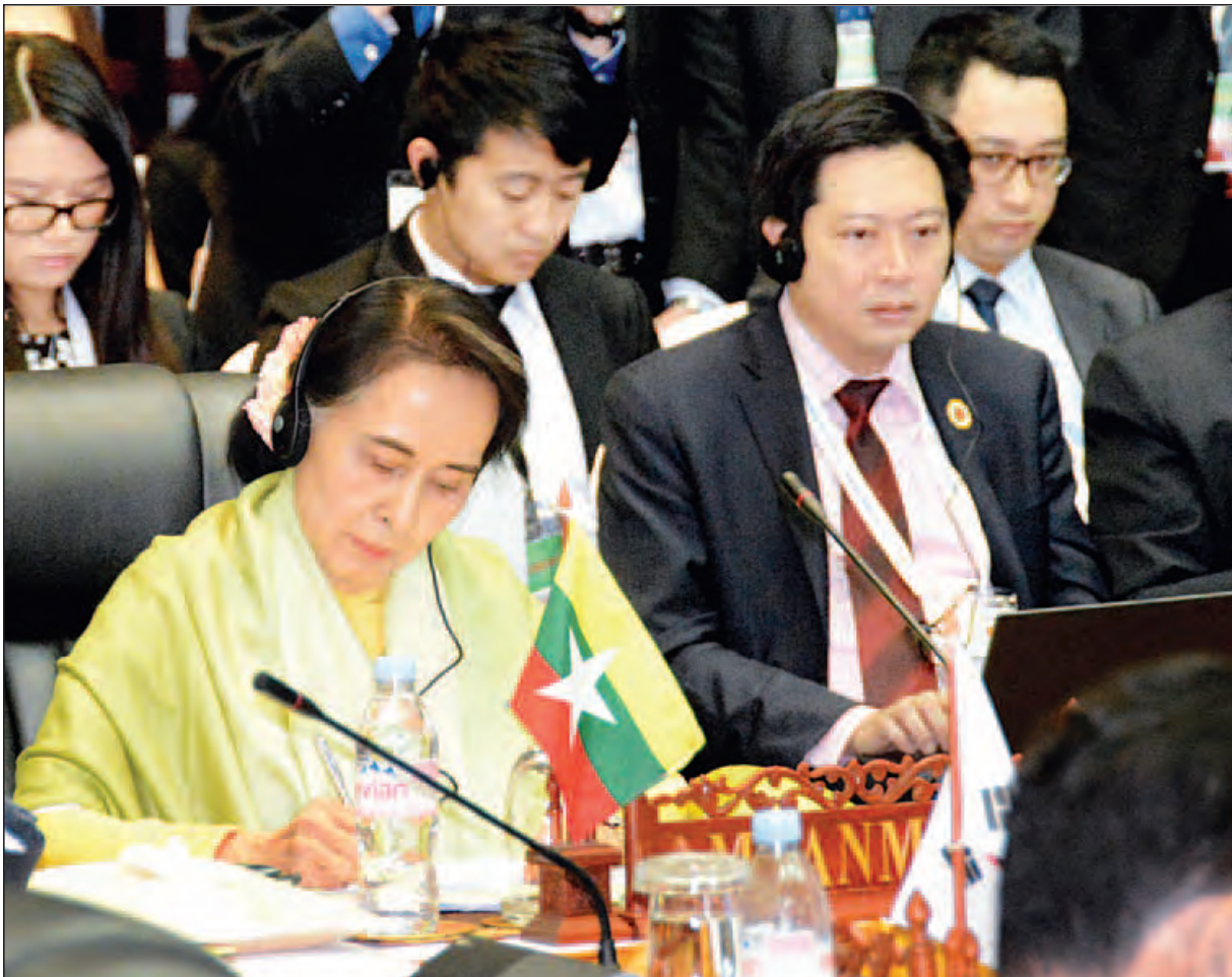
ဗီယက်ကျန်း ဇူလိုင် ၂၆

(၄၉) ကြိမ်မြောက် အာဆီယံနိုင်ငံခြားရေးဝန်ကြီးများအစည်းအဝေး၏ ဆက်စပ် အစည်းအဝေးများဖြစ်သည့် (၁၇) ကြိမ်မြောက် အာဆီယံ+၃ နိုင်ငံခြားရေး ဝန်ကြီးများ အစည်းအဝေး၊ (၆)ကြိမ်မြောက် အရှေ့အာရှထိပ်သီးအစည်းအဝေး ဆိုင်ရာ နိုင်ငံခြားရေးဝန်ကြီးများ အစည်းအဝေး၊ (၂၃) ကြိမ်မြောက် အာဆီယံ ဒေသဆိုင်ရာဖိုရမ် သီးသန့်အစည်းအဝေးနှင့် (၂၃) ကြိမ်မြောက် အာဆီယံ ဒေသဆိုင်ရာ မျက်နှာစုံညီအစည်းအဝေးတို့ကို ယနေ့နံနက်ပိုင်းနှင့် မွန်းလွဲပိုင်း တို့တွင် လာအိုနိုင်ငံ ဗီယက်ကျန်းမြို့၌ ကျင်းပရာ နိုင်ငံခြားရေးဝန်ကြီးဌာန ပြည်ထောင်စုဝန်ကြီး ဒေါ်အောင်ဆန်းစုကြည် တက်ရောက်ဆွေးနွေးသည်။