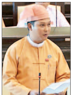
ဦးဥက္ကဋ္ဌမင်း

ဒုတိယအကြိမ် အမျိုးသားလွှတ်တော် ဒုတိယပုံမှန်အစည်းအဝေး ဒုတိယနေ့ကို ယနေ့နံနက် ၁၀ နာရီတွင်ကျင်းပရာ ပြည်ထောင်စုဝန်ကြီး ဦးသိန်းဆွေက အထက်ပါအတိုင်း ဖြေကြားခဲ့ခြင်းဖြစ်သည်။