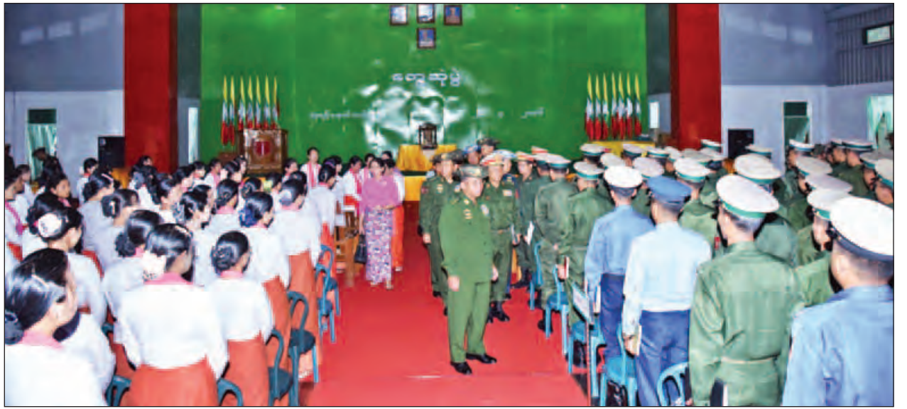
တပ်မတော်ကာကွယ်ရေးဦးစီးချုပ် ဗိုလ်ချုပ်မှူးကြီး မင်းအောင်လှိုင် သံတောင်ကြီးတပ်နယ်မှ အရာရှိ၊ စစ်သည်မိသားစုများနှင့် သင်တန်းသားများအား ရင်းရင်းနှီးနှီးနှုတ်ဆက်စဉ်။

တွေ့ဆုံပွဲအပြီးတွင် တပ်နယ်မှ အရာရှိ၊ စစ်သည်၊ မိသားစုဝင်များအတွက်