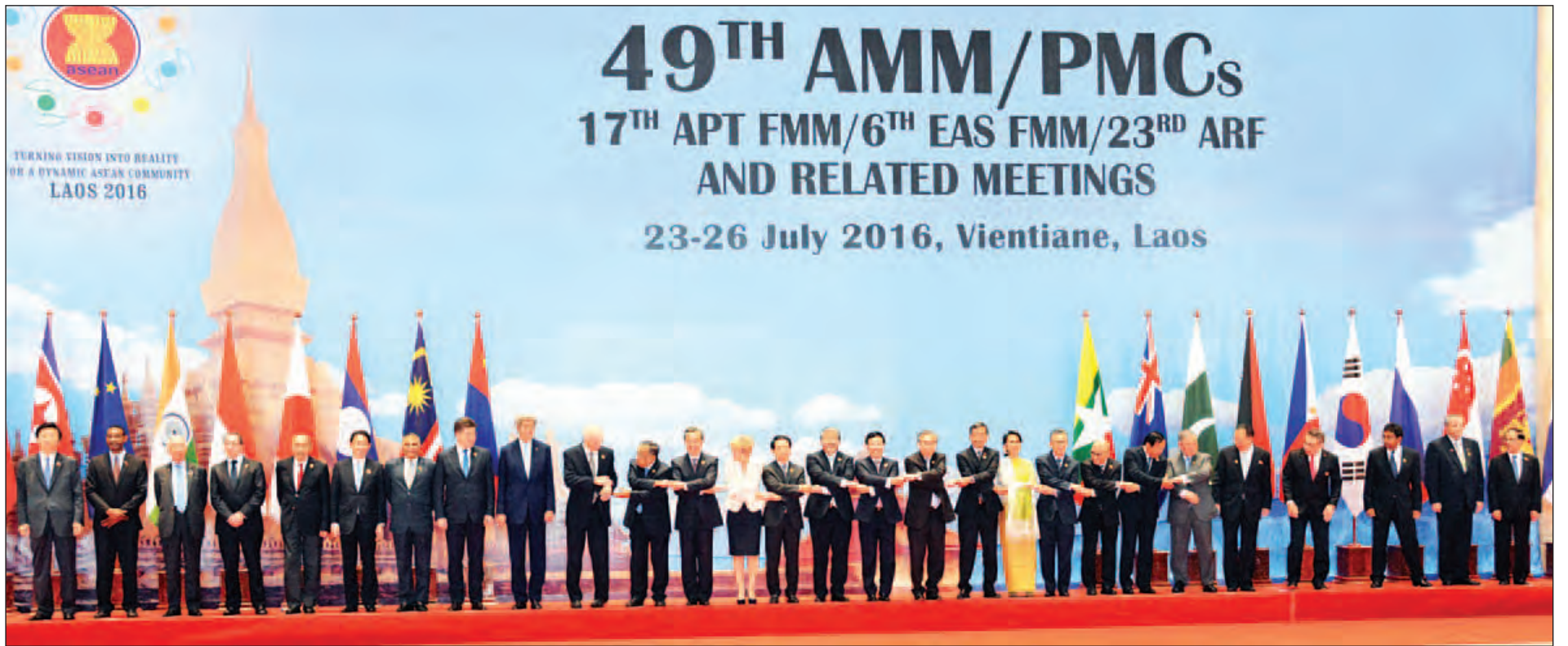
(၄၉)ကြိမ်မြောက် အာဆီယံနိုင်ငံခြားရေးဝန်ကြီးများအစည်းအဝေးနှင့် ဆက်စပ်အစည်းအဝေးများသို့ တက်ရောက်လာသည့် နိုင်ငံခြားရေးဝန်ကြီးများ မှတ်တမ်းတင်ဓာတ်ပုံရိုက်ကြစဉ်။ (သတင်းစဉ်)