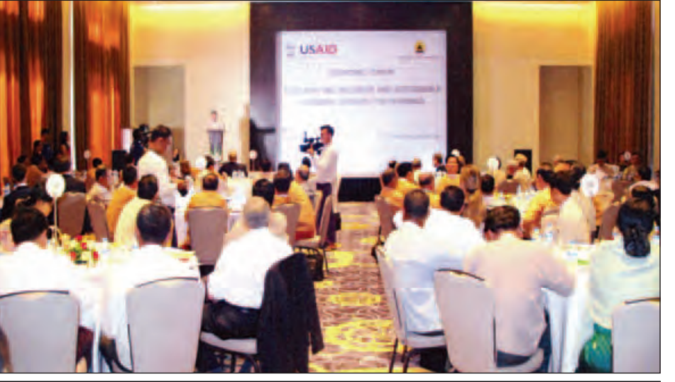
ရေရှည်တည်တံ့ပြီး အားလုံးပါဝင်သော မြန်မာ့စီးပွားရေးတိုးတက်မှု အရှိန်မြှင့်တင်ရေး အလုပ်ရုံဆွေးနွေးပွဲ ကျင်းပစဉ်။

လျှော့ချရေးကို ဦးစားပေးဆောင်ရွက် ပေးလျက်ရှိကြောင်း၊ သို့ဖြစ်ရာ ဘဏ္ဍာ ရေးကဏ္ဍတွင် ပြည်သူ့အားလုံး ပါဝင် ဆောင်ရွက်မည့်လမ်းပြမြေပုံ (၂၀၁၄- ၂၀၂၀)ကို ချမှတ်၍ ကောင်းမွန်သော ငွေကြေးကဏ္ဍ ဖွံ့ဖြိုးတိုးတက်လာရေး ကို အကောင်အထည်ဖော် ဆောင်ရွက်လျက်ရှိကြောင်း။ ထို့ပြင် ယင်းတို့နှင့် ဆက်စပ်၍ အာမခံလုပ်ငန်းကဏ္ဍဖွံ့ဖြိုးတိုးတက် ရေးနှင့် နိုင်ငံပိုင်ဘဏ်များ အဆင့် မြှင့်တင်တည်ဆောက်ခြင်း ကဏ္ဍများ ကိုလည်း ကြိုးပမ်းဆောင်ရွက်လျက် ရှိကြောင်း၊ ယခုအခါ ကမ္ဘာ့အနှံ့တွင် မငြိမ်မသက်ဖြစ်မှုများ၊ စစ်ပွဲများ၊ စားနပ်ရိက္ခာပြတ်လပ်မှုများကြောင့်