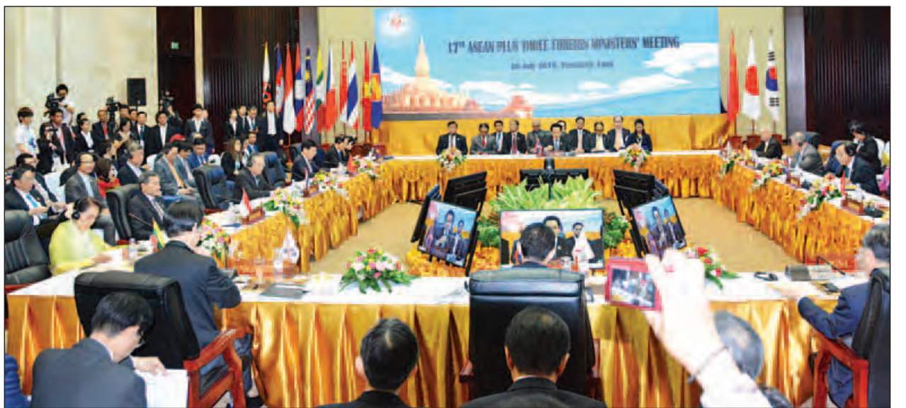
(၁၇)ကြိမ်မြောက် အာဆီယံ+၃ နိုင်ငံခြားရေးဝန်ကြီးများအစည်းအဝေး ကျင်းပစဉ်။ (သတင်းစဉ်)

ထို့ပြင် အာဆီယံဥက္ကဋ္ဌအဖြစ်ဆောင်ရွက်သော လာအိုနိုင်ငံက အဆိုပြုထားပြီး (၁၁)ကြိမ်မြောက် အရှေ့အာရှထိပ်သီးအစည်းအဝေးက အတည်ပြုချမှတ်မည့် အရှေ့အာရှအတွင်း အခြေခံအဆောက်အအုံ ဖွံ့ဖြိုးတိုးတက်မှု