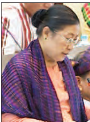
ဒေါက်တာခင်မကြီး

အတွက် အနည်းဆုံးအကြေးငွေ တစ်နာရီ ငွေကျပ် ၄၅၀ နှုန်းဖြင့် တစ်ရက်အလုပ်ချိန် ၈ နာရီအတွက် ငွေကျပ် ၃၆၀၀ သတ်မှတ်ချက်နှုန်းထားကို ပြန်လည်သုံးသပ်ပြင်ဆင်ပေးရန် အစီအစဉ်ရှိ မရှိ မေးခွန်းနှင့်စပ်လျဉ်း၍ ပြည်ထောင်စုဝန်ကြီး ဦးသိန်းဆွေက အနည်းဆုံးအကြေးငွေ နှုန်းထားတစ်ခု သတ်မှတ်ရာ၌ အဓိကအားဖြင့် အလုပ်သမားများ၏ လိုအပ်ချက်များကို ဖြေရှင်းနိုင်မည့် ငွေကြေးပမာဏဖြစ်ရန် လိုအပ်သကဲ့သို့ အလုပ်ရှင်များက အမှန်တကယ်ပေးနိုင်မည့် ငွေကြေးပမာဏဖြစ်ရန် လိုအပ်ပါကြောင်း။