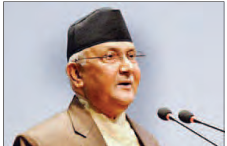
နီပေါနိုင်ငံဝန်ကြီးချုပ် ကေပီအိုလီ။

နီပေါနိုင်ငံ၌ ဝန်ကြီးချုပ်အိုလီသည် ဇူလိုင် ၂၄ ရက်တွင် ရာထူးမှနုတ်ထွက်ခဲ့သည်။ ပါလီမန်တွင် အိုလီအား အယုံအကြည်မရှိကြောင်း အဆိုတင်သွင်းရန်ရှိနေစဉ် ရာထူးမှ နုတ်ထွက်သွားခဲ့ခြင်းဖြစ်သည်။ အိုလီ၏ ပါတီစုံပါဝင်သော ညွန့်ပေါင်းအဖွဲ့မှ မဟာမိတ်များအစိုးရအဖွဲ့ကို စွန့်ခွာခဲ့ကြပြီးနောက် မလွဲသာမရှောင်သာ ရာထူးမှနုတ်ထွက်ခဲ့ရသည်။ မြေငလျင်ဘေးဒဏ်ပြင်းထန်စွာခံစားခဲ့ရသည့် နီပေါနိုင်ငံ၌ ဖြစ်ပွားခဲ့သော ဆန္ဒပြပွဲများကို ကိုင်တွယ်ဆောင်ရွက်ပုံနှင့် ပတ်သက်၍ အပြင်းအထန် ဝေဖန်ခံခဲ့ရသူဖြစ်သည်။ နီပေါနိုင်ငံ၌ ပြီးခဲ့သည့်ဒီဇင်ဘာလက ဖွဲ့စည်းပုံအခြေခံဥပဒေသစ်ကို ကန့်ကွက်ဆန္ဒပြကြသော လူနည်းစုတိုင်းရင်းသားမျိုးနွယ် ဆန္ဒပြသူများနှင့် ရဲတပ်ဖွဲ့ဝင်များ အကြား အဓိကရုဏ်းများဖြစ်ပွားခဲ့ရာ လူ ၅၀ ကျော် သေဆုံးခဲ့သည်။ နီပေါနိုင်ငံသည် တရုတ်နိုင်ငံ၏မိတ်ဆွေနိုင်ငံဖြစ်ပြီး အေးအတူပူအမျှ အတူယှဉ်တွဲနေထိုင်လာခဲ့ကြသော နိုင်ငံများဖြစ်ကြောင်း၊ နိုင်ငံတကာရေးရာနှင့် ပြည်တွင်းရေးရာများ၏ အကျိုးသက်ရောက်မှုများ မည်သို့ပင်ရှိနေစေကာမူ မိတ်ဆွေများအဖြစ် ဆက်လက်ရပ်တည်သွားမည် ဖြစ်ကြောင်း ကြေညာချက်တွင် ဖော်ပြသည်။ နီပေါနိုင်ငံအပေါ် အိန္ဒိယနိုင်ငံ၏ ဩဇာလွှမ်းမိုးမှု လျော့ပါးစေရေးအတွက် ဝန်ကြီးချုပ်အိုလီအုပ်စိုးစဉ် ကာလအတွင်း ချုပ်ဆိုခဲ့သော နယ်စပ်ဒေသ ပူးပေါင်းဆောင်ရွက်ရေး သဘောတူညီချက်များကို ဝန်ကြီးချုပ်သစ်က ပြန်လည်ပယ်ဖျက်နိုင်မှုအတွက် စိုးရိမ်ပူပန်မှုများ ပေါ်ထွက်နေချိန်အတွင်း ယင်းကြေညာချက်ပေါ်ထွက်လာခြင်းဖြစ်သည်။ ဝီတီအိုင်း။