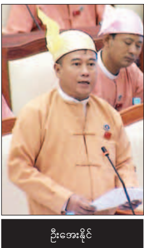
ဦးအေးနိုင်

နေပြည်တော် ဇူလိုင် ၂၆ ဒုတိယအကြိမ် ပြည်သူ့လွှတ်တော် ဒုတိယ ပုံမှန်အစည်းအဝေး ဒုတိယ နေ့ကို ယနေ့နံနက် ၁၀ နာရီတွင် နေပြည်တော်ရှိ လွှတ်တော်အဆောက်အအုံ၌ ပြည်သူ့လွှတ်တော်အဆောက်အအုံ၌ ဆက်လက်ကျင်းပရာ ကြယ်ပွင့်ပြမေးခွန်း သုံးခုမေးမြန်းခြင်းနှင့်ဖြေကြားခြင်း၊ အဆိုတစ်ခုတင်သွင်းခြင်းနှင့် ယင်းအဆိုနှင့်စပ်လျဉ်း၍ လွှတ်တော်ကိုယ်စားလှယ်များက ဝိုင်းဝန်းဆွေးနွေးခြင်း၊ ဥပဒေကြမ်းတစ်ခုကို အတည်ပြုရန် လွှတ်တော်၏ အဆုံးအဖြတ်ကို ရယူခြင်းများ ဆောင်ရွက်ကြသည်။