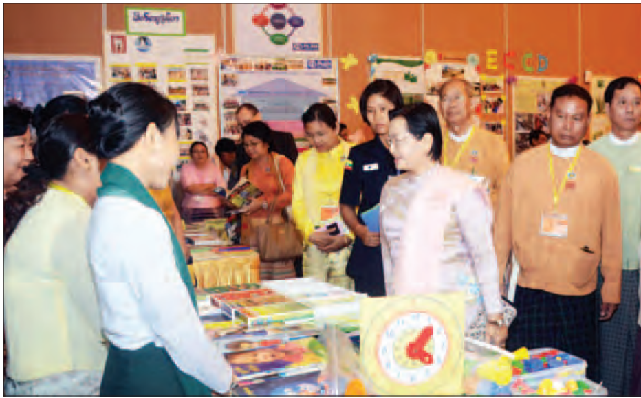
မြန်မာ့ရေးဦးအရွယ်ကလေးသူငယ်ပြုစုပျိုးထောင်ရေးနှင့် ဖွံ့ဖြိုးရေးလုပ်ငန်း အမျိုးသားအဆင့်ဆွေးနွေးပွဲတွင် တက်ရောက်လာကြသူများက ခင်းကျင်းပြသထားသည့် စာအုပ်စာစောင်များကို ကြည့်ရှုကြစဉ်။ (သတင်းစဉ်)

နေပြည်တော် ဇူလိုင် ၂၆ ကလေးသူငယ် ပြုစုပျိုးထောင်ရေးနှင့် ဖွံ့ဖြိုးရေးလုပ်ငန်းကို စနစ်တကျ ဖြစ်စေရန်နှင့် ပိုမိုတိုးတက်အောင်မြင် စေရန်အတွက် ရှေးဦးအရွယ်ကလေး သူငယ်ပြုစုပျိုးထောင်ရေးနှင့် ဖွံ့ဖြိုး ရေးဆိုင်ရာ ဥပဒေနှင့် နည်းဥပဒေကို ထုတ်ပြန်ခဲ့ပြီး ဖြစ်ကြောင်း ပြည်ထောင်စုဝန်ကြီး ဒေါက်တာ ဝင်းမြတ်အေးက ယနေ့နံနက် ၉ နာရီ တွင် နေပြည်တော် မင်္ဂလာသီရိ ဟိုတယ်၌ကျင်းပသည့် မြန်မာ့ရေးဦး အရွယ်ကလေးသူငယ် ပြုစု ပျိုးထောင်ရေးနှင့် ဖွံ့ဖြိုးရေးလုပ်ငန်း အမျိုးသားအဆင့်ဆွေးနွေးပွဲ ဖွင့်ပွဲ အခမ်းအနား၌ ပြောကြားလိုက် သည်။